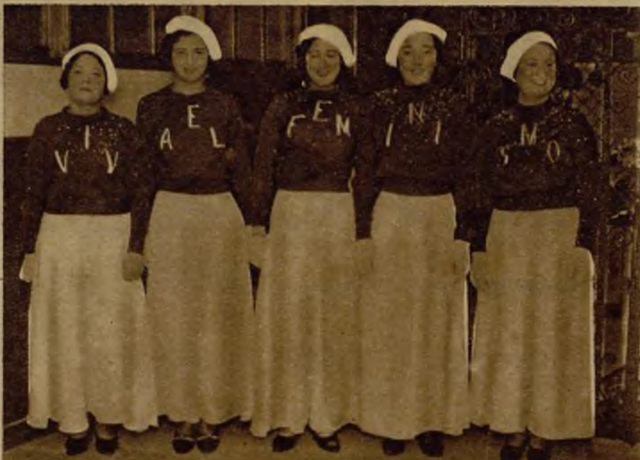
Distinguidas señoritas que formaban el grupo "Viva el feminismo". Como se ve, las mujeres se lanzan a la conquista de sus derechos por todos los medios que están a su alcance