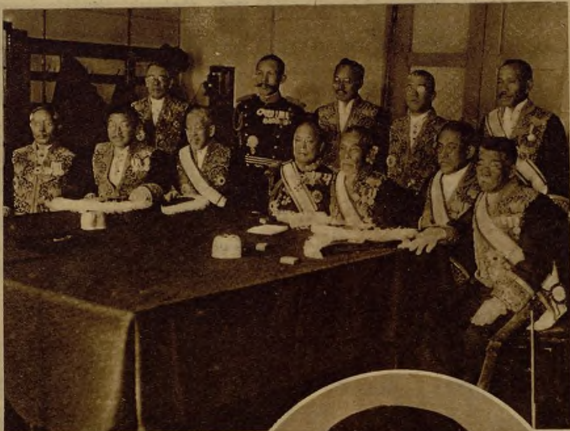
Los miembros del Gabinete japonés, bajo la presidencia de Inukai, en uno de los recientes Consejos

Tropas Italianas embarcando para marchar a China, a fin de garantizar la seguridad personal y los intereses de los súbditos allí residentes.