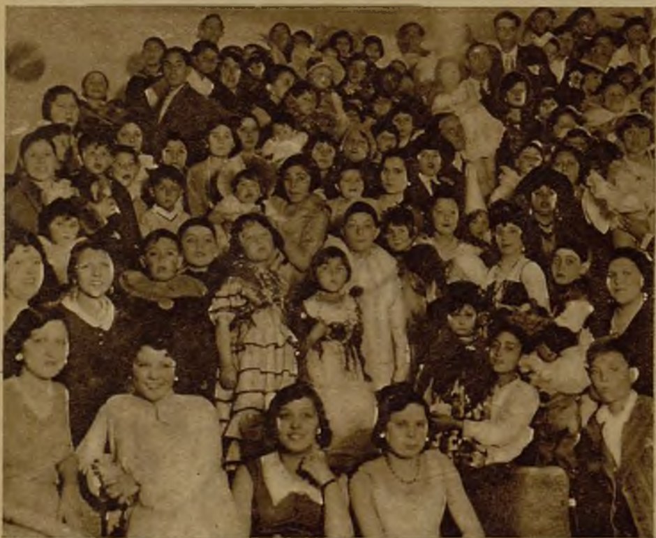
Aspecto del salón del Círculo de Unión de Recreo, de Melilla, durante el baile infantil organizado por la citada entidad