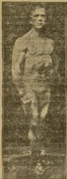
LIONEL STRONGFORT el hombre perfecto.