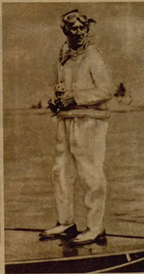
El "recordman" americano Gard Wood, que ha superado la marca mundial en canoa automóvil. El "record", sin embargo, no ha sido homologado por defectos reglamentarios