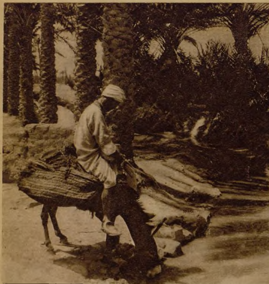
El río Guis, que, como el Necor, el Kerb, el Lau, el Uriaga, y, sobre todo, el Guadalejé, puede constituir un magnífico caudal de riego

La posibilidad de producción de nuestra zona y la orientación de una política económica