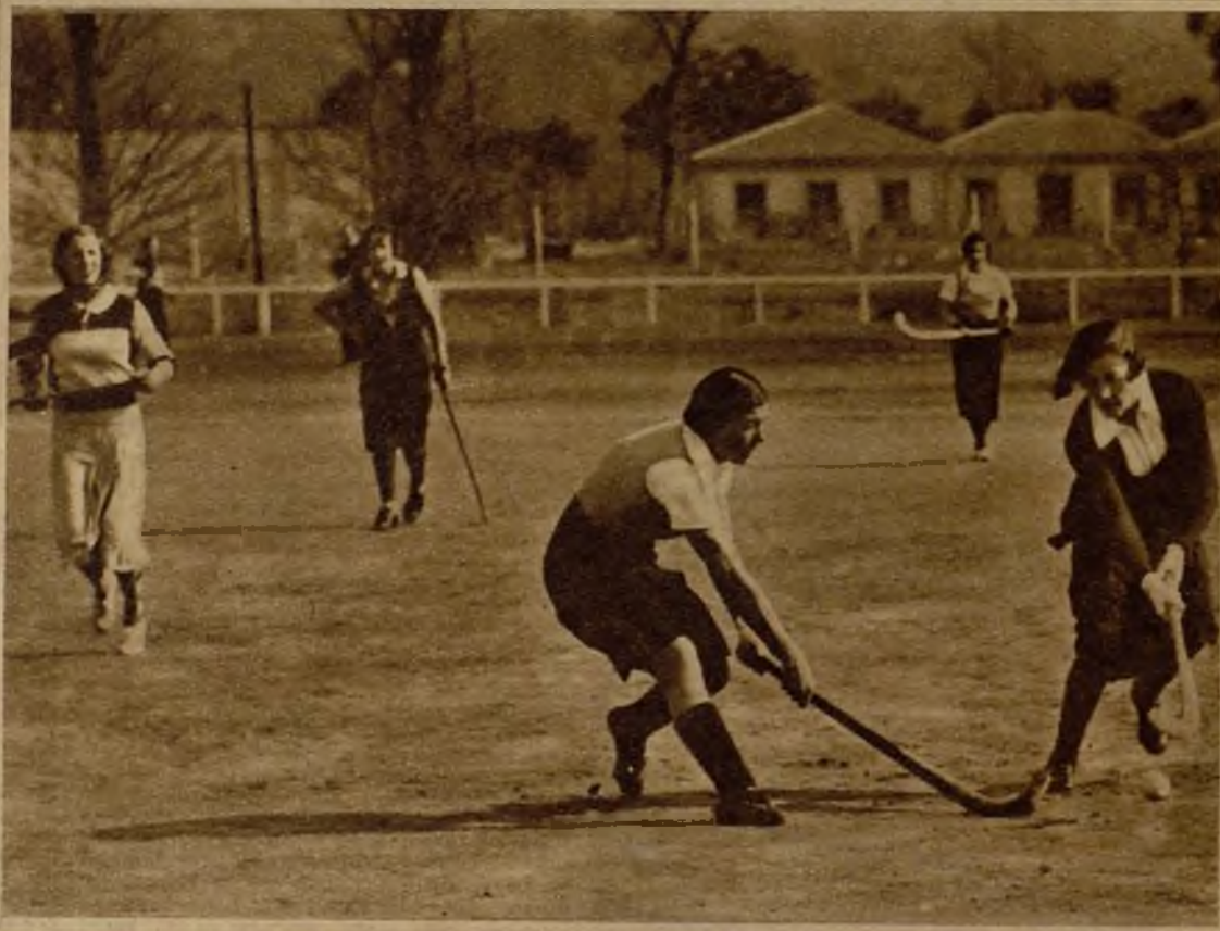
Un momento del disputado encuentro entre los "teams" femeninos de la Tranvía y del Club de Campo