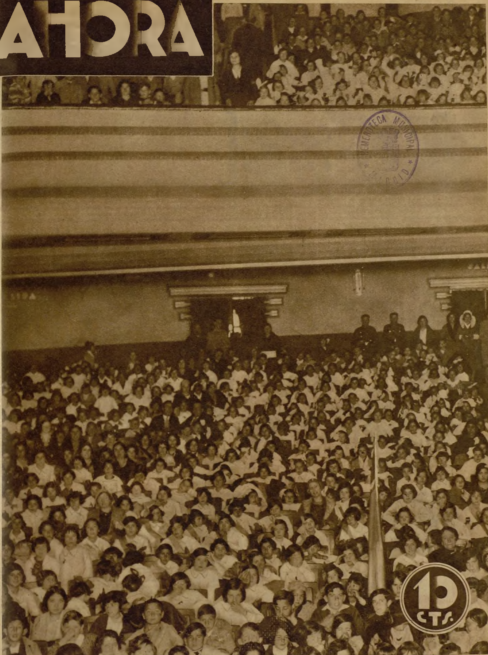
LA CONMEMORACION DE LA PRIMERA REPUBLICA Y LOS NIÑOS. —Con motivo del aniversario de la proclamación de la primera República, los niños de las escuelas públicas han tenido participación en la fiesta nacional, asistiendo a una representación en el cine Europa, que ofrecía el animadísimo aspecto que recoge la fotografía