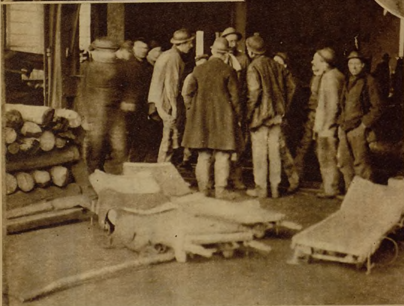
Un equipo de salvamento preparado para descender a una mina en Monceau-Fontaine (Bélgica), donde por efecto de una explosión de grisú han quedado sepultados veinte obreros.