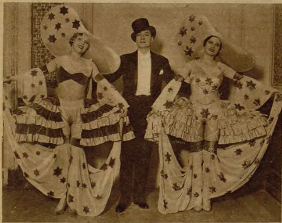
Una escena de la obra "¿Qué pasa en Cádiz?", último estreno del teatro Romea