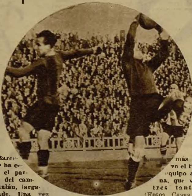
En Barcelona se ha celebrado el partido final del campeonato catalán, largamente aplazado. Una vez