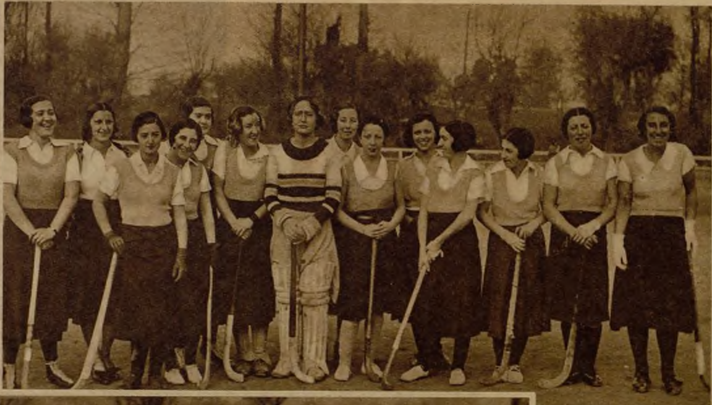
Estas señoritas formaron el equipo de la Tranvía que se enfrentó con el del Club de Campo, en un animado encuentro, en que las jugadoras de uno y otro bando mostraron su excelente clase