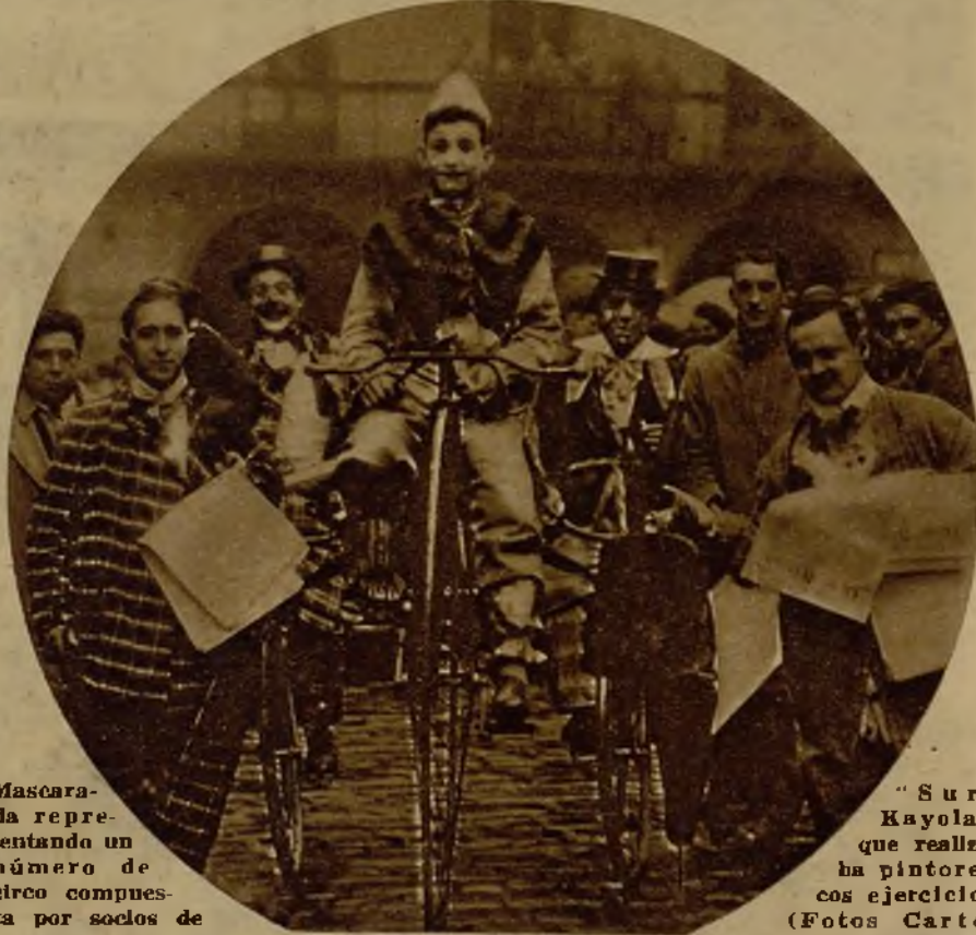
Mascara-da representando un número de circo compuesta por socios de