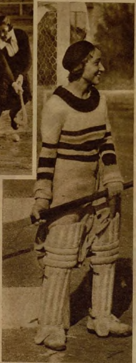
El equipo del Club de Campo. No hubo en el encuentro, para satisfacción de todos, ni vencedoras ni vencidas