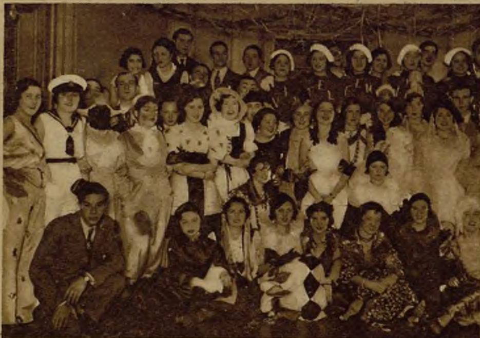
SAN SEBASTIAN.—En el Círculo Francés se celebró un baile de Carnaval, que estuvo concurridísimo. He aquí un aspecto de la animada fiesta