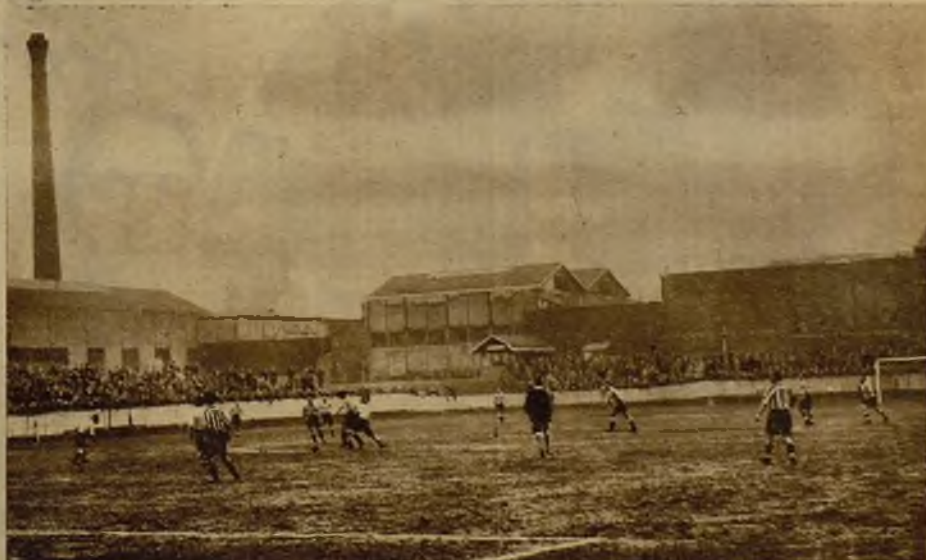
Aspecto general del campo, durante el encuentro Athlétic de Bilbao-Racing-Red-Star, de París. El encuentro, que había despertado interés, fué de decepción para el público, que no vió en los hilhainos al fuerte equipo que ha tenido en la capital francesa afortunadas exhibiciones