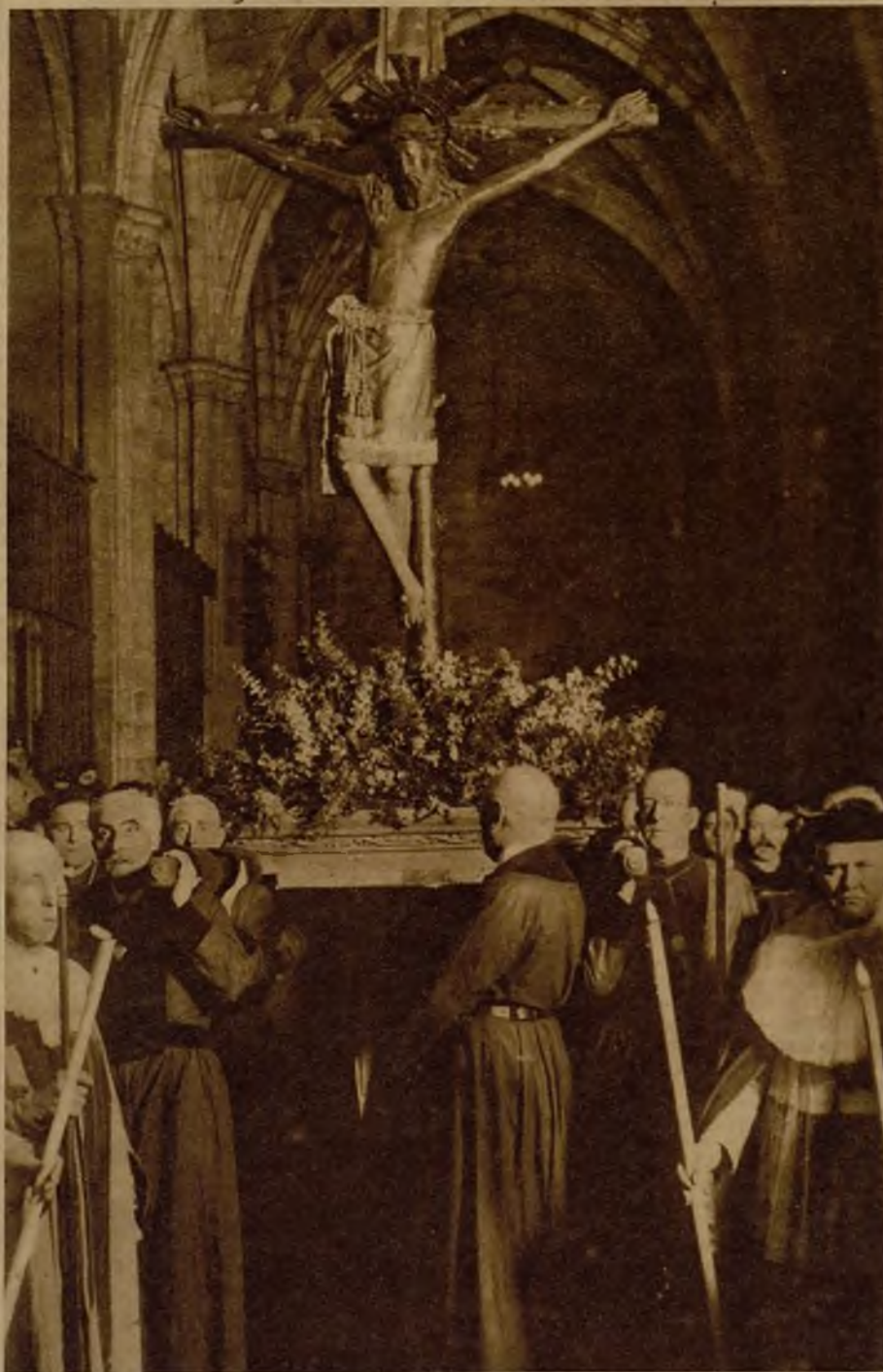
Imagen del Cristo de Lepanto, que en una solemne procesion ha sido trasladado desde su altar, en la catedral de Barcelona, a un nuevo camarín