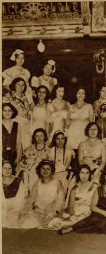
Grupo de señoritas que concurrieron al baile de máscaras organizado por el Centro de Hijos de Madrid, en el teatro de la Zarzuela