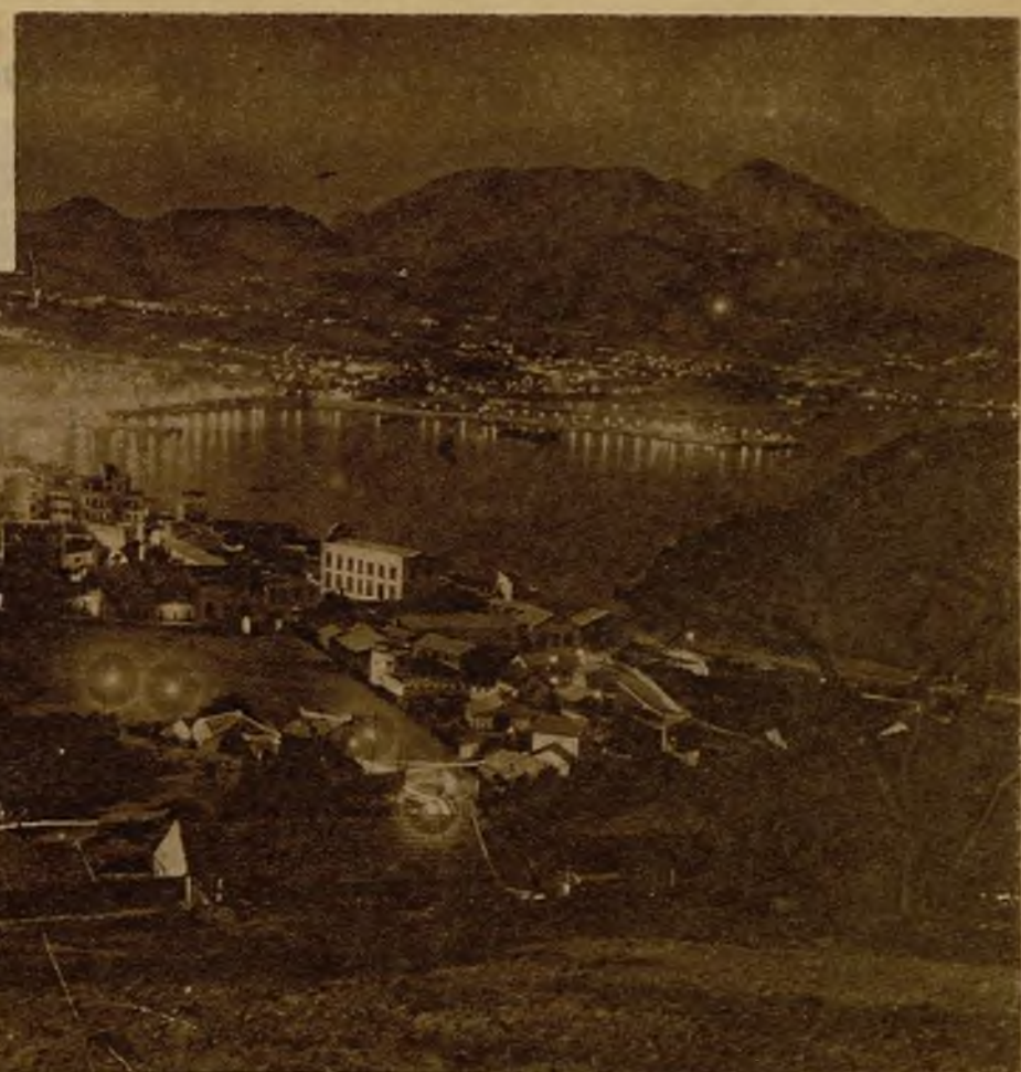
Ceuta debe ser el nudo de las comunicaciones de África, para establecer el contacto con España. Ha de ser el gran puerto comercial equiparado a Casablanca

nico, una especie de mecánico de la tierra. En ambas granjas—especialmente en Larache—los alumnos cultivan un trozo de terreno, en el que practican las enseñanzas que reciben, y muchos de ellos viven como internos en el mismo recinto de la granja. En Larache los estudios y prácticas duran tres años. El primero aprenden a preparar viveros y semilleros, trasplantes, picados, siembras, podas e injertos, manejo de pequeño material agrícola, aperos y atalajes, teoría de las máquinas y manejo de máquinas de siembra. El segundo, estudio de plantas cultivadas, laboreo de tierras, épocas y material agrícolas más apropiados, manejo de máquinas cultivadoras y de recolección, pequeñas industrias, cría del gusano de seda, realización de plantaciones y siembras, distribución del arbolado. El tercero es, por último, una ampliación de prácticas y, además, estudios sobre preparación y empleo de insecticidas, estudios sobre plagas agrícolas, manejo de máquinas empacadoras y de tractores, cálculo y preparación de semillas, abonos, cultivos de regadío. La granja agrícola de Melilla es, además, campo de experiencias y vivero forestal, que el último año ha facilitado