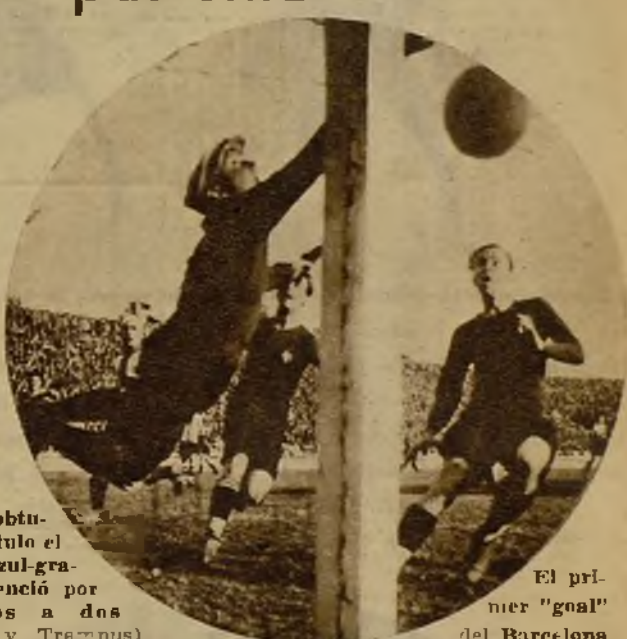
El primer "goal" del Barcelona