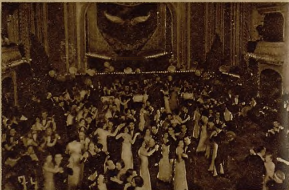
Un momento del gran baile del Nuevo Club, en el teatro Rosalia de Castro, de La Coruña