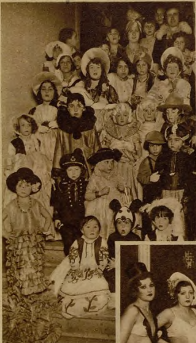
La encantadora gente menuda que concurrió al animado baile del semanario infantil "Pichi", en el teatro Victoria