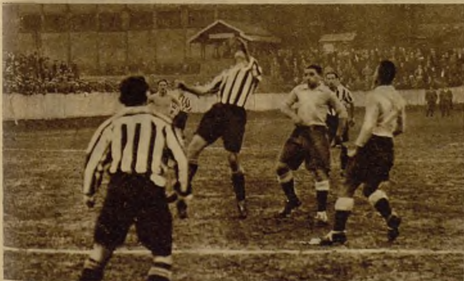
En el partido celebrado en París entre el Athlétic de Bilbao y una selección del Racing y el Red-Star, el consorcio de nuestros campeones dió, por una vez, la victoria a los jugadores franceses, que vencieron por el fuerte tanteo de 4-1