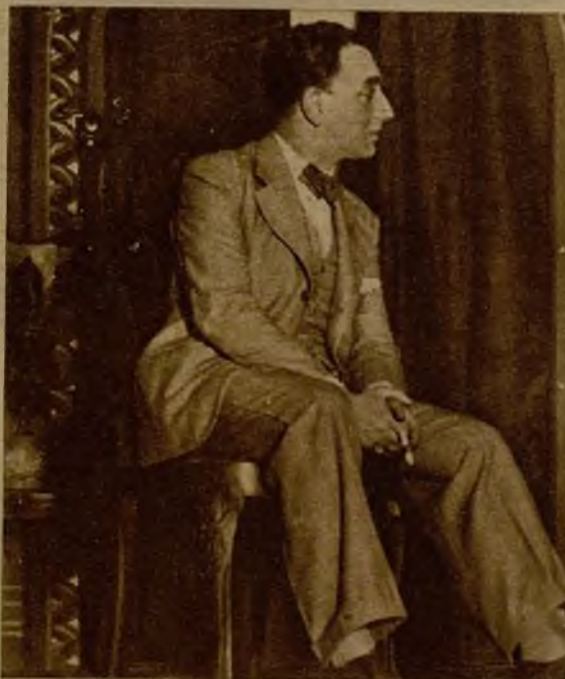
Otra escena de "¡Aquí está mi mujer!", obra en la que la compañía del Figaro muestra notables aciertos