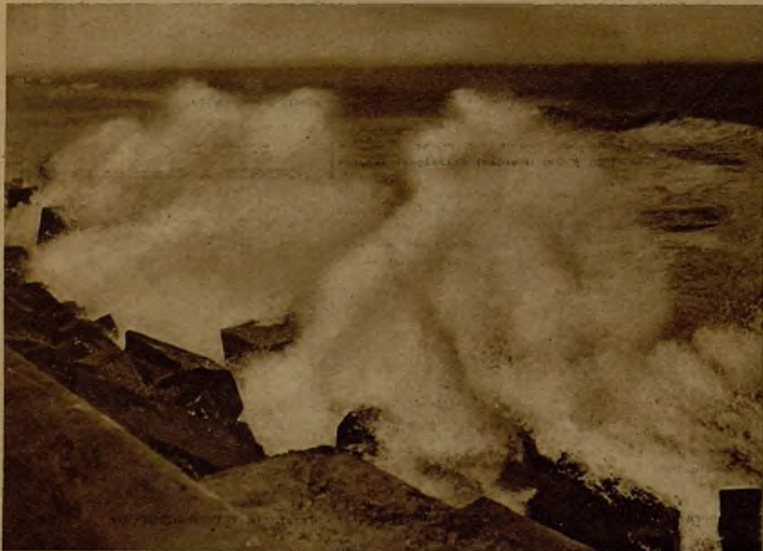
Sobre las costas de Levante ha descargado un fuerte temporal. Véanse los bellos y destructores efectos del mar en la escollera de Barcelona