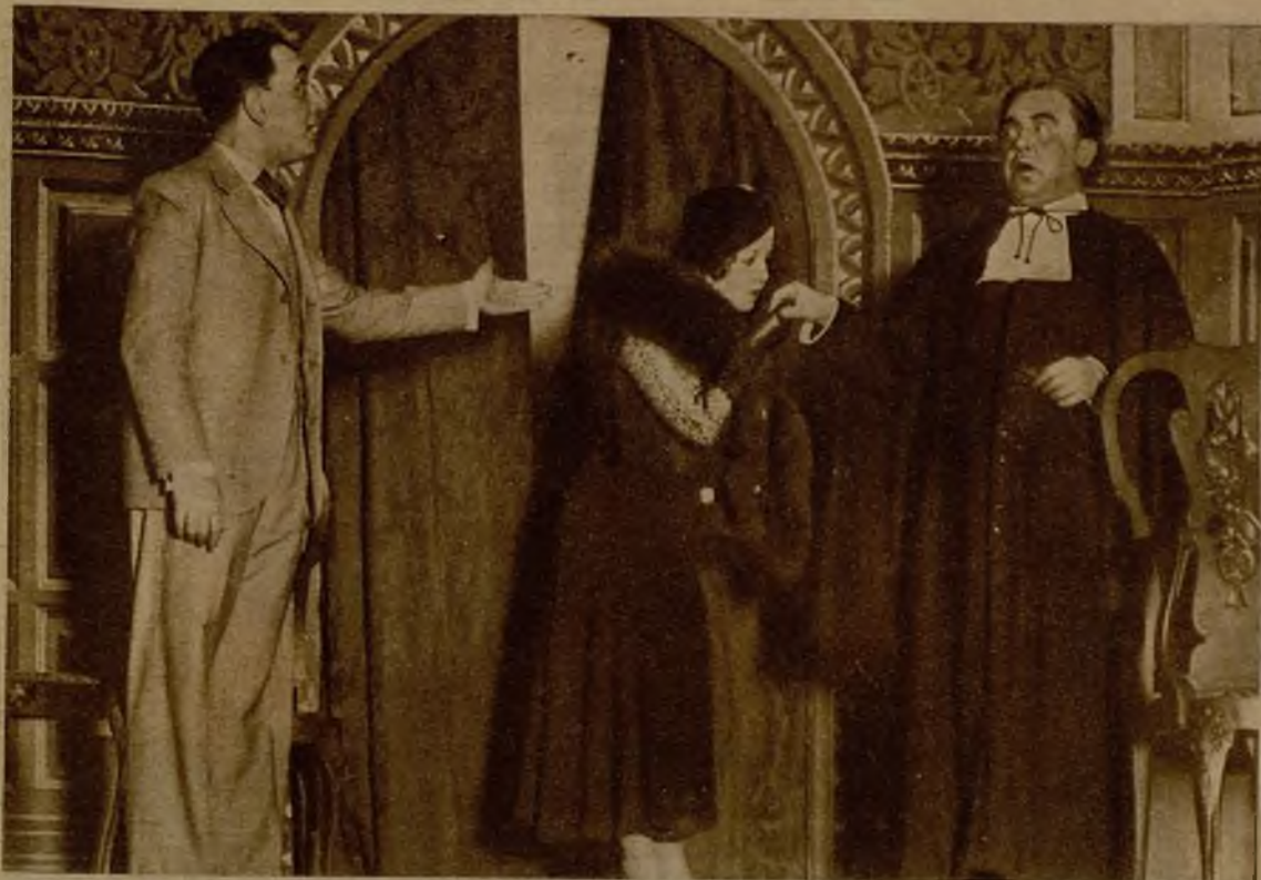
Un interesante momento de "¡Aquí está mi mujer!", estreno del teatro Figaro