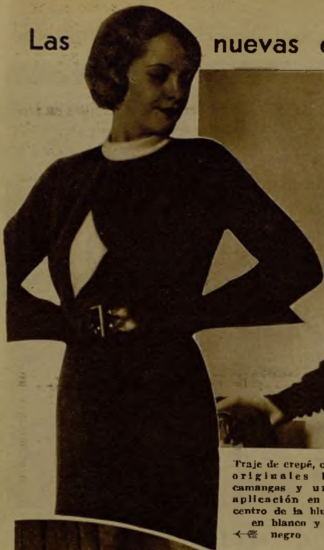
Traje de crepé, con originales bocamangas y una aplicación en el centro de la blusa en blanco y negro