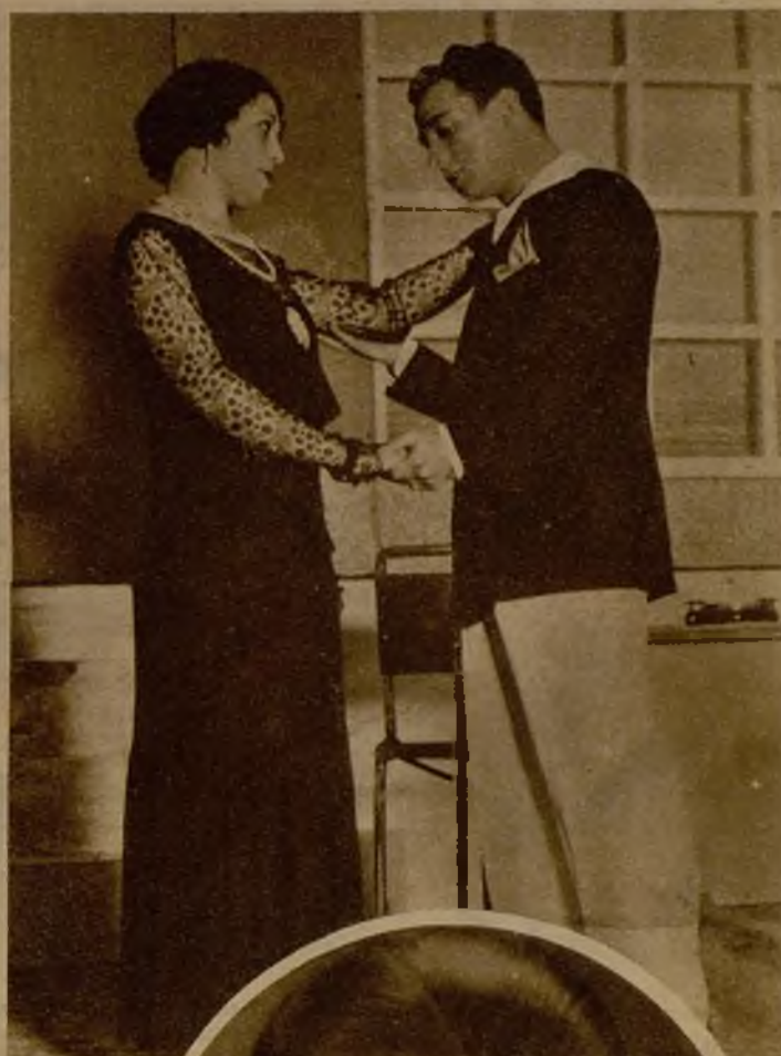
Una escena de la obra "Aquella noche", de Agustín de Figueroa, estreno del Cervantes