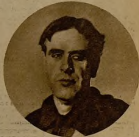
El ilustre cronista Pedro de Répide, que ha dado a la luz un nuevo tomo de su colección "Vidas españolas del siglo XIX", titulado "Isabel II".