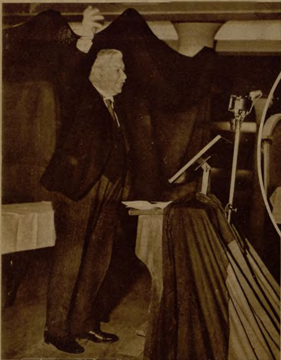
La propaganda electoral adquiere gran intensidad en Alemania ante la proximidad del plebiscito que designará el nuevo presidente del Reich. Véase al ministro de Hacienda señor Brüning en un alegato pro Hindenburg