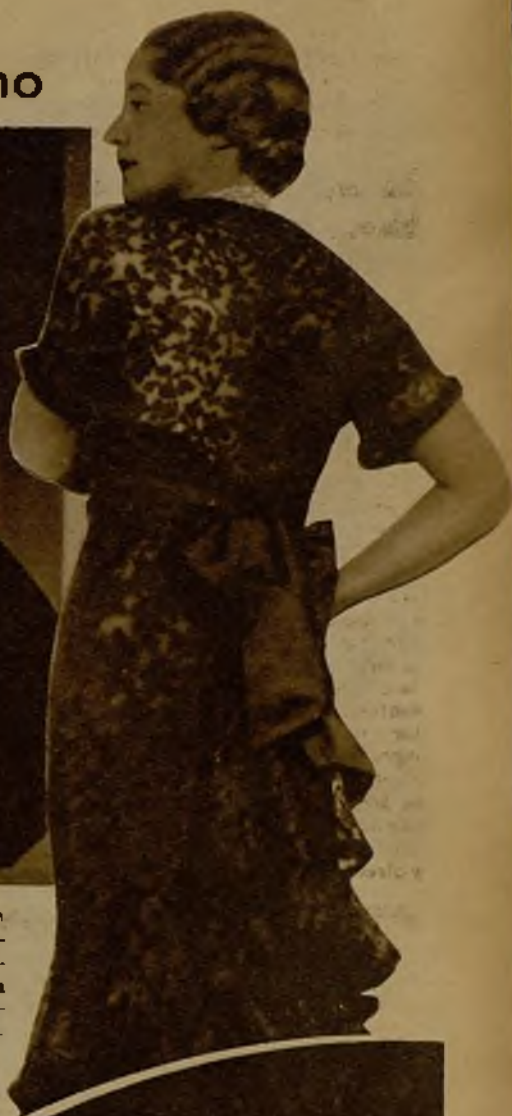
Bellísima toaleta de encaje color marrón, última expresión de la moda en trajes de paseo