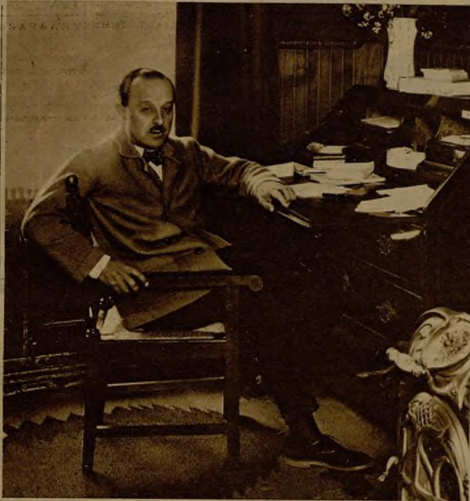
El popularísimo poeta Luis de Tapia, que ha publicado en un libro cincuenta de sus "coplas", aguda efemérides de la vida política española.

su memoria va asociada a la efemérides histórica.