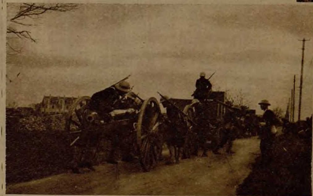
Piezas de artillería japonesa tomando posiciones en una carretera para intervenir en el bombardeo de Chapei