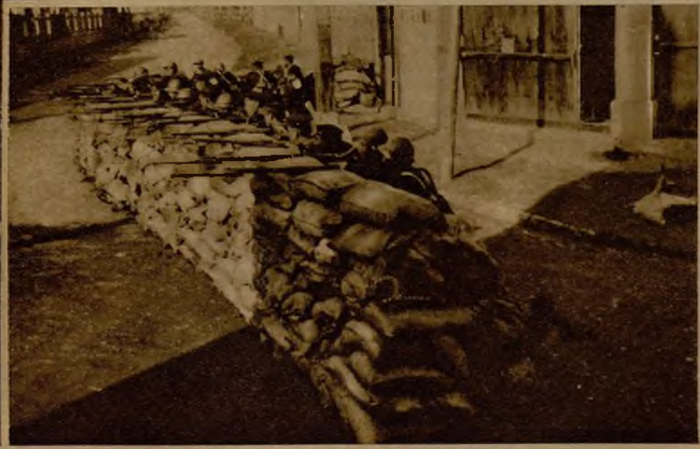
Trincheras de las avanzadas japonesas, desde la que cruzan su fuego con las tropas chinas, al borde mismo de la concesión internacional