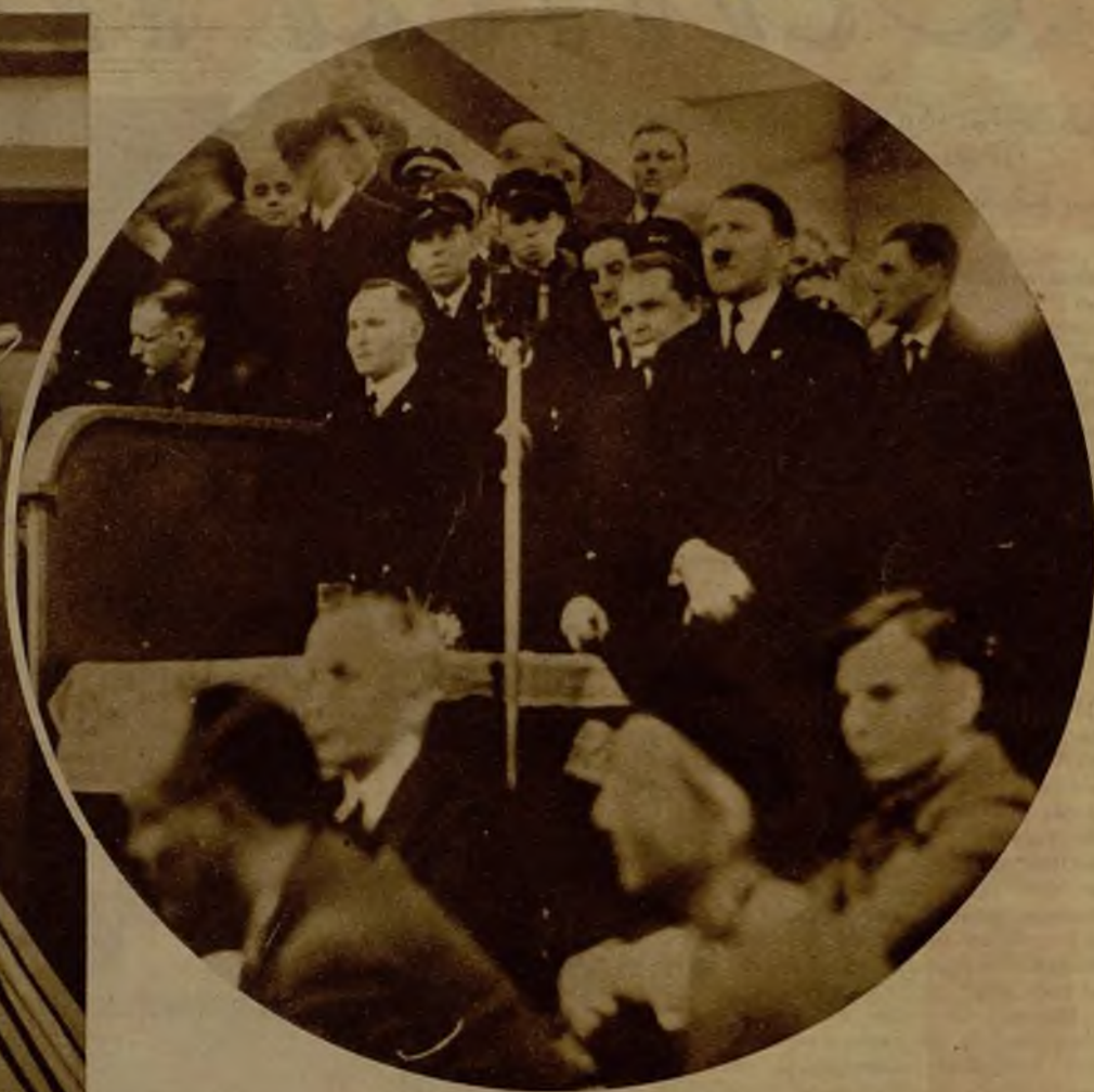
Hitler durante su primer discurso de propaganda, como candidato a la Presidencia de la República alemana. El acto tuvo lugar en el Palacio de los Deportes, de Berlín