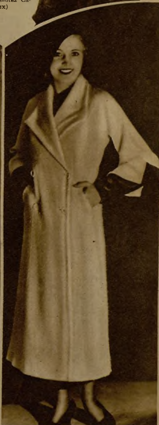
Un original abrigo, en el que las mangas negras establecen bonito contraste