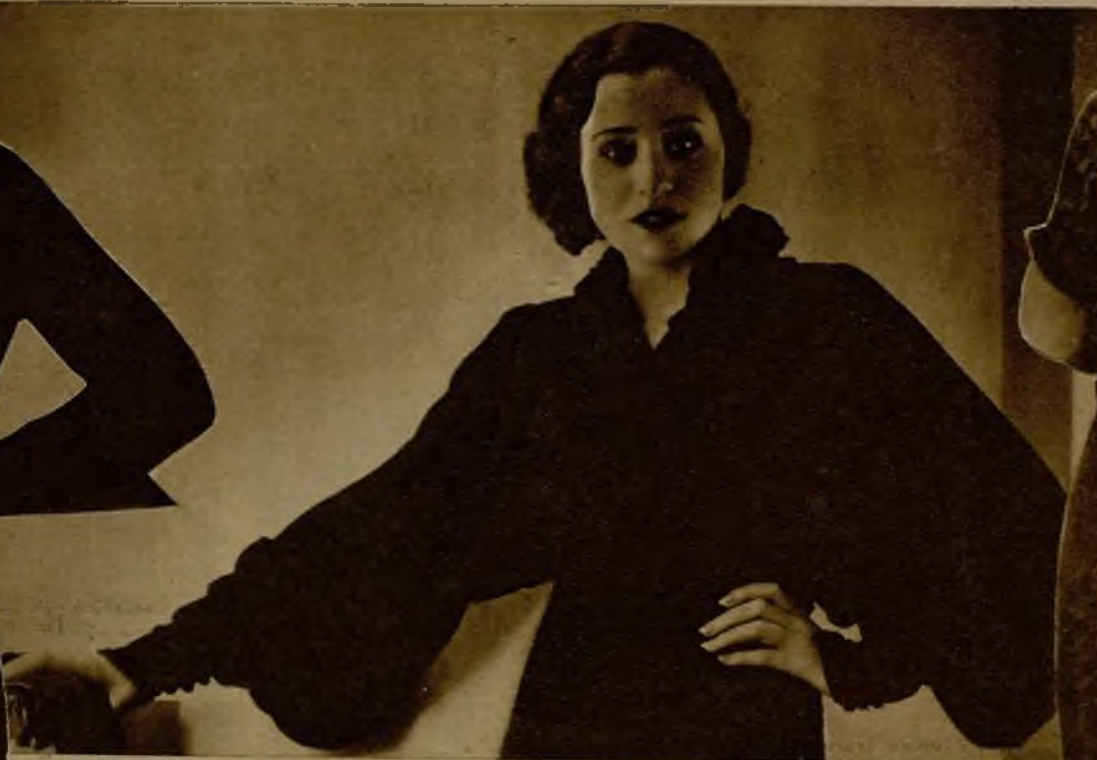
Este medio abrigo, todo sencillez, es característico del indumento en la simpatía de las visitas íntimas. El habla de la "causerie" del té y de la "dulce" murmuración en las conversaciones confidenciales