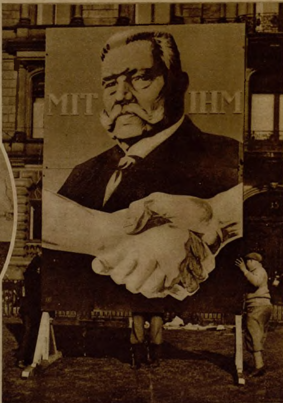
He aquí uno de los expresivos carteles de propaganda de la candidatura de Hindenburg para la Presidencia de la República, fijado en una calle de Leipziger Platz (Berlín)