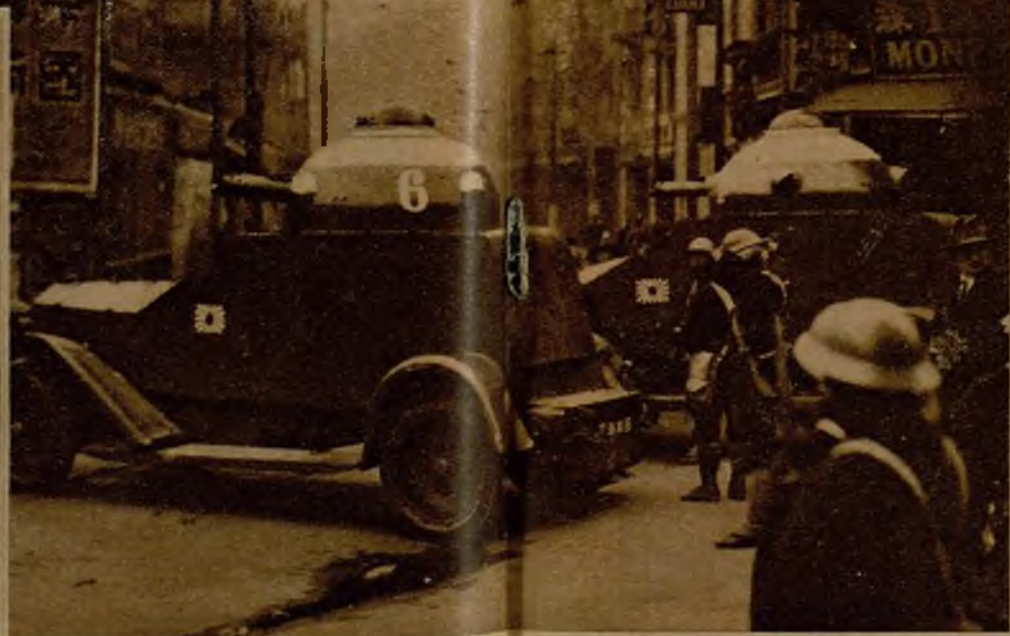
Tanques japoneses que tomaron parte en la acción contra Chapei, y de los que se apoderaron los chinos, en un desesperado contraataque