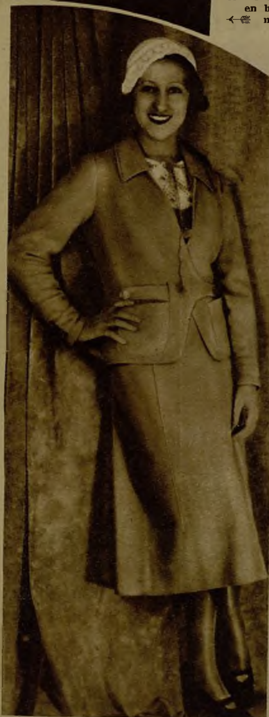
El traje sastre, atavio sencillo de paseo, tiene aquí una elegante modalidad