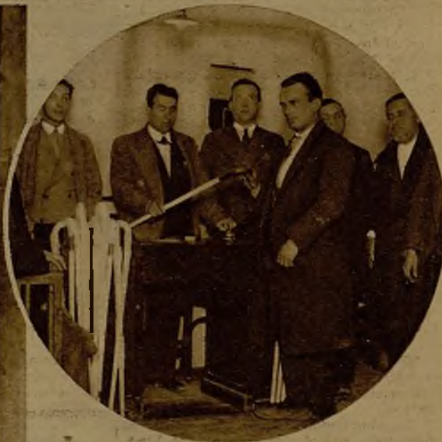
El Ayuntamiento de Zaragoza ha entregado a los ciegos de la ciudad unos bastones blancos, que les sirven de ayuda y distintivo al mismo tiempo. He aquí el acto de la entrega