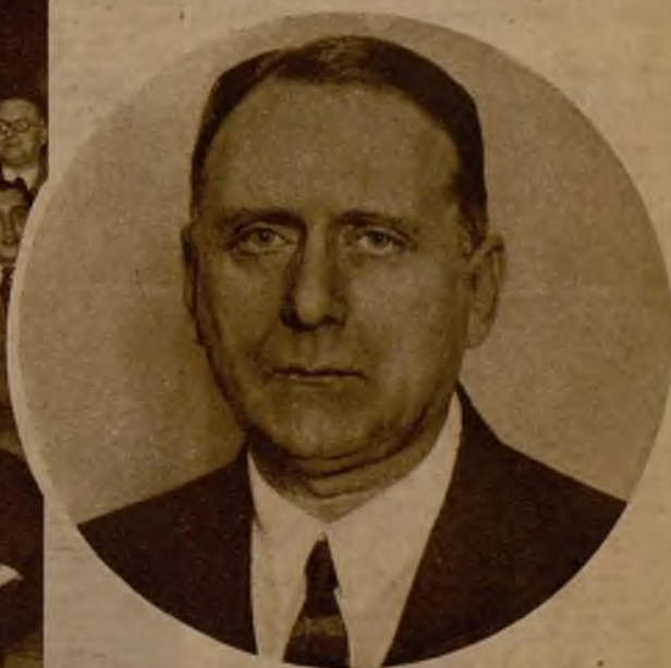
El nuevo embajador de Bélgica en España, señor Everts, que en breve presentará sus cartas credenciales al Presidente de la República