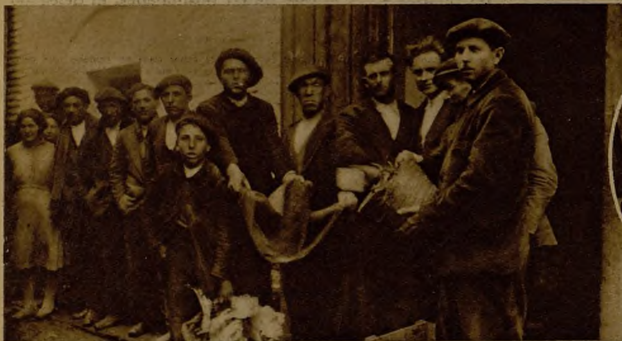
La Junta del Sindicato Único de Campesinos, ante la difícil situación de ciento veinte obreros, decidió abrir una suscripción entre sus afiliados para repartir ochocientas pesetas en comestibles