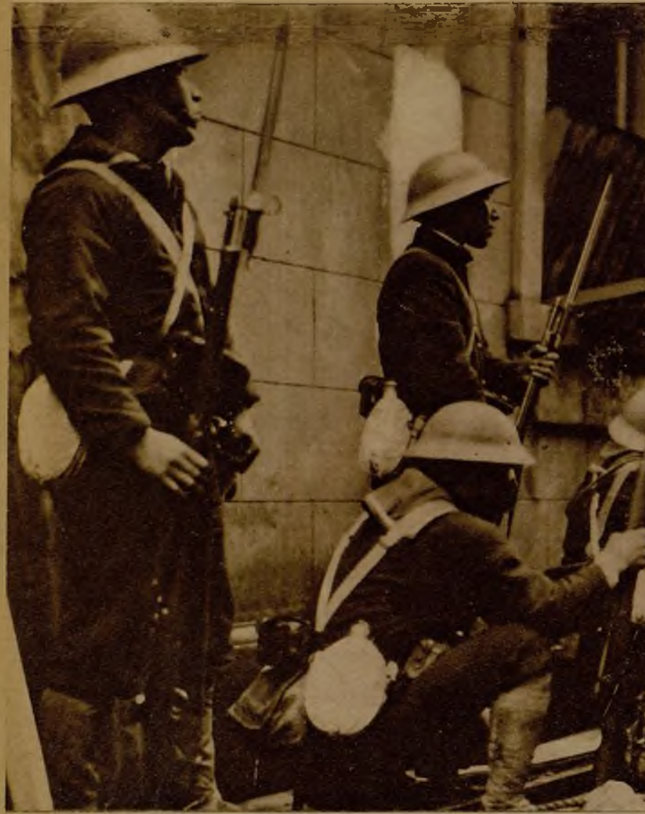
Las calles de Shanghai están convertidas en un verdadero campo de batalla. Las casas abandonadas por sus antiguos habitantes, son, en tanto las respetan los obuses o el incendio, lugar de concentración de desahucios, en el descanso de la lucha en las trincheras. Y aun las partes altas de muchas de ellas, colocadas en situación estratégica, son otros tantos fortines desde los que las tropas japonesas contestan a la defensiva china con fuego de fusilería