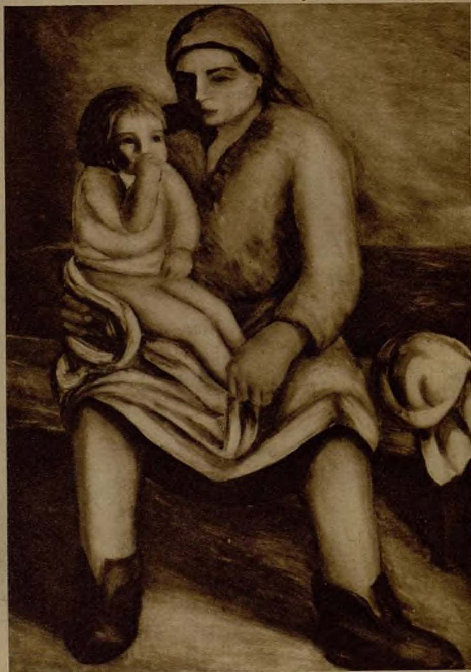
"Mujeres y niño", cuadro del pintor gallego M. Colmeiro

Notable dibujo a pluma, hecho en Tunja (Colombia), original del artista Sánchez Felipe