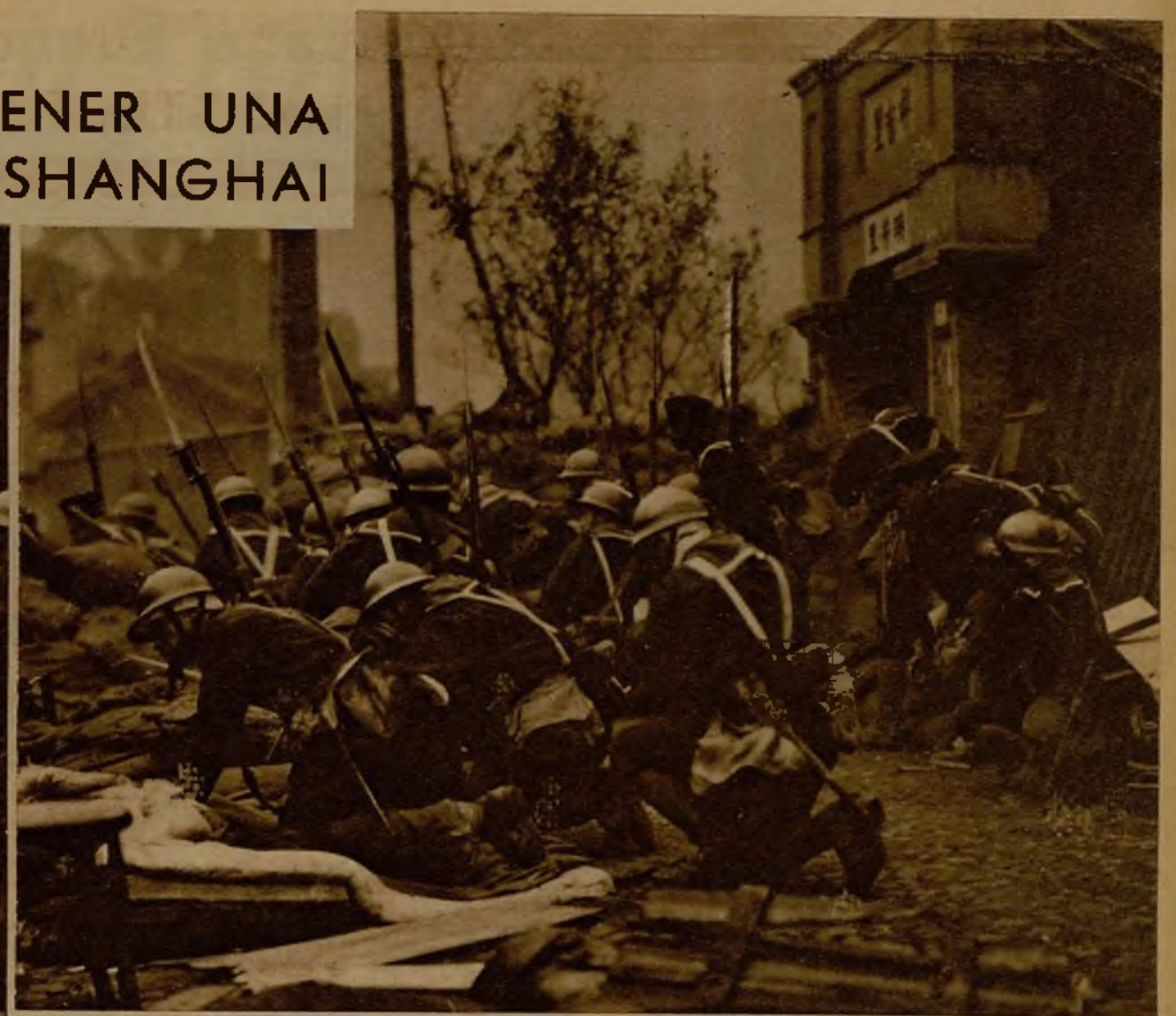
Estas tropas de la vanguardia nipona han logrado apoderarse de una línea de trincheras de los chinos, en las calles de Shanghai, y una vez puesto en fuga el enemigo, las rehacen para proseguir la ofensiva. De este modo, en una lucha constante de ataques y contraataques, puede decirse que Shanghai ha desaparecido como ciudad, y en ella no queda otra vida que la de la guerra