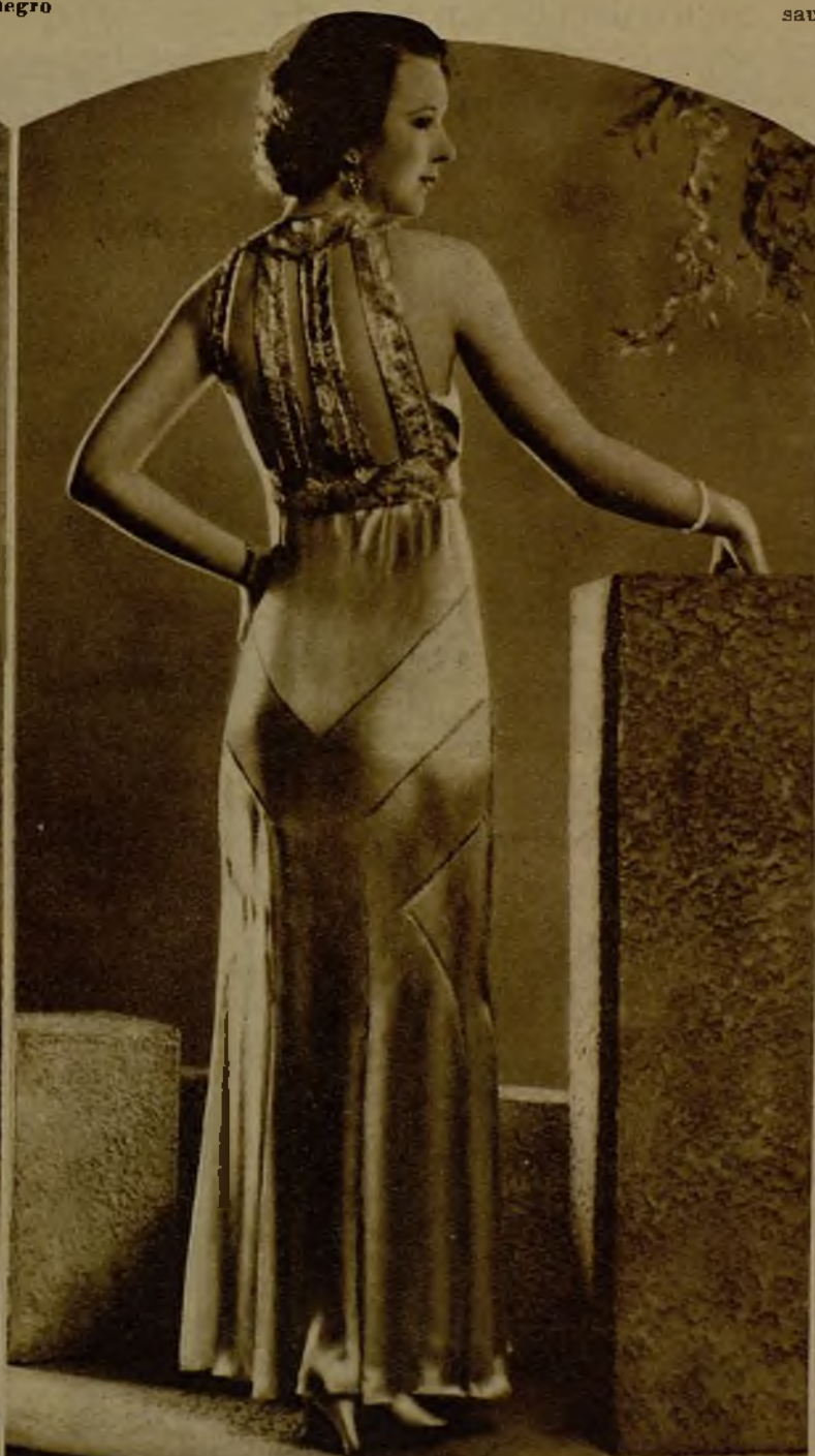
Elegantísimo traje de noche con vistosos adornos de perlas y diamantes