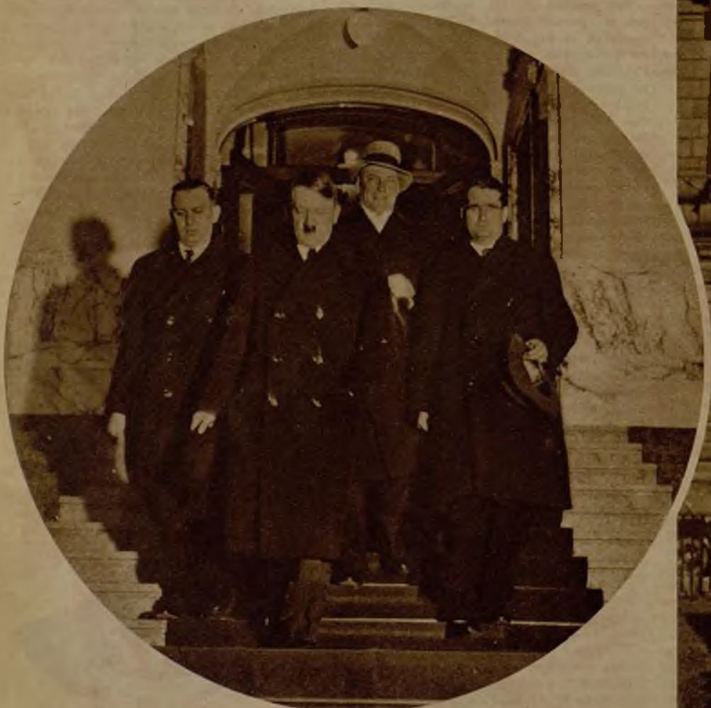
El líder nacionalista Hitler, después de presentar sus credenciales de delegado del Estado de Brunswick, cargo que le da la nacionalidad alemana y legitima su candidatura