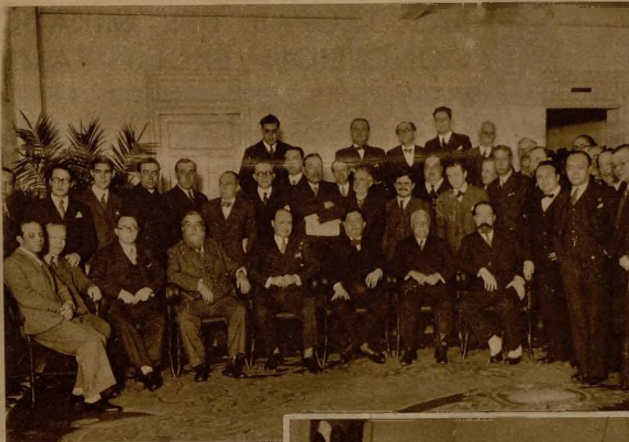
Los representantes en Cortes que constituyen el grupo vitivinícola han obsequiado con una comida a los redactores de los diarios madrileños que hacen información en el Congreso de los Diputados. Grupo de los concurrentes al banquete