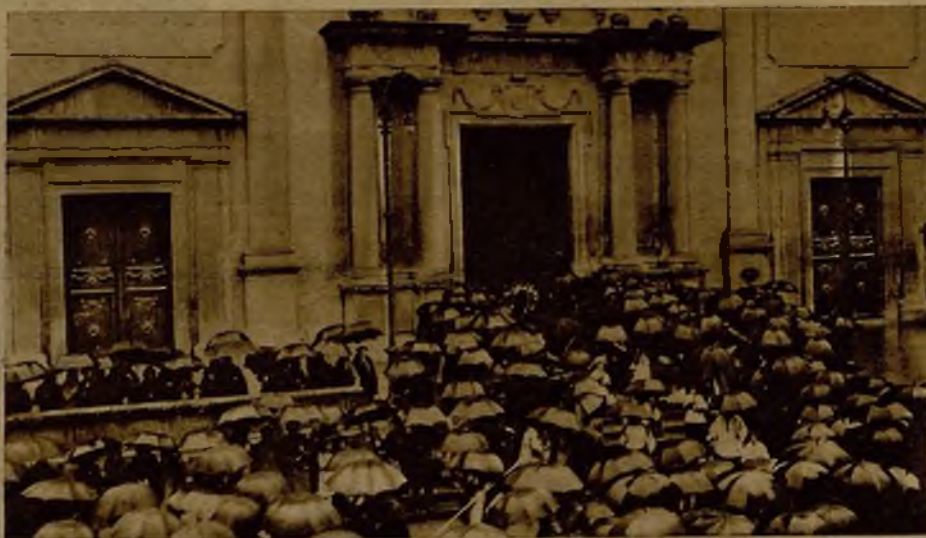
Aspecto que ofrecía la entrada a la catedral de Vich durante los funerales en sufragio del canónigo mosén Collell, recientemente fallecido