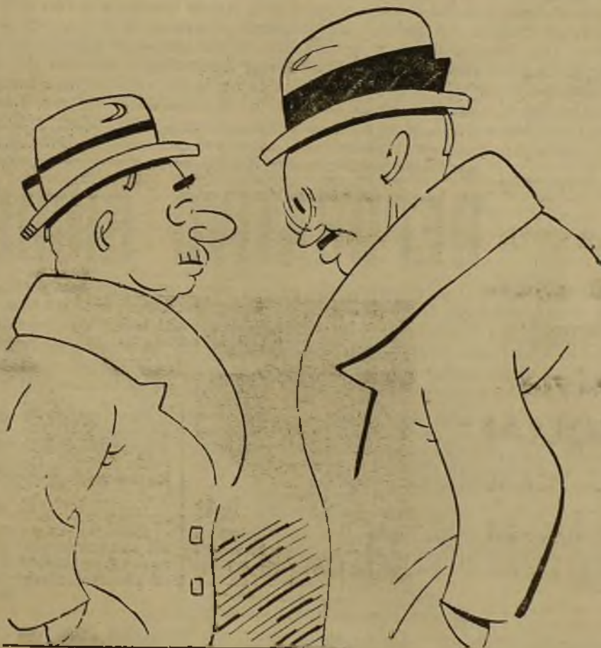
INDAGANDO, por K-HITO

Con este motivo fue precisa la intervención de los guardias de Asalto. De primera intención los estudiantes se dispersaron por diversas calles adyacentes a la Universidad; pero, posteriormente, se rehicieron los grupos volviendo a acometer, por lo que de nuevo tuvo que intervenir la fuerza de Seguridad, disolviendo los grupos definitivamente, sin que se practicara ninguna detención ni resultara ningún lesionado.