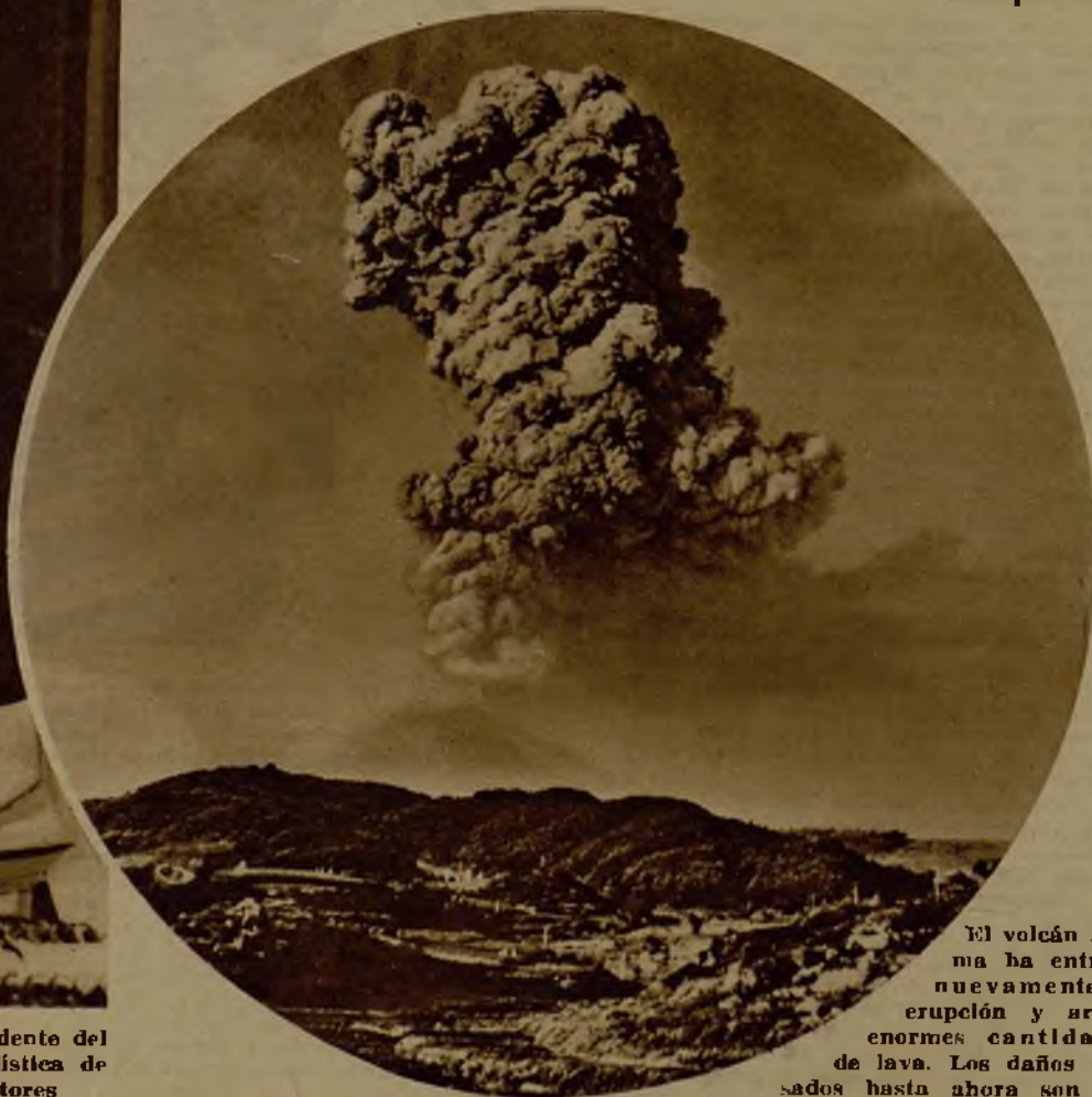
El volcán Aka-ma ha entrado nuevamente en erupción y arroja enormes cantidades de lava. Los daños causados hasta ahora son importantísimos.