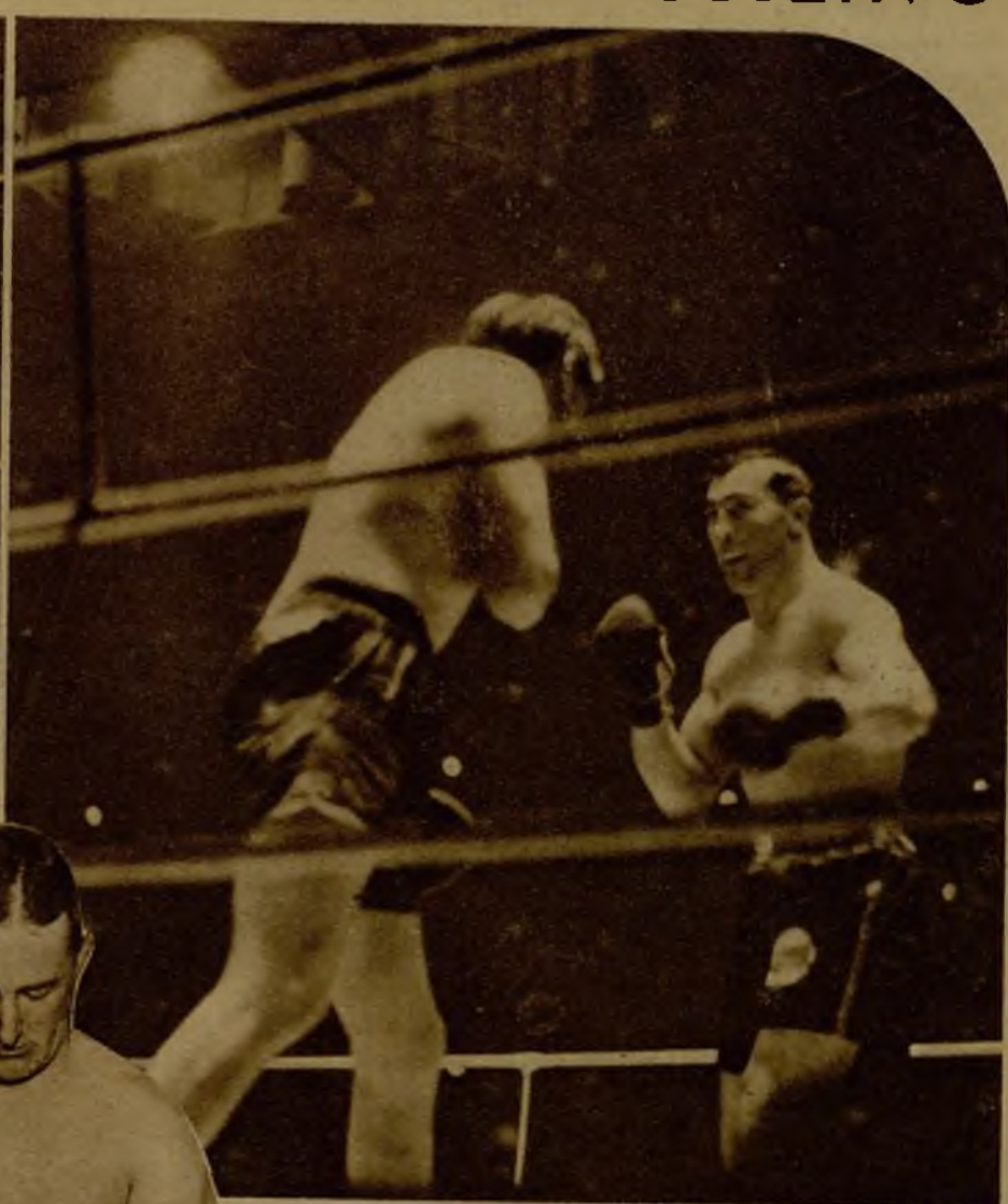
LOS "SUPERDREADNOUGHTS" DEL RING ABURREN A LA GENTE. —Un momento de la pelea celebrada en París entre el belga Pierre Charles y el italiano Primo Carnera, y que llegó hasta el límite... para desesperación de los espectadores