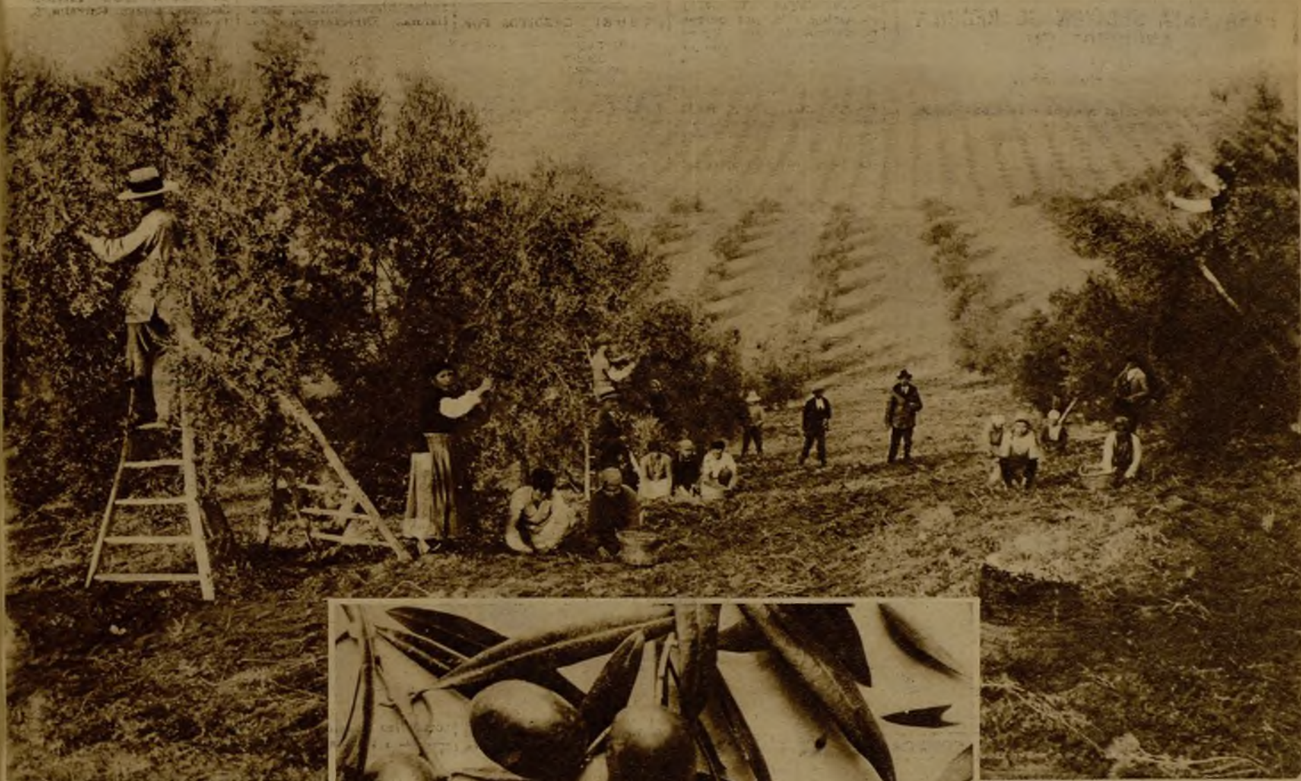
La recolección de la aceituna en los campos de Córdoba

Los obreros han dejado de percibir cerca de veinte millones de pesetas