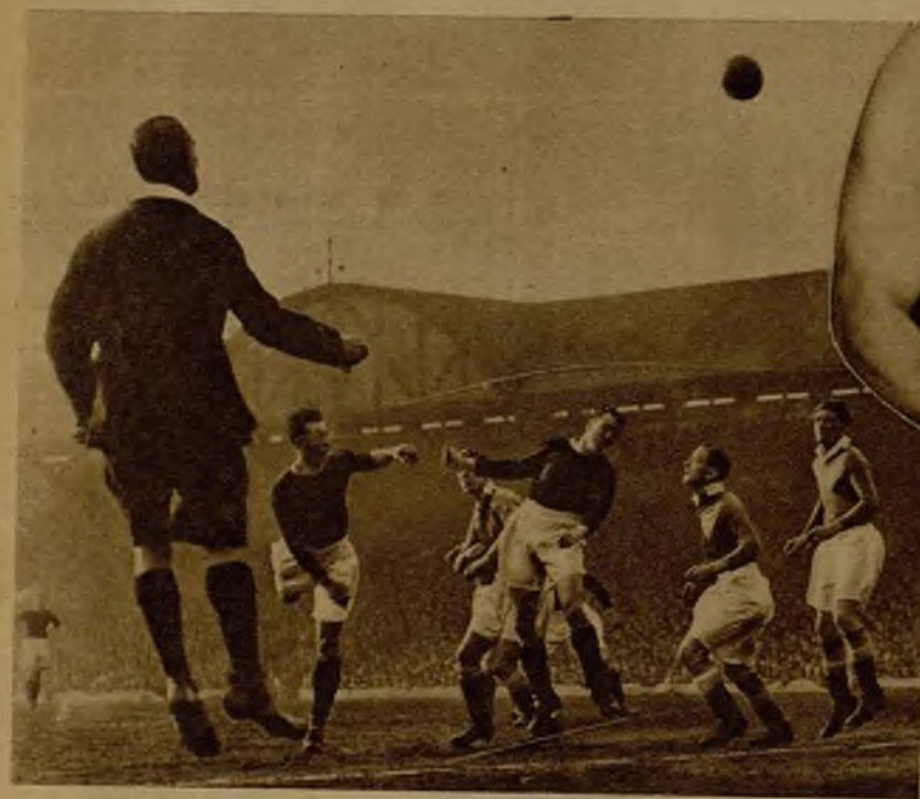
TODOS SALTAN; HASTA EL ARBITRO. —El partido Chelsea-Liverpool, uno de los más competidos de la Copa inglesa, dió lugar a emocionantes escenas como la que recoge la fotografía. Hasta el árbitro, arrastrado por el dinamismo del momento, tiende a elevarse...