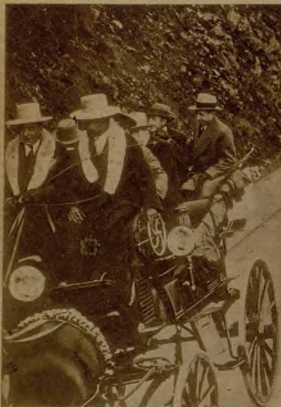
Con la animación de siempre, celebra la barriada de Gracia su romería de "Sant Medí". Véase a unos romeros camino de la ermita del Santo.