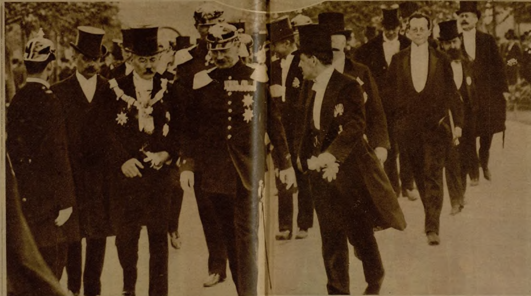
He aquí una fotografía de Federico Augusto Juan de Sajonia, que acaba de fallecer, durante una fiesta popular en Dresde, cuando aún ocupaba el trono

Cuando la reina Luisa entraba en su palco en el teatro de Dresde, toda la sala, puesta en pie, la aplaudía y la vitoreaba; tal era la adoración que la gentil princesita inspiraba a aquel pueblo rudo y sentimental. Desde que ella vivía en Dresde, las batallas de flores habían cambiado de aspecto; no eran ya esa cosa fría, seria, acompañada, que suele ser una batalla de flores concebida por espíritus germánicos; ella, de pie en una calea, las mejillas encendidas, riendo con toda su juventud, con todo su entusiasmo; gozando de la vida con los pulmones abiertos, se batía como una verdadera leona, lanzando los claveles y las rosas a puñados, y no con la timidez que caracterizaba hasta entonces este género de diversiones meridionales, transplantadas bajo el cielo gris de Dresde.