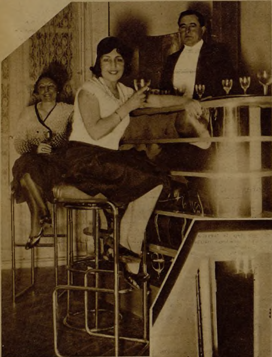
En breve se celebrará la inauguración del nuevo Centro Ateneo Femenino "Magerit". Club de recreo y de cultura. Bellas asociadas en un rincón del bar americano