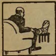
Gota - Dolores