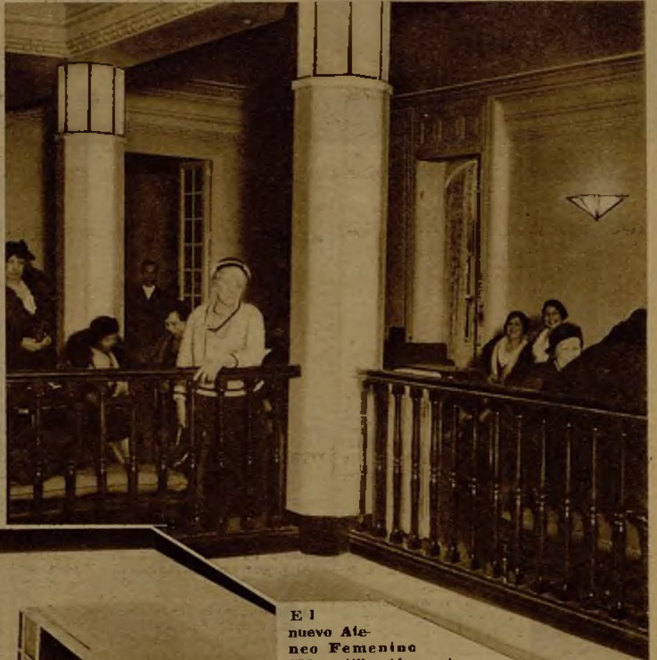
El nuevo Ateneo Femenino "Magerit" está exento de toda tendencia política. Su finalidad es principalmente cultural y artística, y en su programa figura la organización de conferencias y exposiciones. Está dotado, además, de las adecuadas condiciones de recreo para la distinguida sociedad femenina que integra su lista de socios. He aquí una vista de las galerías altas