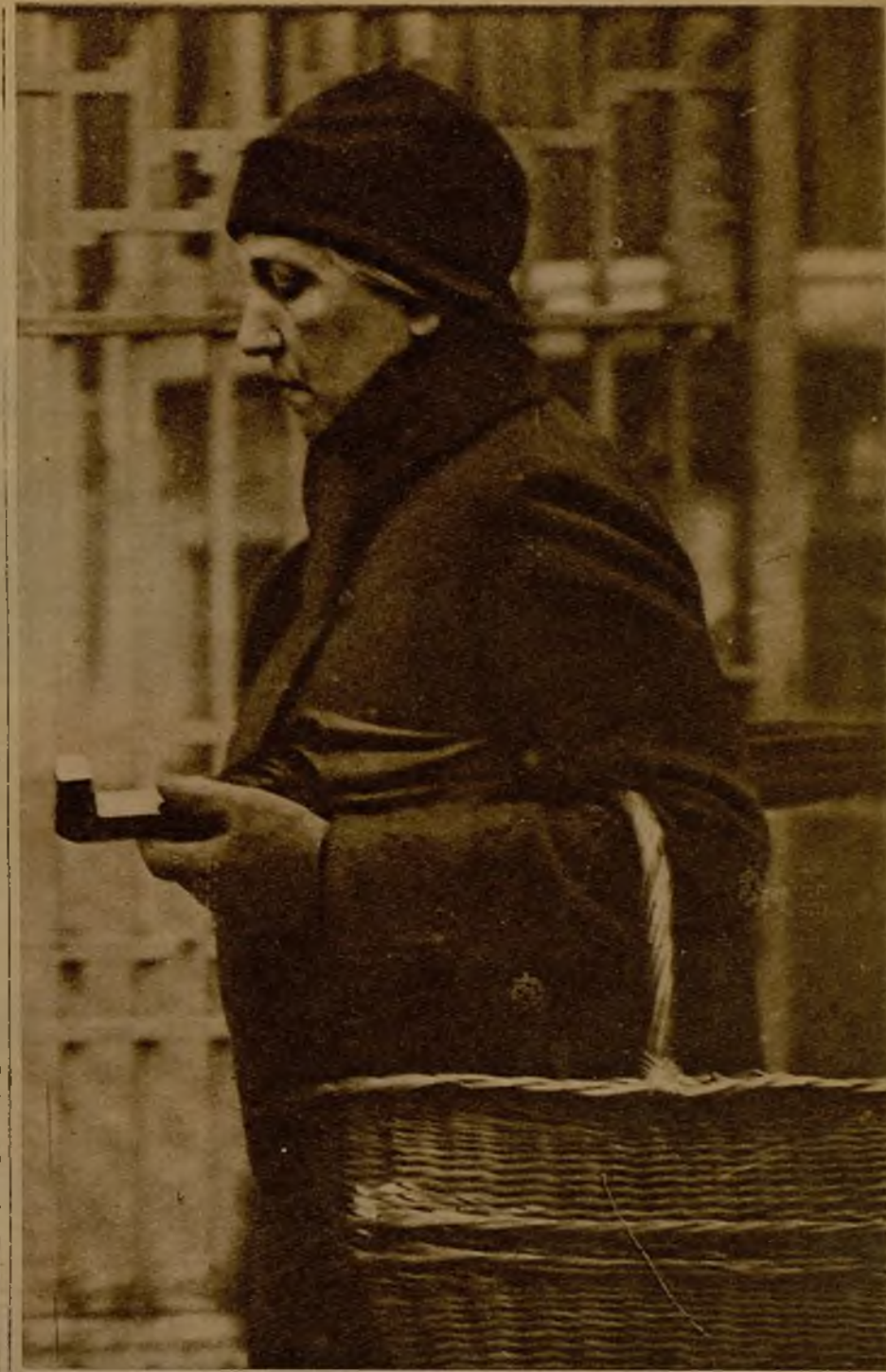
En esta quedó la peregrina belleza y el alocado buen humor de la archiduquesa Luisa de Toscana, que fué un tiempo reina de Sajonia

—Mi salida del palacio de Dresde no ha sido más que un pretexto; la verdad es que yo no podía respirar en aquel