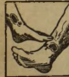
Males en las piernas