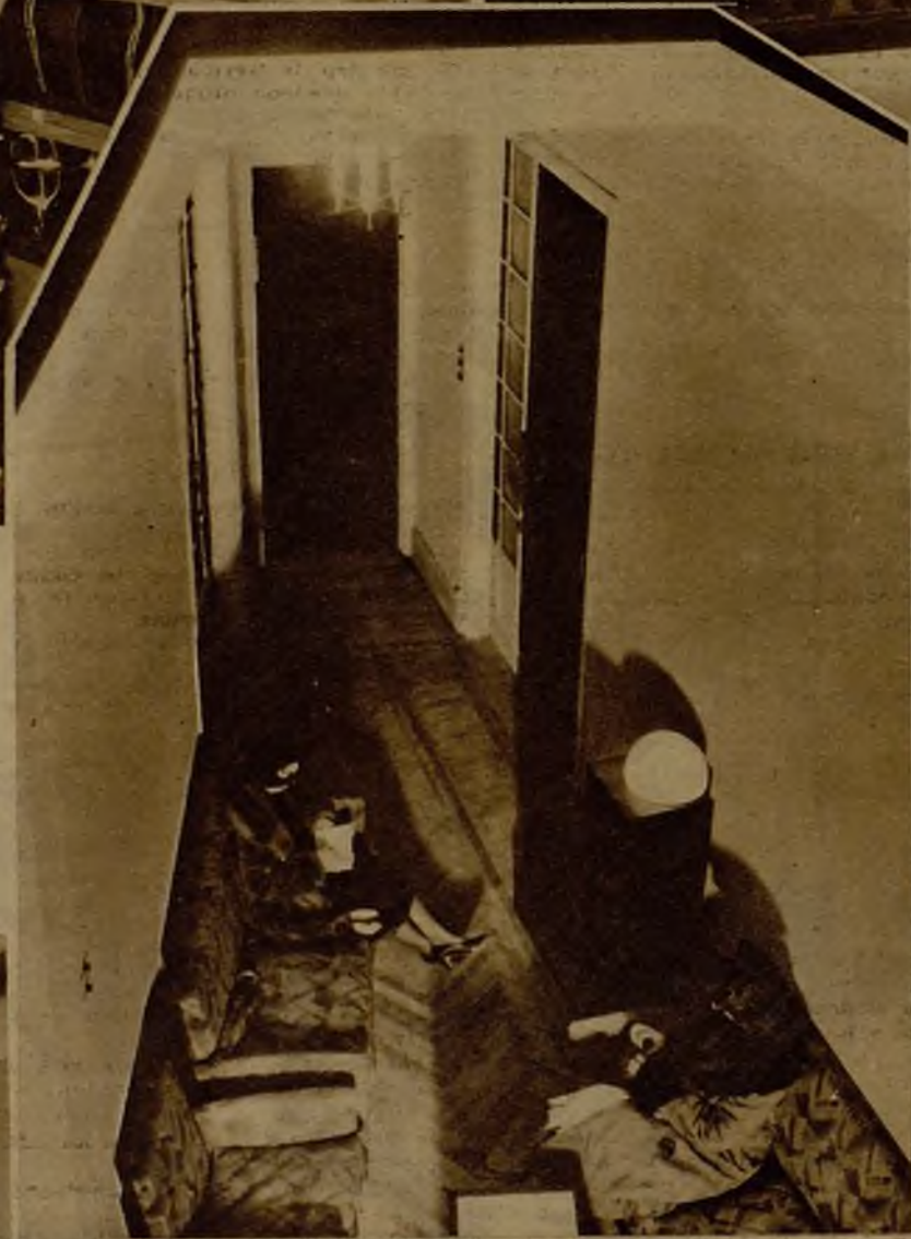
El vestíbulo del nuevo Club femenino, visto desde el "hall" del piso principal →