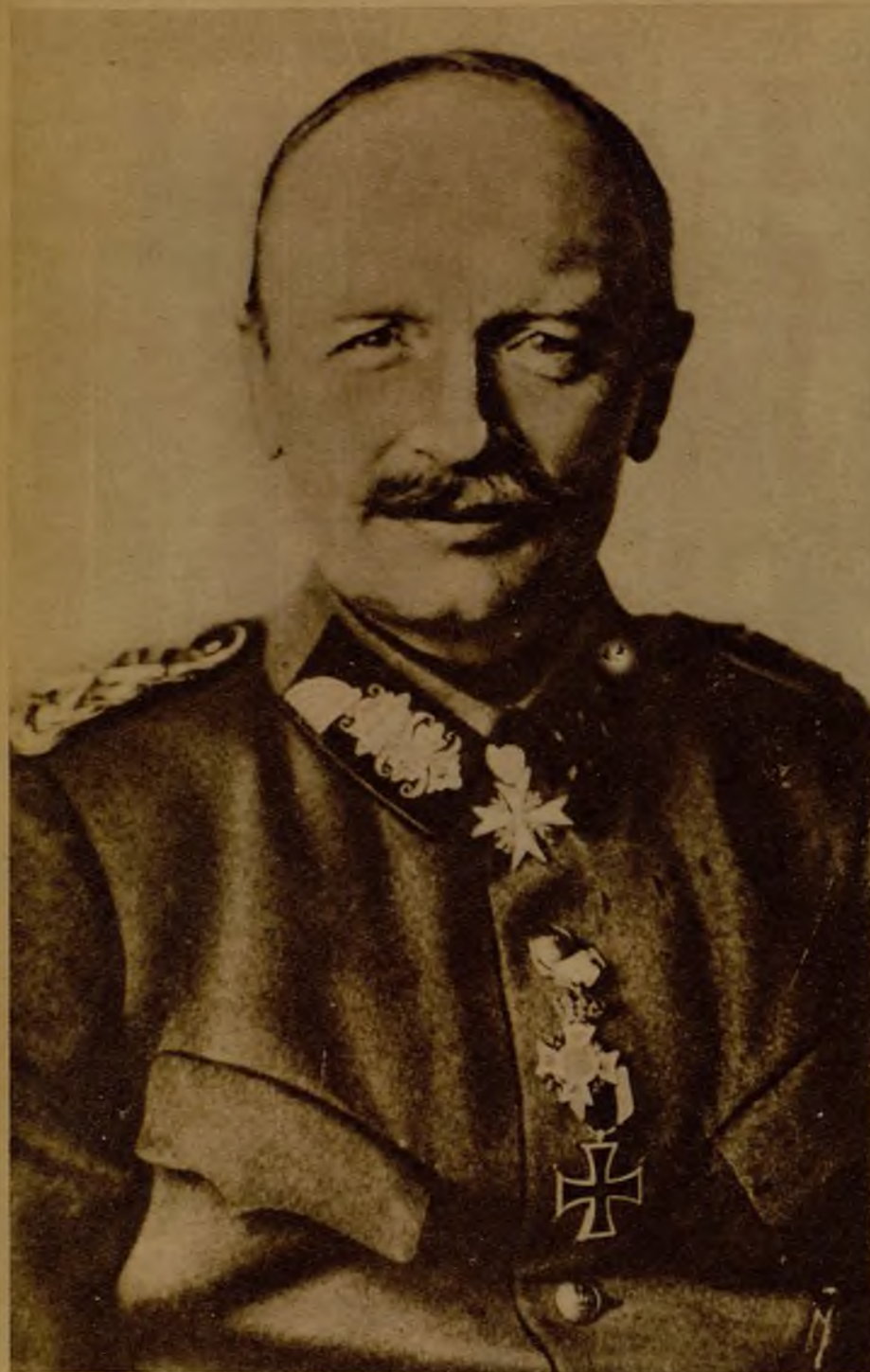
El último ex rey de Sajonia, Federico Augusto Juan, cuando aún las consecuencias de la Gran Guerra no habían destruido su trono

Las agencias nos han anunciado, sin profusión de detalles, que acaba de fallecer en Dresde, su antigua capital, el ex rey de Sajonia, que fué uno de los soberanos más poderosos, más populares y más amados del antiguo Reich alemán.