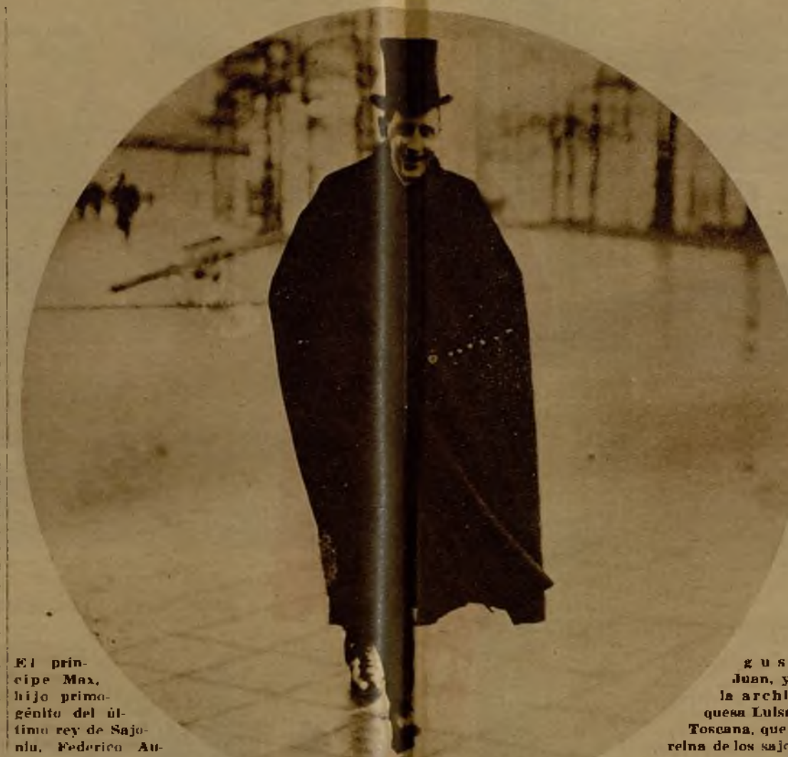
El príncipe Max, hijo primogénito del último rey de Sajonia, Federico Augusto Juan, y de la archiduquesa Luisa de Toscana, que fué reina de los sajones

El desgraciado soberano llegaba hasta sentir por instantes deseos de perdonar a su mujer, pensando en la agobiante tristeza de la vida sajona para una vienesa acostumbrada a la vida trivial de la alegre capital austriaca.