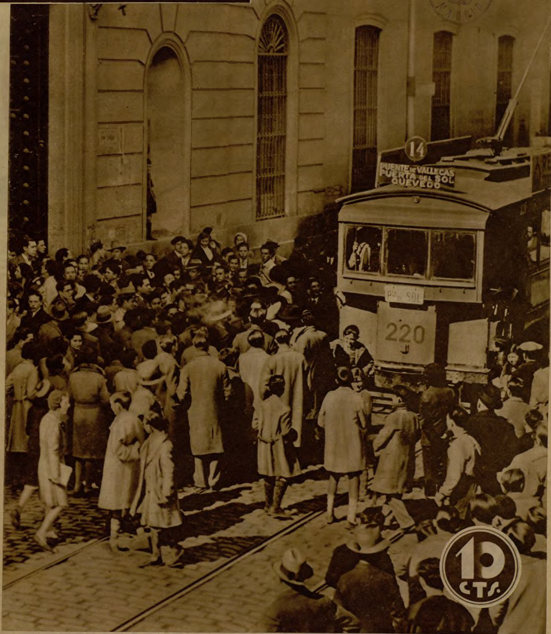
LOS ALBOROTOS ESTUDIANTILES DE AYER. —Con motivo de disparidad de criterios entre escolares de distinta significación se promovieron ayer mañana en las inmediaciones del Instituto del Cardenal Cisneros algunos disturbios, que hicieron necesaria la intervención de la fuerza pública. Durante los alborotos, que no tuvieron otro alcance, los escolares trataron de detener, como se ve en la foto, la circulación de los tranvías