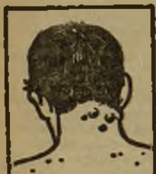
Granos - Forunculos

Tengo tambien de los consumidores de España frecuentes testimonios de curaciones maravillosas obtenidas con el uso de mi Depurativo. No los publico sin embargo por sujetarme al deseo expresado por los mismos de no dar a conocer sus nombres respetando así su natural reserva. Pida Vd hoy mismo un folleto gratuito al Laboratorio Richelet, San Sebastian, 22, San Bartolomé.