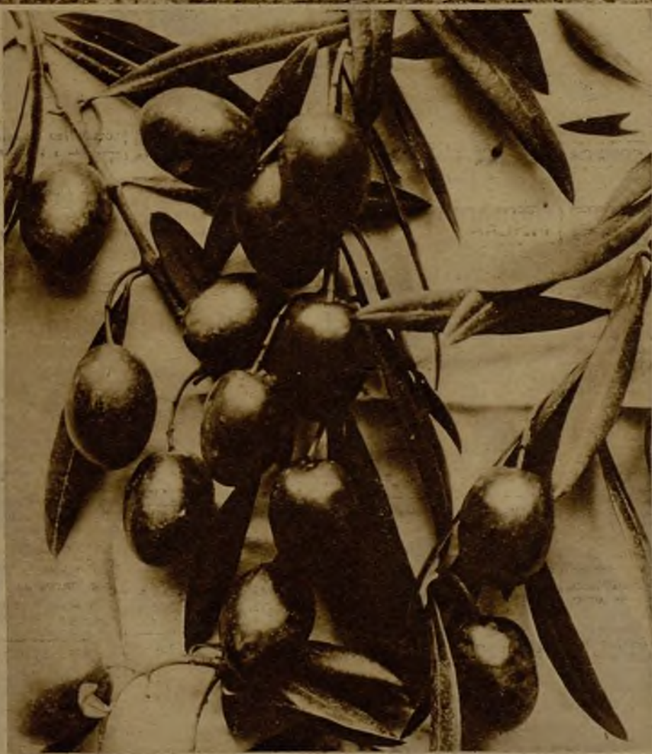
Una rama de olivo, lujosamente adornada de "gordales"

En noviembre llovió y esto hizo, con- cebir algunas esperanzas de que el fruto se desarrollara bien, pero no sucedió así porque tras el agua vinieron temperaturas constantes inferiores a cero que redujeron a un tamaño pequesísimo la aceituna. Entonces la Sección Agronómica vuelve a rectificar y señala la producción de aceite en 400.000 quintales métricos para toda la provincia de Córdoba. Entre la primera cifra y la última existe una diferencia de 389.000 quintales métricos. Esto supone la pérdida de