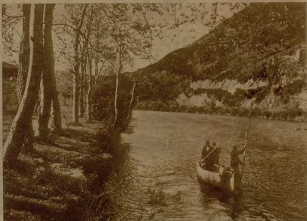
Una lancha pesquera en la ría de Límpias, saliendo a la pesca del salmón, recientemente autorizada.