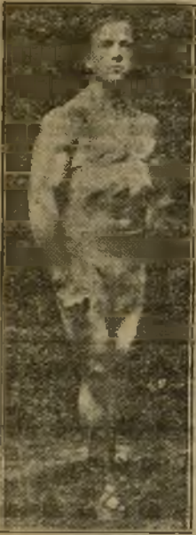
LIONEL STRONGFORT el hombre perfecto

Quizás es usted uno de los muchos miles de hombres que poco a poco, casi insensiblemente, van decayendo física y mentalmente, perdiendo todo gusto y alegría al caer en el marasmo de la impotencia y de la debilidad sexual. La alegría y el entusiasmo de los años juveniles, tal vez ya no hagan vibrar su decaído organismo. No debe usted, empero, permitir que el agotamiento y la paralización de las energías viriles culmine en la irreparable tragedia de la pérdida total de su virilidad. La ignorancia y el abandono son los responsables por tal estado de cosas. ¡Alerta! ¡Su vida misma está en peligro!