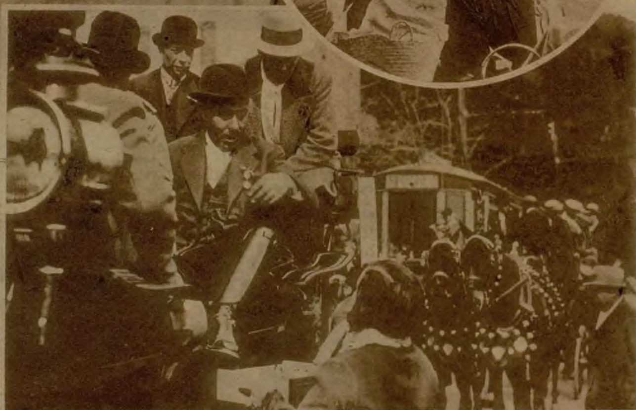
En círculo, los alegres concurrentes a la romería preparan la comida, que consumirán apetitosamente al aire libre. Abajo, unos devotos de "Sant Medí" comprando reliquias.