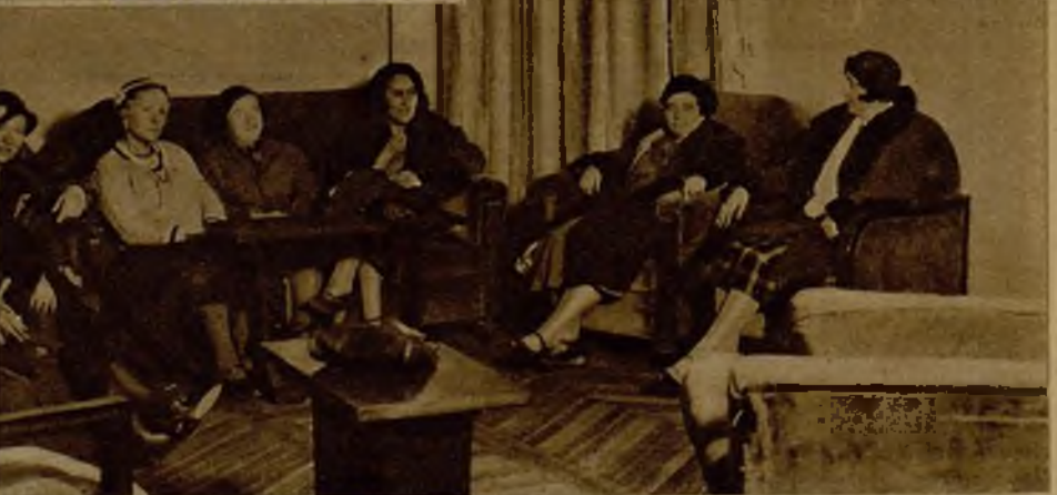
Salón de "bridge" en el nuevo Club femenino