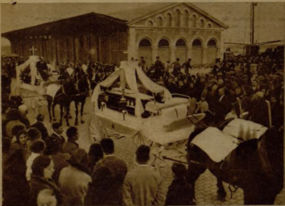
Desfile por las calles de Tarragona de la fúnebre conducción de los cadáveres de dos marinos Italianos muertos a bordo del vapor "Ayrcania", con dirección al puerto, donde fueron embarcados los restos