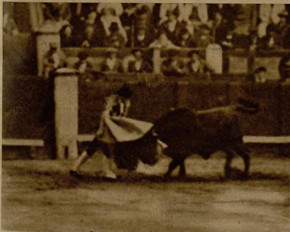
Rafael Moreno toreando por verónicas a uno de sus toros