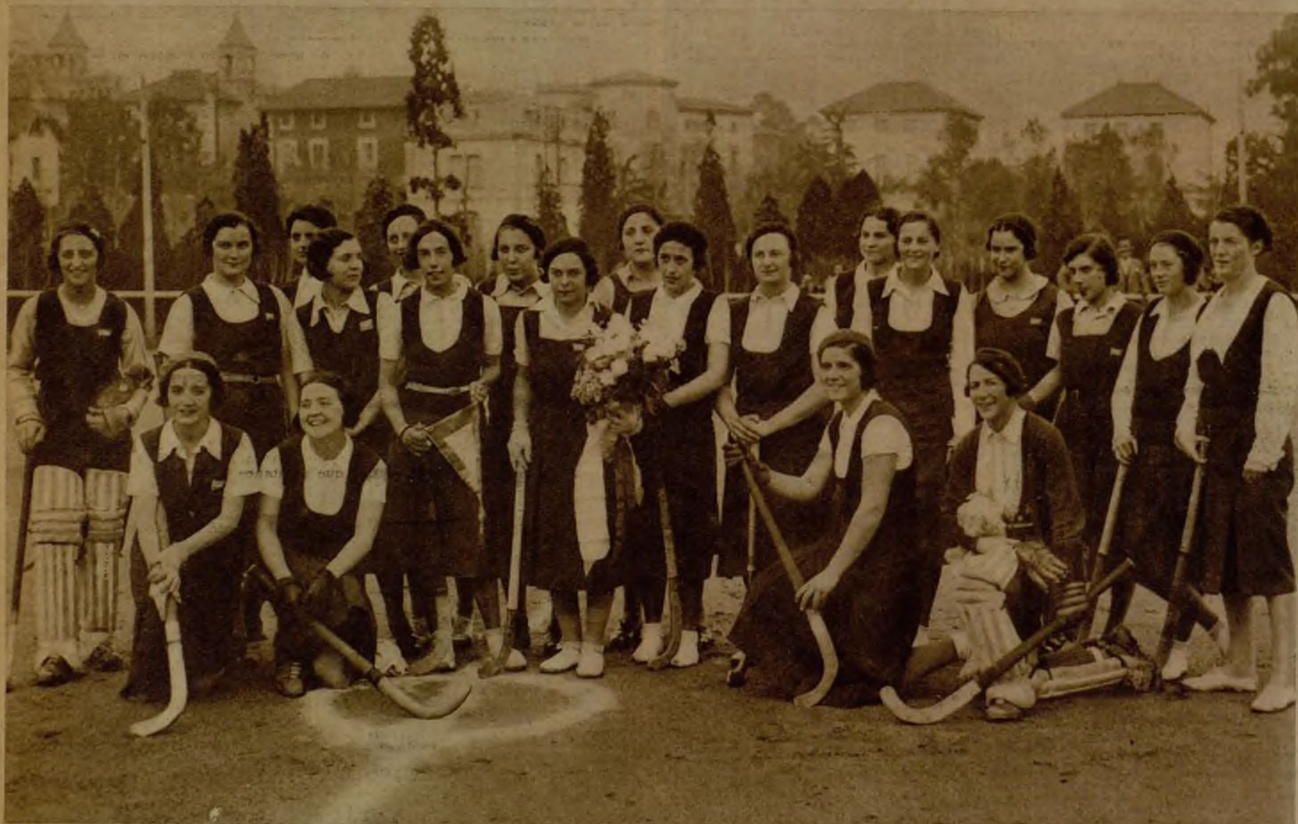
Las jugadoras de "hockey" del Club de Campo, de Madrid, y del Polo Jockey Club, forman un magnífico ramillete de feminidades atléticas, antes de dar comienzo el partido, que se desarrolló en el campo del Club barcelonés

En Barcelona se ha celebrado un partido de "hockey" entre los equipos del Club de Campo, de Madrid, y del Polo Jockey Club, de la capital de la "Generalitat". A él pertenecen estos dos episodios, que ponen de relieve el magnífico ardor puesto en la lucha por los equipos contendientes