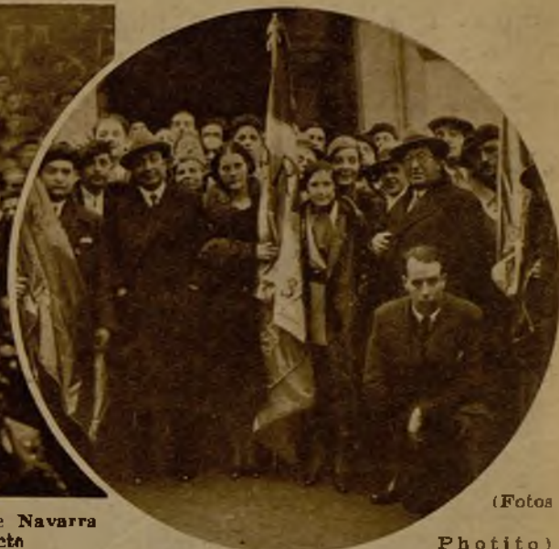
Mitín de propaganda republicano radical socialista celebrado en Irún. En el círculo, las representaciones de Navarra y Gulpúzcoa que asistieron al mitín rodeando a los señores Ortega y Gasset y Botella a la salida del acto