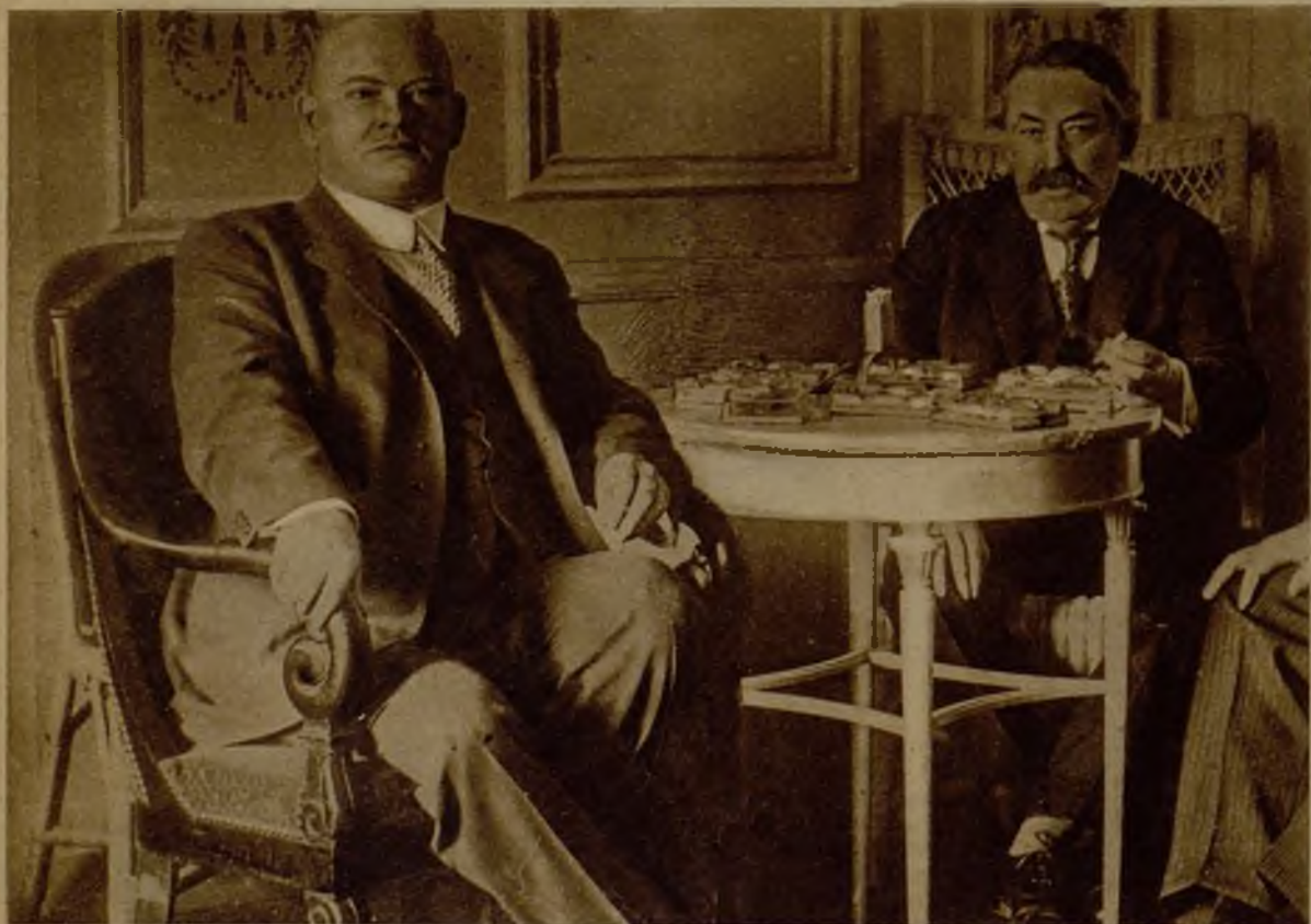
La buena amistad que unía a Briand y a Stresemann era, en realidad, la base más eficiente de la aproximación francoalemana