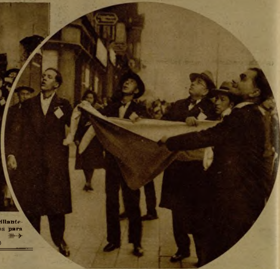
Estudiantes que coadyuvaron brillantemente a la recaudación de donativos para los hospitales barceloneses