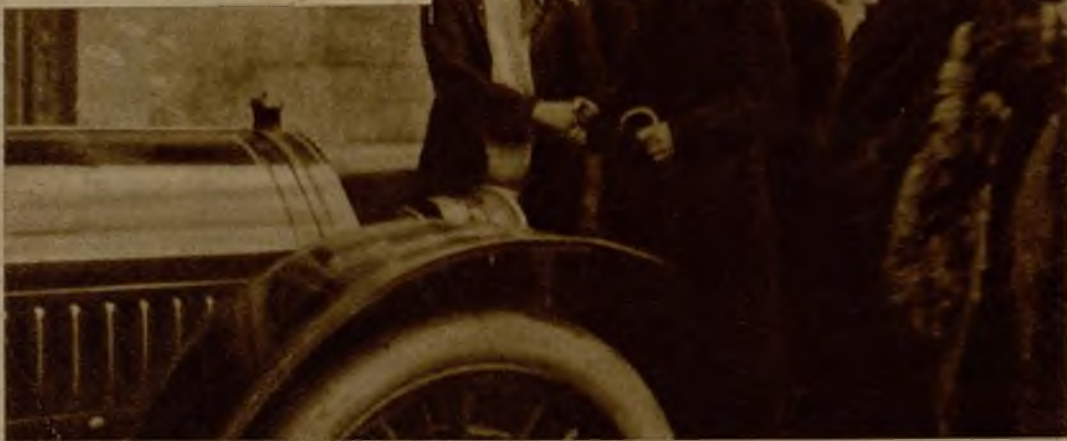
A los cuarenta años, cuando recorría las comunas del Loire, que le eligieron diputado por vez primera en 1902