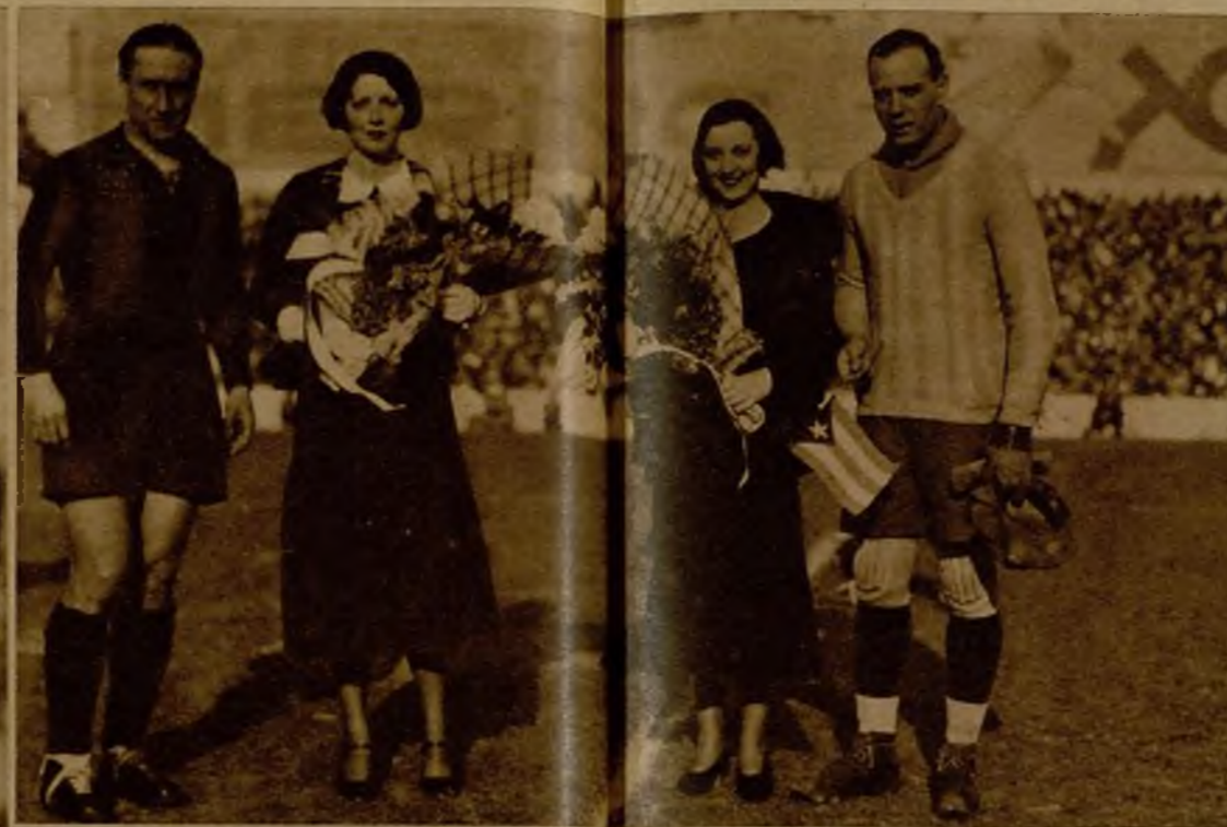
Das hermosas representantes de la colonia cubana saludaron