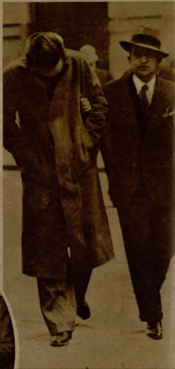
El autor del disparo contra su cómplice Yagüe, conducido por un agente de Policía, elude la acción de los reporteros gráficos