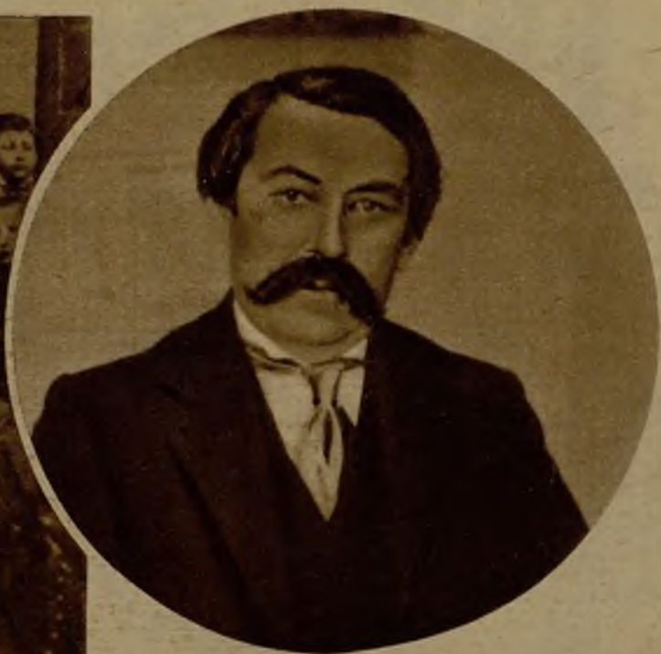
Briand a los cuarenta y cuatro años, al ser ministro por primera vez, de Instrucción Pública, con el Gabinete Sarrien