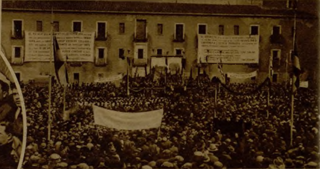
Una vista del lugar que ocuparán los edificios del grupo escolar Collazo Gil. Al acto inaugural de las obras concurrirá numeroso público