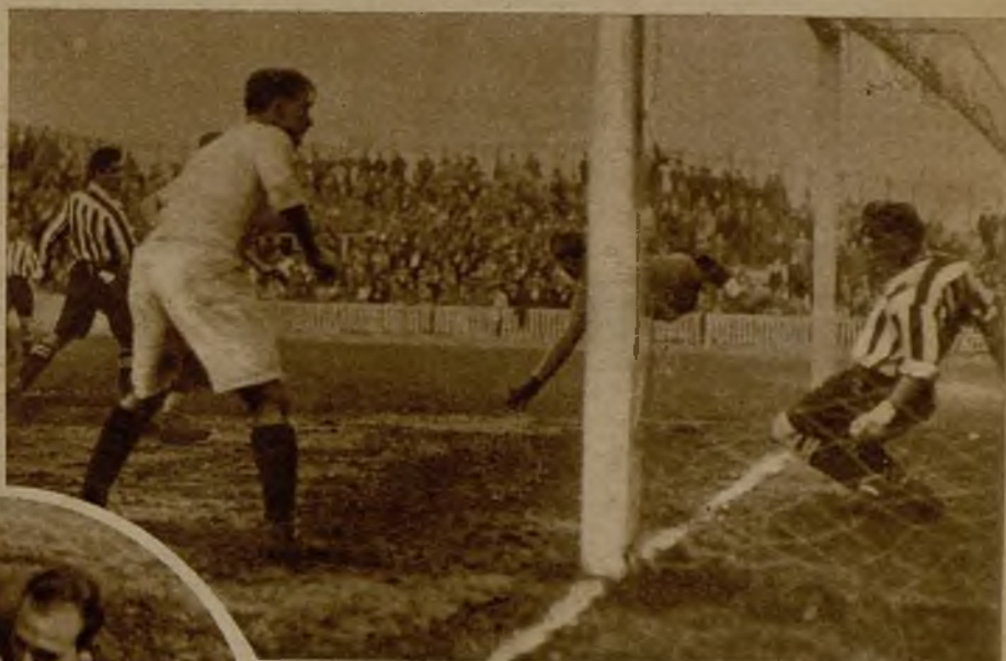
El segundo tanto marcado por el Valencia al Athlético de Bilbao. Ni Blasco, que está en el aire como un pelele, ni Urquiza, desde dentro de la jaula, pueden impedir el goal