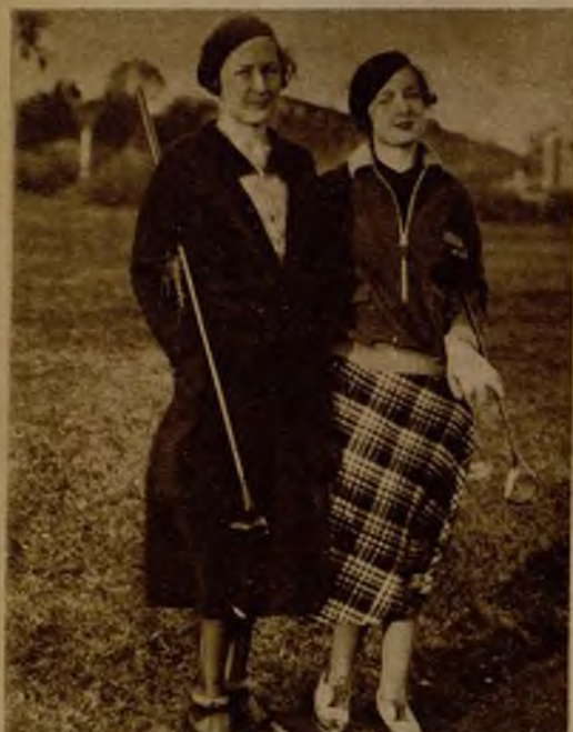
Señoritas de Ibarra y de Barzanallana

Rodando a orillas del mar a 408 kilómetros por hora