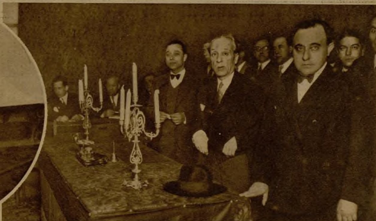
El doctor Marañón durante su brillante conferencia en la Facultad de Medicina de Zaragoza