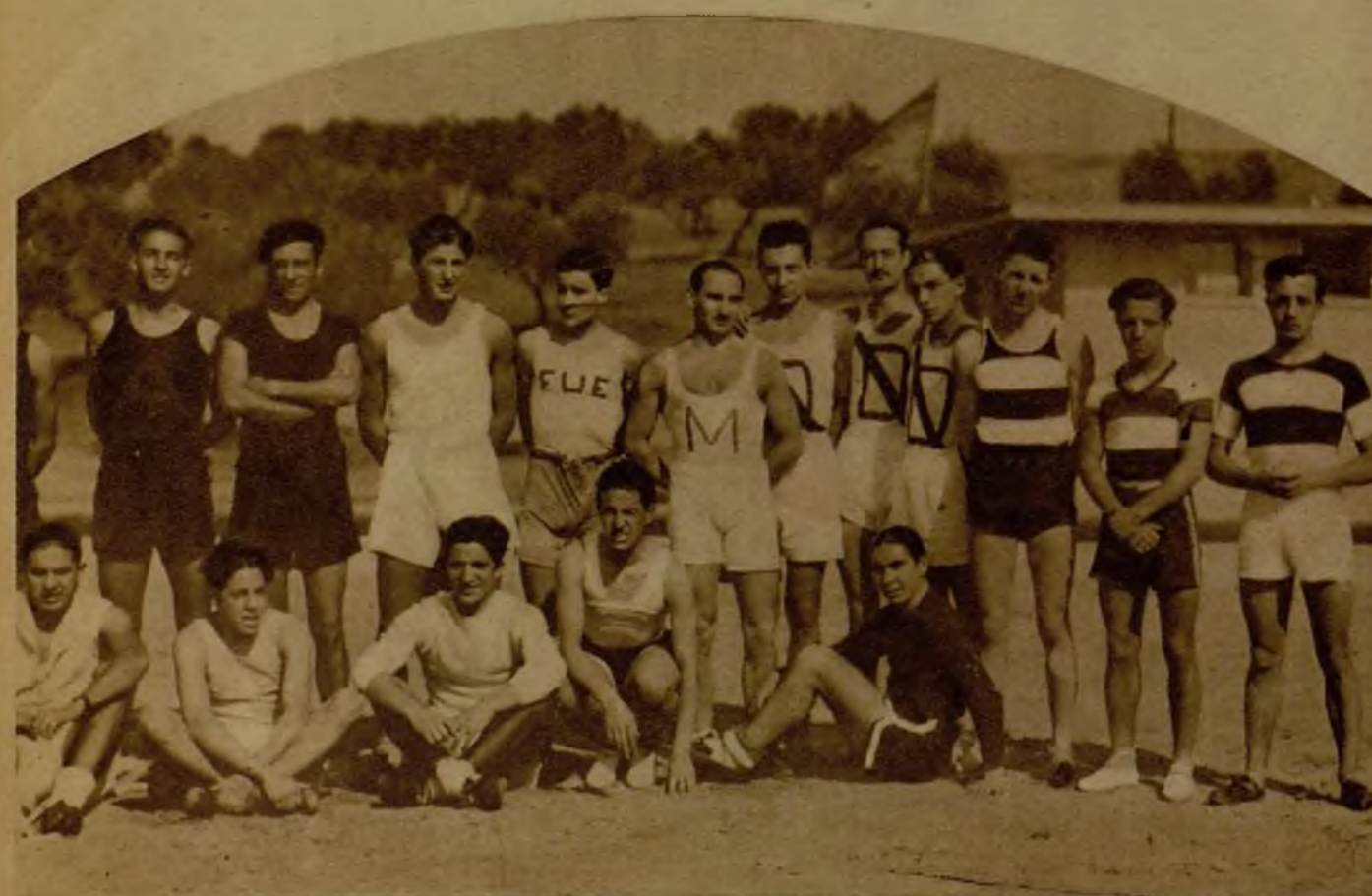
El campeonato universitario de "cross", celebrado en terrenos de la Moncloa, reunió un buen lote de participantes pertenecientes a las diferentes Facultades y Escuelas