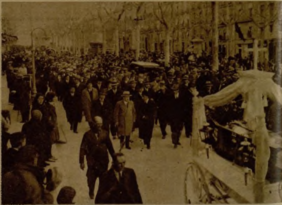
Autoridades civiles y de Marina de Tarragona presidiendo el duelo en la conducción de los marinos del "Ayrcania". Los cadáveres fueron embarcados en el vapor "Guldo Bruner" para ser llevados a Génova