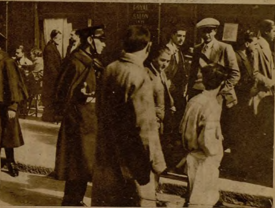
Un detenido con motivo de las algaradas que se promovieron a la salida del mitin de escolares católicos en el cine de la Ópera