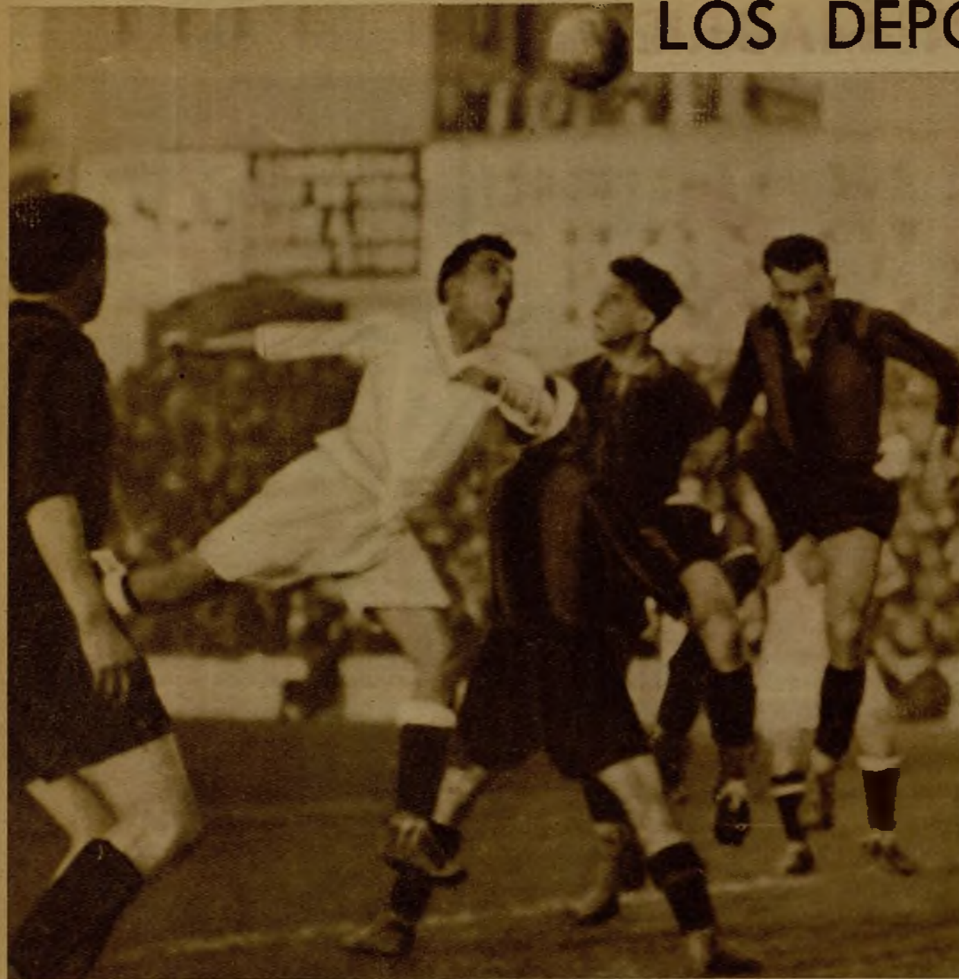
El partido Madrid-Arenas terminó con el rotundo triunfo del equipo madrileño por cuatro tantos a cero. La instantánea recoge una impetuosa entrada de Ollvares al remate de un centro