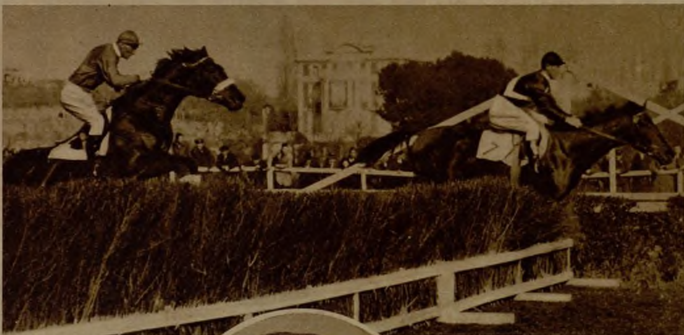
La primera carrera del año, el Premio Hollé (vallas), es ganada por "Bol d'Or" (Chavarrias), delante de "Manchette" (A. Díez)