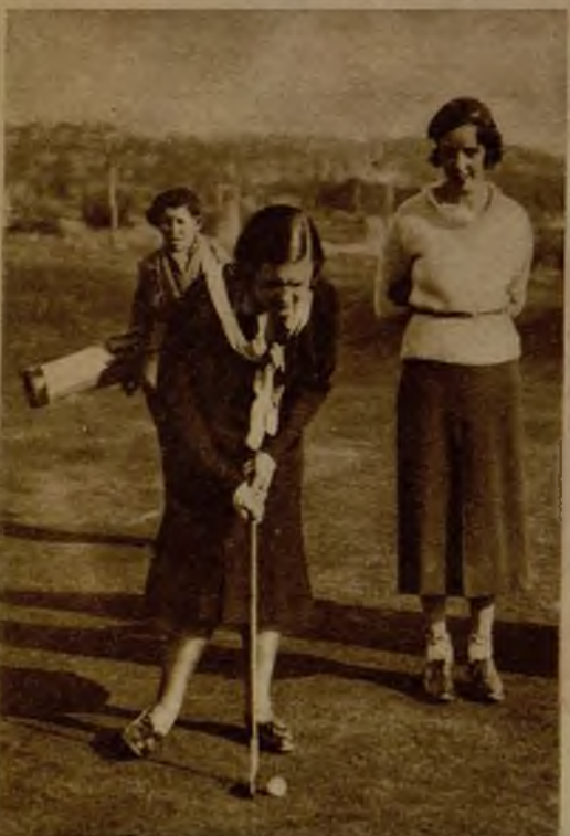
La señorita de Ambouge en juego