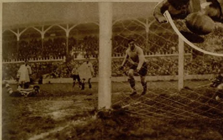
Santo marca desde el suelo uno de los goales del Athlético. En su inverosímil postura, "Bata" impulsa con la cabeza al balón, que sorprende a Nebot, y le quita la gorra