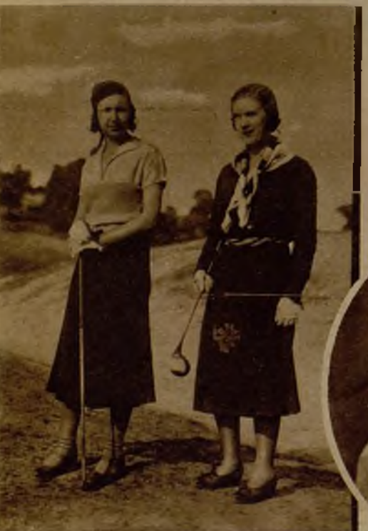
Señoritas de Alós y de Ambouge