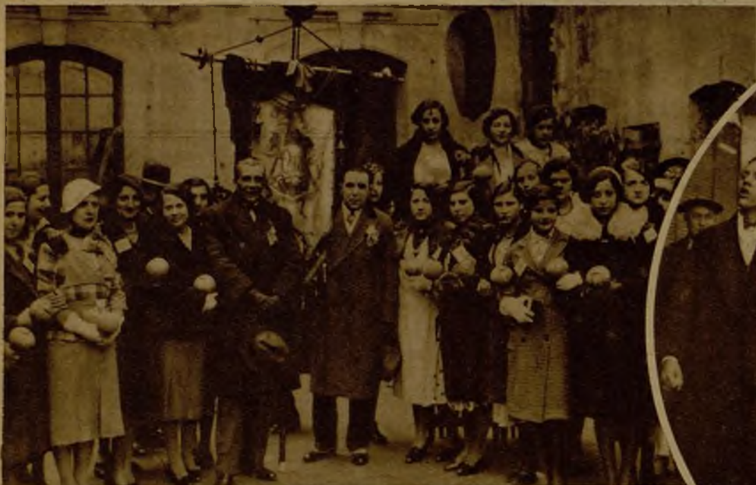
Un grupo de señoritas barcelonesas, provistas de sus huchas, en las que recogieron por las calles de la ciudad cuantiosos donativos para los hospitales