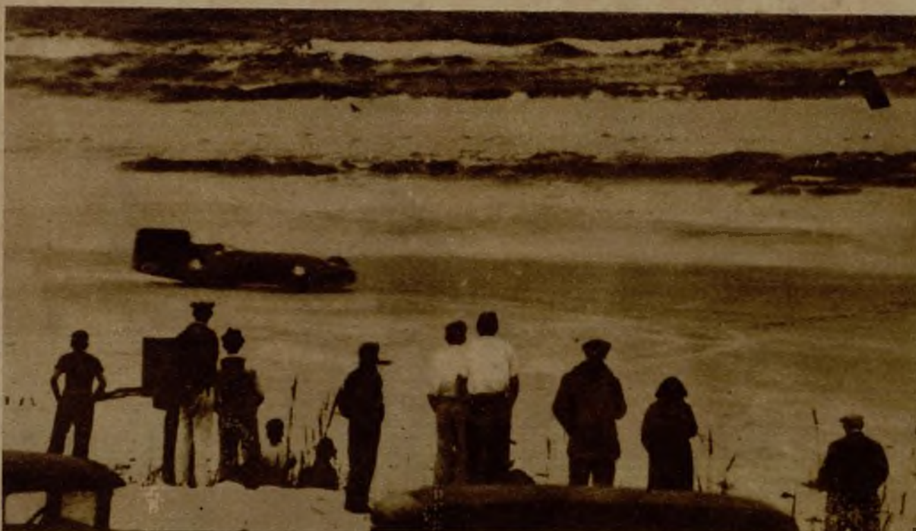
El "Pájaro Azul", de Malcolm Campbell, durante las pruebas en que batió todos los "records" del mundo, de velocidad, en la playa de Daytona