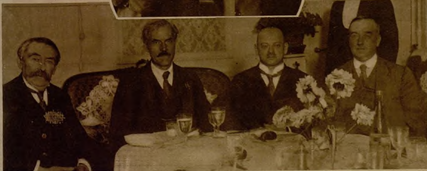
Una comida en Ginebra en septiembre de 1929, con motivo de la reunión del primer Consejo de la Sociedad de Naciones, a que asistieron los ministros laboristas

Hace veintidós años, Briand dicta a los taquígrafos su contestación al ataque de los socialistas. (Dibujo de Sabattier, alusivo a las tempestades provocadas en la Cámara por las afirmaciones del ilustre hombre público)