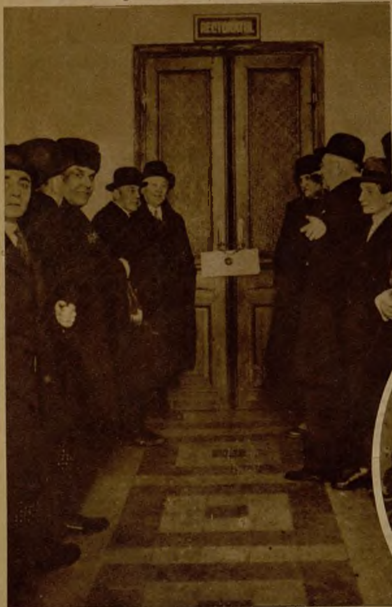
M. Jorga, presidente del Consejo de ministros rumano y rector de la Universidad, ha cesado en este último mandato; pero cuando sus colegas de cátedra se han dispuesto a nombrarle sucesor, han encontrado el salón del Rectorado, donde se celebran las votaciones, cerrado con una cadena, por orden de M. Jorga, que, a lo que se ve, está decidido a que no lo reemplacen