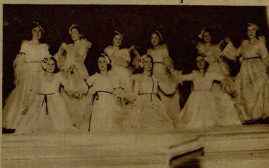
Señoritas de la Asociación de Estudiantes Católicos, de San Sebastián, que interpretaron el minué de "La viejecita" en las fiestas de su patrón