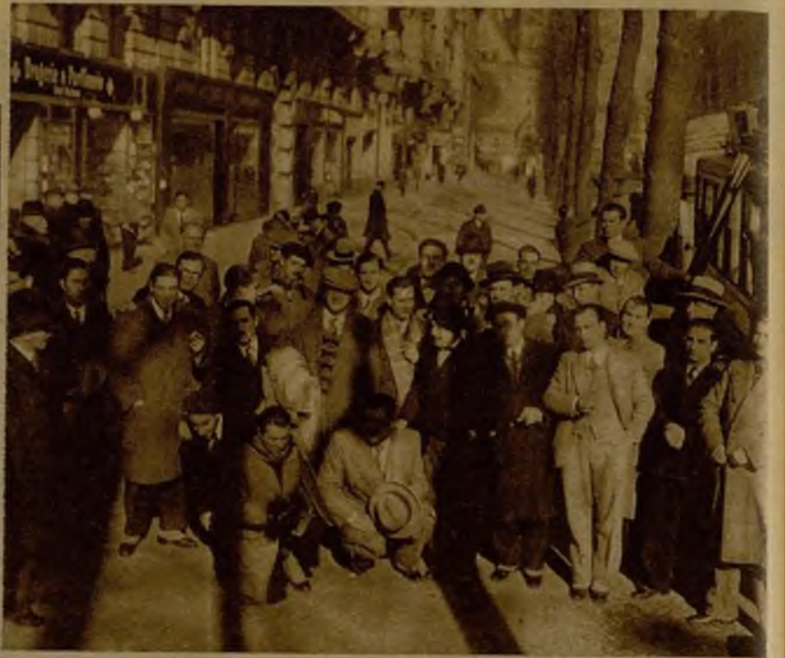
Los escolares barceloneses se colocan ante el objetivo fotográfico, junto a uno de los autobuses que los transporta, en una calle de Berlín, durante la visita que hicieron a los monumentos