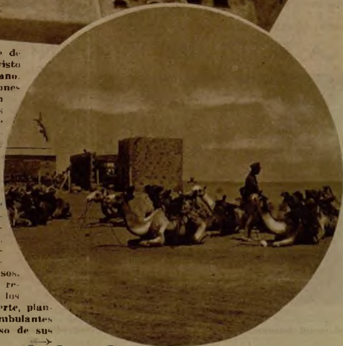
Por el territorio de Río de Oro circulan numerosas caravanas indígenas, dedicadas al comercio y al pastoreo. En sus descansos, uno de los cuales reproduce la foto, en los alrededores del fuerte, plantan sus tiendas ambulantes y esperan el reposo de sus camellos