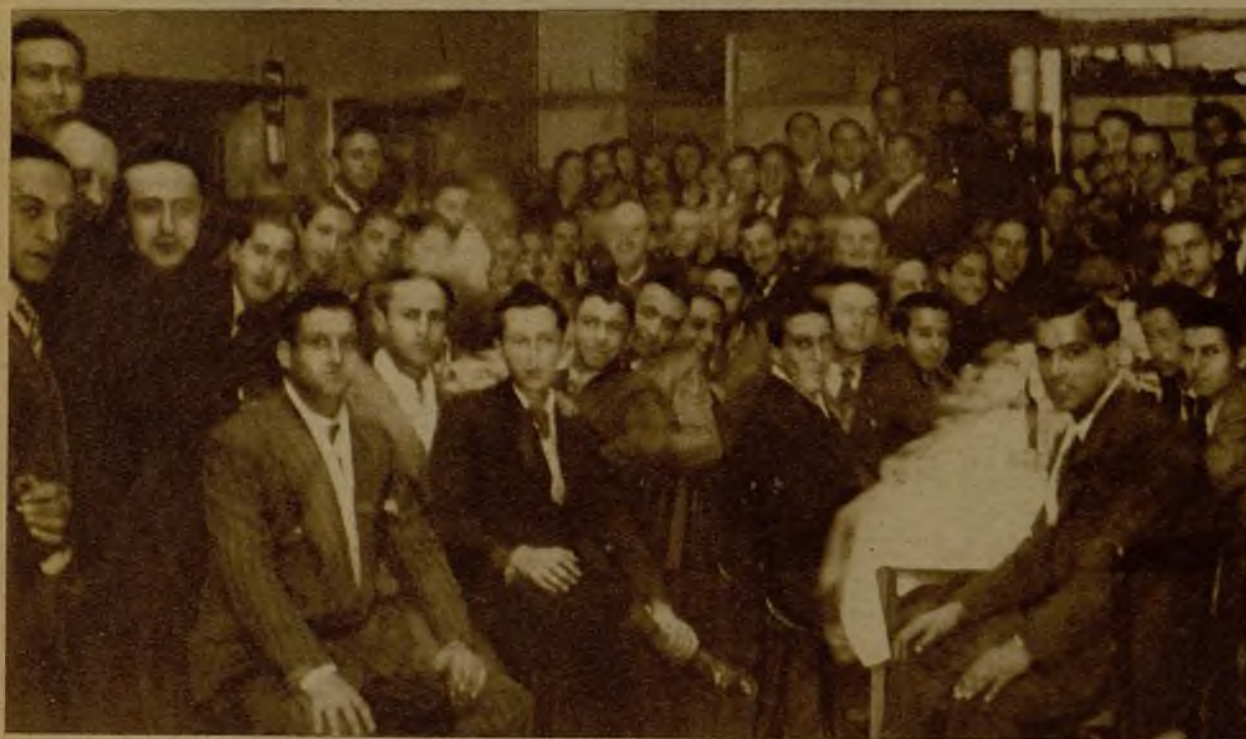
Banquete celebrado por los estudiantes de Oviedo con motivo de las fiestas de Santo Tomás de Aquino. El acto, que estuvo concurrendísimo, puso una vez más de manifiesto el fértil ingenio de los estudiantes astures