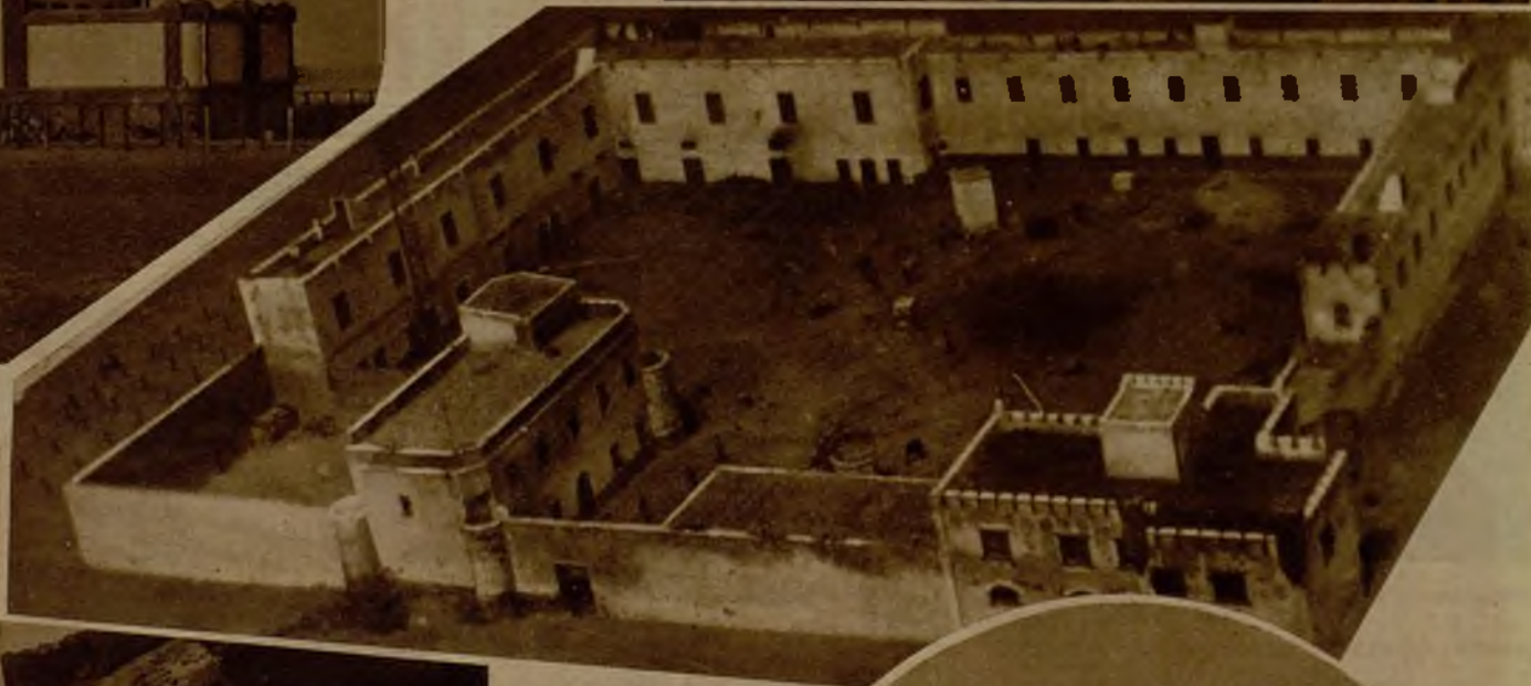
Recinto del fuerte de Villa Cisneros, visto desde un aeroplano. En las edificaciones del fondo tienen alojamiento las tropas, y en las de primer término están las oficinas y el pabellón de oficiales