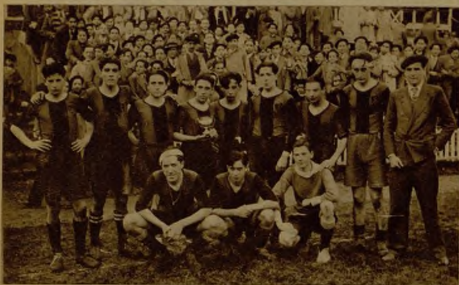
Equipo de la Escuela de Altos Estudios con la copa ganada en el partido escolar celebrado en el campo de San Mamés, de Bilbao