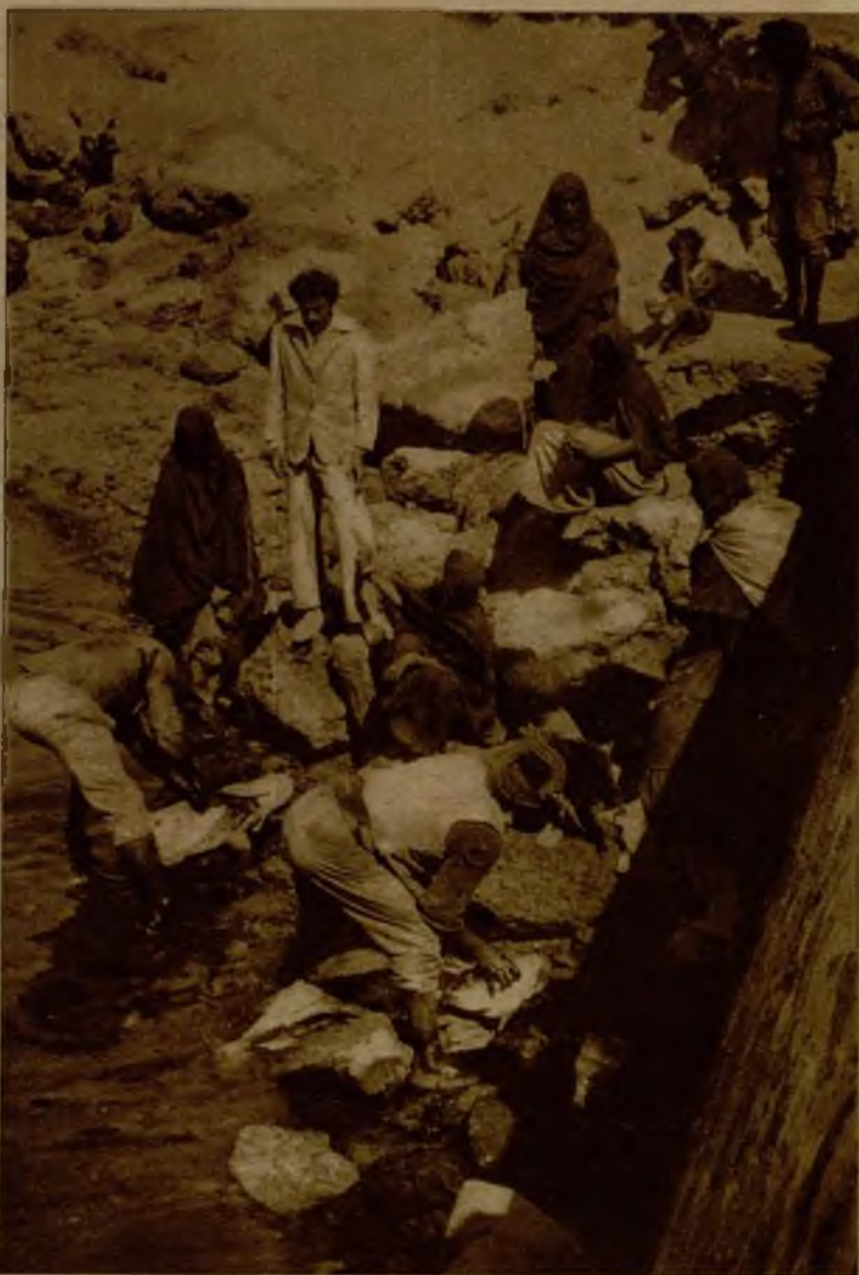
Los habitantes de Villa Cisneros no tienen otra ocupación que la recogida del pescado que queda entre las peñas en la bajamar.