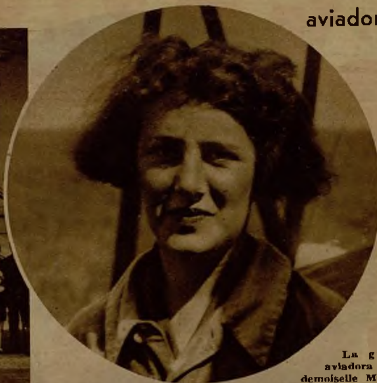
La gran aviadora mademoiselle Maryse Bastié, poseedora de varios records mundiales, ha obtenido el trofeo Internacional de aeronáutica, que está por primera vez en manos femeninas