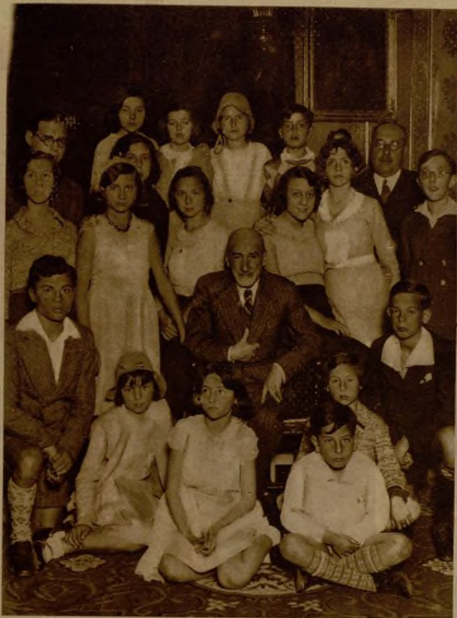
El insigne don Jacinto Benavente, cariñoso amigo del Lectorio Infantil Hispanoamericano, ha recibido de mano de los pequeños acogidos a la institución el título de socio honorario de la misma. Heo aquí con sus visitantes, a los que obsequió cariñosamente