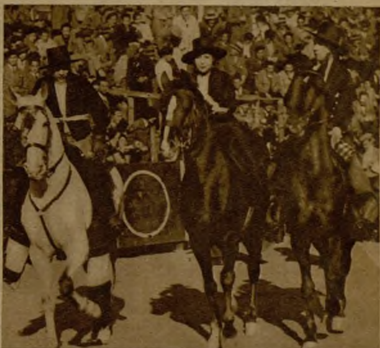
La gentil caballista que pidió la llave en la becerrada de los estudiantes, escoltada por dos de éstos