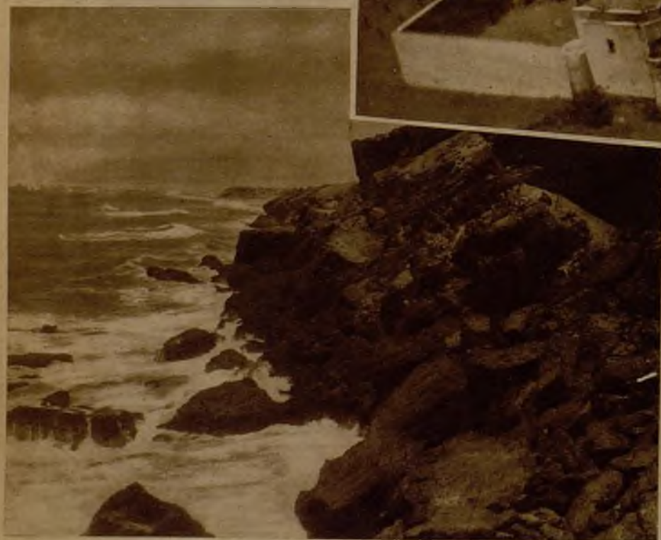
El acantilado de Villa Cisneros, punto del territorio en el que el mar suple con perfecta rigurosidad cualquier otra vigilancia