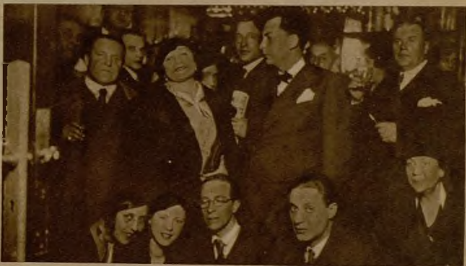
Algunas de las principales figuras de la Compañía Artística de Moscú, con varios redactores de AHORA, durante su visita de ayer a nuestra casa