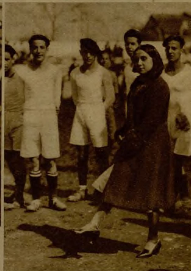
Partido de fútbol celebrado en Córdoba por los estudiantes con motivo de la fiesta de Santo Tomás de Aquino, patrón de los estudiantes católicos. En la fotografía aparece el momento en que la madrina del equipo Magisterio hace el saque de honor