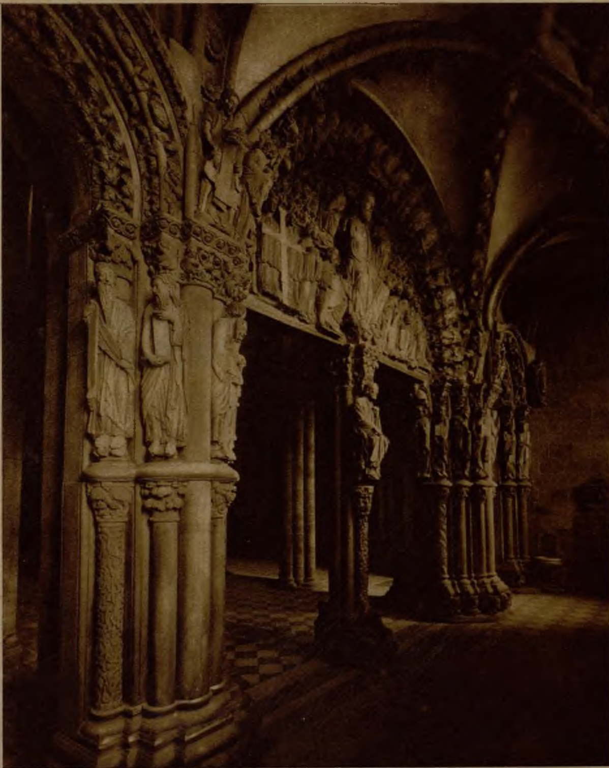
El famoso Pórtico de la Gloria, en la catedral de Santiago de Compostela