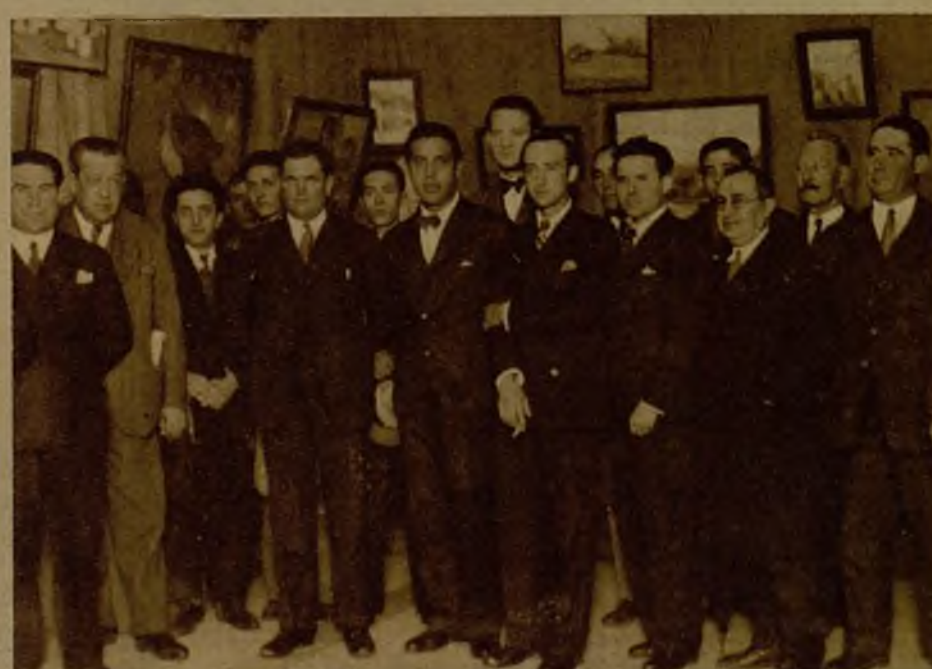
Momento de ser inaugurada la Exposición de pintura y escultura de los artistas señores Enrique Segura y Manuel Echegoyan, pensionados por la Diputación de Sevilla