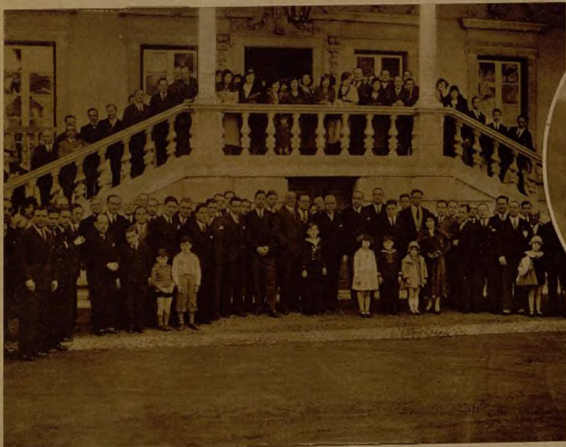
Concurrentes a una fiesta celebrada en la Embajada de España en Lisboa, en la que nuestro representante diplomático repartió entre la colonia de compatriotas ejemplares de la Constitución de la República