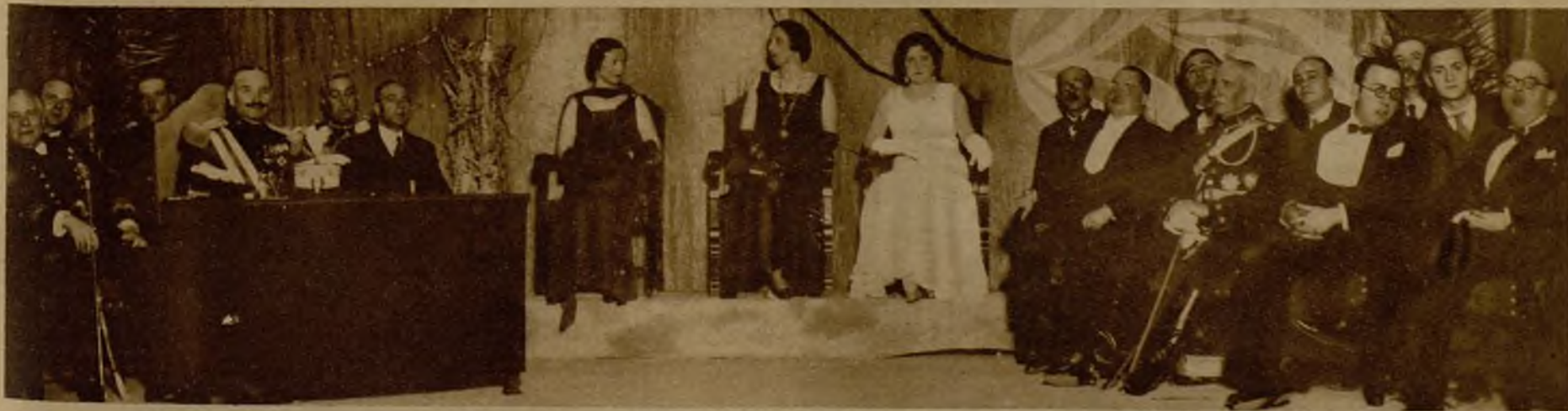
Presidencia de la brillantísima fiesta, homenaje del estudiante murciano a la República, celebrada con gran solemnidad en el teatro Romea de dicha capital. Figuran en el estrado el general Queipo de Llano, en representación del Gobierno; el almirante Cervera, y las autoridades locales. Actuó de mantenedor el ministro de Agricultura, don Marcelino Domingo