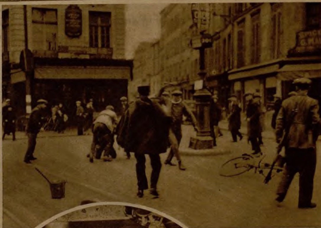
En Saint Denis, cerca de París, los comunistas han promovido fuertes alborotos al pretender alterar la paz de un modesto mercado, establecido a lo largo de las calles, en el que pretendieron colocar banderas de su partido. Véase a uno de ellos en el momento de descargar un golpe de porra sobre un agente de Seguridad