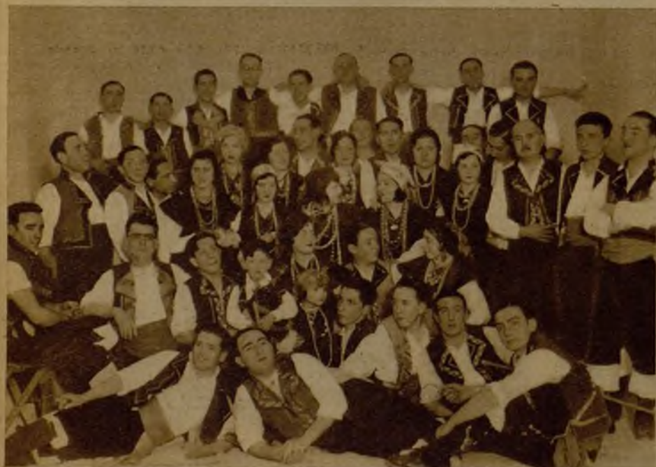
La notable colectividad "Anaquiños d'a Terra" ha inaugurado con una gran fiesta su domicilio social en Madrid. He aquí el coro artístico