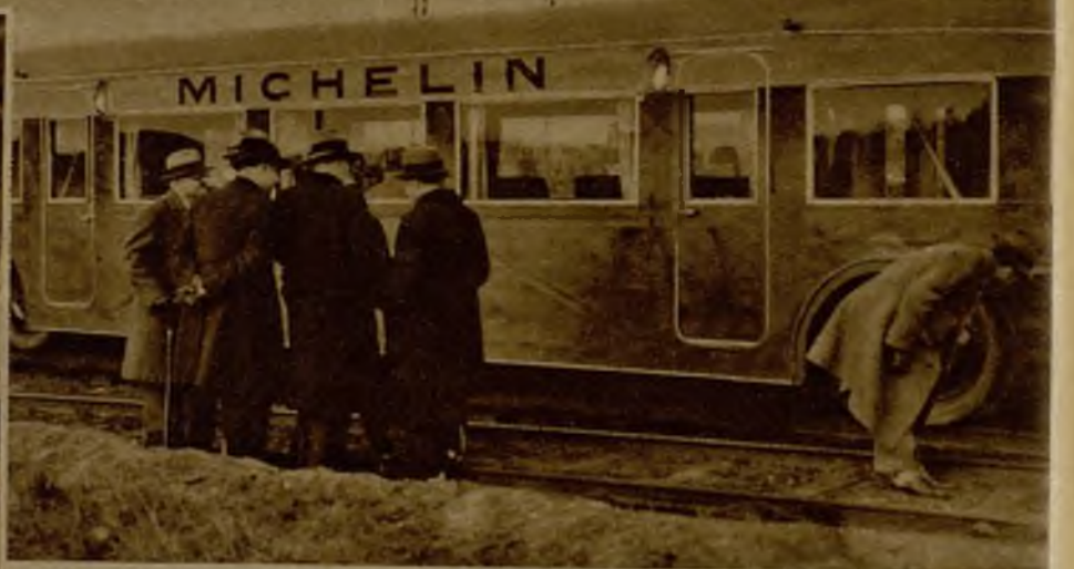
Véase el interior de uno de los autobuses sobre rieles, cuya prueba, verificada en París con gran éxito, ha sido presenciada por delegados del Ministerio de Obras Públicas de España