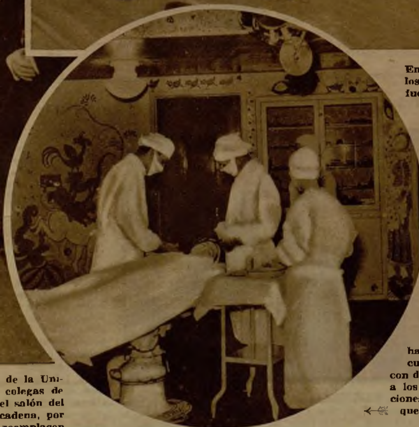
En el Barnes Hospital, de San Luis (Estados Unidos), ha sido instalado un quirófano cuyas paredes están adornadas con dibujos grotescos, para distraer a los enfermos durante las operaciones poco importantes, en las que no se aplique la anestesia