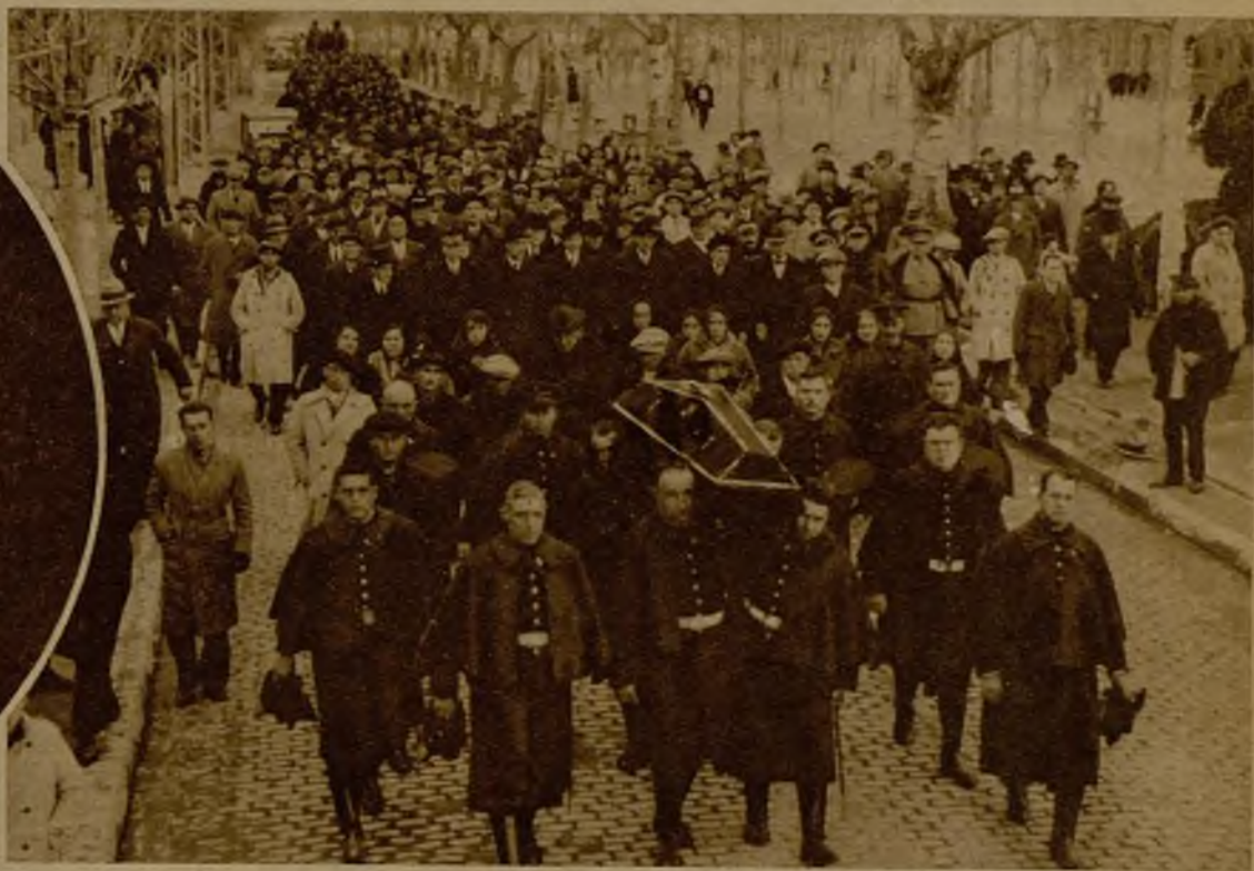
El entierro del guardia Ropero ha constituido una verdadera manifestación de duelo. Presidieron la fúnebre conducción las autoridades zaragozanas, y concurrieron a ella en corporación los compañeros del fallecido