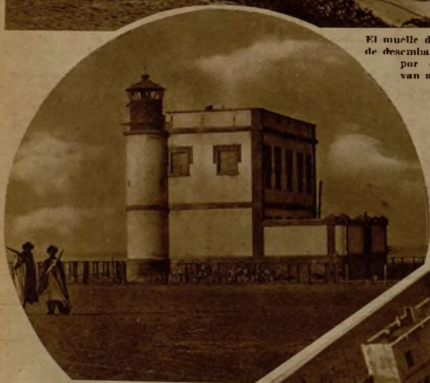
Una vista del faro de Villa Cisneros