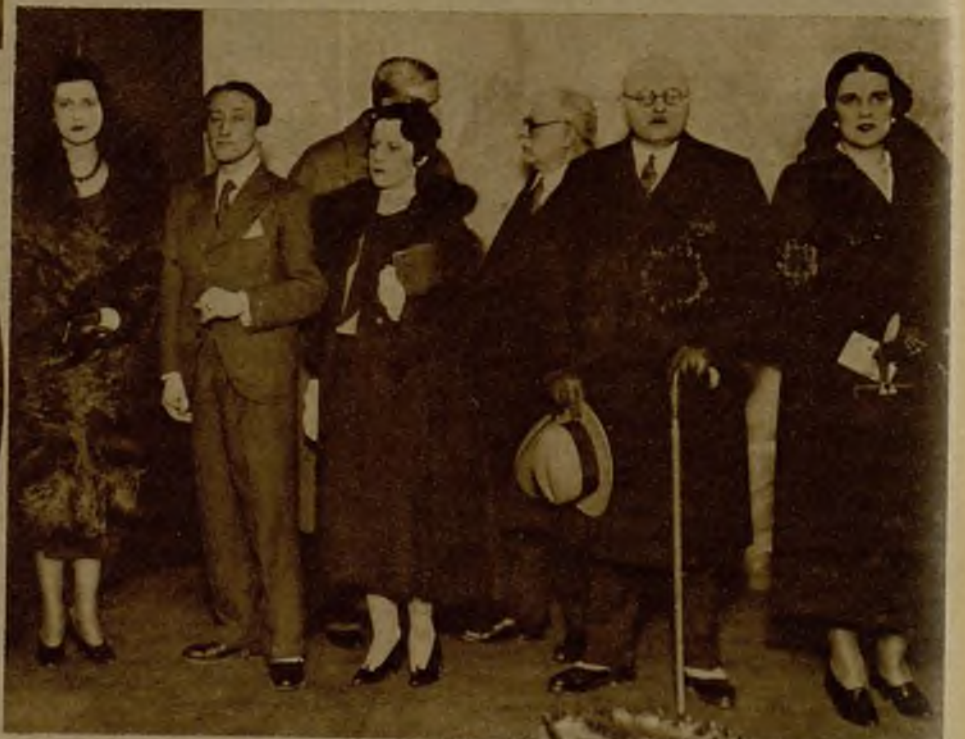
Concurrentes a la inauguración de una Exposición de cuadros del pintor español José Muñoz Melgosa, celebrada en París. Entre los concurrentes figuran representantes de nuestra Embajada en Francia