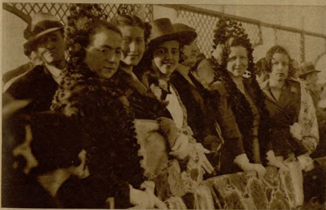
Bellísimas señoritas que presidieron un lucido festival taurino, en el que tomaron parte los estudiantes zaragozanos