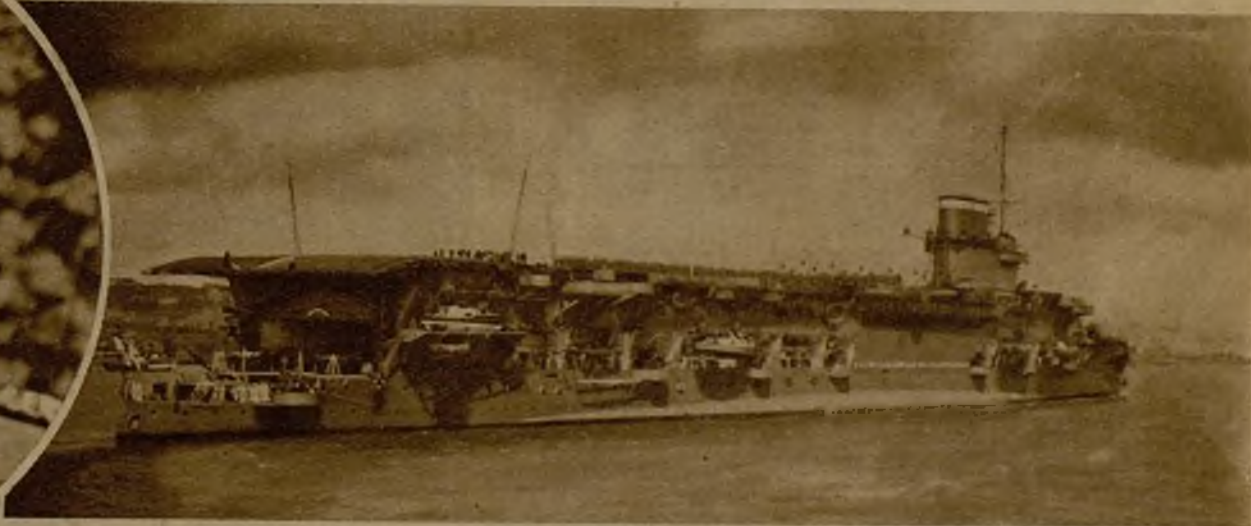
El magnífico buque portaaviones, de la Marina de guerra inglesa "Connaught", que ha realizado una visita al puerto de Lisboa, y a cuyo bordo se ha celebrado una brillante fiesta