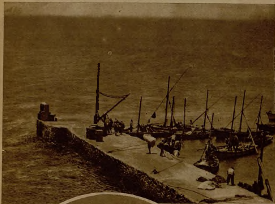
El muelle de Villa Cisneros, donde desembarcarán los deportados por delitos políticos que van a bordo del "Buenos Aires"