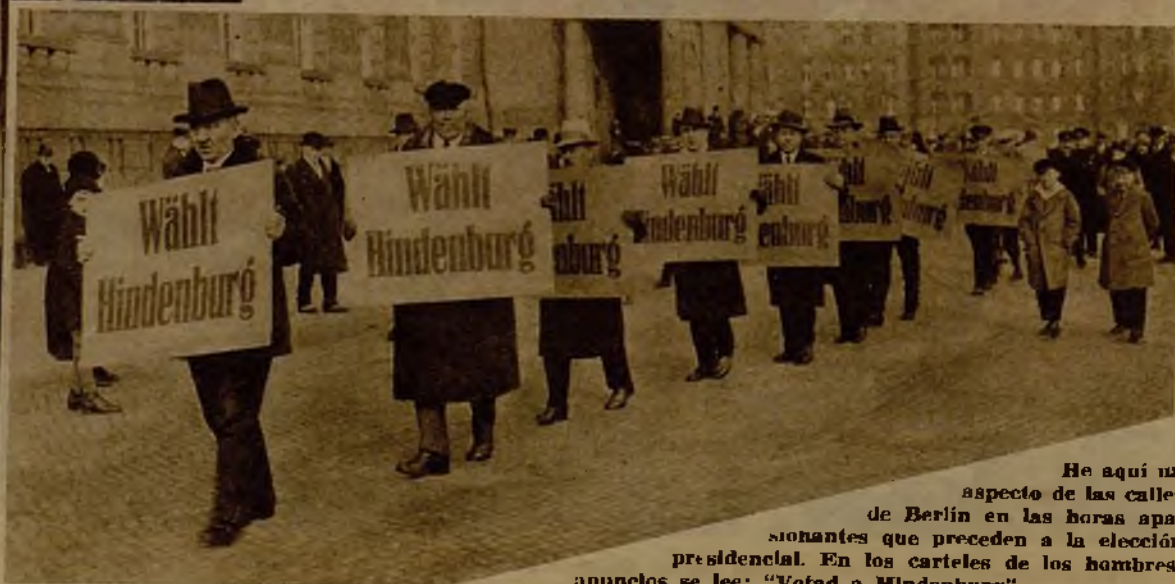
He aquí un aspecto de las calles de Berlín en las horas apasionantes que preceden a la elección presidencial. En los carteles de los hombres-anuncios se lee: "Votad a Hindenburg"