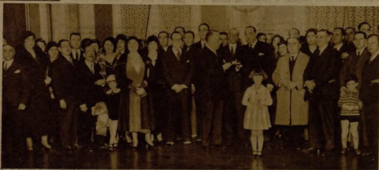
El acto de la entrega de ejemplares de la Constitución española por el embajador de la República en Lisboa a destacados miembros de nuestra colonia en la capital portuguesa