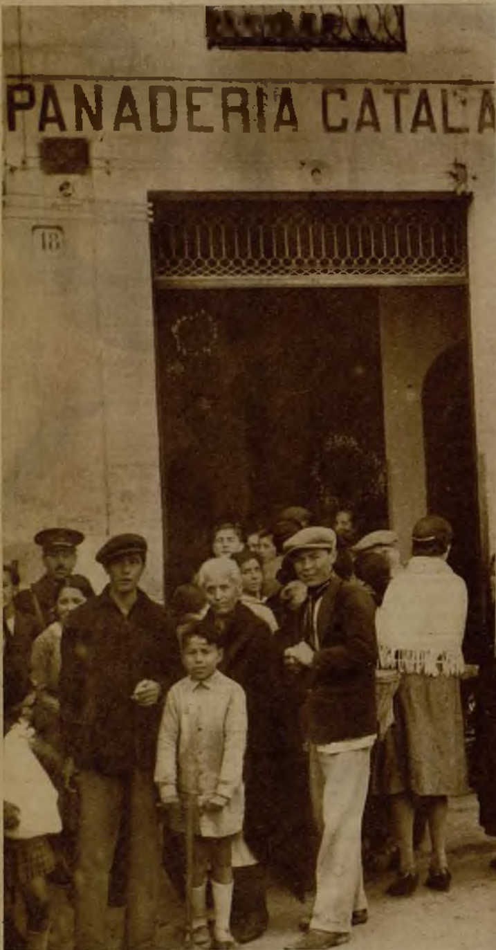
Grupo de vecinos a la puerta de una panadería, en espera de que se les sirva el pan fabricado por los soldados llegados de Sevilla