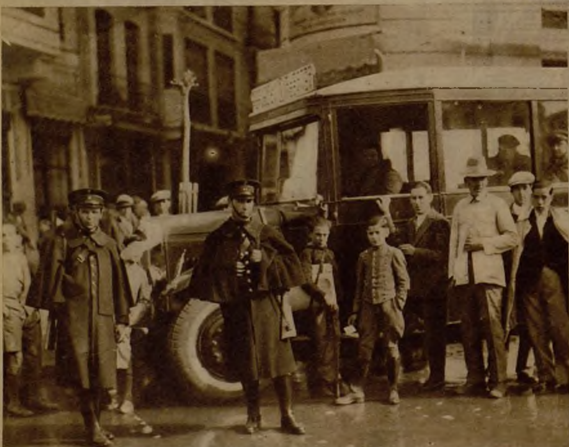
Fuerzas de Seguridad custodiando la salida de los camiones de viajeros de las líneas de la sierra y de las barridas de los alrededores