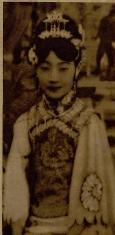
Proclamada la independencia de Manchuria, bajo el control político japonés, ha sido proclamado jefe del Estado el ex emperador Pu Yi, descendiente directo de la dinastía manchú. En la foto aparece la joven esposa de Pu Yi, de igual progenie