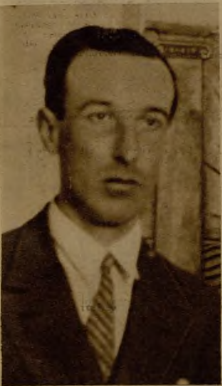
Gerardo Diego, autor de una notable antología poética, de figuras españolas contemporáneas