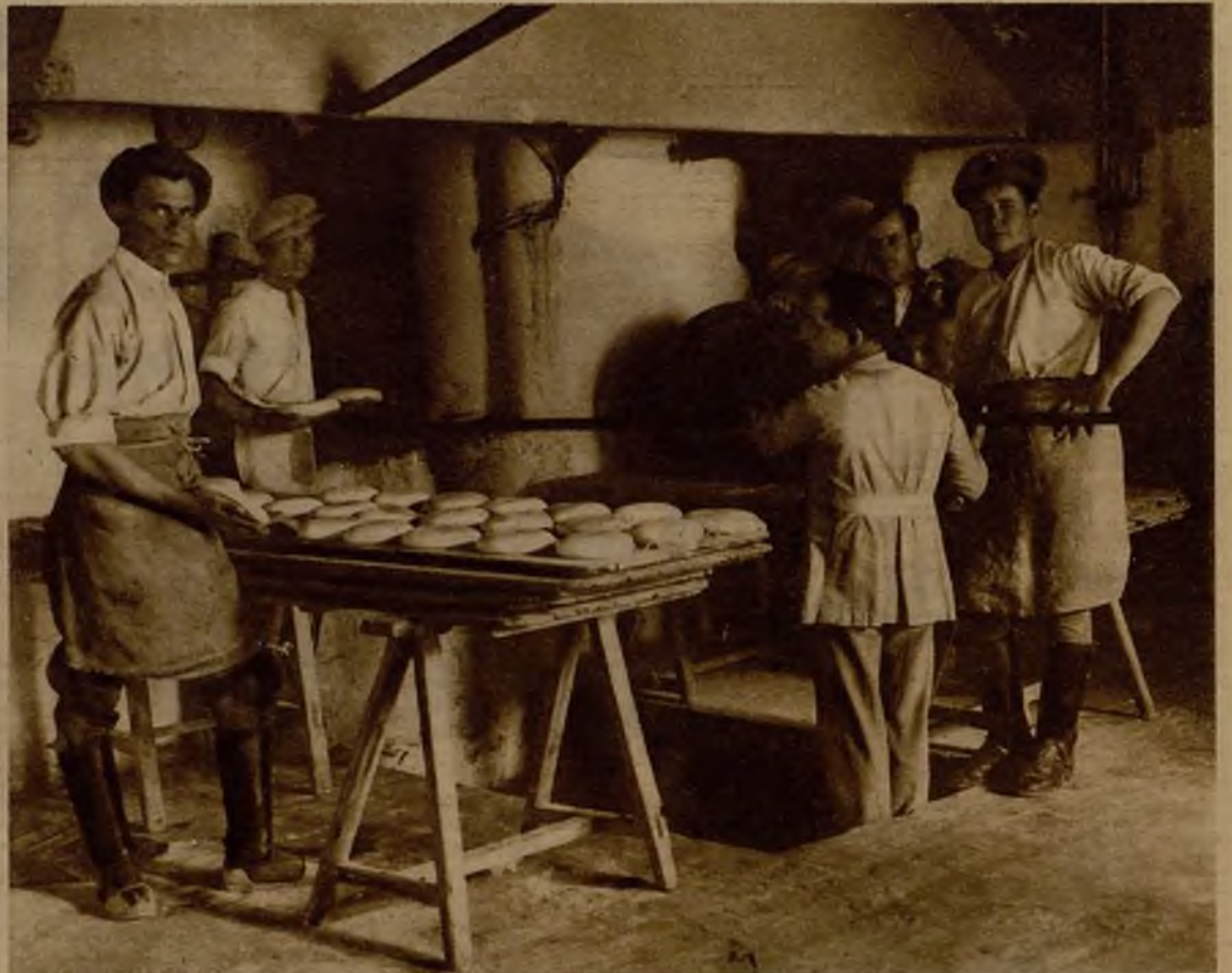
Los soldados de la guarnición de Sevilla, ocupados en la confección del pan para el abastecimiento público