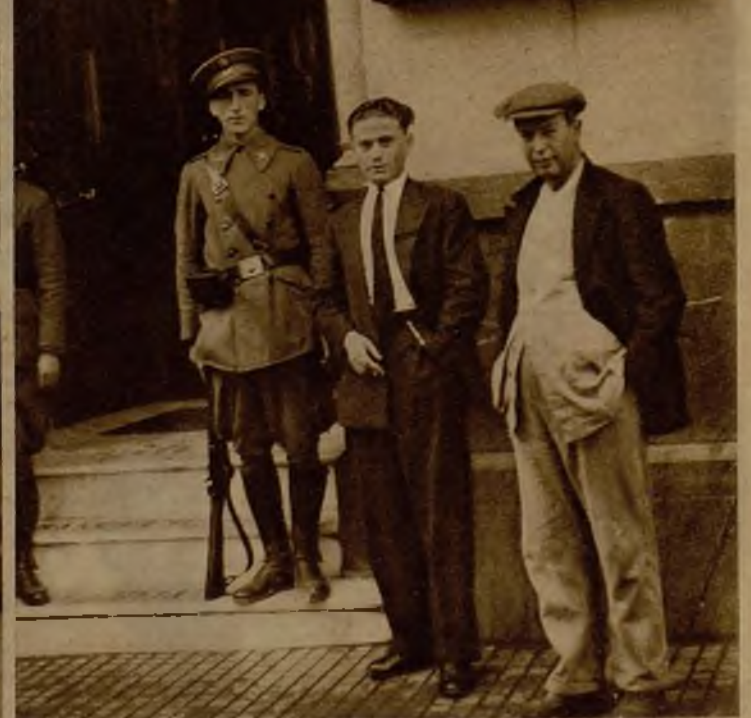
Con motivo de la huelga se han establecido retenes de vigilancia formados por soldados, en los establecimientos bancarios