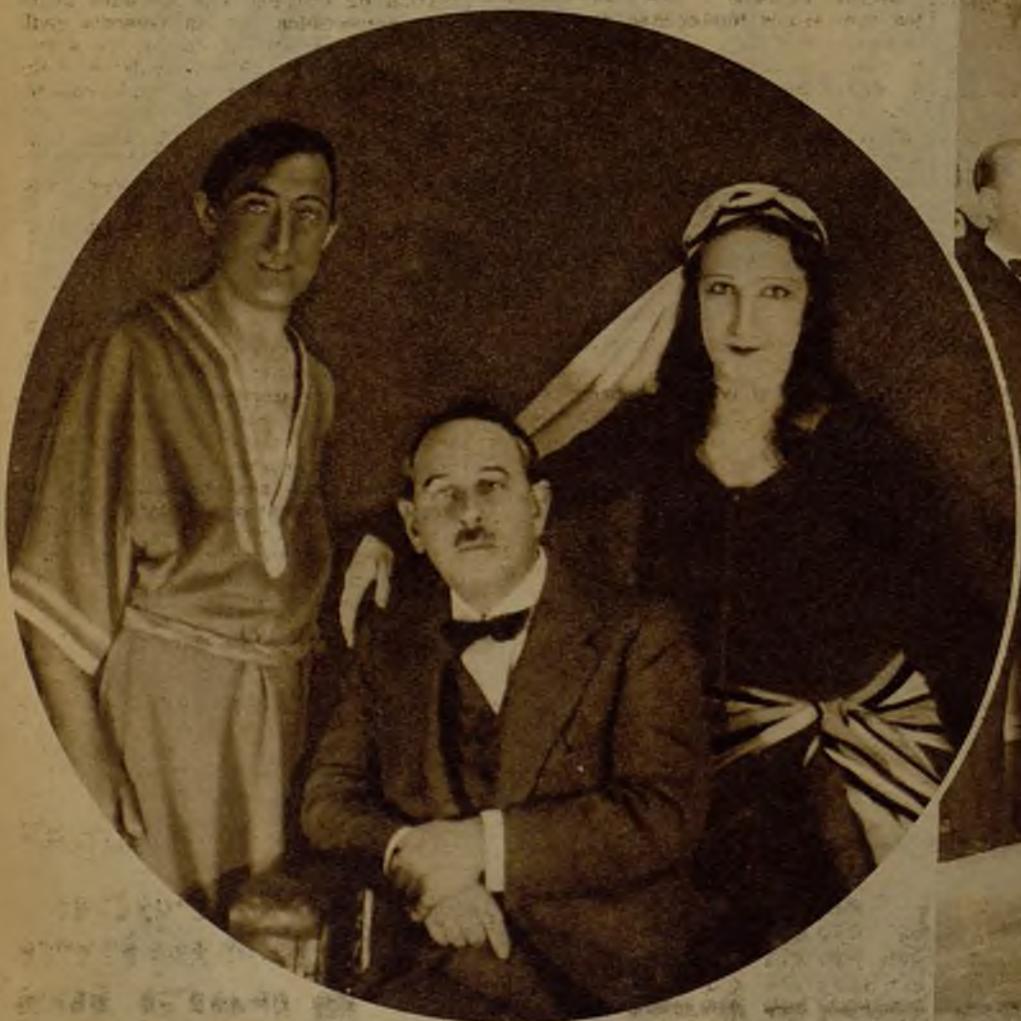
El ilustre Eduardo Marquina, autor de "Era una vez en Bagdad...", y sus notabilísimos intérpretes Irene López Heredia y Mariano Asquerlino, en cuyo honor se celebrará una fiesta artística el próximo sábado