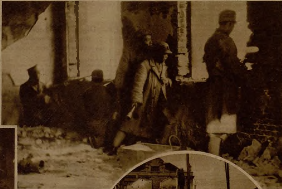
Falsanos chinos en armas contra los japoneses, arrojando bombas sobre las tropas invasoras desde el balcón de un edificio semiderruido del barrio de Chapei