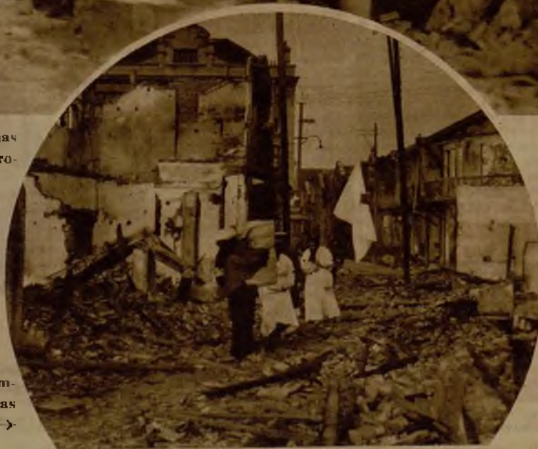
Vecinos del derruido barrio de Chapel, a los que prestan auxilio, en su completa miseria, las religiosas católicas