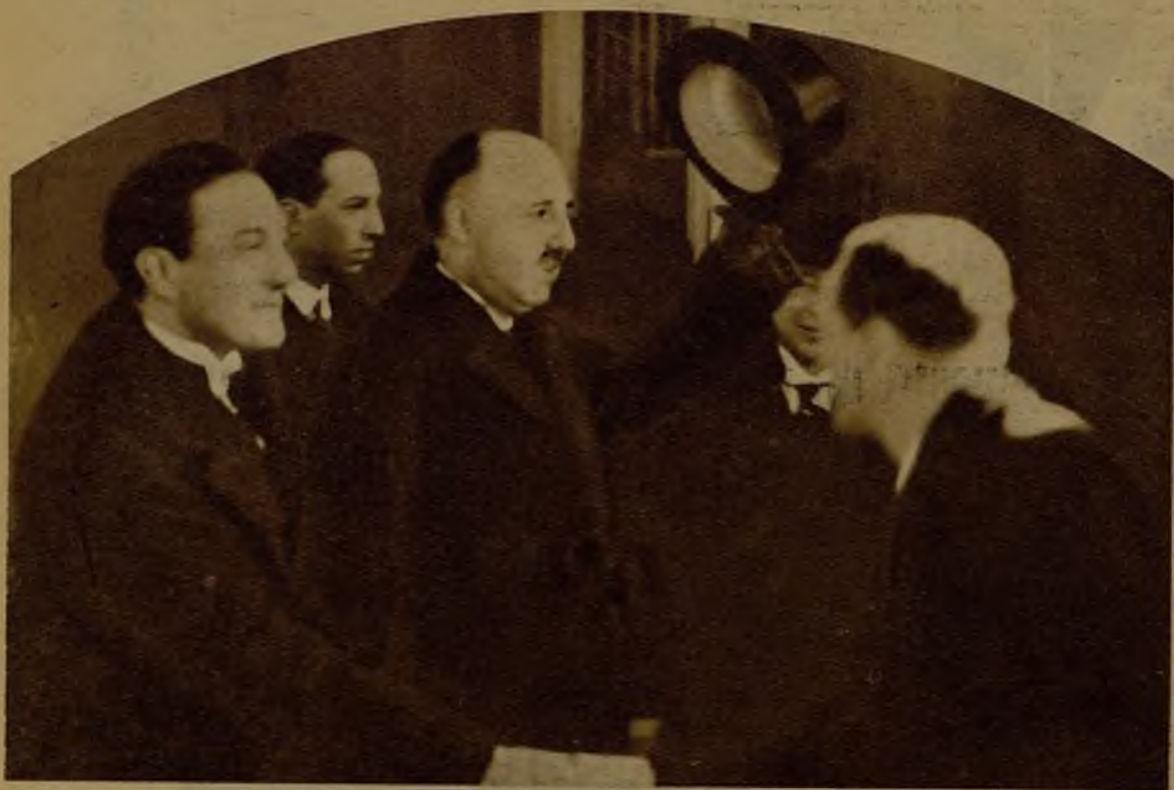
Don Francisco Agramonte y Cortijo, nuevo ministro de España en Praga, al salir de la presentación de sus cartas credenciales al presidente Masaryk