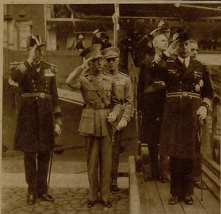
El presidente de la República portuguesa, acompañado del ministro de Marina y del embajador de Inglaterra de Lisboa, saludando los acordes del himno nacional británico, durante su visita al portaaviones "Corageous"