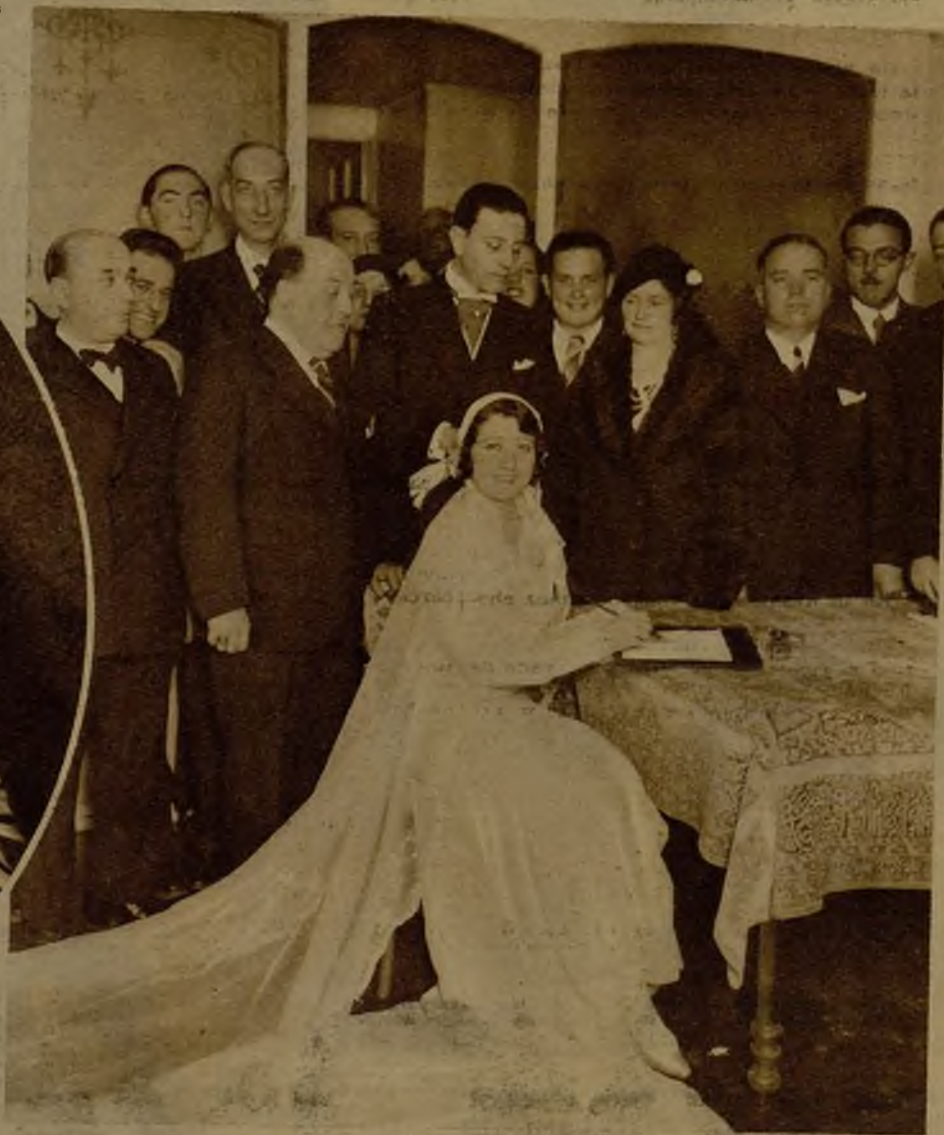
En La Coruña han contraído matrimonio los excelentes actores Isabelita Barrón y Ricardo Galache. La bellísima actriz, en el momento de suscribir el contrato matrimonial