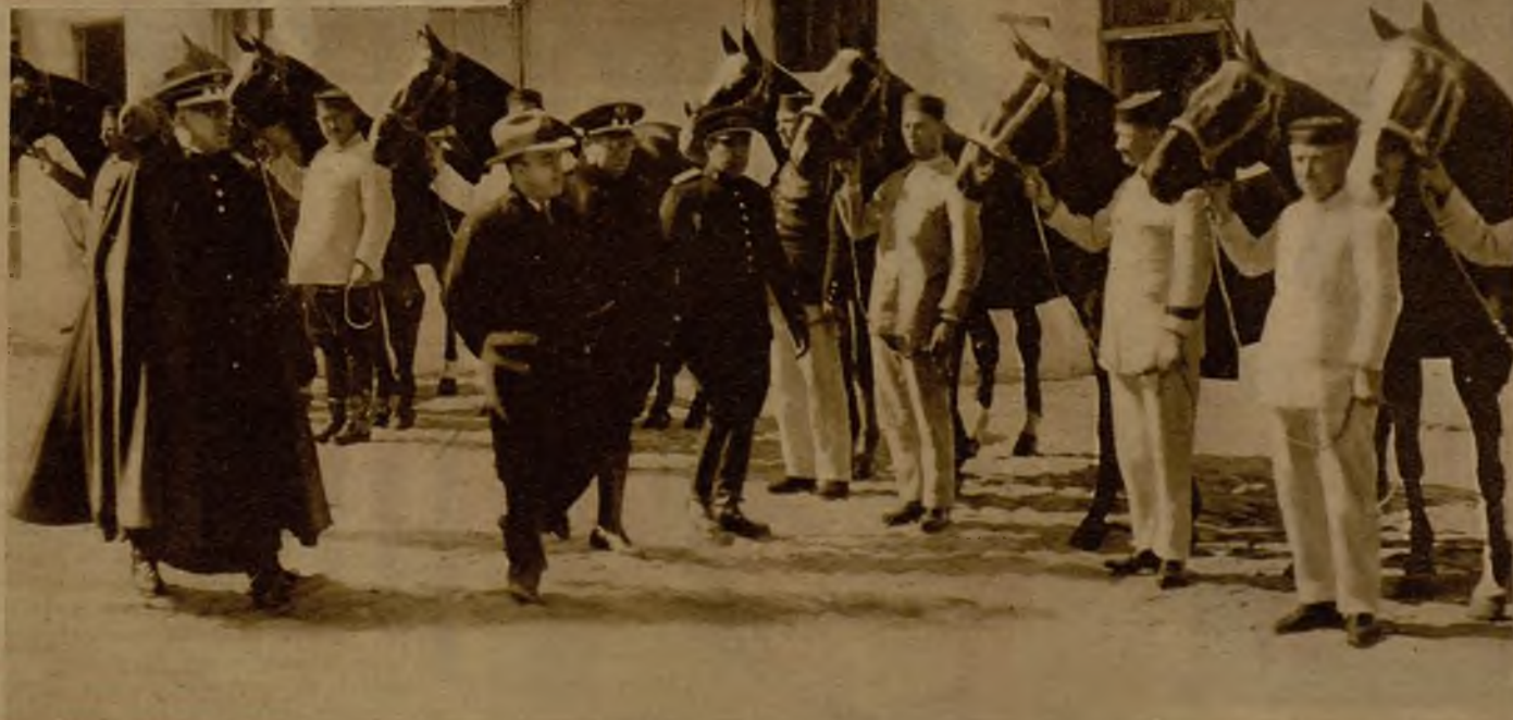
Un momento de la revista girada por el director general de Seguridad a las fuerzas de Orden público de Caballería

Militar por profesión desde hace cuarenta y dos años—termina diciendo el señor Bermúdez de Castro—, rompi la disciplina de mi deber para rebelarme contra la tiranía la noche llamada de San Juan, y que tan caro pagué. Hoy ocupo un cargo que representa autoridad, y creo suficiente para ejercerlo que los que me tienen que obedecer sepan que mis actos todos se basan en los para mí sagrados principios de Paz, Justicia y Libertad.