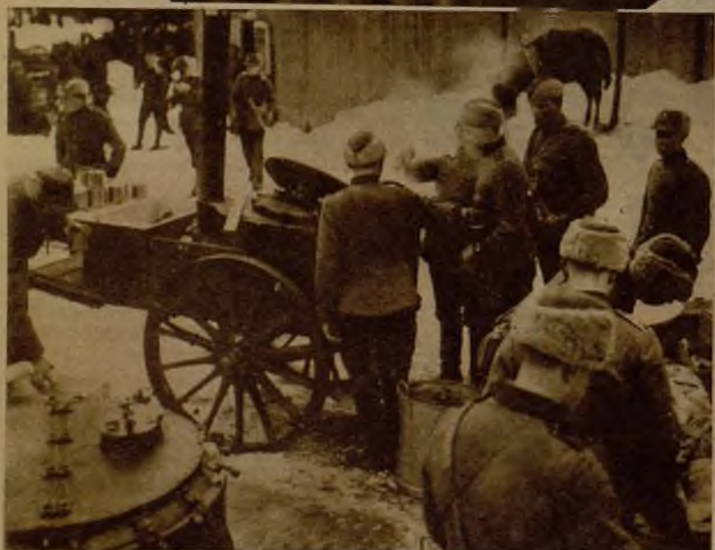
Fuerzas del Gobierno situadas en las afueras de la capital en espera del aviso de avanzar sobre la ciudad si el movimiento encontraba repercusión

El presidente de la República finlandesa reunido con varios ministros, al estallar el movimiento, para adoptar medidas de represión contra los revolucionarios, que intentaron adueñarse del Poder por un golpe de mano.