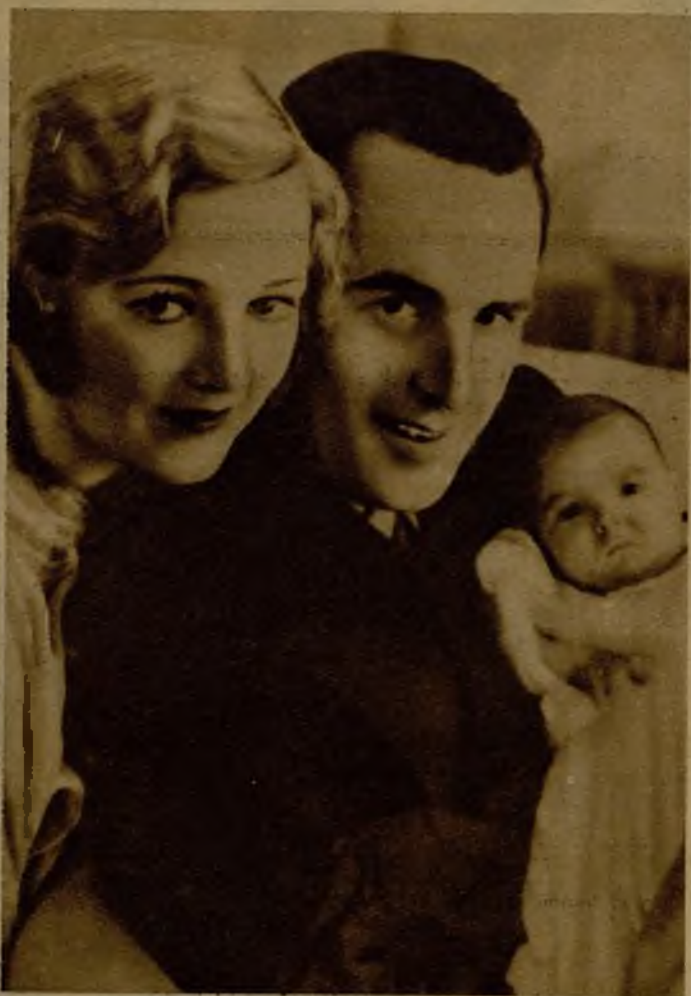
El gran actor de la pantalla Harold Lloyd, alarmado por el rapto del pequeño Lindbergh, ha encargado a dos detectives que custodien día y noche a su hijo, que con sus padres aparece en la fotografía