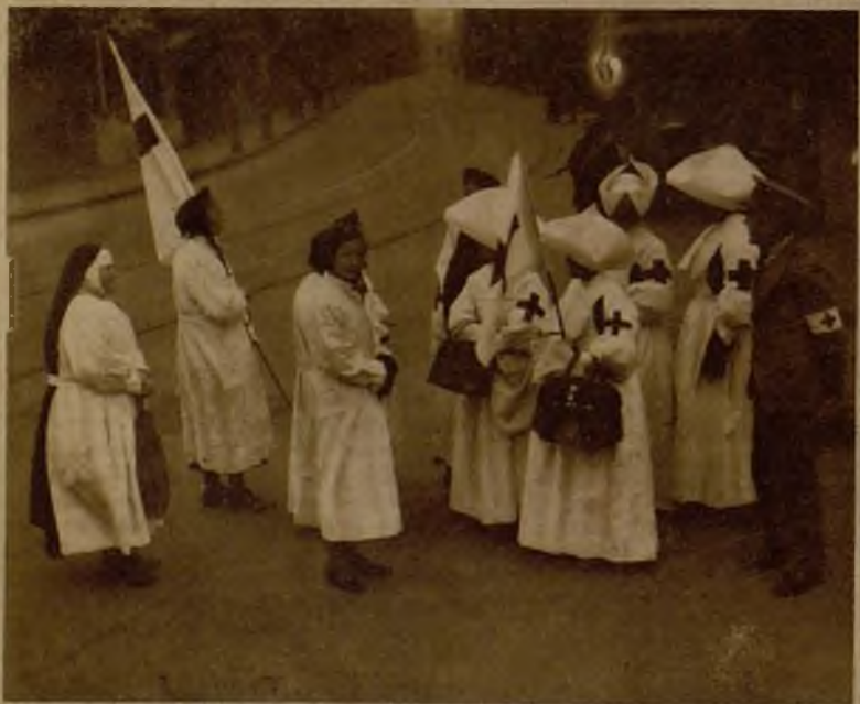
Religiosas católicas que ejercen una admirable labor en Shanghai, en socorro de los chinos no combatientes