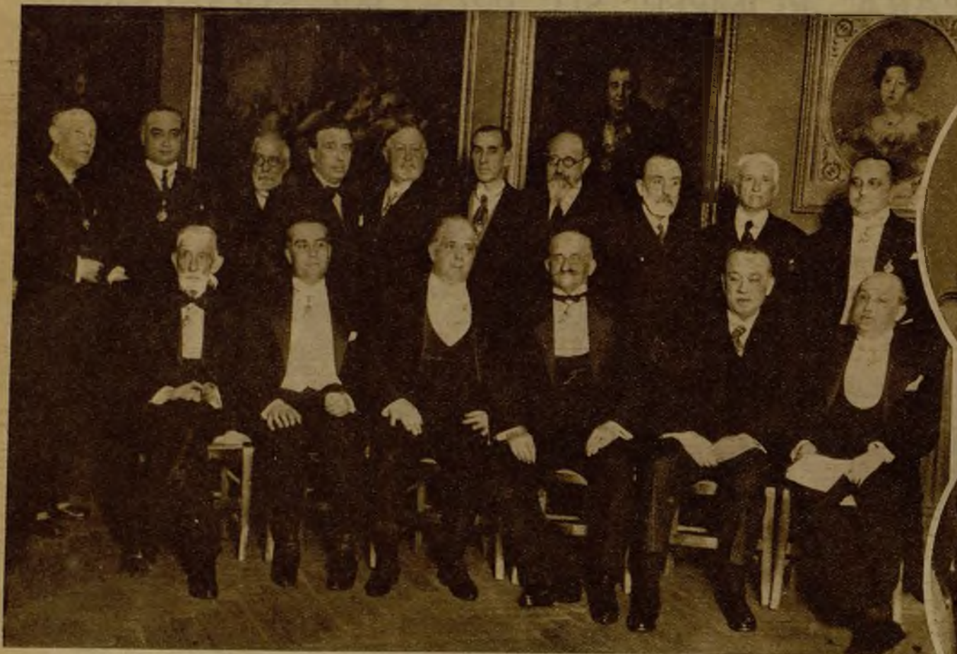
Miembros de la Academia de Bellas Artes con su presidente, el conde de Romanones, que asistieron a la recepción del nuevo académico, el ilustre arquitecto don Antonio Flórez