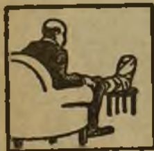
Gota - Dolores