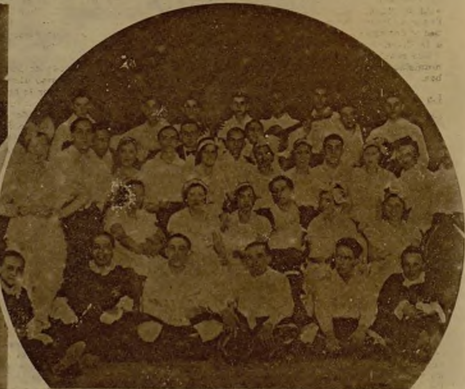
Estudiantes que bailaron el pericón argentino en la función celebrada en Vitoria a beneficio de los hijos del sereno Foronda, asesinado no hace mucho tiempo