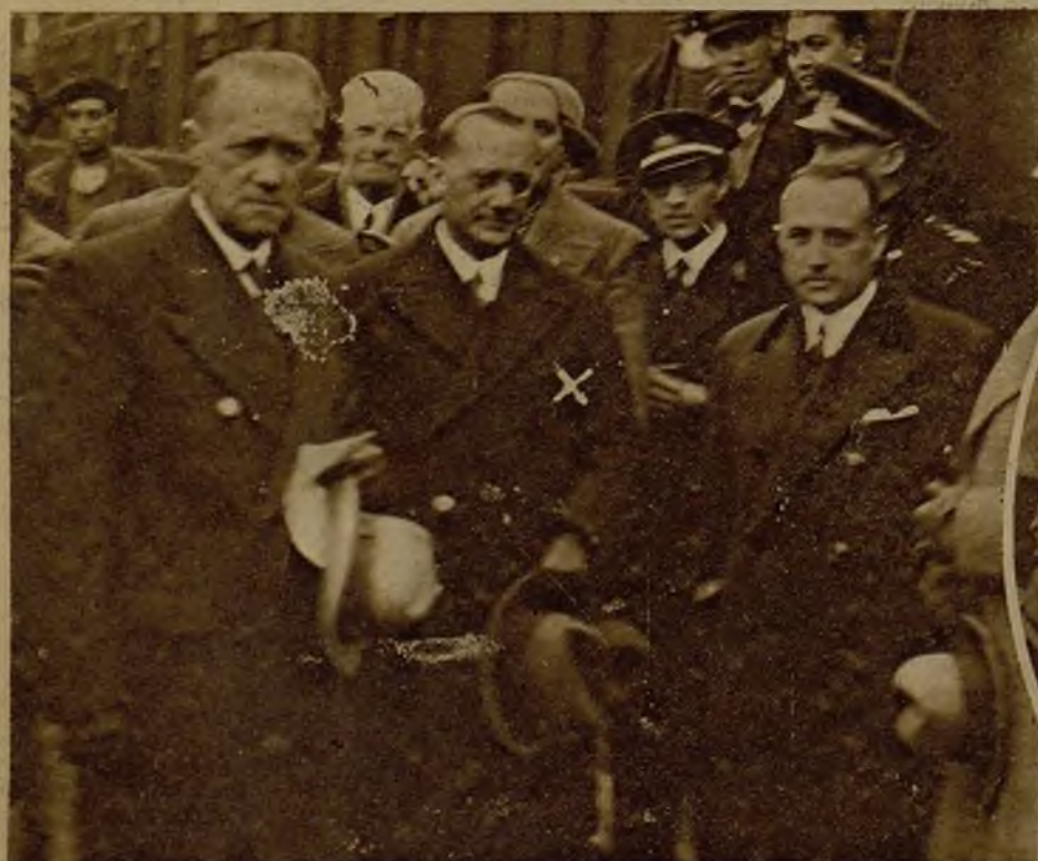
El ministro de Marina, señor Giral, a su llegada al Ferrol, rodeado por las autoridades, que salieron a recibirle a la estación