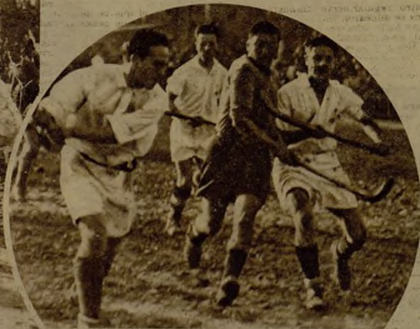
Los equipos de la Tronviana y del Valencia H. C. disputaron, sobre un terreno enfangado y difícil, un partido semifinal del campeonato de España de hockey, al que pertenecen estos episodios, en los que se evidencia el ardor puesta en la lucha por ambos equipos. El encuentro terminó con empate a cero