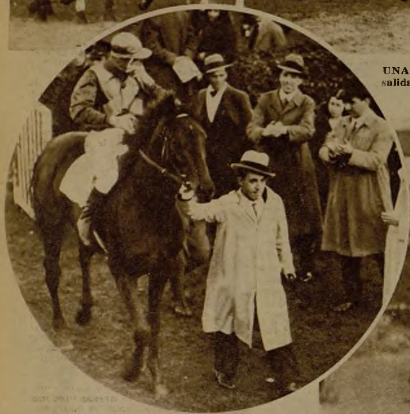
UNA ANIMADA REUNION DE CARRERAS EN EL HIPODROMO DE LA CASTELLANA.—La salida del Premio Sevilla. De derecha a izquierda: "The Winter Queen", "Chiquierdi", "Pagues", "Lydia", "Bean Monsieur", "Toisón d'Or" (ganador), "Solong II" y "Pourquoi Pas?"