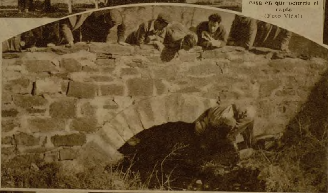
Policías del Estado de Nueva Jersey registrando los alrededores de la finca de los Lindbergh, en busca de alguna huella de los secuestradores