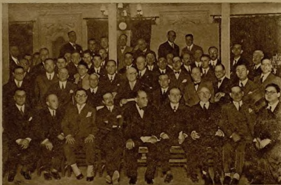
Médicos de beneficencias provinciales que asistieron a la apertura de la asamblea efectuada ayer en el local del Colegio de Médicos de Madrid