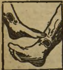
Males en las piernas