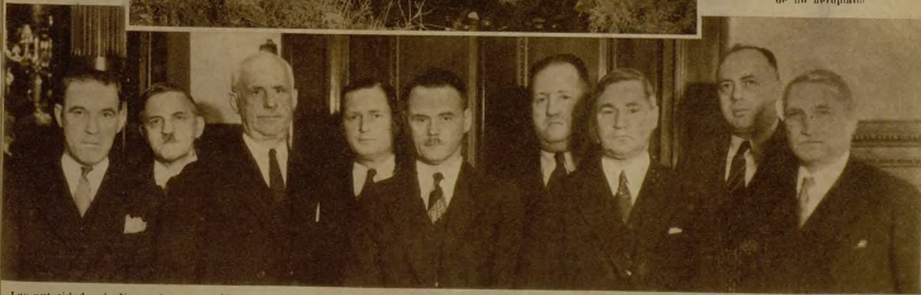
Las autoridades de Nueva Jersey reunidas para acordar medidas conducentes al descubrimiento del paradero del niño desaparecido y de los autores del rapto. Hasta hoy han sido inútiles reuniones y acuerdos...