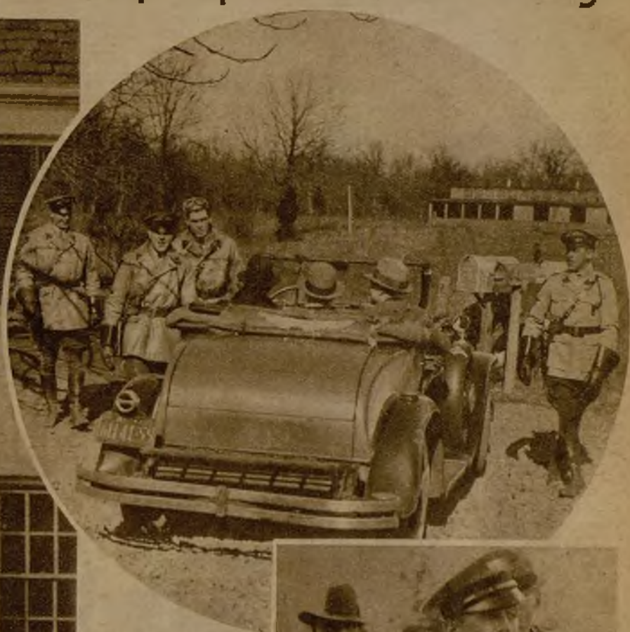
Policías del Estado de Nueva Jersey interrogando a los ocupantes de un automóvil procedente de Nueva York, a la entrada de la finca de los Lindbergh, en Hopewell. Esta medida se sigue con todas las personas que se acercan a la casa en que ocurrió el rapto