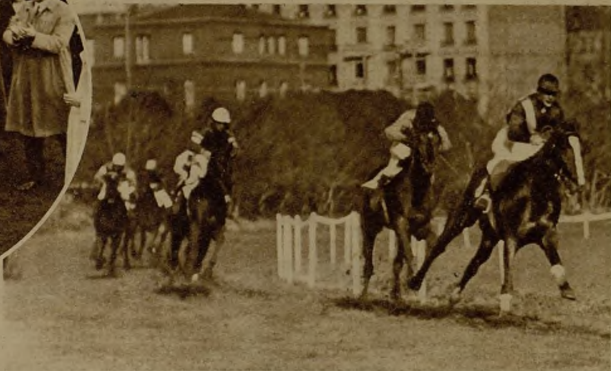
"Cordon Rouge", un hijo de "Rohan", que debutaba en los hipódromos, ganó en forma impresionante el Premio Lactea