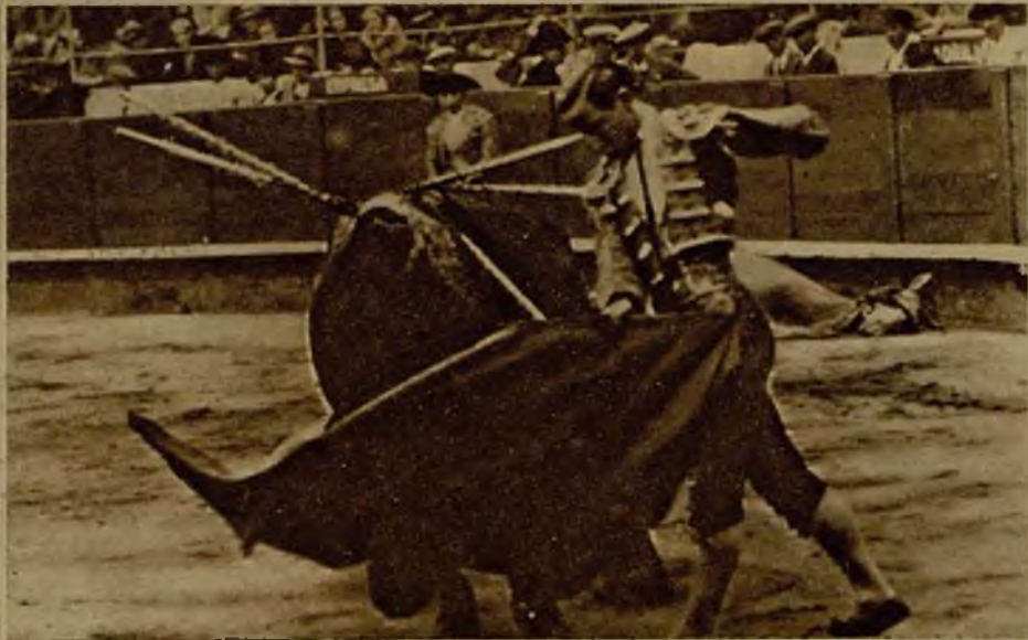
Vicente Barrera realizando una gran faena de muleta en la corrida celebrada el domingo en Barcelona