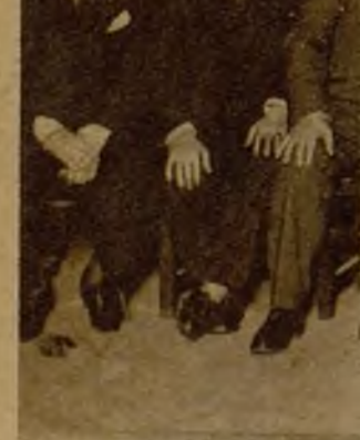
Concurrentes a la sesión inaugural de la Asamblea nacional de médicos de la Beneficencia provincial, celebrada en el Colegio profesional, con asistencia de una nutrida representación de la Federación de Colegios Médicos