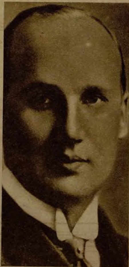
El conocido millonario sueco Yvay Kreuger, llamado en el mundo de los negocios "el rey de los fósforos", se ha suicidado en París, disparándose un tiro en la cabeza. Kreuger formaba parte principalísima de numerosas empresas, y era un trabajador incesante. A lo que parece, un ataque de neurastenia, efecto de su agobiante labor, le ha inducido a la trágica resolución