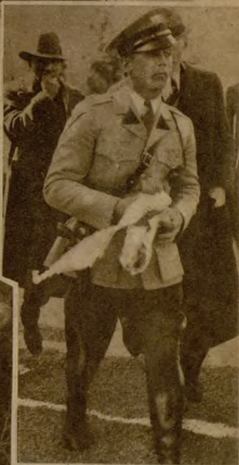
Un policía se apresura a llevar a casa de los padres un mensaje arrojado desde un aeroplano