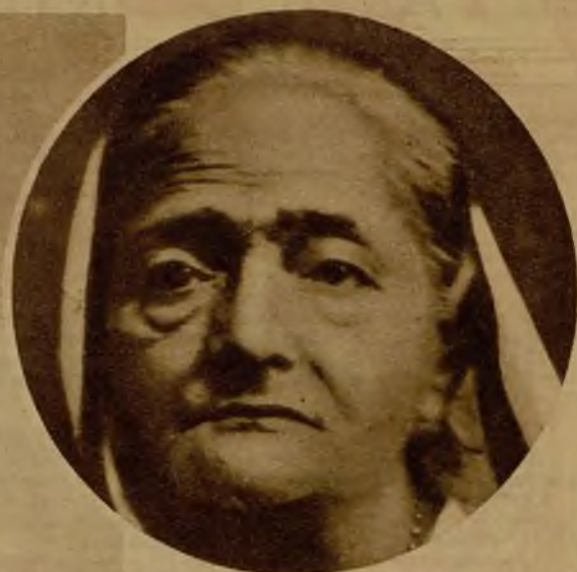
He aquí a la esposa del Mahatma Gandhi, que actualmente se encuentra bajo el peso de la ley inglesa. Había sido libertada hace muy pocos días por su intervención en la campaña antihitleriana, y ahora se la vuelve a detener por sus contactos peligrosos — para Inglaterra, naturalmente — con elementos panindios que preparaban una nueva campaña. Los Tribunales la han condenado a seis meses de trabajos forzados, y esta sanción ha producido gran efervescencia en la India