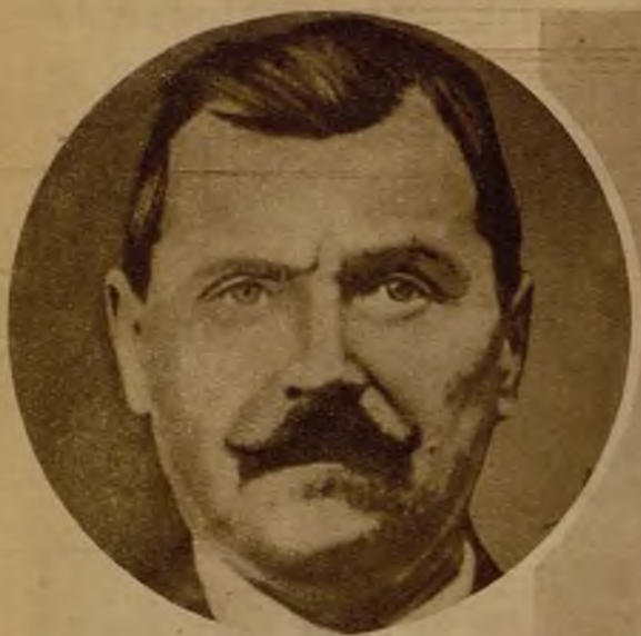
El tristemente célebre bandido austriaco Franz Leithgo, que al fin ha sido arrestado por la Policía. Es autor del asesinato de siete mujeres