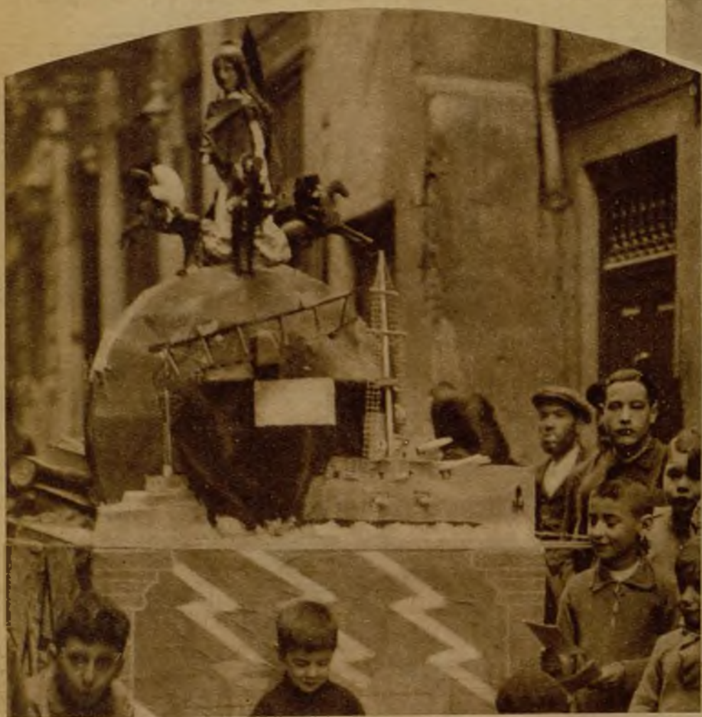
El chispeante humorismo de las famosas fallas valencianas está representado en ésta, que se exhibe en la calle de Gracia, con una "alegoría" del desarme internacional