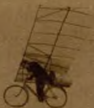
Este extraño aparato es el llamado "bicicleta volante", con el que en Berlín ha alcanzado el aviador Mase Wieden-hoff una velocidad de 167 kilómetros a la hora. Está impulsado por cohetes → (Foto Keystone)