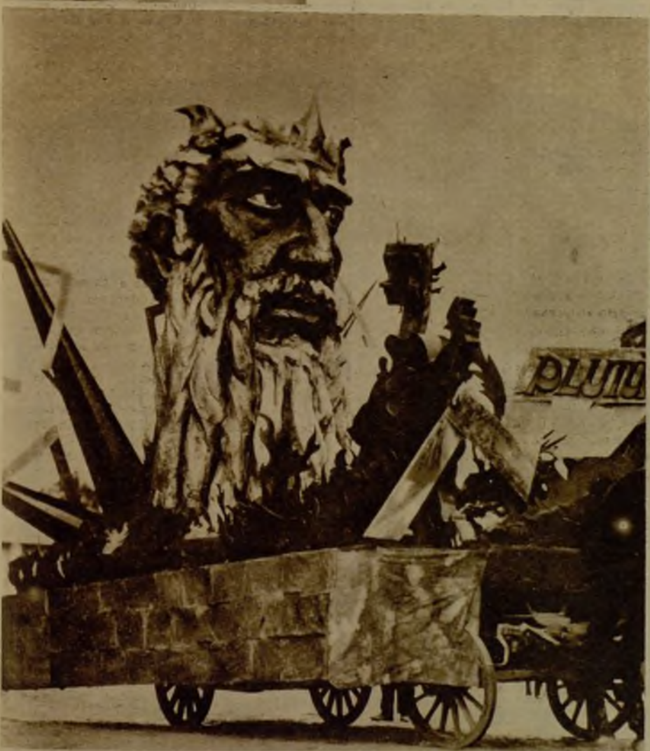
Este es el carro del dios Plutón, que ha figurado en la cabalgata triunfal celebrada ayer con motivo de las típicas fiestas falleras en Valencia