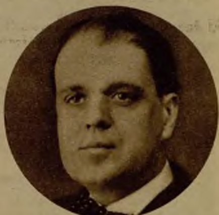
El escritor y periodista don Arturo Mori, que ha publicado la "Crónica de las Cortes constituyentes de la segunda República española"

La vasta cultura literaria y humanística del autor se advierte en mil pormenores, expresivos de una selecta formación intelectual, a la cual no permanece extraña ninguna sugestión de acento moderno.