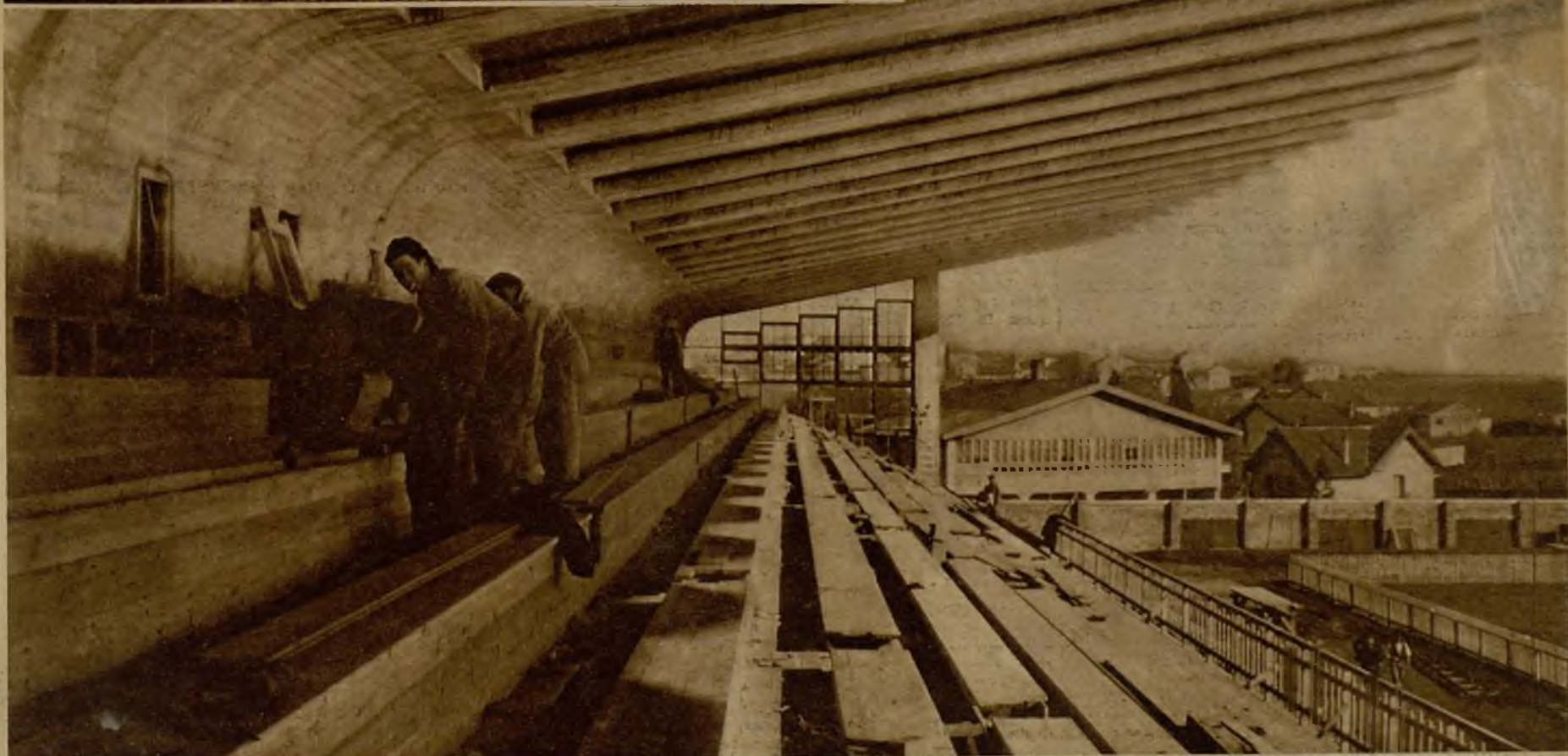
Un aspecto parcial de la tribuna de entrada general, y al fondo la columna donde será colocado el marcador