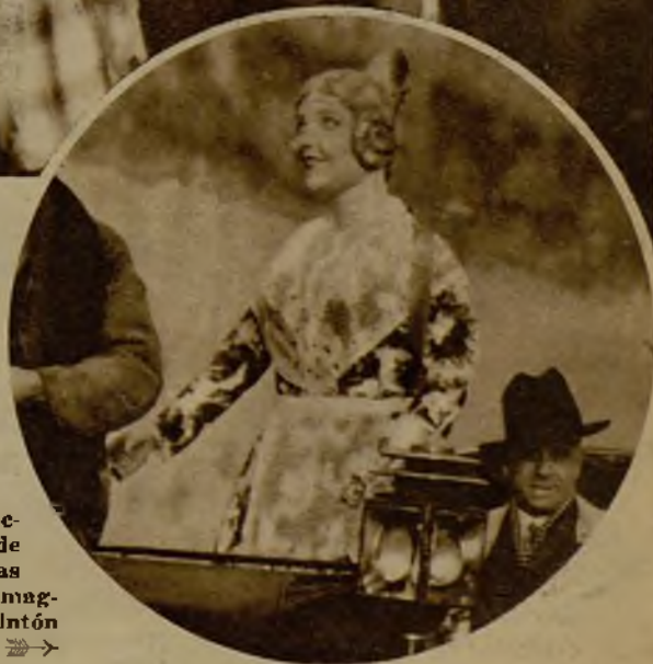
Esta bella huertana, reproduc- ción, no del todo completa, de muchas bellezas valencianas "que pestañean", figuró en la mag- nífica cabalgata del dios Plutón