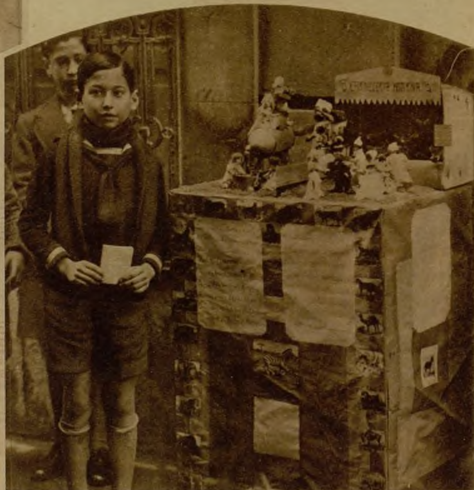
¿Recuerdan ustedes el matadero de burros descubierto hace poco en Valencia? Estos pequeños "escultores" también. Y aluden graciosamente al caso en esta falla infantil