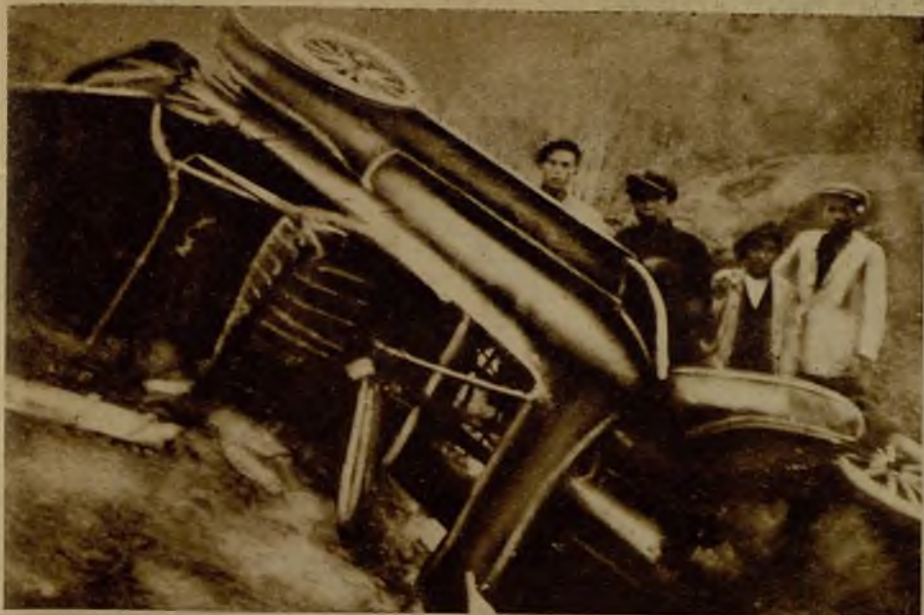
Estado en que quedó un auto- móvil que volcó cerca de Baena (Córdoba). Resultaron he- ridos de suma gravedad sus ocupantes