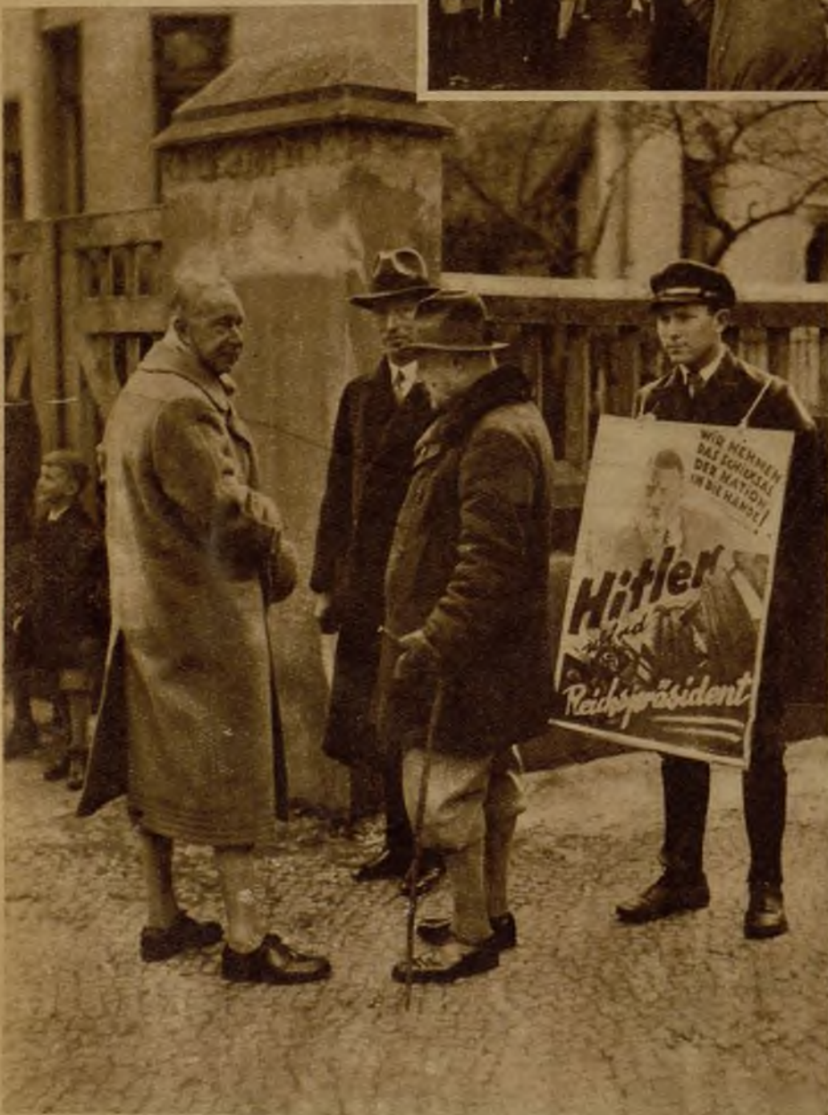
El ex kromprinz Guillermo, al salir de emitir su voto en un colegio electoral de Postdam, acompañado de caracterizados hitlerianos