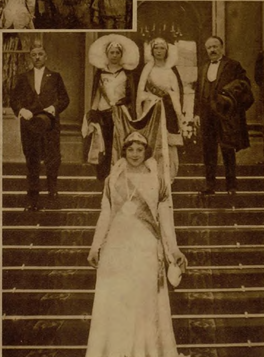
La reina de la belleza de París, que ha sido recibida por el presidente de la República, al salir del palacio del Eliseo, con sus damas de honor