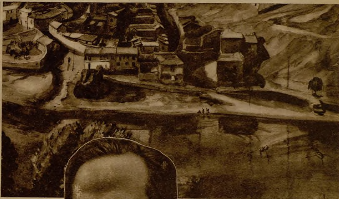
"El río", paisaje de Poppelreuter en su interesante Exposición. En el temperamento del notable pintor han prendido, por inclinación y por estudio, las lecciones de Alberto Durero. Poco a poco, a medida que se ha ido alejando del impresionismo, ha renacido en él el concepto alemán del paisaje

Muchos pintores extranjeros han cruzado por España rápidamente y no se han llevado en su equipaje artístico más que ramalazos de sol y pintoresquismo descriptivo, como el turista apresurado que sólo se lleva unas postales de toros y unas panderetas con madroños.