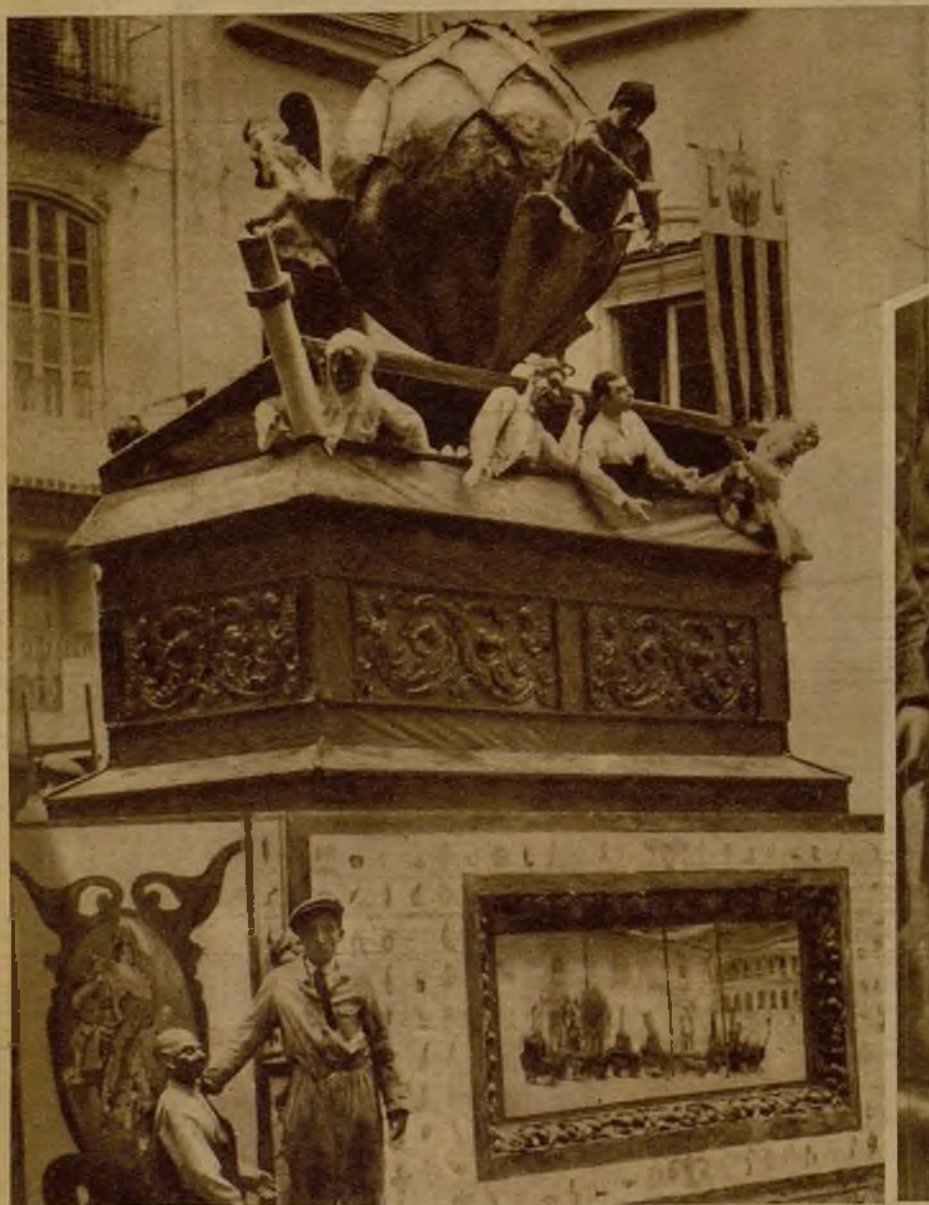
Un viejo episodio típico está reproducido en esta falla, colocada en la plaza de San Andrés, y que se titula: "Costumbres que desaparecen"