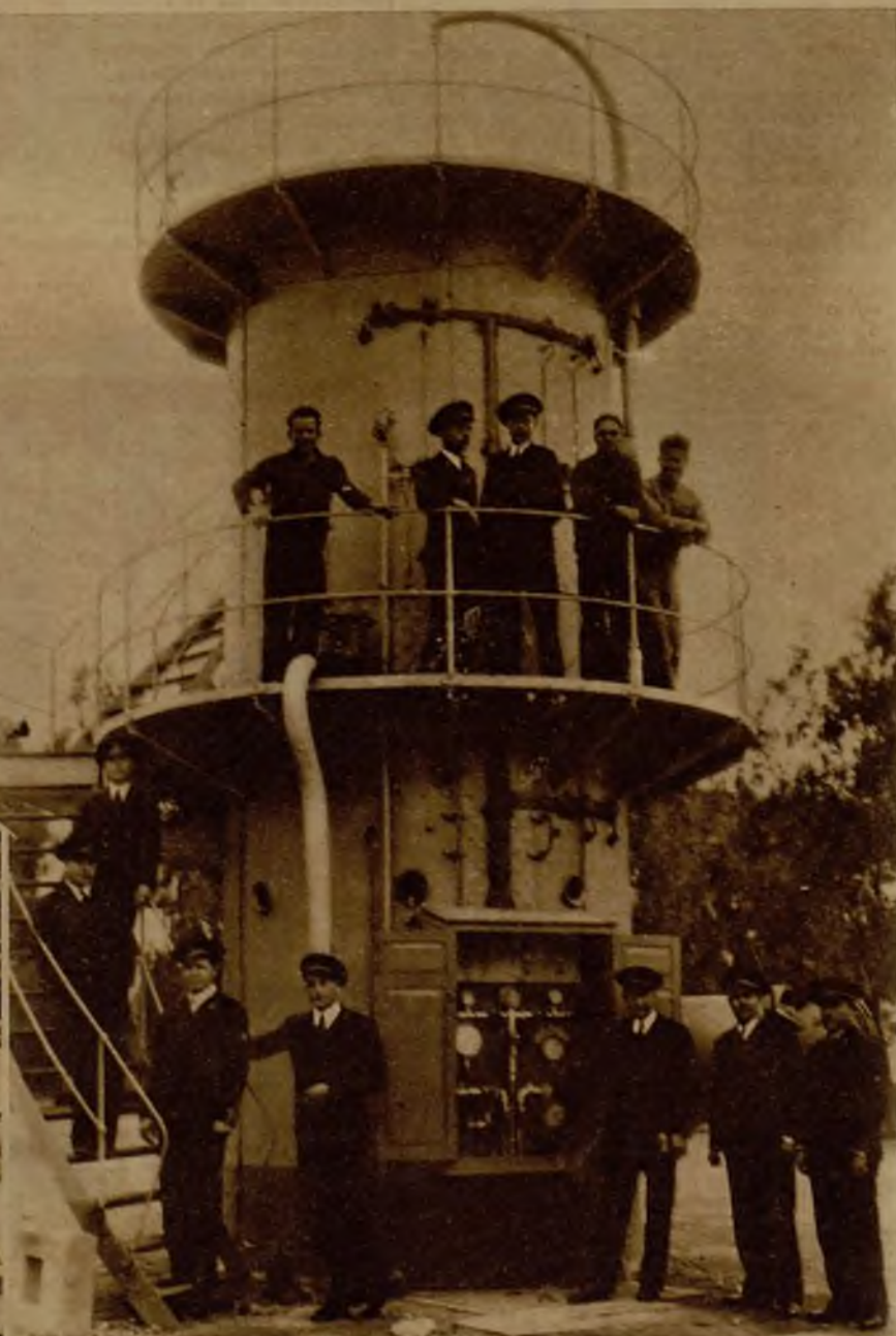
El nuevo tanque que usan los buzos de la Armada para sus experiencias, construido especialmente para lograr grandes profundidades