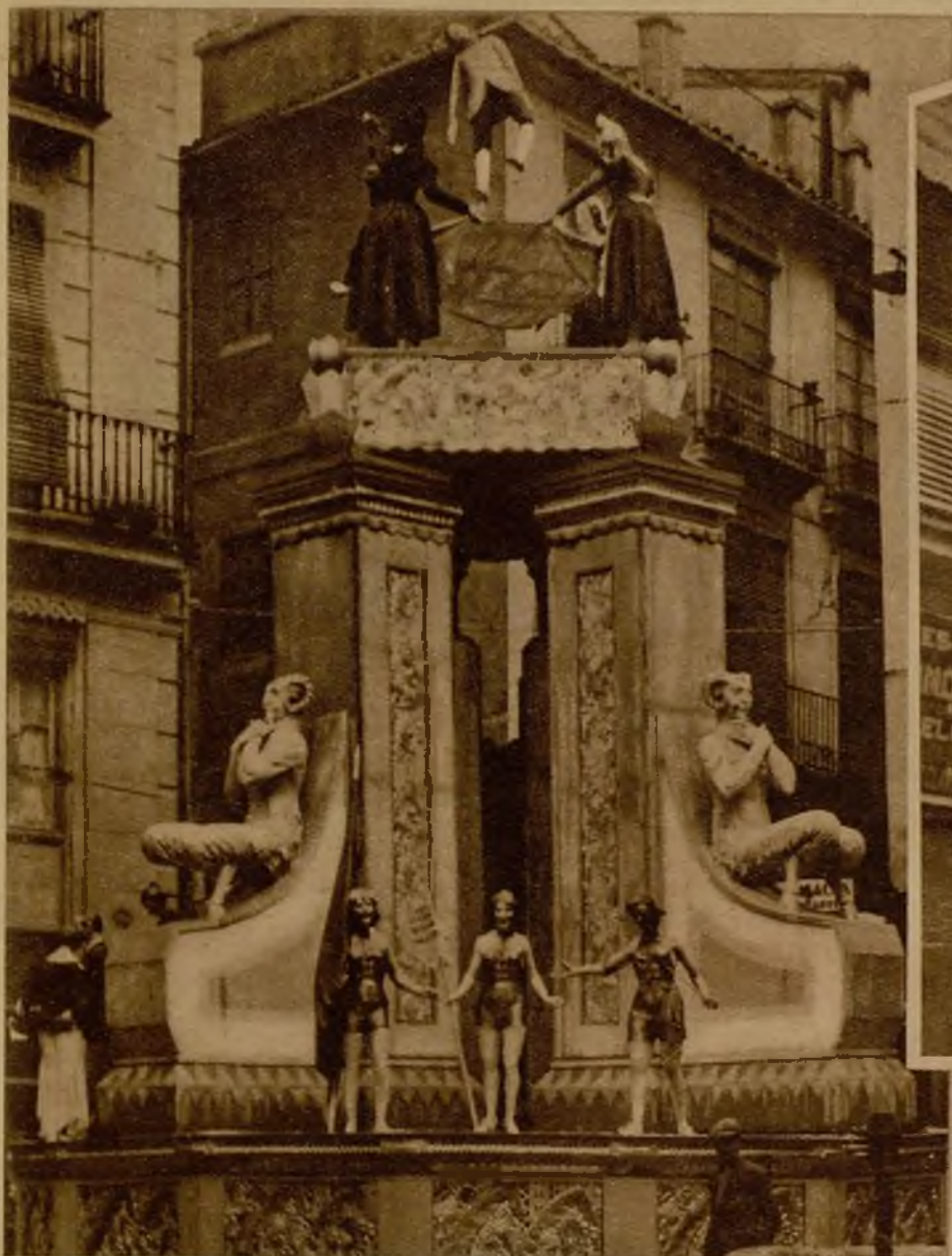
En esta magnífica falla, "sita" en la plaza de Cataluña, se simboliza "el triunfo del feminismo". Presume un futuro en el que el hombre será manteado por las mujeres... como hasta aquí...