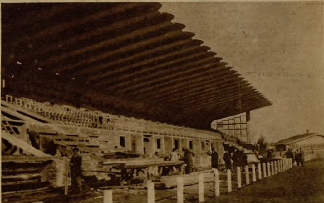
Un detalle de la magnífica tribuna del Stadium

En la planta baja de la tribuna van instalados los cuartos de los jugadores y del árbitro, todo con sus correspondientes lavabos, cuartos de baño, de duchas, de agua fría y caliente; la cantina, el almacén, lavabos y servicios para el público. Los jugadores y el árbitro