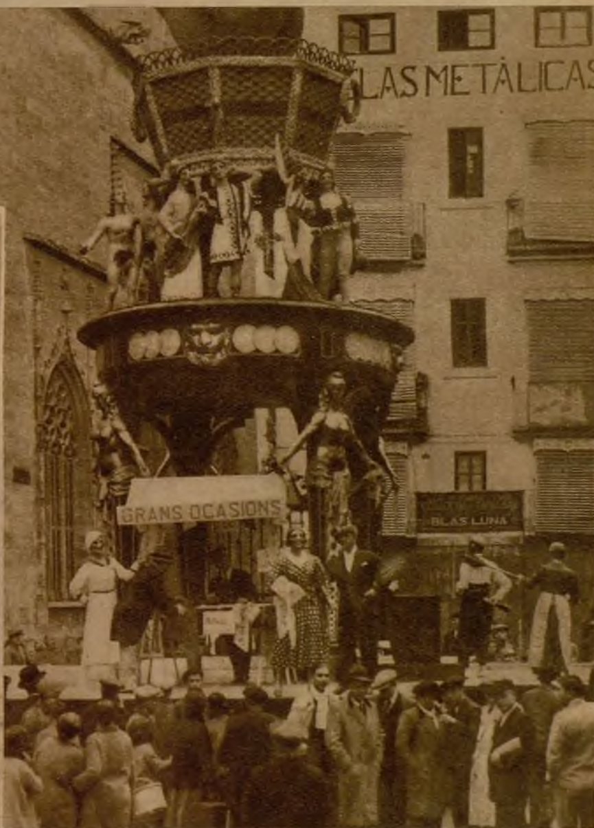
En la plaza de Collado figura este pronóstico para un futuro próximo: "El divorcio y sus consecuencias en España". Se ofrecen "grandes ocasiones."