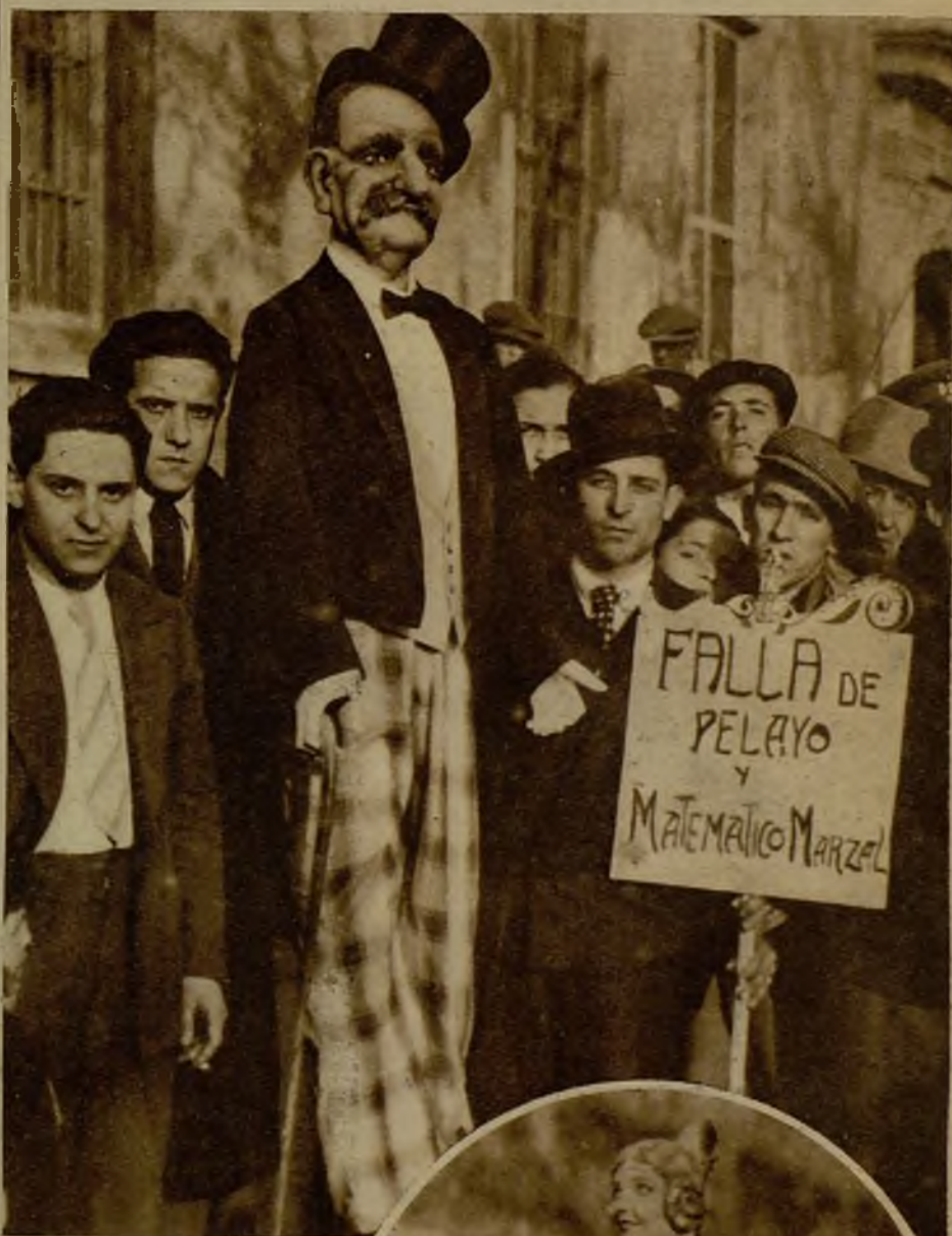
Los falleros valencianos han querido gastar una pequeña broma al conde de Romanos. Don Alvaro, graciosamente reproducido, no tendrá el menor reparo, ya que de buen humor se hace, en ser quemado en effigie, entre el redoble de truenos apo- calípticos