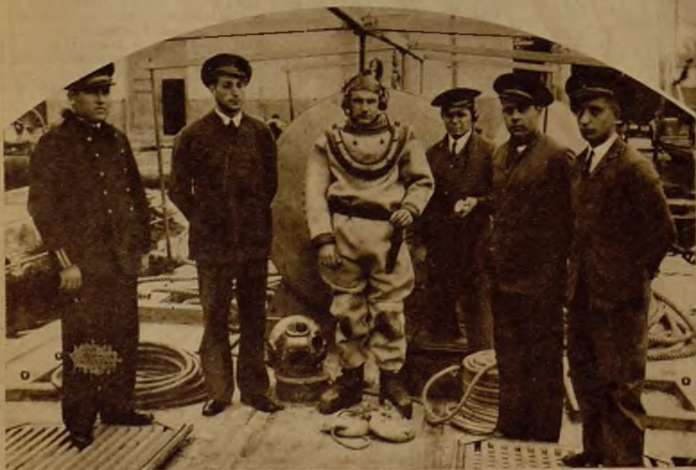
El victorioso "recordman", con los ayudantes que le auxiliaron en el intento

Es digna de todo encomio la hazaña del profesor Rendón, que puso en riesgo su vida en el logro del empeño.