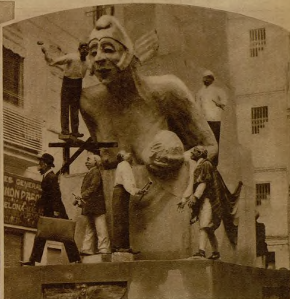
La proclamación de la República y una representación irónica de sus episodios figura en la plaza de San Gil. "¡Hay que hacer un monumento, que perpetúe un momento...!"