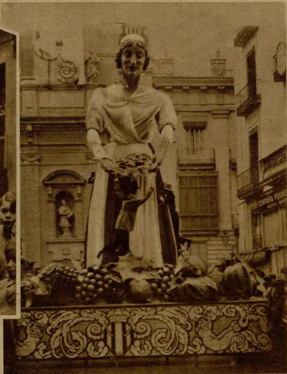
Artística falla, en la que la Huerta ofrece sus espléndidos frutos. Está instalada en la plaza de San Vicente Ferrer, y lleva el lema: "Es Valencia tan pródiga, que da para todos"