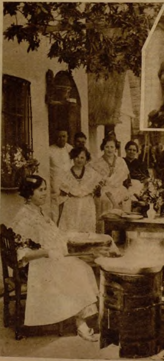
Una típica bunolera, de artística composición, servida por bellas valencianas