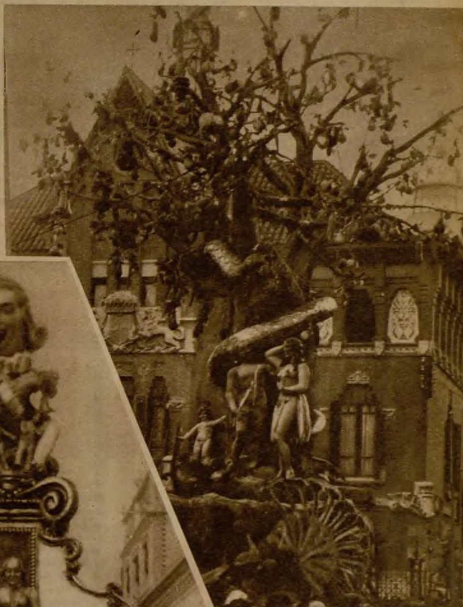
Esta falla, colocada en el puerto, es toda un bello paraíso, y se llama "Un plat de gloria"