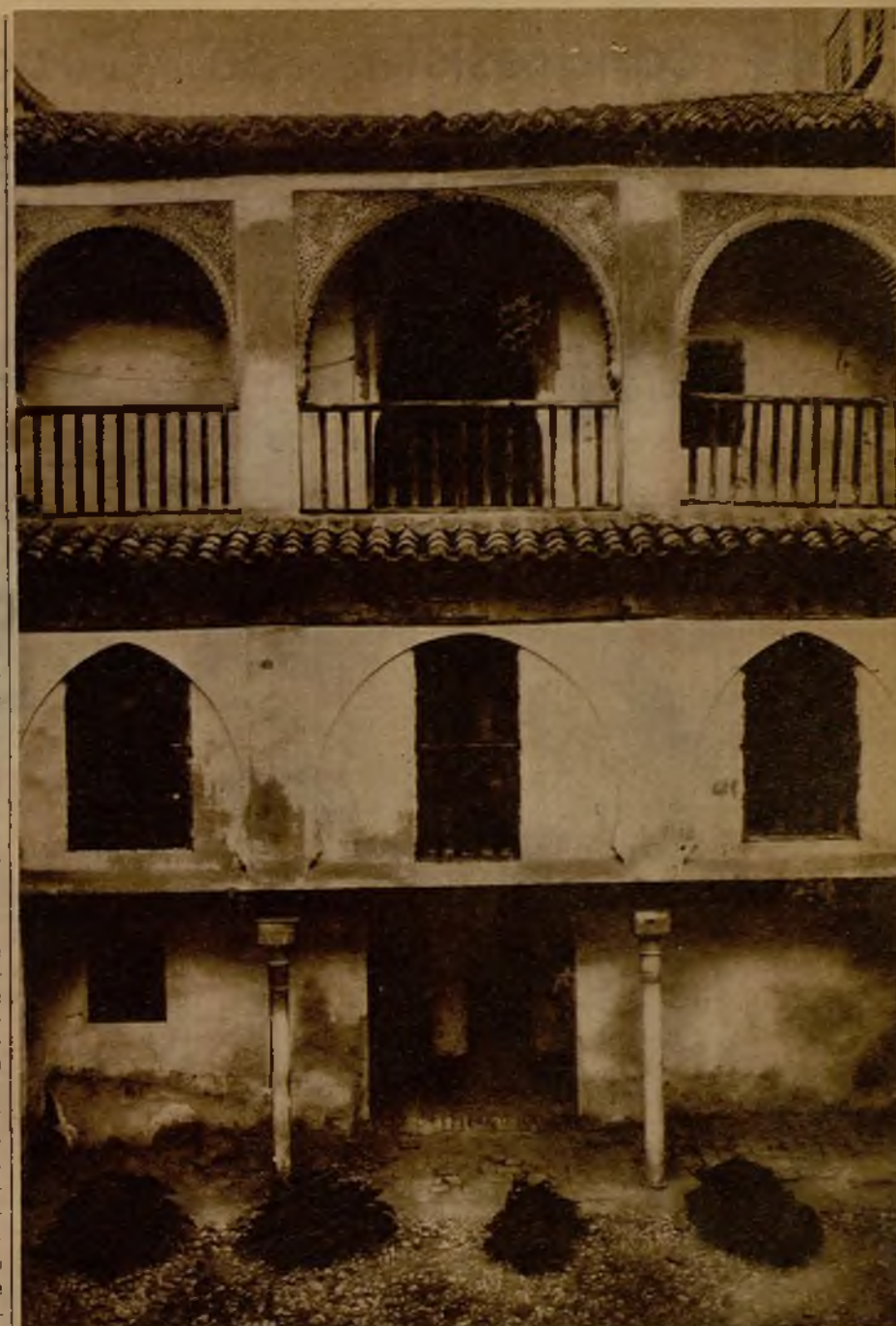
El patio de la Casa del Chapiz, que será el centro de la nueva cultura musulmana

que venían los moros. En vista del enorme éxito de estos trabajos, el director de Bellas Artes hacia 1926, conde de las Infantas, dispuso que el dinero recaudado por las entradas a la Alhambra se emplease en adquirir edificios de Granada amenazados por la piqueta municipal, para consolidarlos y limpiarlos, devolviéndoles su carácter. Así se compraron varios edificios en el barrio del Albaicín: una casa de baños árabes, un harén marroquí que estaba medido en un convento, una posada de mercaderes, una casa rica de un morisco