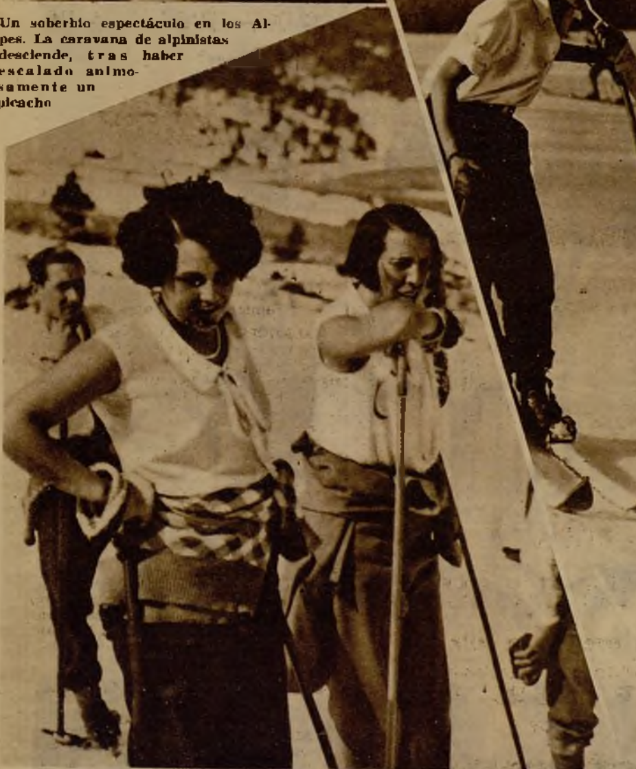
Dos bellas deportistas alpinas reposan un momento ante el objetivo curioso. En el centro: unas fumadas al cigarrillo, que resultan sabrosas tras el ardoroso ejercicio