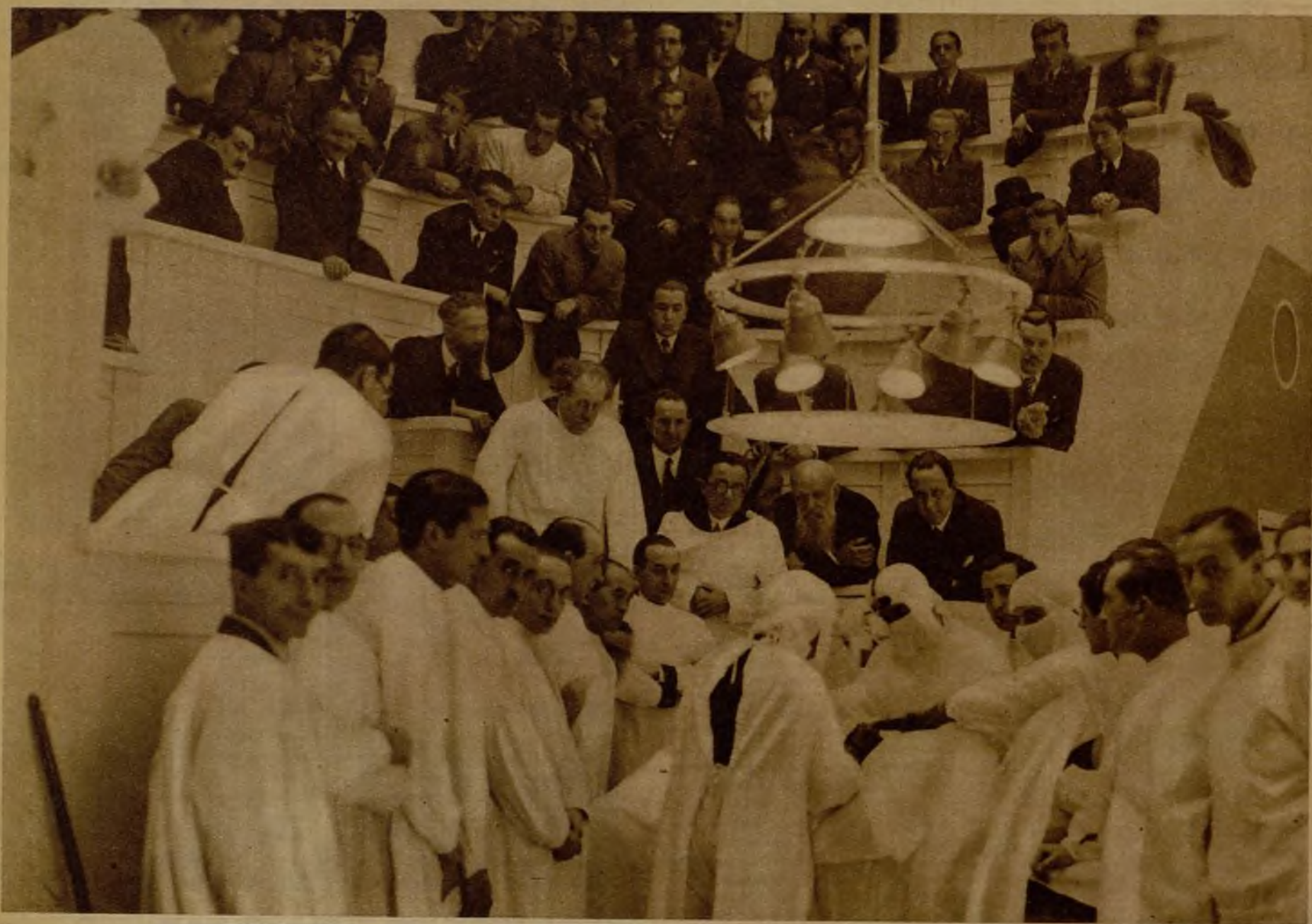
El doctor Cardenal durante una operación quirúrgica en el Hospital Clínico, realizada a presencia de miembros del Congreso Internacional de Cirugía