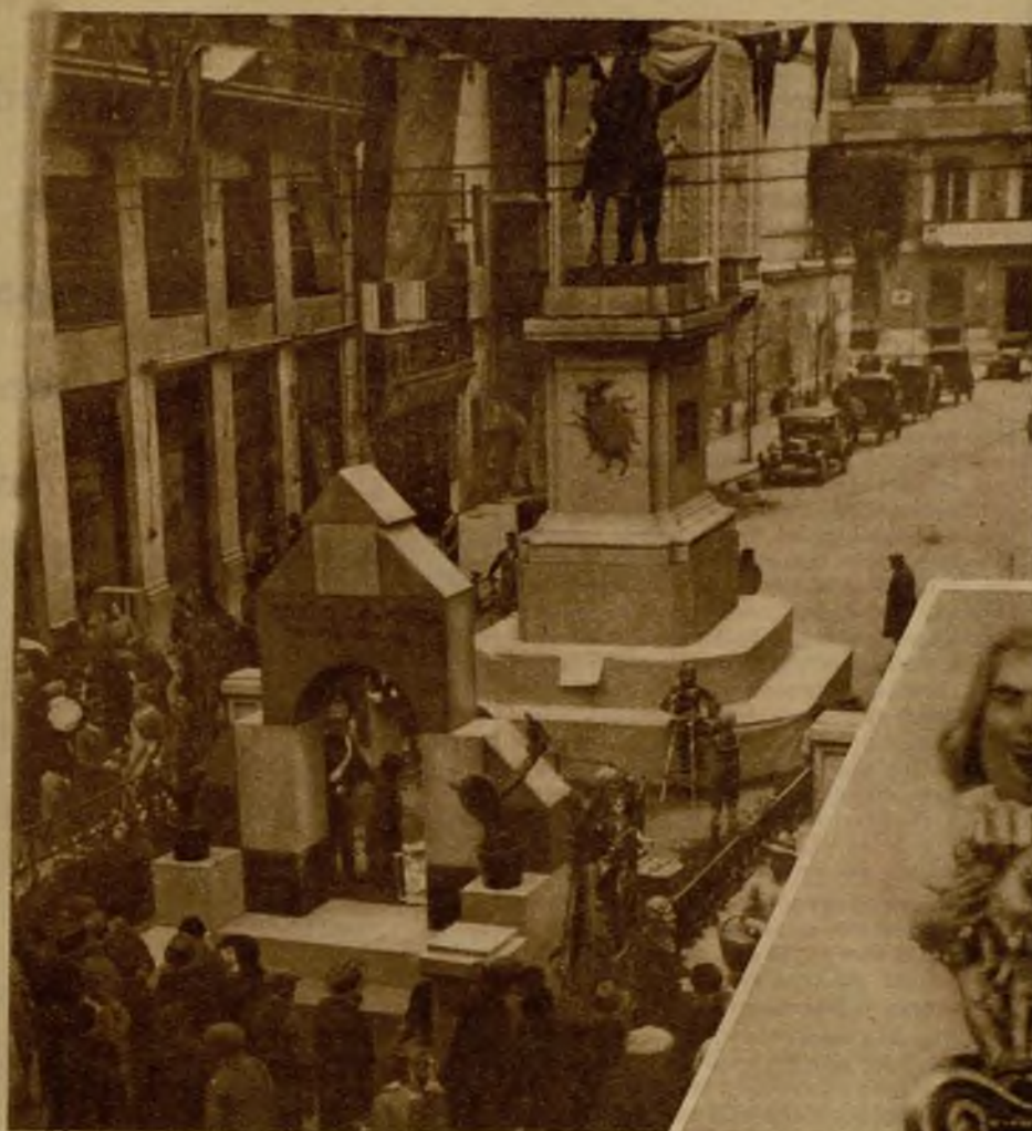
Esta representación del Tribunal Tutelar de Menores, que es la falla instalada en la calle de la Paz, ha obtenido el quinto premio del concurso