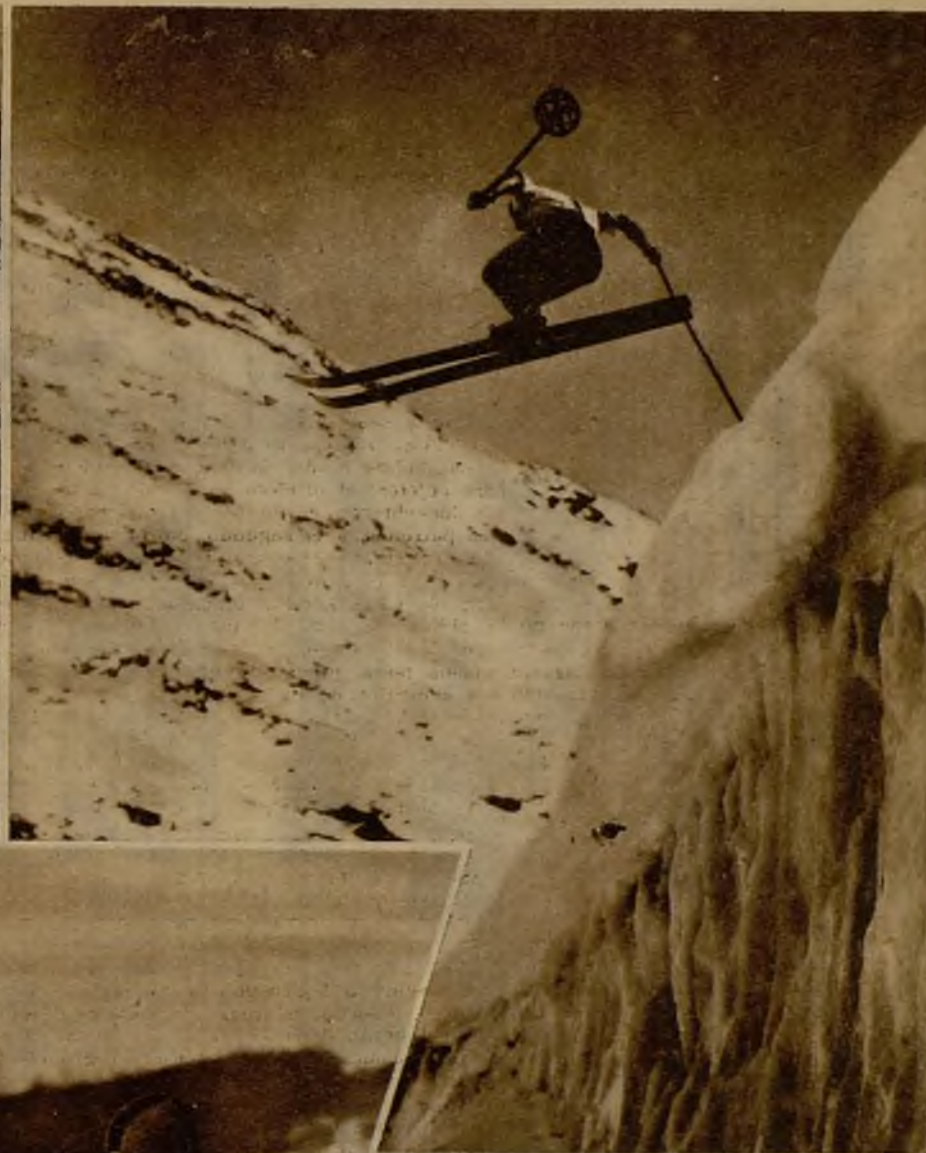
El esquiador ataca bravamente su salto. Hay un rápido instante en que se siente suspendido sobre el panorama nevado