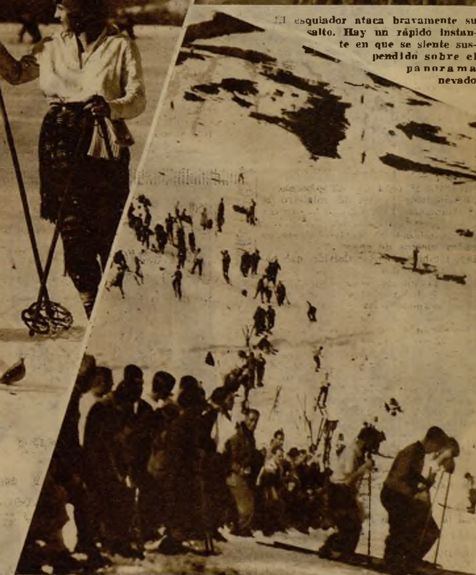
Los esquiadores en marcha, por un bello paisaje, durante el concurso de saltos, campeonato de España, de esquíes, celebrado en las pistas de La Molina, en los Pirineos