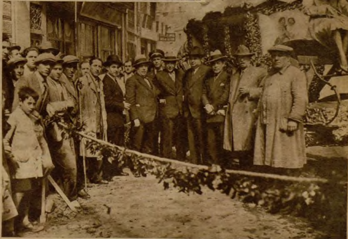
El Jurado, presidido por el alcalde, que ha otorgado los premios en el concurso de fallas