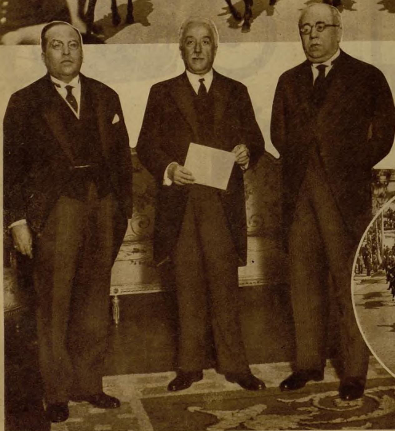
El nuevo embajador de Méjico en España, doctor Estrada, al salir con la escolta protocolaria del Palacio Nacional, después de presentar sus cartas credenciales al Presidente de la República