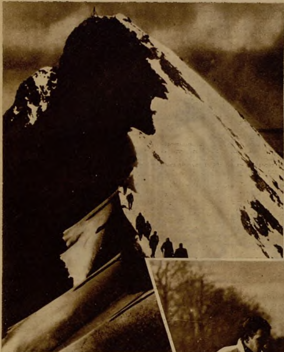
Un soberbio espectáculo en los Alpes. La caravana de alpinistas desciende, tras haber escalado animosamente un picacho