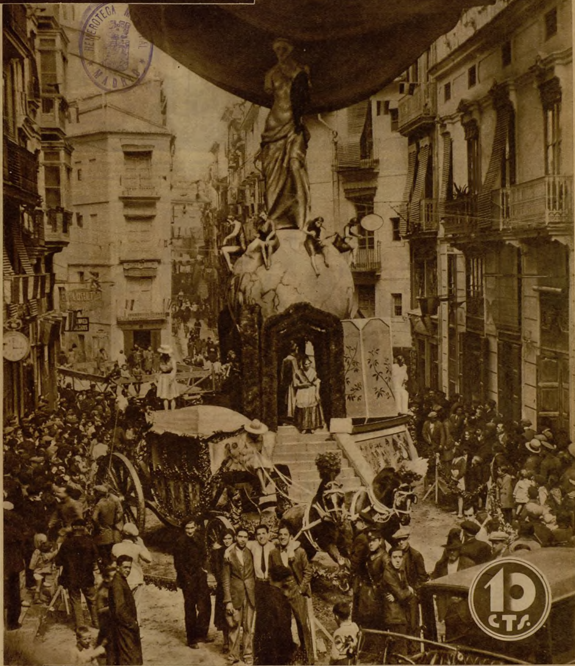
EL PRIMER PREMIO DEL CONCURSO DE "FALLAS" DE VALENCIA.—Culminan hoy los brillantísimos y tradicionales festejos "falleros" de San José en la bella capital levantina. Entre las numerosas y artísticas instalaciones presentadas al concurso, animadas en su mayoría por simbolismos finamente ingeniosos o reproducción de típicas costumbres populares, el Jurado ha otorgado el primer premio a esta vistosa y artística alegoría, que figura en la plaza de San Jaime