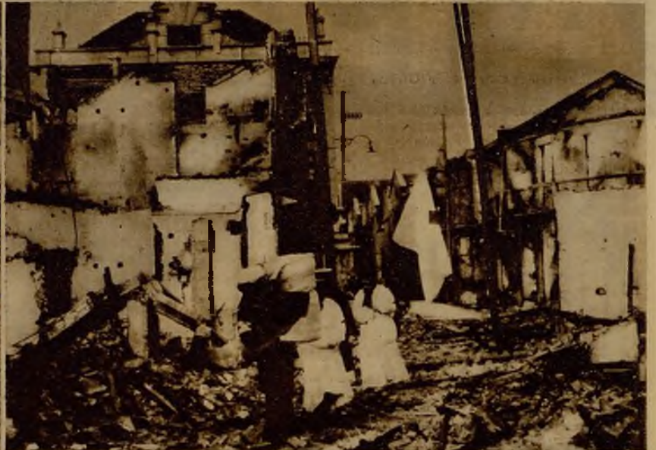
La casi total ruina que pesa sobre los territorios chinos que han sido teatro de las acciones guerreras, toma proporciones desastrosas por la acción devastadora de los bandidos. Ante el temor de sus tropelías, los vecinos huyen con sus míseros menajes