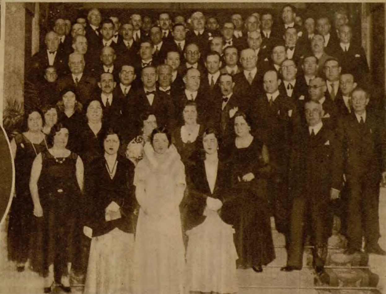
Delegados del Congreso Nacional de Hoteleros, después de la sesión de clausura

"Bohy", el bailarín francés ganador del campeonato de resistencia en el Circo de Price, que ha muerto en Llabna, cuando participaba en otra competición