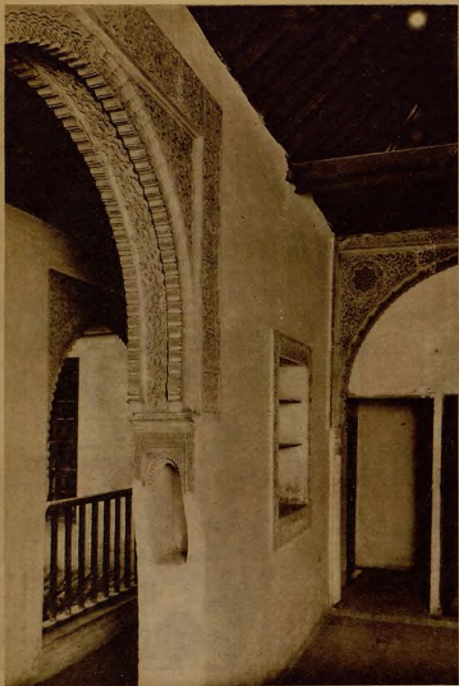
Galería alta de la Casa del Chapiz, espléndido ejemplar de arquitectura de la época morisca

Granada es la mitad de España. O por lo menos la mitad del alma española. Porque Granada simboliza nuestra civilización árabe, que es la nota más original que España puede ofrecer al mundo, lo que origina su superioridad sobre las otras culturas europeas, menos apasionadas, más imitadoras del consabido modelo romano. Y esa España mora es mucho más extensa de lo que parece. Si se leen los estudios del sabio arabista y sacerdote católico—don Miguel Asín, se aprende que en Italia el Dante, en Francia Santo Tomás, en España Lulio y hasta Santa Teresa, sufren la influencia de nuestros moros. Otro sabio—Gómez Moreno—demuestra que la arquitectura románica se deriva en gran parte de la Mezquita de Córdoba. Ribera encuentra la música andaluza en la Alemania de los "Minnesinger" y en la Francia de los trovadores. Y hasta el Renacimiento y la Reforma se iniciaron en la Córdoba de los moros antes que en sus países de triunfo. Toda esa civilización moro-andaluza va a resucitar otra vez, gracias al nuevo Centro de Estudios Árabes, recientemente creado en Granada.