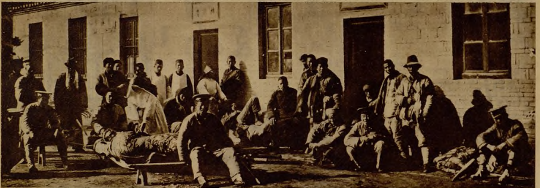
Vecinos de Laohokow heridos por los bandoleros, que invadieron la población. Fueron recogidos por las franciscanas misioneras de Egipto. Según parece, diez y ocho misioneros italianos han sido apresados por los salteadores en Laohokow, de cuya ciudad siguen dueños