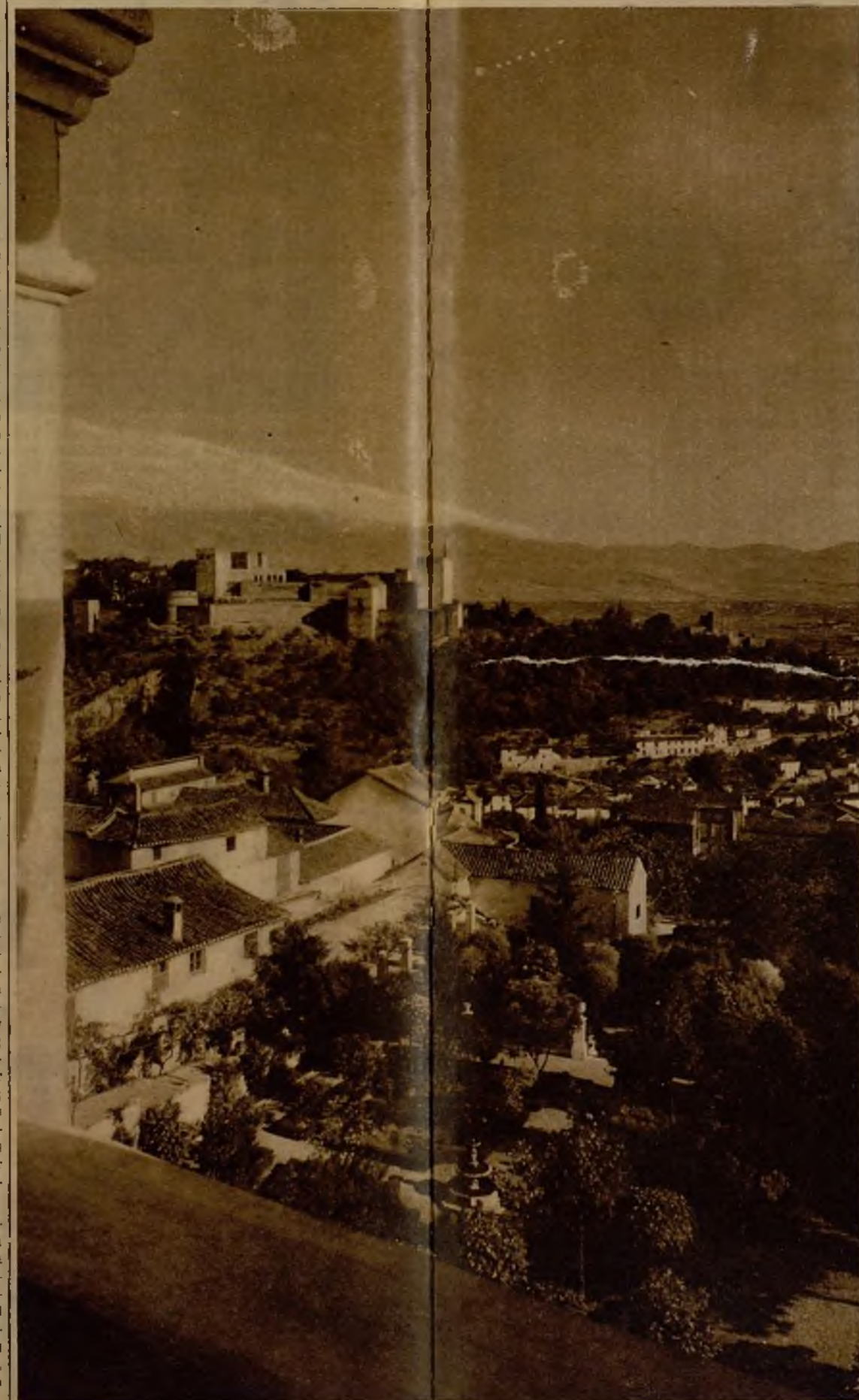
Los cármenes del Albaicín, que conservan aún su carácter musulmán, en contraste con la melancolía de la Alhambra, ofrecen este espectáculo de soberbia magnificencia

Lo que será el Centro de Estudios Árabes de Granada. Se instalará una exposición permanente de industrias artísticas granadinas, que hoy siguen aún las viejas técnicas árabes. La casa del Chapiz será residencia de estudiantes moros y de turistas