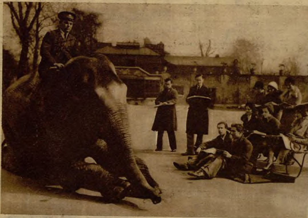
Este paciente elefante del parque zoológico de Londres se presta de buen grado a que los alumnos de escultura tomen apuntes de su voluminosa figura