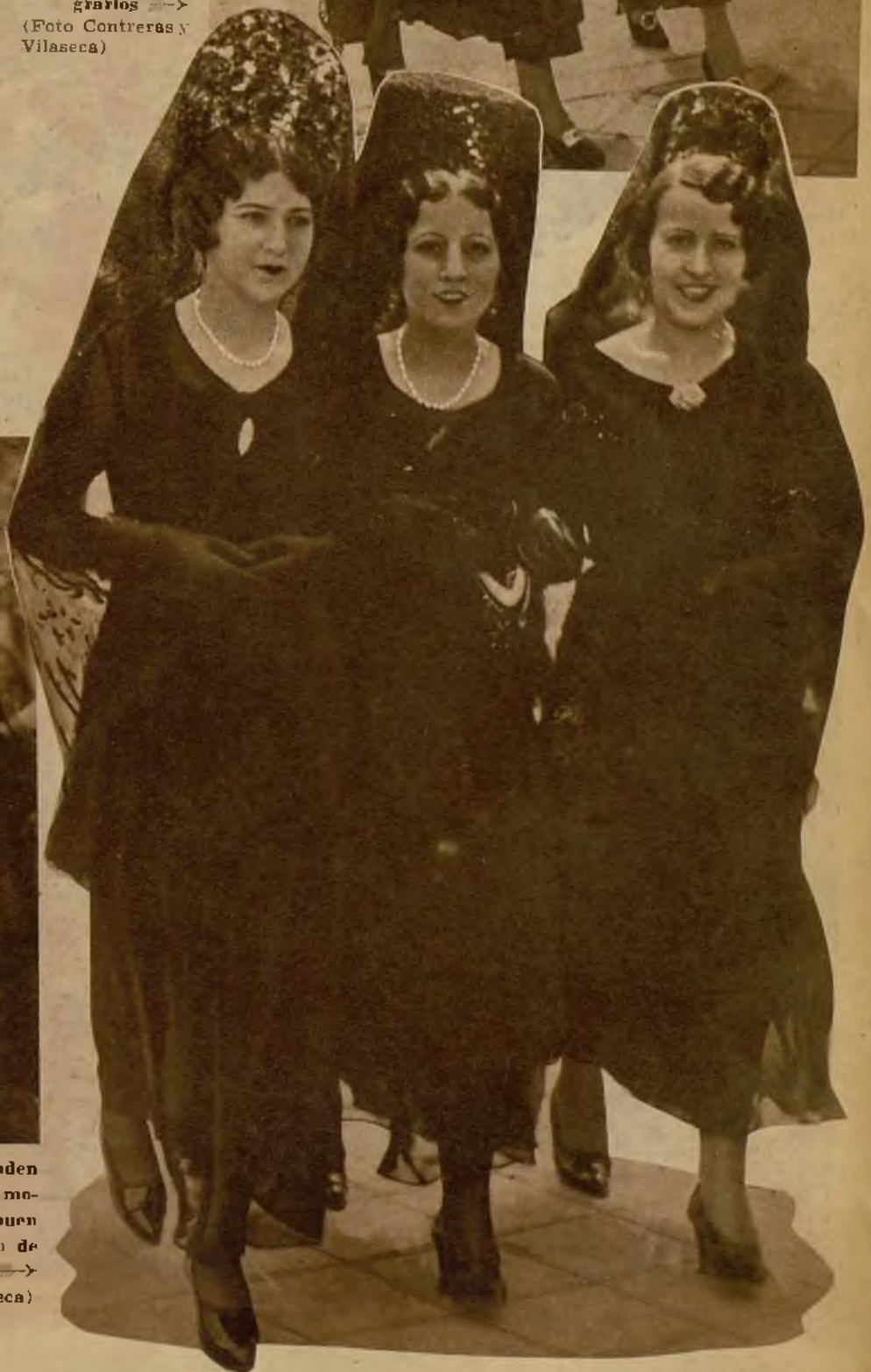
Estas tres lindísimas madrileñas rinden culto a la tradición recorriendo los monumentos de las Iglesias, y al buen gusto luciendo la elegancia y garbo de la mantilla castiza