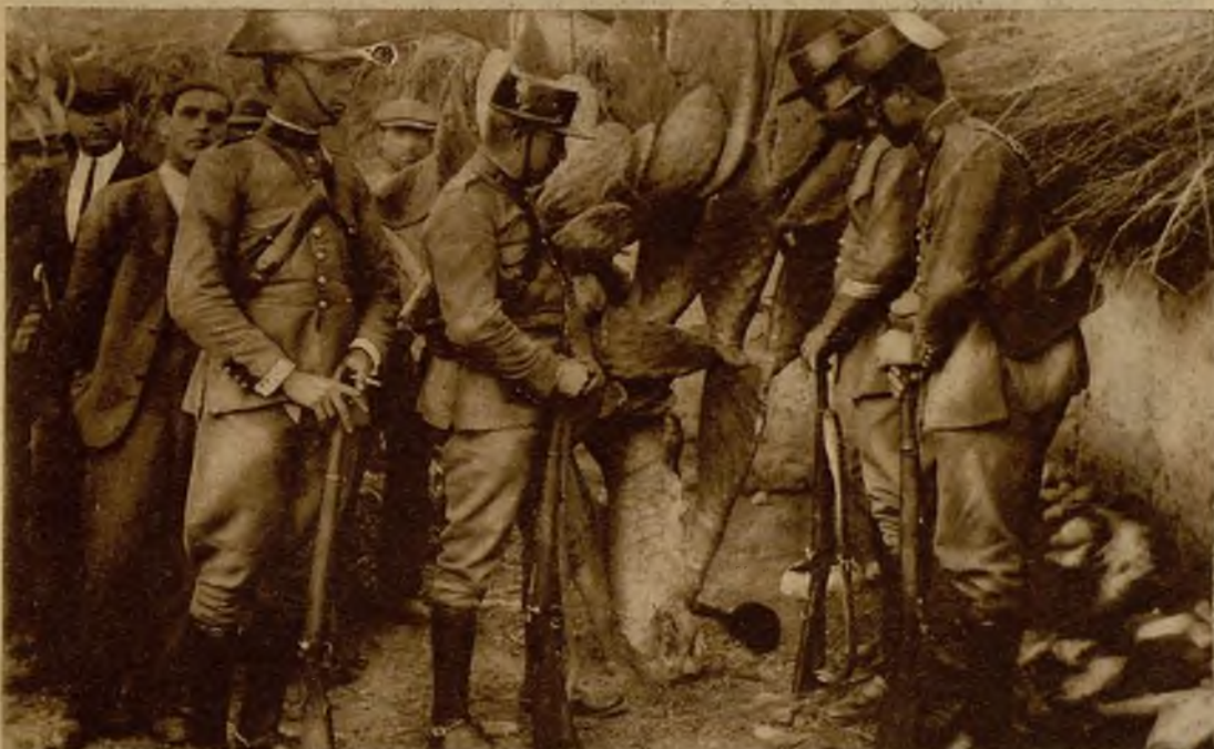
Lugar inmediato al chozo en que fueron asesinados los ancianos moradores del mismo, donde, al pie de una higuera, fué hallado el hocino con que se cometió el doble crimen