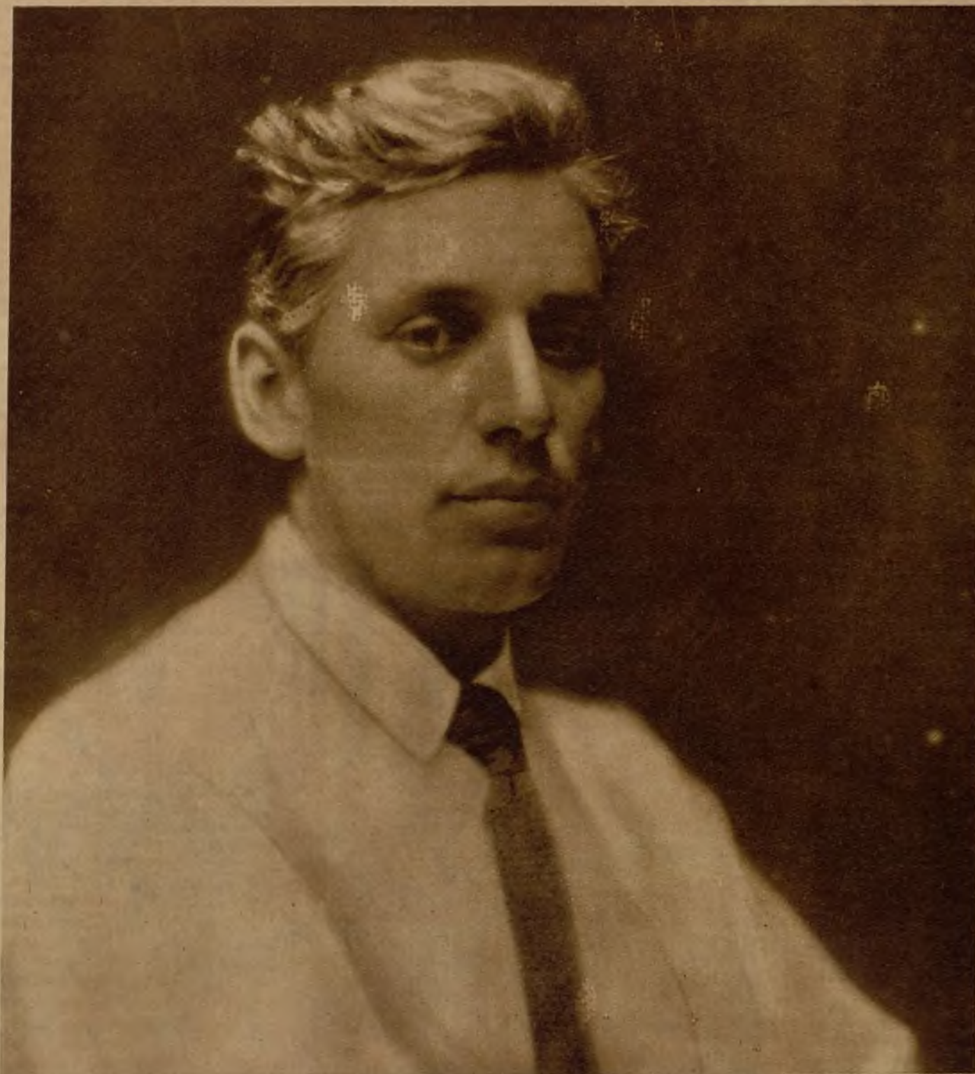
Max Eastman, hijo del rey del Kodak, que ha renunciado a la herencia de su padre, que importa 500.000.000 de dólares

dente de Suiza, la renuncia está al alcance de cualquiera. No hace falta un príncipe exaltado y al cual, esto aparte, se le ofrece la seductora popularidad del cine. Cualquiera otro sueco de sus años haría, indudablemente, lo mismo.