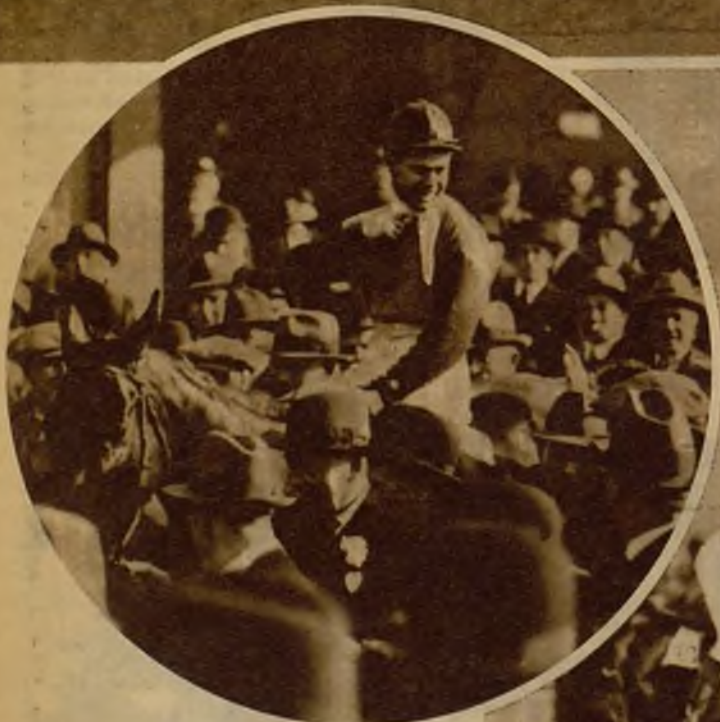
El caballo vencedor, "Forbra", su propietario y su jinete, son objeto de aclamaciones al terminar la emocionante carrera