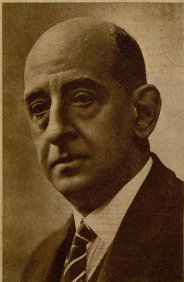
El ilustre pintor don Enrique Martínez Cubells, nuevo académico de la de Bellas Artes de San Fernando en la vacante de don Luis Menéndez Pidal