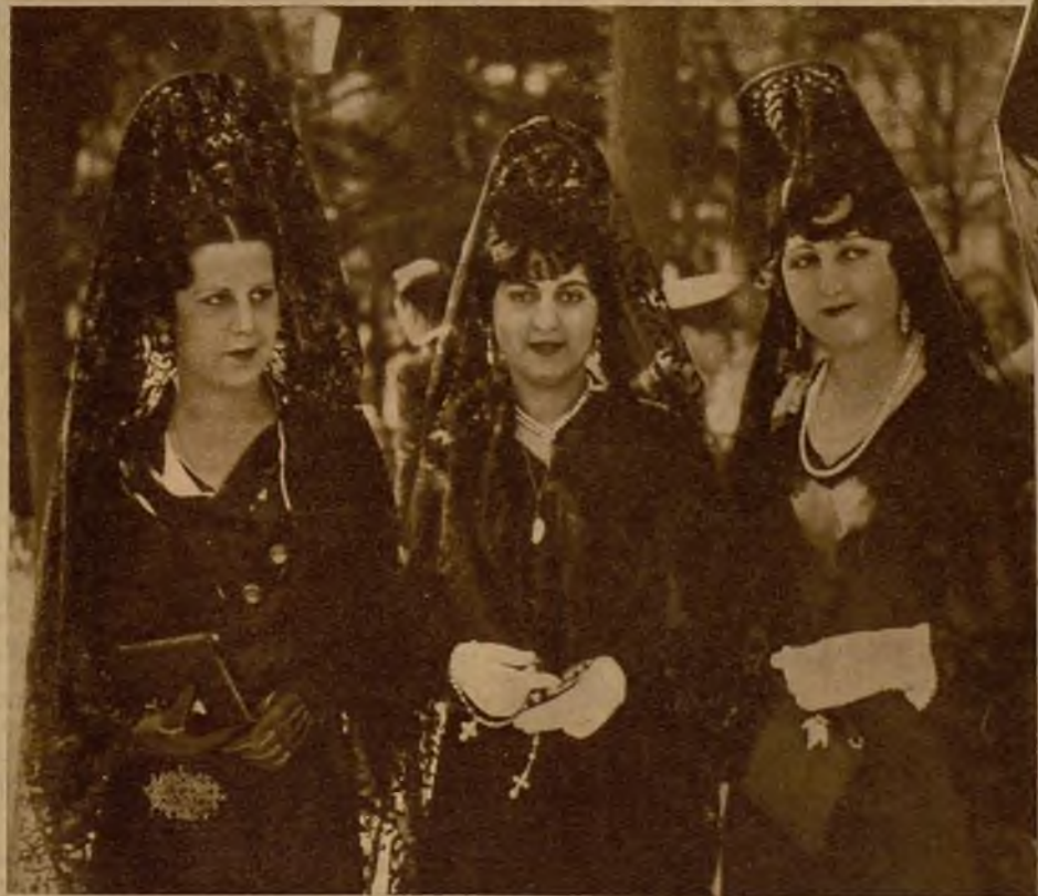
Con la elegancia peculiar de la mujer madrileña, estas tres bellísimas señoritas hacen gala del encanto de la mantilla, colocada airosamente sobre la peña gallarda