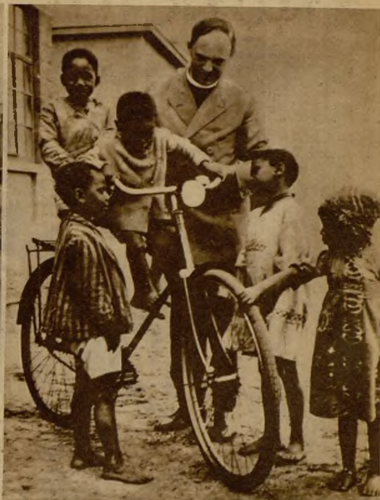
Estos pequeños negros de un bosque africano están recibiendo las primeras lecciones de deporte civilizado por medio de una bicicleta. Y los chicos miran la máquina como a un bicho raro