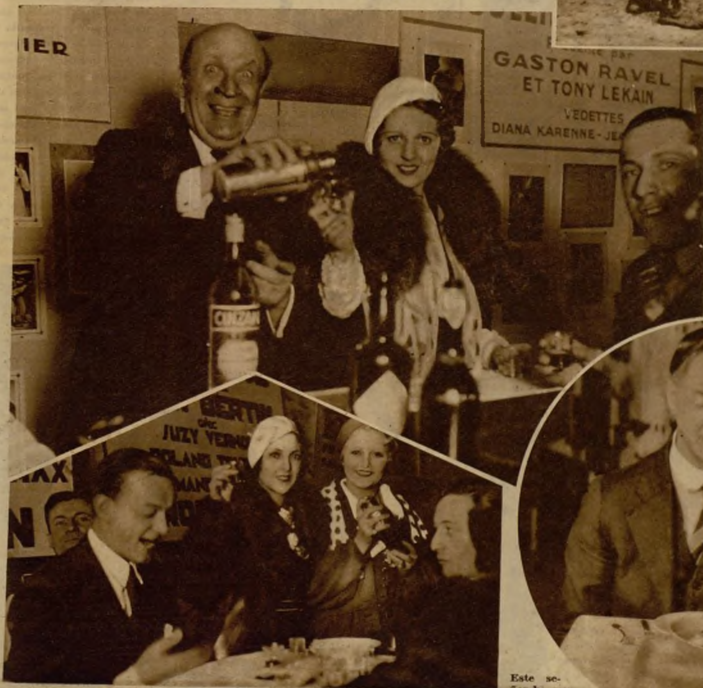
Los artistas que han celebrado el original campeonato de "cock-tails" están en una de las pruebas finales. Este ciudadano de la izquierda parece a punto de ser eliminado por sus bellas contrincantes