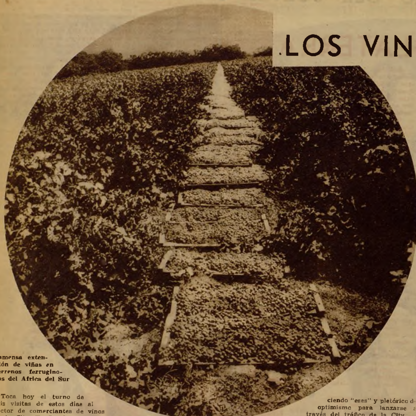
Inmensa extensión de viñas en terrenos ferruginosos del África del Sur

Toca hoy el turno de mis visitas de estos días al sector de comerciantes de vinos de la City. En Londres hay tres o cuatro casas de antiguo abolengo en este comercio. Los grandes exportadores jerezanos, para los cuales cada gota de sus soleras se convertía en Inglaterra en una gota de oro, sobre todo allá por los tiempos en que Eduardo VII era el príncipe de Gales, "bon vivant y bon buveur", en cuya mesa no faltaba nunca la botella de lo añejo procedente de Jerez, abrieron suntuosos despachos ri-