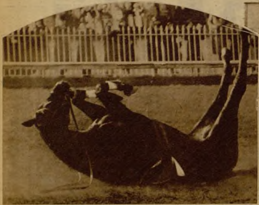
El objetivo recoge el momento de una de las más aparatosas caídas. Es "K. C. B." el caballo que ha sufrido el accidente