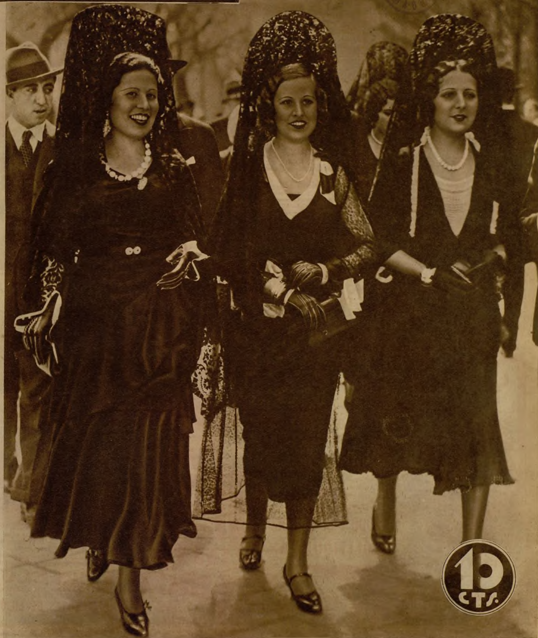
LA FESTIVIDAD DEL JUEVES SANTO EN MADRID.—Las calles de la capital ofrecieron en el día de ayer la bella nota de sus mujeres ataviadas con la clásica y galana mantilla, en la tradicional visita de los sagrarios. El objetivo refleja a uno de los muchos grupos de gentiles madrileñas que recorrieron los Monumentos levantados en las iglesias, en celebración de la gran solemnidad religiosa