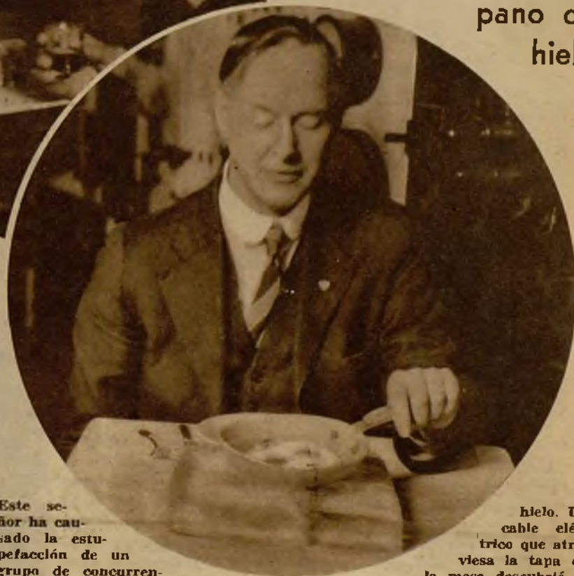
Este señor ha causado la estupefacción de un grupo de concurrentes a un restorán, friendo huevos sobre un témpano de