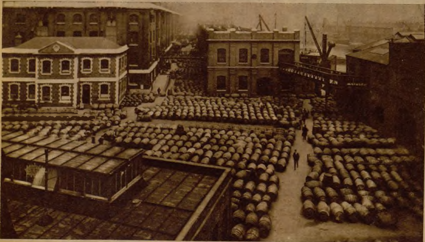
Vino, vino para Londres Gargantua! Los muelles del puerto, aharrados de mosto