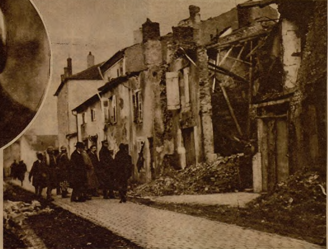
El señor Azaña con sus compañeros de excursión al frente francés en 1917, recorriendo las calles de Verdún

Este hombre, denso y recio bigote, fué con un casco guerrero, es, que no sea fácil reconocer al actual jefe del Gobierno, ministro de la Guerra, don Manuel Azaña. Está hecha la foto en 1917, cuando el político, que entonces ostentaba en sus fajas el solo título de escritor, visitó el frente francés en su tienda mun-