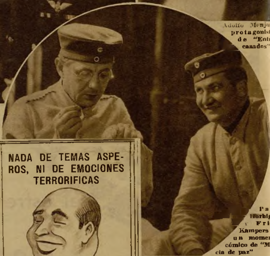
Paul Hörbiger y Fritz Kampers en un momento cómico de "Milicia de paz"