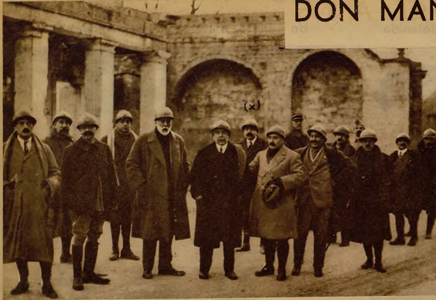
El actual jefe del Gobierno (x) en el patio de la fortaleza de Verdún, durante la excursión que realizó en 1917 al frente francés

EL MINISTRO DE LA GUERRA EN LA GUERRA. SU VISITA AL FRENTE FRANCES EN 1917