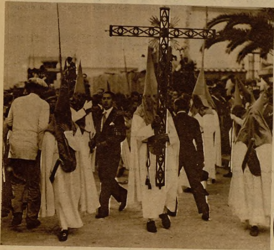
Esta ha sido la única cruz de guía que ha salido de su templo este año en la famosa Semana Santa sevillana. Iba al frente de la Hermandad de Nuestro Padre Jesús de las Penas y Virgen Santísima de la Estrella, de la parroquia de San Jacinto. En los círculos de la derecha: las dos imágenes de la Cofradía

Ocurrieron algunos incidentes, pero la procesión volvió a su templo entre el entusiasmo de los sevillanos