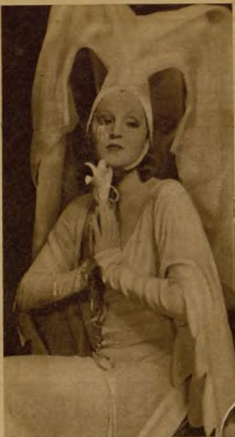
Brigitte Helm, la imponderable actriz, principal figura femenina de "El Danubio azul". En silueta: Lillian Tashman, que destaca por su belleza y excelente arte en "¡Estamos... aprés!"