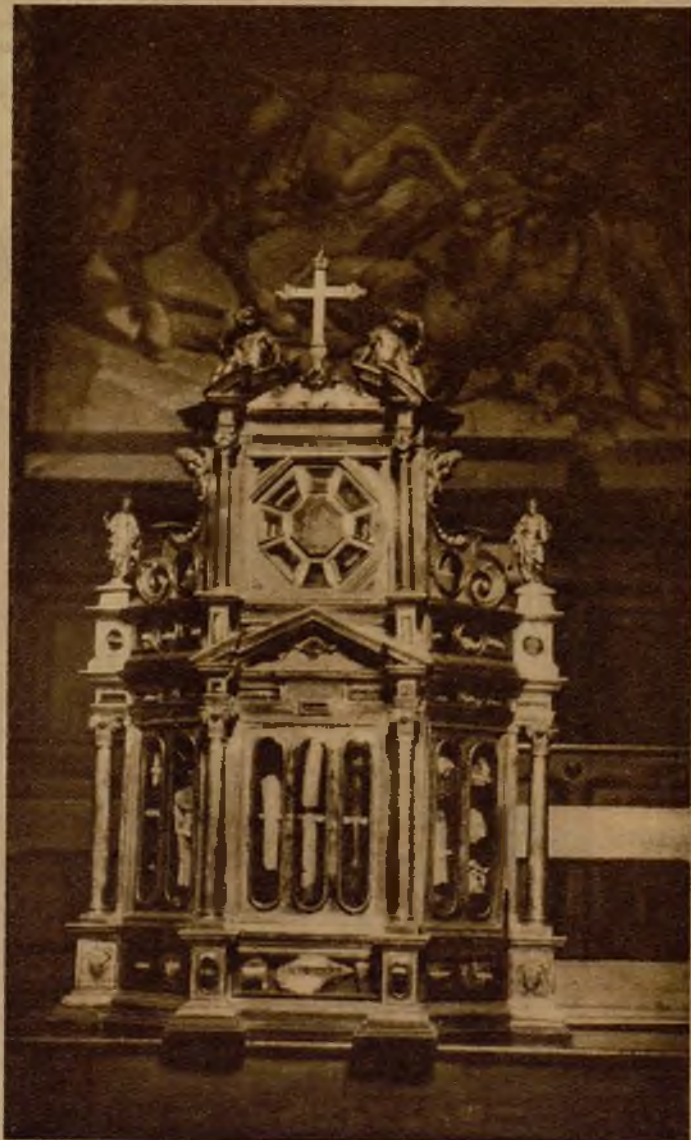
En la ochavilla superior de este templete-relicario se custodia la más milagrosa de las 150 espinas arrancadas de la corona de Cristo

Renuncio a contaros ciertos episodios histórico-legendarios referentes a algunas de estas sagradas espinas; como la de Ascoli Piceno que el rey Felipe el Bello de Francia cedió a su confesor ita-