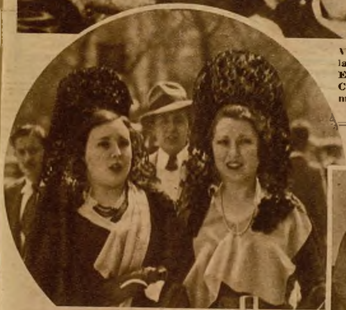
Dos lindas madrileñas con el clásico atavío, dirigiéndose a los cultos religiosos