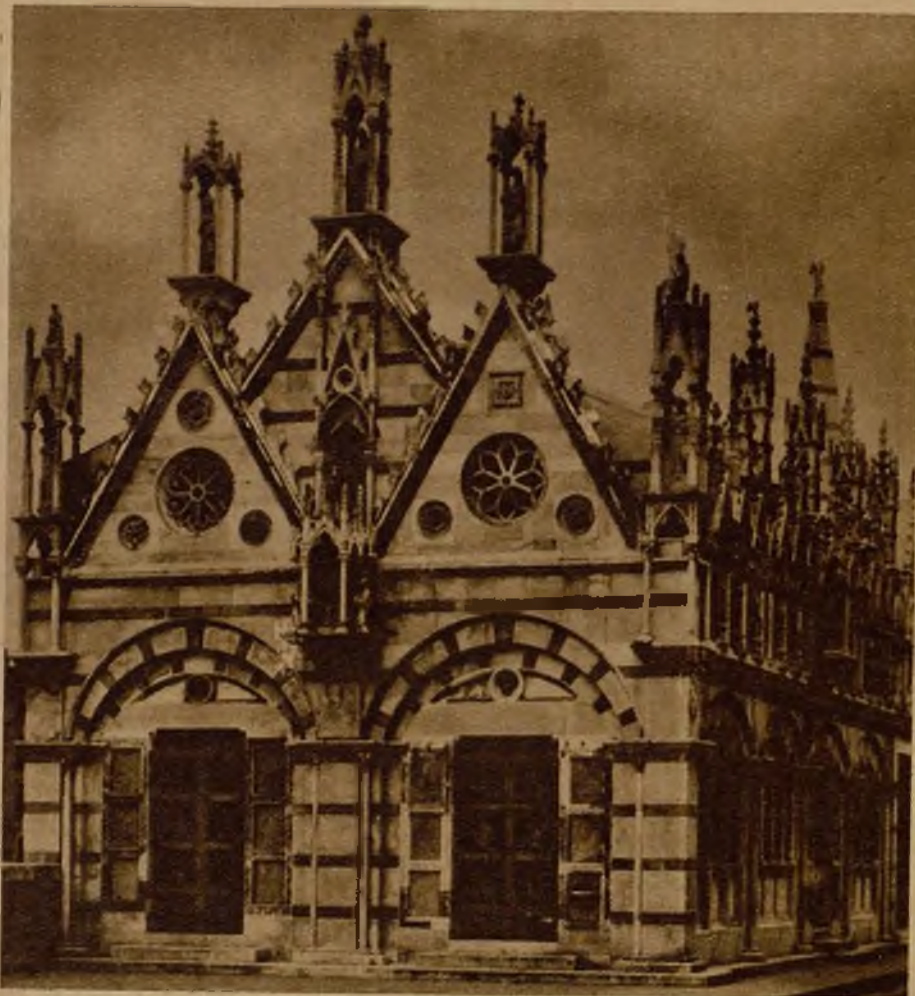
Esta bellísima capilla de Pisa es famosa por su pequenez, y sobre todo por la fama milagrosa de la Santa Espina, en ella conservada

llano a cambio de un diente de nuestro Santo Domingo "más una libra de plata para el relicario y otra libra de cera para cuando me muera".