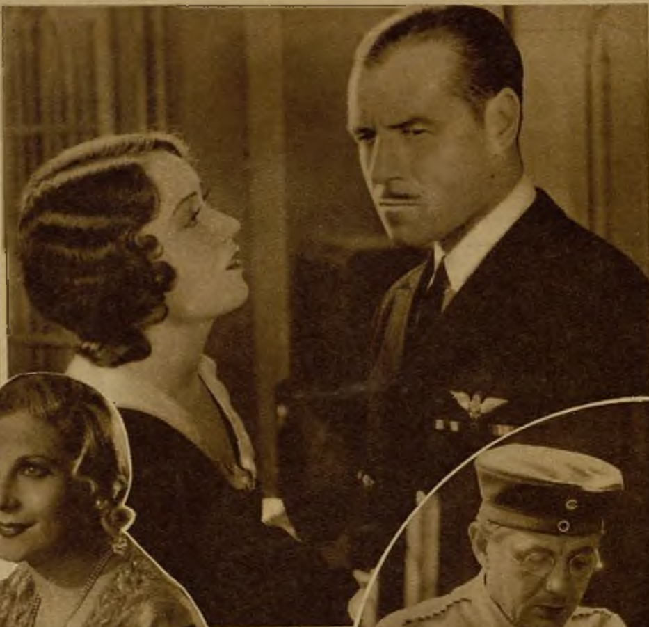
Una escena de "El dirigible", película de pasión y aventuras, interpretada por Fay Wray y Jack Holt