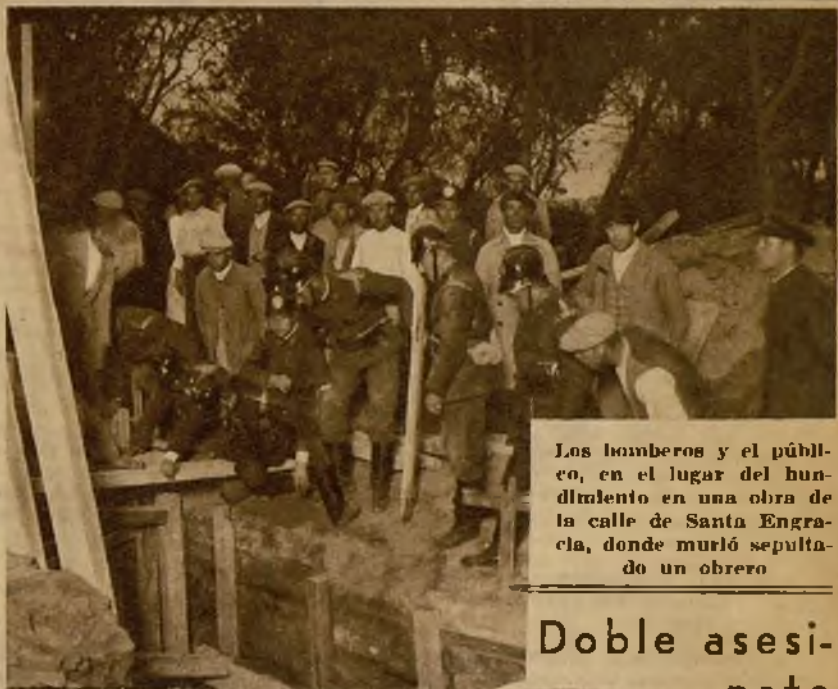
Los hombres y el público, en el lugar del hundimiento en una obra de la calle de Santa Engracia, donde murió sepultado un obrero