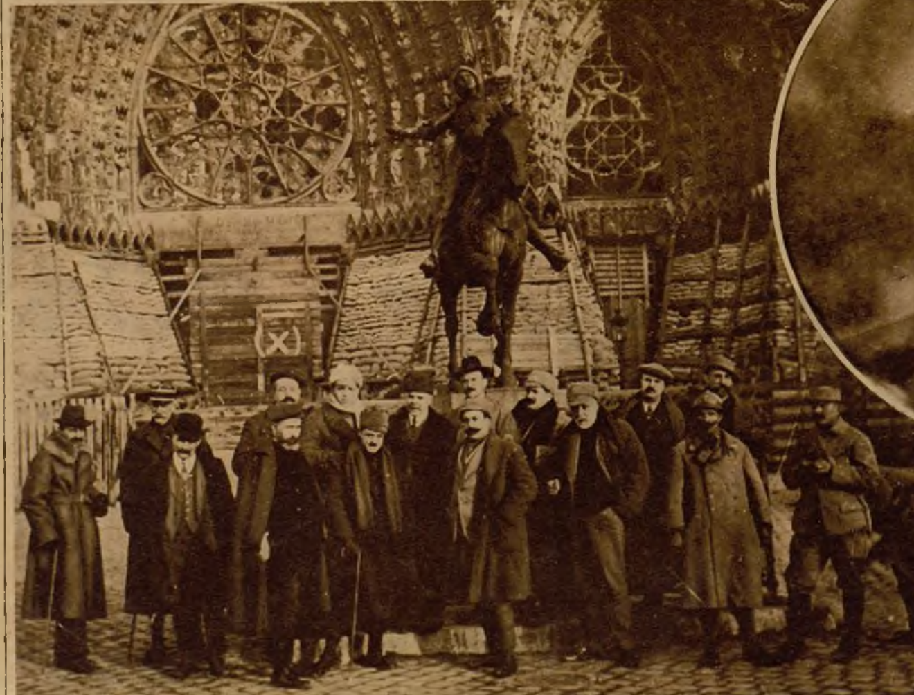
En la segunda línea del grupo (x) se ve al actual ministro de la Guerra, frente a la catedral de Reims