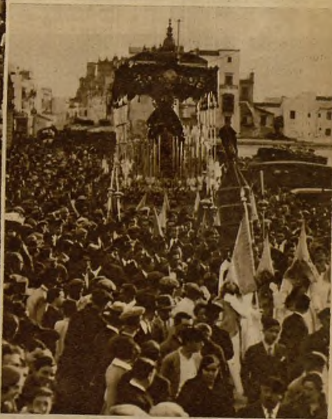
A pesar de la alarma que produjeron unos disparos al entrar la imagen de la Virgen de la Estrella en la catedral, el público reaccionó inmediatamente, y la Cofradía regresó con toda normalidad a su templo, entre un exaltado entusiasmo