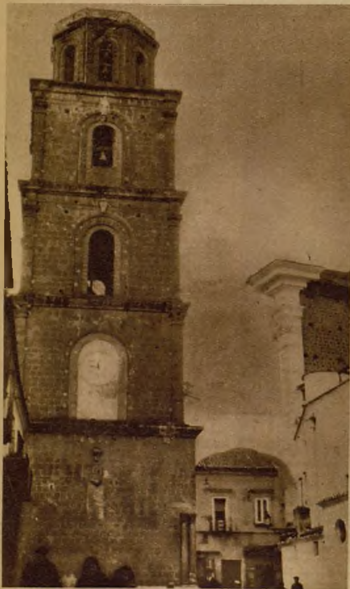
El macizo campanario medieval y la enclavada catedral de Aversa, donde se conserva una Santa Espina

única era verdaderamente de espinas o de juncos.