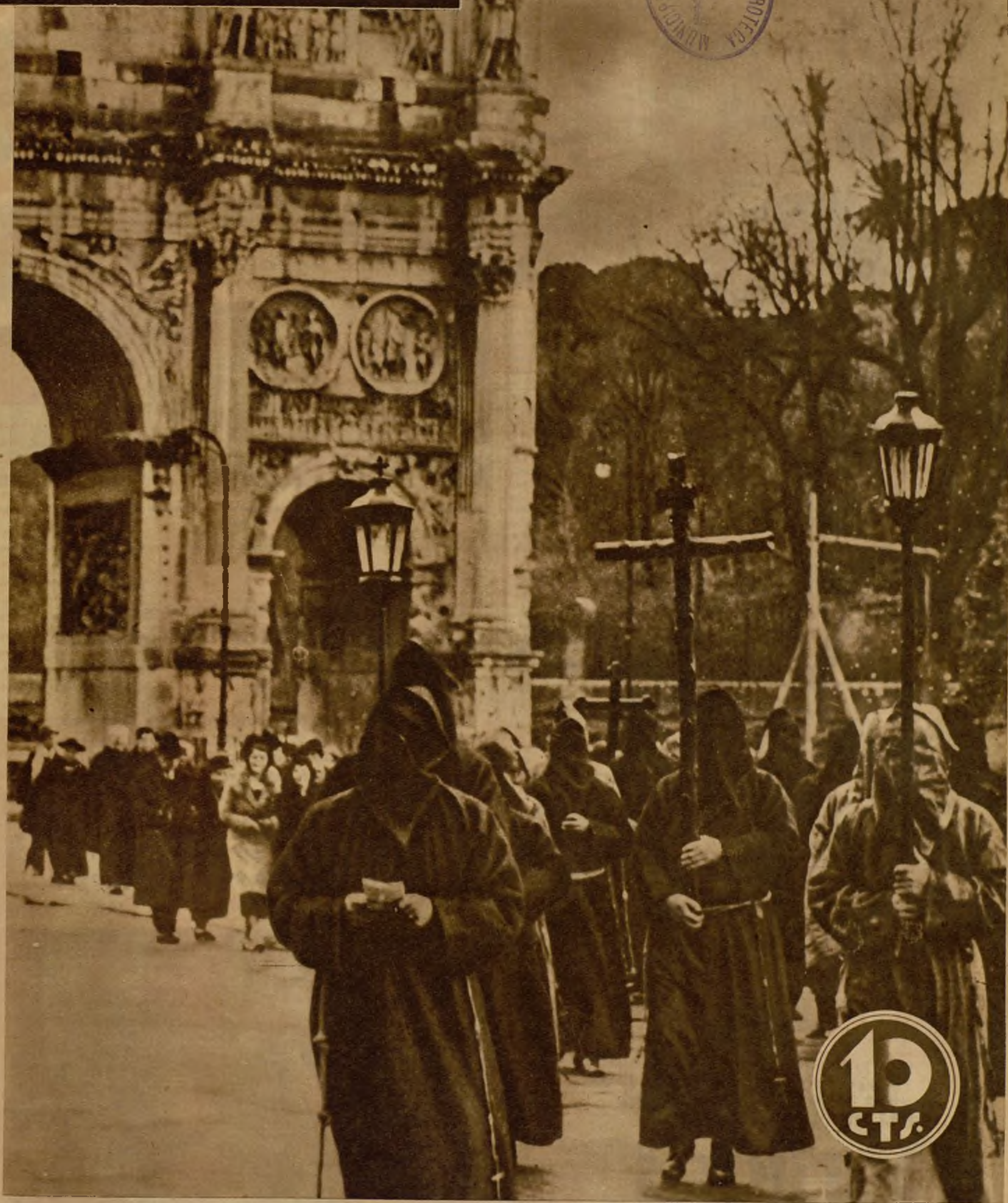
LA SOLEMNIDAD DE SEMANA SANTA EN LA CAPITAL DEL MUNDO CATOLICO.—Ante el fondo grandioso del Arco de Constantino, en la Vía Sacra, y sobre la traza magnífica de sus ocho columnas, avanza la procesión de encapuchados, en Roma, donde las ceremonias de la Semana de Pasión y Muerte revisten magnífica solemnidad