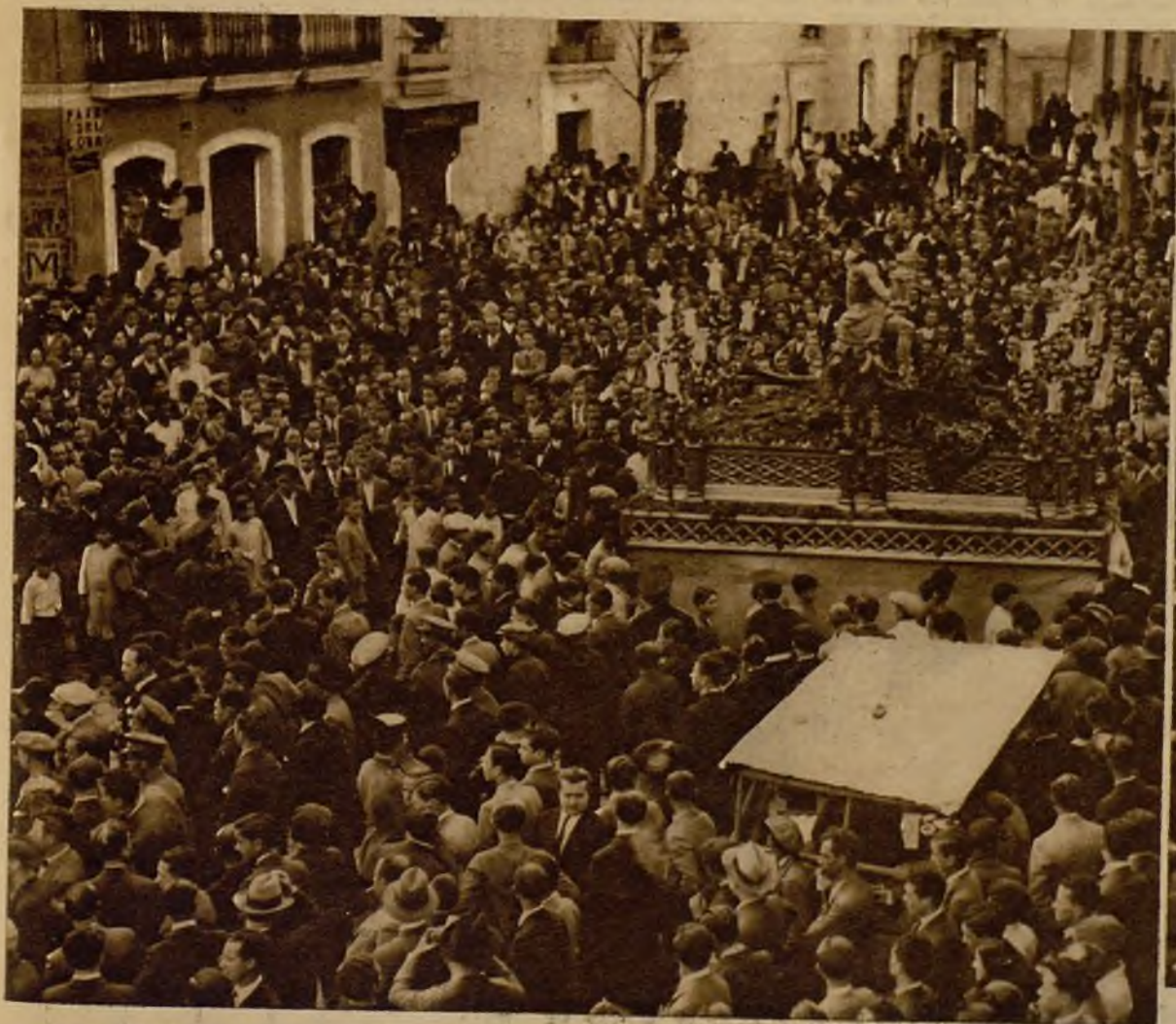
El Cristo de las Penas, a su paso, en la tarde del Jueves Santo, por la plaza del Altozano, en la entrada del puente de Triana. En el tránsito de la Cofradía ante la catedral, un perturbador arrojó una piedra y disparó una platola, pero el suceso no tuvo consecuencias, por fortuna