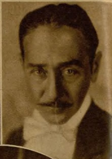
Adolfo Menjou, protagonista de "Entre casados"