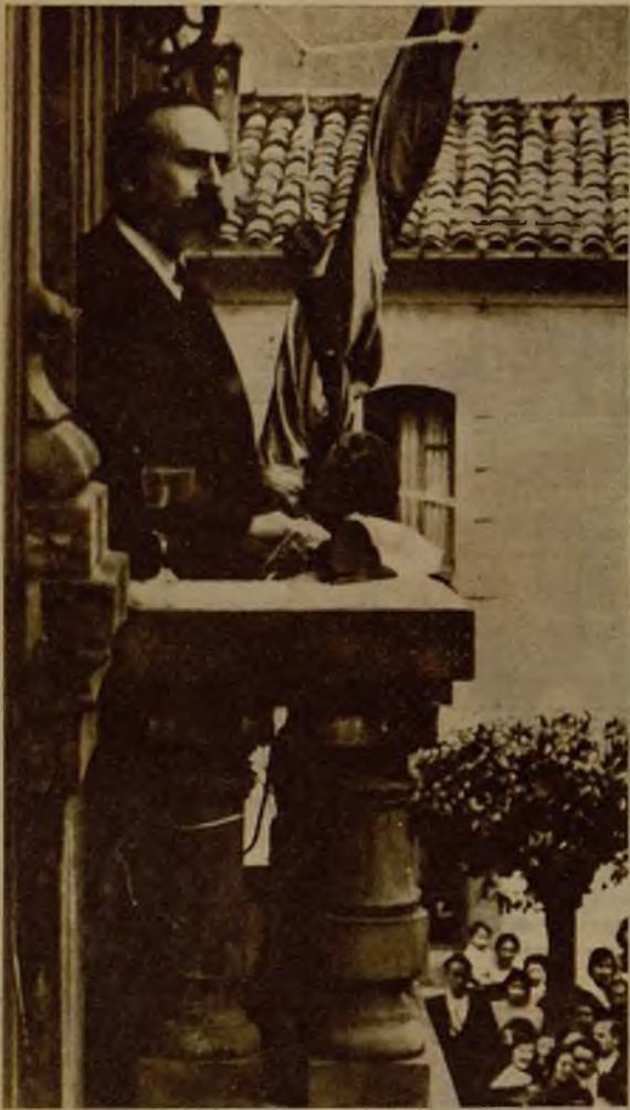
Don Fernando de los Ríos dirigiendo la palabra al pueblo de Mieres, desde el balcón del Ayuntamiento