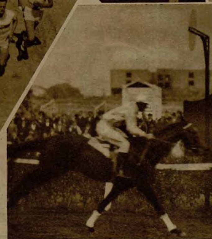
"Le Vaal" cruzando la línea de llegada, después de ganar el Premio "Chitiagand".