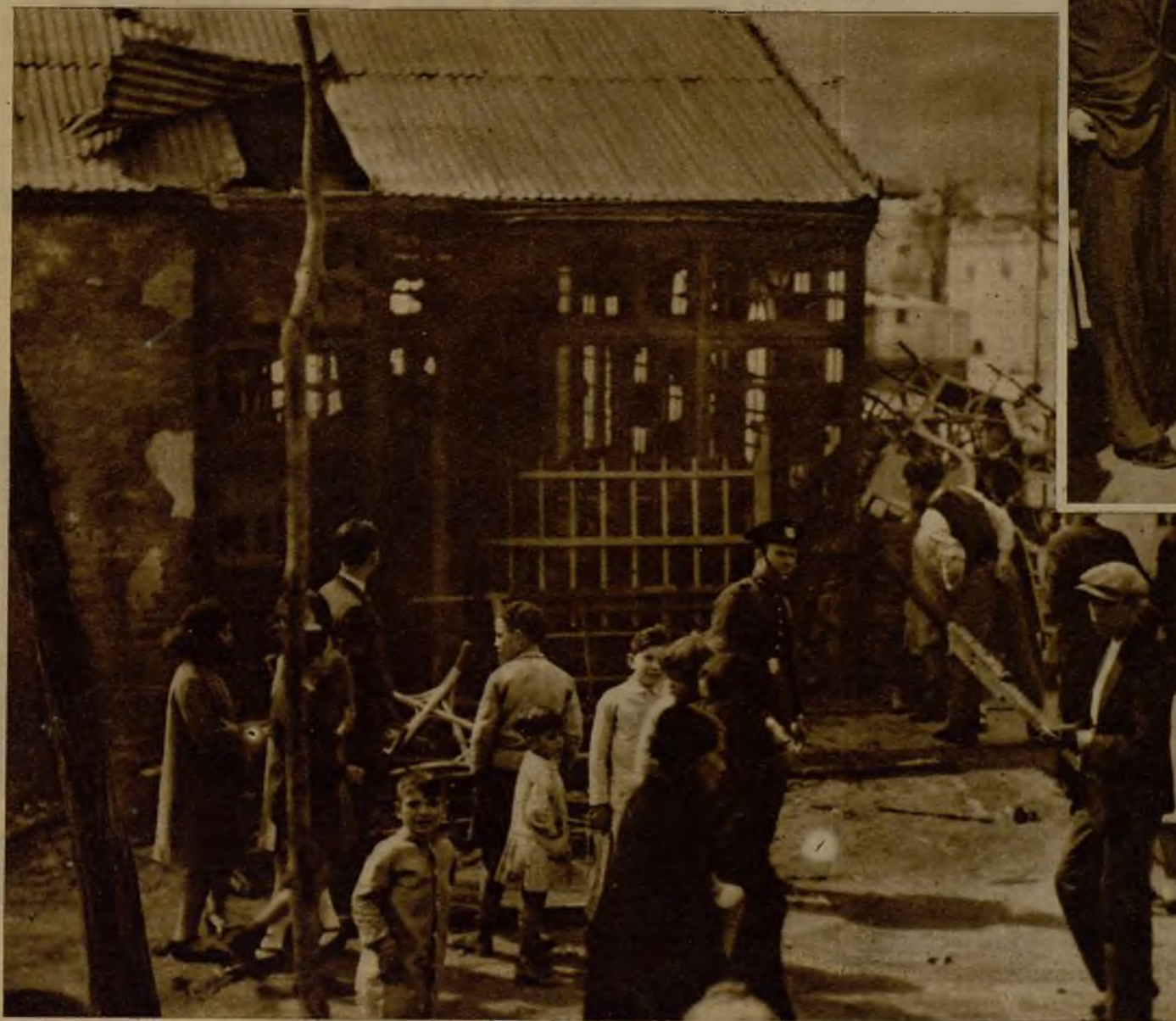
El quiosco de bebidas El Sol, al que unos desconocidos prendieron fuego, causando destrozos valuados en cinco mil pesetas. Los autores del hecho intentaron primeramente penetrar en el local, levantando, como se aprecia en la foto, una plancha metálica de la techumbre, y ante las dificultades que hallaron, decidieron incendiarlo