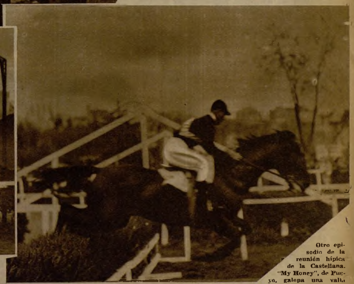
Otro episodio de la reunión hípica de la Castellana. "My Honey", de Pucyo, galopa una valla.