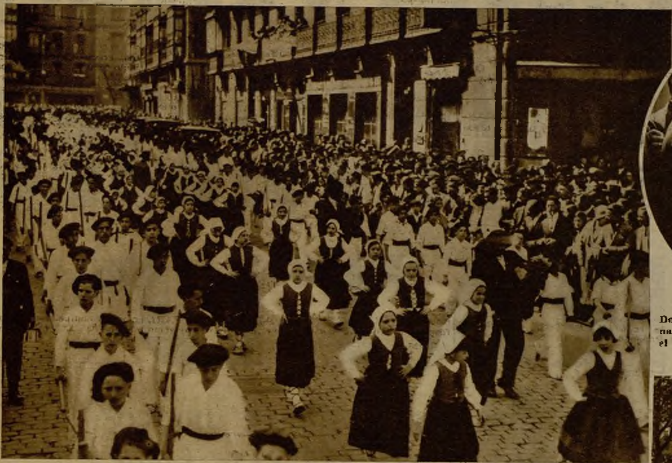
El vistosísimo espectáculo del desfile de las hilanderas durante la imponente manifestación