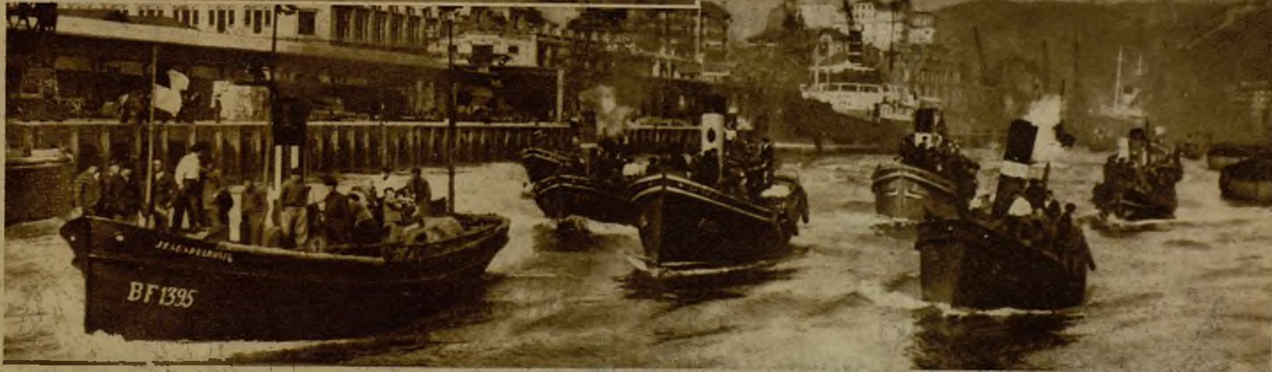
Llegada de vaporcitos conduciendo a las Comisiones marineras que de toda la zona vascongada han concurrido a las fiestas conmemorativas. Arriba, a la izquierda: el solemne momento de descubrir la lápida en la casa en que nació Sabino Arana