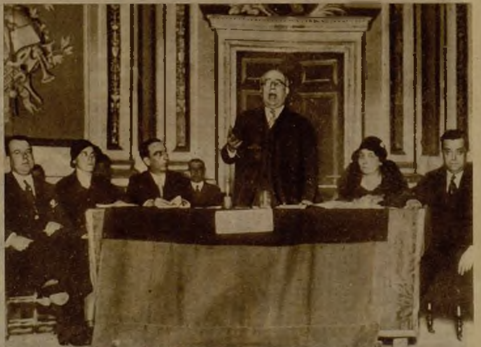
El jefe del Gobierno pronunciendo un discurso en la sesión de ayer del Congreso de Acción Republicana, que se celebra en el teatro María Guerrero