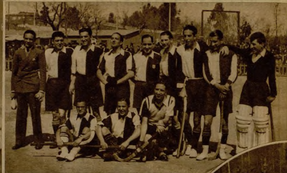
El equipo de "hockey" del Athletic de Bilbao antes del partido final del campeonato de España de este deporte.