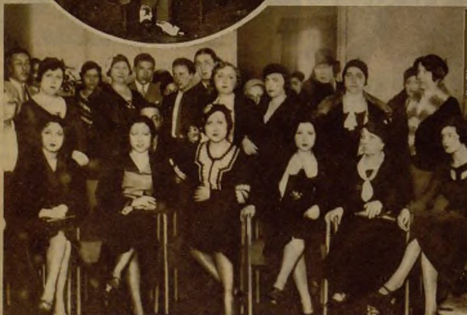
Bellas y distinguidas concurrentes a la brillante inauguración del Ateneo Femenino "Magerit"