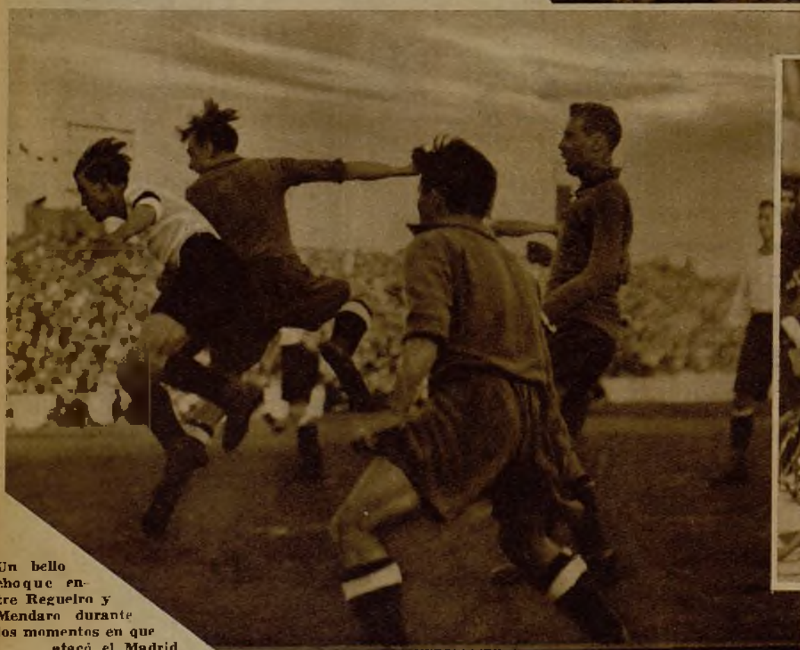
Un bello choque entre Reguero y Mendaro durante los momentos en que atacó el Madrid.