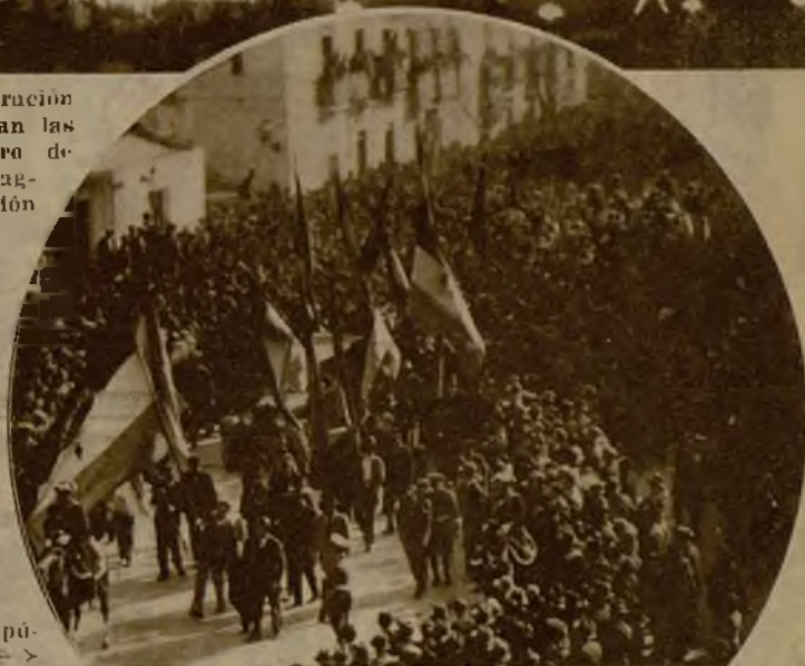
Comisiones con banderas, que realizaron un lucidísimo desfile ante el Presidente de la República

Si el coche que ha comprado no lleva bujías