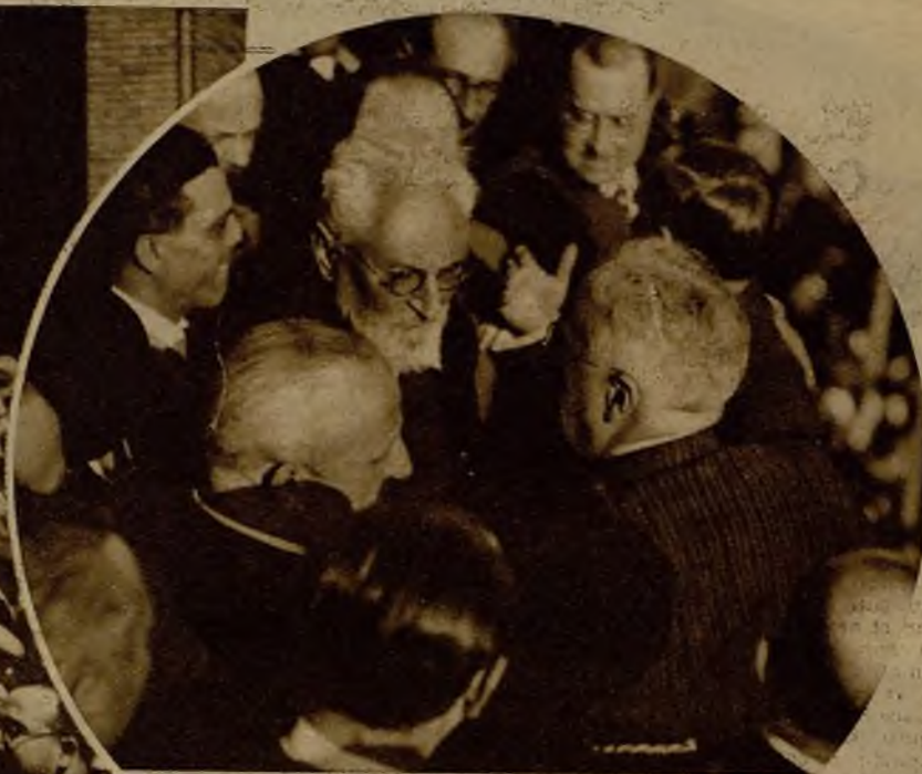
Don Niceto Alcalá Zamora, saluado por la multitud, a su paso por Albacete