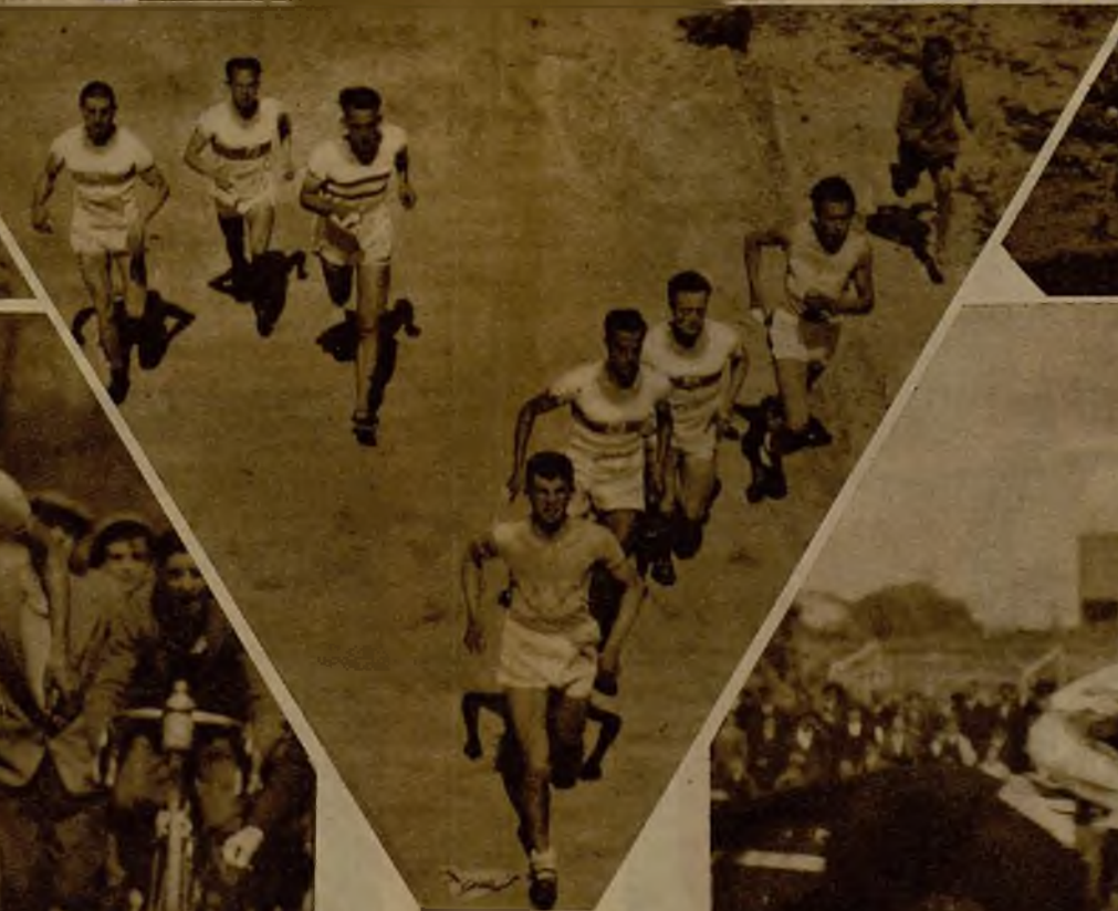
En la barriada contigua al Puente de Segovia se celebró una carrera pedestre, organizada por el Club Deportivo "La Tierra", en la que participaron numerosos corredores. He aquí el grupo de cabeza, después de cubierto la mayor parte del recorrido, preparándose para la batalla final.