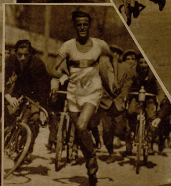
El ganador de la carrera pedestre Premio Puente de Segovia cruza destacado la meta.