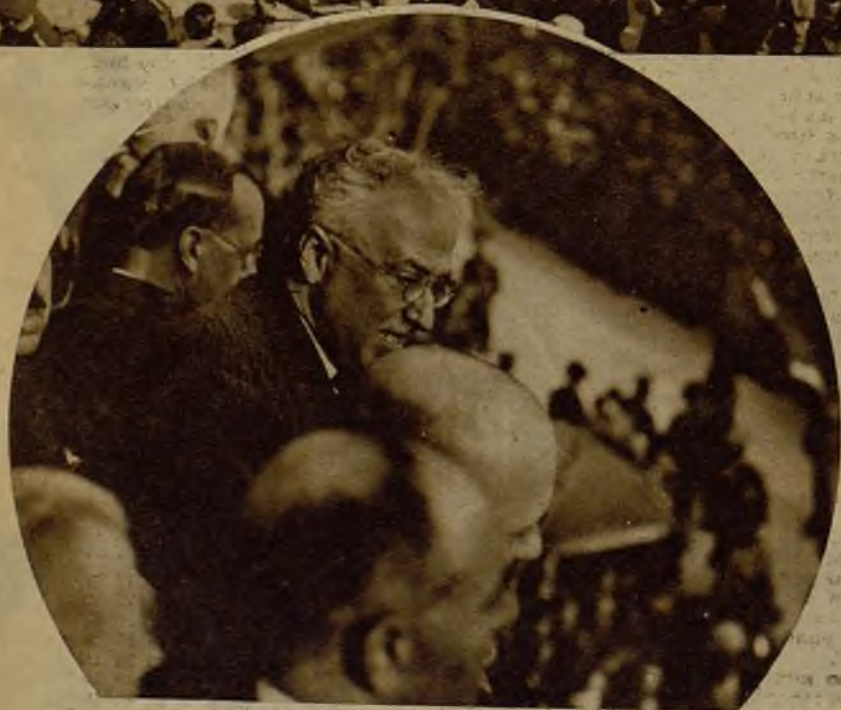
El jefe del Estado correspondiendo a los vítores y aclamaciones del pueblo de Murcia desde el balcón del Ayuntamiento. Arriba, don Niceto Alcalá Zamora dirigiéndose al Ayuntamiento murciano, rodeado por la multitud