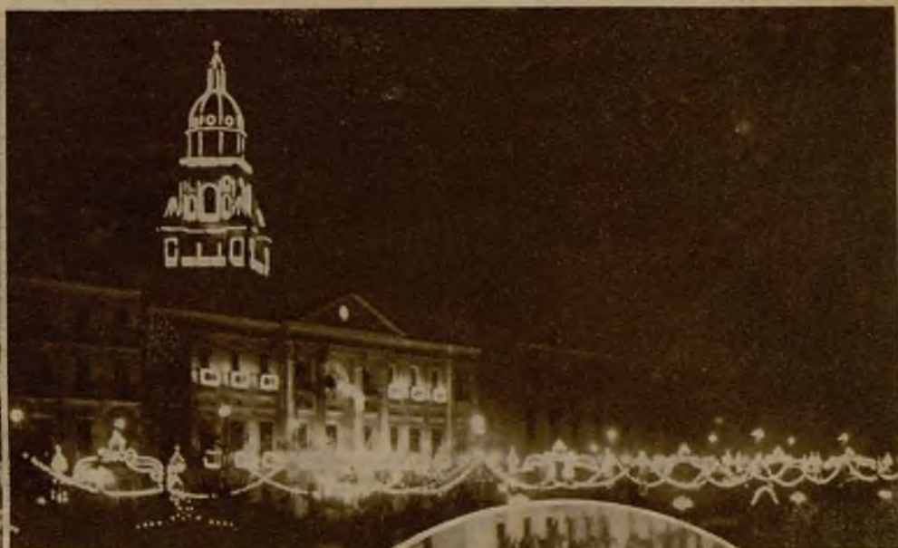
Esta bella decoración luminosa ofrecían las calles del centro de Murcia, en la magnífica recepción tributada al Jefe del Estado