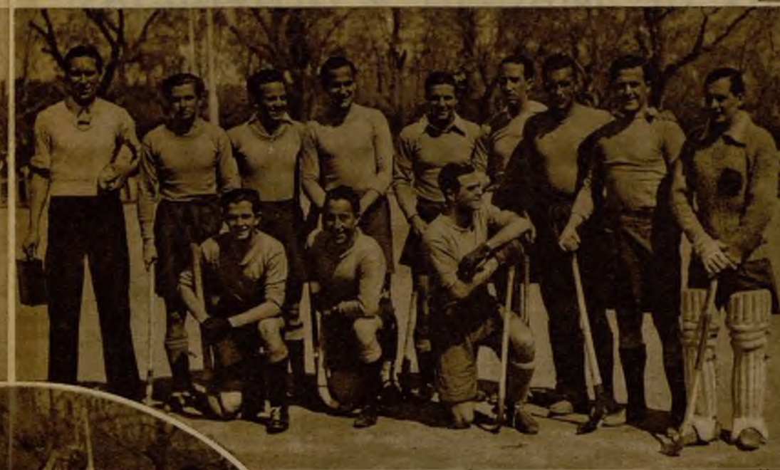
La Agrupación Deportiva Tranviaria de Madrid se ha adjudicado el campeonato de España de "hockey", triunfando brillantemente del Athletic bilbaíno por dos tantos a cero.