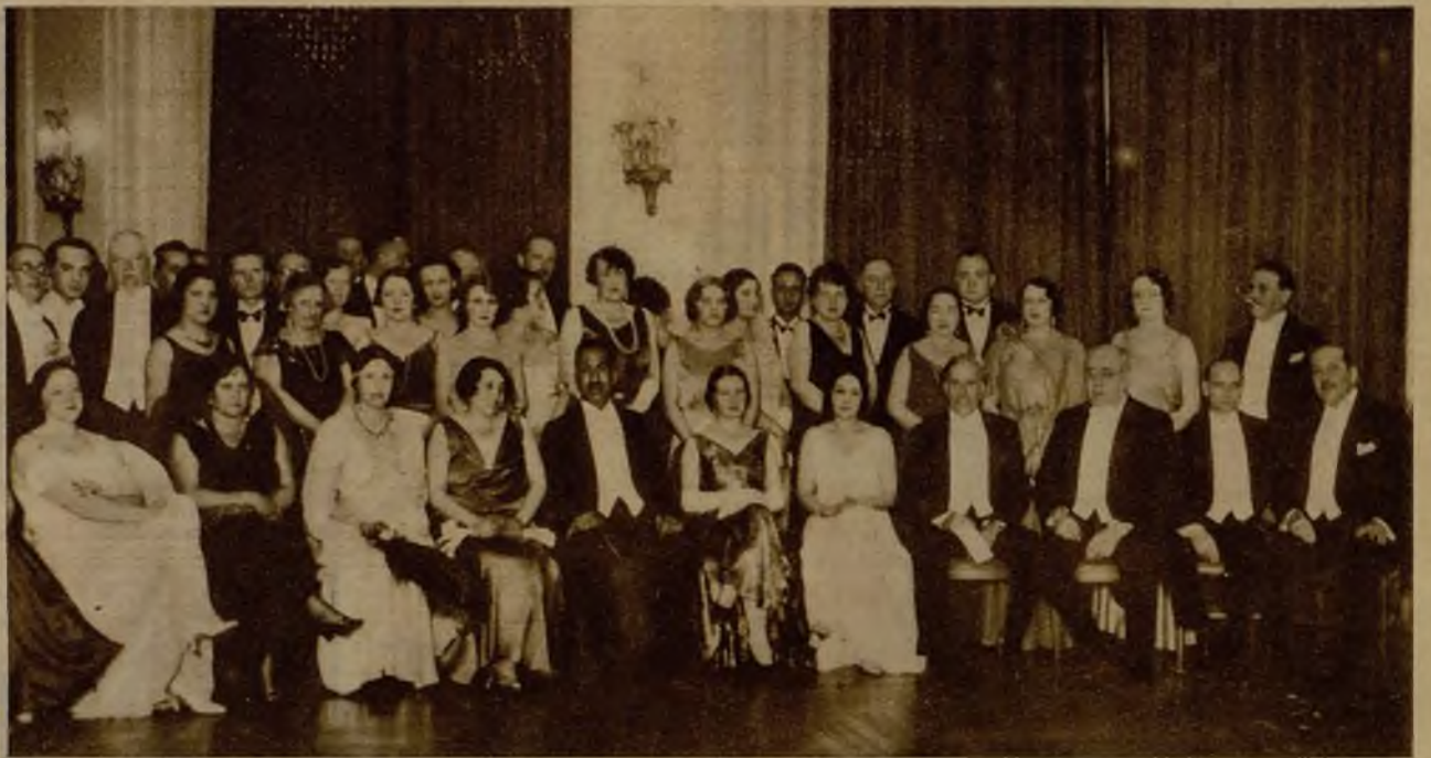
Grupo de personalidades, entre las que figuran el jefe del Gobierno, el ministro de la Gobernación y el presidente de las Cortes, en la conmemoración de la fiesta nacional de Egipto, celebrada en el Ritz