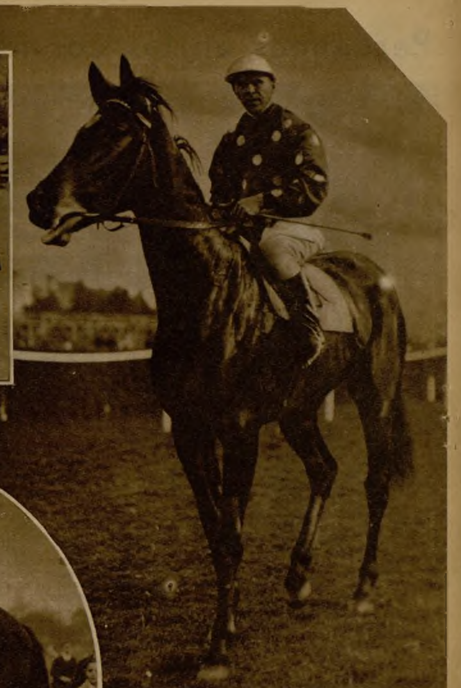
LAS CARRERAS DE LA CASTELLANA. — "Le Vaal" después de ganar la prueba de vallas con que empezó la reunión del domingo.