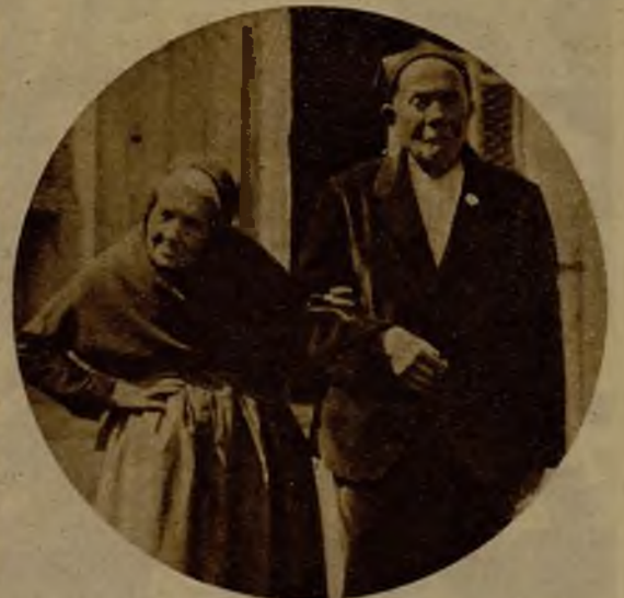
Una pareja interesante de ancianitos, que ha sido agasajada, entre otras muchas