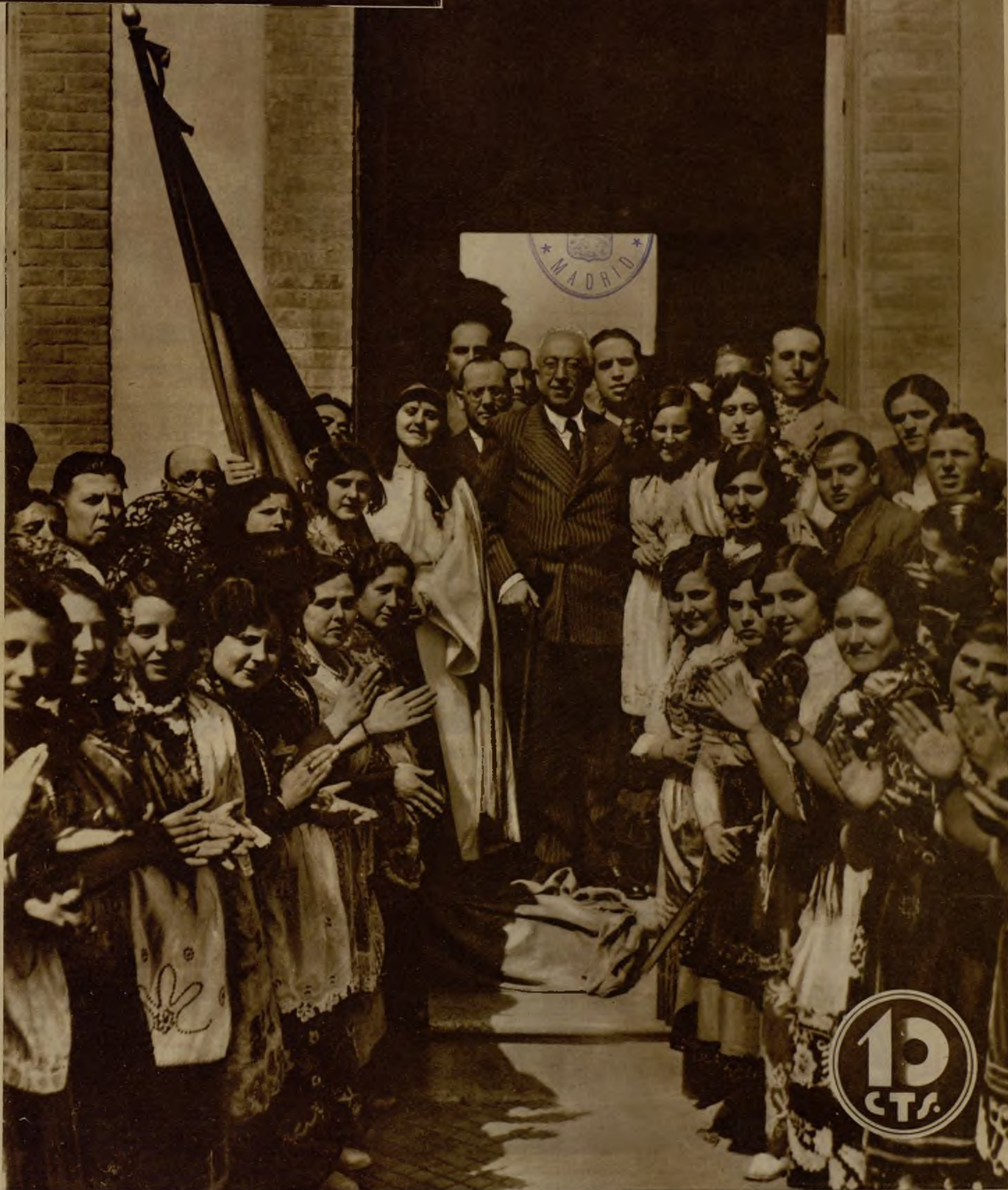
EL VIAJE DEL PRESIDENTE DE LA REPUBLICA. —Una de las más simpáticas notas de adhesión entusiasta recibidas por don Niceto Alcalá Zamora durante su estancia en Murcia se produjo en la visita que hizo ayer a la estación sericícola, donde las obreras, bellamente ataviadas con el vistoso traje regional, le tributaron un homenaje cariñosísimo