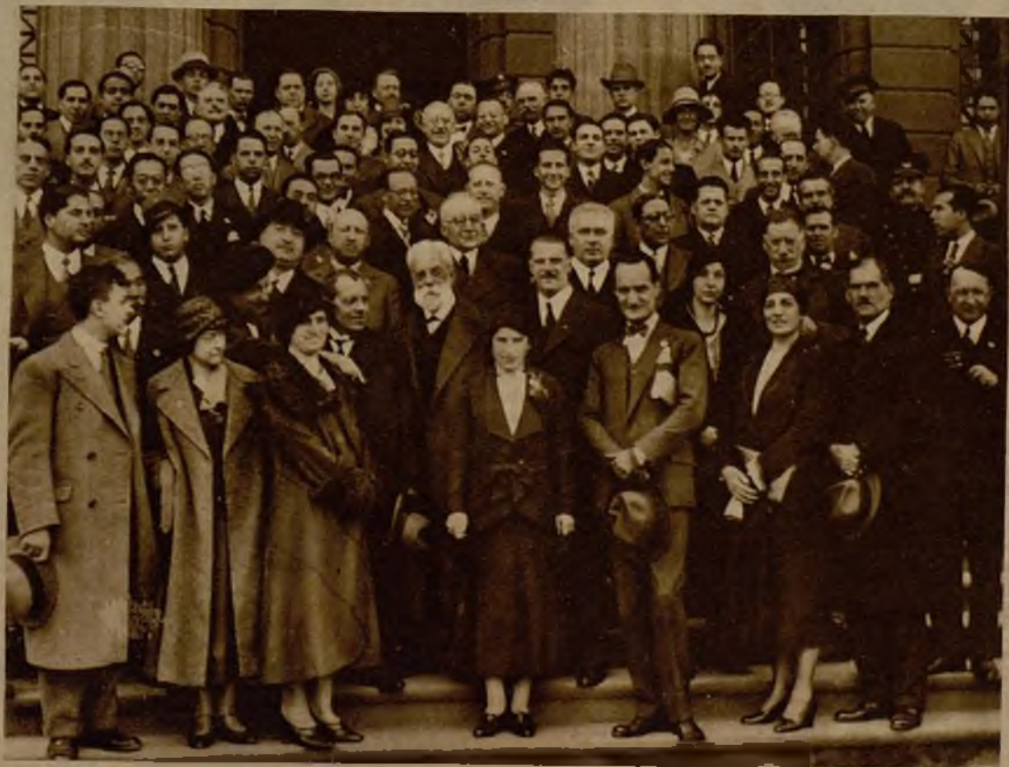
Delegados del Congreso Internacional de Cirugía, que realizan una visita a Barcelona, después de la recepción celebrada en su honor en la Facultad de Medicina