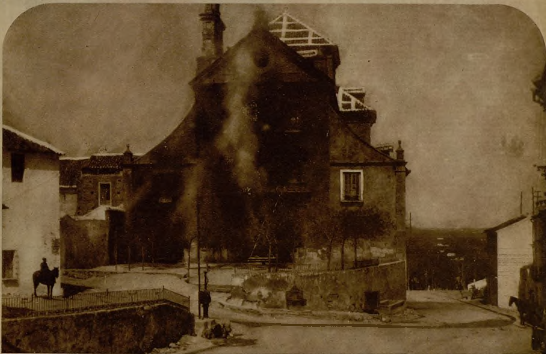
El convento de la Trinidad, que fué incendiado por elementos extremistas durante los sucesos revolucionarios desarrollados en Antequera (Málaga), con motivo de la huelga. La foto está hecha cuando aún no habían terminado los trabajos de extinción del siniestro