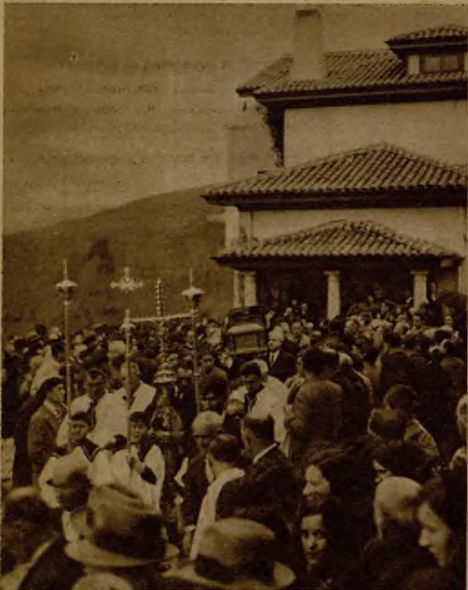
El cadáver del marqués de Valdecilla al salir de la capilla ardiente. Entierro sencillo de un gran bienhechor que desaparece