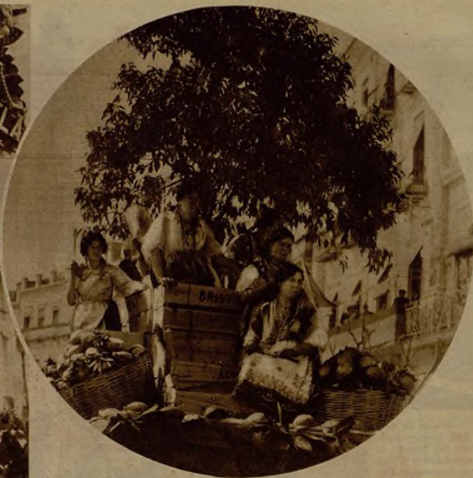
Otra de las típicas carrozas, representativa de la fecundidad de la huerta, en la que figuraban bellas labradoras con los trajes típicos