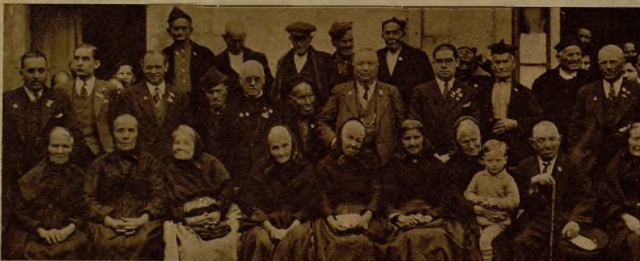
Las autoridades de Las Planas (Gerona) con un grupo de ancianos, a quienes se ha rendido homenaje en la fiesta anual