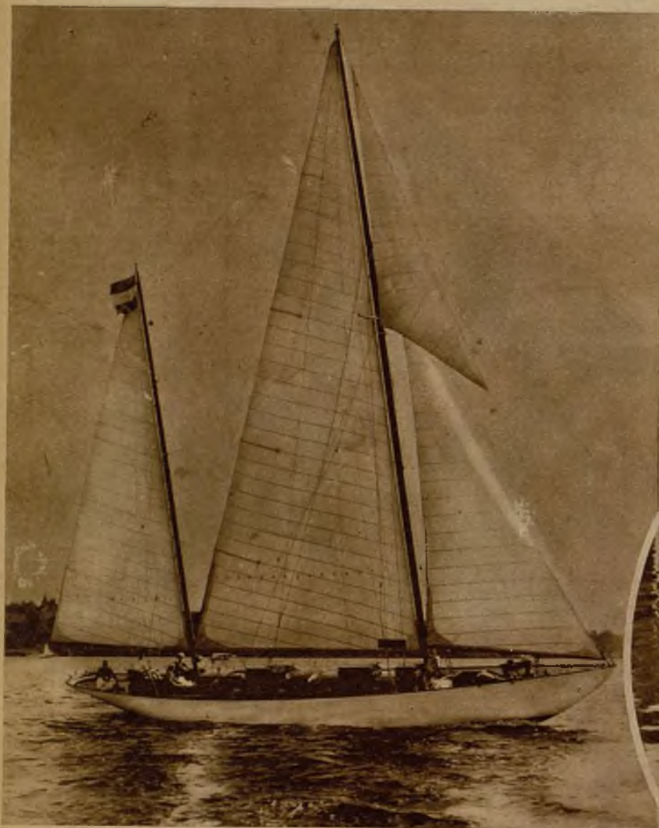
El balandro de noventa toneladas que ha sido adquirido para uso de los deportistas, y que será botado en breve en el estanque de la Casa de Campo