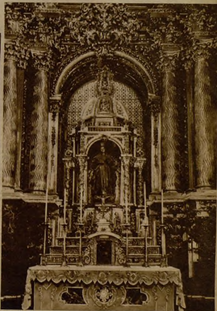
Altar mayor de la iglesia parroquial de Azpeitia (Gulpúzea), cuyo retablo ha sido destruido por un incendio casual. Se han quemado asimismo imágenes de gran valor artístico