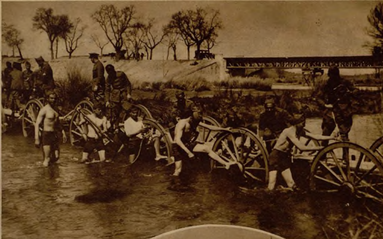
Los soldados de Ingenieros colocan, cubiertos hasta medio cuerpo por el agua, la pasadera de carros para un puente