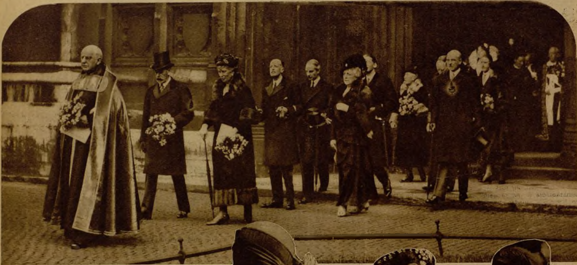
Los reyes de Inglaterra al salir de la ceremonia de socorrer a tantos pobres como años tiene el monarca. El acto se celebra el Jueves Santo en la Abadía de Westminster