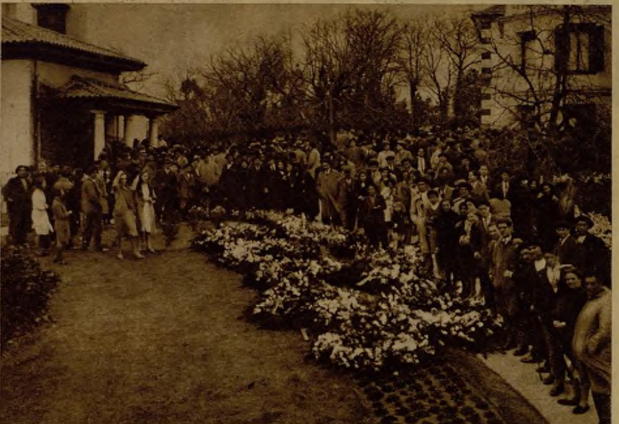
Sobre el césped del jardinillo que rodea la capilla aparecen las grandes coronas con que le rindieron postumo homenaje sus amistades y favorecidos