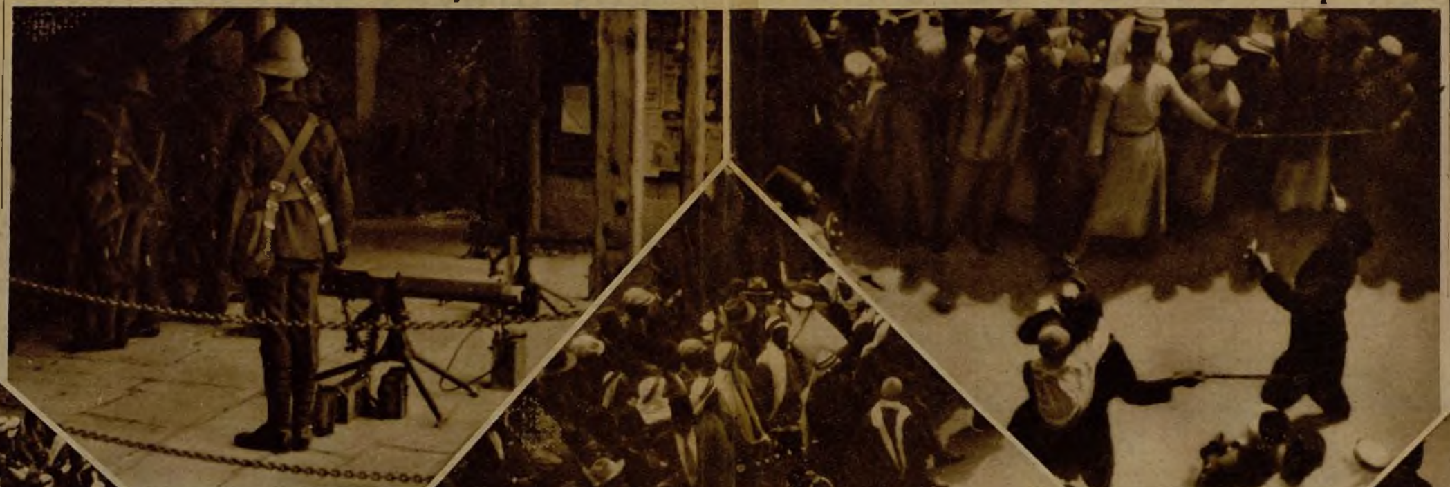
En la puerta de Jaffa la Policía establece previamente su ametralladora.

Los manifestantes gritan. Y cada uno grita por un motivo. El árabe cristiano, por lo extraño de esa alegría despreocupada que el judío lleva a la antes severa y melancólica Jerusalén, y que impele al turista y el estudiante judío a invadir regocijado los Santos Lugares cristianos tan cargados de poca simpatía hacia el hebreísmo. El árabe musulmán, porque sabe que los judíos aspiran a reedificar su Templo sobre la colina en que hoy está la mezquita de Omar, que es la segunda después de la Meca. El árabe ateo, porque le molesta el exclusivismo del judío que se considera pueblo elegido y cree que Dios es sólo para él y no para el español o el francés. El conservador, por ver que la vida judía en Palestina destruye todos los valores tradicionales y especialmente la familia. El revolucionario social, porque ve en la acción