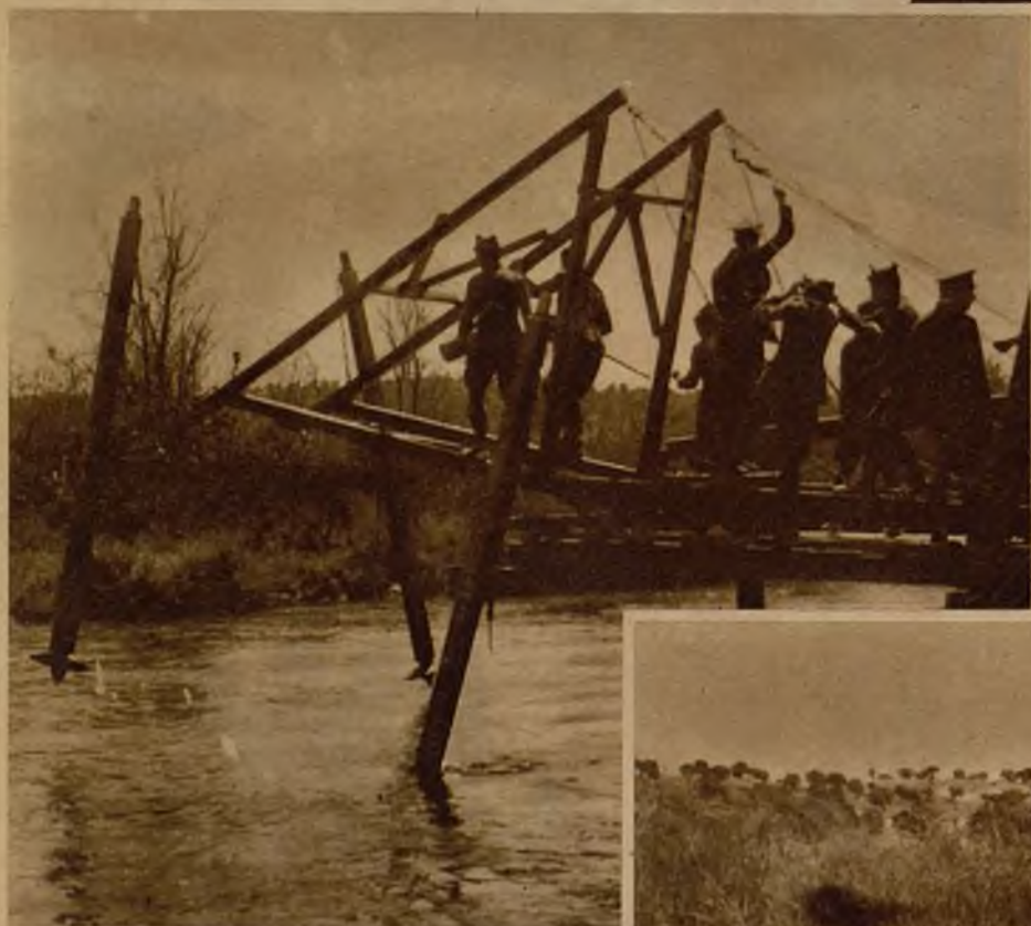
En el río Guadarrama, a la altura de Villaviciosa, se han efectuado interesantes maniobras militares por el batallón de Zapadores Minadores número 1, de la guarnición de Madrid. Una de las más notables operaciones fué la colocación de un puente. La foto reproduce la instalación de uno de los soportes

En brevísimo tiempo, y dando pruebas de gran pericia, los soldados de Ingenieros instalaron esta pasarela de carros sobre el Guadarrama, durante las interesantes maniobras realizadas ayer en Villaviciosa