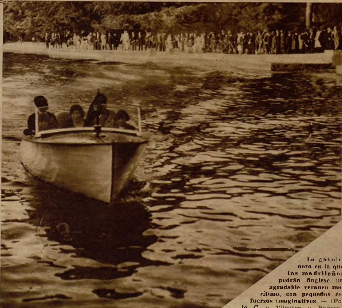
La gasolinera en la que los madrileños podrán fingirse un agradable veraneo marítimo, con pequeños esfuerzos imaginativos.