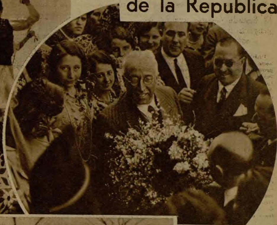
El Presidente de la República recibiendo el homenaje de unos bellos ramos de flores, de manos de las operarias de la Estación Sericícola

Los huertanos de Murcia han hecho objeto al Jefe del Estado de un entusiástico y lucidísimo homenaje. Una profusa cabalgata, en la que figuraban carros artísticamente engalanados, y en los que lucía la belleza de las huertanas, ataviadas con los trajes típicos de brillantes colores, vitoreó a la República y a su Presidente con calurosidad extraordinaria. Véase una de las típicas carrozas ocupadas por labradoras de la huerta, que desfilaron ante el Ayuntamiento, a presencia del señor Alcalá Zamora