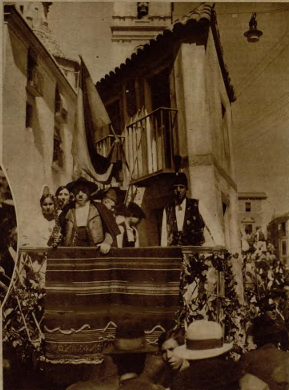
Carroza "Ayuntamiento", que formó parte de la cabalgata "El bando de la Huerta"