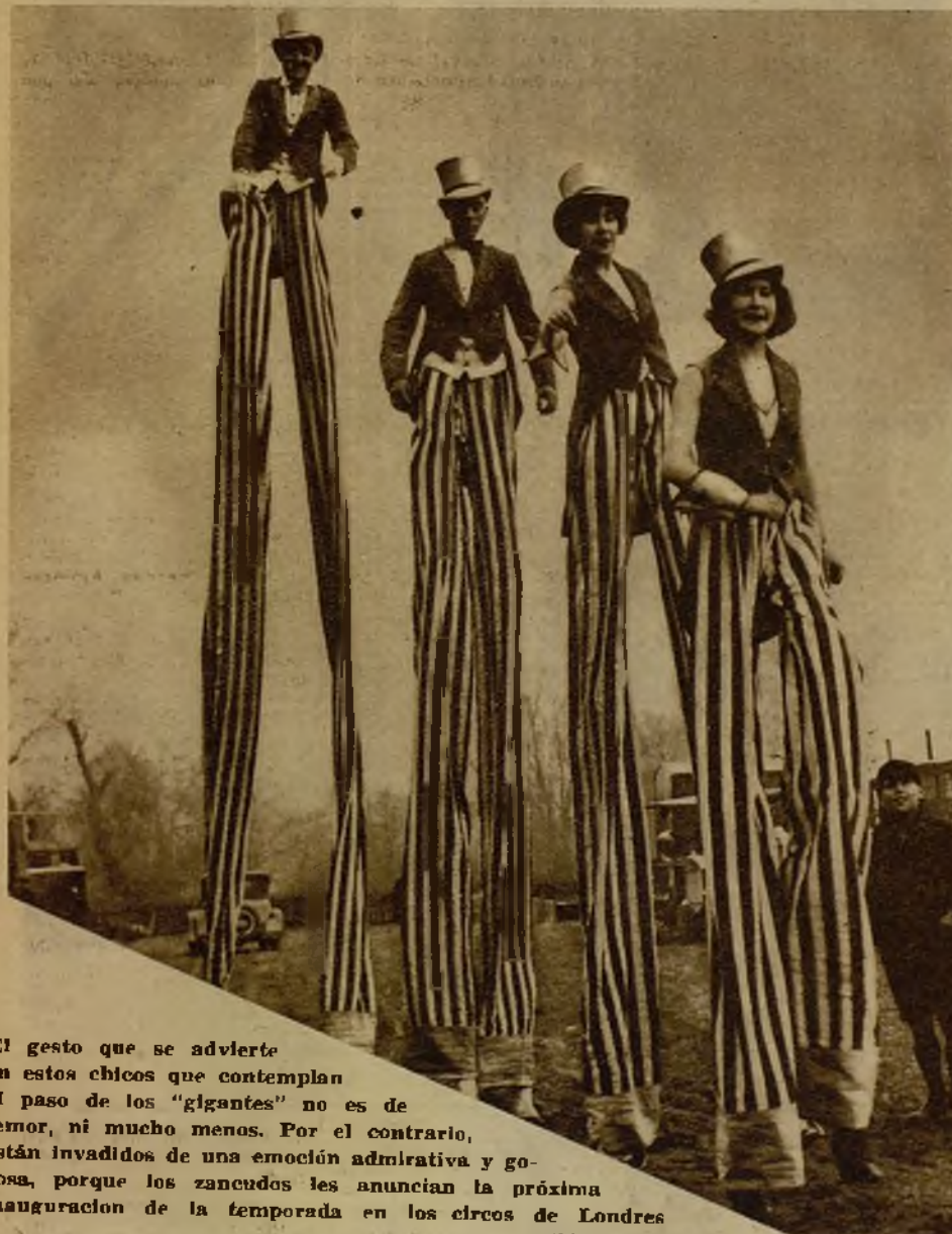
El gesto que se advierte en estos chicos que contemplan el paso de los "gigantes" no es de temor, ni mucho menos. Por el contrario, están invadidos de una emoción admirativa y gozosa, porque los zancudos les anuncian la próxima inauguración de la temporada en los circos de Londres