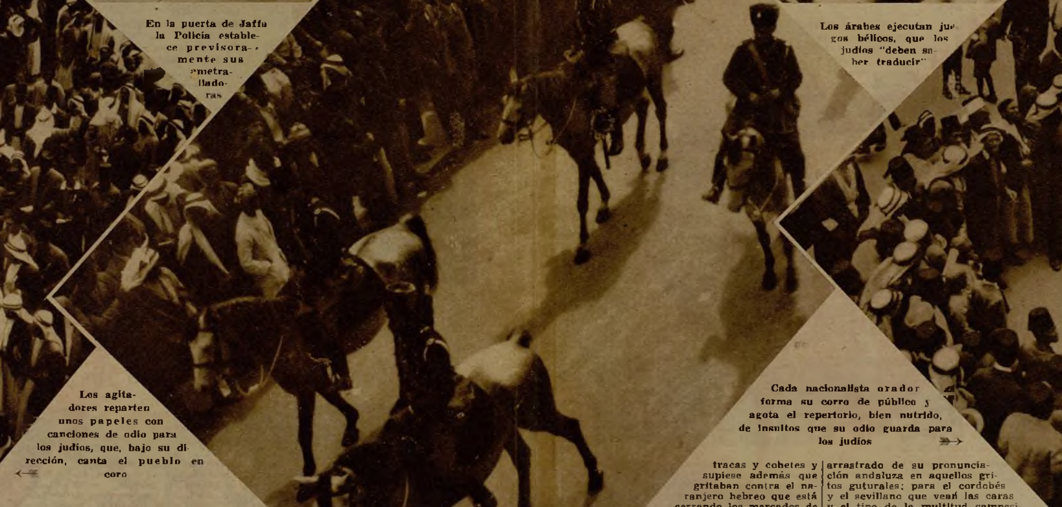
Los agitadores reparten unos papeles con canciones de odio para los judíos, que, bajo su dirección, canta el pueblo en coro.