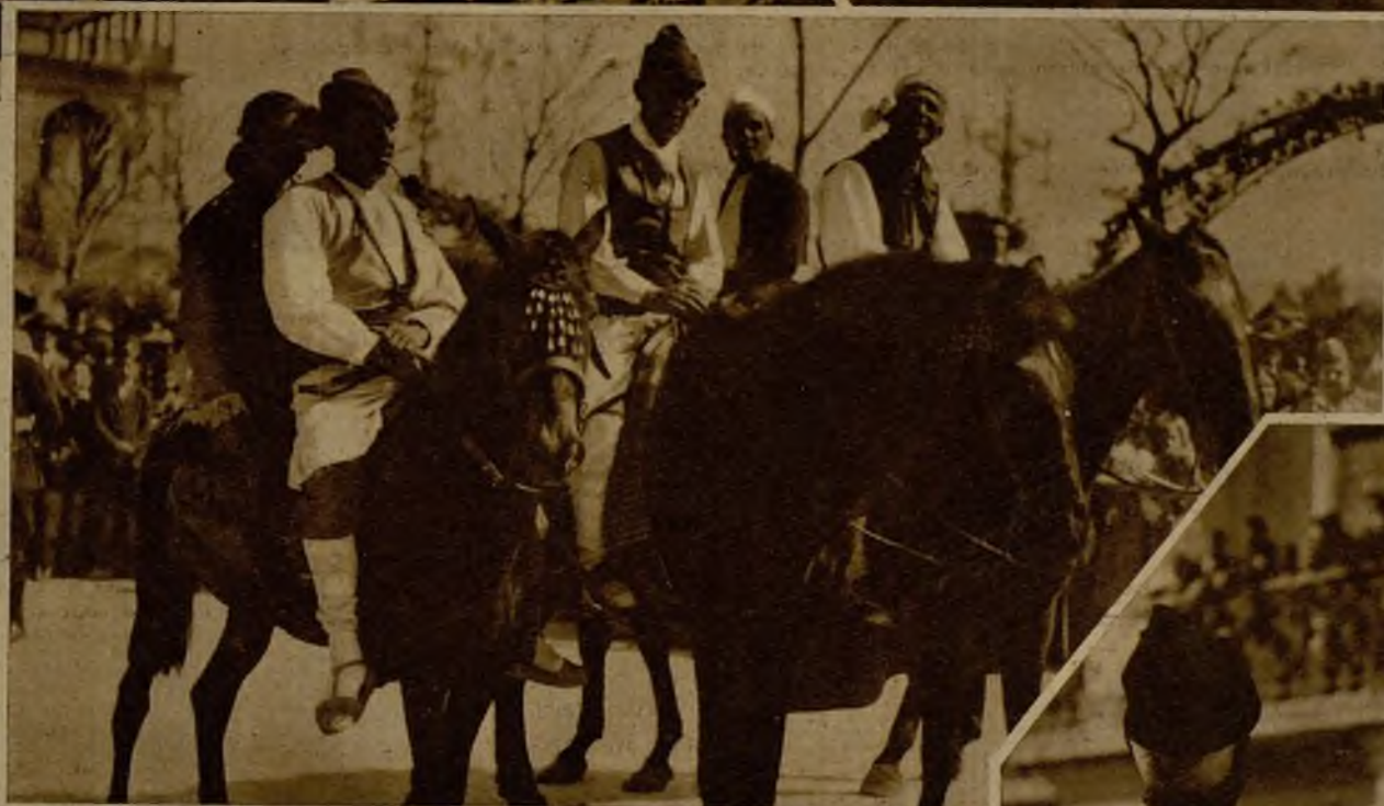
Caballistas de la huerta murciana que, en lucidísimo cortejo, desfilaron ante el Jefe del Estado y le aclamaron entusiásticamente

Los huertanos de Murcia han hecho objeto al Jefe del Estado de un entusiástico y lucidísimo homenaje. Una profusa cabalgata, en la que figuraban carros artísticamente engalanados, y en los que lucía la belleza de las huertanas, ataviadas con los trajes típicos de brillantes colores, vitoreó a la República y a su Presidente con calurosidad extraordinaria. Véase una de las típicas carrozas ocupadas por labradoras de la huerta, que desfilaron ante el Ayuntamiento, a presencia del señor Alcalá Zamora