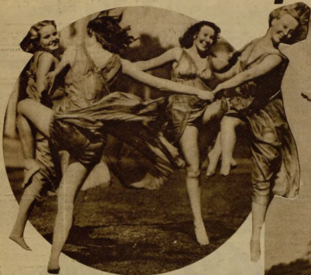
Esta reproducción de un bajorrelieve griego es obra de las alegres muchachas de Los Angeles, que se dedican a la gimnasia rítmica en los jardines del parque de Griffith