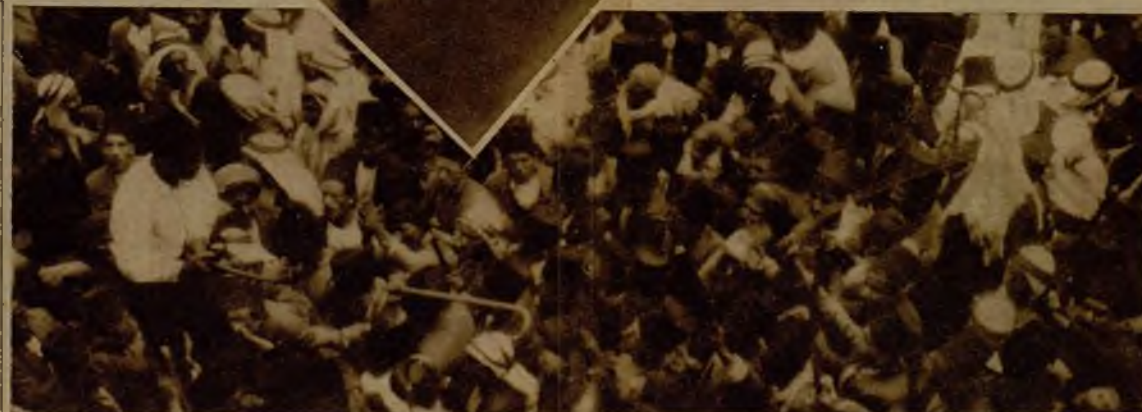
Un orador subido en los hombros del público lanza su catilinaria contra los invasores judíos que se apoderan de su tierra y de su comercio.

En las calles y soldados patrullan por las calles, en previsión—bien motivada—de desórdenes.