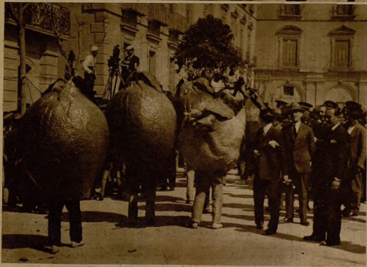
Este original desfile de huertanos, embutidos en los ricos frutos de su tierra pródiga, fué una de las notas más sobresalientes del festejo