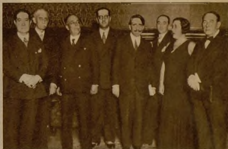
El notable poeta uruguayo Juan Zorrilla San Martín, con las personalidades que asistieron al homenaje celebrado en su honor en el Ateneo