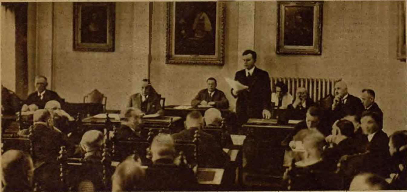
Dos libras y diez chelines reciben los pobres favorecidos con el donativo tradicional que el Jueves Santo ofrece el rey de Inglaterra, y que se extiende a igual número de necesitados que años ha cumplido Jorge V. He aquí a tres de los pobres socorridos este año