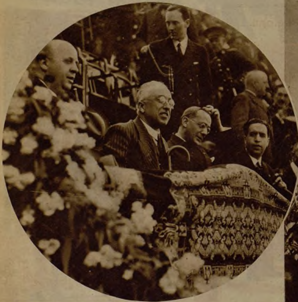
El Presidente de la República presenciando el partido de fútbol Athlético de Madrid-Murcia