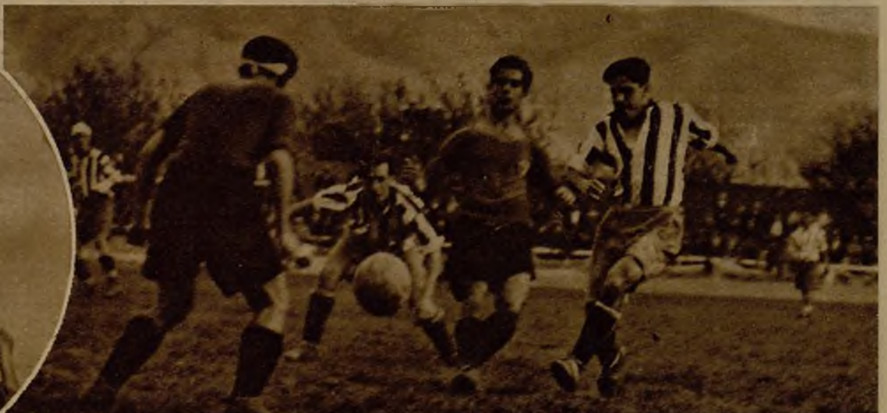
Dos momentos del encuentro de fútbol correspondiente al campeonato de Liga, celebrado entre el Murcia y el Athletic madrileño, en el campo de la Condomina. Este partido, suspendido el domingo, tuvo lugar ayer, con asistencia del Presidente de la República, y en él fué derrotado el equipo del centro por cuatro tantos a cero