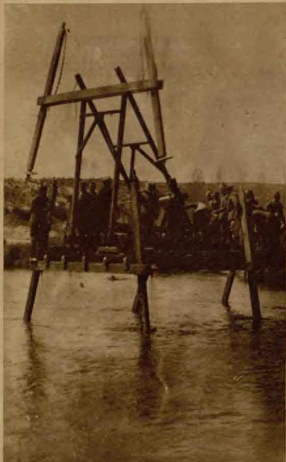
Un episodio de los ejercicios. Los soldados han colocado ya los puntales de uno de los soportes y se preparan para reforzarlo con viguetas