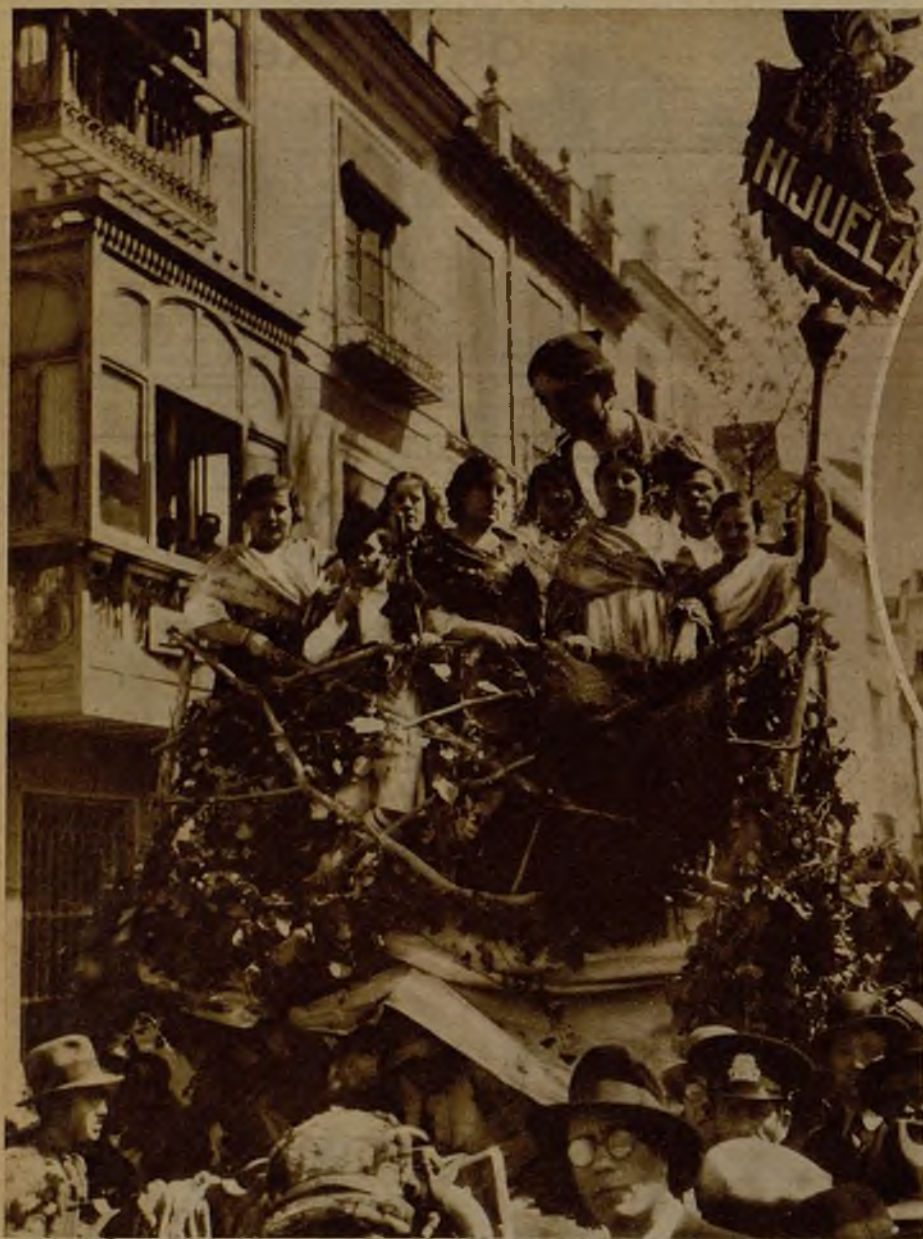
Carroza titulada "La hijuela", ocupada por bellísimas murcianas, que formó en el cortejo popular en honor del Presidente