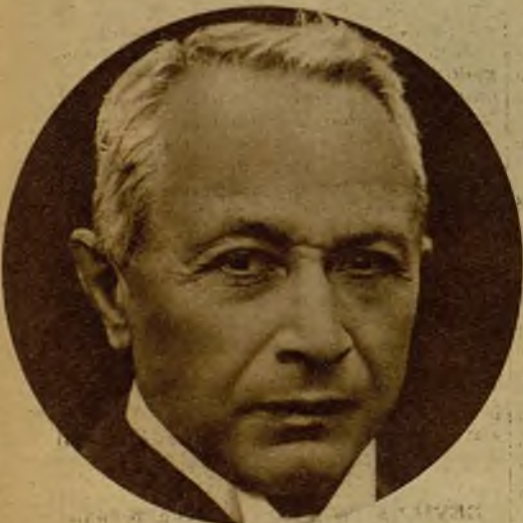
La famosa Casa Junkers, constructora de aeroplanos, se ha declarado en quiebra. He aquí a su director, Hugo Junkers