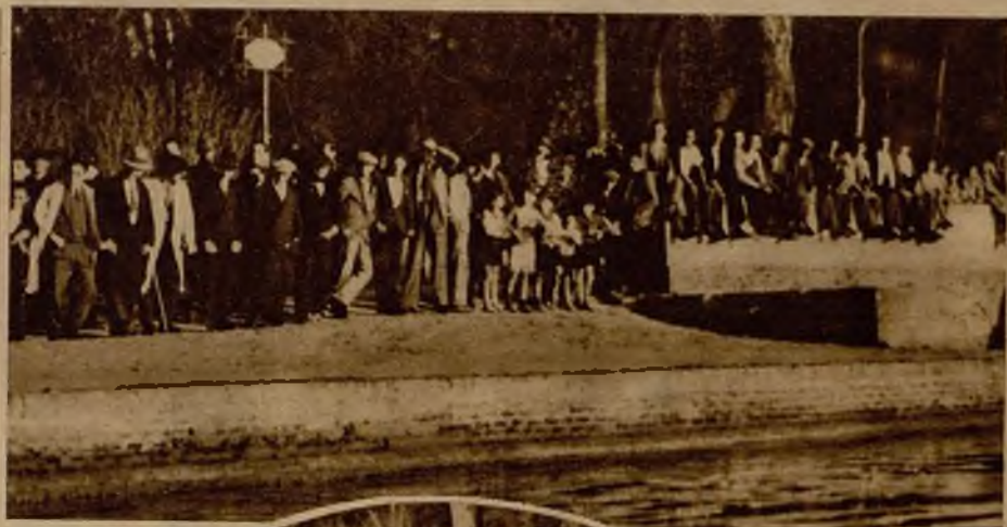
El público contempla el lugar de sus próximas expansiones veraniegas