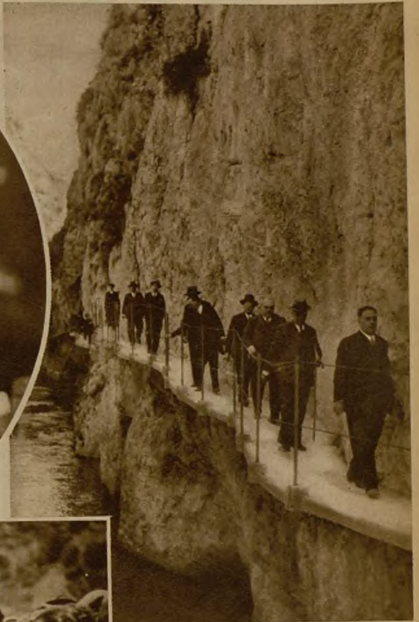
El Jefe del Estado durante la visita al pantano de Camarillas, recorriendo los lugares en que han de efectuarse las próximas obras, que colmarán una legítima aspiración de la provincia de Albacete y proporcionarán, además, los medios de remediar la aguda crisis obrera. El señor Alcalá Zamora pronunció en el acto de la inauguración oficial de las obras un elocuentísimo discurso, y fué objeto durante la ceremonia de calurosas ovaciones