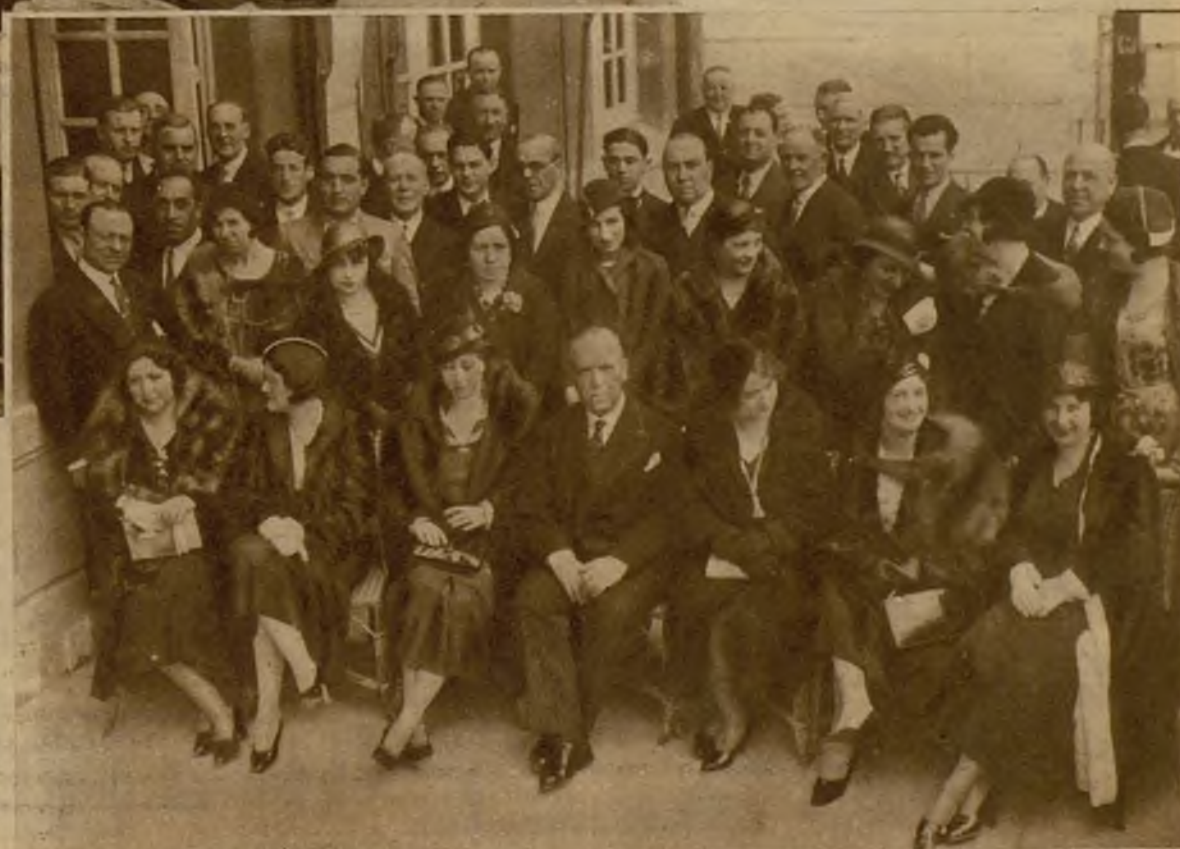
Nuestro embajador en Lisboa con los concurrentes a una fiesta celebrada en su honor con motivo de la inauguración de la Casa de España en la capital portuguesa