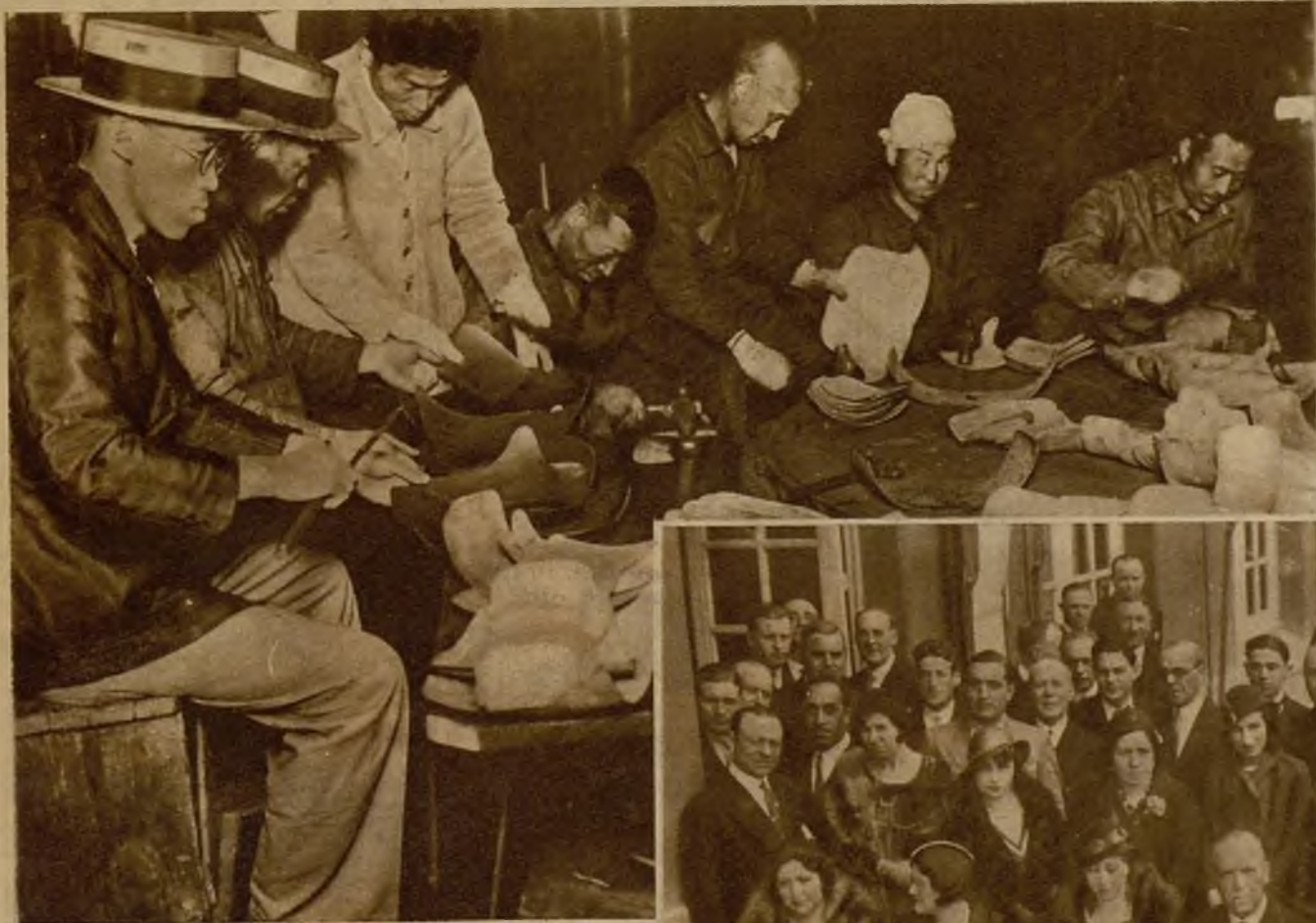
En vista de la frecuencia con que en el Japón se producen los atentados políticos, se ha convertido en una fructífera industria la construcción de petos y corazas, que colocan a un japonés en ropa interior con la apariencia de un personaje medieval fugado de un cuadro