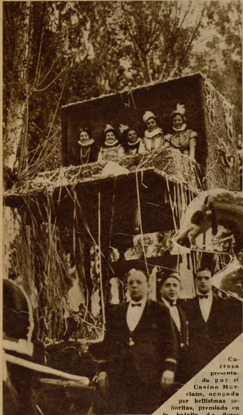
Carroza presentada por el Casino Murciano, ocupada por bellísimas señoritas, premiada en la batalla de flores