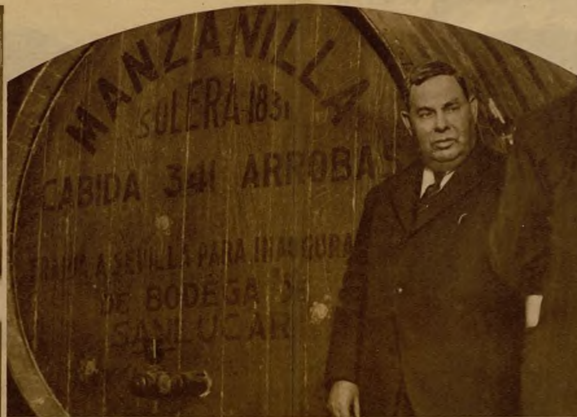
Trescientas cuarenta y una arrobas contiene esta bota, formidable cantera de coplas flamencas y de peregrinos dandares. "¿Que no es la más grande del mundo?... ¿Pero usted que sabe, cristiano?..."