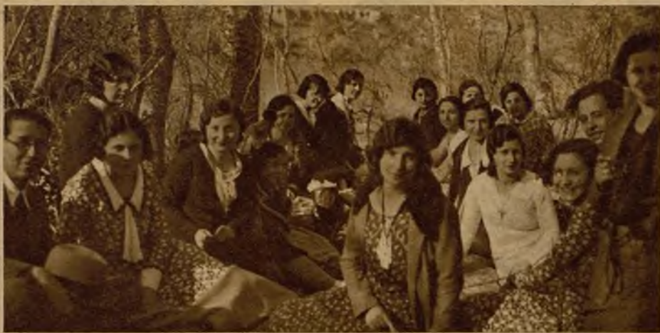
Grupo de señoritas celebrando la Pascua en Caspe (Zaragoza), en las inmediaciones del Ebro