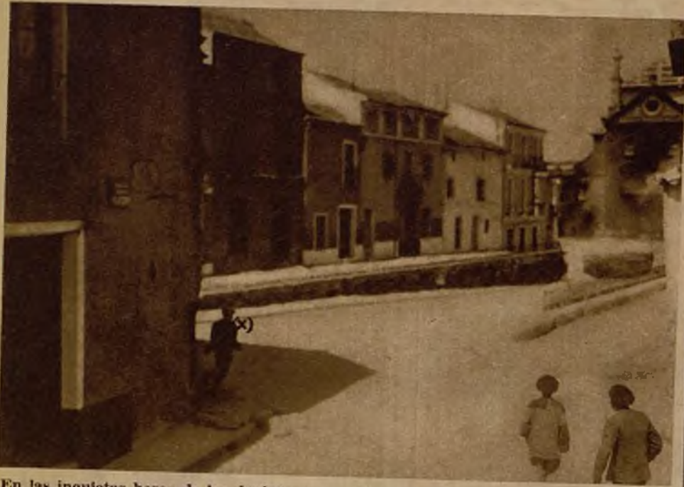
En las inquietas horas de los desórdenes revolucionarios, el vecindario cerró las puertas de las casas. El individuo (x) a quien se ve en la foto corriendo para atravesar la calle es uno de los perturbadores, que a los pocos momentos fué muerto en el tiroteo