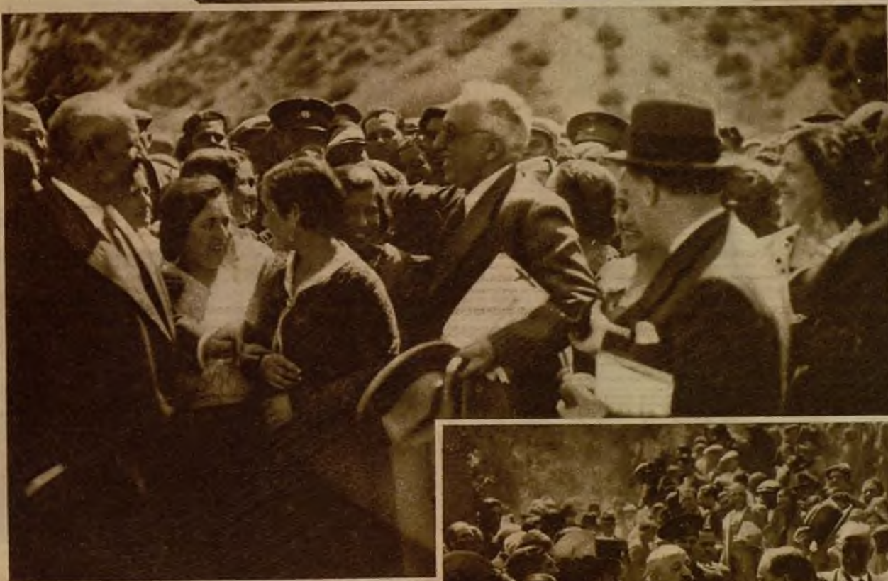
Como en todos los lugares del itinerario del viaje presidencial, el pueblo ha dado, en la persona del Presidente, amplias muestras de adhesión a la República. Durante la estancia del señor Alcalá Zamora en Cleza, y en la inauguración de las obras del pantano, la multitud le hizo objeto de incesantes aclamaciones