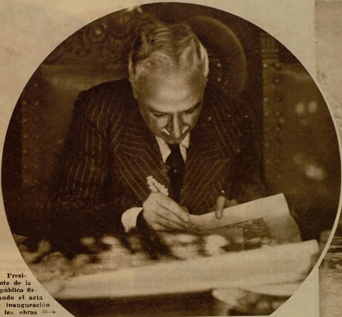
El Presidente de la República firmando el acta de inauguración de las obras →