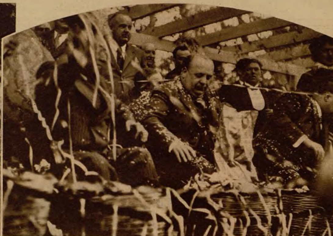
Más de veinte mil personas presenciaron la brillantísima batalla de flores, celebrada con animación imponderable, y en el desfile figuraron veintuna carrozas, de artística decoración y adornadas con fantástico lujo de flores naturales. Bellísimas señoritas murcianas completaban el cuadro de modo magnífico. El ministro de Obras Públicas, señor Prieto, que presenció el soberbio desfile, fué objeto durante el mismo de nutridas ovaciones, presenciando el paso de la cabalgata