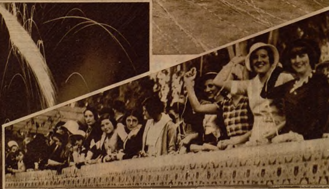
Fantástico aspecto que ofrecían las iluminaciones y las tracas, en las fiestas con motivo del viaje presidencial