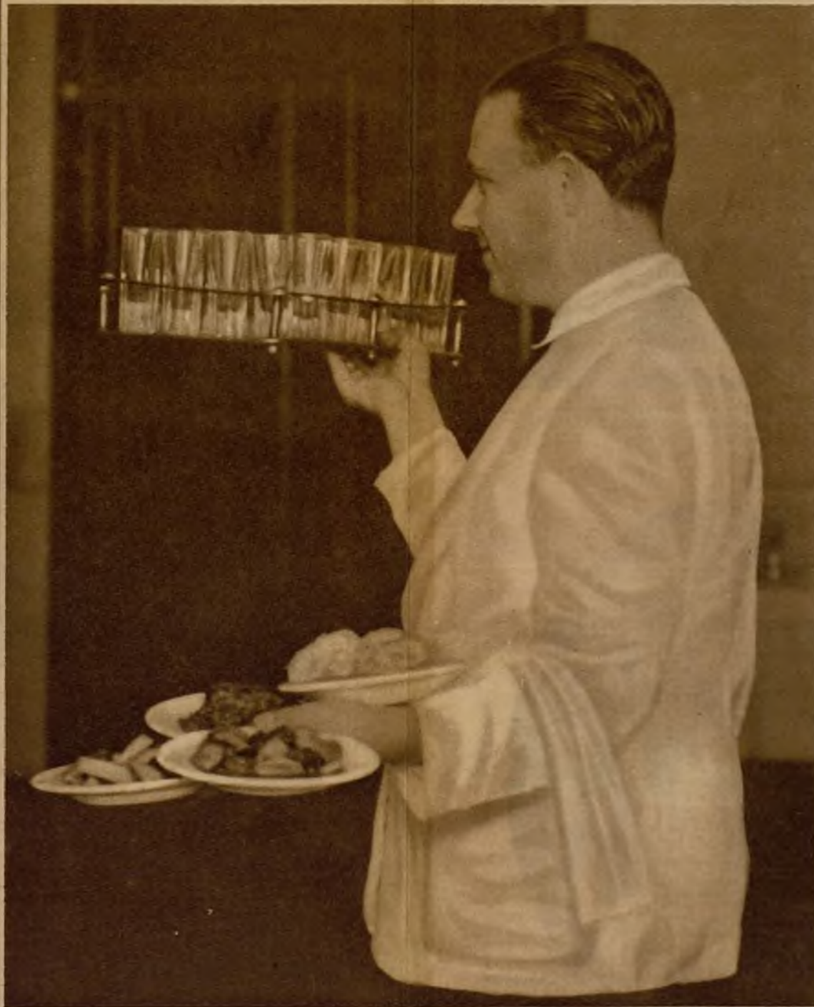
¡Ah! va, para alegrar a la reunión, su "mersé" la cañera de veinticuatro "cañas", acompañada del cortejo de "tapas" múltiples: carne, cazón, calamares, paella, bacalao!...