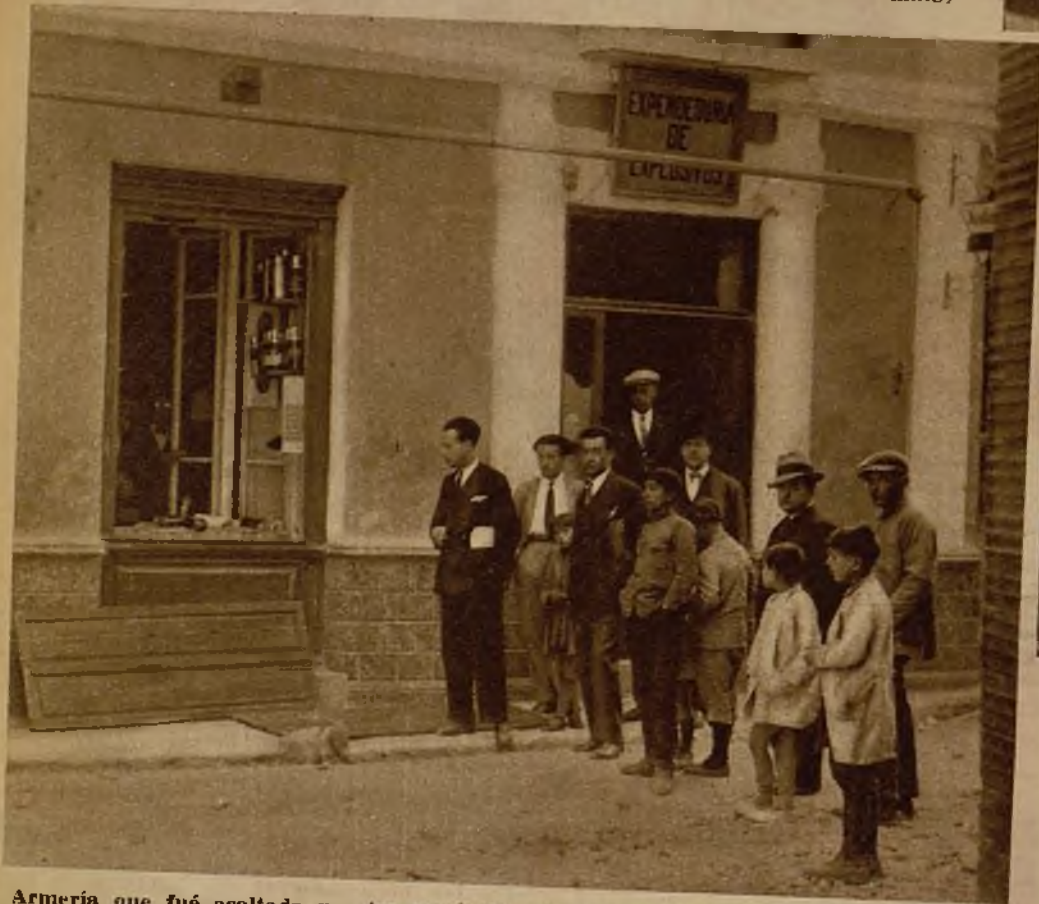
Armería que fué asaltada por los revolucionarios, que se llevaron numerosas armas y produjeron daños en el establecimiento