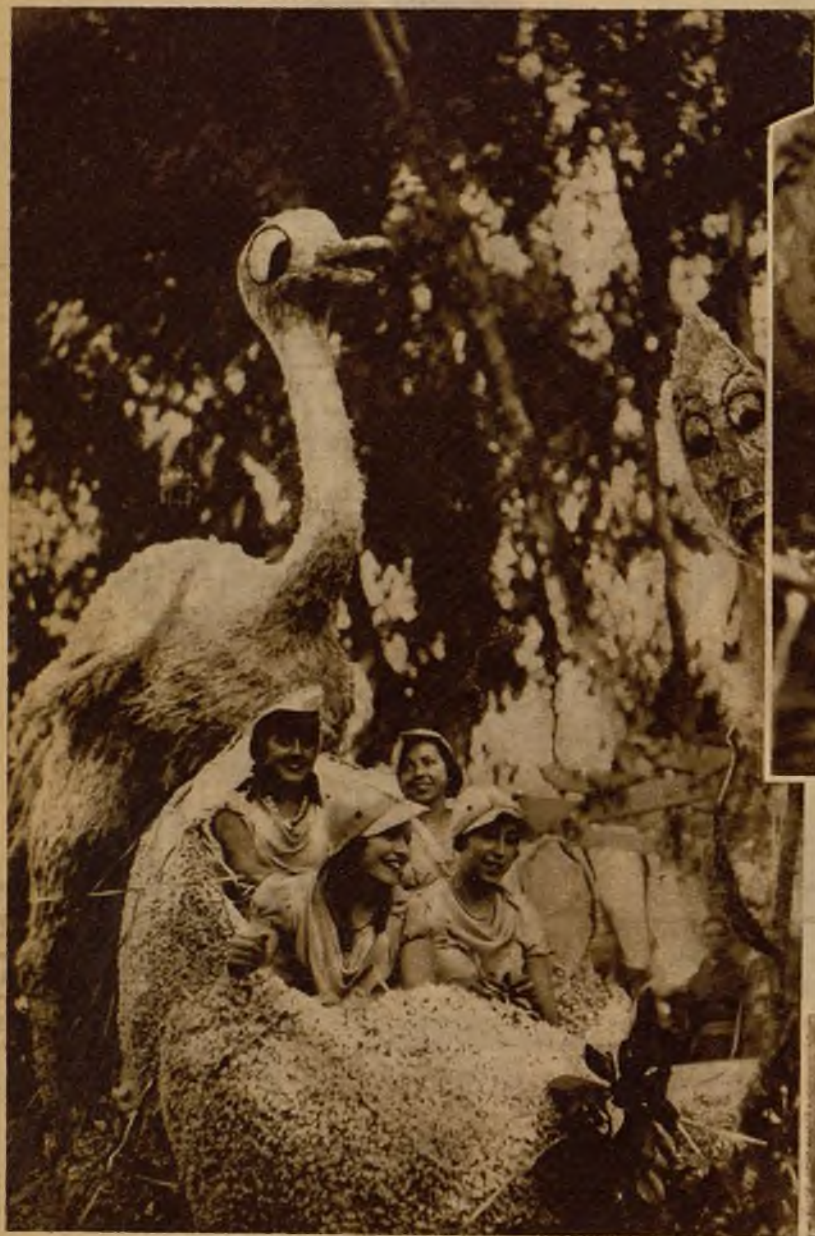
La batalla de flores celebrada en Murcia, con motivo de las fiestas primaverales, ha revestido este año excepcional brillantez, con motivo de la estancia del señor Alcalá Zamora en la bella capital. Una de las artísticas carrozas adornadas