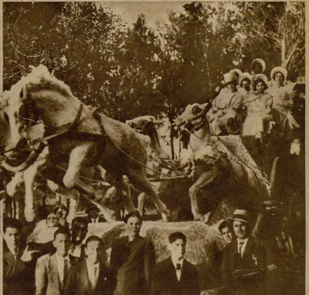
Magnífica carroza presentada por los señores de Gómez, a la que se concedió el premio de honor