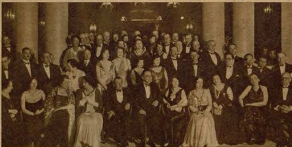
Concurrentes al banquete organizado por la Generalidad y Ayuntamiento de Barcelona en honor de los congresistas de la Sociedad Internacional de Cirugía