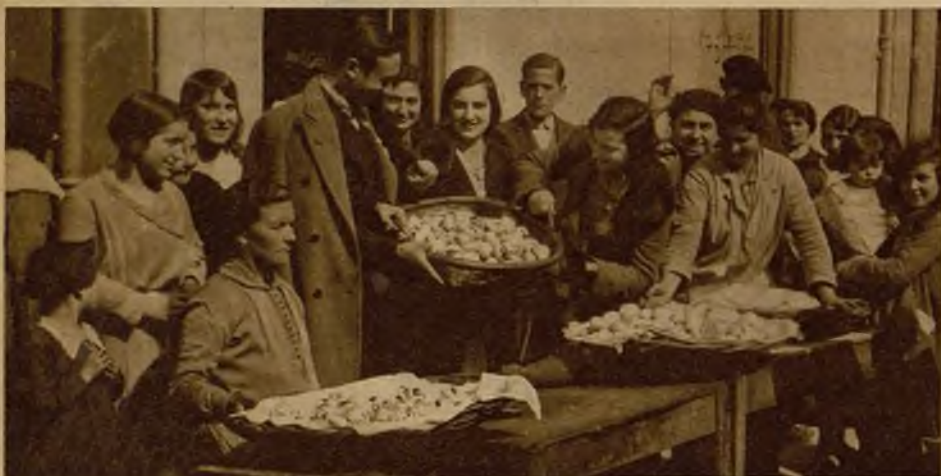
La tradicional romería de los "Huevos pintos", que se celebra anualmente en Pola de Siero (Oviedo)