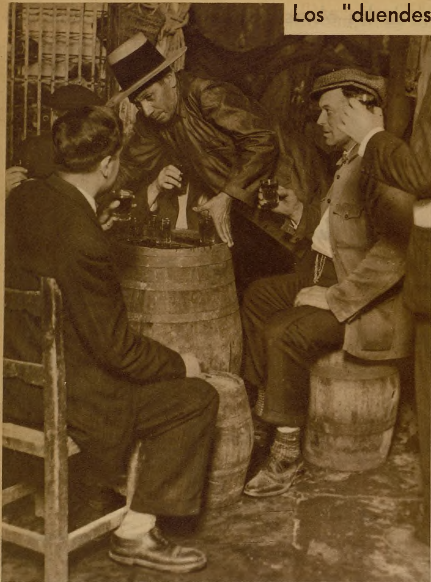
Lo mismo que los "manzanilleros" dedican su rato por la tarde a expansionar el ánimo con unos "chatos", los obreros, los artesanos, tienen su alegre refugio, que no necesita más decoración que un barril y unas sillas de anas. Y, con perdón del sabor, también unos tintos de Valdepeñas son base suficiente para una reunión de "amiguitos leales"