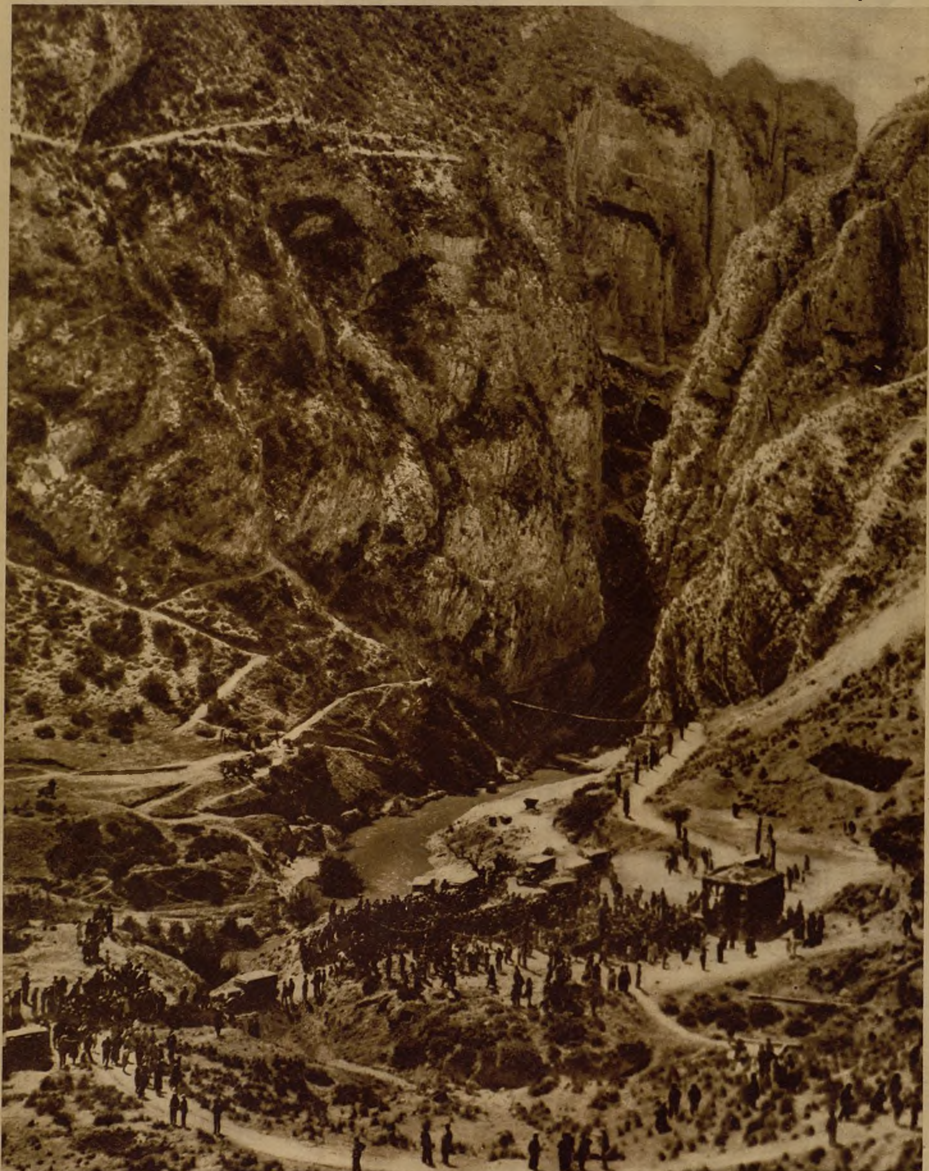
Soberbio aspecto del pantano de Camarillas, durante la visita del Presidente de la República y del ministro de Obras Públicas, con motivo de la inauguración oficial de las obras. Los visitantes recorriendo el lugar del emplazamiento .