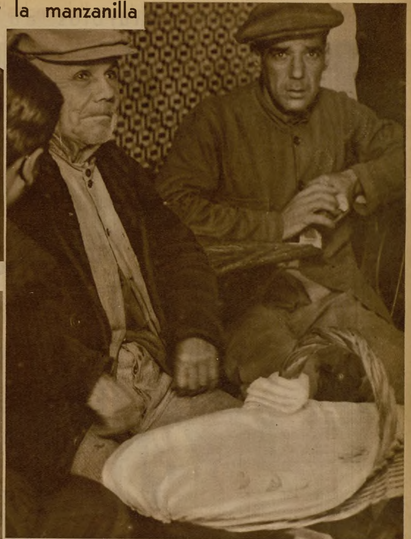
"¡Camarones, gambas, cangrejos, mojama! ¡Bocas "güenas" de la Isla!" El "marisquero" recorre los establecimientos, dejando en manos de los bebedores de manzanilla sus "tapas" sabrosas. Tienen la ciencia del regateo, y será difícil predecir cuál será el precio definitivo de la venta. Todo depende del "salero" que el cliente ponga en la discusión... y de las "medias cañas" que lleva tomadas el hombre de los mariscos

Era una noche en Las Delicias, y otra en la Venta de Eritaña, y otra en un ventorrillo de la carretera de Alcalá o de San Juan de Aznalfarache, donde aquel indiano desgarrado y "mal ángel" se las pasaba de claro en claro, como gallina en corral ajeno, entre una turba de flamencos y gitanos, oyendo cantar y tocar la guitarra, sin mostrar entusiasmo ni aspasientos, sin mirar a las caras de las mocitas, atento sólo al revuelo de los farfanes de sus vestidos de colorines y a la trama que, como lanzaderas, tejían y destejían los "pinreles" de las bailadoras de talle de aviapa o de pucheros lebrerianos. ¡Qué mas daba! Oír y ver. Aquel hombre frío, impasible; con chaqué de cola de pato, bombín café de grandes alas abarquilladas, bastón de caña de indias, sol mejicano rodeado de brillantes, pendiente de la gruesa cadena del reloj; valiosa tumbaga en el meñique de la mano izquierda, magro, lar-