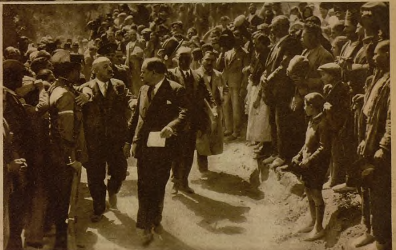
Momento de la llegada del Presidente al pantano de Camarillas. La multitud, difícilmente contenida, le rodeó entusiastamente →