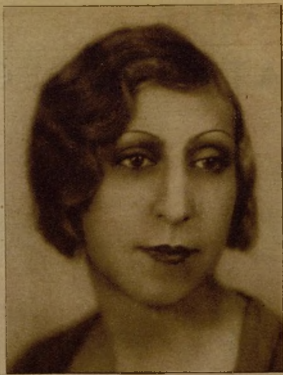
La ilustre escritora Magda Donato, que ha realizado en "Cómo vive la mujer en Cataluña" uno de sus más brillantes reportajes.