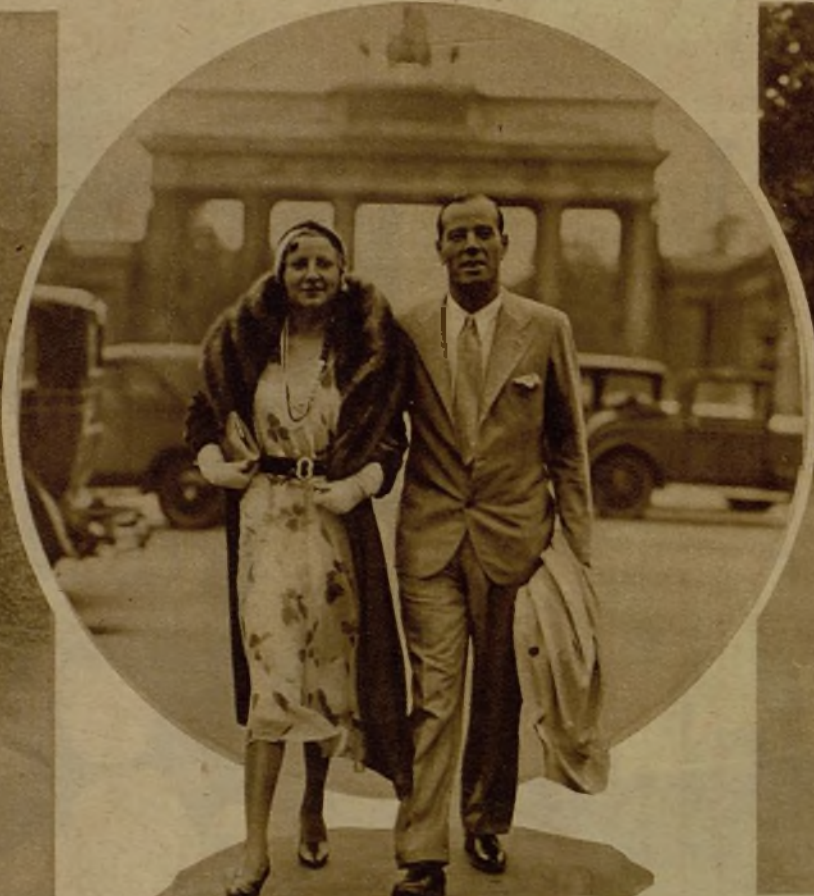
El popularísimo guardameta del equipo español de fútbol, Ricardo Zamora, ha conseguido ratificar en Centroeuropa su clase excepcional. Helo aquí paseando por Berlín, en compañía de su bella esposa