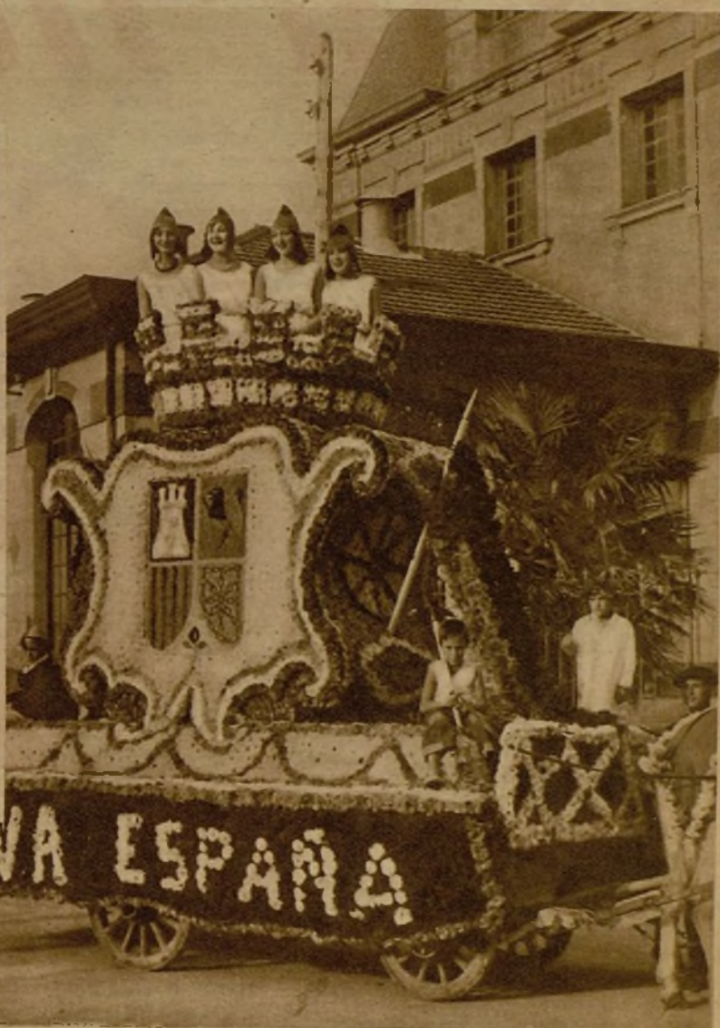
El Jurado que recibió la facultad de otorgar los premios en el concurso de carrozas de Laredo se vió en un duro trance. Las muchachas que las ocupaban ejercían una coacción evidente. Al fin logró colocarse en el justo medio, y otorgó el primer premio a ésta, representativa del escudo de España, en la que están a tono el gusto artístico ornamental y la belleza de sus cuatro republicanas ocupantes