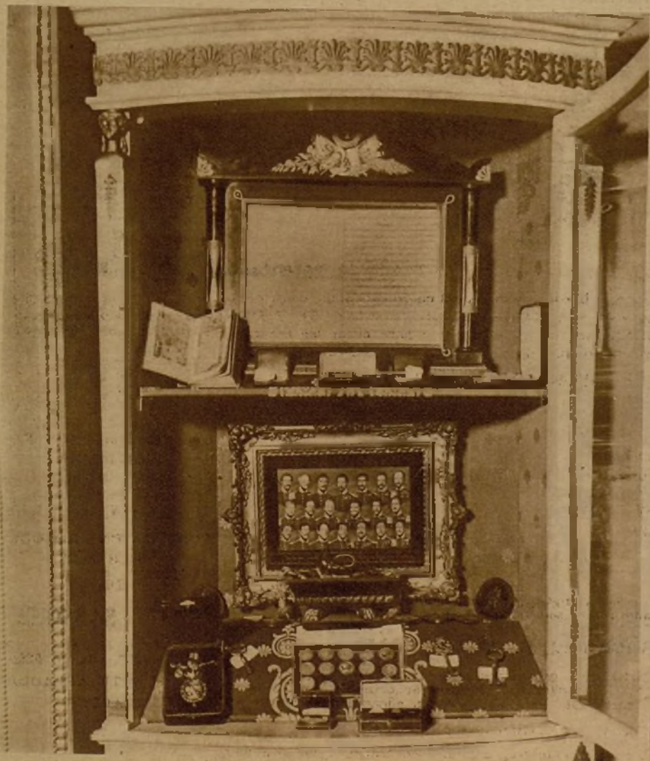
Una interesantísima vitrina, que figura en el salón del presidente de la Cámara, y en la que se guardan valiosos documentos históricos

Y terminamos. El señor San Martín nos perdona... No le hemos dejado vivir tranquilo en toda la mañana. Menos mal que nos hacemos la reflexión de que con las Cortes abiertas sus demás momentos tampoco deben ser muy tranquilos.