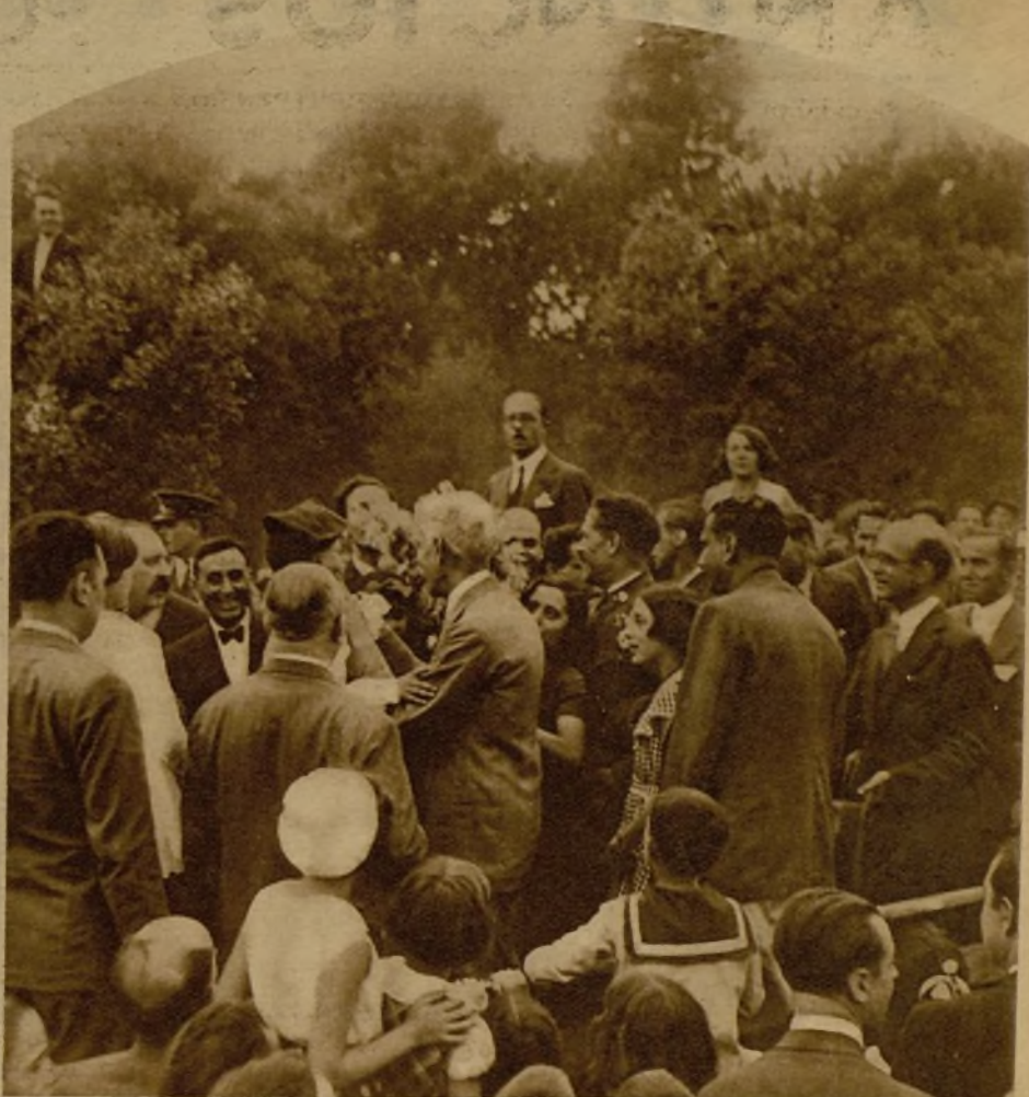
En Cardedeu se ha celebrado una lucida fiesta de aviación, a la que ha asistido el presidente de la Generalidad Catalana. He aquí al señor Maciá recibiendo el homenaje del pueblo