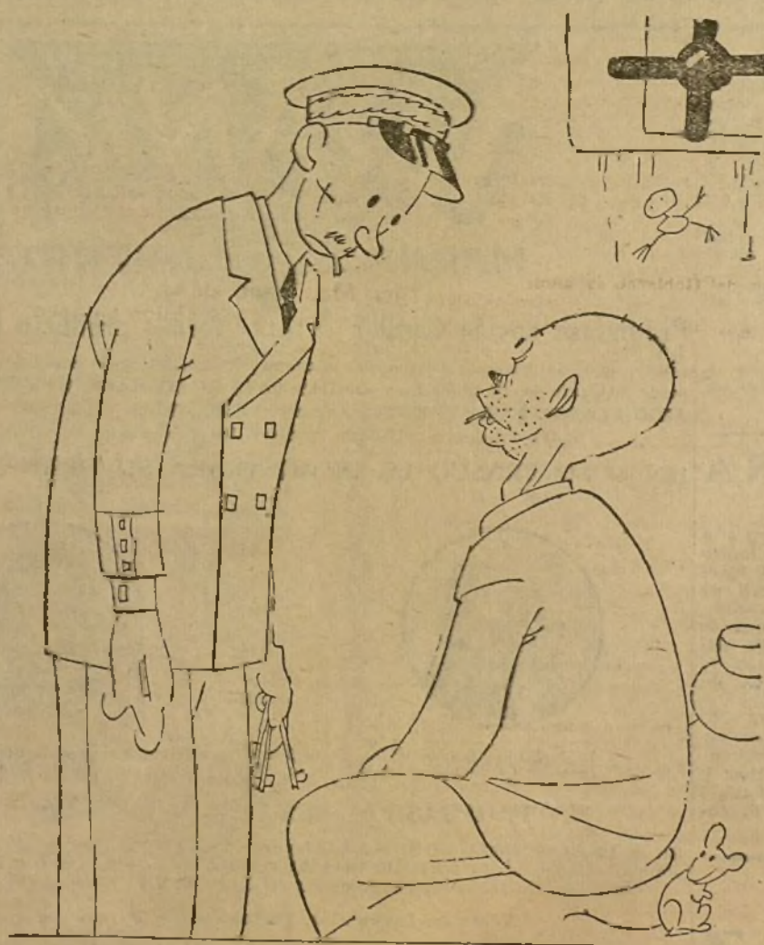
EL CONDENADO A MUERTE, por K-HITO

BERLIN, 1.—El Reichsbank ha rebajado el tipo de descuento del 10 al 8 por 100 y el de anticipos sobre títulos, del 12 al 10 por 100.—Fabra.