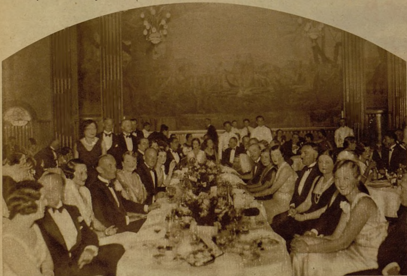
Comida de gala en el Miramar. El ministro de Hungría, señor Hevesy de Heves, antitrión del embajador de Alemania, de los embajadores de Italia en Madrid, y de otros diplomáticos y altas personalidades