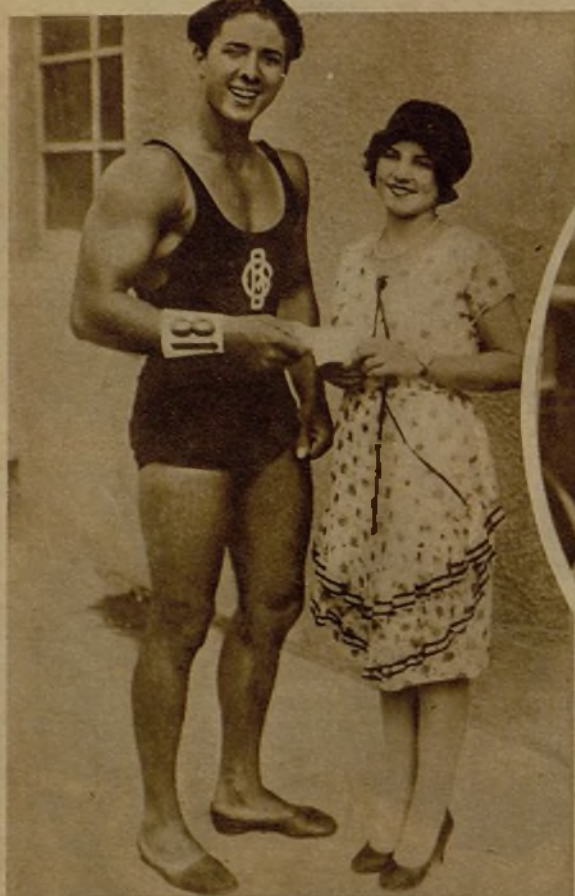
Muy lamentable, definitivamente lamentable, que haya concursos de belleza masculina... Este joven de Venice (California) ha obtenido el primer premio en una disputada competición. Bonitos que los hay.