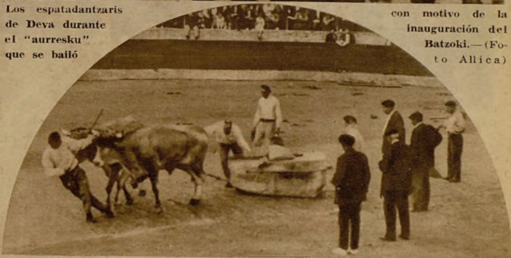
La pareja de bueyes de Berrin, vencedora en el concurso de arrastre de peso, celebrado en la Plaza de Toros de Eibar