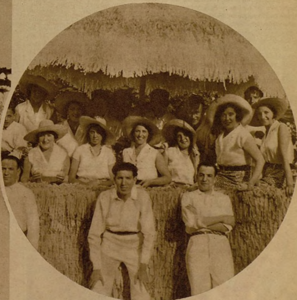
No vienen del campo, ni han cortado una espiga siquiera. Pero sus sombreros de palma y el exorno de la carroza dicen que sí. No les llevemos la contraria, y declarémoslas segadoras honorarias