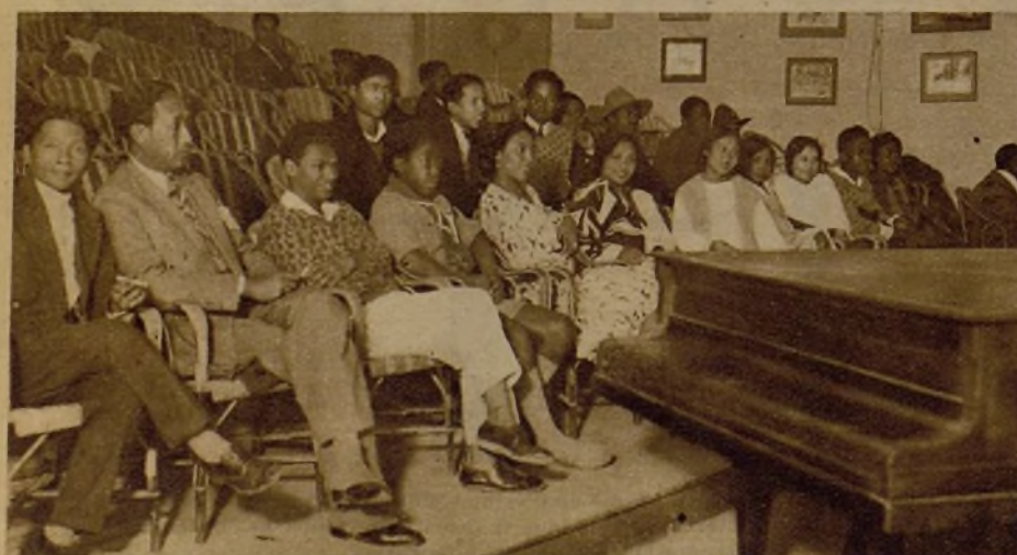
Una sala de espectáculos donde no abundan los blancos