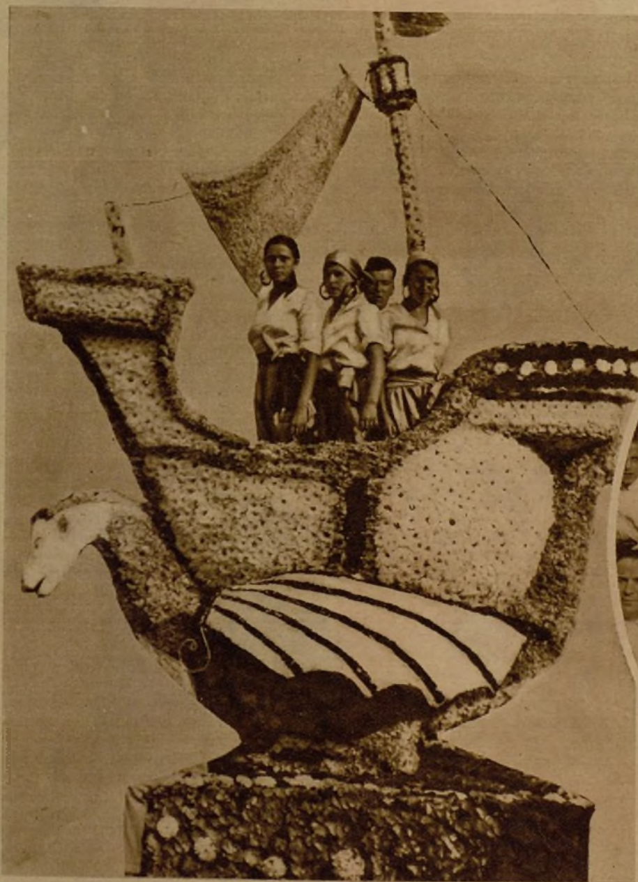
Esta carroza obtuvo el tercer premio en la batalla de flores de Laredo. Original y artística, sin duda. Pero avalorada, sobre todo, por estas tres argonautas, dignas de descubrir Américas