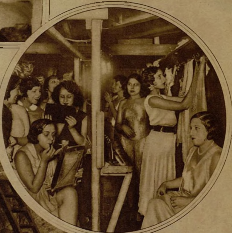
En un teatro del Paralelo: las chicas se preparan para salir a escena.

"Las terribles comunistas". "La mujer del nuevo diputado".