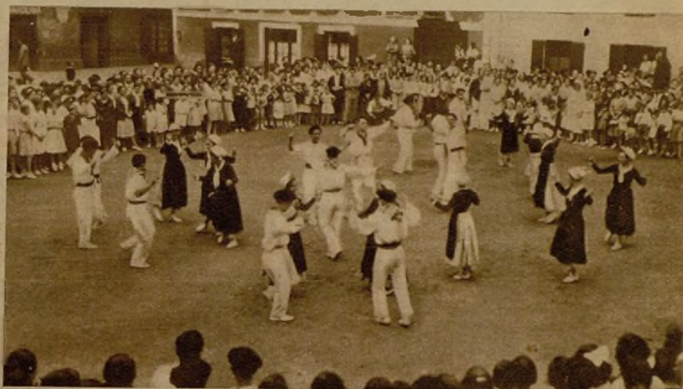
Los espatadantzaris de Deva durante el "auresku" que se bailó