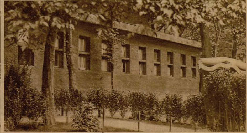
El teatro Malgache, de París, visto desde fuera