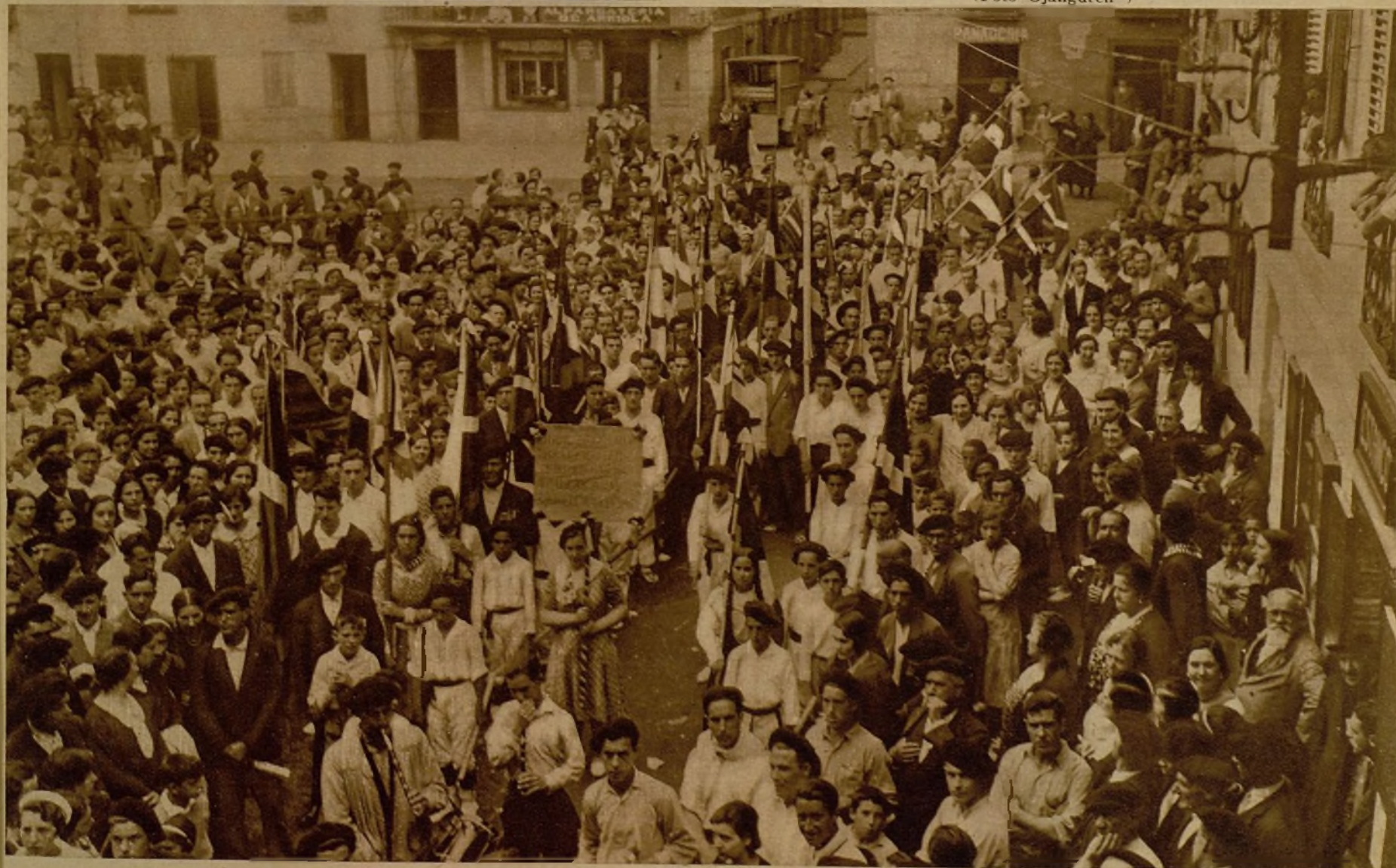
En Deva se ha celebrado, con gran brillantez, la inauguración del Batzoki. He aquí a los mendigoizales, con sus banderas, al regreso de una asamblea que celebraron en Xeiur