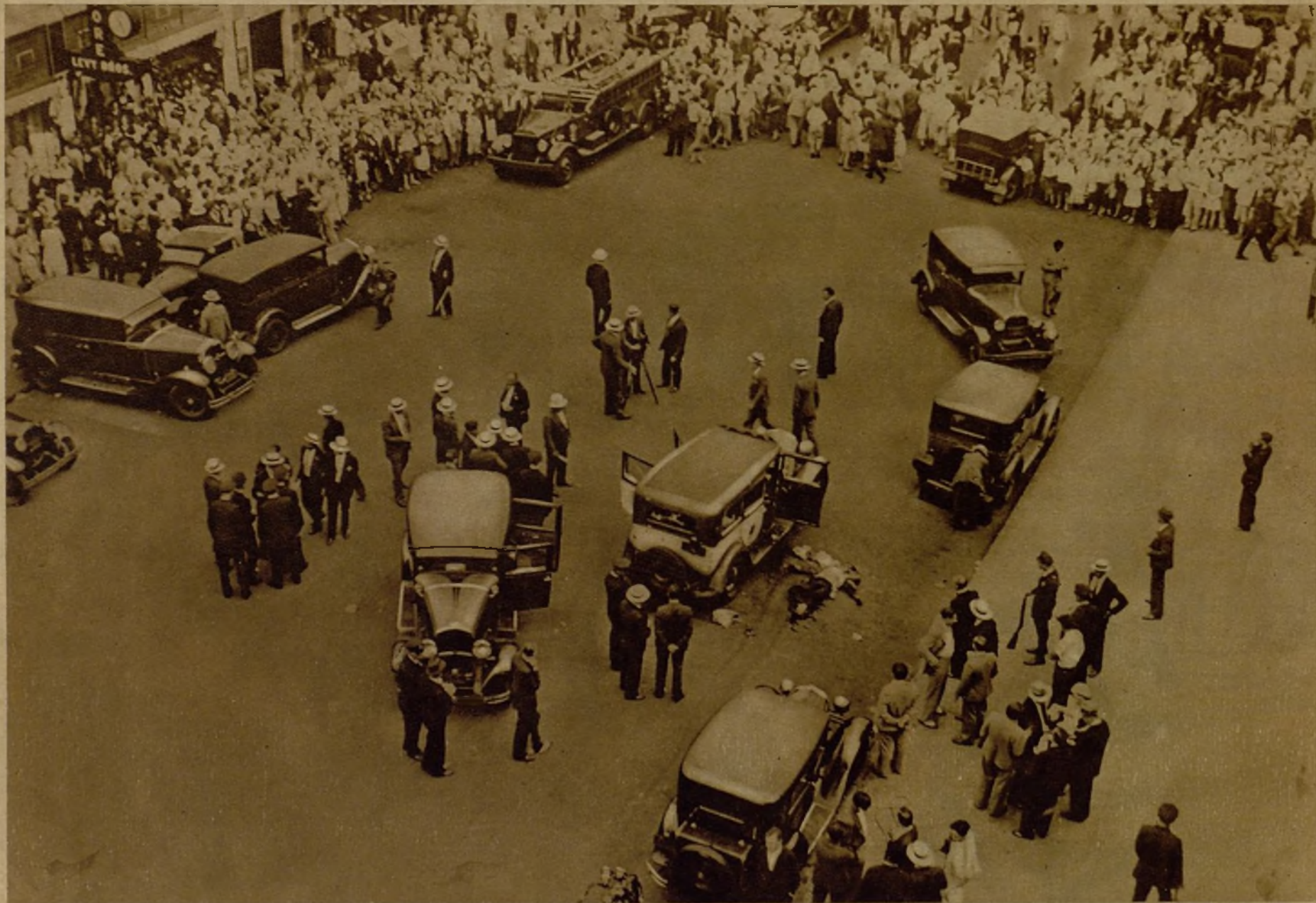
Hace días tuvo lugar en Nueva York una gran batalla contra un numeroso grupo de bandidos. Tras accidentada persecución en automóvil por las calles de la ciudad, y después de una verdadera batalla, la banda fué capturada. A consecuencia del tiroteo fueron muertos seis de los perseguidos, uno de los cuales yace, en la foto, al pie de un coche de la Policía