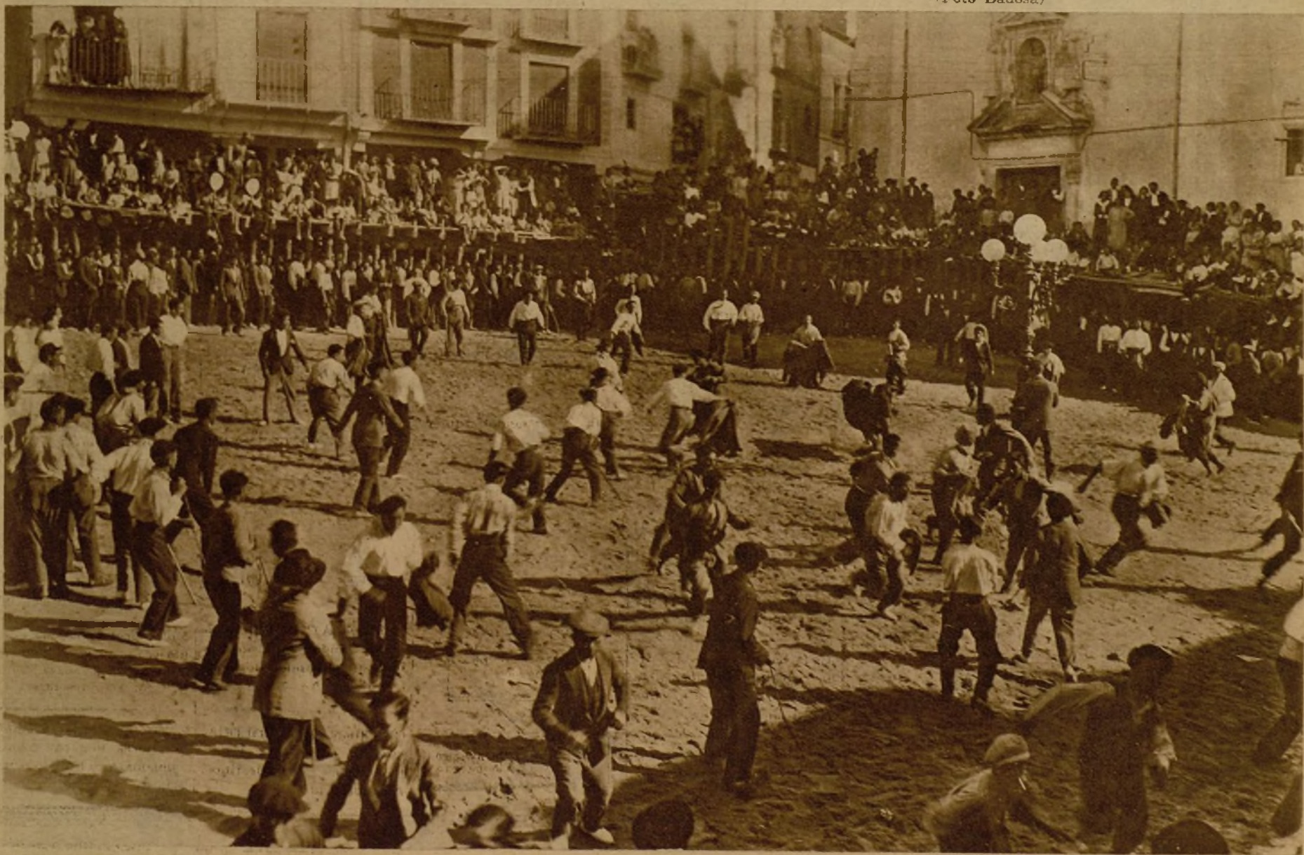
Otro festejo popular... de los prohibidos, según una reciente y enérgica disposición del Gobierno. Se trata de una capoeira celebrada en Cuéllar (Segovia), con apreciable riesgo para los lidiadores y evidente peligro para la credencial del alcalde