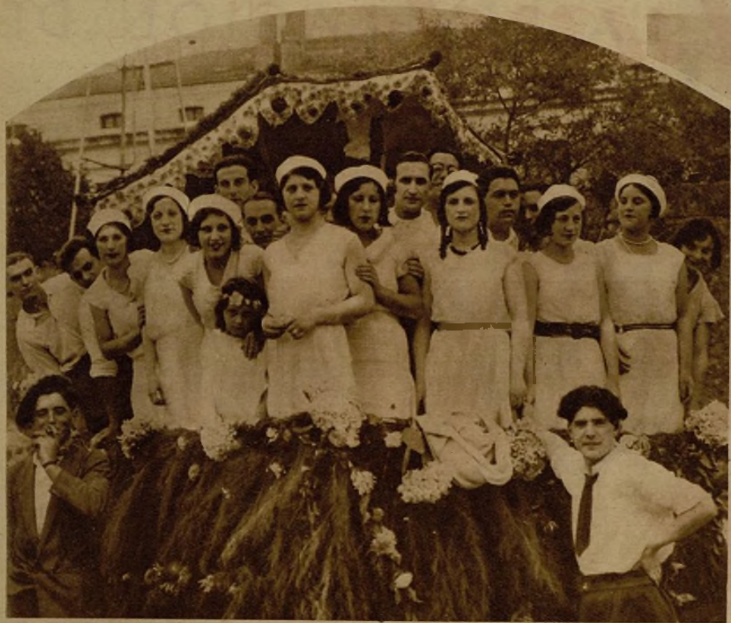
Con motivo de las fiestas anuales de Laredo, se ha celebrado una animadísima batalla de flores, en la que figuraron artísticas y lujosísimas carrozas. Con todo ello, el exorno se eclipsó ante la belleza de las "montañesucas" que tomaron parte activa en el festejo