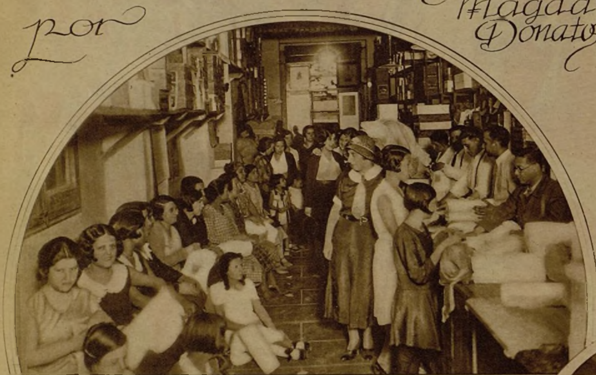
Un almacén barcelonés de ropa blanca a la hora en que las camiseras entregan su labor.

Hace poco publicó Magda Donato en AHORA la primera serie de reportajes sobre el tema "Cómo vive la mujer en España".