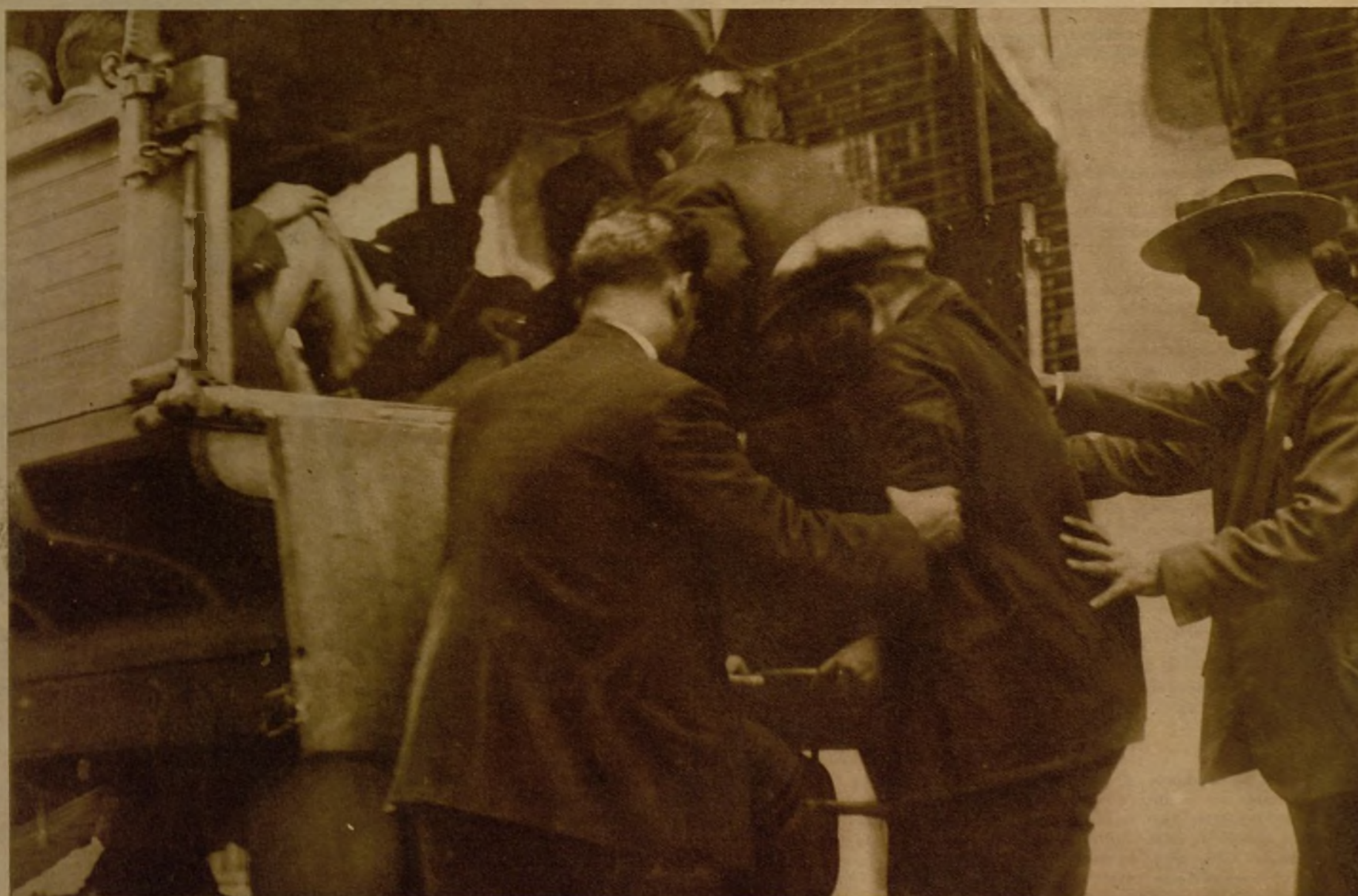
Cuando los jefes de la fuerza que sostuvo una verdadera batalla frente al Sindicato de Construcción, convertido por los huelguistas en fortín, intimidaron a los sediciosos para que se rindieran, éstos lo hicieron a fuerzas del Ejército. Suspendido el fuego, los refugiados en el Sindicato fueron conducidos en camiones a la cárcel