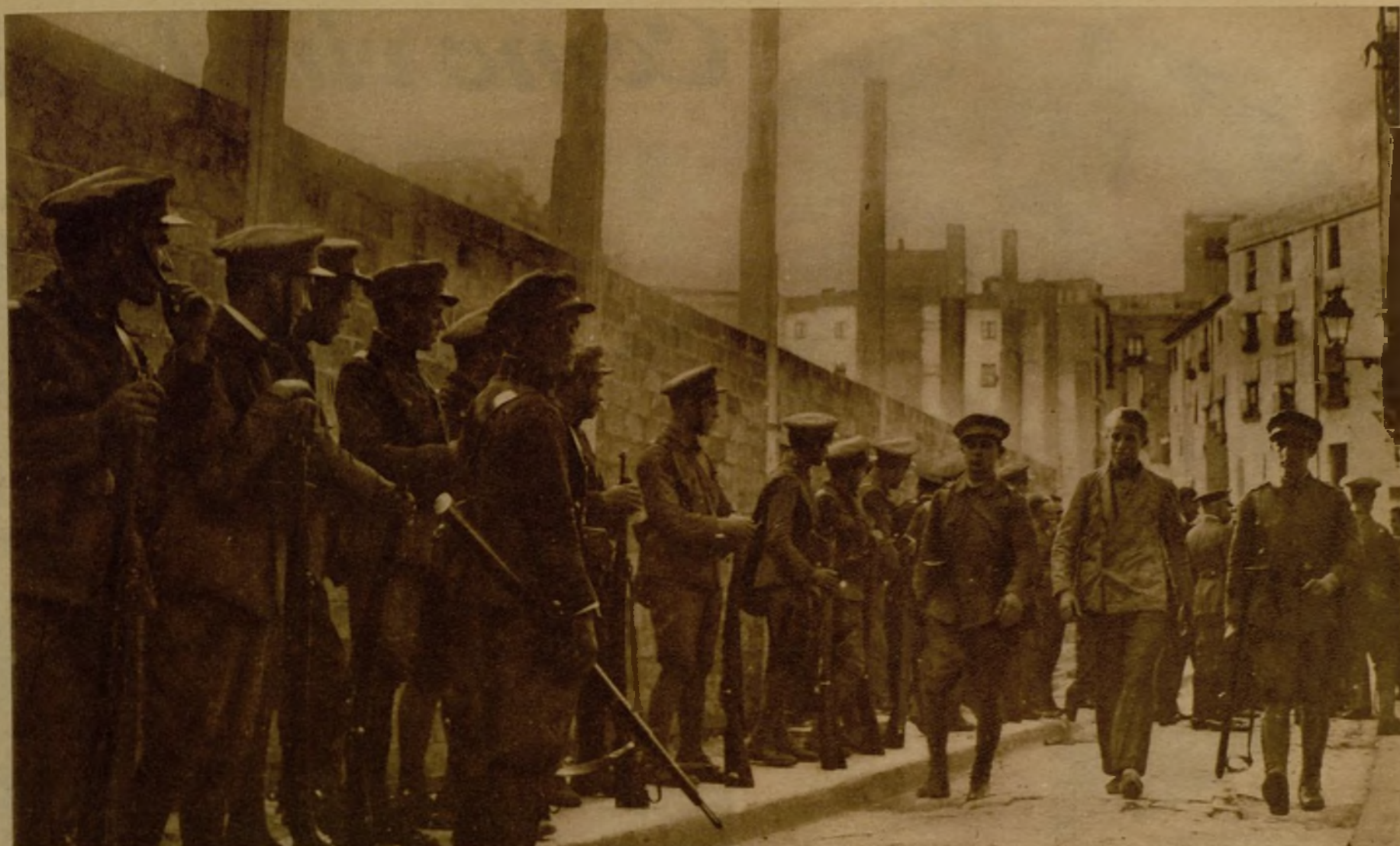
Después de la sangrienta lucha sostenida entre la fuerza pública y los huelguistas refugiados en el Sindicato de Construcción, se logró que los revoltosos se rindieran. He aquí a uno de los detenidos, conducido por fuerzas del Ejército