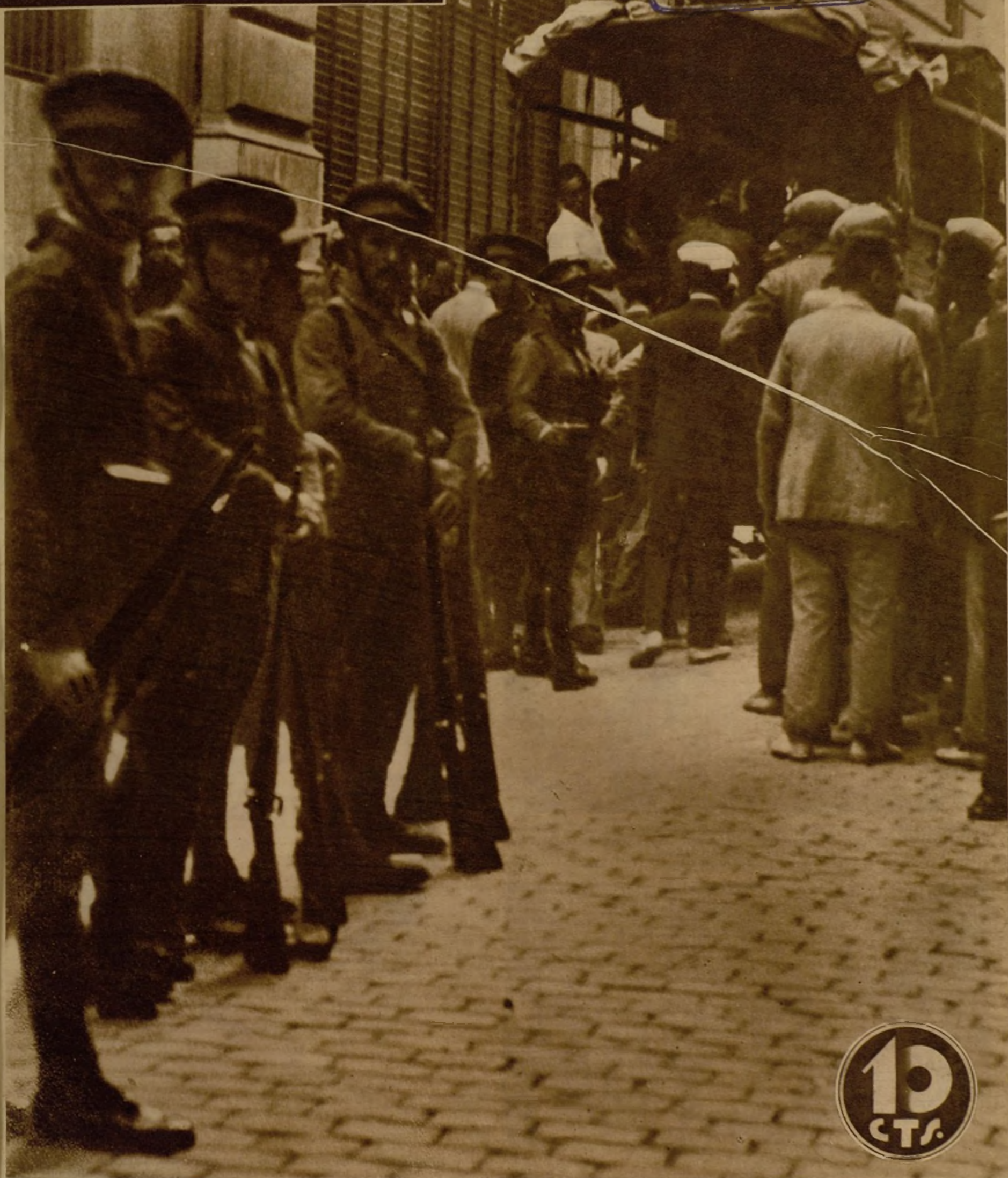
EL SANGRIENTO EPISODIO FRENTE AL LOCAL DEL SINDICATO DE LA CONSTRUCCION, EN BARCELONA.—Las tristes jornadas que la huelga ha proporcionado a Barcelona tuvieron su más dolorosa culminación en el encuentro que sostuvo la fuerza pública con los sindicalistas atrincherados en el local del Sindicato de la Construcción. Los sediciosos se rindieron, al fin, pero pusieron como condición para la entrega que se retirara la Guardia civil y la de Seguridad y las sustituyeran fuerzas del Ejército. Este es el momento que sorprende la foto, en la que se ve a los sometidos bajo la vigilancia de los soldados