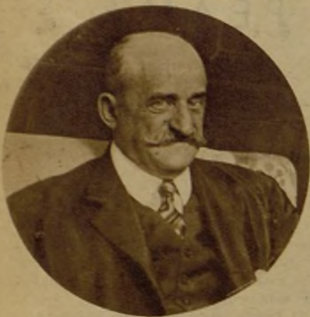
El conde de Romanones, que ha publicado un documentado y ameno libro sobre la personalidad del marqués de Salamanca