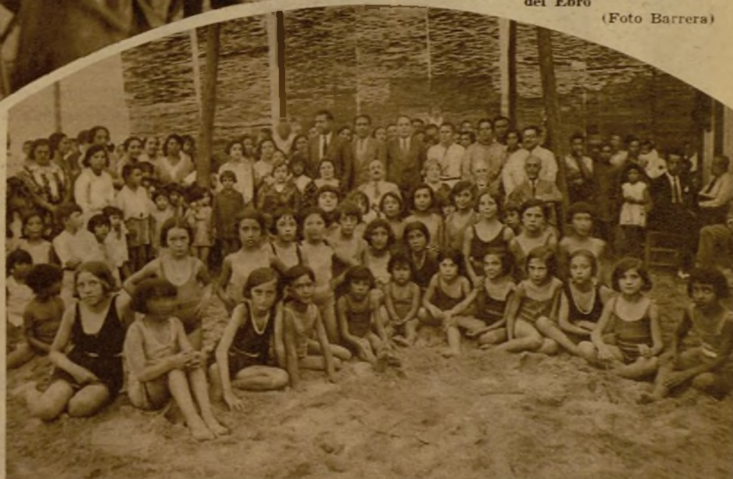
Grupo de niñas de las colonias escolares de Tarragona durante una fiesta con que fueron obsequiadas por el Ayuntamiento