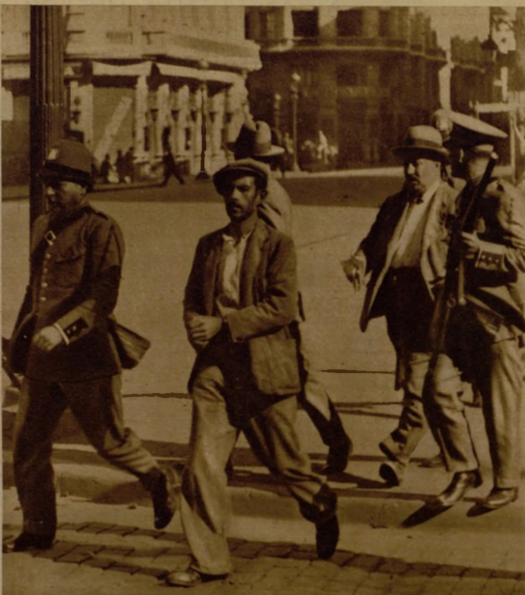
Un huelguista que fué sorprendido con armas en la Gran Vía Layetana, conducido por la fuerza pública a la Comisaría del distrito