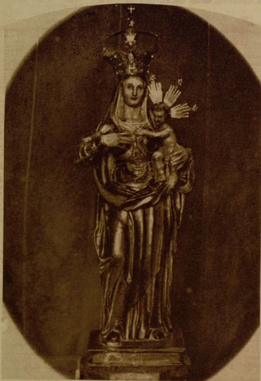
Nuestra Señora de la Peana, tal y como es, tal y como quiso que fuera el maravilloso imaginero que realizó esta primorosa talla

La barbarie realista que dominó en la escultura religiosa española de siglos pretéritos se ha dilatado, como tradición popular, a través de los años. Aún perdura en el espíritu de las gentes sencillas. Aún atormenta la sensibilidad rudimentaria de muchos pueblos. Aún se impone al recto sentimiento estético de los encargados de velar al mismo tiempo por la pureza de la Fe y la conservación de las obras de Arte.