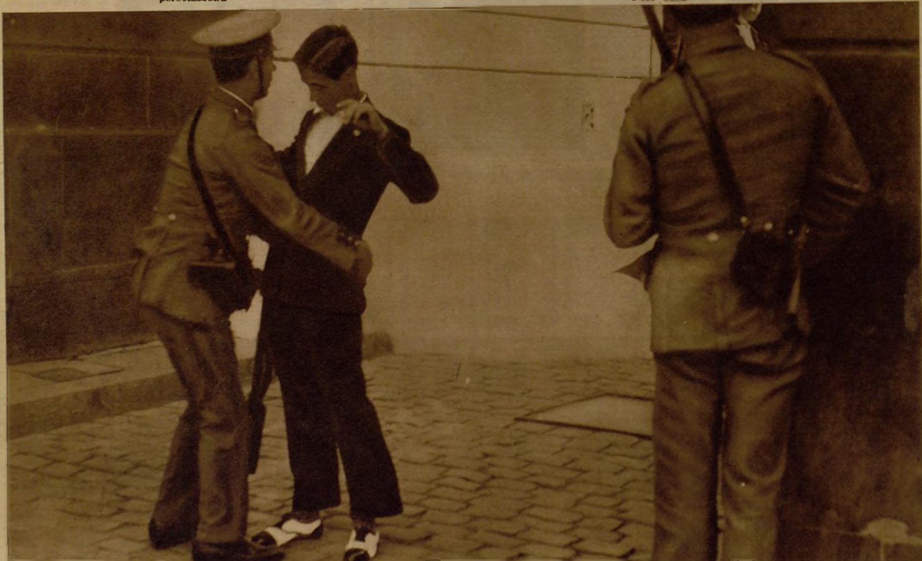
La recogida de armas por parte de los agentes de la Autoridad ha sido muy importante, pues los cacheos fueron generales en todas las calles de la capital, y más insistentemente en las vías próximas a Centros obreros y en los lugares en que parecía, con más frecuencia, concentrarse la actividad de los sediciosos