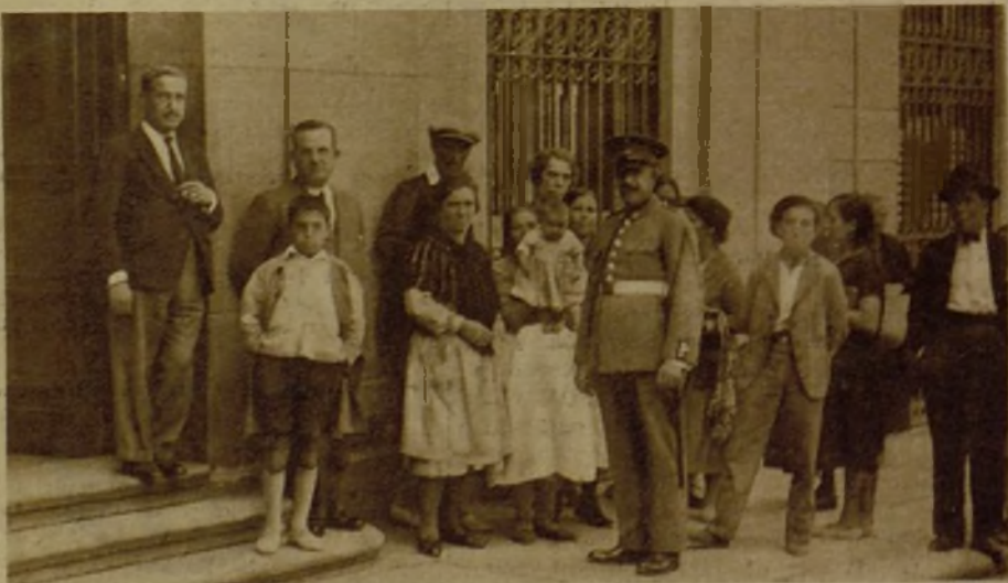
El Ayuntamiento madrileño realiza en estos días una benemérita labor en beneficio de las clases necesitadas. Se trata del desempeño gratuito de las máquinas de coser. He aquí una cola de favorecidos.