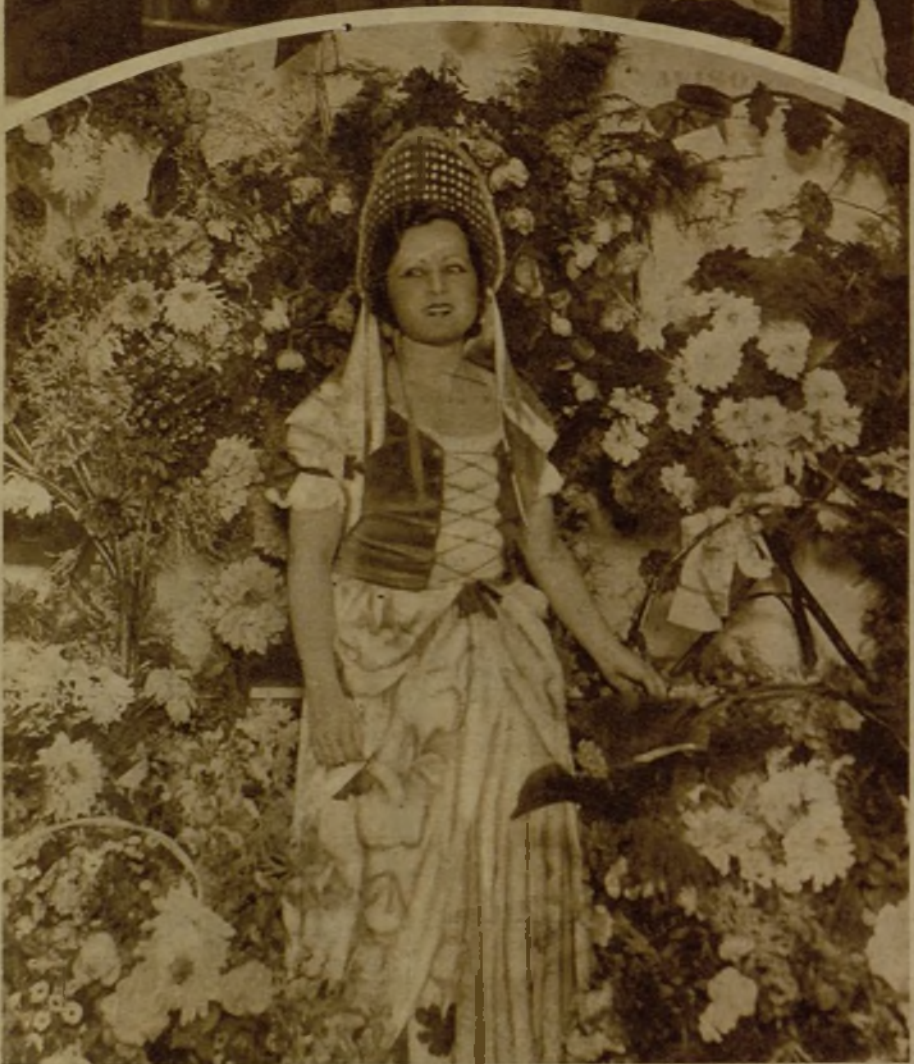
La bellísima tiple cómica Rosita Cadenas, tan aplaudida por el público madrileño, que ha recibido pruebas de admiración sin cuento con motivo de su beneficio, celebrado en el teatro Calderón