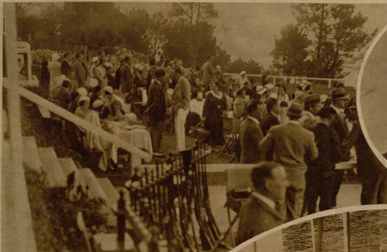
Las grandes tiradas de San Sebastián congregan anualmente a los más selectos aficionados y a un núcleo numerosísimo de distinguidos espectadores. Un aspecto del campo de tiro el día en que se disputó el gran premio