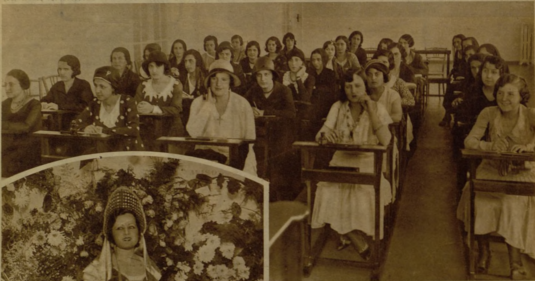
Solemne sesión de apertura del curso de enfermeras profesionales, celebrado en el Dispensario de la Cruz Roja Española