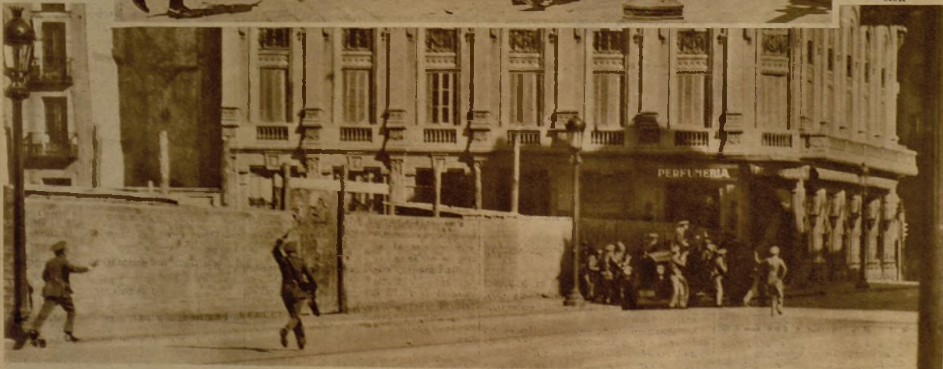
Grupo de guardias, parapetados en un camión, en el momento en que repelían las agresiones de que fueron objeto por parte de los huelguistas. Arriba, los agentes de Orden público impidiendo el paso por determinadas vías

De las noticias que, desordenadamente, pues las comunicaciones son muy anormales, se reciben de Barcelona, no se desprende una total reacción hacia la normalidad, si bien tampoco puede decirse que la huelga continúe. Muchos obreros han reanudado el trabajo, y la tranquilidad en la vía pública parece completamente restablecida, tras la rendición de los sindicalistas. El alcalde de Barcelona conferenciando con otras autoridades a la puerta del Sindicato de Construcción