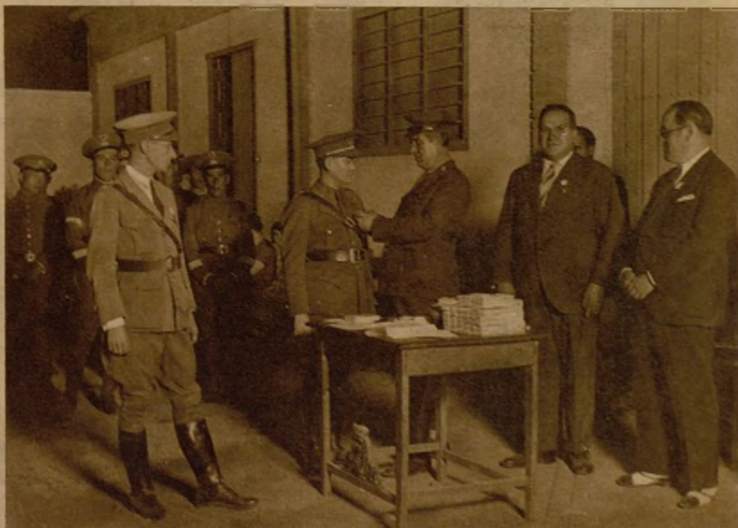
Imposición de medallas y entrega de donativos en metálico a las clases y soldados de la Cruz Roja de Sevilla, como premio a su labor durante los sucesos revolucionarios