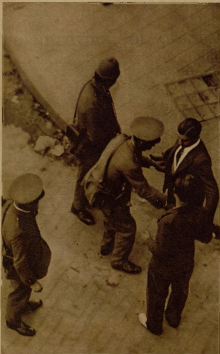
La vigilancia en los alrededores del Sindicato de Construcción fué rigurosísima, y todo transeúnte estaba obligado a identificar su personalidad