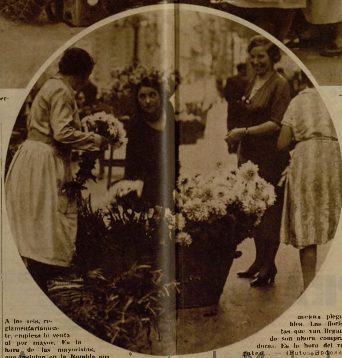
A las seis, reglamentariamente, empieza la venta al por mayor. Es la hora de las mayoristas, que instalan en la Rambla sus mesas plegables. Las floristas que van llegando son ahora compradoras.

—Estamos consagradas a las flores, de madres a hijas, desde hace siglos