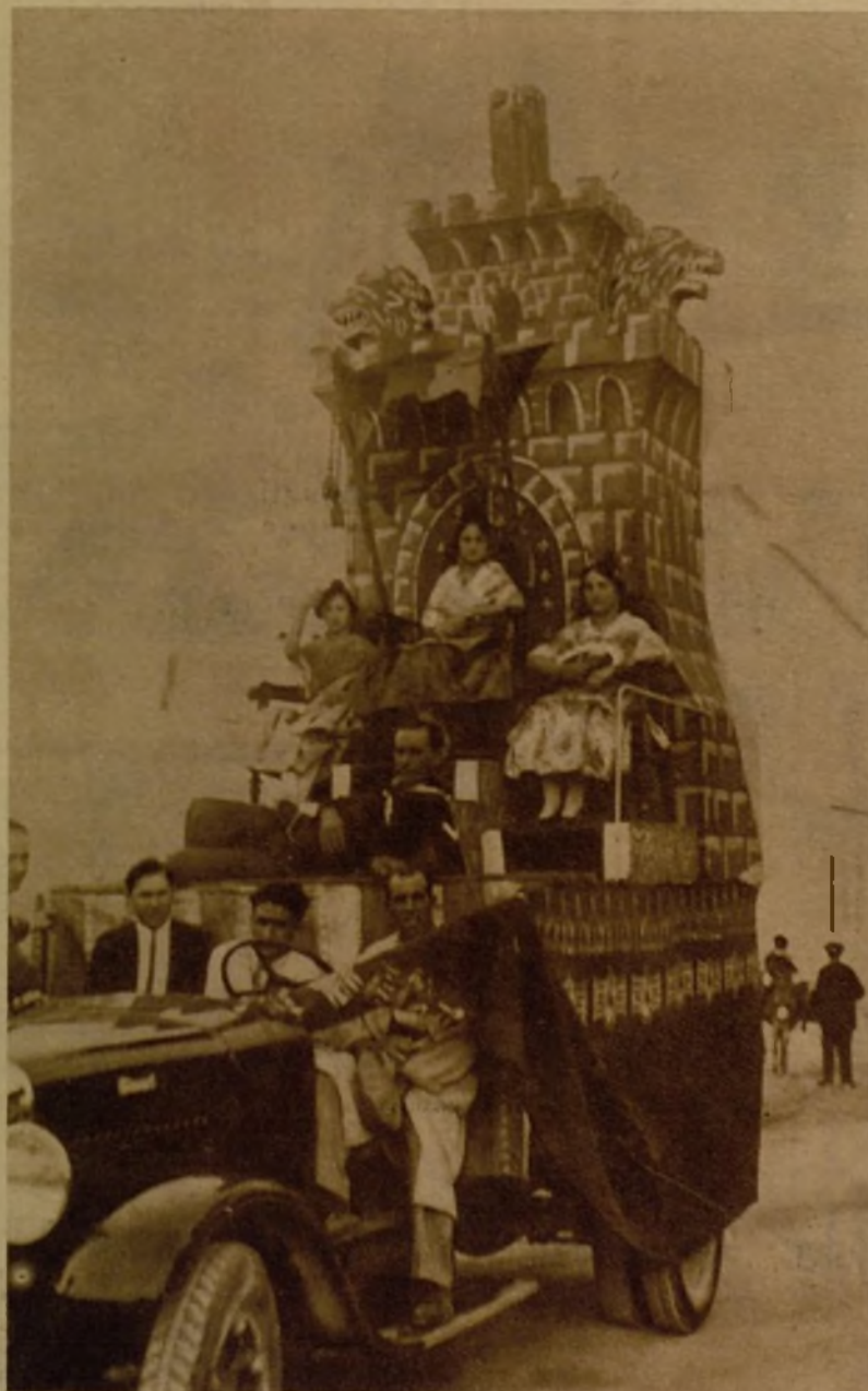
Carroza presentada por el Ayuntamiento de Onteniente en las fiestas celebradas en aquella población. Iba ocupada por la reina de la belleza y sus damas