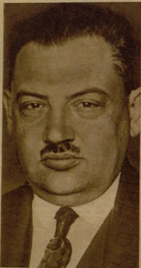
Taddaus Holowko, diputado polaco que ha sido asesinado por unos desconocidos. Se sospecha que se trate de un complot perpetrado por nacionalistas ucranianos