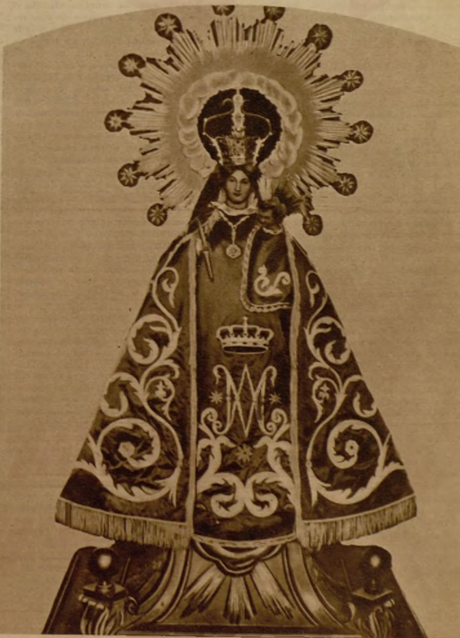
La Virgen de la Peana, vestida y peinada según el gusto realista español, tal y como se venera en la iglesia de Ateca