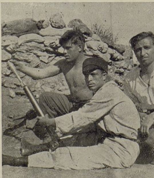
Aprended el manejo de todas las armas.

Tu actuación durante el combate depende de como cuides el armamento.