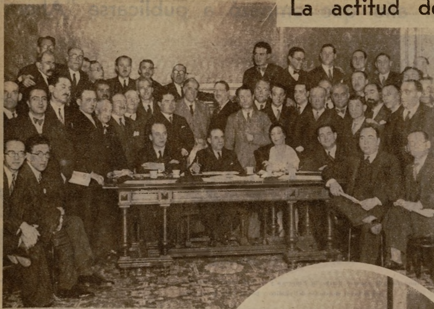
Los diputados que constituyen la minoría socialista se reunieron en sesión permanente, bajo la presidencia del jefe de aquélla, Remigio Cabello, para seguir el curso de la crisis y decidir en cualquier momento y con la necesaria rapidez la actitud del partido. A la reunión asistieron el presidente del Congreso, señor Besteiro, y los ministros dimisionarios, señores Prieto, Largo Caballero y De los Ríos.