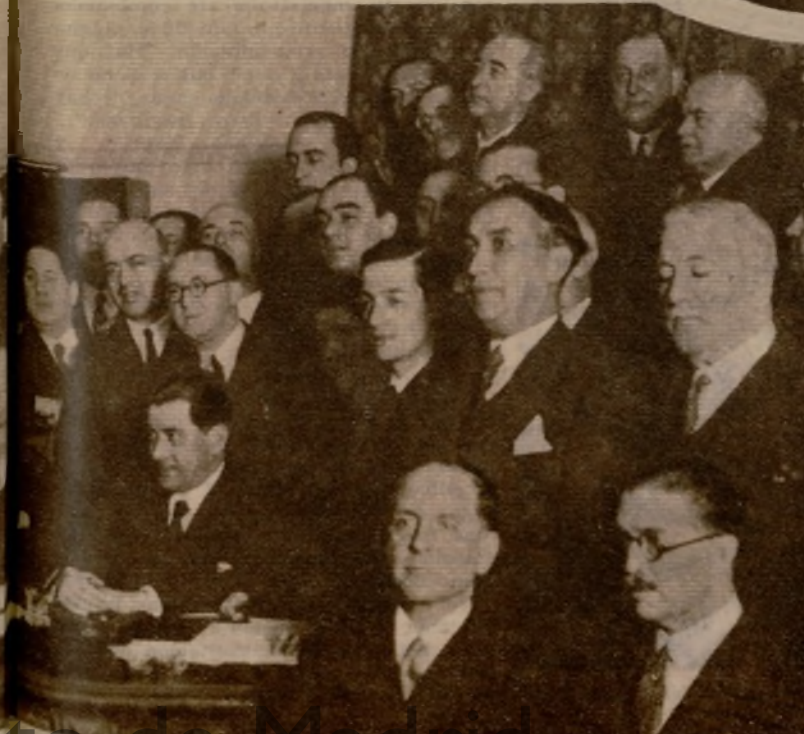
La actitud adoptada por la minoría radical, manifestada por una nota oficiosa, de la que en la foto toman referencia los periodistas, produjo el inesperado escollo para el fácil desarrollo de la crisis. La minoría declaró en esta nota que no prestaría participación al Gobierno, si bien daría todas las facilidades posibles para que cumpla su misión en el Parlamento y en la gobernación del país. Aclaró la minoría radical en su nota que, ni individual ni colectivamente, se han declarado incompatibles con ningún miembro del Gobierno que se anunció, y mucho menos con el representante de la Esquerda Calatana, señor Carner.