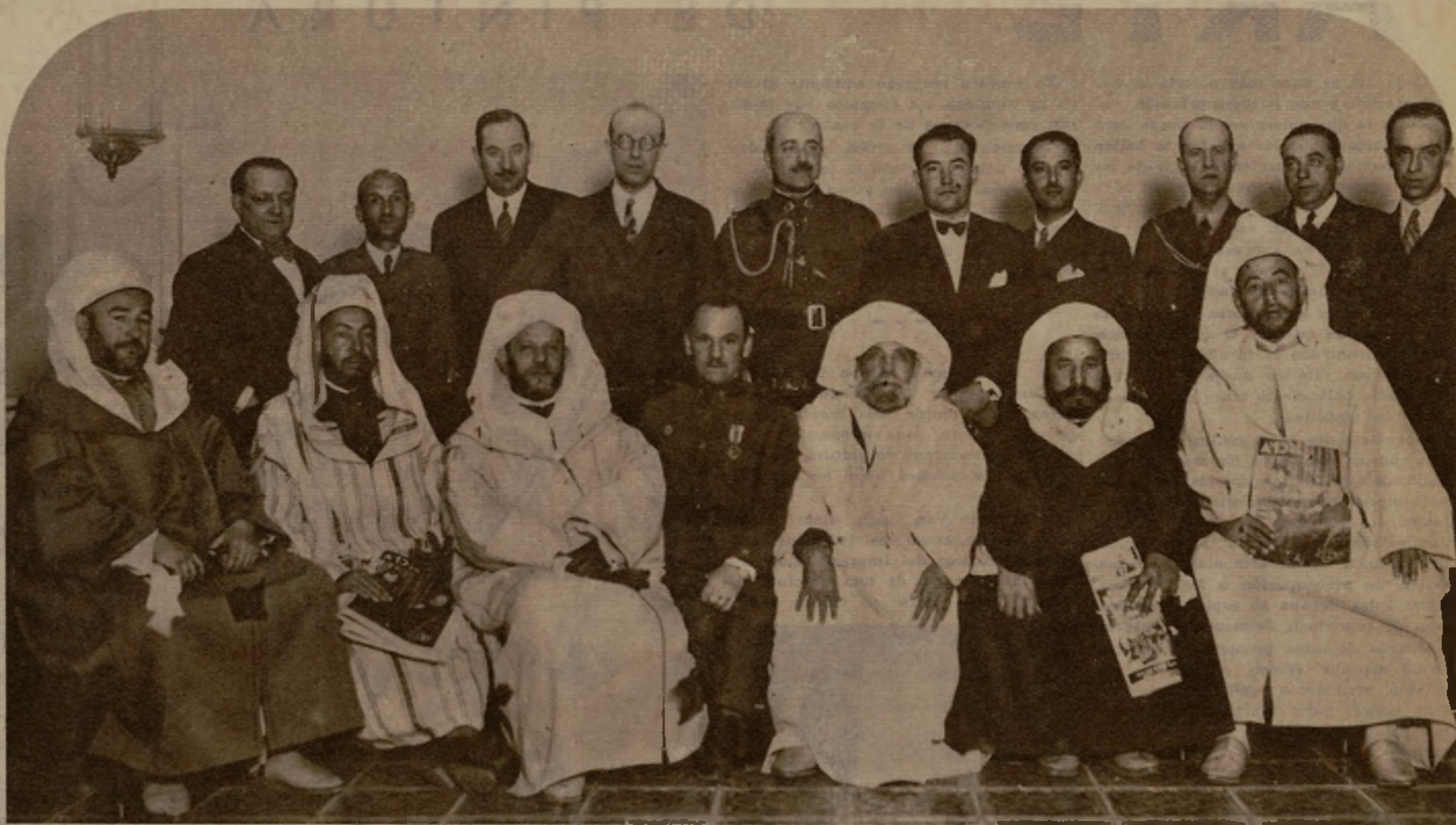
Varios de los moros notables que han venido a Madrid con motivo de la proclamación del Presidente de la República han honrado con su visita la casa de AHORA. Entre ellos se encuentran Abd-el-Kader, Amarusen y varios distinguidos marroquíes, que, con el general Goded y otras personalidades, figuran en la foto