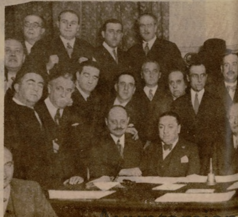
Los diputados de la minoría radical, presididos por los señores Lerroux y Martínez Barrios, en la reunión en que adoptaron el acuerdo de no colaborar directamente en el Gobierno proyectado por el señor Azaña con la aportación del grupo socialista.