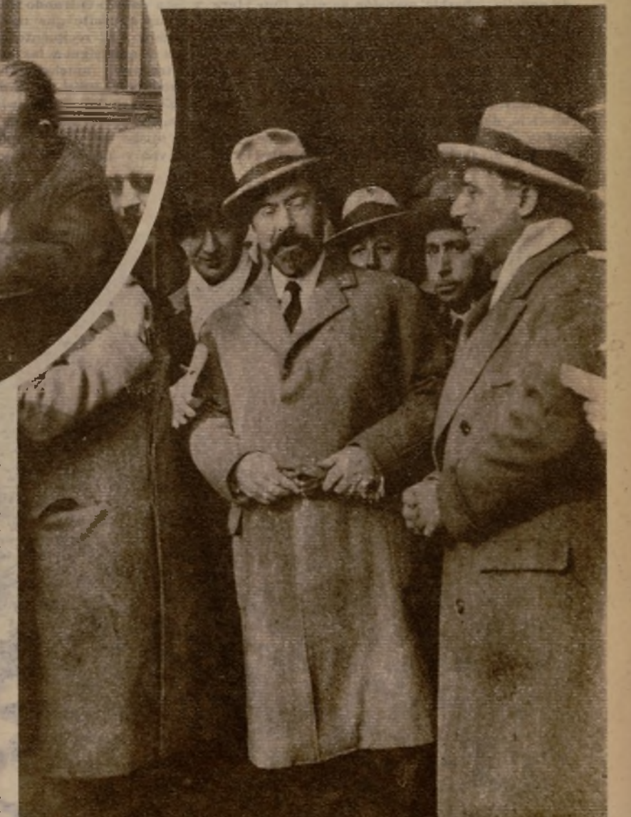
El ministro dimisionario de Justicia, don Fernando de los Ríos, estuvo también en el Ministerio de la Guerra para comunicar al señor Azaña el resultado de la deliberación celebrada por la minoría socialista en relación con la crisis pendiente. Este acuerdo fue reiterar al jefe del Gobierno su decidido apoyo para la formación del nuevo Gabinete.