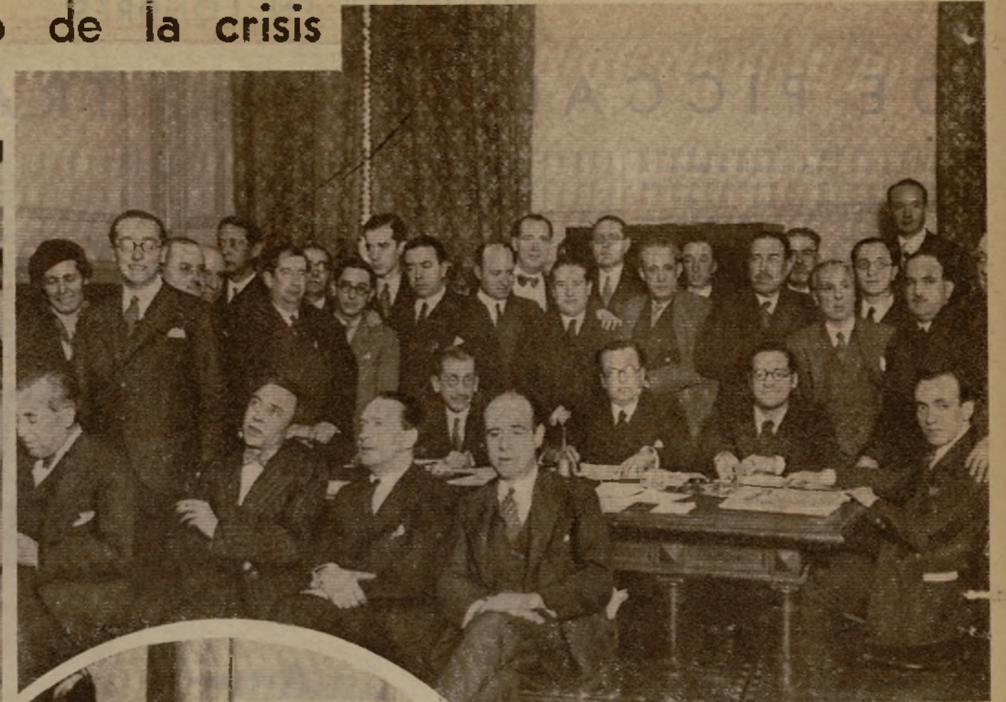
Los miembros parlamentarios de la minoría radical socialista, entre los que figuran los ministros dimisionarios, señores Domingo y Albornoz, acordó, como la socialista, reunirse en sesión permanente para seguir por instantes el lento desenvolvimiento de la crisis. La actitud adoptada por el señor Lerroux y por la minoría radical les hizo colocarse a la expectativa.