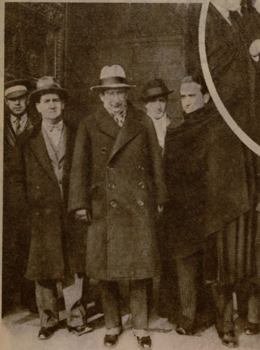
El ministro dimisionario de Instrucción pública, don Marcelino Domingo, al salir del Ministerio de la Guerra, donde visitó al señor Azaña y cambió con él impresiones acerca de la marcha de la crisis y de las actitudes tomadas por las minorías parlamentarias. El representante radical socialista habló con los representantes de la Prensa al terminar su visita, y les dijo que su opinión es en todo momento favorable a la constitución de un Gobierno que presidiera el señor Azaña.