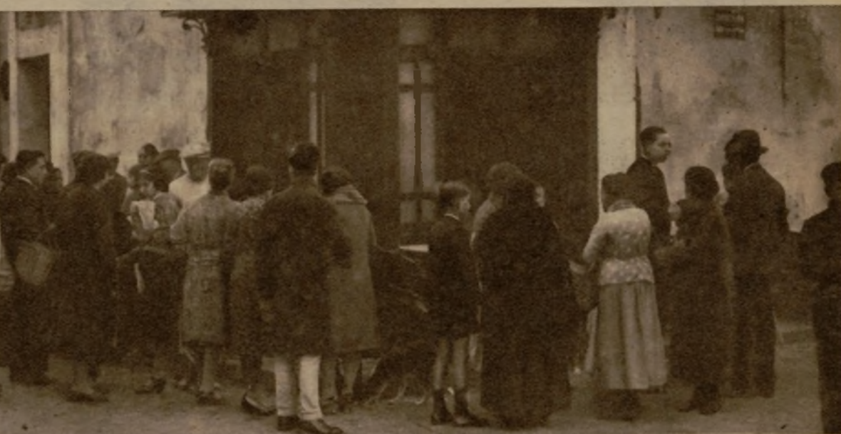
La taberna "Las tres columnas", donde se desarrolló el atraco. Los asaltantes, después de herir a los dueños, lograron llevarse algunos objetos de valor y dinero. El público comentando el suceso