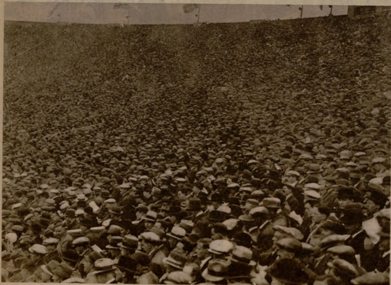
He aquí a una multitud para ver morir a "un hombre solo". El equipo español hizo un triste papel ante... demasiados espectadores