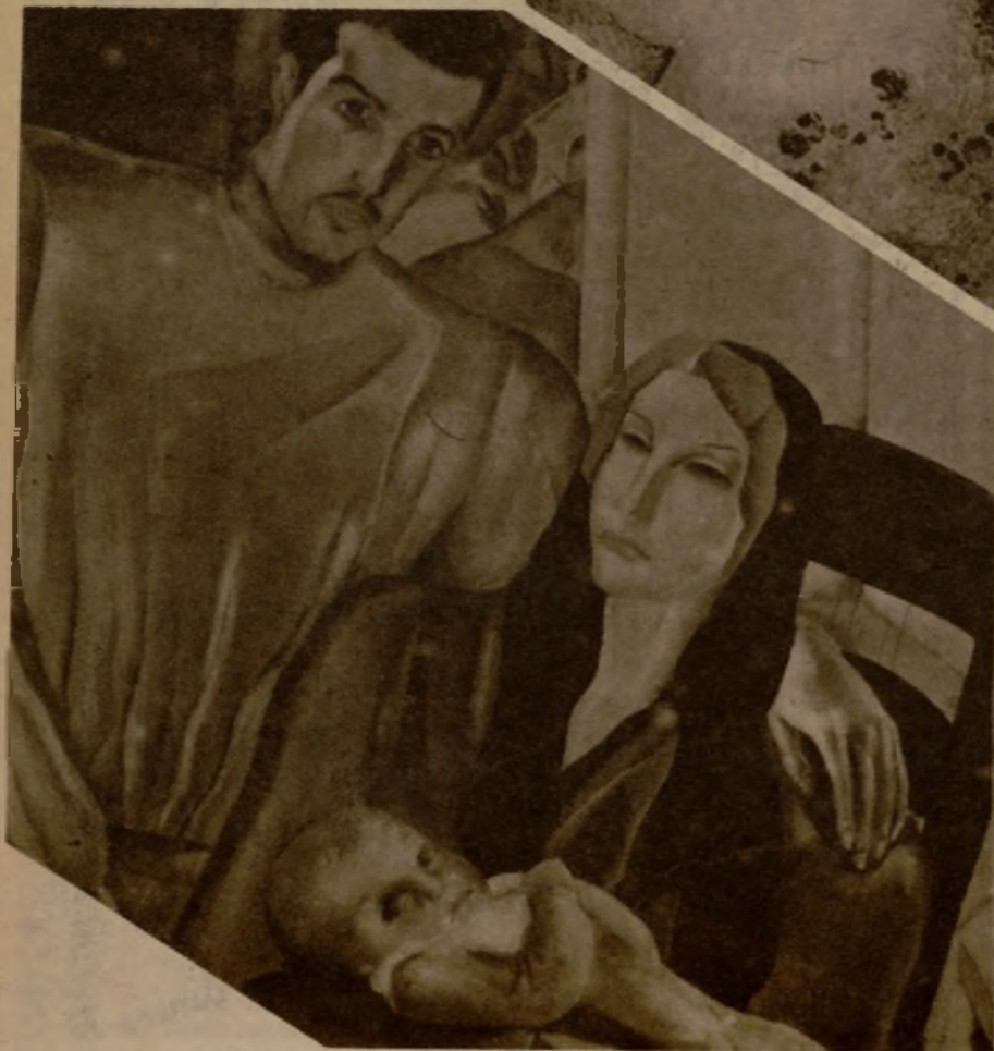
"Familia", notable lienzo del joven pintor Florit