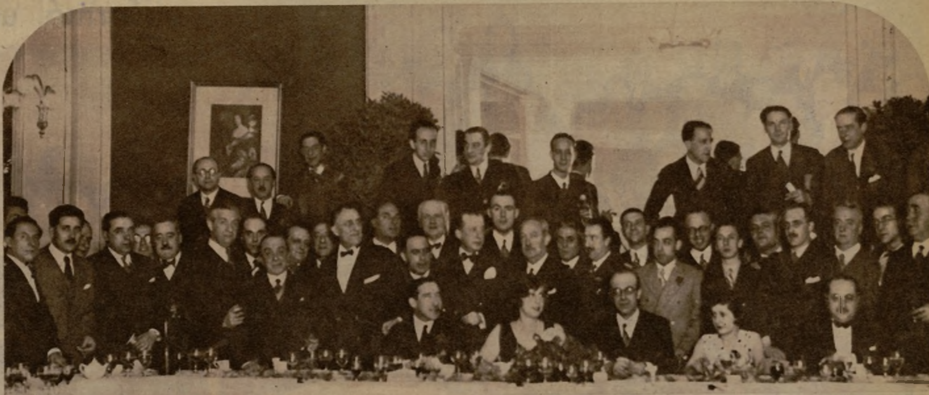
Al cumplirse el primer aniversario de la fundación de nuestro diario, la Empresa y la Redacción de AHORA se han reunido en un fraternal banquete, felicitación por el favor constante del público y por el éxito de su labor