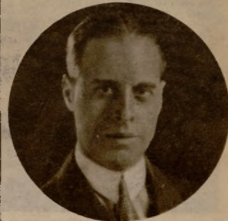
El distinguido diplomático señor Quer Boule, que ha reflejado en un notable libro sus impresiones sobre Suiza