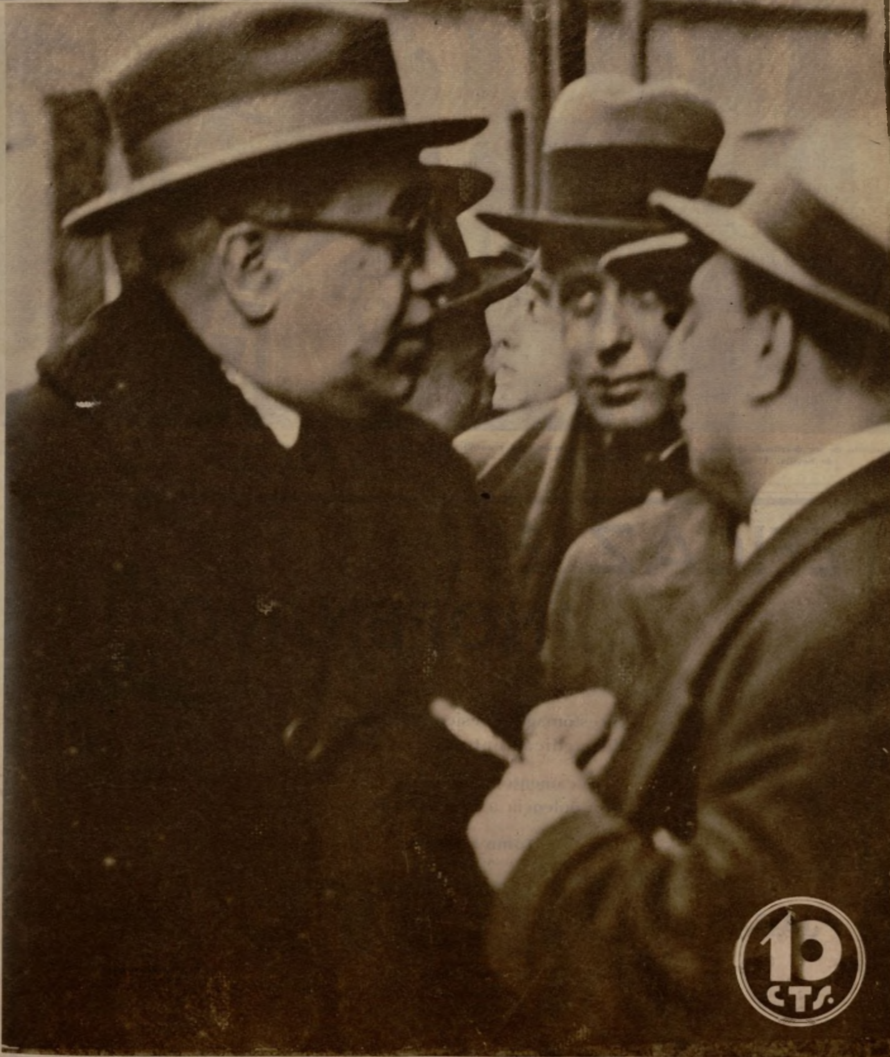
EL SEÑOR AZAÑA DURANTE LA TRAMITACION DE LA CRISIS. —La labor del jefe del Gobierno dimisionario, encargado por el Presidente de la República de formar nuevo Gabinete, halló el escollo de la actitud de los radicales, que, sin adoptar una postura de oposición, se negaron a prestar una colaboración directa. Véase al señor Azaña dando cuenta a los periodistas de la marcha de sus gestiones