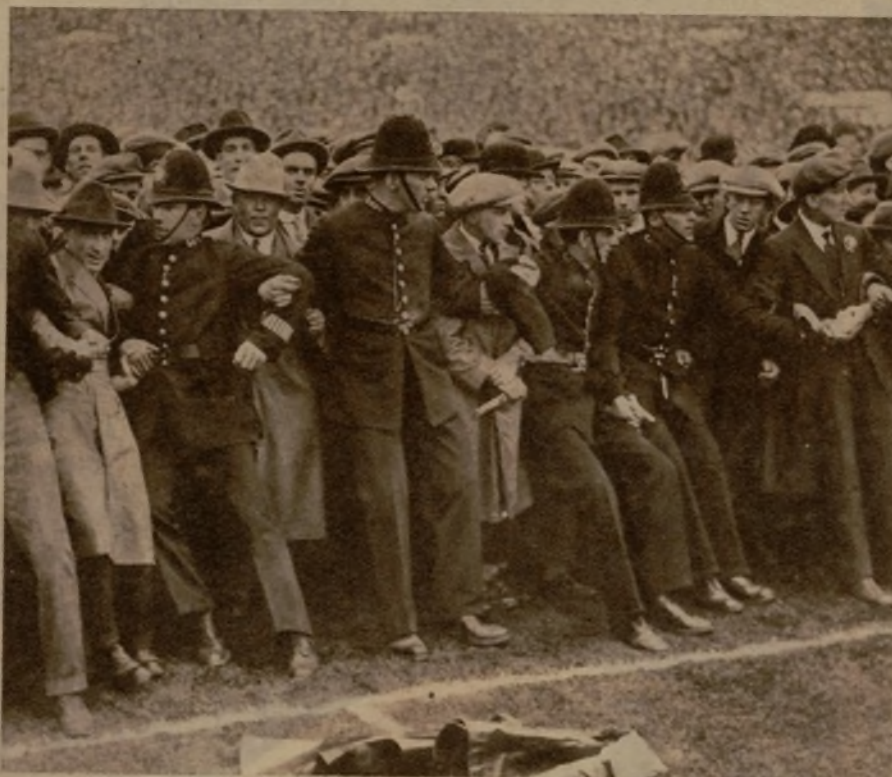
Y el público de Londres llenó el campo, a pesar de todo. A pesar de ese al-tre-uno, que... pesa..., pesa...