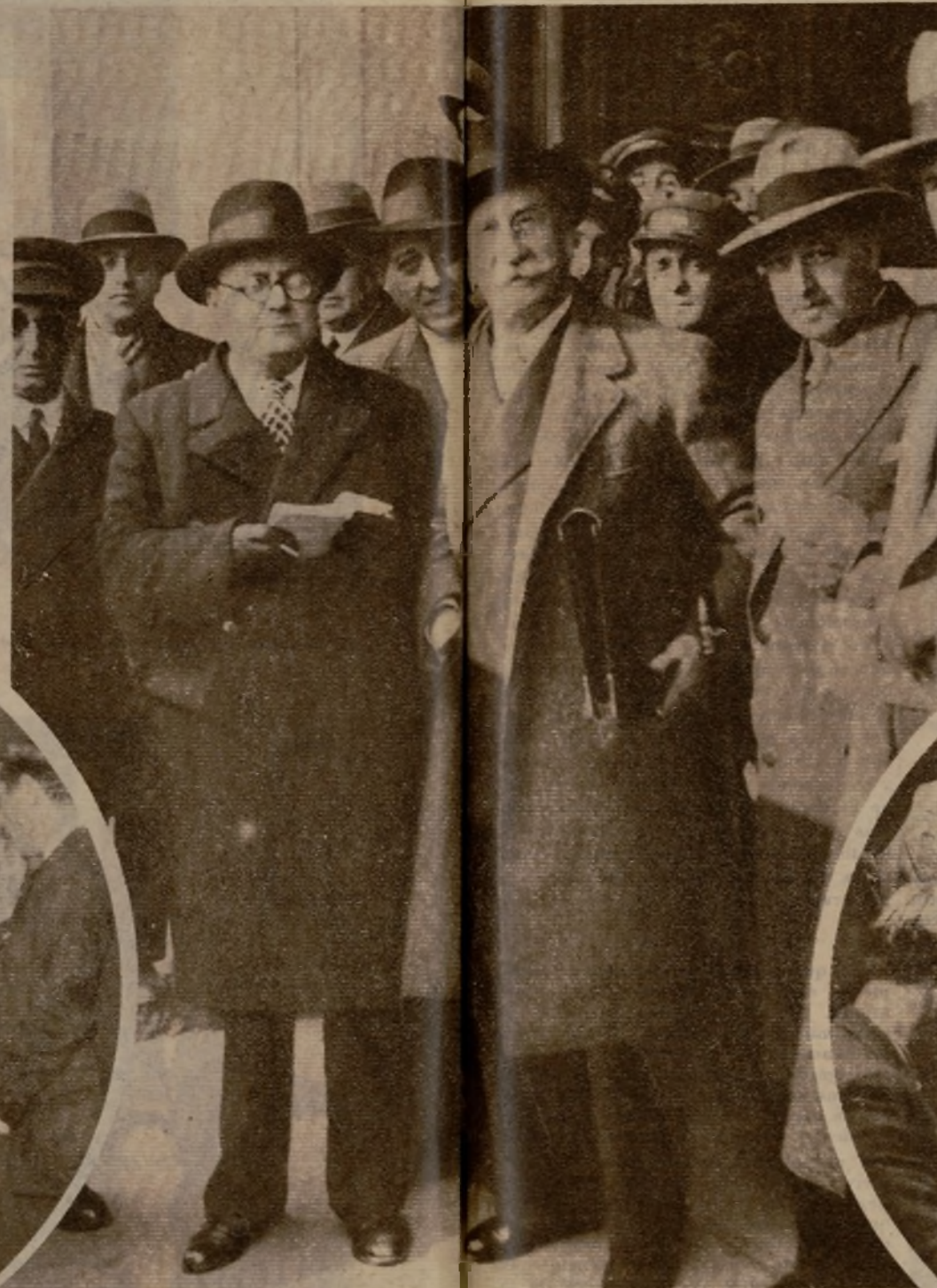
Don Alejandro Lerroux al salir del Ministerio de Guerra de comunicar al señor Azaña la decisión adoptada por la minoría radical de no aceptar la participación en el Gobierno que se forme.