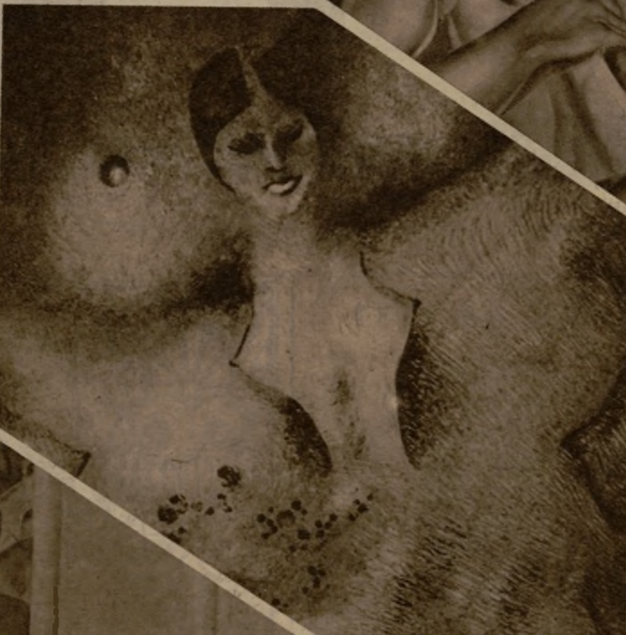
"Mujer", cuadro expresionista de Ciria

cas y la poca firmeza de sus recursos plásticos.