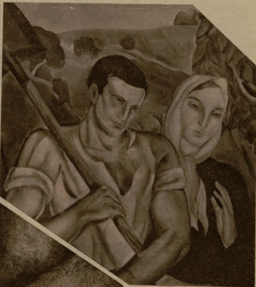
"Vuelta del trabajo", delicada obra pictórica de Florit

Ciria, como Van Gogh, como Signac, como Gauguin, como casi todos los renovadores teóricos del impresionismo, me daba la sensación de una absoluta incompatibilidad entre sus teorías estéticas