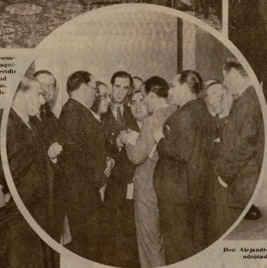
En los pasillos del Congreso los corros de diputados esperan las noticias del desenvolvimiento de la crisis, y comentan, cada cual con su cristal, la actitud de los partidos.