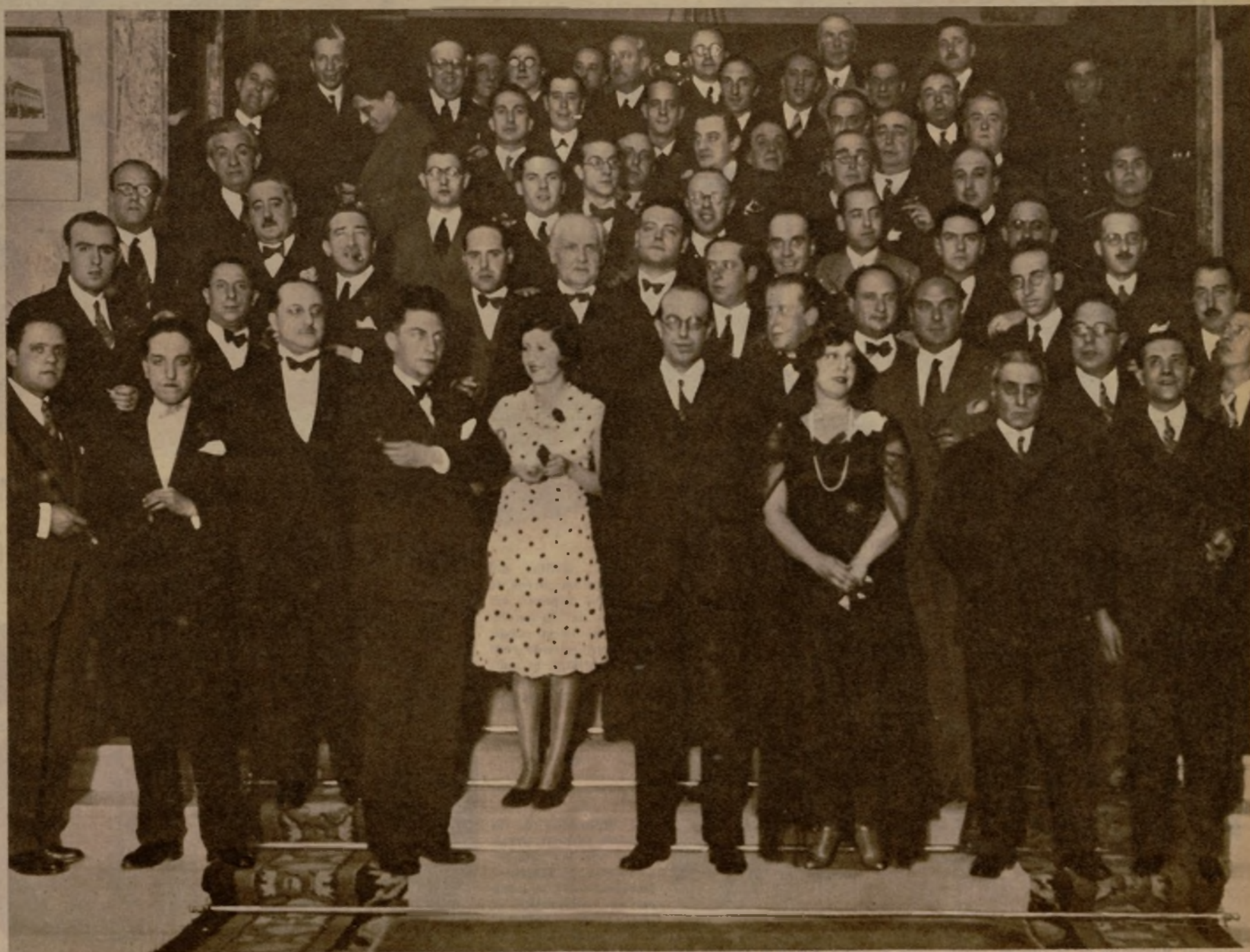
Concurrentes al banquete con que se celebró el primer aniversario de AHORA, al que asistieron los directivos de la Empresa editorial, ilustres colaboradores, cuerpo de redacción y jefes de talleres de nuestro diario