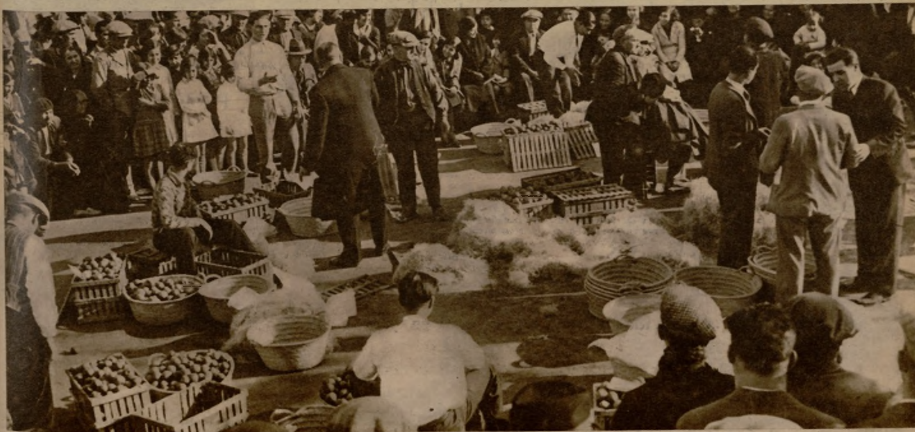
Vistoso aspecto que ofrecía el mercado de frutas de San Baudilio de Llobregat durante la típica fiesta de la manzana y concurso de embaladores, tradicional en muchos pueblos de la región catalana