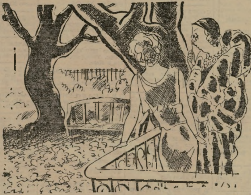
TAPICES DE OTONO

—¿No encuentra usted encantador este tapiz de hojas secas? —¡Inimitable! Si no fuera indiscreción yo le preguntaría a usted cuánto le ha costado.