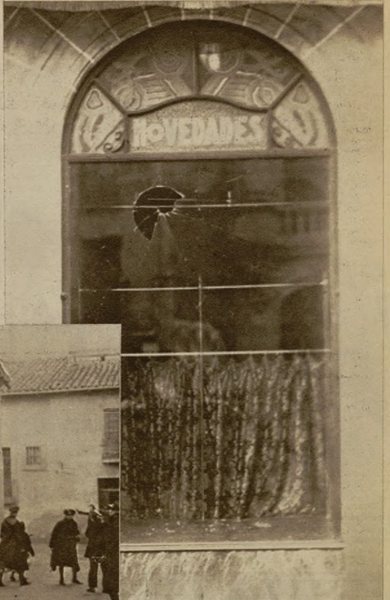
La luna de la puerta de una tienda de tejidos, situada en el centro de la ciudad, fué apedreada y rota por un grupo de huelguistas