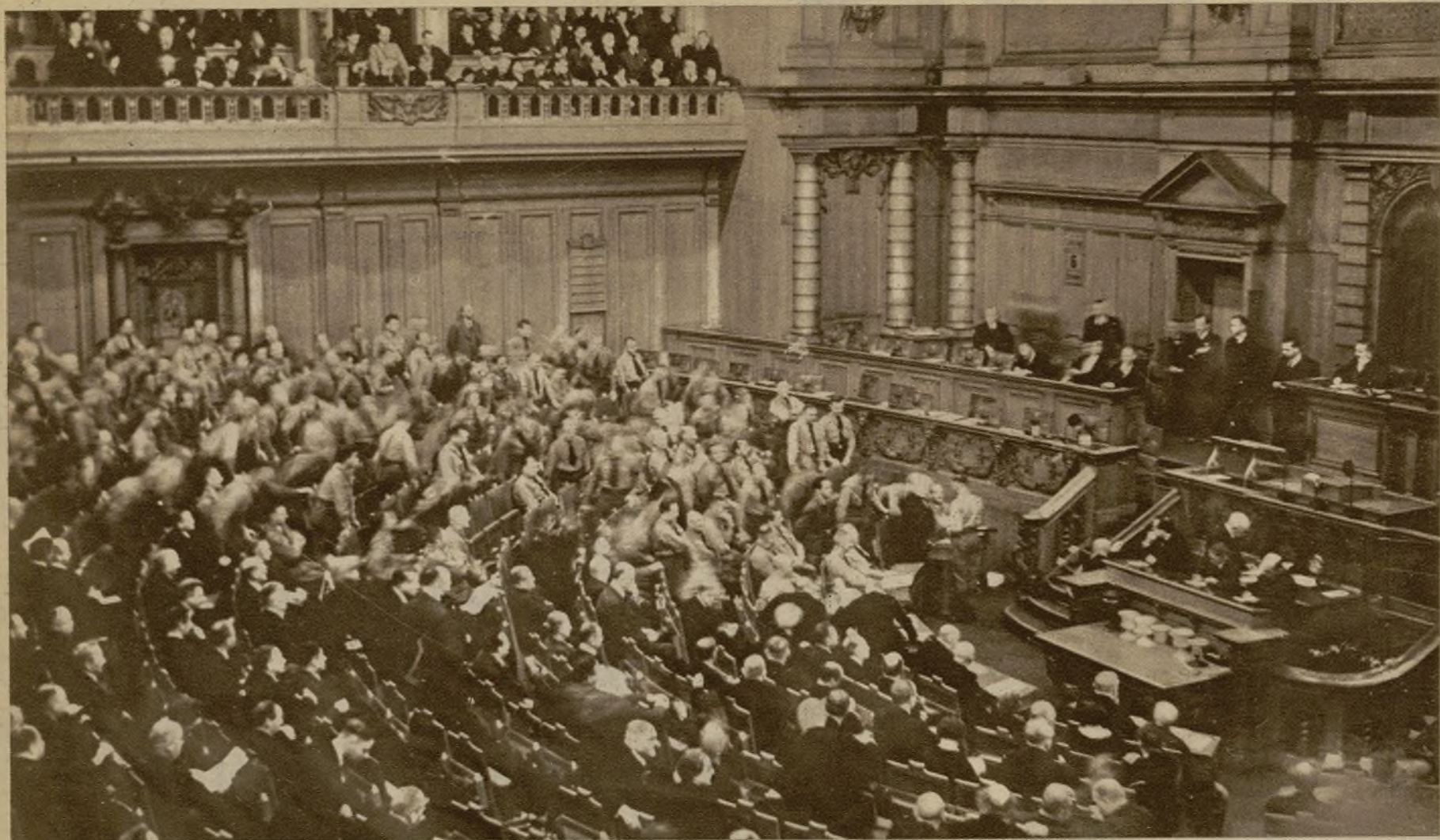
Las últimas sesiones parlamentarias del Reichstag se han caracterizado por el ambiente de violencia en que se deslizaron. Comunistas y nacional socialistas se han obsequiado con los insultos más variados. La foto ha recogido el instante en que los "nazis" increpan a los comunistas con el grito: "¡Vosotros no sois hombres; sois animales!"