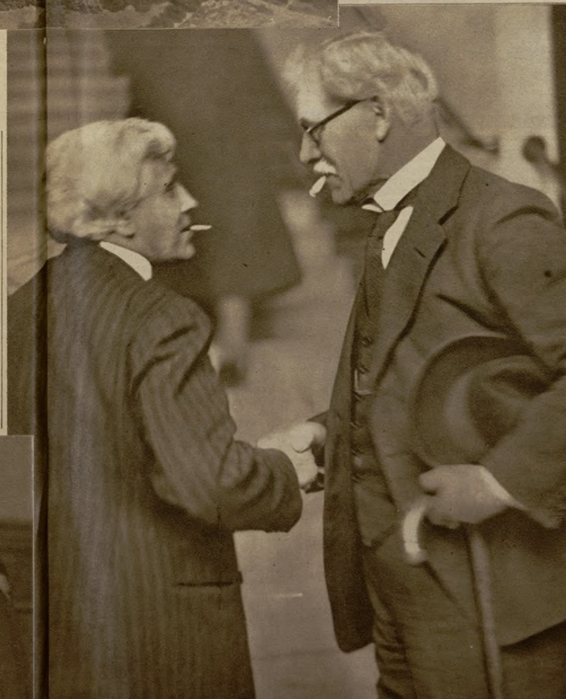
En un pasillo de su hotel, von Neurath, representante alemán en la Sociedad de Naciones, trata con John Simon, delegado de Inglaterra, el complicado problema de la liquidación de las deudas