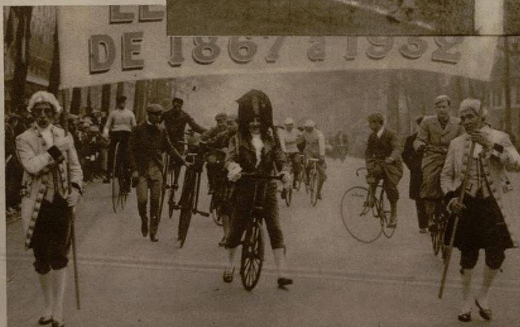
En una típica fiesta deportiva celebrada en París se han presentado modelos de bicicletas desde 1867 a 1932. Los participantes llevaban el atavío correspondiente a la edad de su "burro"