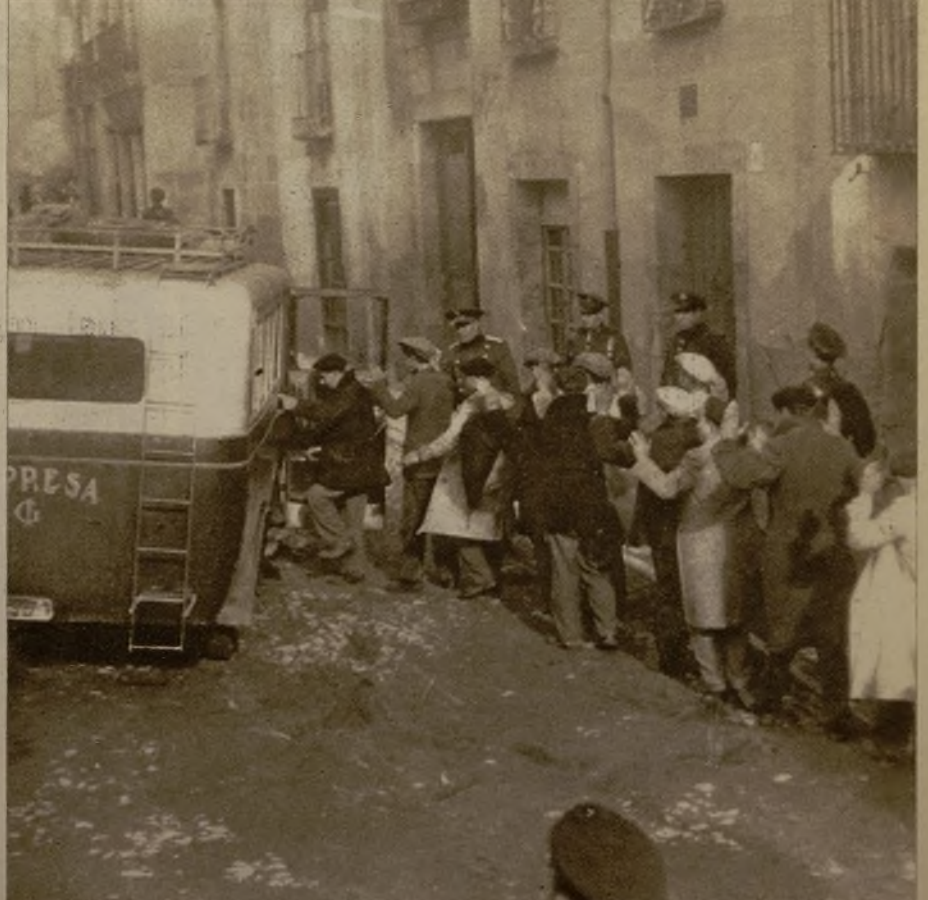
Grupo de detenidos llevados a los camiones de la Policía para su conducción a la Comisaría de Vigilancia