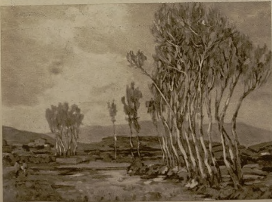
"Albas vallesanas", paisaje de Granollers, por Vicente Albarranch

Más que la técnica, fluida y vigorosa; más que la paleta, en la que destaca la riqueza de verdes; más que el dibujo constructivo; más que el sentido armónico de las composiciones, tan difícil de lograr en el paisaje, donde no se dispone de otros recursos que la luz, el punto de vista y el corte del asunto, es esa propiedad de naturaleza activa y afanosa lo que hace interesantes los cuadros-apuntes de Albarranch.