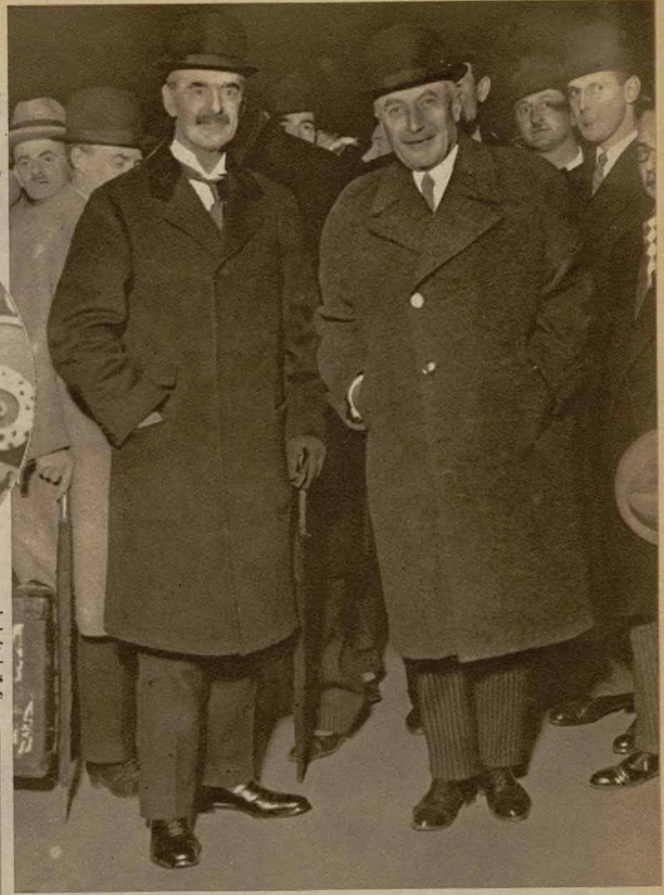
El canciller de los exchequers, Neville Chamberlain, a su llegada a París, recibido por su colega francés, Germain Martin

Este famoso vencimiento del 15 de diciembre, del que ya hemos suficientemente hablado, inspira tal pánico a Europa entera porque no es sino el preludio de una serie de pagos escalonados en los sucesivos semestres.