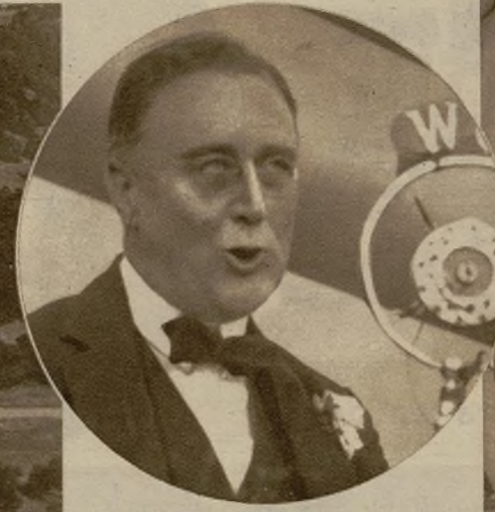
El presidente electo de los Estados Unidos, Franklin Roosevelt, en cuyas inspiraciones para el futuro han de buscar fundamento las normas de equilibrio económico entre los Estados Unidos y los países europeos, actuales deudores de Norteamérica

No se trata ahora de discutir la legitimidad de las reclamaciones del acreedor; no hay que pensar en semejante cosa. Las reclamaciones de los americanos pueden ser más o menos justificadas; los préstamos que antaño consintieron a las potencias europeas tienen un origen más o menos generoso. Nadie pone en tela de juicio el altruismo de la gran República yanqui. Lo que aquí se ventila es un pleito muy distinto.