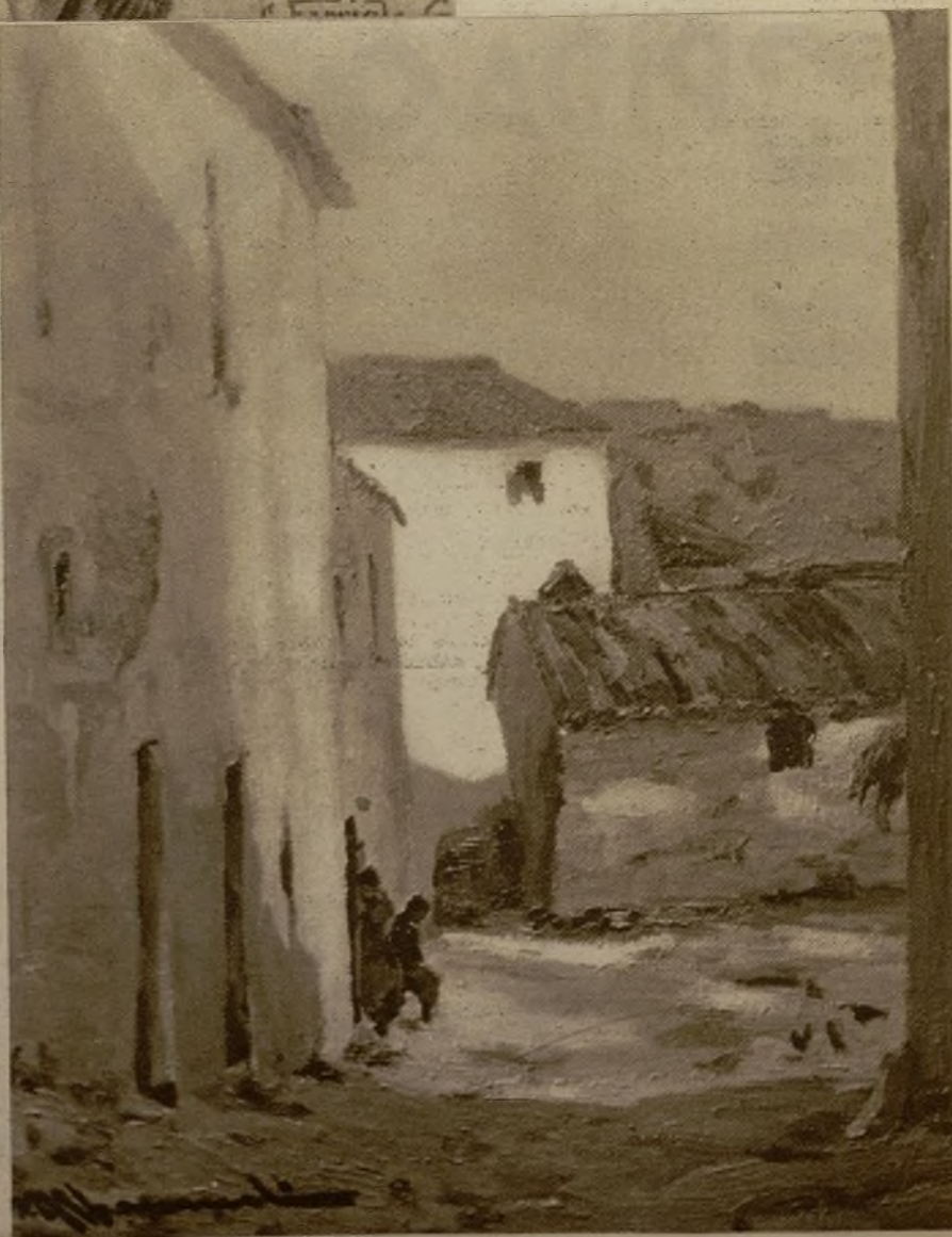
"Callejón del canario", cuadro de Vicente Albarranch