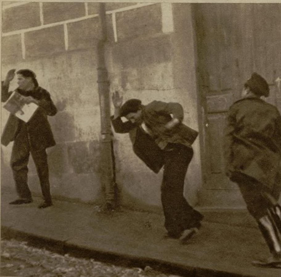
Un huelguista que opuso resistencia a los guardias, reducido a golpes