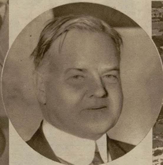
El presidente saliente de los Estados Unidos, Mr. Hoover

El argumento de los países deudores no necesita grandes explicaciones: el mismo interés del acreedor es conservar la gallina de los huevos de oro; si le saca las entrañas para ver lo que contienen, adiós huevos y adiós oro... Si los Estados Unidos quieren seguir vendiendo sus productos a los países de Europa, que son sus mejores clientes, preciso es que no arruinen su posibilidad de comprar en el exterior. Un país con moneda depreciada no tiene más remedio que vivir estrechamente con sus propios recursos. Sin contar con las incalculables consecuencias que tendría el derrumbamiento definitivo de una moneda como la libra esterlina.