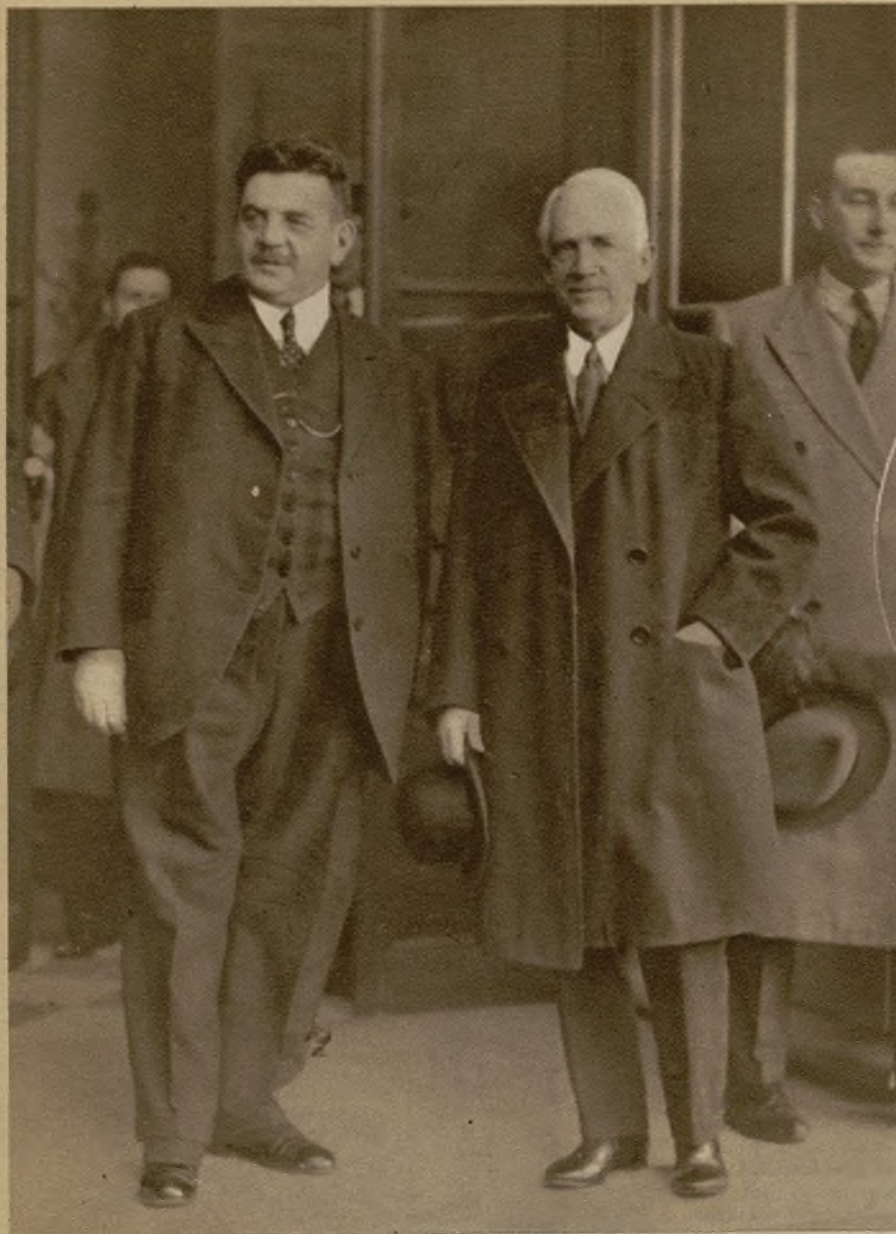
Herriot acude a recibir al señor Norman Davis, enviado extraordinario de los Estados Unidos, para exponer las conclusiones de su país en cuanto a las deudas

La voluntad cerrada, intransigente, de Norteamérica, ha precipitado en estos días a nuestra pobre Europa en un mar de confusiones y de inquietudes.