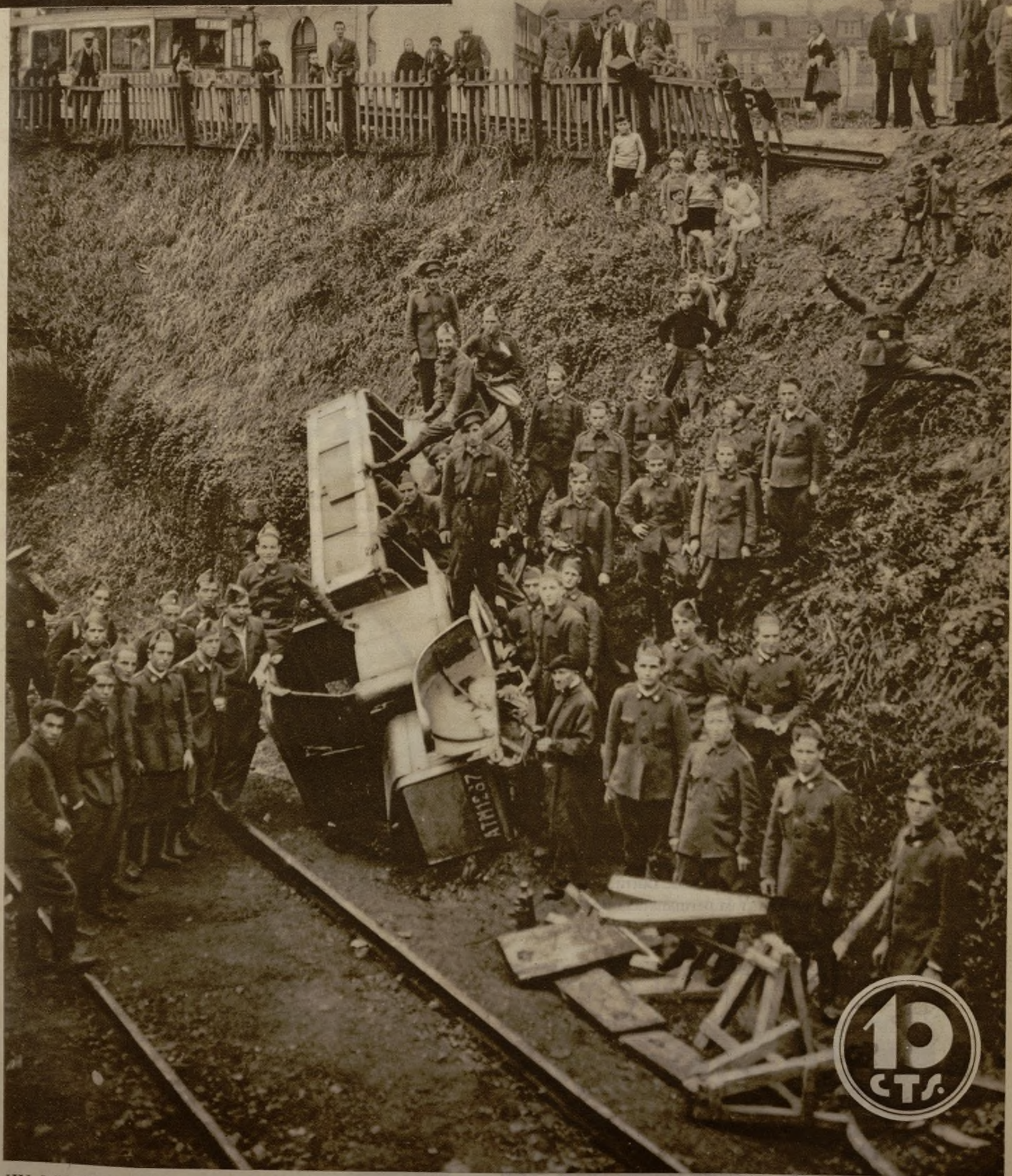
UN ACCIDENTE QUE PUDO TENER CARACTERES DE GRAN CATASTROFE.—De milagro viven estos soldados de Intendencia, que ocupaban el camión que aparece destrozado en la foto. Al tratar el conductor de evitar el choque con un tranvía, en las inmediaciones de La Coruña, el vehículo volcó y rodó por el terraplén, hasta llegar a la vía. En aquel momento avanzaba un tren a muy poca distancia, y por fortuna el maquinista logró parar cinco metros antes del lugar en que habían caído, entre los raíles, los ocupantes del camión