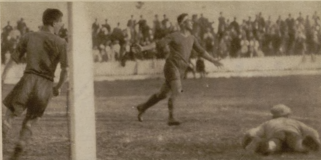
Los andaluces se impusieron a los donostiarras por resistencia y buen juego. Así se produjo el tercero de los cuatro tantos que se hicieron a Beristain