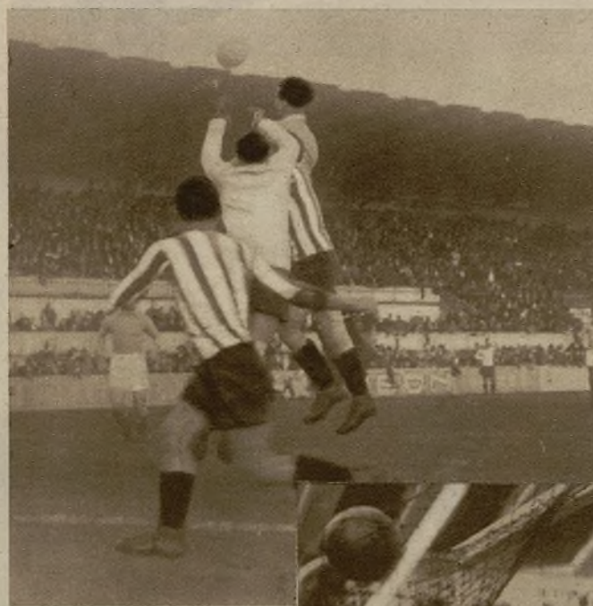
El partido Oviedo-Spórting de Gijón no fué, como podía esperarse de la ventaja de actuar en campo propio, un triunfo del primero. Después de un partido accidentado, en el que los gijoneses emplearon un gran entusiasmo, terminó el encuentro con empate a tres tantos. Un despeje del portero gijonés