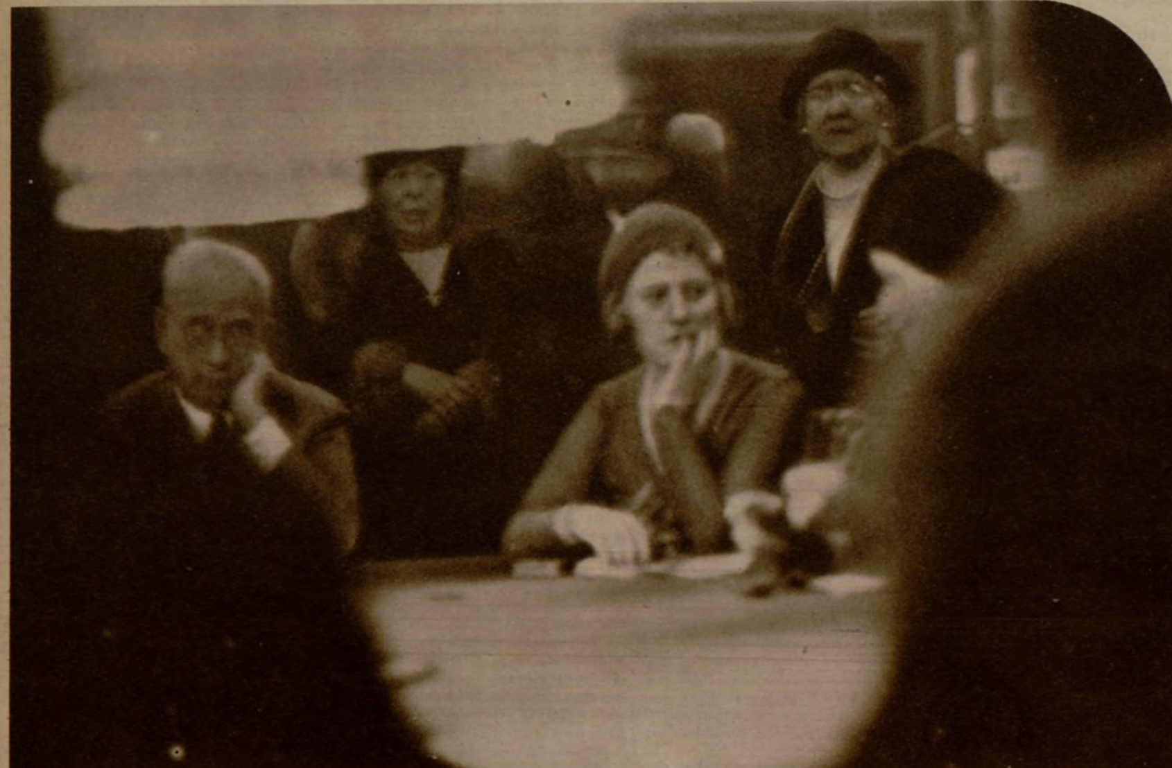
Una mesa de bacarrá en Montecarlo.

Por supuesto no creo que exista semejante orden. Las equivocaciones de los "croupiers", que he visto muchas veces rectificar y que hasta he rectificado yo misma, no siempre favorecen a la Banca. Pero el hecho es que se produce con bastante frecuencia. Hasta entonces nadie les había dado importancia; pero, a partir de la aparición del artículo empezaron los recelos, las quejas... A cada jugada surgía alguien que creía que la cuenta estaba mal hecha y que obligaba a contar de nuevo. Casi siempre el empleado había sumado bien, claro; pero cuando había te-