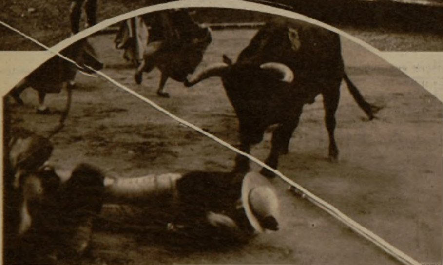
Las corridas de toros de Pamplona.—Este picador está en un grave trance, del que le salvará el capote oportuno de Barrera