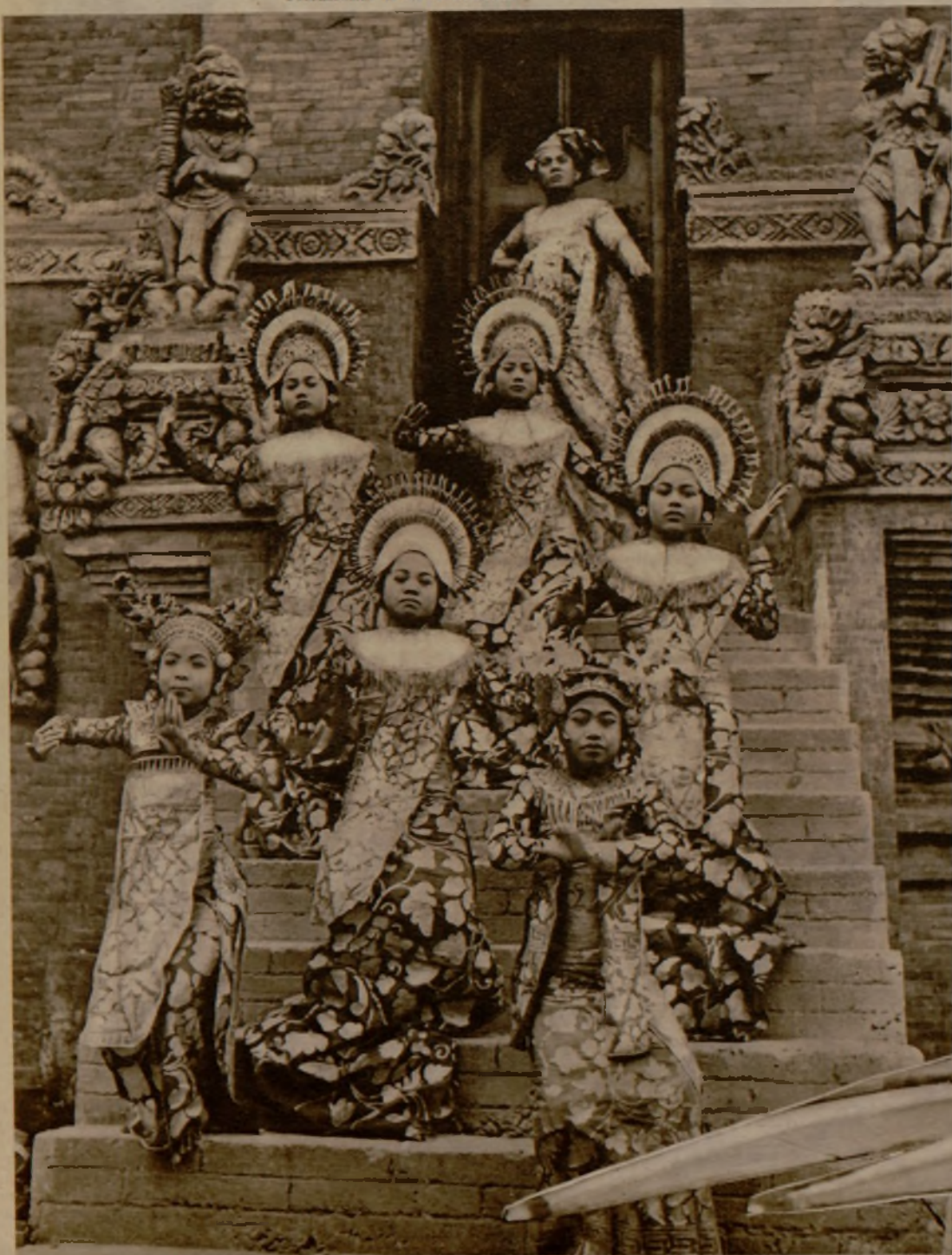
En la Exposición Colonial de París, este grupo de danzarinas de Java, ataviadas del modo exótico que se ve en la foto, han ofrecido un sugestivo espectáculo de su arte original