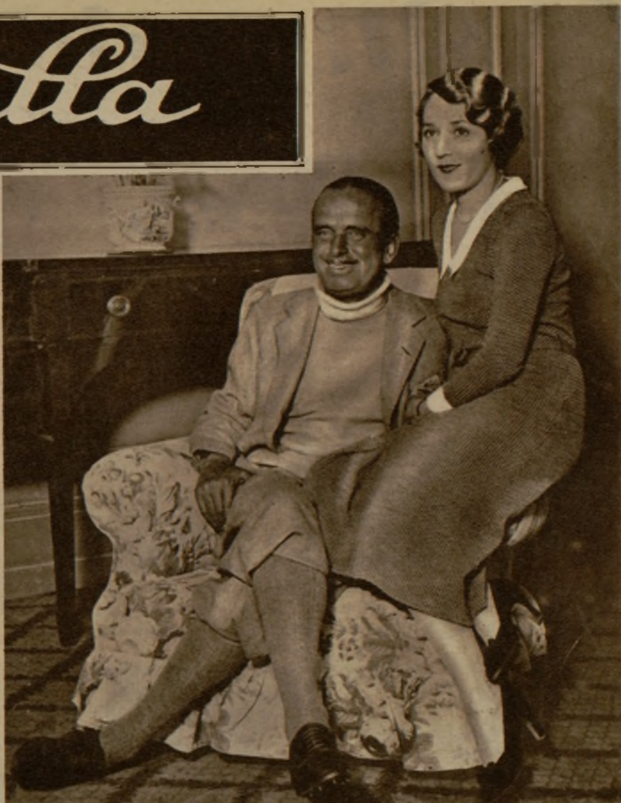
El matrimonio Mary Pickford-Douglas Fairbanks partirán en breve de Londres para regresar a Norteamérica. Se dice que antes de tornar a Los Angeles visitarán el Canadá