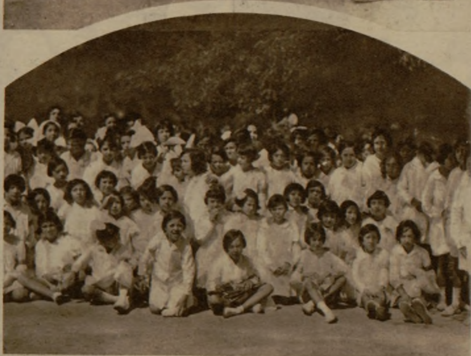
Los pequeños escolares de los Centros municipales de enseñanza madrileños no sufren el agobio del local cerrado. He aquí a chicos y chicas en las clases al aire libre que se celebran en los Viveros de la Villa y que han constituido una medida entusiastamente plausible.