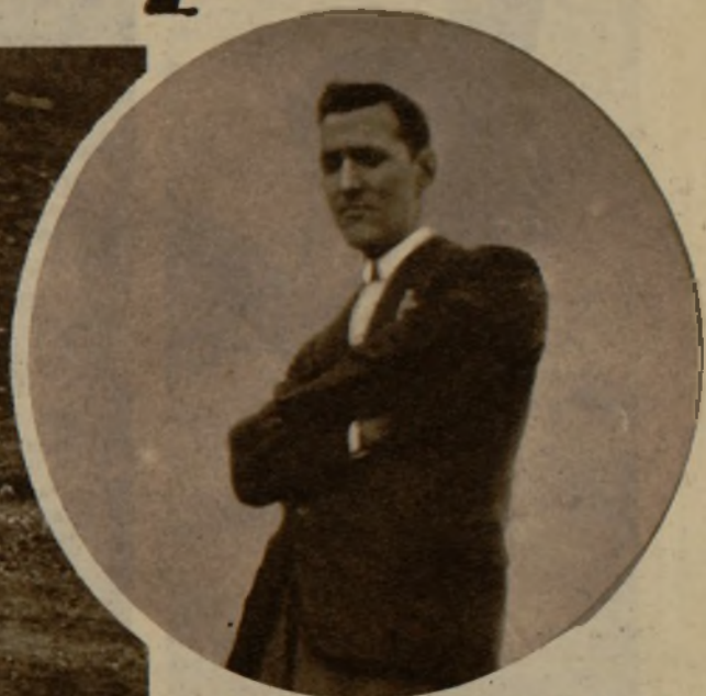
La Universidad de Verano de Jaca ha inaugurado sus excursiones de la temporada con una jira a los Pirineos, a la que asistió este alegre grupo juvenil. En el círculo, el famoso alpinista vasco Andrés Espinosa, que ha marchado a la India para intentar coronar el Monte Everest