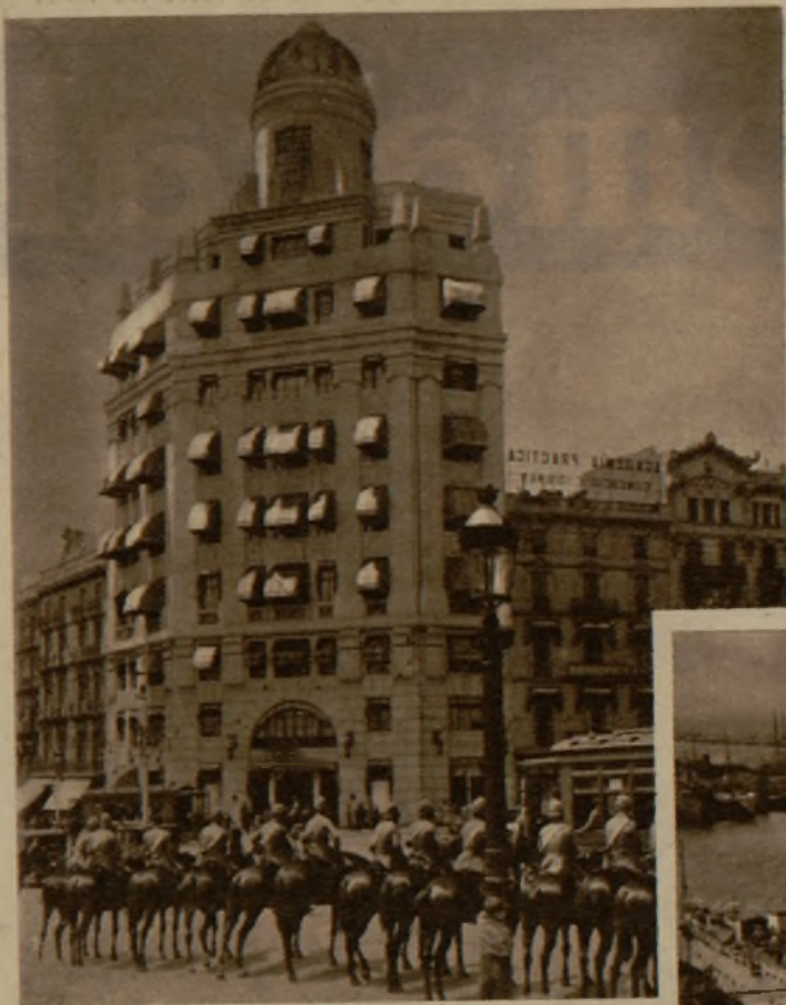
La Central telefónica de Barcelona custodiada por un piquete de la Guardia de Seguridad. En la foto de la derecha, el acorazado "República", llegado al puerto de Barcelona con motivo de los conflictos sociales