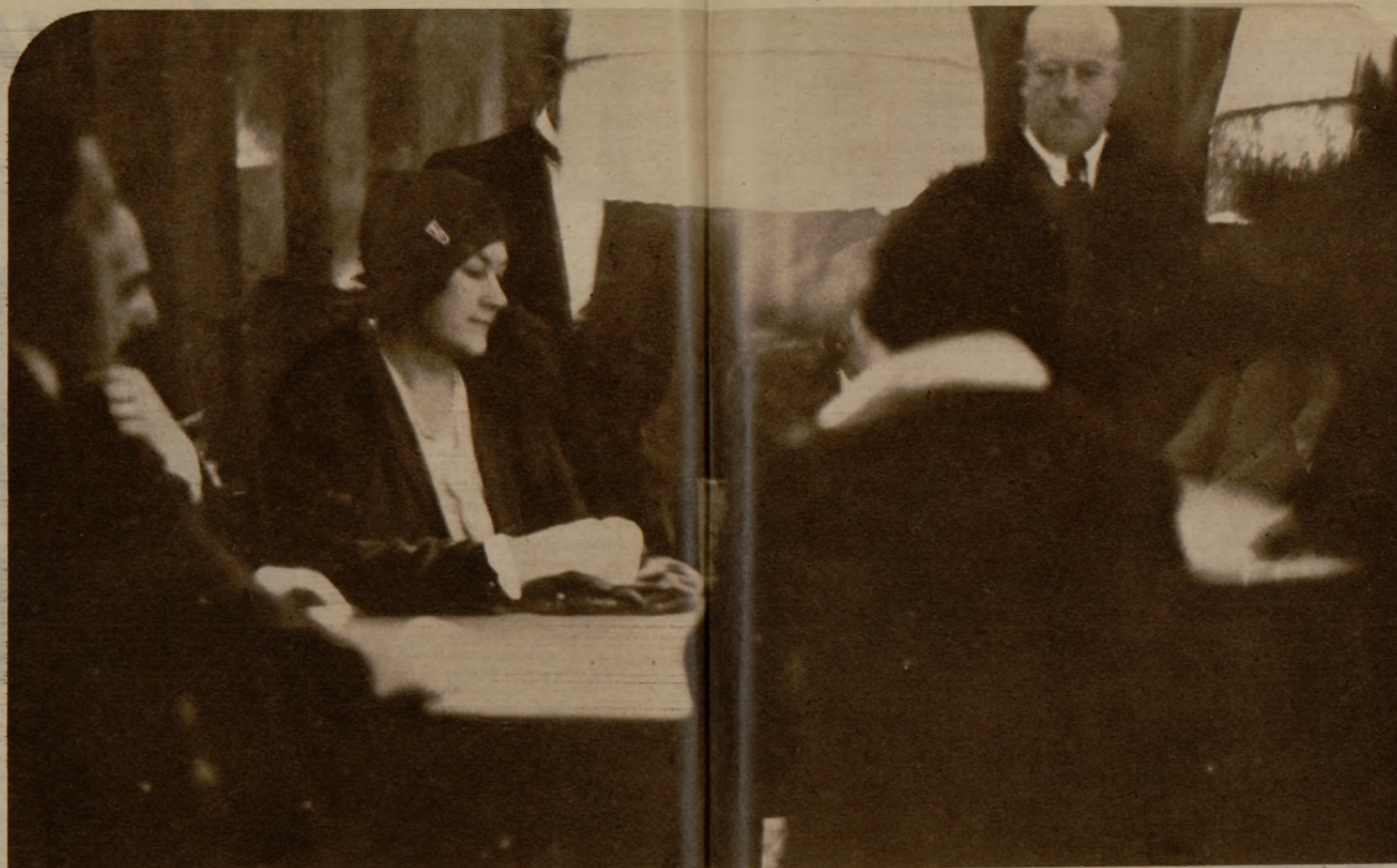
Escenas del juego sorprendidas por Gutman. Las condiciones en que se ha hecho esta fotografía, como las que siguen, explican y disculpan que sean defectuosas.

Mucha gente comprendía que todo era una novela, y se encogía de hombros; pero había otros que lo creían y algunos hasta se pasaban las noches en las terrazas, mirando a la bahía, a ver si llegaba el buque fantasma... La moneda, que hasta entonces no se le había ocurrido a nadie examinarla, comenzó a reconocerse escrupulosamente todo el mundo y en cuanto un billete tenía el