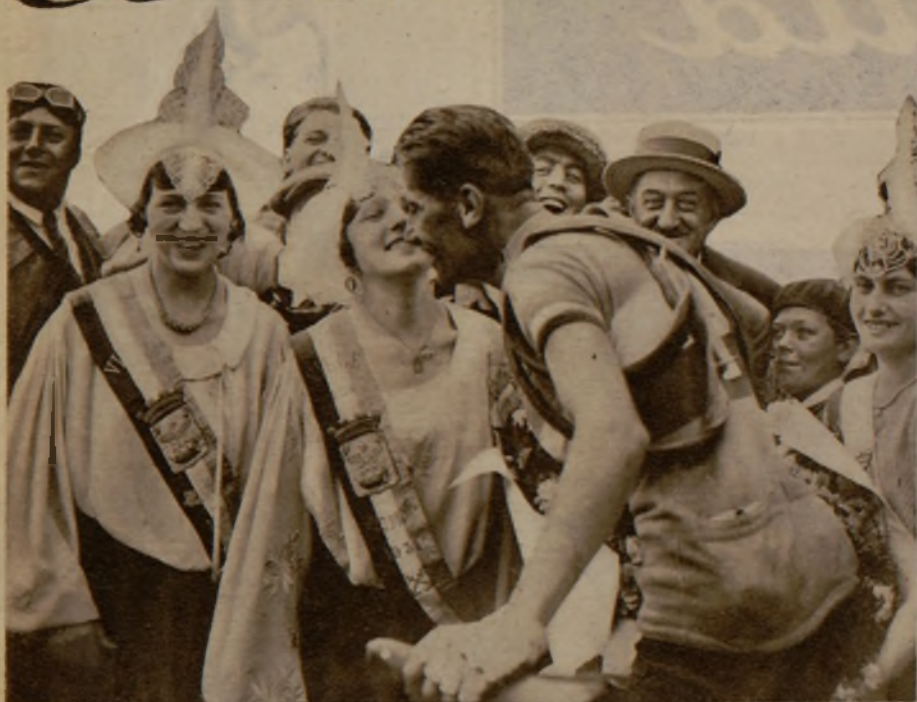
De la vuelta a Francia en bicicleta. Es tradicional que una linda muchacha de Sables d'Olonne premie con un beso al vencedor de la etapa Vannes-Les Sables. En este caso se trata de Charles Pélissier que, con muy buen acuerdo, no quiere renunciar a la tradición