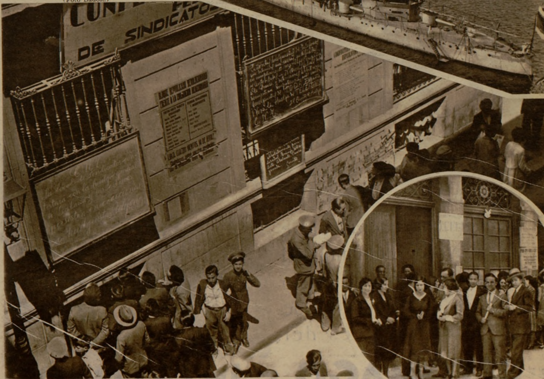
El local social de la Confederación Nacional del Trabajo, en Madrid, donde se reúnen los sindicatos Unicos. Los carteles colocados en la fachada reflejan la actividad que los sindicalistas emplean con motivo de la huelga de Telefonos. A la derecha, un grupo de telefonistas ovetenses a la puerta del Centro social de los Sindicatos