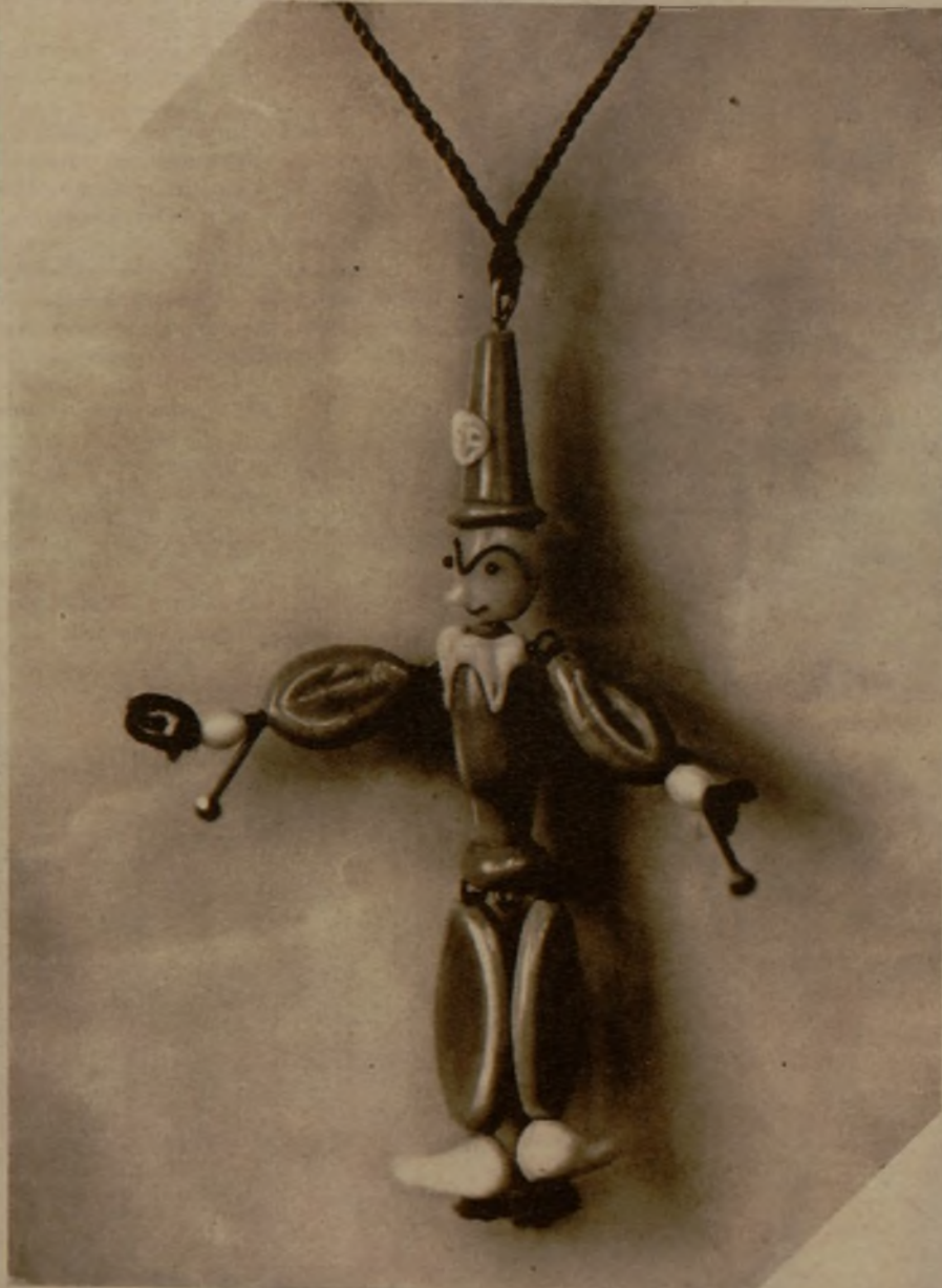
Reproducción de uno de los "fetiches" más usados por los jugadores de Montecarlo

sino un imponente acorazado, con bandera brasileña.