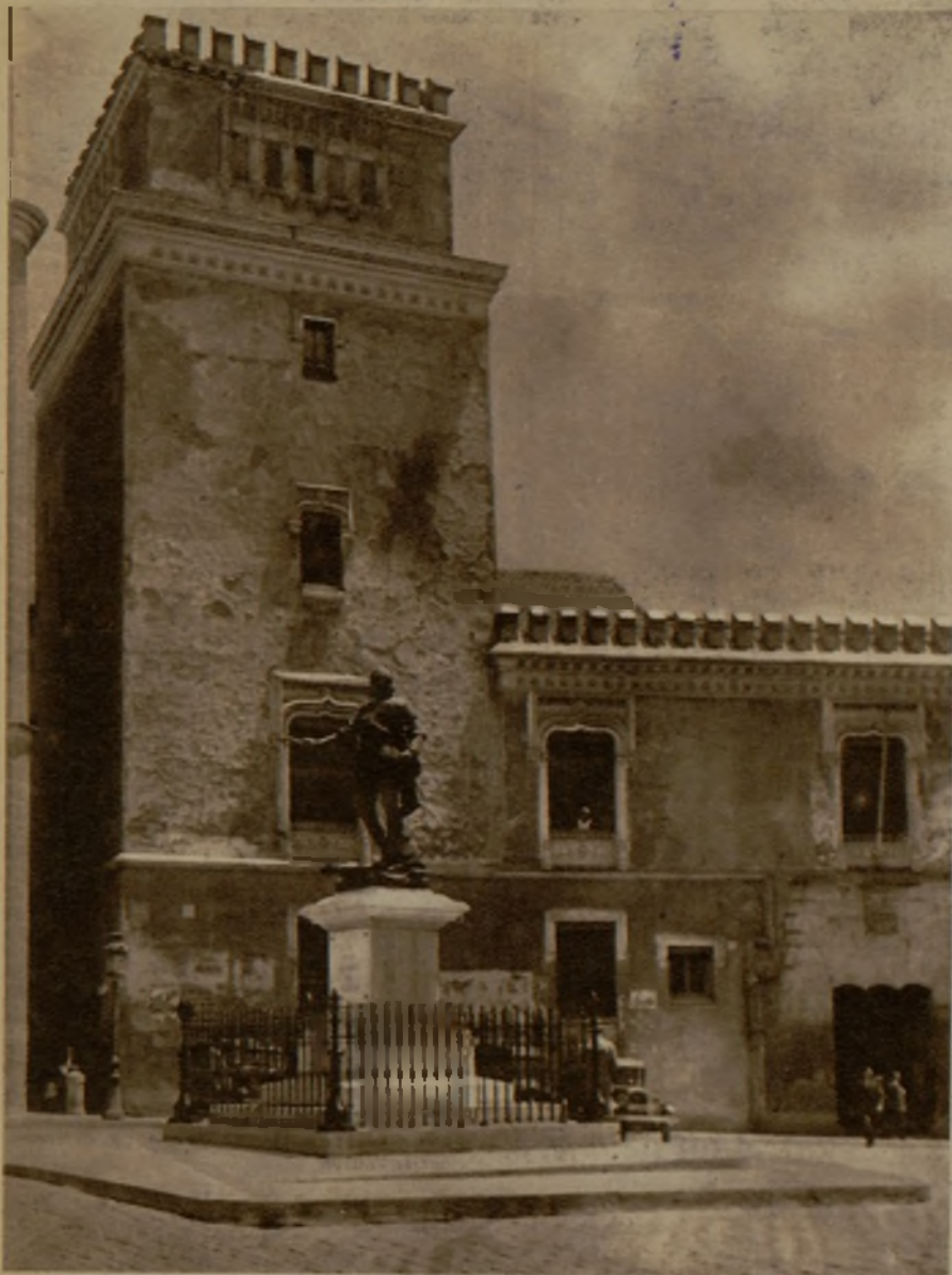
La histórica Torre de los Lujanes, en la plaza de la Villa, lugar de cautiverio de Francisco I de Francia, durante el reinado de Carlos V, que ha sido denunciada por hallarse en peligro de derrumbamiento.