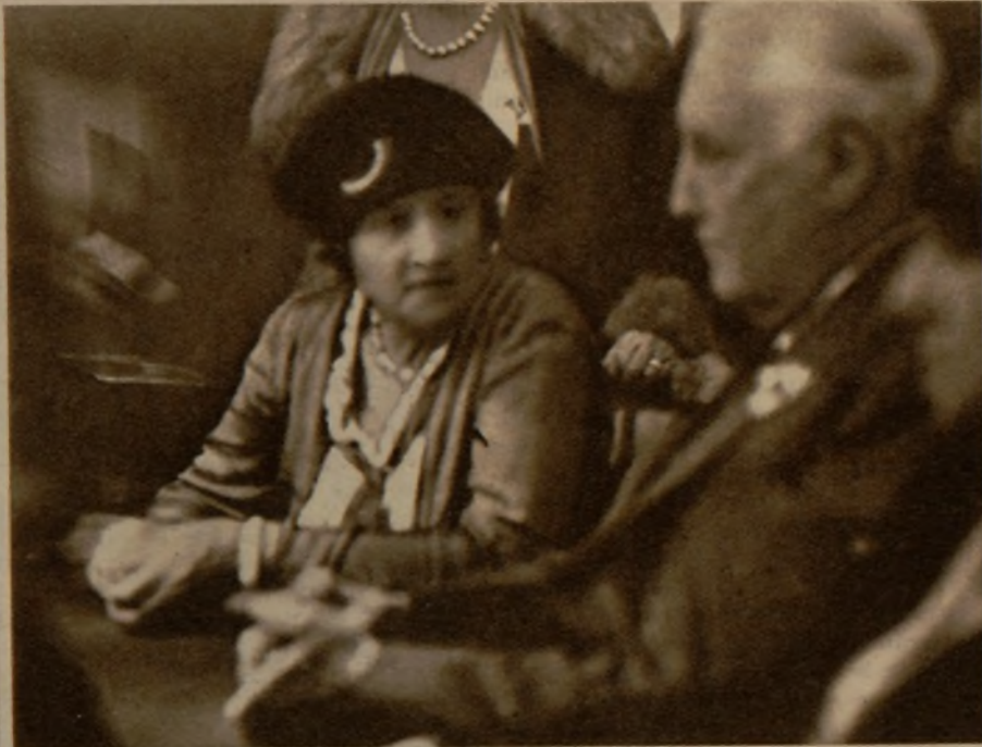
En la sala privada de Montecarlo