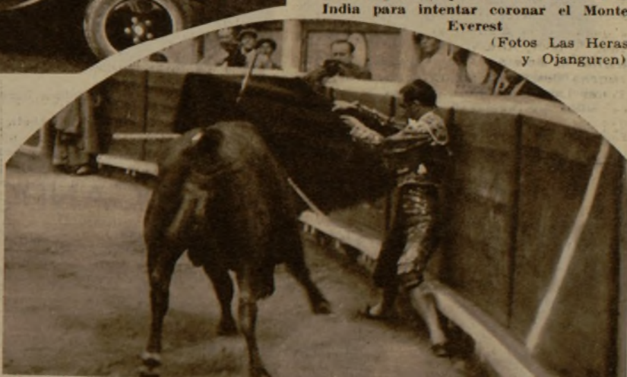
Y aquí aparece el mismo diestro valenciano en un arriesgado pase, pegado a los tableros, con el que inauguró una de sus faenas de muleta