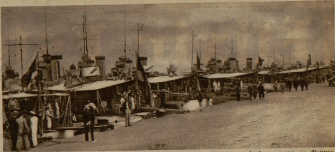
Ante el anuncio de una huelga en Barcelona que afectaría a los ramos de luz y agua, se dispuso que saliera para la capital de Cataluña la escuadrilla de destructores, que aparece atracada al muelle de San Beltrán