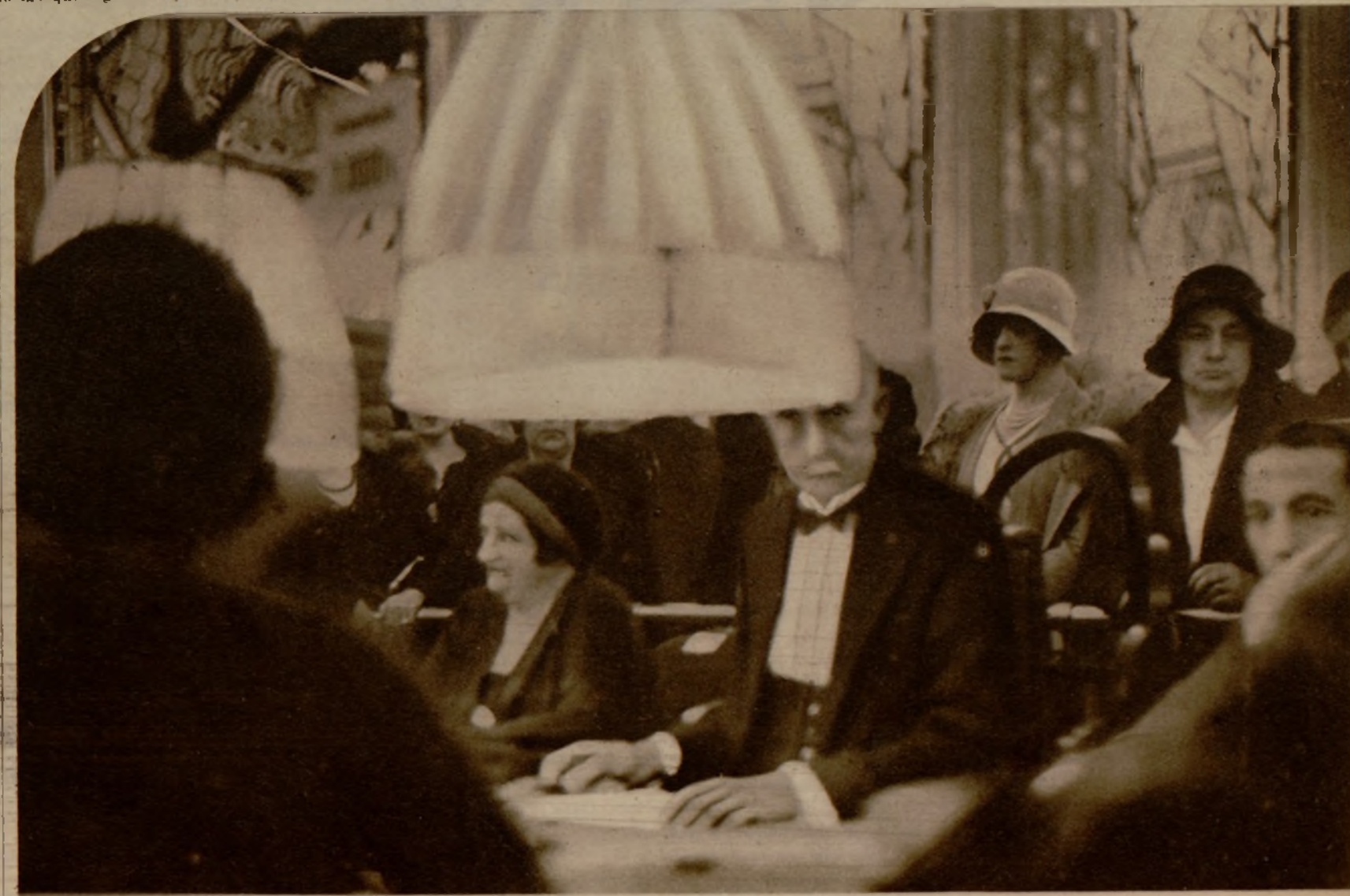
El dramático instante en que la bola va a detenerse.

—Pues que hace algún tiempo, después de la guerra ya, una Agencia de información, a la que el Casino se negaba a subvencionar, lanzó en pleno mes de diciembre, es decir, cuando principiaba aquí la temporada, la noticia de que en Mónaco había una terrible epidemia de tífus. ¡Figúrese usted al pánico que se produjo! Los jugadores son gentes de nervios débiles, gentes aprensivas y miedosas. En cuarenta y ocho horas se quedó vacío el Casino. El hotel en que yo vivía entonces, que tenía reservadas habitaciones a dieciocho viajeros, recibió en un día telegramas y telefonemas de quince de ellos, diciendo que renunciaban al viaje, y de cuarenta