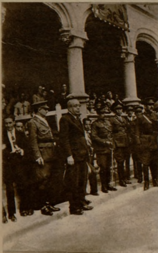
El ministro de la Guerra, señor Azáñ, haciendo entrega a la Academia de Artillería, en Segovia, de la bandera de la República