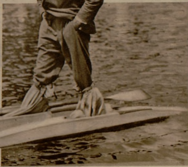
Este es un nuevo modelo de flotador que fué presentado, con brillante éxito, en la inauguración de las regatas de Henley (Inglaterra)