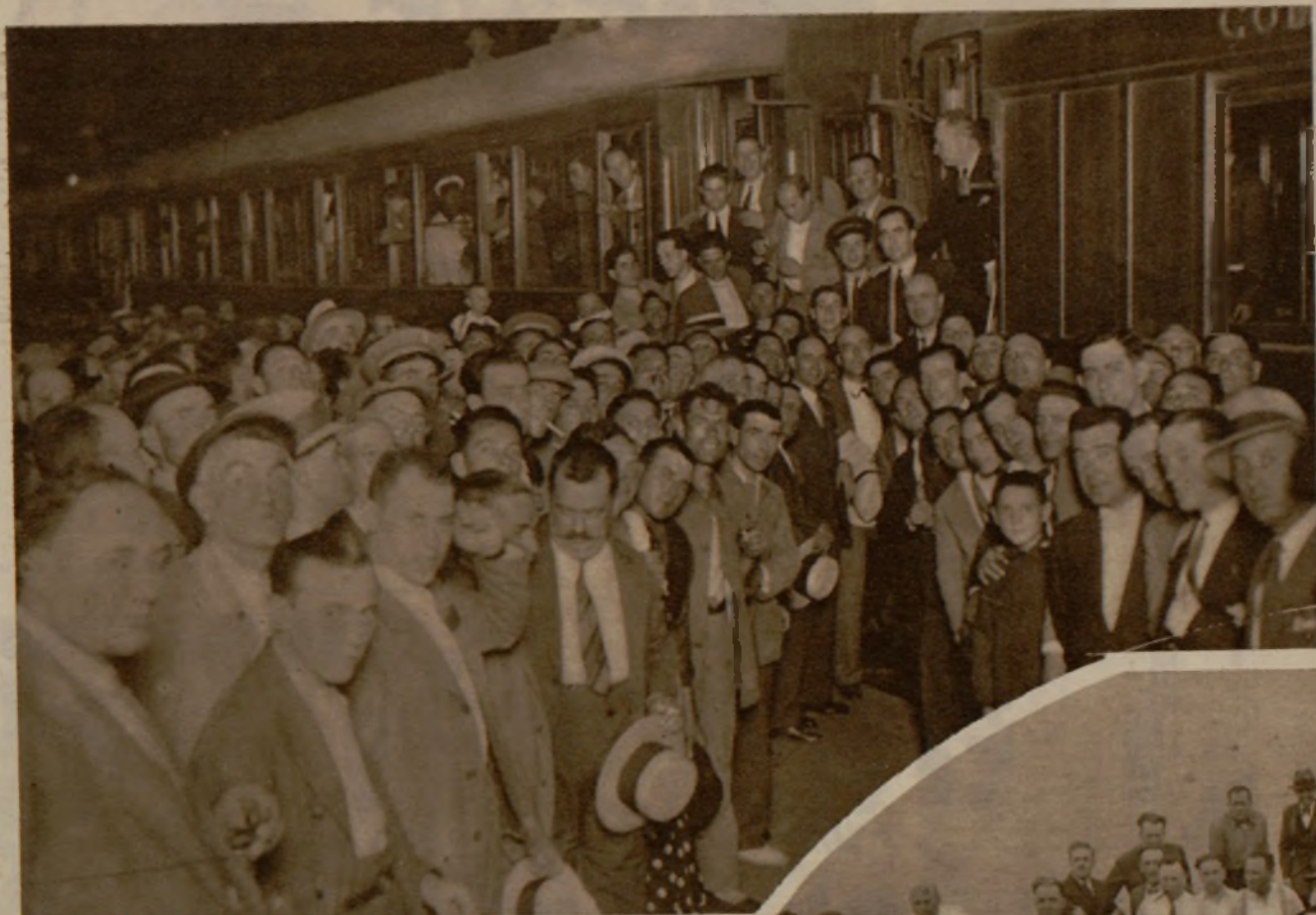
El pueblo de Valencia despiden con gran entusiasmo a sus diputados constituyentes, que marchan a Madrid