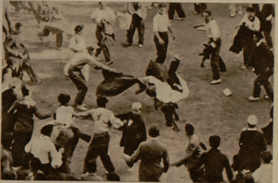
Un espontáneo aparatosamente revolcado por una vaquilla