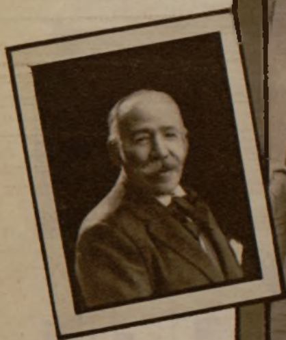
■ Mariano Benlliure, famoso escultor, que figura en este Concurso entre los miembros del Jurado Nacional.