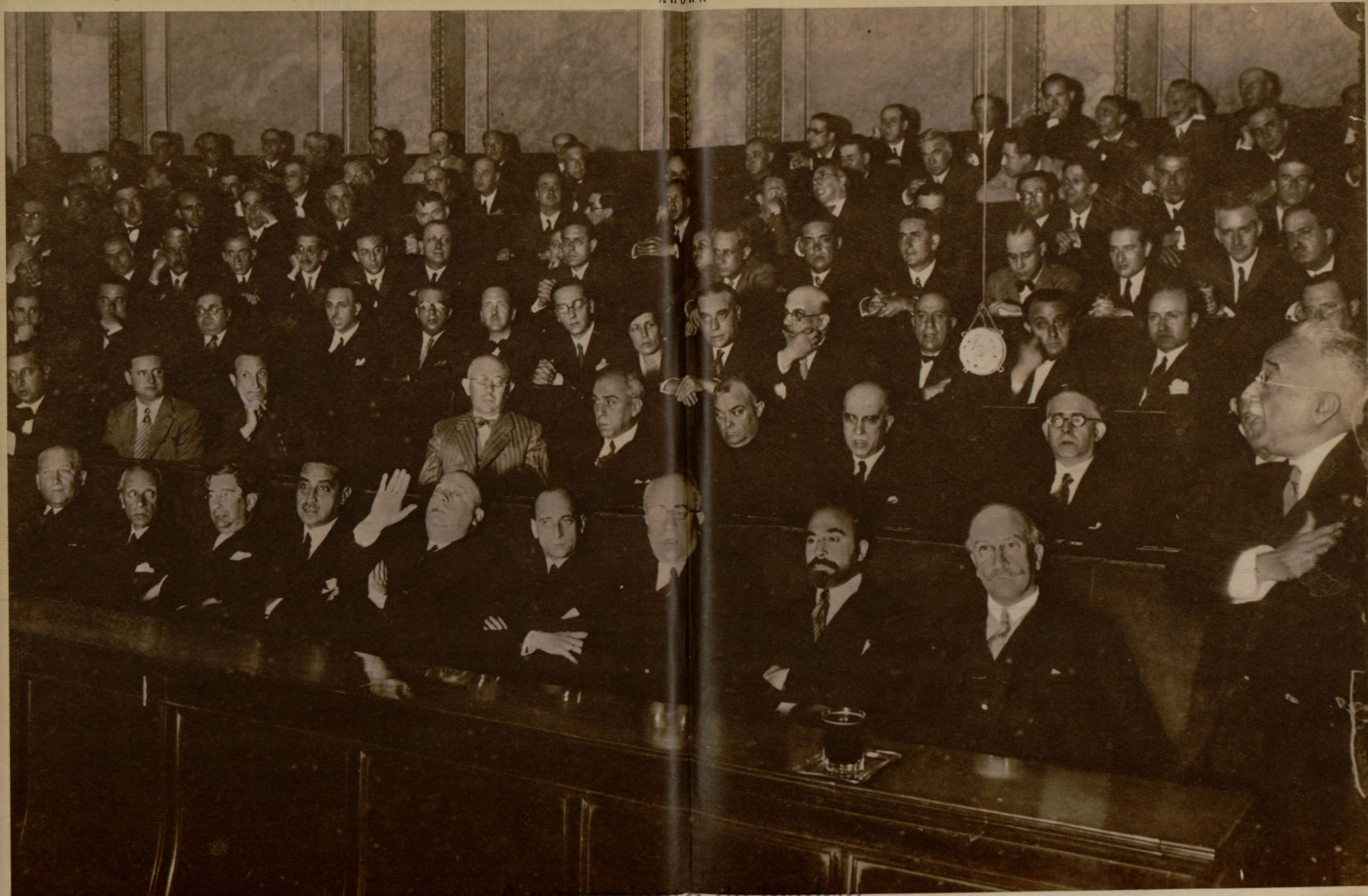
Alcalá Zamora, a la cabeza del Gobierno y ante la Asamblea en pleno, resigna los poderes que el pueblo otorgó el 14 de abril al Gobierno provisional y dice: "Os entregamos la República con las manos limpias de sangre y de codicia." "Os entregamos la República con plena soberanía, segura, indestructible... libre del empuje militar y del cardillo político." "Los militares, como protectores; innecesarios como dominadores; imposibles como rebeldes. Sed severos."