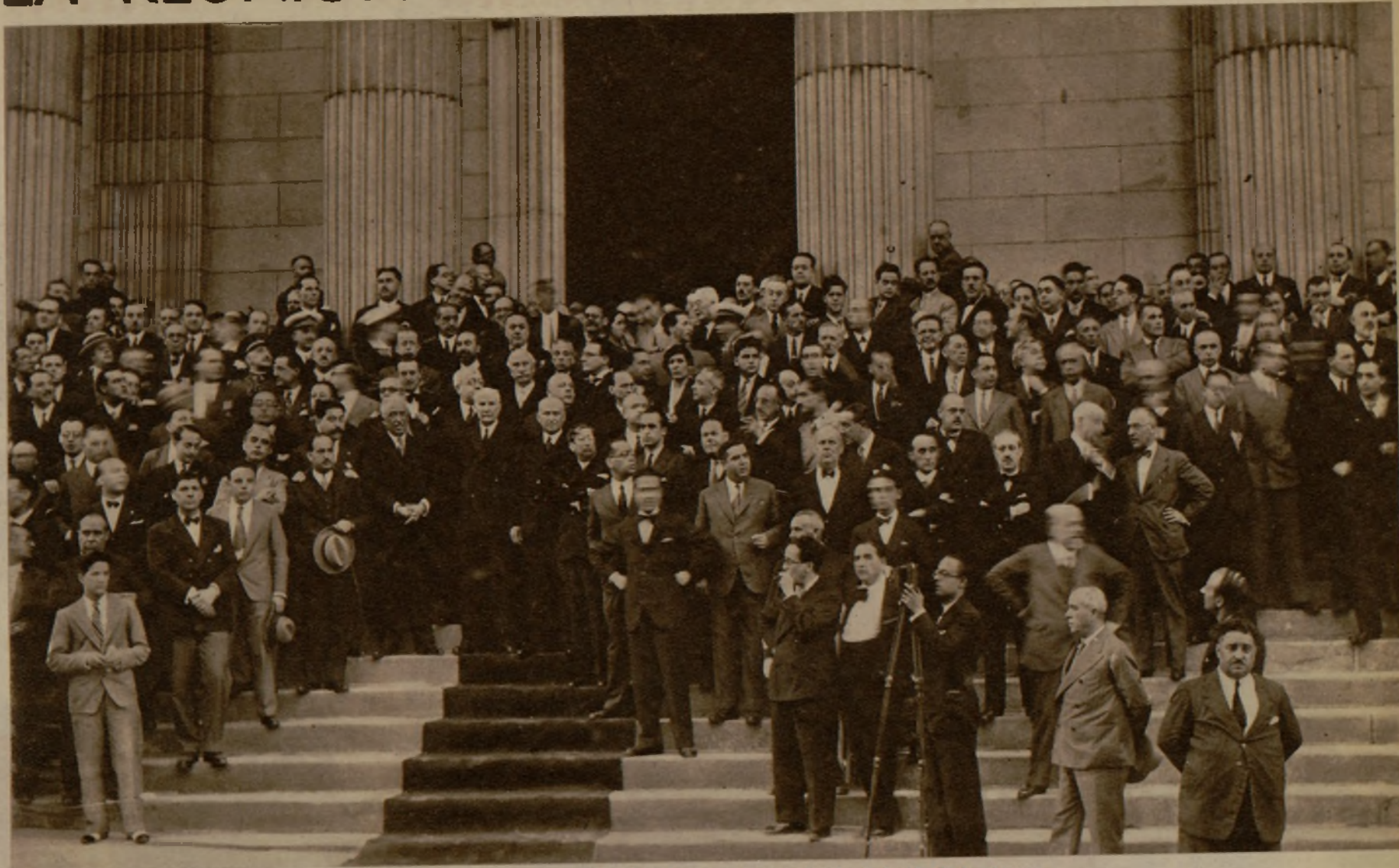
El Gobierno en la escalinata del Congreso, presenciando el desfile de las tropas