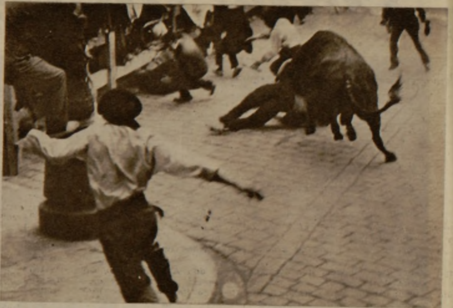
En el encierro del día 12 un toro arremetió contra un grupo, revolcando a varios aficionados al clásico festejo