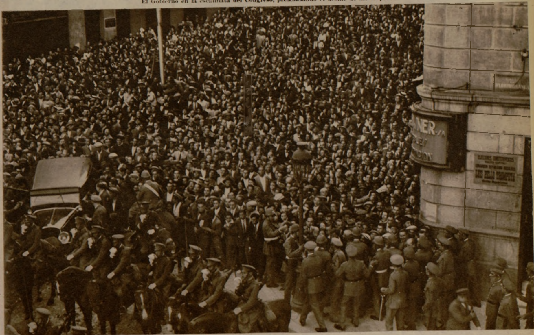
El público congregado en los alrededores de la Cámara Constituyente para presenciar la llegada del Gobierno