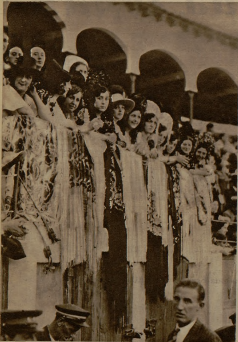
Bellas pamplonicas que el domingo presidieron una corrida a beneficio de los obreros sin trabajo