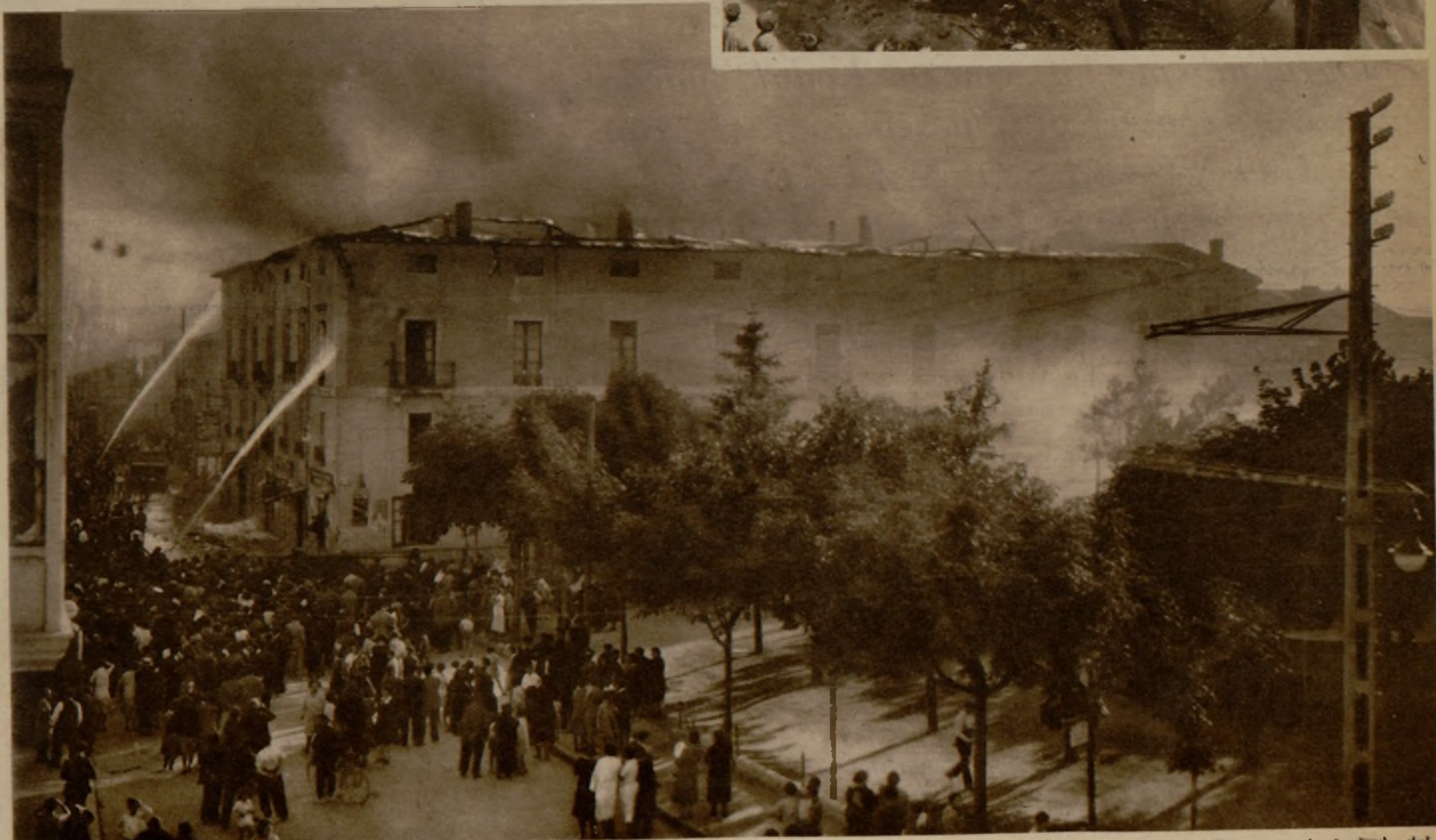
El momento culminante del horroroso incendio que ha destruido totalmente varios edificios en Miranda de Ebro. Arriba, los bomberos de Burgos en la fachada del parador, donde se inició el siniestro, que ha dejado a numerosas familias sin albergue