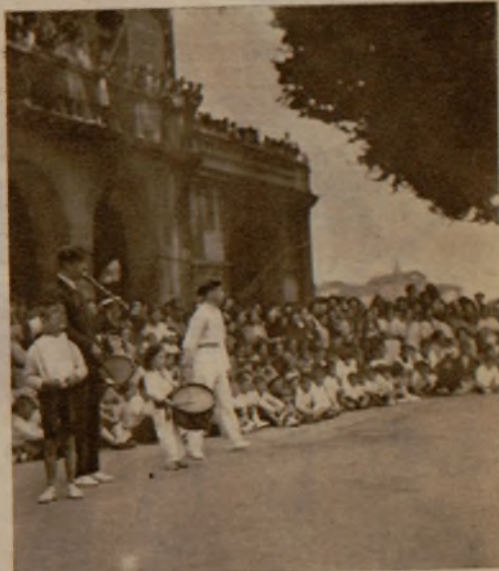
El tamborilero más joven de España ha hecho su debut en las fiestas vascas del domingo en Lekeitio