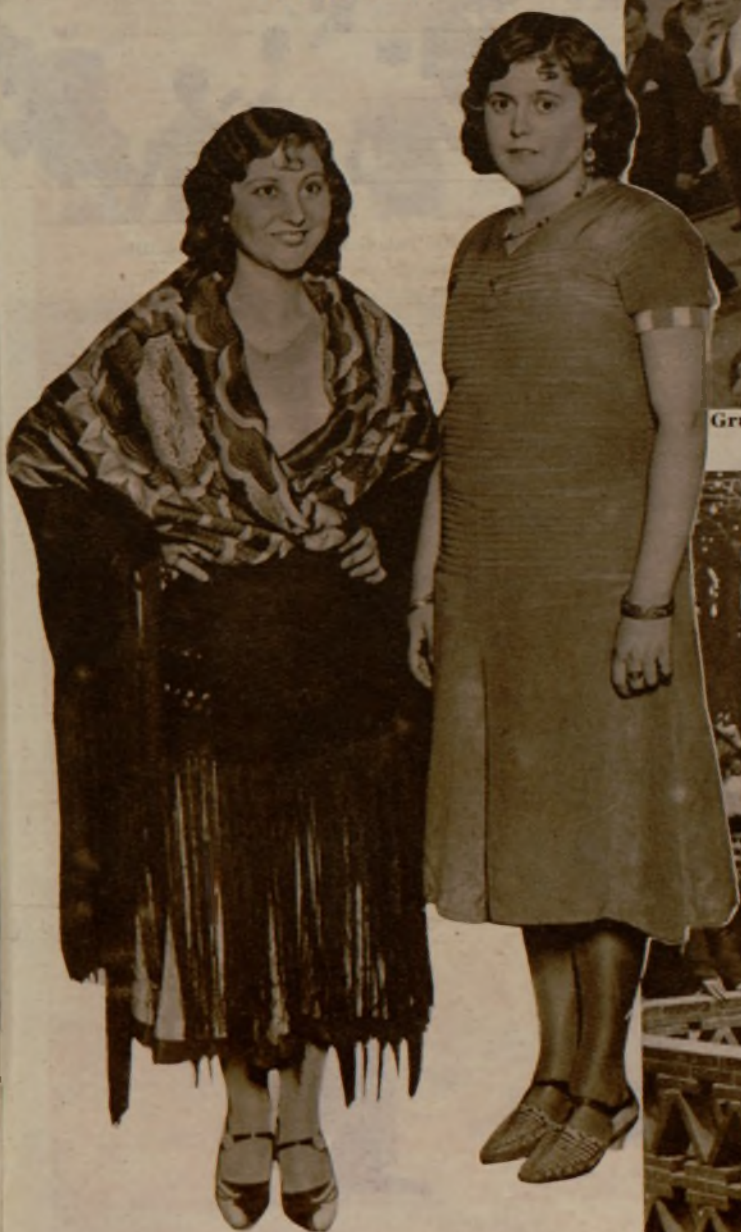
La verbena de las Arenas, en Valencia. He aquí la guapísima valenciana a quien tocó en suerte un soberbio mantón