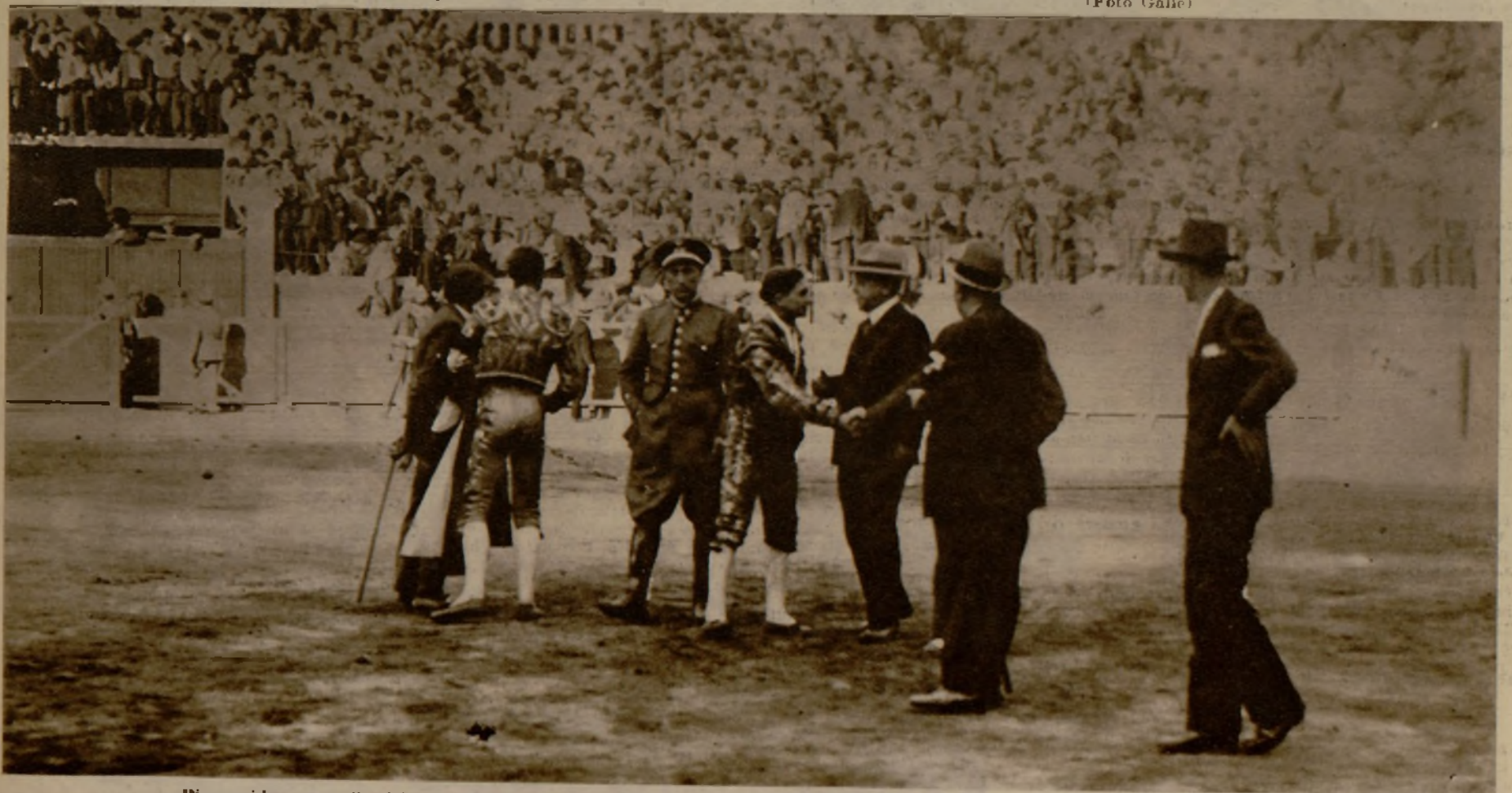
Bienvenida, en medio del ruedo, solicitando el gobernador civil su seguridad personal, en vista de la airada actitud del público