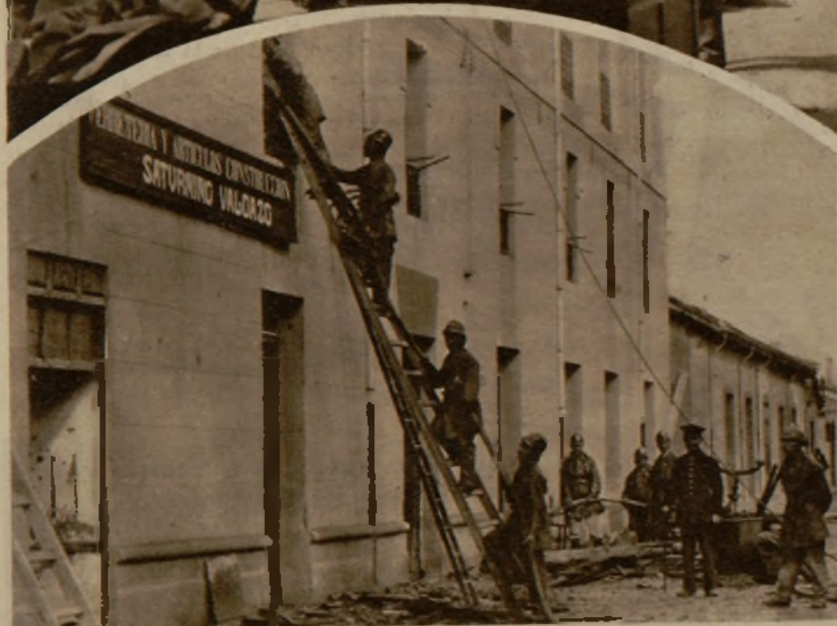
Los bomberos trabajando en la extinción del incendio. Arriba, muebles y enseres salvados del siniestro