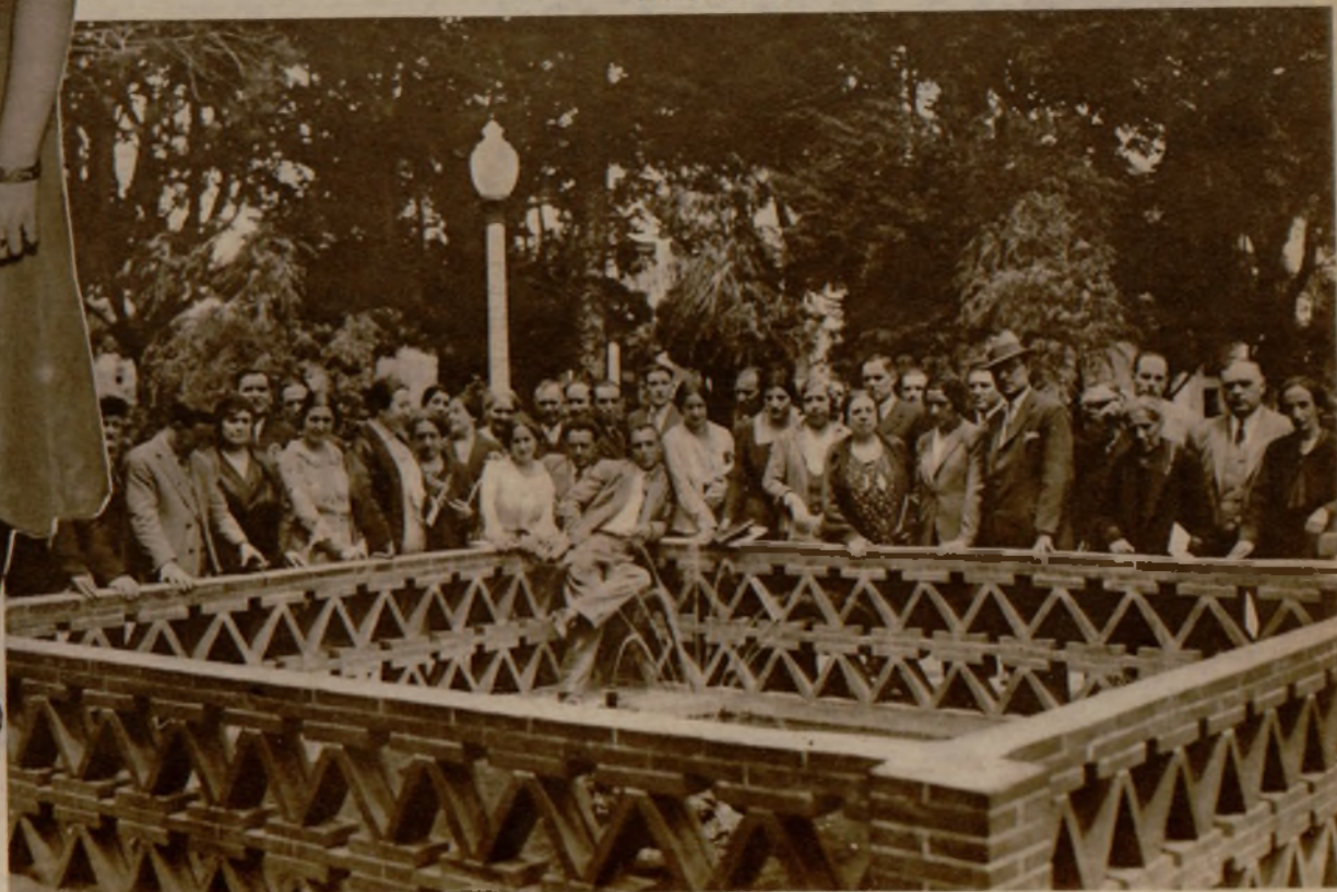
Maestros riojanos en su visita a los monumentos de Soria