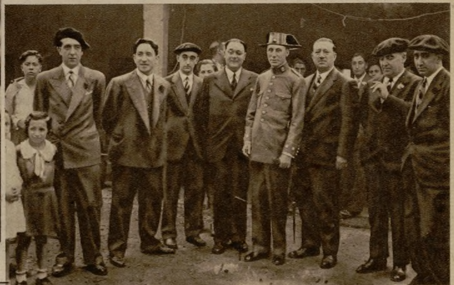
El presidente del Tiro de Eibar, con el equipo guipuzcoano, el presidente del Tiro de Logroño y el teniente coronel de la Guardia civil, durante el concurso