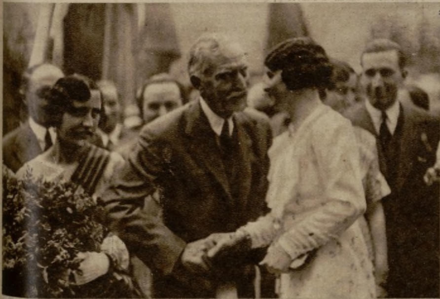
Señoritas entregando un ramo de flores al presidente de la Generalidad durante su estancia en Suria