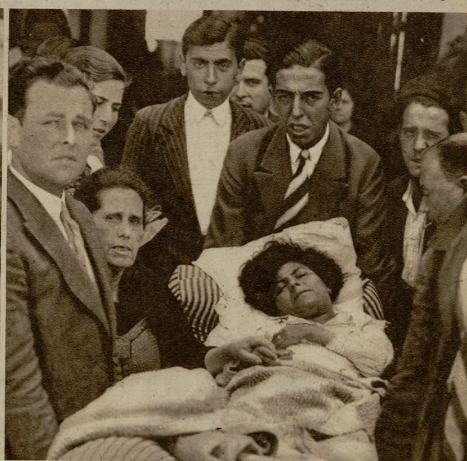
Al regresar a Valencia la peregrinación de enfermos que fué a visitar el famoso Santuario de Lourdes. En la foto, un paralítico es conducido al coche para reintegrarse a su domicilio