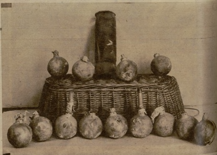
La Policía zaragozana ha encontrado en una cueva catorce bombas cargadas, las que una es de gran tamaño, y se sospecha que esté cargada con trilita