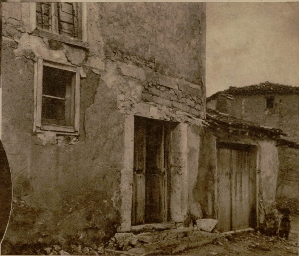
Fachada de la casa donde estuvo secuestrado el niño, el cual fué encontrado por unas vecinas que asistían a la madrastra enferma al oírle hacer alusiones al secuestrado