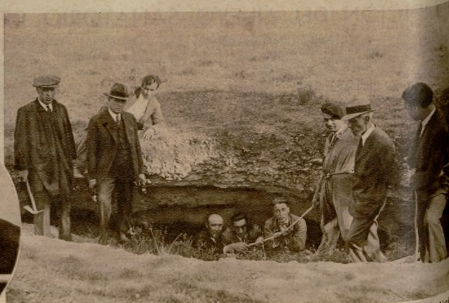
Lugar donde fueron encontradas las bombas. El comisario jefe y agentes de Policía reconociendo la cueva