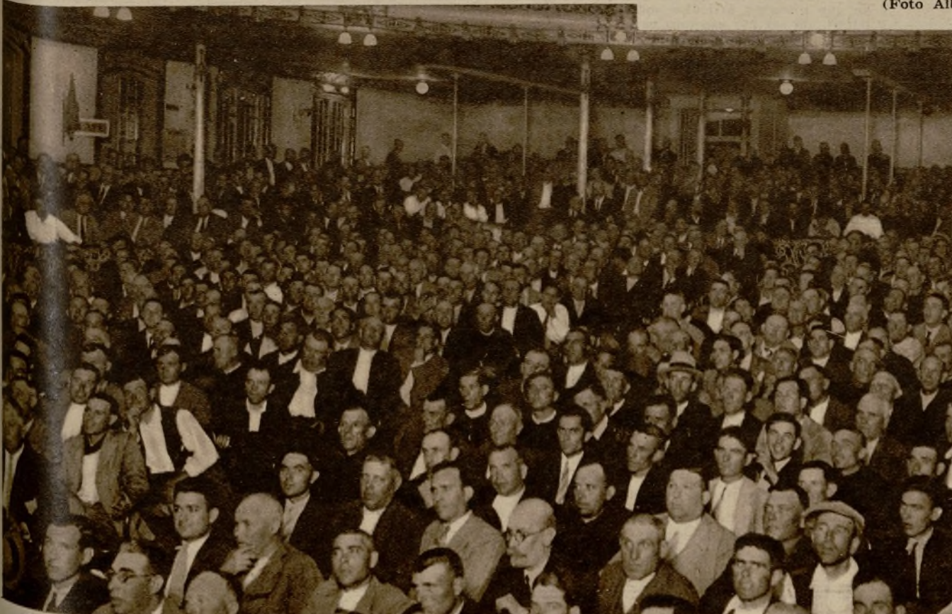
Aspecto que presentaba la sala del teatro Apolo durante la Asamblea de fuerzas vivas, reunida para tratar del aprovechamiento de las aguas del río Júcar, conforme a un reciente decreto de Obras Públicas (Fotos Lázaro y Alberto Muro)