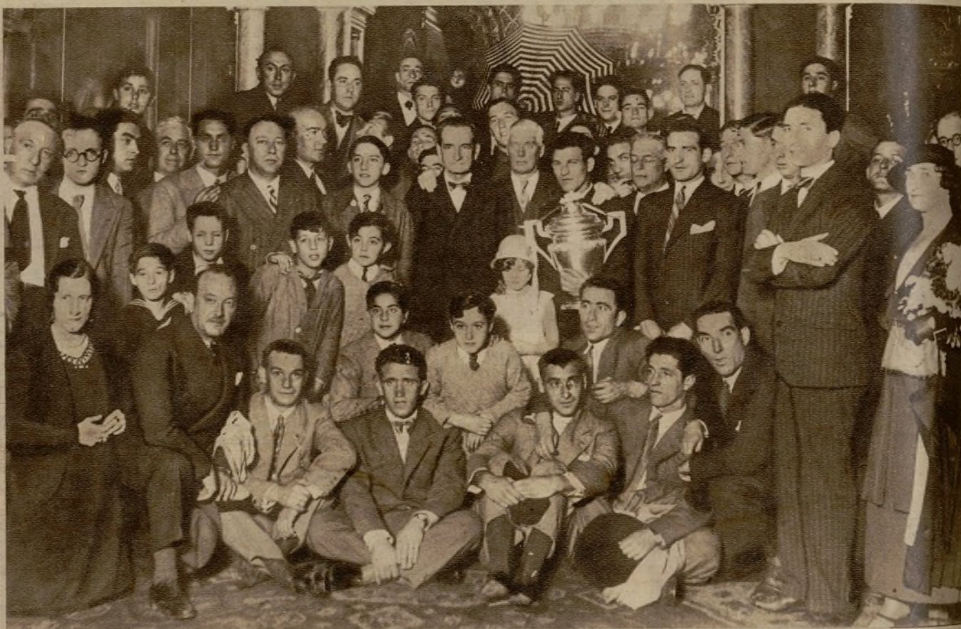
Al llegar a Bilbao los equipiers del Athlétic, después de su resonante victoria sobre el Barcelona, han sido recibidos con todos los honores y entusiasmos en el Ayuntamiento de la invicta villa. En la fotografía aparecen los jugadores con su trofeo y las autoridades bilbaínas