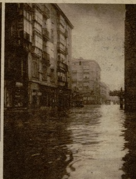
El persistente temporal de agua en el norte de España ha dado lugar a importantes inundaciones en diferentes ciudades norteñas. He aquí tres aspectos de Santander bajo los efectos de las pertinaces lluvias. A la izquierda: la entrada del Ayuntamiento; en el centro: los automóviles y camiones detenidos en la vía pública, y a la derecha, la inundación en una calle