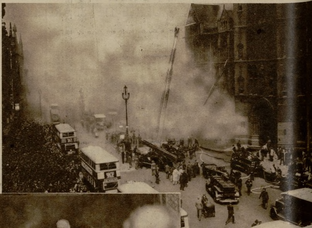
En el "building" de la Compañía de seguros "Pruden" se declaró un formidable incendio que estuvo a punto de destruir el edificio. La rápida intervención de los parques de bomberos evitó que la catástrofe se consumara