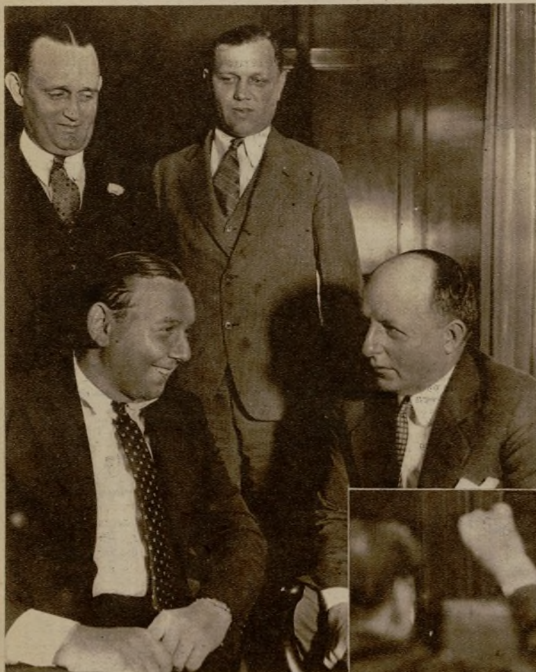
Continúan con gran actividad las pesquisas para hallar a los misteriosos autores del asesinato del baby Lindbergh. En el sumario siguen interviniendo personajes de la más diversa condición, desde millonarios a contrabandistas. En la foto se ve al conocido "gangster" Harry Fleischer en el momento de ser interrogado por el juez instructor