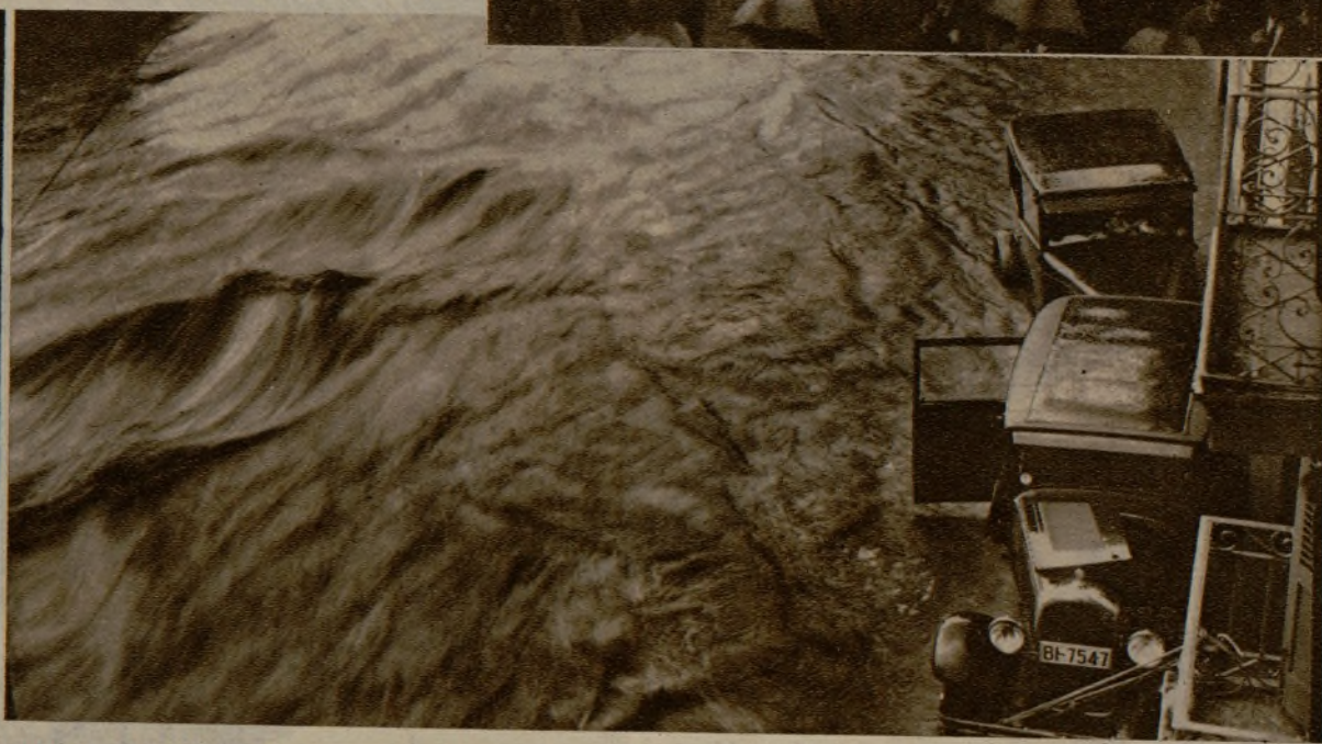
Las inundaciones en Somorrostro (Vizcaya) revisiten gran intensidad. Véase cómo había que entrar en las casas de los barrios invadidos