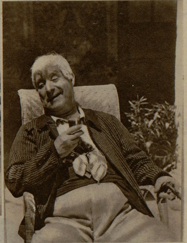
El notable actor Enrique Lacasa, que ha fallecido repentinamente en Córdoba, donde se hallaba interpretando el argumento de la película "Carceleras"

Las fuertes avenidas de agua en Burceña (Vizcaya) han producido grandes destrozos en los cimientos del puente de Bilbao, que estaba en construcción