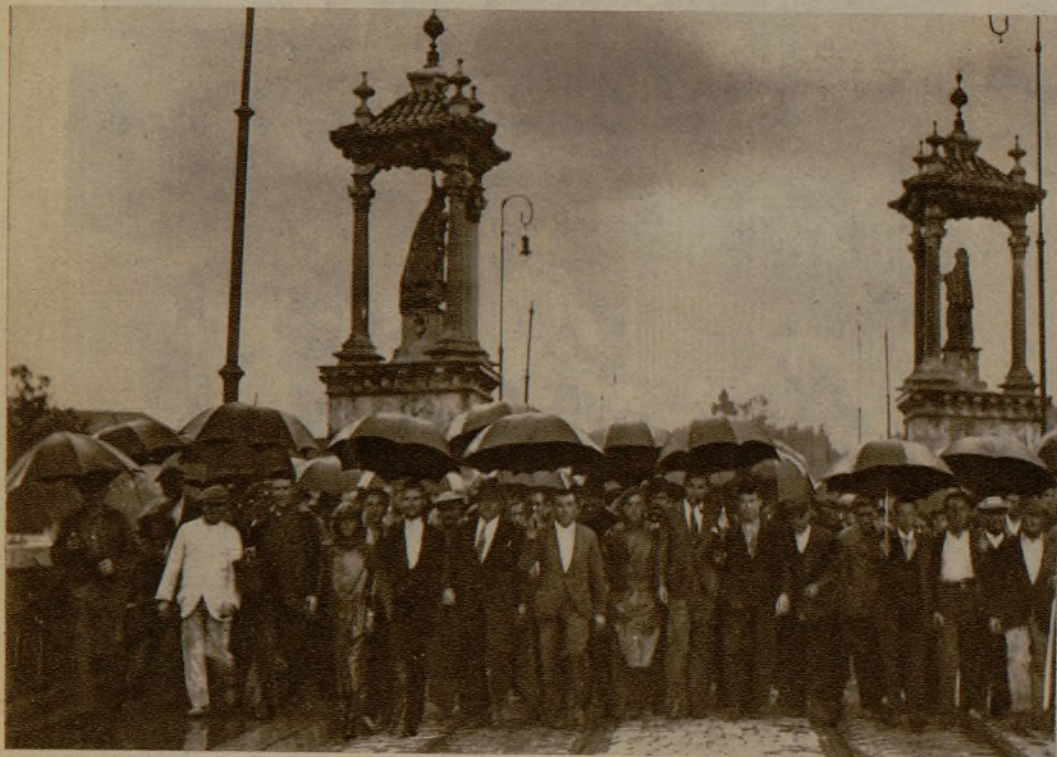
Presidencia de la manifestación celebrada en Valencia para solicitar que se construyan en los astilleros de Levante los dos correos de la Transmediterránea destinados a Fernando Poo