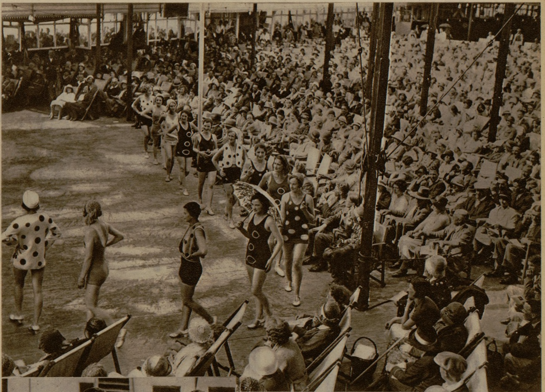
Estas lindas y esculturales muchachas se exhiben en una playa inglesa para que las bañistas puedan documentarse y escoger con conocimiento de causa el traje que les sienta mejor