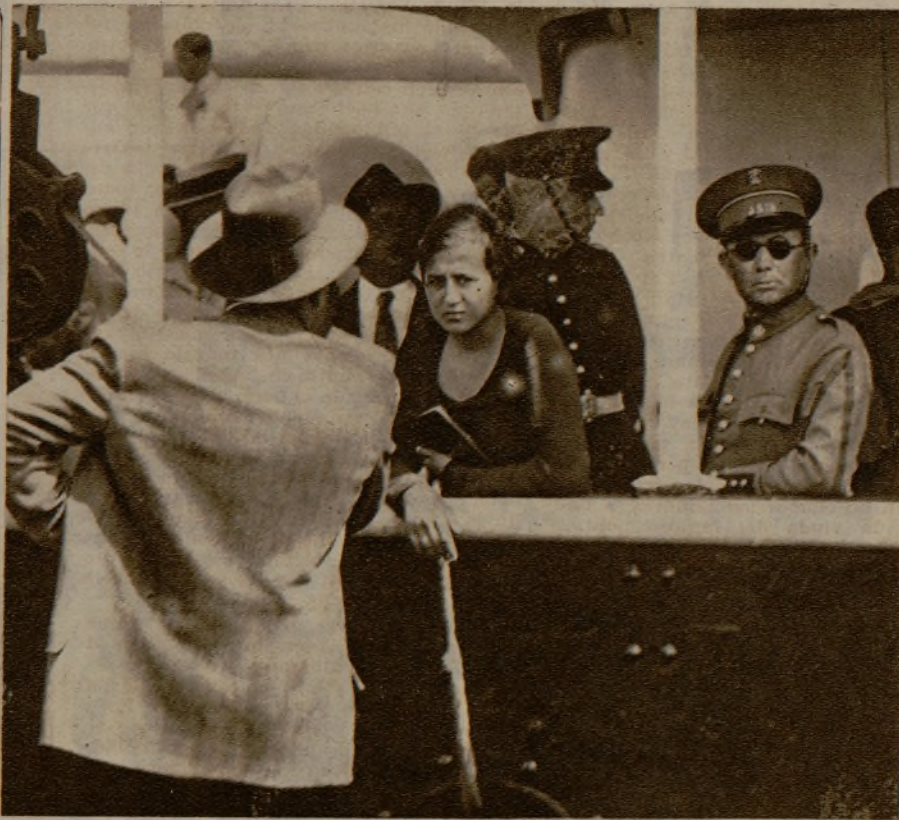
La trata de blancas: la Policía detiene a una joven y a un tratante