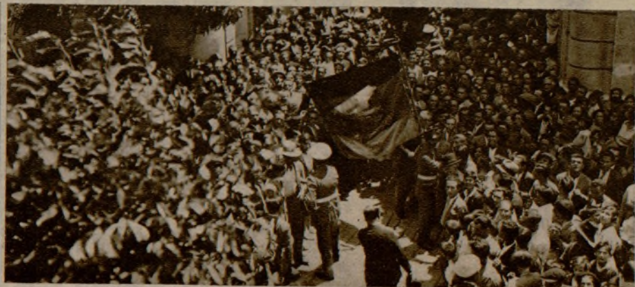
Las banderas de las Agrupaciones de ferroviarios, llevadas por los representantes de las mismas, en el acto de la inauguración de los grupos escolares