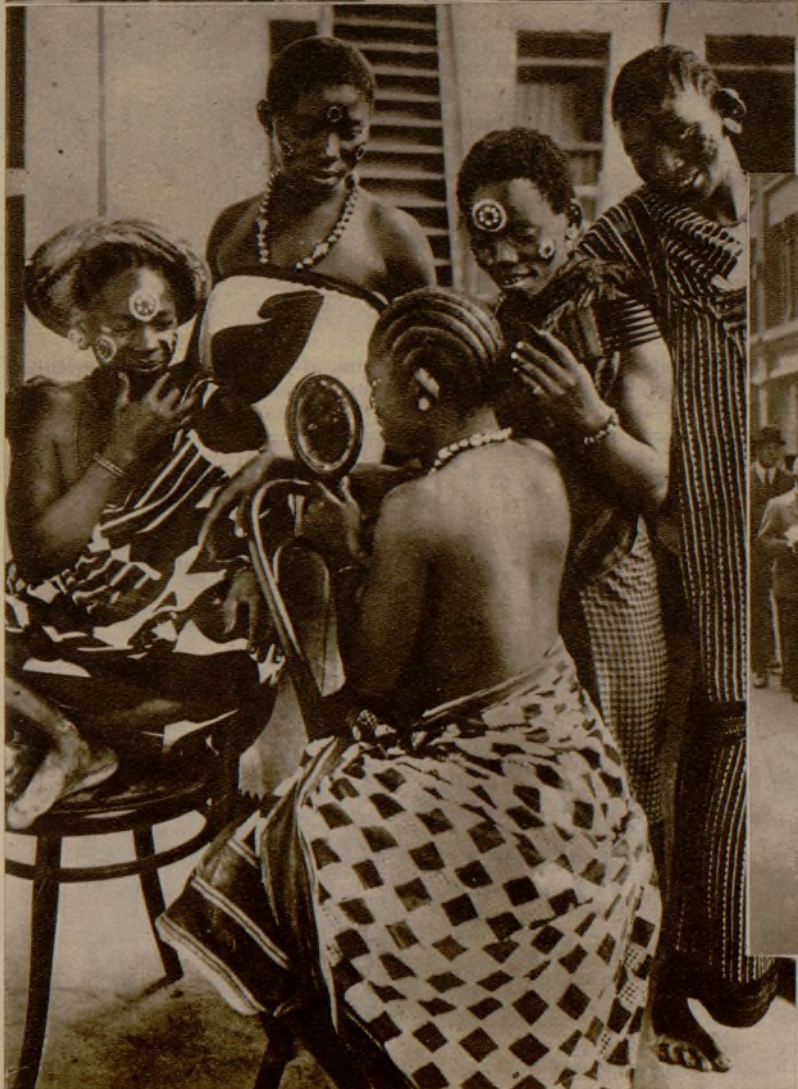
En estas negras de Zanzibar se manifiesta la feminidad con el mismo impulso que en un cabaret parisién. Parecer bien es el objeto...