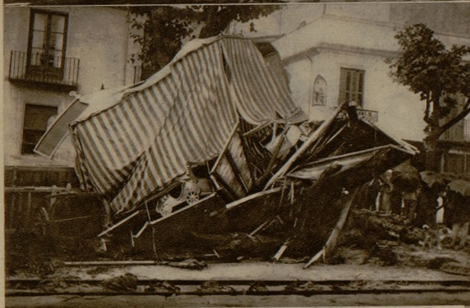
En Arenys de Mar, las aguas se desbordaron y arrastraron las instalaciones de la feria, inmediata a la playa

Las fuertes avenidas de agua en Burceña (Vizcaya) han producido grandes destrozos en los cimientos del puente de Bilbao, que estaba en construcción