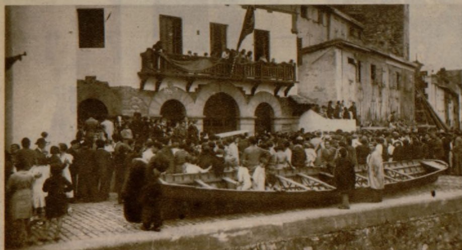
Una típica escena ante el edificio de la Cofradía de Mareantes, en San Sebastián, con motivo de las fiestas de la Virgen del Carmen