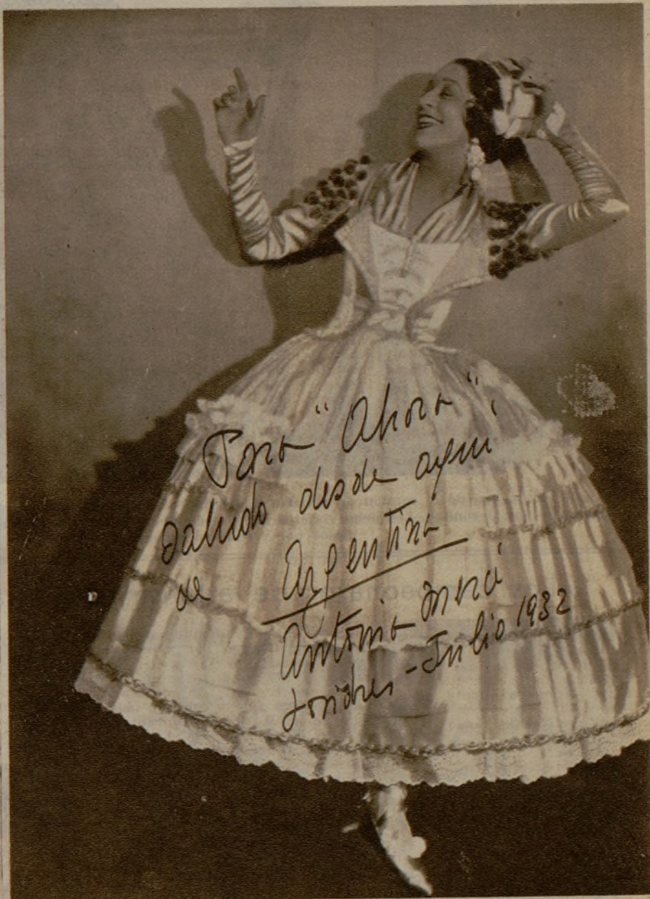
La insigne ballarina Antonia Mercé en una danza goyesca, durante su actual temporada en Londres

Todo esto quiere decir que por segunda vez trae la Argentina a la corte de San Jaime la embajada de su arte exquisito. Grande y útil es esta embajada: crea entusiasmo por las cosas de España, es antídoto contra el estrepitoso envenenamiento que produce la españolada. El genuino folklore español hace otra aparición en Londres. Si Antonia Mercé no hiciese sino exhibir sus trajes, mientras el programa explica la región de que proceden, ello sería ya estupenda propaganda que estimularía el deseo por ver más de lo mismo, allá en los sitios en que se le dice al público que puede hallarse. El que visite España podrá o no podrá dar con los rincones típicos; pero es un hecho que la Argentina presenta evocaciones sacadas de la verdad misma. Ese auténtico traje de charra, rico y cos-