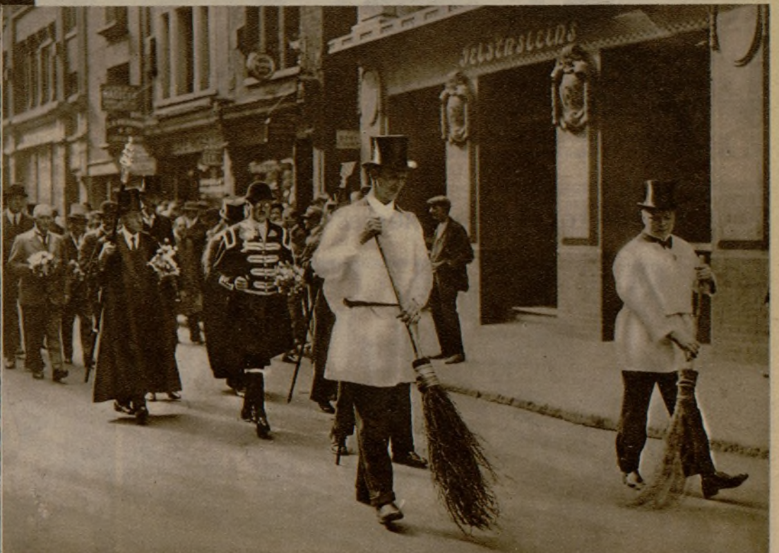
Ya es sabido que Inglaterra es donde más se conservan las tradiciones. Nada menos que de 1205 data esta procesión que anualmente hacen los vinateros londinenses, vestidos con sus pintorescos trajes de época