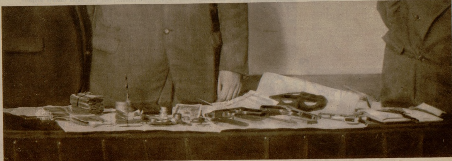
Armas y dinero que fueron encontrados en poder de los atracadores a quienes primeramente capturó la Guardia civil en el monte de Murias