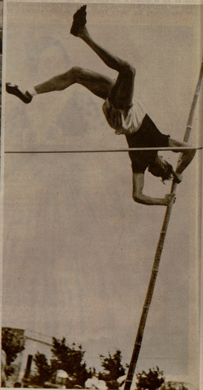
Las pruebas de saltos de pértiga fueron ganadas por Trias, que aparece en la foto en un momento de su actuación