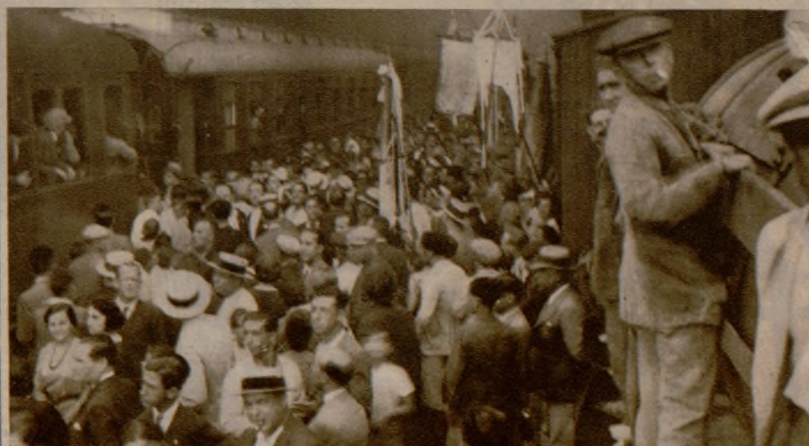
El pueblo de Alicante muestra su alborozo ante la llegada del tren "botijo", servicio restablecido después de seis años de suspensión