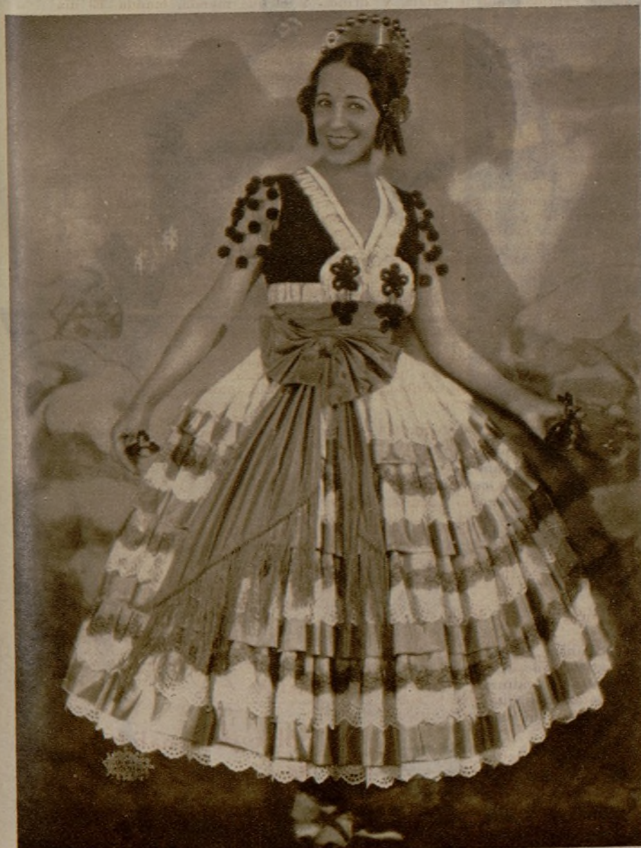
Otra "pose" de la gentilísima danzarina, inagotable mostración de donosura

toso—miles de pesetas—; traje hallado en un rincón salmantino, en el arcón de una familia cargada de tradición, produce al ser visto un murmullo admirativo entre el público. Hay una "castellana" que parece delicada porcelana del Retiro; desfilan por el escenario del "Savoy" los aciertos ancestrales de línea, de color y de conjunto del pueblo español, y ya eso solo es una magnífica obra hispánica. ¿Para qué he de hablar del arte de la Argentina, si yo no tengo saber para ensalzarlo hasta el punto de emoción que me produce!