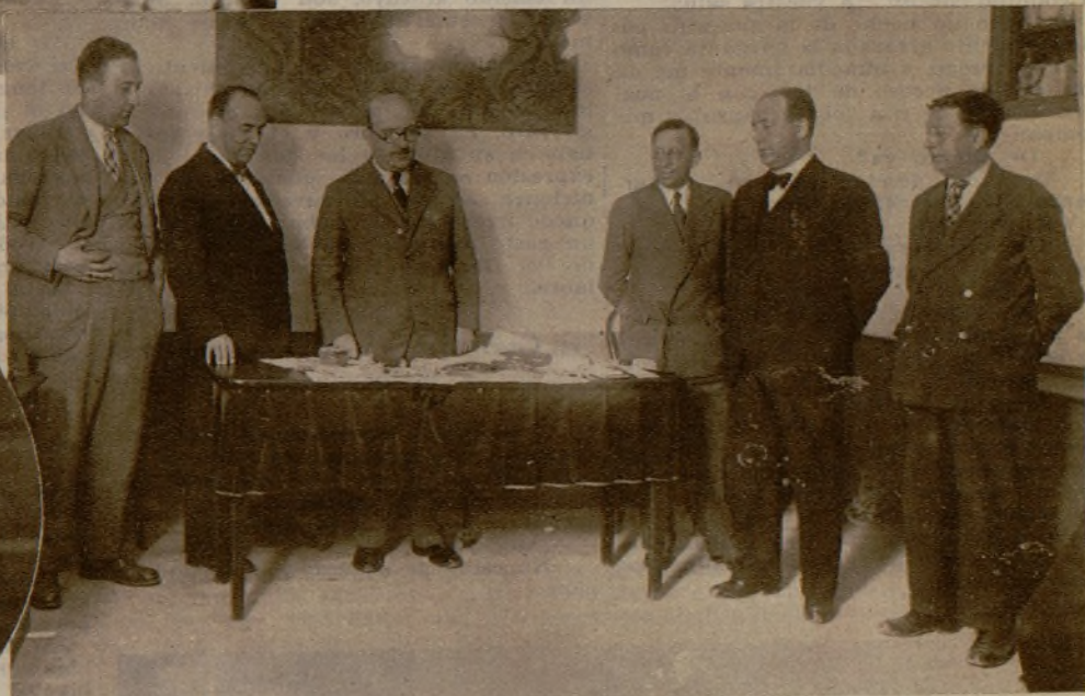
El juez de instrucción de Avilés, con el gobernador civil de Oviedo, examinando los objetos hallados en poder de los pistoleros