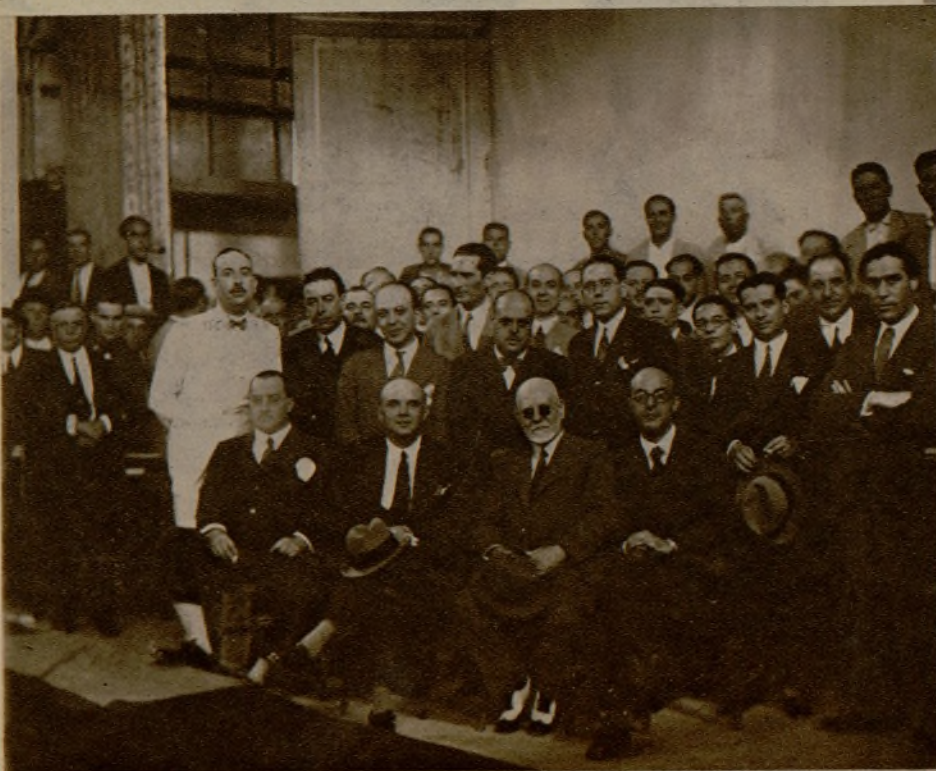
Grupo de hacendados murcianos con los representantes parlamentarios de la provincia, que se han reunido en asamblea para tratar del problema de los riegos

El notable motorista Arteche, vencedor en la carrera de la Cuesta de Castrejana, que se ha celebrado con gran éxito deportivo en Bilbao y en la que tomaron parte numerosos corredores