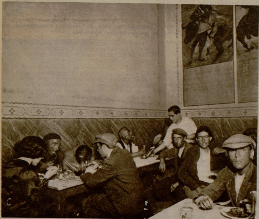
El "Malvaria", un ex presidiario, nos sirvió el plato del día: refritos de hígado y estofado

Continuación de este interesante reportaje.