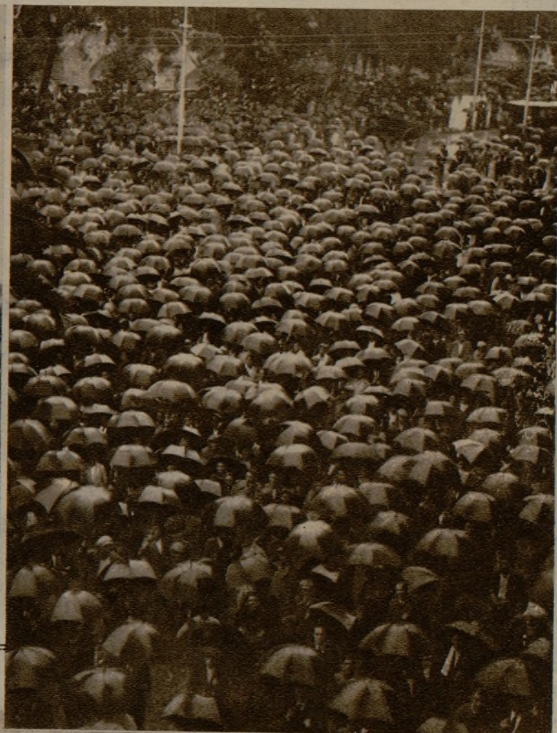
Los manifestantes, a cuyo frente se pusieron el Ayuntamiento y la Diputación valencianos, al llegar al Gobierno Civil para transmitir sus deseos al Gobierno