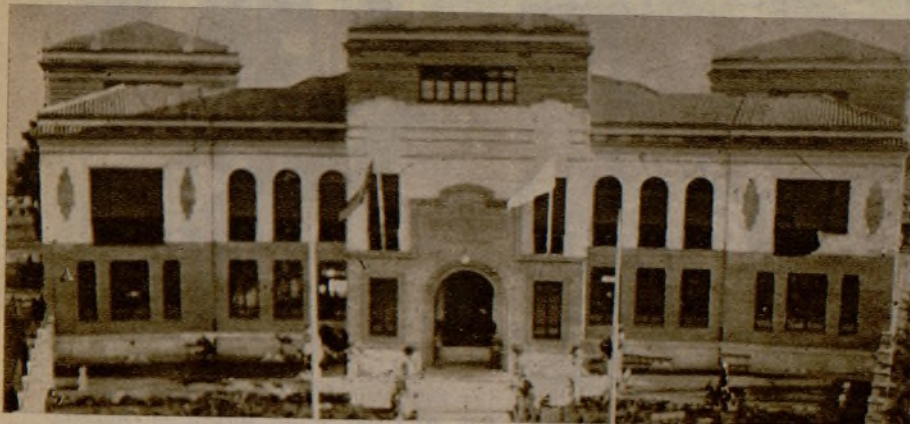
Las nuevas escuelas costeadas por la Asociación de Ferroviarios de la zona 23, que han sido inauguradas en Huelva