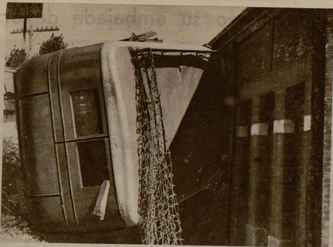
Estado en que quedó el camión de viajeros de Sevilla a la Algaba, que volcó a la entrada del puente de San Jerónimo. Los ocho viajeros que lo ocupaban, así como el conductor, resultaron ilesos por verdadero milagro