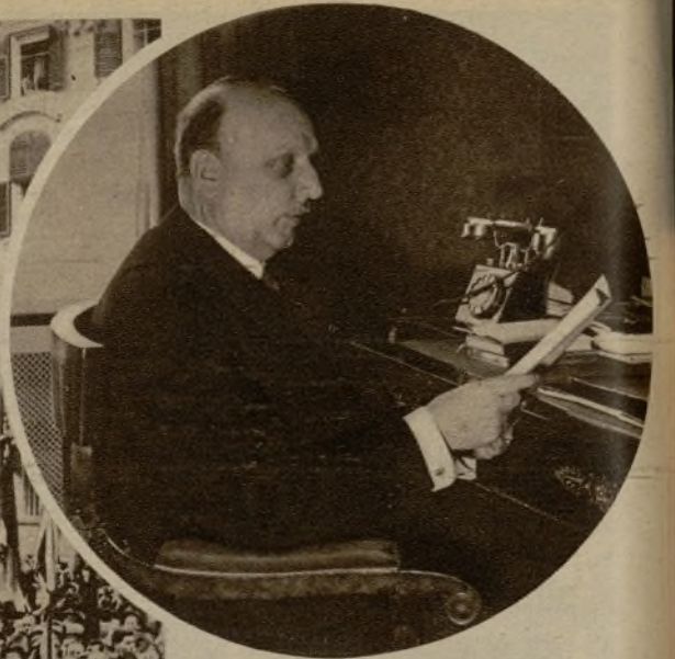
El presidente Miklas, que en unión del príncipe de Starhemberg se dirigió a Viena para depositar una corona ante el cadáver del canciller y hacer frente a la difícil situación política que plantea el asesinato de Dollfuss