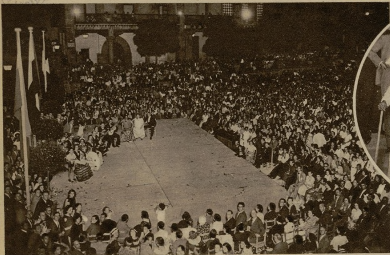
Un aspecto de la plaza del Pueblo Español durante la fiesta