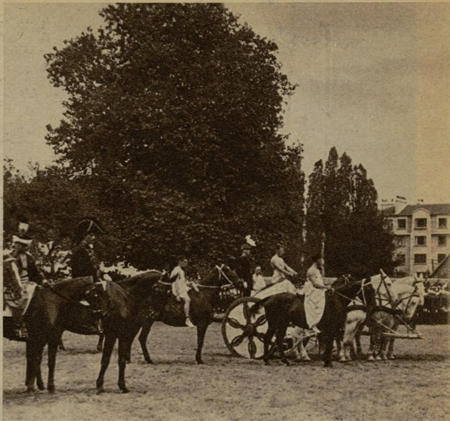
Una vista general tomada durante la ceremonia celebrada en la Academia Militar francesa de Saint Cyr