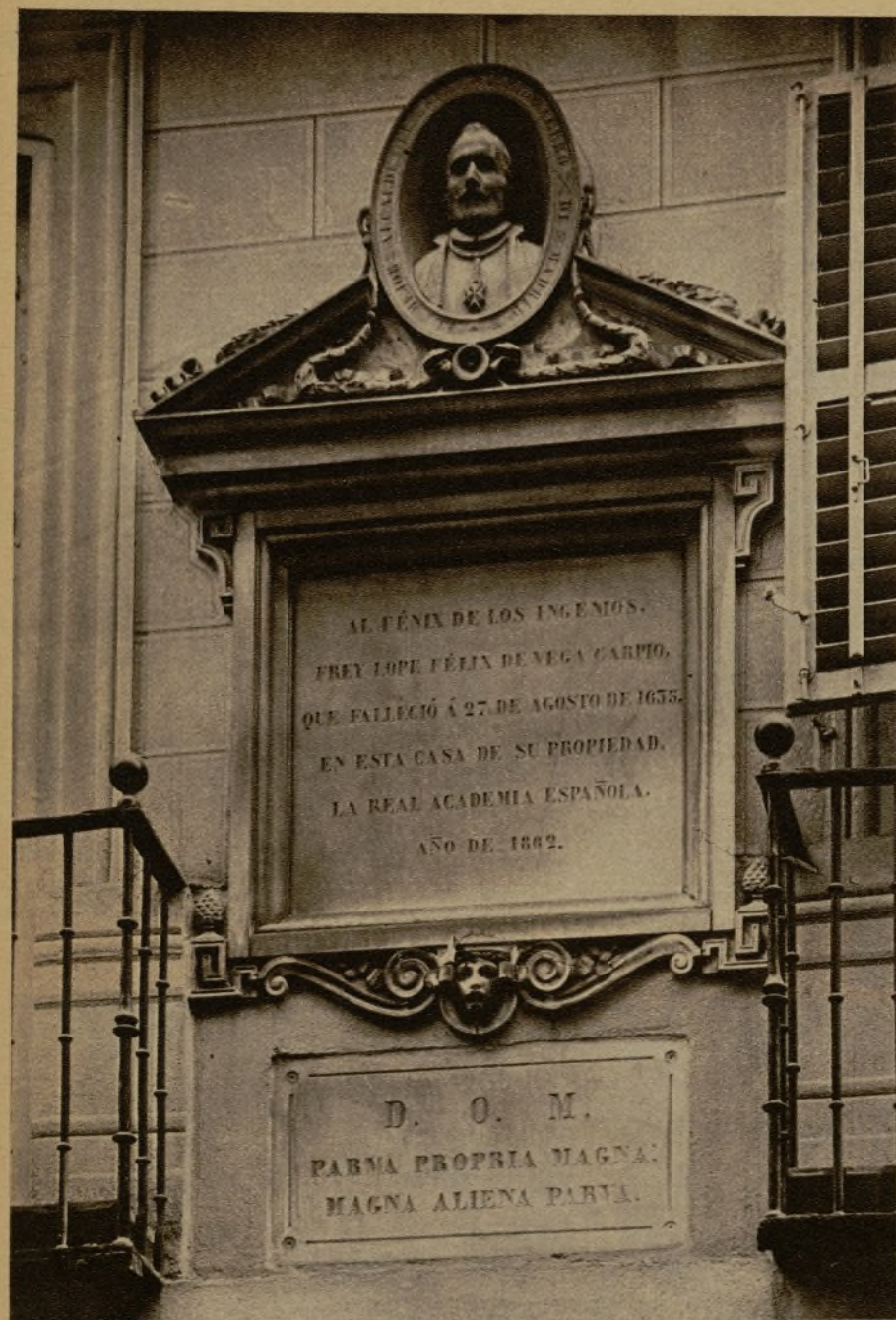
Por acuerdo de la Real Academia de la Lengua Española figura esta lápida, en honor del "Fénix de los Ingenios", sobre la fachada de la casa en que vivió Lope de Vega