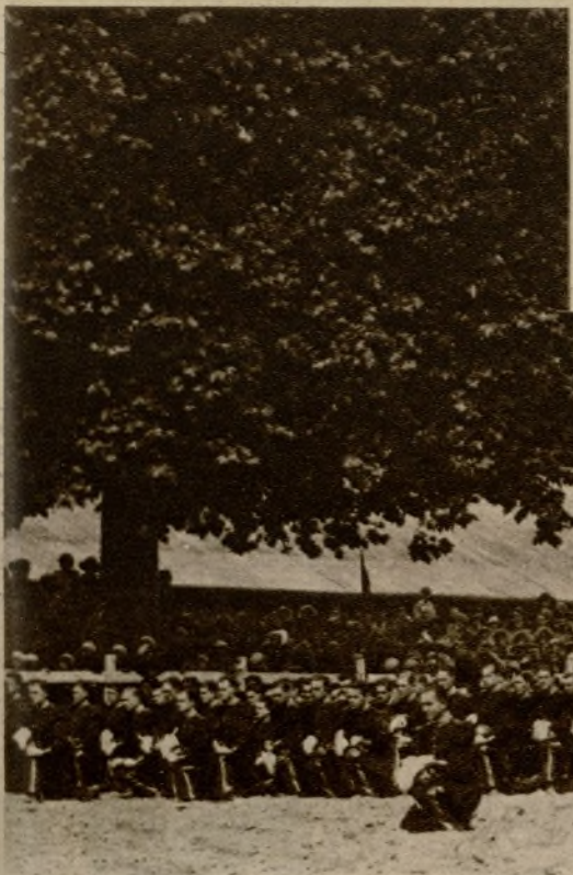
El solemne momento de la prestación del juramento por los nuevos cadetes de Francia