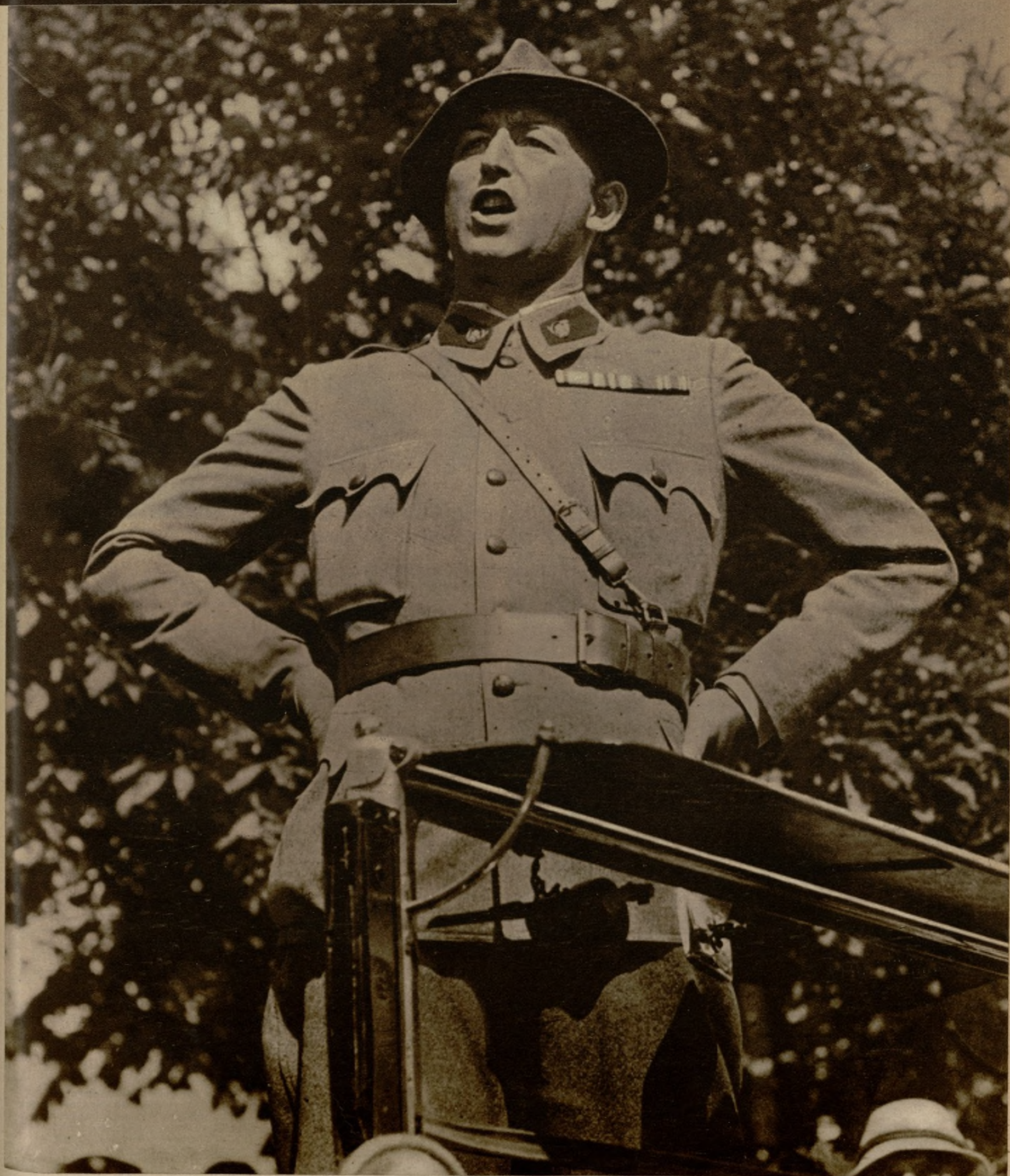
EL PRINCIPE STARHEMBERG SUCEDERÁ PROVISIONALMENTE AL CANCELIER DOLLFUSS. — El príncipe Starhemberg, actual vice-canciller y jefe de los "heimwehren", ha sido designado por el presidente Miklas para encargarse del Poder, mientras se aclara la confusa situación por que pasa Austria en estos momentos.