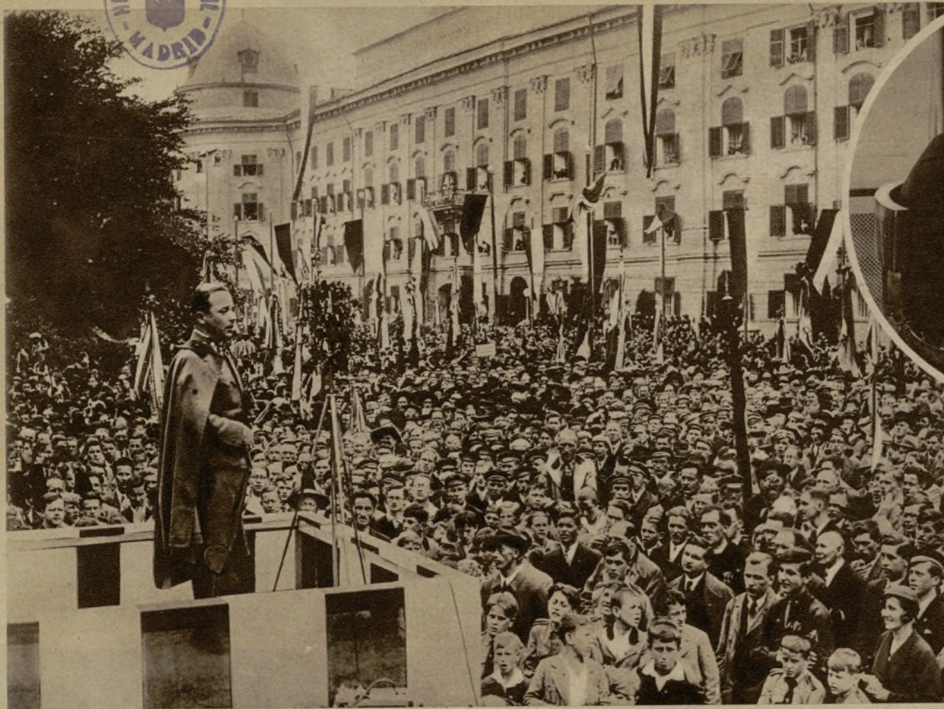
El canciller Dollfuss dirige la palabra a la multitud en un mitin contra los procedimientos del terrorismo "nazi"

Un grupo de soldados de la "Heimwehr", de aquellos que intervinieron en la represión de los sucesos del mes de febrero, y cuyos contingentes totales han sido movilizados