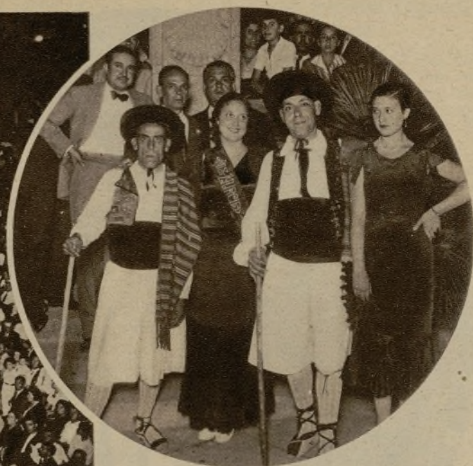
"Miss Murcia" y sus paisanos de Murcia y Albacete acudiendo a la verbena.