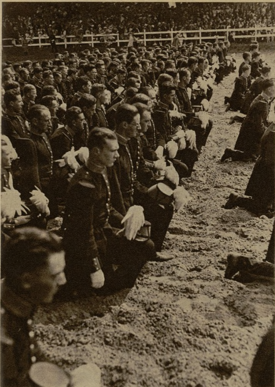
El día 19 de este mes tuvo lugar la fiesta del Triunfo, que celebra la Escuela Militar francesa de Saint Cyr. He aquí a los cadetes de la nueva promoción escuchando el discurso del padre Systéme