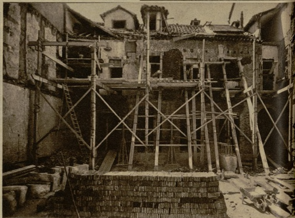
Una restauración racional y adecuada convertirá en breve en Museo la casa de Lope de Vega, "Fénix de los Ingenios"

Lope de Vega habitó muchos años esta casa—desde 1613, fecha de la compra, hasta el 27 de agosto de 1635, día de su muerte—, haciendo en ella muchas reparaciones, formando el oratorio y transformando el corral en huerto. Lope de Vega, que por su vida azarosa parecía incapaz de sentir el amor hogareño, no tenía grandes deseos de vivir en Madrid y sobradamente lo demuestra en una de sus cartas, que escribió en agosto del año 1604: "Mire V. Md. por donde me voy a vivir a Valladolid, porque si Dios me guarda el seso, no más corte, coches, caballos, alguaciles, música, rameras." Es decir, que prefería trasladar su residencia desde Toledo a Valladolid antes de vivir en Madrid. Sin embargo, no se sabe por qué motivo, decidióse llegar a la Corte y habitar en compañía de su familia en la casa que años más tarde com-