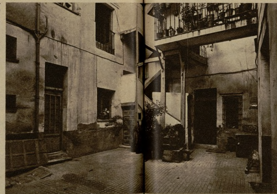
Este es el aspecto que ofrecía el interior de la casa donde vivió Lope de Vega, antes de emprenderse las obras que han de transformarla en Museo

—ya lo apuntamos—el 27 de agosto de 1635. De la casa de la calle de Francos salió su solemne entierro, que acompañaban—dice Mesonero Romanos—todas las personas más visibles de la corte, y era tan numeroso, que ya había entrado mucha parte de él en la iglesia de San Sebastián y aún no había salido el cadáver de la casa.