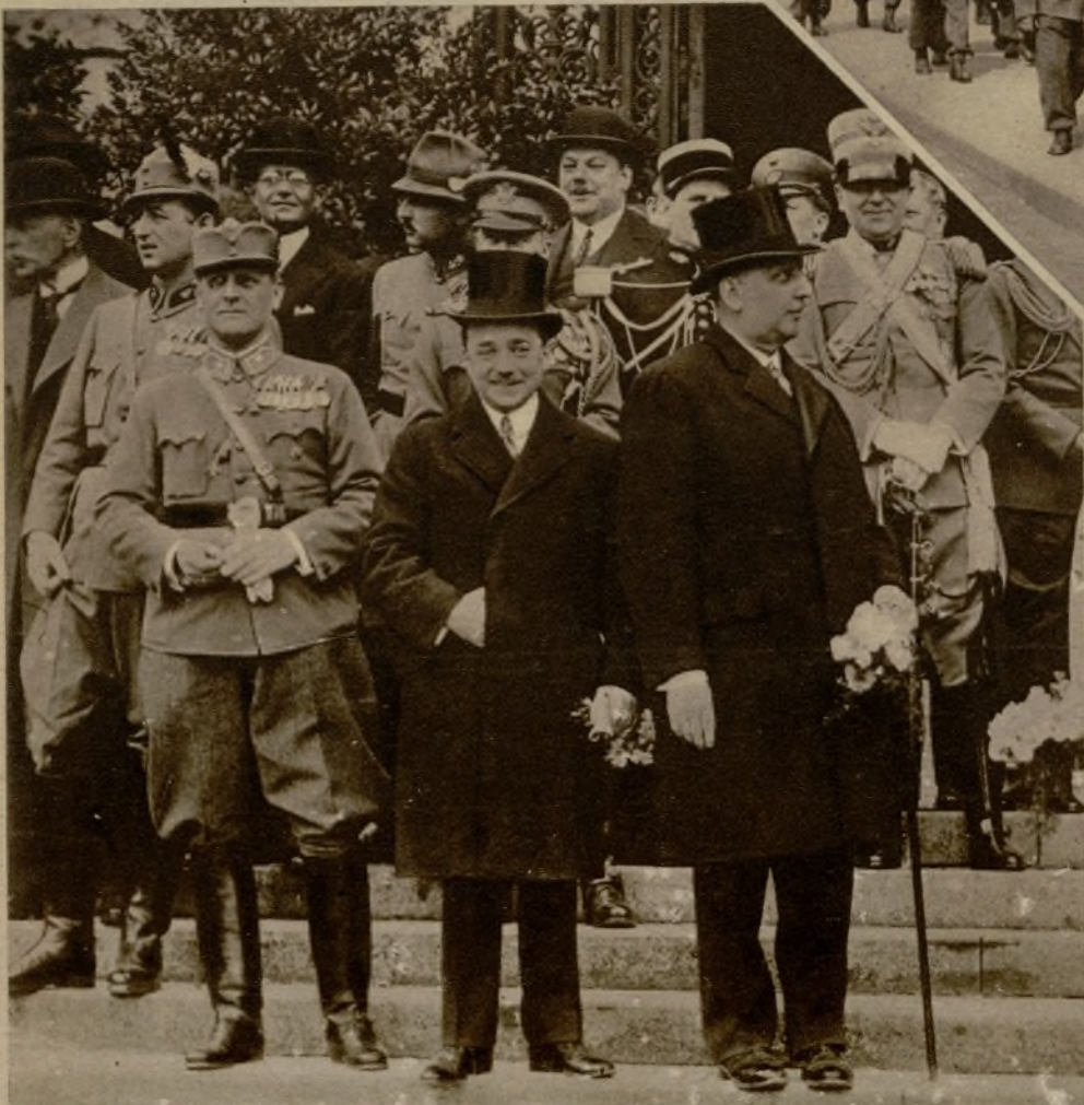
De izquierda a derecha: El príncipe Starhemberg, el Mayor Fay, el canciller Dollfuss y el presidente Miklas

El canciller Dollfuss, al lado de su esposa, durante la convalecencia de las heridas que recibió en un reciente atentado