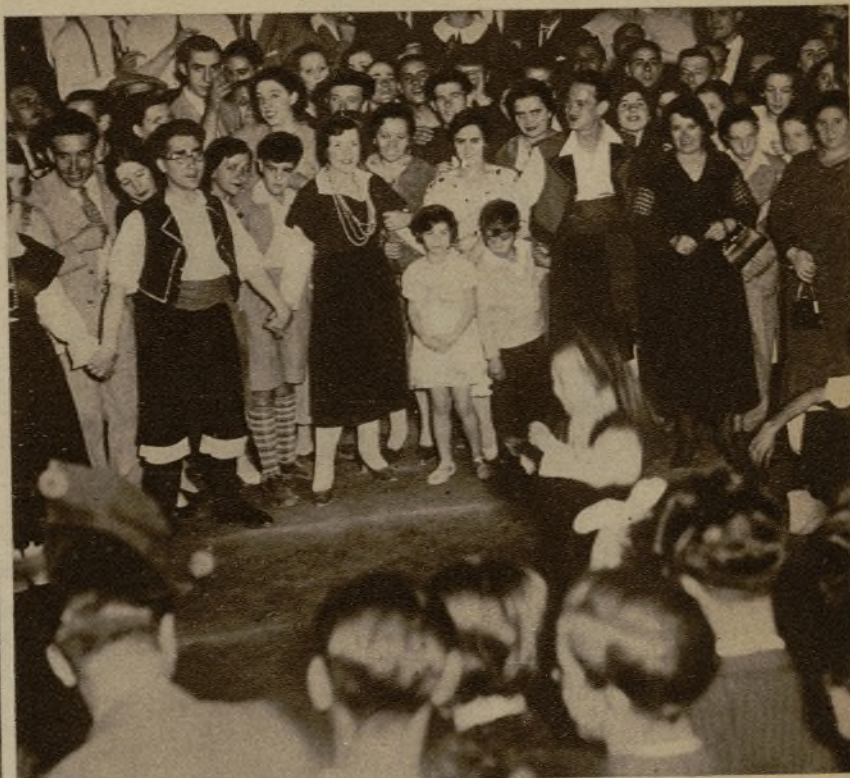
Los Coros Gallegos, en Madrid, han contribuido, en el día del Patrón de Galicia, a la celebración de la fiesta, en la que los espectadores admiran el primer de los bailes y cantos de la región querida