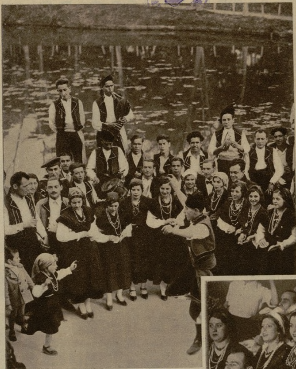
Galicia celebra la fiesta de Santiago Apóstol, su Patron, y la alegría de toda la hermosa región repercute en los que, ausentes de ella, sienten el dulzor del recuerdo de la tierra querida. He aquí una muñeira bien acompañada y llena de ingenio gracejo