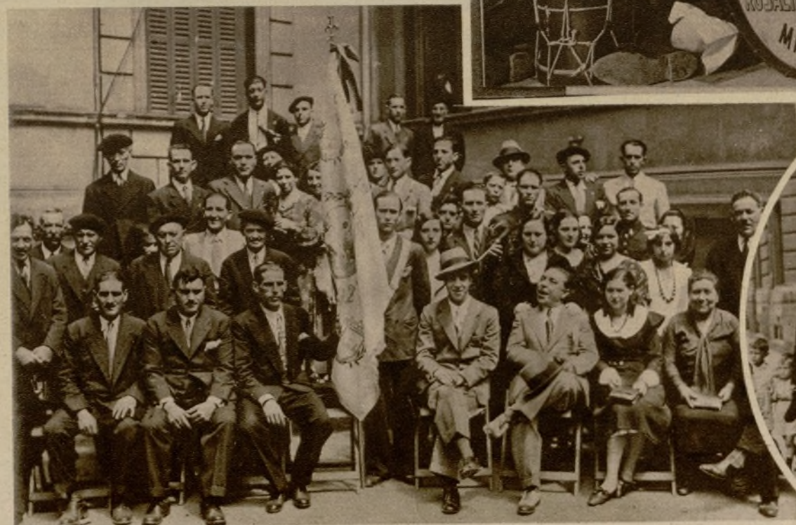
Grupo de socios de la Casa de Galicia, en la capital de Vizcaya, el día de la celebración de su fiesta regional