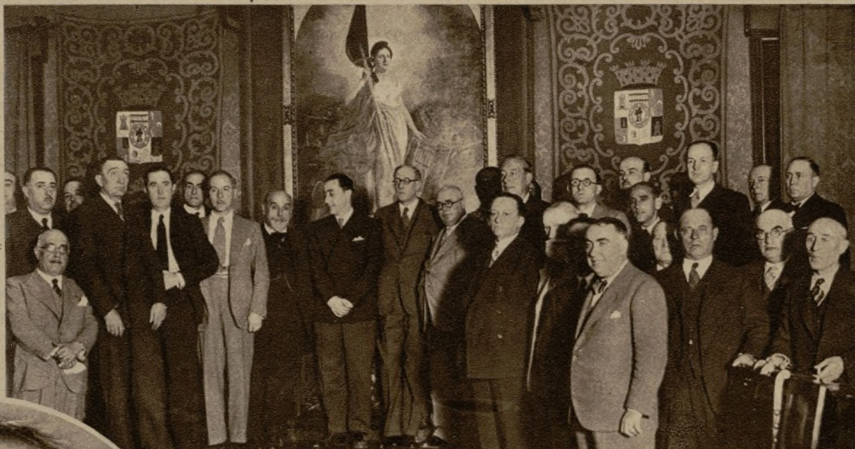
Grupo de concurrentes a la sesión inaugural de la Asamblea de Diputaciones de España para tratar de la introducción de trigos de las diferentes regiones de España, en Cataluña

La Asamblea de Diputaciones de España para tratar de problemas trigueros