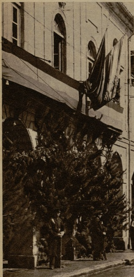
El Ayuntamiento de Zumárraga, en donde se reunieron los parlamentarios vascos y catalanes, custodiado por la fuerza pública. La asamblea no tuvo virtualidad alguna, ya que no pudieron concurrir a la reunión los representantes de los Municipios, en virtud de las medidas adoptadas por el Gobierno