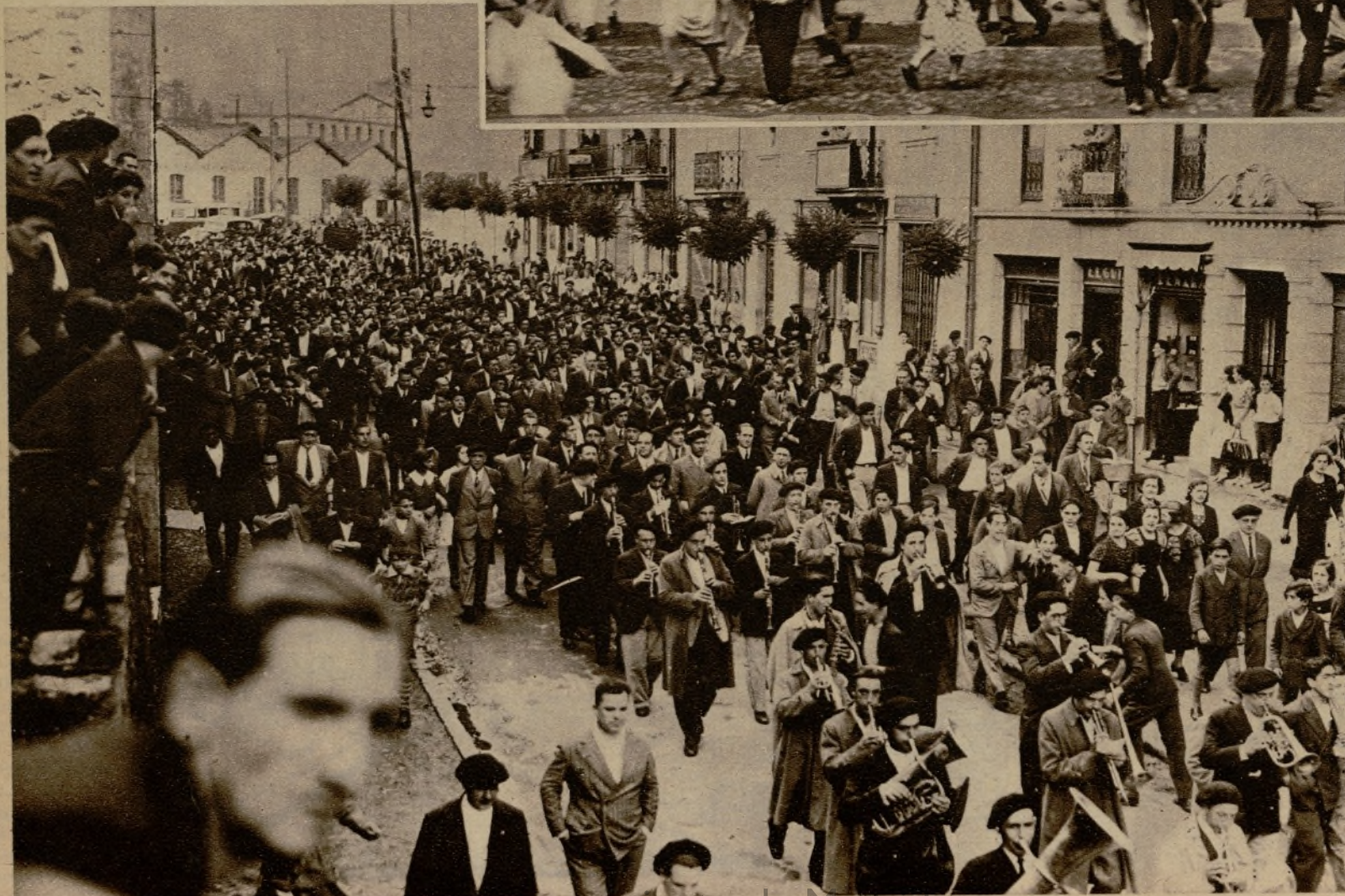
Como un numeroso grupo intentara penetrar en el Ayuntamiento de Zumárraga, se promovieron algunos incidentes. La fuerza pública, que tenía orden de dejar pasar sólo a los parlamentarios, obligó a los manifestantes que pretendían acompañarles a que se dispersaran