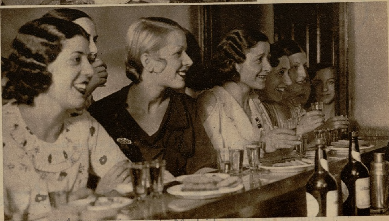
Un gentil grupo de señoritas premiadas saborean un "cock-tail" en un descanso del baile celebrado en la casa de AHORA y "Estampa"

EXPOSICION del BANCO BENEFICO Eduardo Dato, 21 (Gran Vía) MADRID