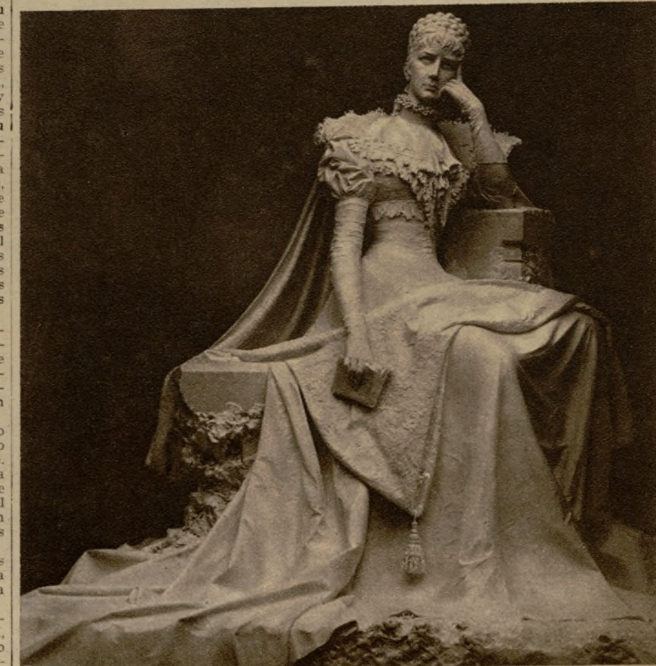
El monumento a la emperatriz Isabel de Habsburgo