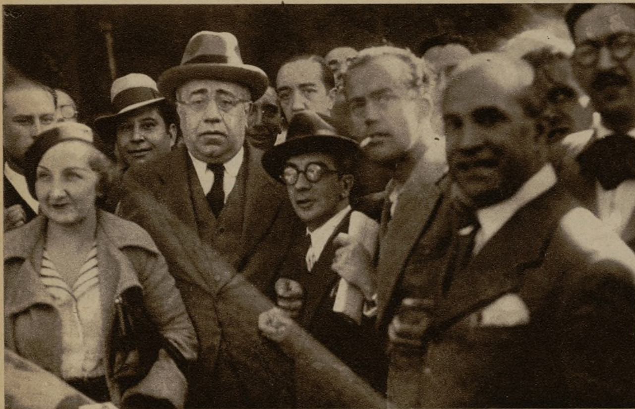
El ex presidente del Consejo don Manuel Azaña, que, como se sabe, ha permanecido durante una temporada en Cataluña, ha regresado a Madrid. Hele aquí, acompañado de su esposa, momentos después de su llegada

La Asamblea de Diputaciones de España para tratar de problemas trigueros