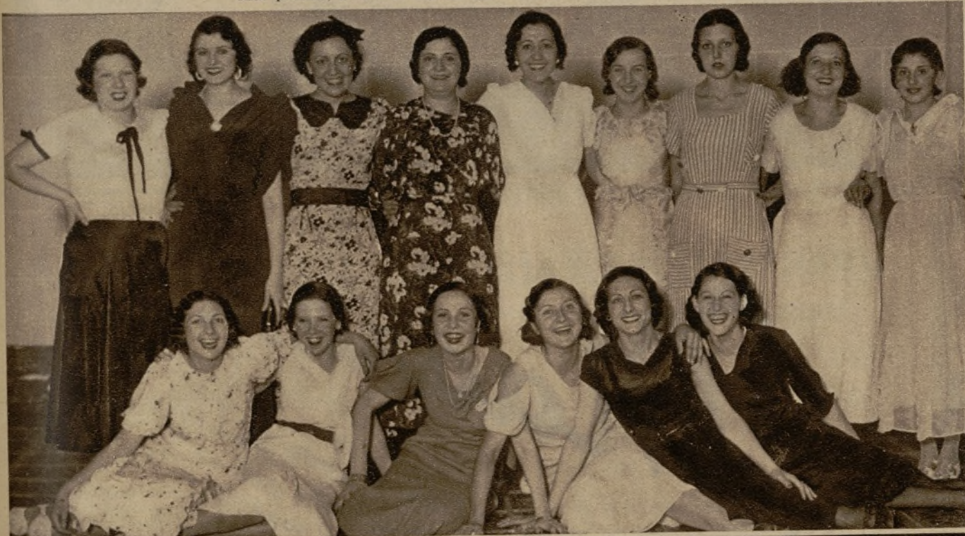
Las lindas muchachas que obtuvieron "premios menores" en el Concurso del "vestido de cuatro pesetas", en nuestro salón de fiestas, durante el agasajo celebrado en su honor