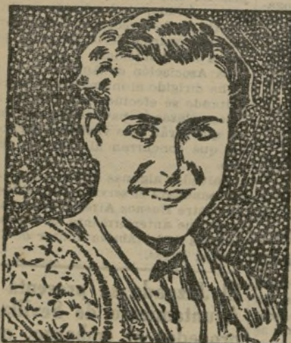
por LUIS GOMEZ "El Estudiante"

"La joven de quien me enamore—escribe este valiente torero—ha de tener ante todo y sobre todo, un cutis blanco, claro y fresco. En una mujer, es la belleza del cutis lo que más seduce a los hombres, mucho más que cualquier otro atractivo. Ninguna joven con espinillas, poros dilatados u otros defectos puede esperar conquistar al hombre de sus ensueños. La mujer más hermosa del mundo me confesó que la maravillosa tez que tenía la debía exclusivamente a la Crema Tokalon, la famosa crema parisiense. Por eso digo que todas las jóvenes que deseen tener la belleza clara y fascinadora que atrae a los hombres, deberían emplear esta preparación maravillosa."