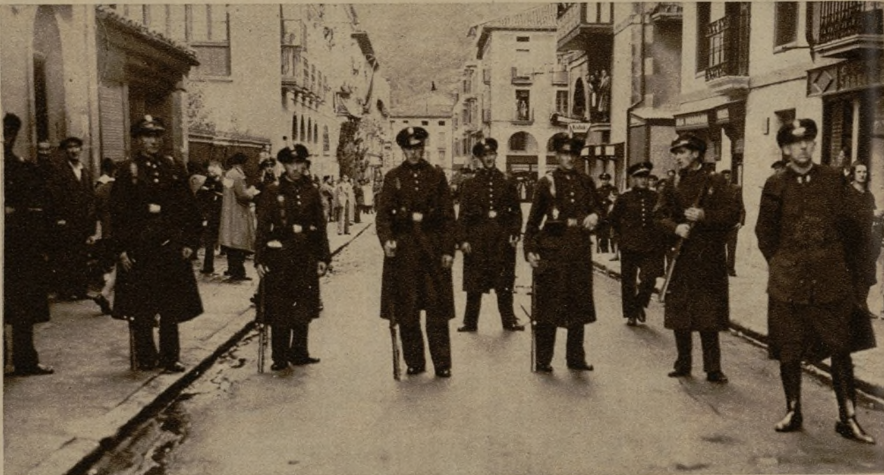
Fuerzas de Asalto en las calles inmediatas al Ayuntamiento de Zumárraga, estableciendo vigilancia para impedir que la manifestación pública que se anunciaba lograra acceso a la Casa Consistorial