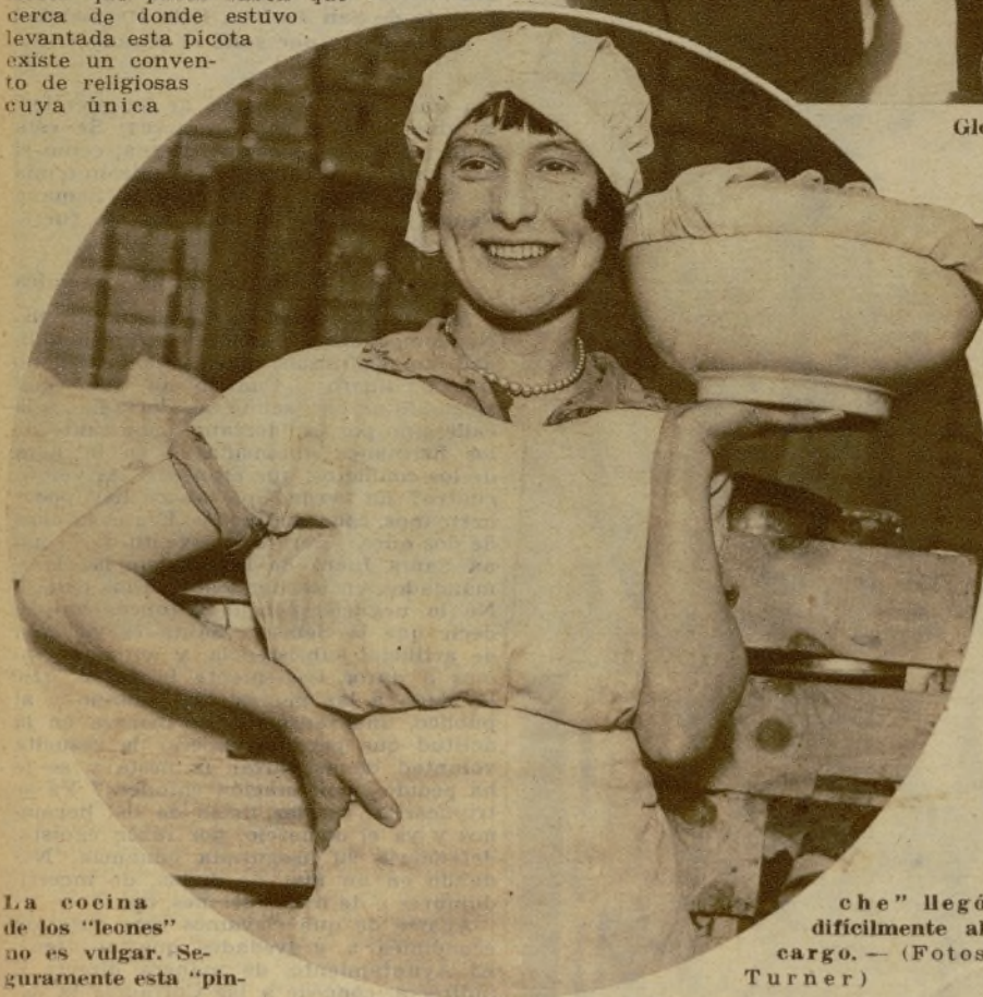
La cocina de los "leones" no es vulgar. Seguramente esta "pin-