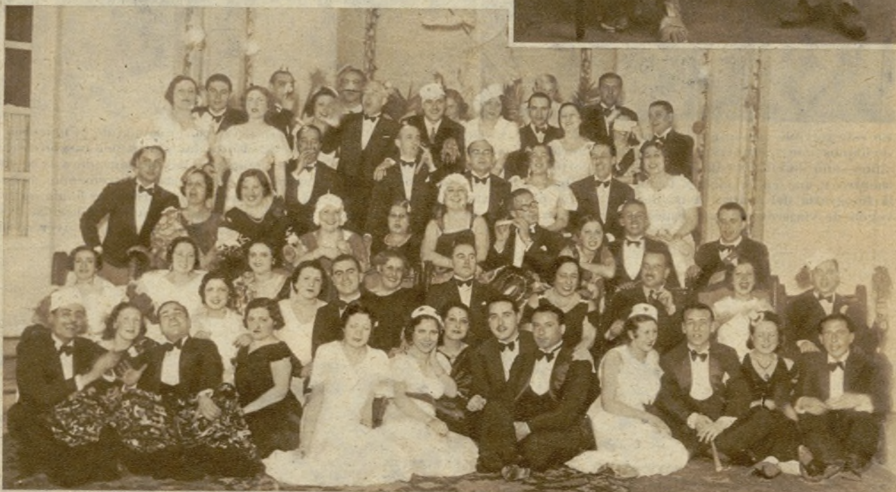
Alegres participantes en la lucida fiesta de Piñata, celebrada por las Juventudes Alpinas en el Hotel Ritz