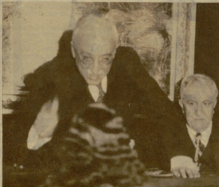
En la Sociedad Económica Matritense de Amigos del País se celebró ayer una distribución de premios, que honró con su presencia el Jefe del Estado. S. E. aparece en la foto entregando a una niña el premio a la virtud