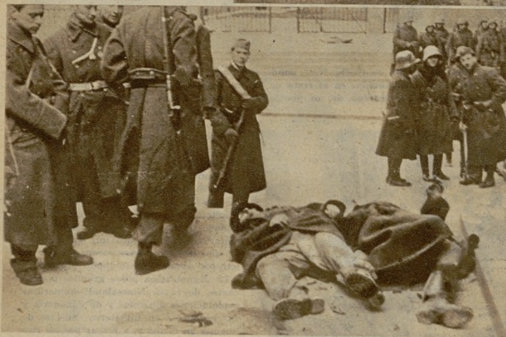
He aquí los cadáveres de dos soldados pertenecientes a la heimwehr, caídos en Viena durante la batalla librada en las cercanías de la Casa Carlos Marx