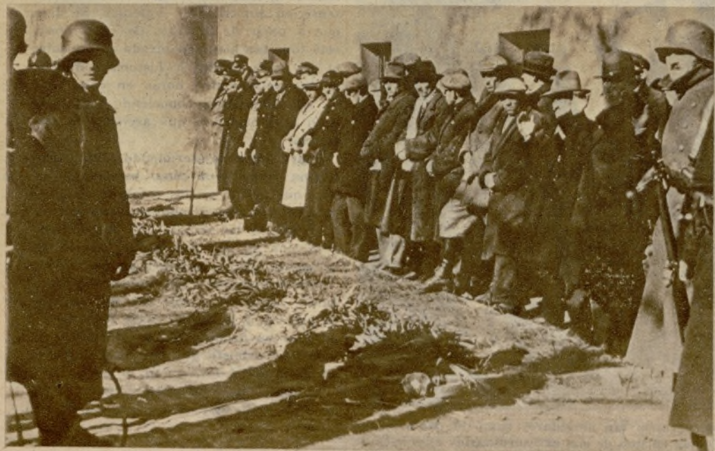
He aquí un grupo de prisioneros socialistas esperando la llegada del camión destinado a transportarles ante los Tribunales militares