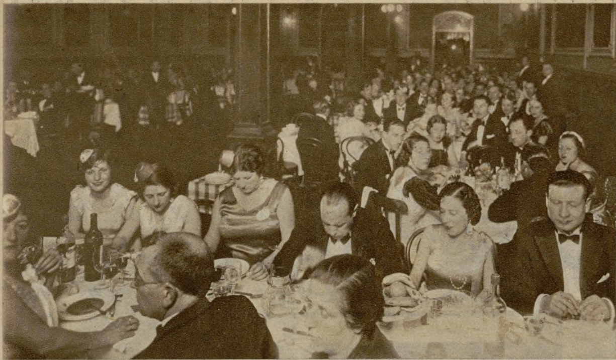
Brillante aspecto del salón de fiestas del Círculo Mercantil de Huelva, durante la cena de Piñata, celebrada el pasado domingo