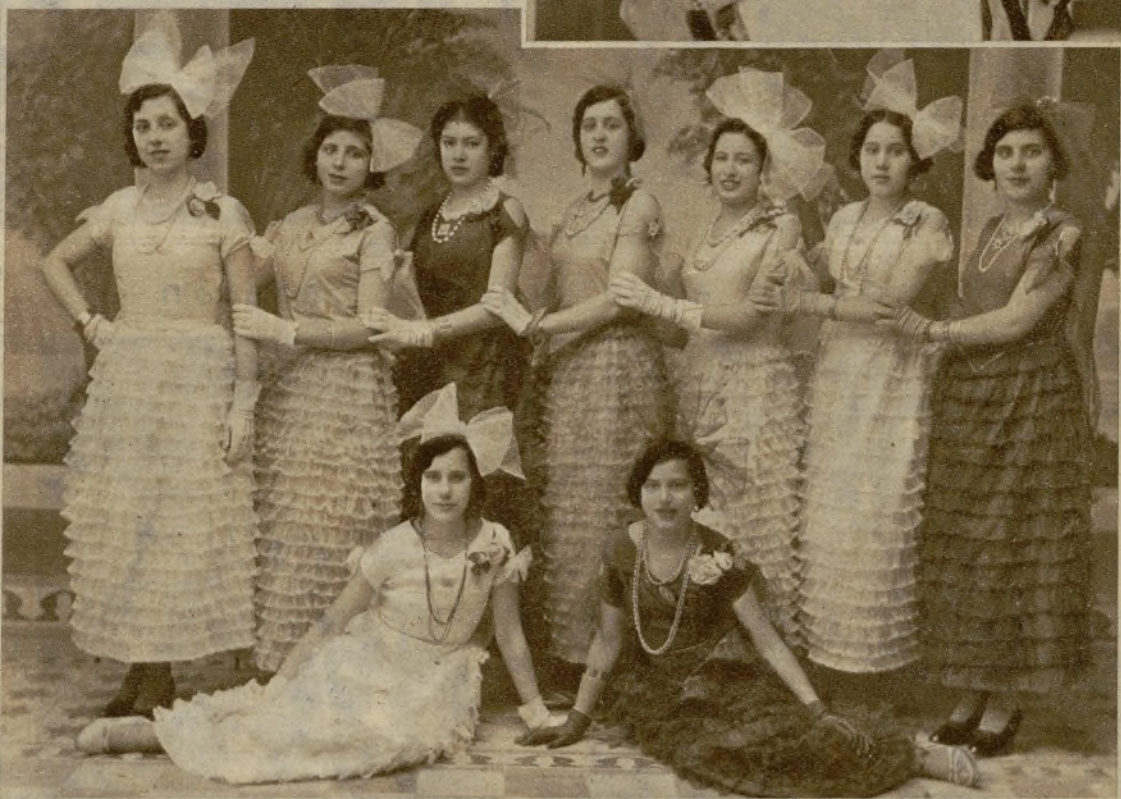
Originales mascarones concurrentes al baile celebrado en la Unión de Artesanos de la Coruña