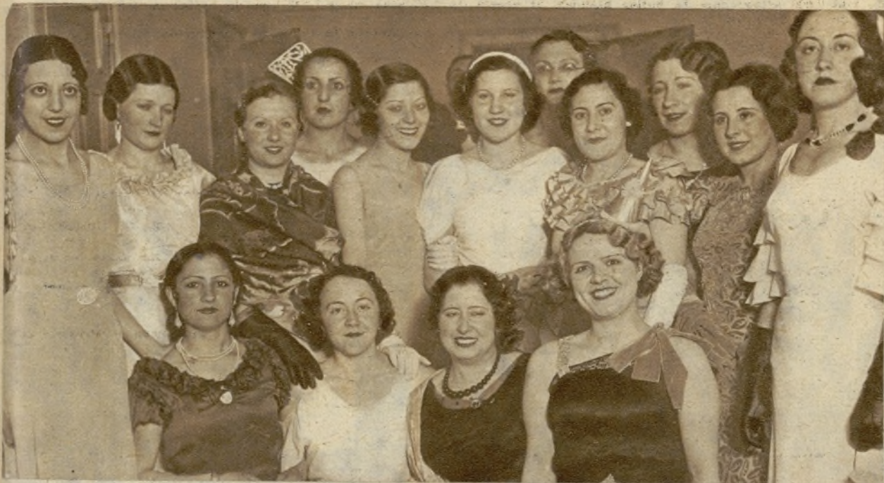
Un grupo de bellas señoritas concurrentes al baile organizado por el elemento joven del Circulo madrileño de la Unión Mercantil