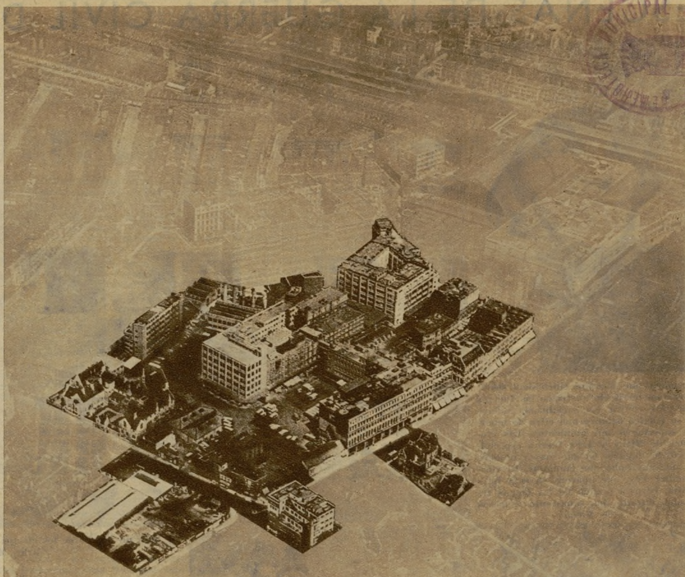
Ved lo que representa en el inmenso Londres el recinto de Cadby Hall, donde se preparan los platos estandarizados, que han de ser distribuidos en el resto de los establecimientos "Lyons". Esa fabricación requiere el terreno de un pueblo de primer orden

común en el mundo británico y a veces se emplea para componer historietas y chistes: "Lyons" significa "leones", y se dice lo siguiente: "¿Qué diferencia hay entre el Coliseo Romano y uno de los grandes restaurantes de la Lyons? En el Coliseo, los romanos eran echados como comida a los leones, y en ese restorán los leones arrojan comida a los cristianos." Si desapareciesen de Londres los "leones", se crearía, sin duda alguna, un conflicto público en la ciudad, porque ¿dónde irían a satisfacer su apetito los ejércitos de hambrientos que entran todos los días por las puertas coronadas con los letreros dorados sobre fondo blanco?