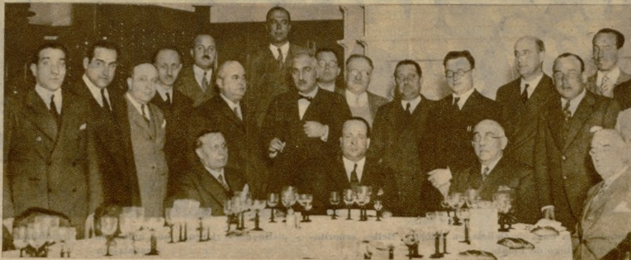
Las altas representaciones oficiales y los elementos populares han tributado al ilustre creador del autogiro testimonios de la rendida admiración que merece su extraordinario invento. Durante su visita a Zaragoza se han reproducido estas manifestaciones. Los ingenieros agrónomos de la capital de Aragón ofrecieron un banquete en homenaje del insigne español