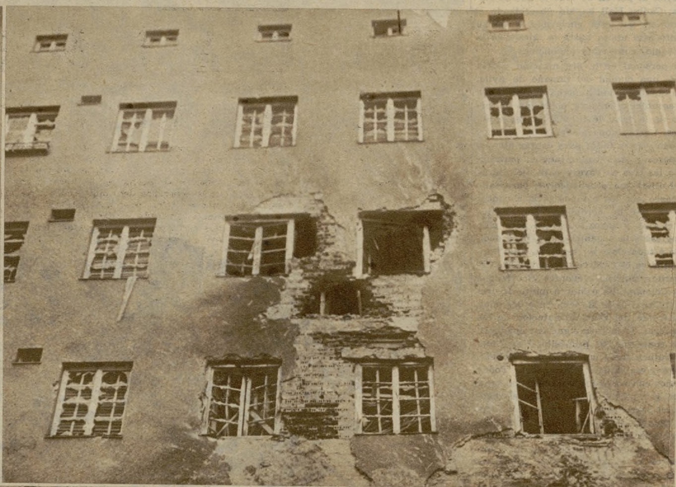
He aquí un detalle de los efectos causados por el bombardeo en la Casa Carlos Marx, de Viena

La lucha que durante cinco días sostuvieron en territorio austriaco las fuerzas federales contra los socialistas, incluye en su trágico balance una cifra de muertos superior a mil quinientos. Las ciudades de Viena y Linz fueron especialmente los lugares en que mayor número de víctimas hubo que lamentar. El vicecanciller Fey, que aparece en esta fotografía, tuvo el mando de las tropas federales durante los sangrientos sucesos de Viena