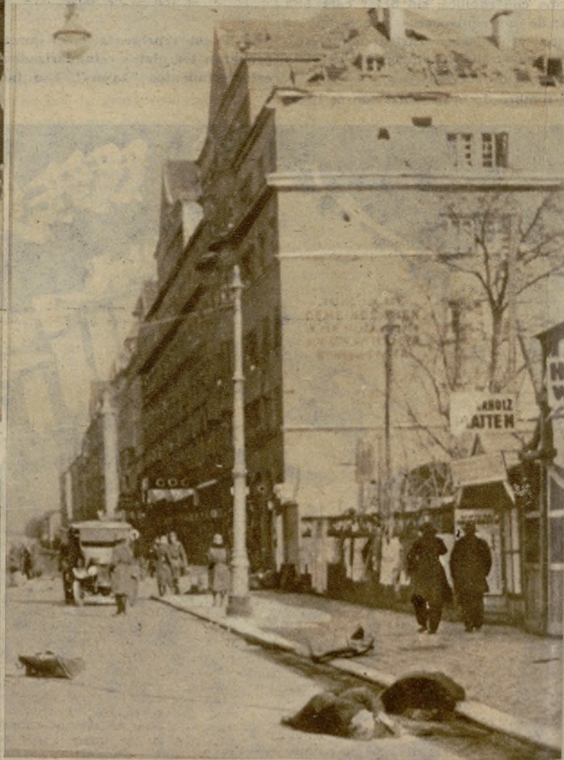
El movimiento revolucionario de Austria alcanzó una intensidad tan acusada, que más presentó, ya desde los primeros momentos de su iniciación, la fisonomía de una verdadera guerra civil. Los adversarios utilizaron para atacarse el armamento más moderno, cuyos mortíferos efectos señala esta foto, obtenida en Floridsdorf