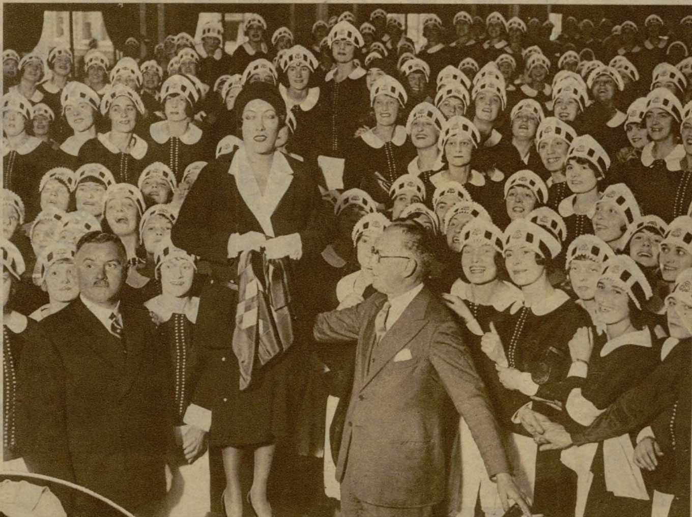
Gloria Swanson rodeada por la grata compañía de las "nippy", las graciosas camareritas que sirven el té a todo Londres

El Londres actual, calculando a razón de medio litro de té diario por persona, se traga cuatro millones y medio de litros de esta infusión, lo que podrían convertir la plaza de toros nueva de Madrid en el pequeño mar con que apaga la sed mister Londres cada veinticuatro horas. Hay en la ciudad dos monumentos a la inmensa taza de té londinense: uno de ellos, reliquia histórica, está situado en la City, y es un cuartucho de planta baja con media docena de mesas de pino desvencijadas. En las paredes del cuartucho se descascarillan unas pinturas que representan paisajes chinos, y hay allí un mostrador diminuto sobre el que se ven algunas tazas de fina porcelana desportilladas: es el "salón de té", donde se reunían los primeros importadores de este producto. El otro monumento se halla situado a una pedrada del rincón de Hyde Park, que sirve de plataforma a los oradores al aire libre, y ha sido levantado en los terrenos de Tyburn, lugar en que durante muchos años se erigía la picota patibularia en la que fueron colgados muchos reos del terrible delito de deudas, y en la que fenecieron buen número de mártires del catolicismo en los siglos XIV y XV. Por cierto que pocos saben que cerca de donde estuvo levantada esta picota existe un convento de religiosas cuya única