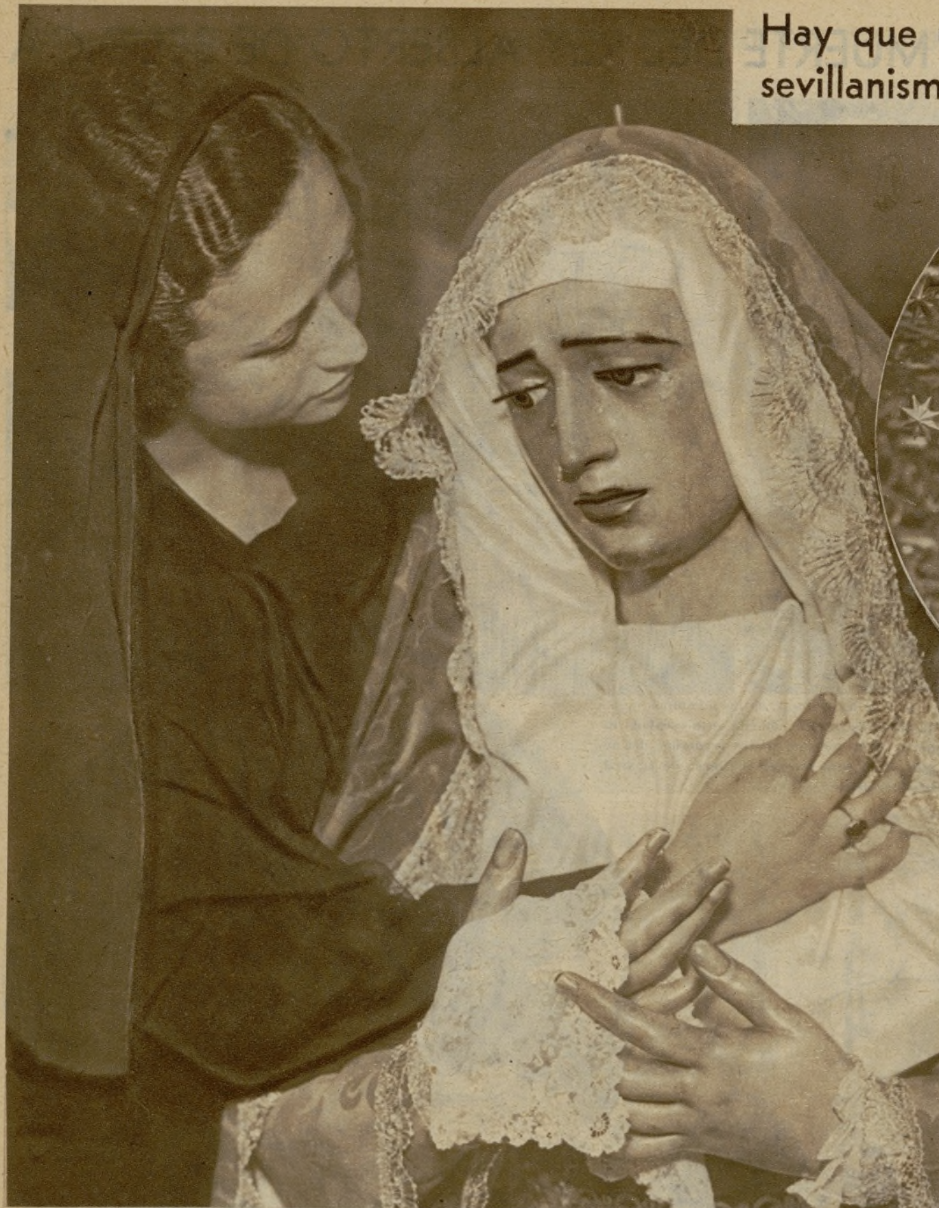
La camarera de la Virgen, de la Hermandad de San Juan de la Palma, encargada exclusiva del arreglo de la imagen de Nuestra Señora de la Amargura, ajusta, reverente y orgulloso, la toca de hebreo sobre la venerada cabeza