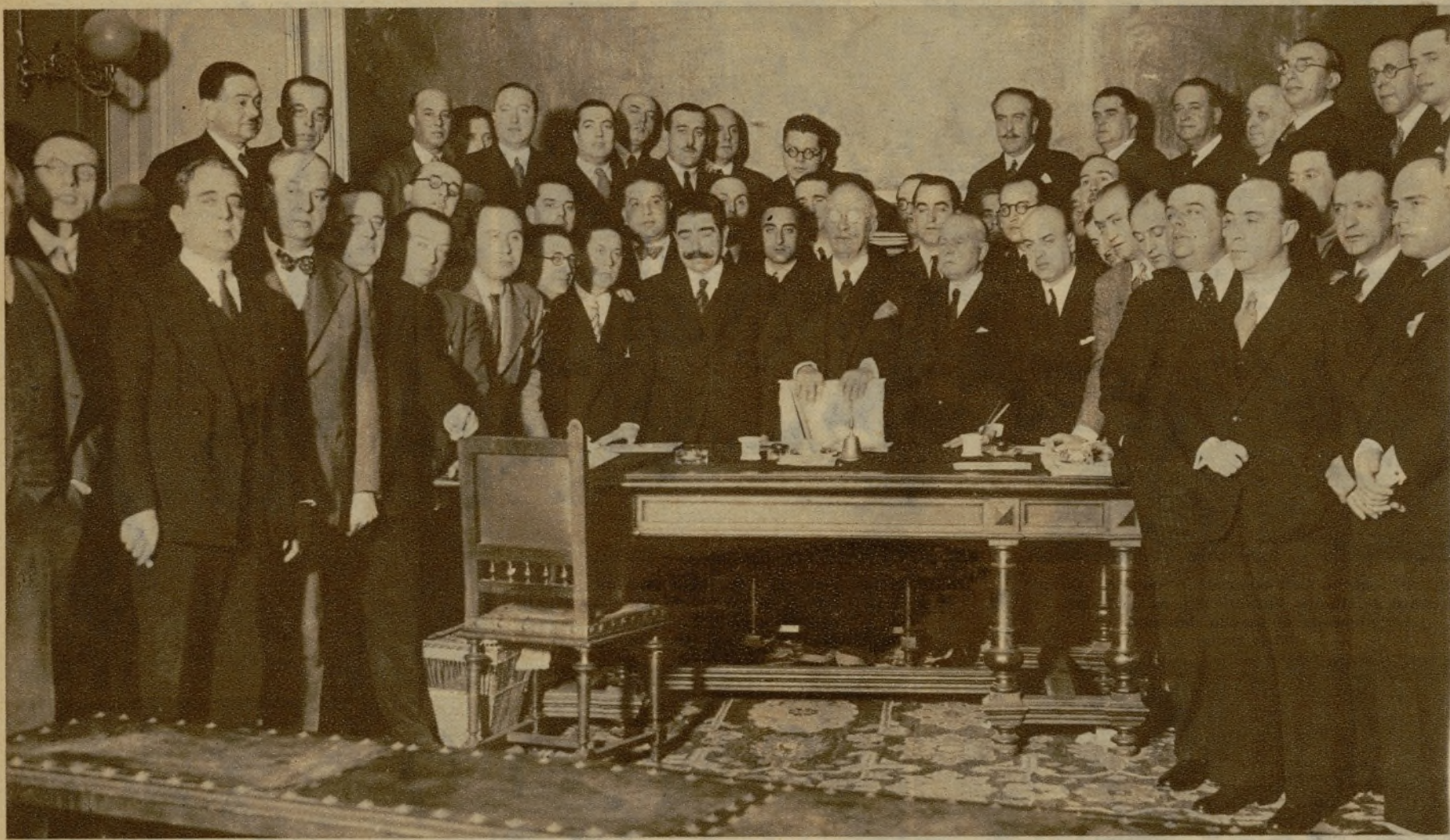
El jefe del Gobierno, don Alejandro Lerroux, presidiendo la reunión celebrada en el Congreso por los diputados del partido radical en la mañana de ayer