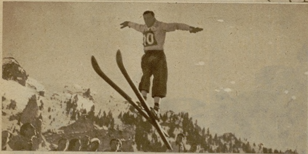
Un momento de los concursos internacionales en La Molina ● Arriba, la meta