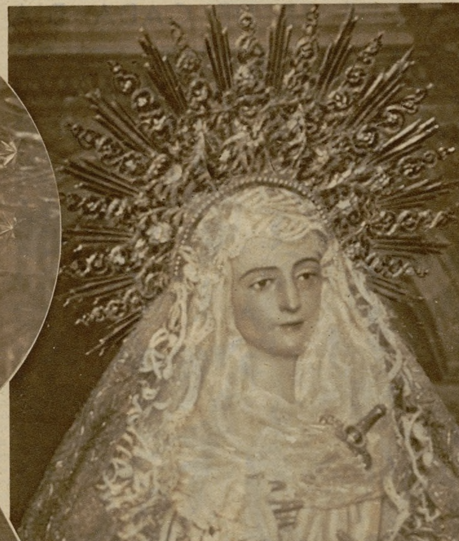
La hermosísima y venerada imagen de Nuestra Señora de la Merced, de la parroquia del Salvador.