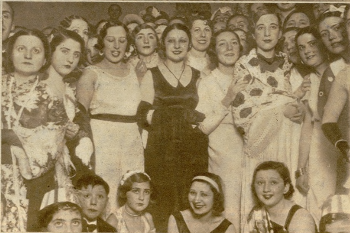
El Hogar Extremeño ha celebrado el Domingo de Piñata y el estreno de su nueva casa con un brillantísimo baile, al que asistió una bellísima y nutrida representación femenina, de la que es elocuente muestra la foto