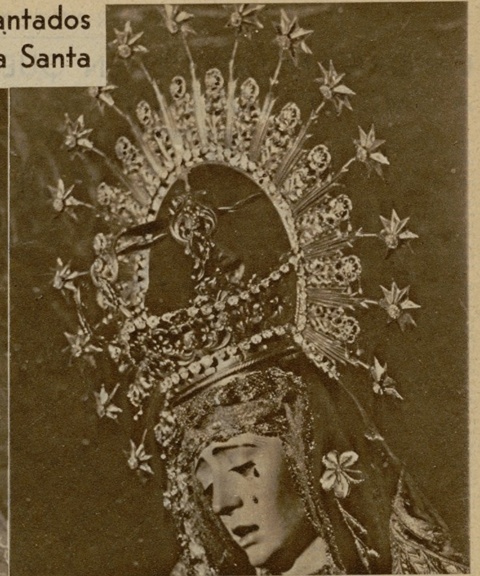
Nuestra Señora de la Estrella, de la parroquia de San Jacinto. Esta Hermandad fué la única que salió el pasado año