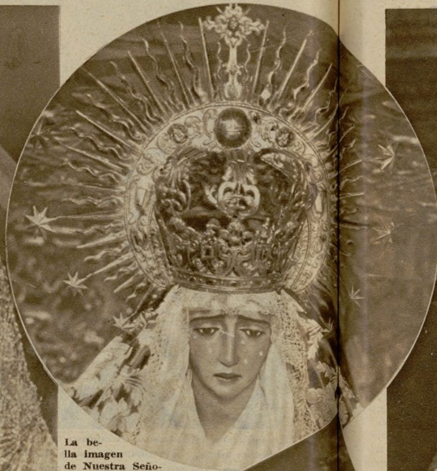
La bella imagen de Nuestra Señora de la Candelaria, de la parroquia de San Nicolás, adornada artísticamente