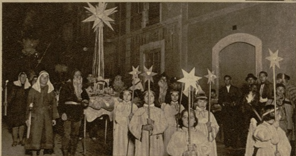
Otro lucido grupo de la cabalgata de Reyes, de Tarragona, con la estrella-guía.