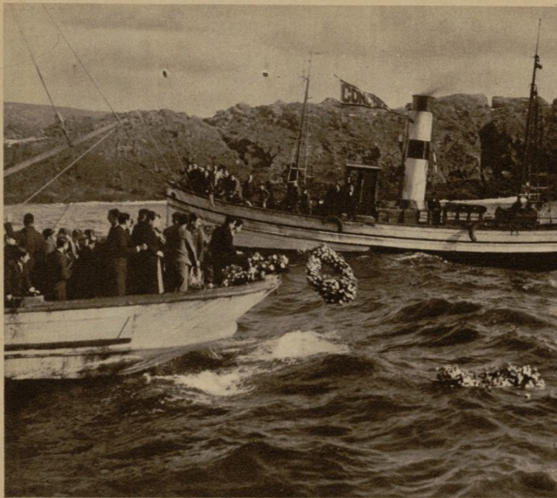
Momento de ser lanzadas al agua, en la ría de Vigo, coronas de flores en recuerdo de los siete naufragos del vapor "Nueva República", recientemente hundido. El acto se verificó en el propio lugar del trágico accidente

En memoria de las víctimas de un naufragio Una madre mata a sus hijos en un ataque de locura