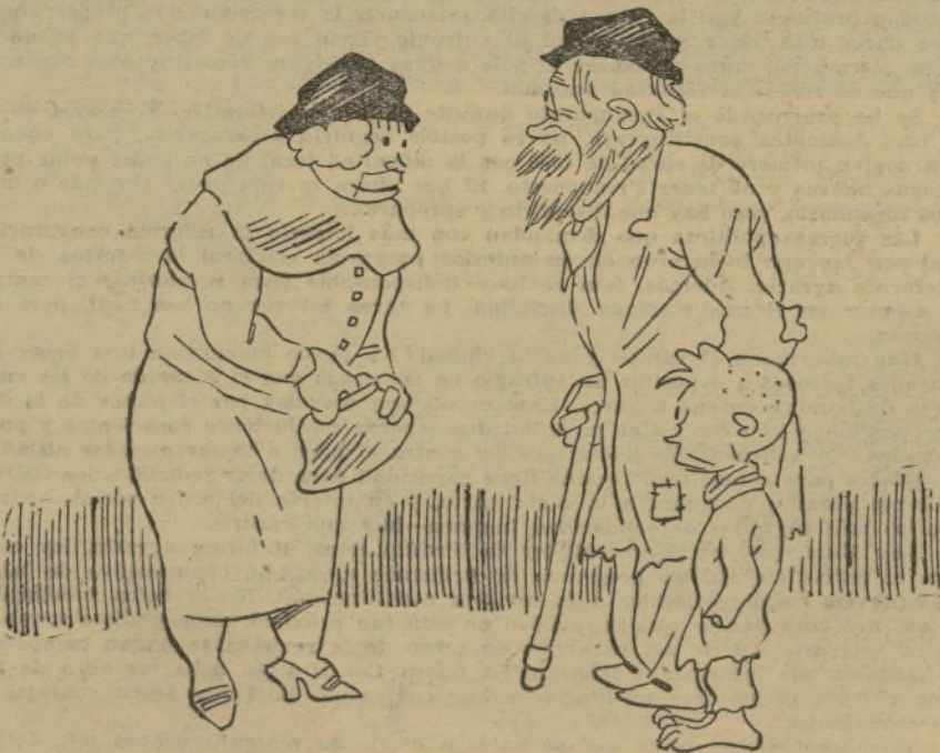
LA MENDICIDAD, por K-HITO

—¿Este niño es nietecito suyo? —No, señora. Es un aficionado.