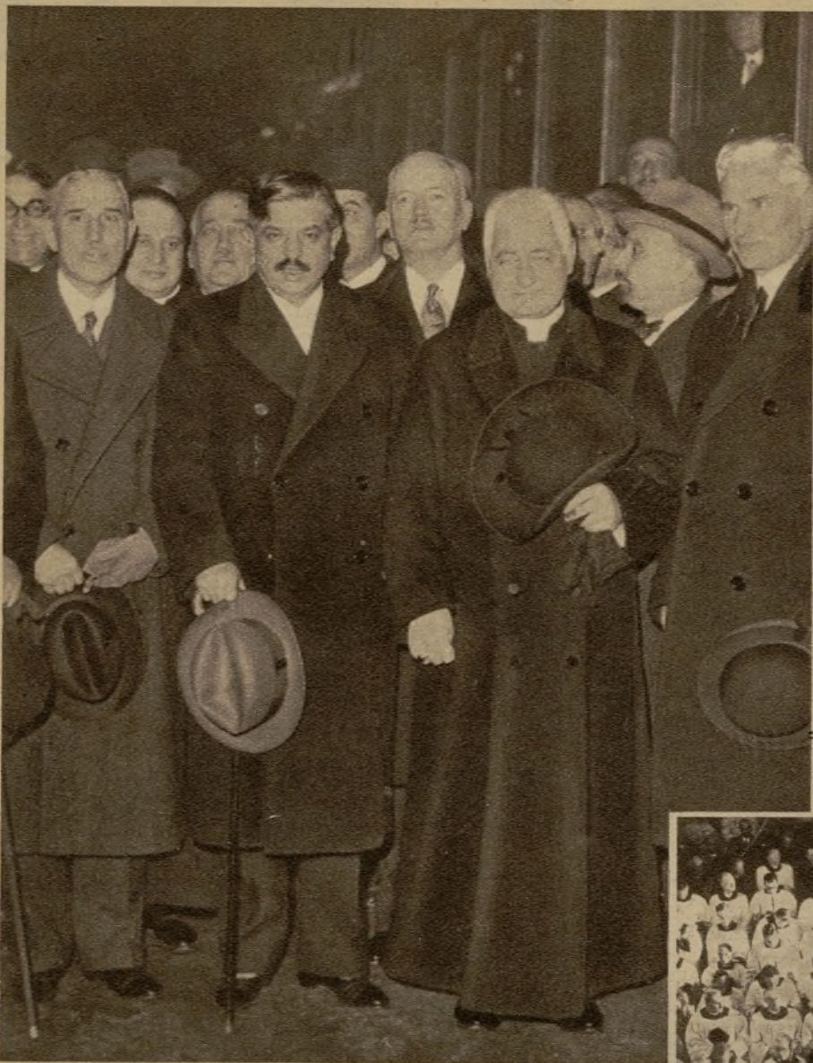
Monsieur Pierre Laval momentos antes de partir para Roma, en la estación de Lyon. Acompañan, en la foto, al ilustre político francés el conde Pignatelli Morano di Castozza, embajador de Italia en París; monseñor Maglione, nuncio apostólico, y M. Spalaicovith, ministro de Yugoslavia en Francia