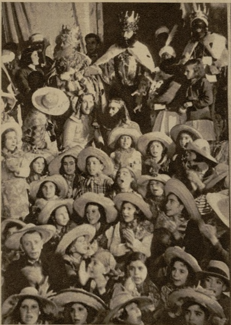
Los Reyes Magos de la lucidísima cabalgata que desfiló por las calles de Granada repartiendo juguetes a los niños del Hospicio