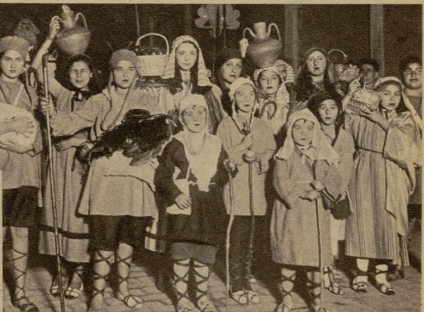
Pastores y figuras bíblicas que formaban parte de la cabalgata de los Reyes Magos en Tarragona