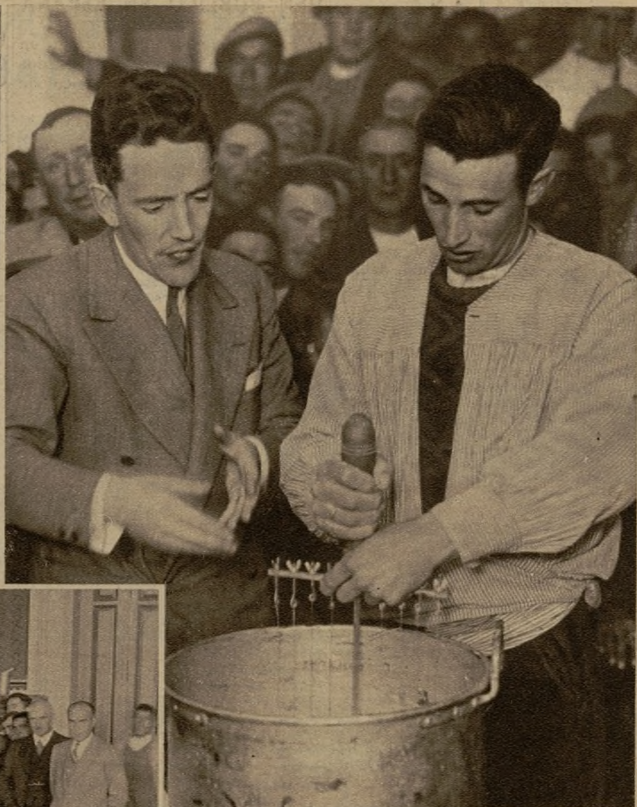
Realizando la operación de cortar la leche, una vez cuajada, valiéndose del instrumento llamado "lira"