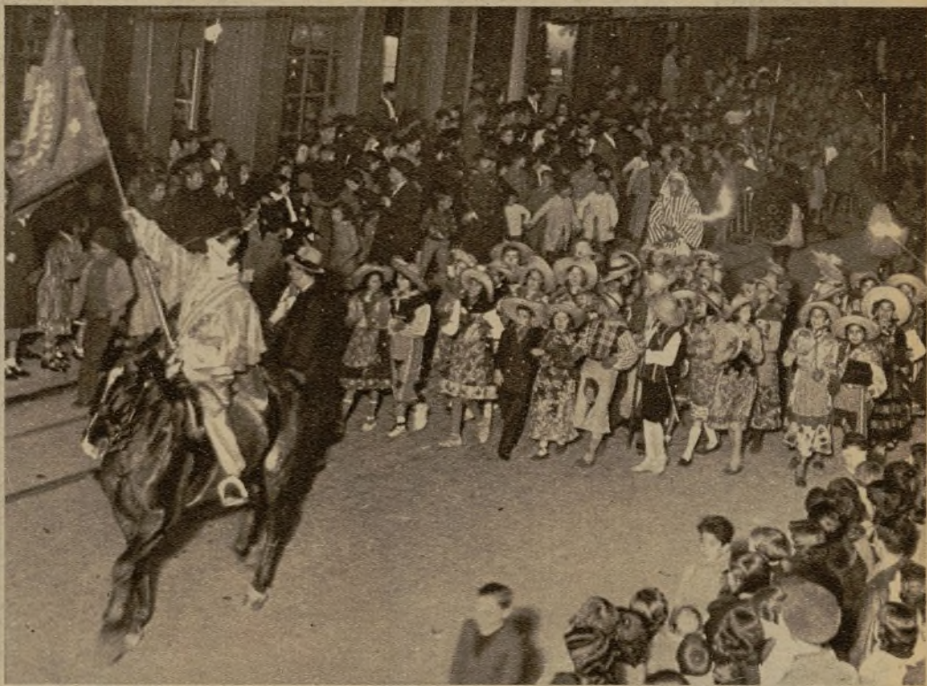
Grupo de pastorcitos que figuraban en la lucida cabalgata que recorrió los centros benéficos de Granada repartiendo regalos a los pequeños