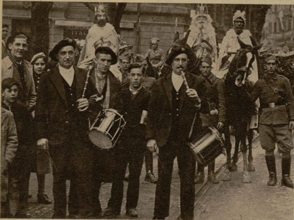
Los tres Magos de Oriente, que con un lucido cortejo y precedidos por los flautistas y tambo- borileros, recorrieron las calles de Bilbao y realizaron un reparto de miles de juguetes en- tre los niños acogidos en los Centros de Beneficencia