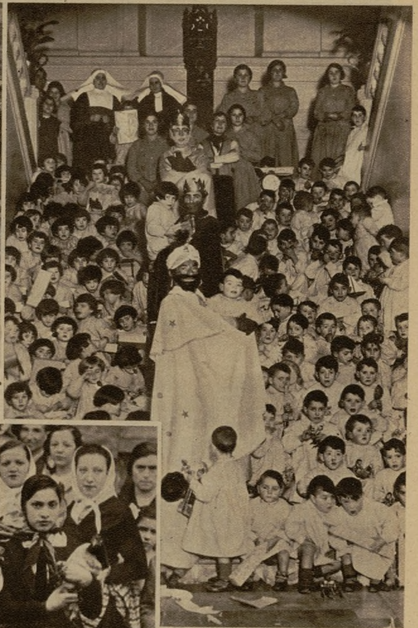
La Asociación de Antiguos Exploradores, de Bilbao, organizó una lucida cabalgata, que recorrió los Centros benéficos para repartir ju- guetes a los niños enfermitos y asilados. Helos aquí, con los maravillosos pequeñines