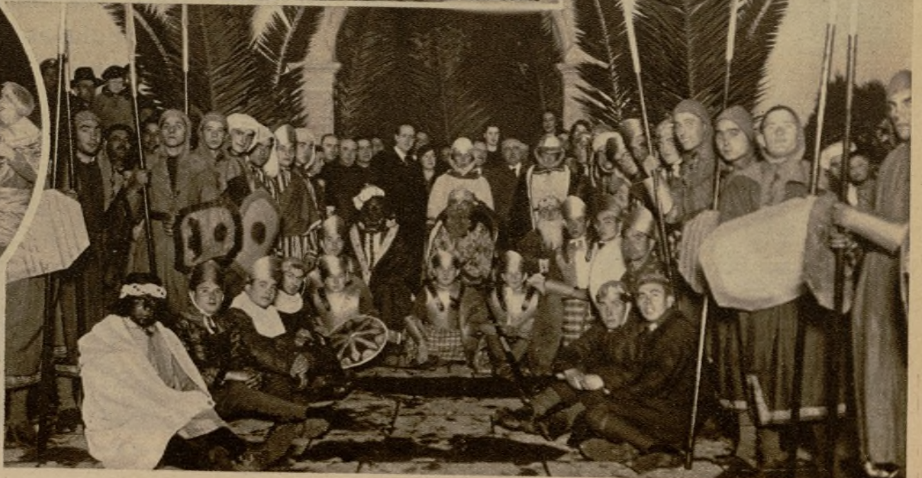
Los Reyes Magos y su cortejo, que recorrieron los Centros benéficos de Oviedo