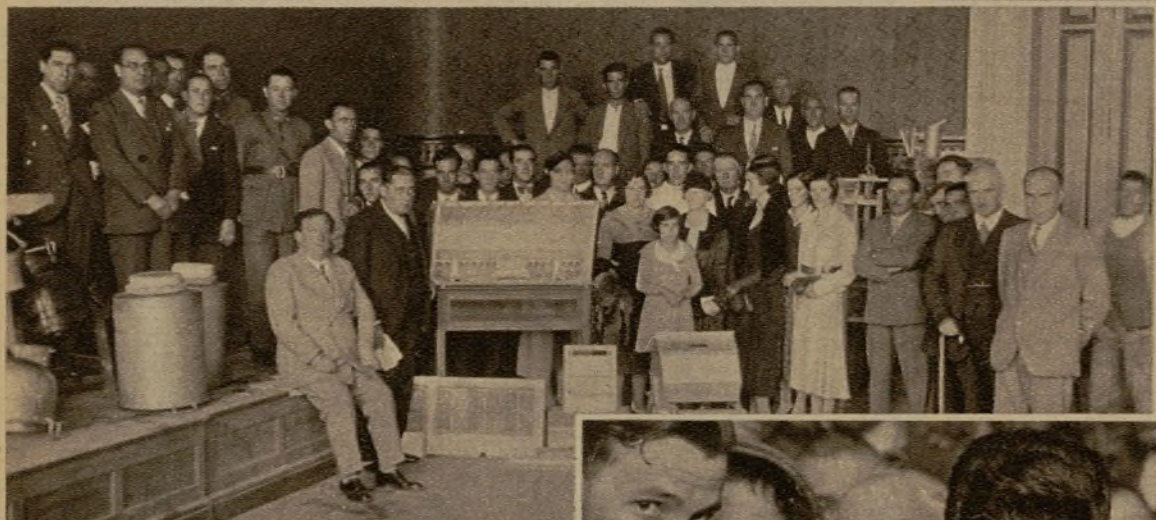
Lección práctica de avicultura y apicultura en la Escuela de Artes y Oficios de Logroño