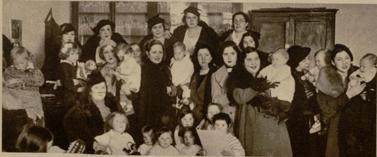
Un momento del reparto de ropas y juguetes a los hijos de las reclusas en la Cárcel de Mujeres