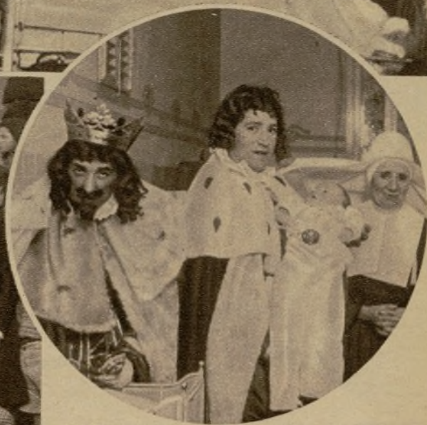
Los Reyes Magos del Círculo de Bellas Artes, de Valencia, durante su visita a los niños de la Inclusa