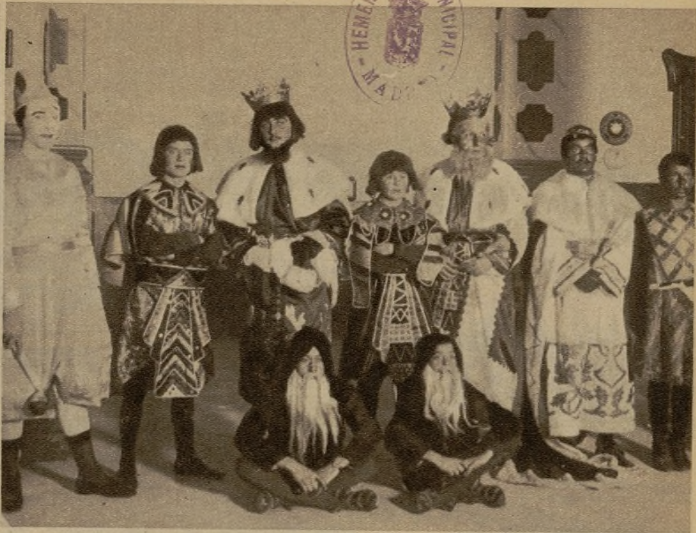
Los Magos de la Caja de Ahorros y Monte de Piedad, de Valencia, que repartieron juguetes entre los niños del Asilo de San Eugenio. Los pequeños fueron también agasajados con una función de circo