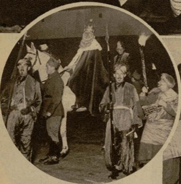
Uno de los Magos, con su cortejo, al llegar a la Casa de Misericordia, de Pamplona, para repartir sus dádivas a los pequeños