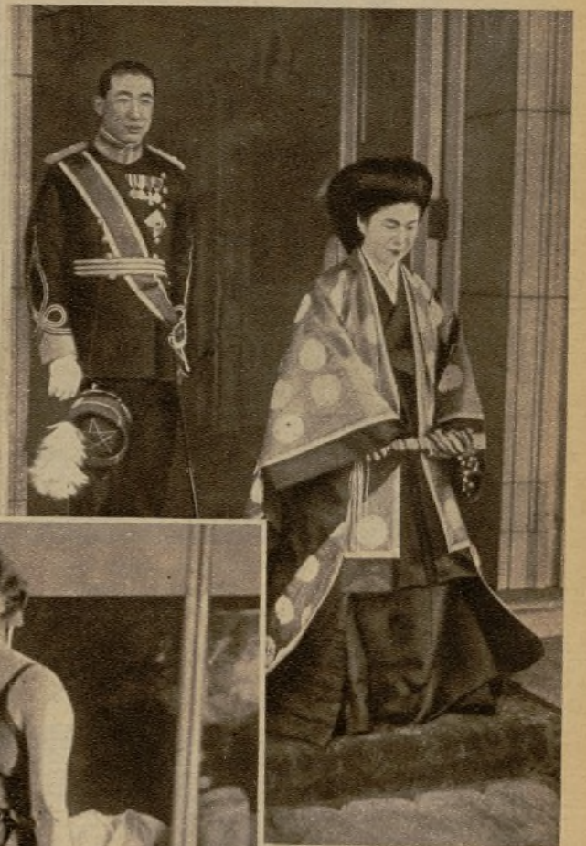
He aquí a la princesa nipona Sawaka Kitashirakawa, que en breve contraerá matrimonio con el vizconde Higashigomo. En la foto aparece la princesa al salir del palacio imperial, acompañada de su hermano

En Roma se realizan con gran actividad las excavaciones arqueológicas para el descubrimiento de restos de la ciudad antigua. He aquí una vista del Circo Máximo, sobre el Palatino, y arriba, la Avenida del Imperio y la Basilica de Masencio