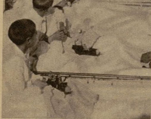
En honor de los enfermitos del Sanatorio de la Malvarrosa, en Valencia, se celebró una función de circo, que hizo las delicias de los pequeños. Después, los generosos artistas hicieron un profuso reparto de juguetes