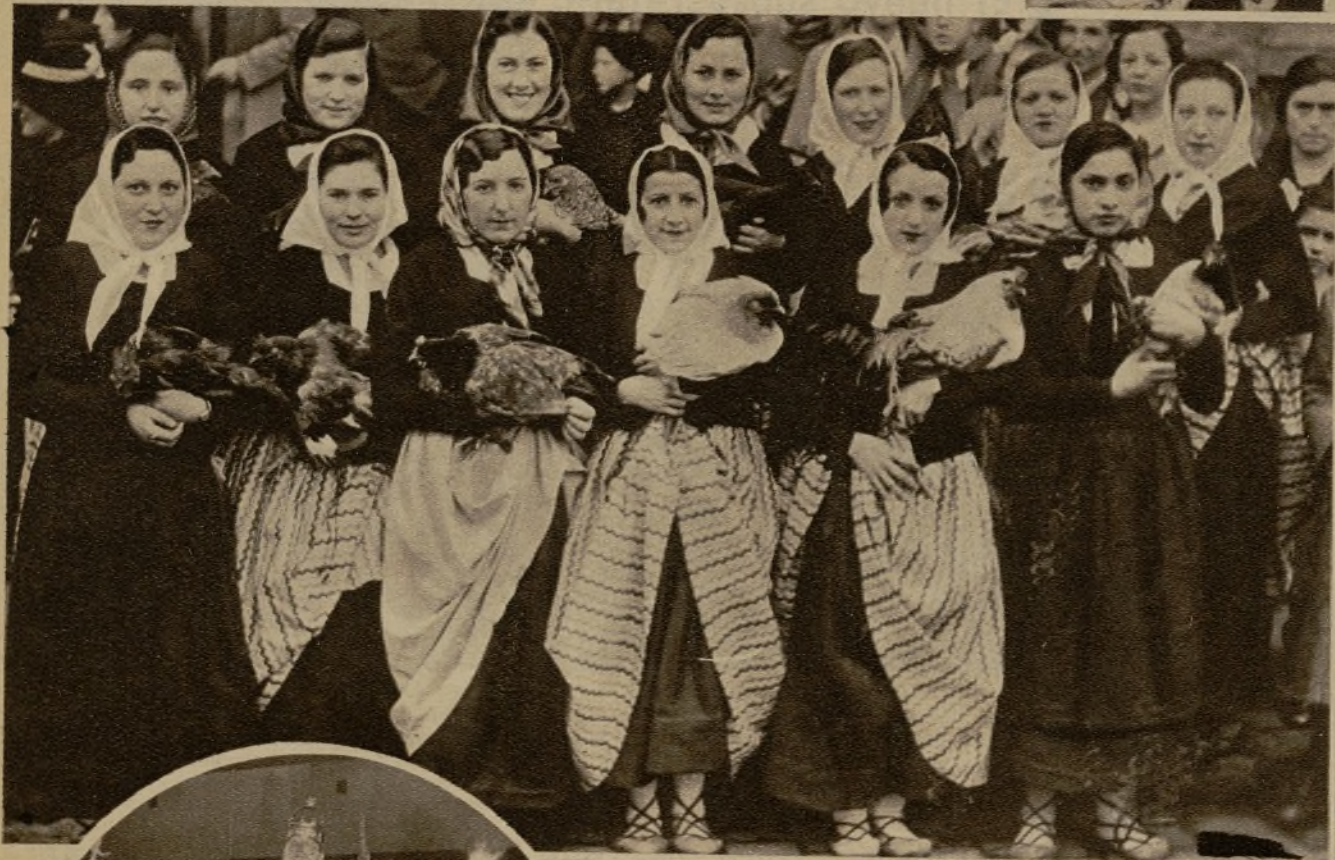
Grupo de bellas señoritas bilbaínas que figu- raban, como pastoras, en la brillante comitiva de los Reyes Magos, que recorrió los Centros benéficos