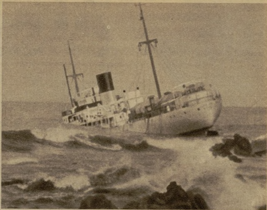
El magnífico vapor de la Compañía Frayssinet, dedicado al transporte de frutas, que en su viaje inaugural ha encallado en los arrecifes próximos a Casablanca, y al que se considera totalmente perdido