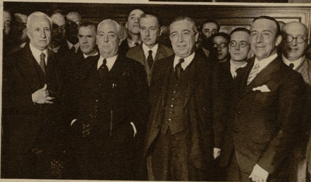
Niños del Colegio de Huérfanos de Médicos, que fueron obsequiados con una comida y juguetes por el Consejo de Colegios Médicos de España con motivo de la festividad de los Reyes Magos