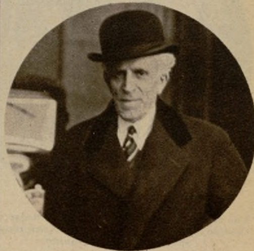
El gobernador general de Cataluña, señor Portela Valladares, al salir del Palacio Nacional, después de cumplimentar al Presidente de la República