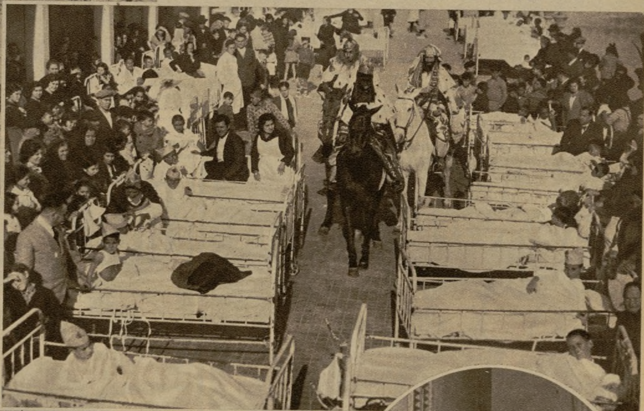
Los Reyes del "Americain Cirque", de Valencia, llegan fastuosamente vestidos, caballeros en sus apacibles corceles, junto a las cunas de los enfermitos de la Malvarrosa