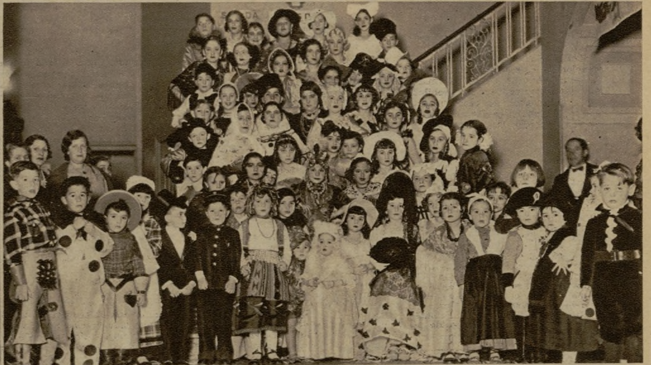
Un nutrido grupo de pequeñas mascaritas que animaron el lucido baile que dedicó a los pequeños la Unión de Dibujantes Españoles