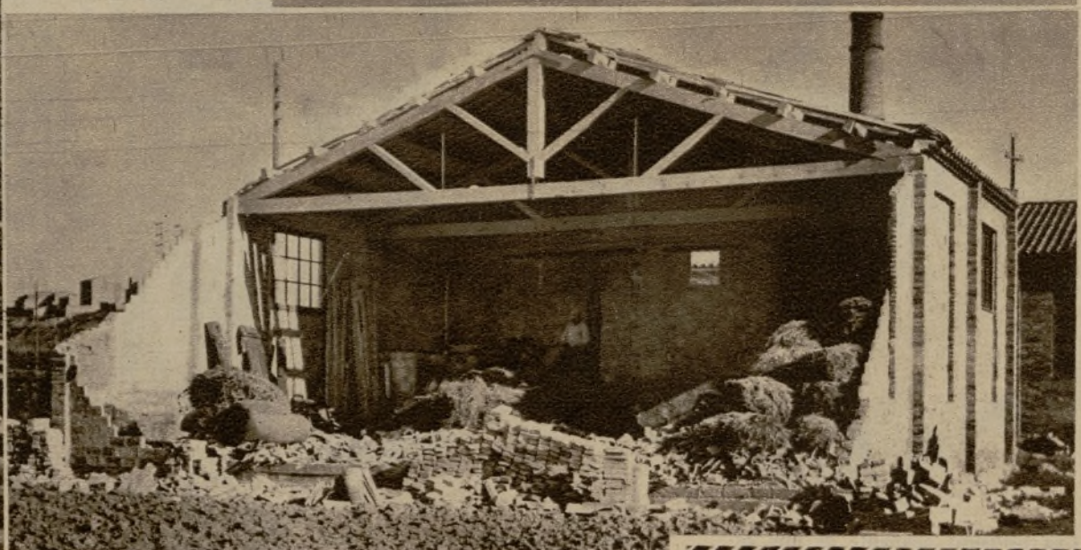
Restos de un molino, en las inmediaciones de Manresa, que fué derribado por un formidable ciclón

AMER PICON Aperitivo universal : Producto nacional Burla el frío y combate la gripe