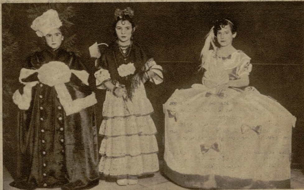
El baile dedicado a los pequeños por la Asociación de la Prensa valenciana constituyó un extraordinario éxito y fué motivo de animación para chiquitines y mayores. Varias de las mascaritas premiadas