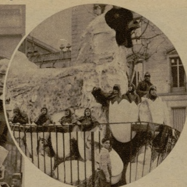
Una colosal gallina, con "polluelos" de diversa clase y condición, que formó parte del gran cortejo de Carnaval en el paseo de Gracia