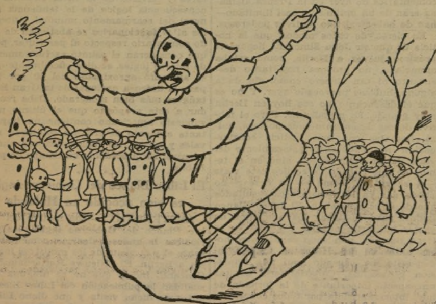
LA DESTROZONA, por K-HITO