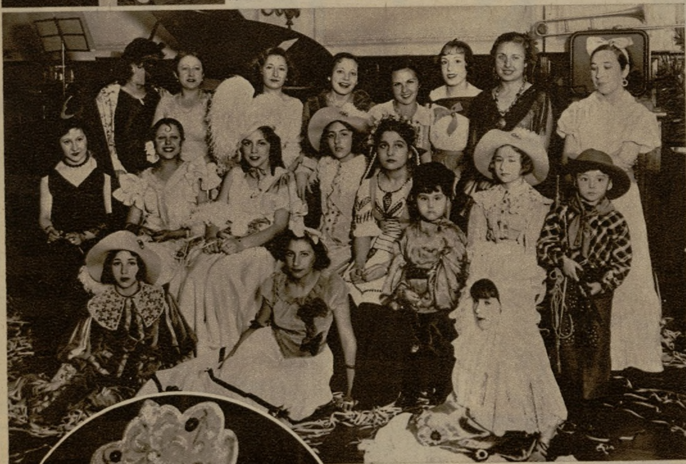
Grupo de bellas señoritas concurrentes al baile de disfraces organizado por el "Young Peoples Ball"