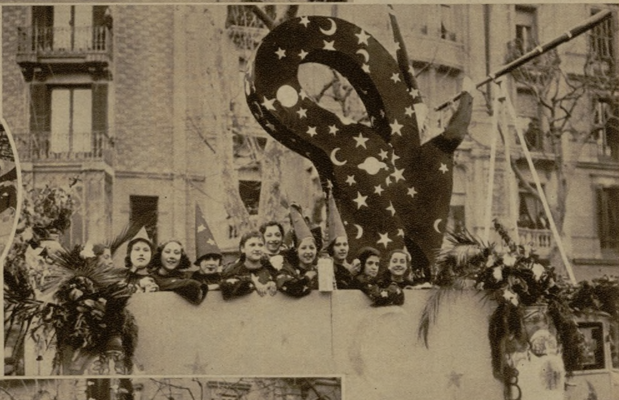
Otra original carroza ocupada por un bello ramillete de "astrónomas"