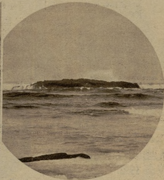
Lugar donde ocurrió el naufragio de la lancha pesquera "Ursula II", y al fondo, el islote con que fué a chocar, impulsado por un terrible golpe de mar, el bote salvavidas "Mariscal Liautey"