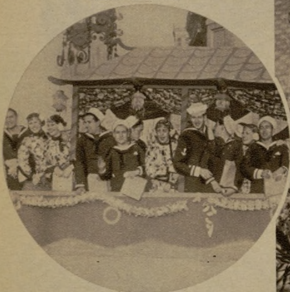
"Embarcación china" con sus tripulantes, que no ofrecen palmarias características asiáticas