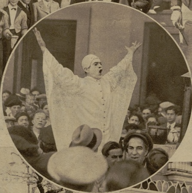
Esta máscara, que decía representar al "duende de Zaragoza", paseó tangible, perorativa y sin misterio, con la impedimenta de su cocina, por las calles gaditanas