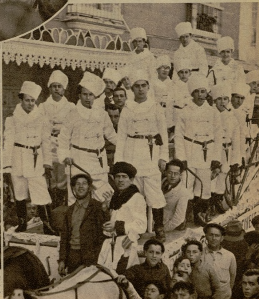
Coro "Los polacos", tercer premio en el concurso de comparsas del Carnaval gaditano