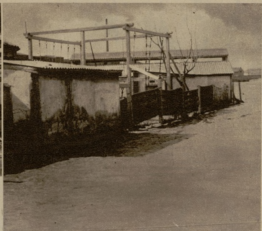
El Ebro ha sufrido una alarmante crecida y las aguas han invadido grandes extensiones de terreno. Véase el nivel que alcanzan en el lugar donde está emplazado el Club Helios