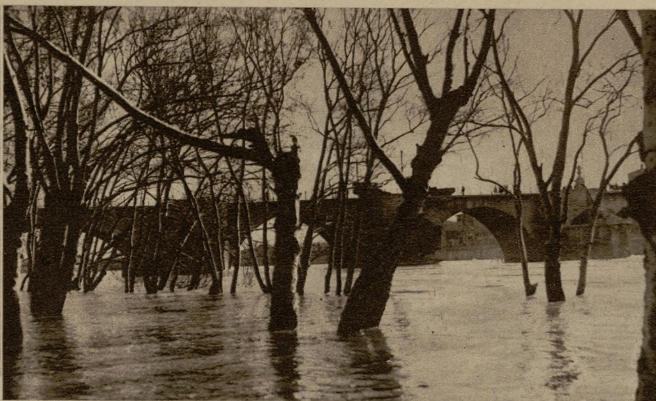
Las aguas del Ebro cubren toda esta extensa zona de arboleda, junto a la vía del ferrocarril, en Zaragoza