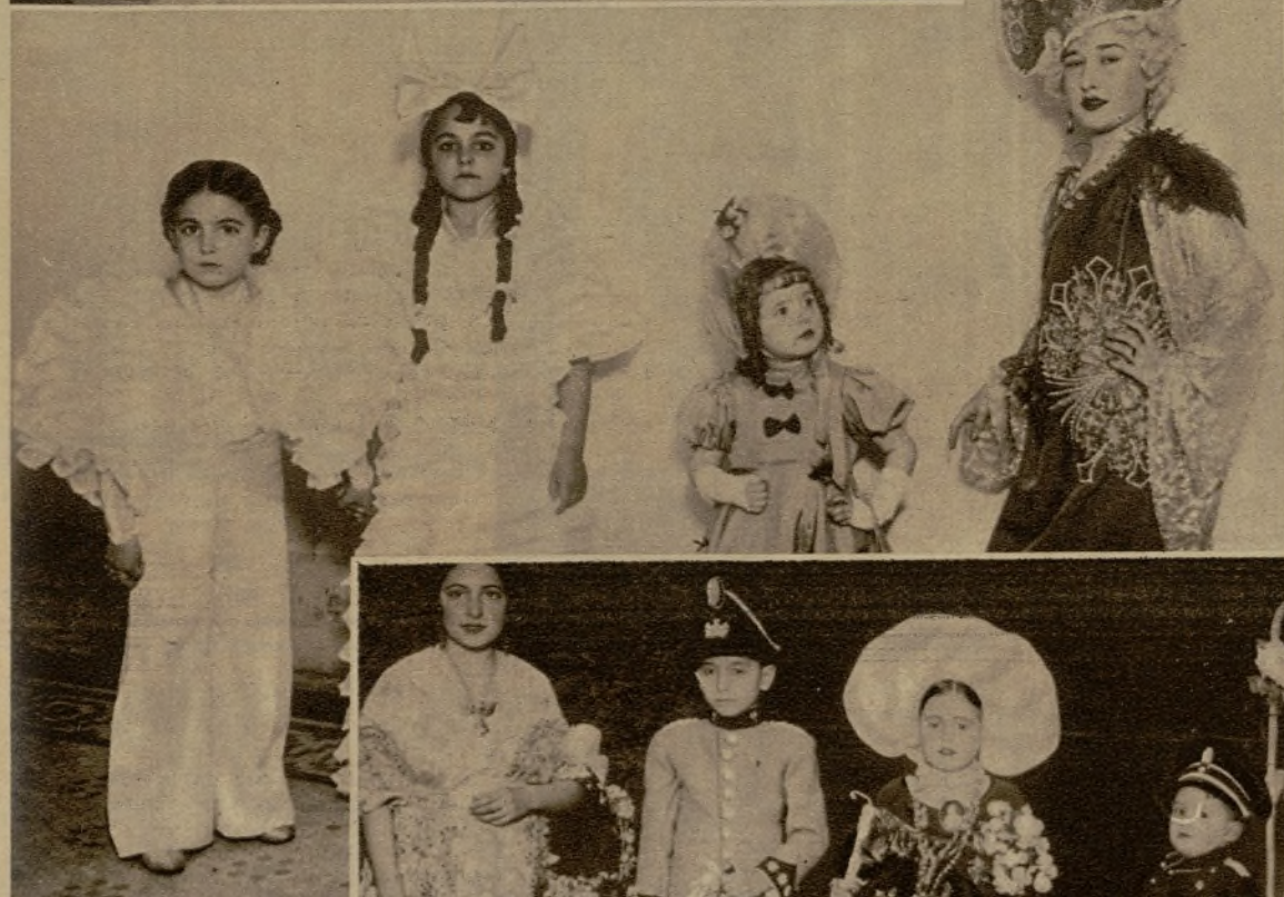
Centenares de niños concurrieron al lucidísimo baile infantil de la Asociación de la Prensa, y difícilísima fué la labor del Jurado para adjudicar los premios, pues los disfraces de los pequeños rivalizaban en arte y originalidad. He aquí a los cuatro galardonados en primer lugar