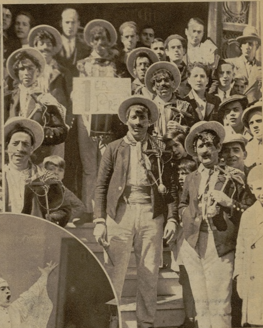
Esta comparsa, titulada "Los lañadores", y que desarrolló un graciosísimo repertorio de coplas, obtuvo el primer premio en el concurso de su "categoría"