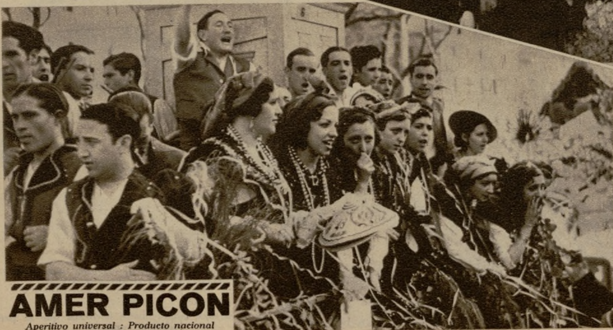
El tercer premio (bis) del concurso de carrozas artísticas, importante 1.500 pesetas, fué otorgado a la de la simpática y popular entidad gallega "Anaquiños da Terra"