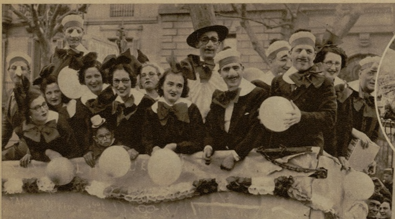
Animados ocupantes de una de las muchas carrozas carnavalescas que desfilaron por el paseo de Gracia barcelonés