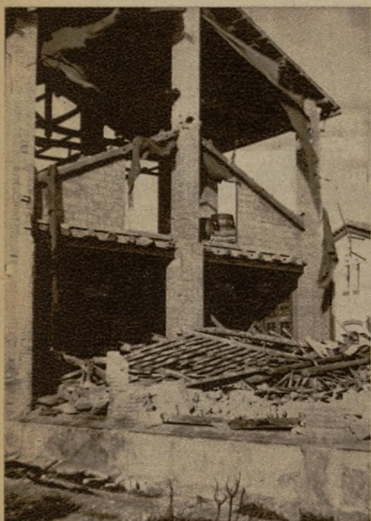
A consecuencia del furioso vendaval, en Igualada se desplomaron la techumbre y varios muros de una fábrica de curtidos, que quedó en el estado que se aprecia en la foto