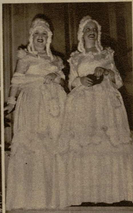
Dos bellas concurrentes al baile de Bellas Artes