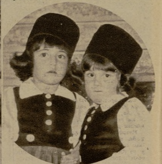
Dos monísimas holandesas del baile infantil de la Unión de Dibujantes