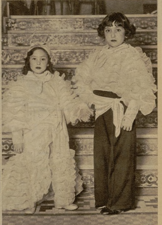
Grupo de concurrentes al animadísimo baile organizado por los alumnos de Ingeniería y Arquitectura de la Agrupación "Ingar". A la derecha, una linda pareja de "rumbistas" que concurre al baile infantil organizado por la Unión de Dibujantes Españoles en el Metropolitano