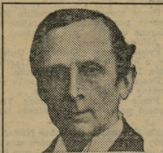
El Real Médico que acogió el Asmacura del Dr. Hair.

Las personas que padecen los tormentos causados por el Asma, las que sufren de Bronquitis, y los hombres y mujeres martirizados por Catarros o por los efectos agotadores de una Tos Crónica, no deberían vacilar ni por un momento para adquirir un suministro de Asmacura del Dr. Hair. Los éxitos logrados del uso de este descubrimiento revolucionario de este famoso especialista son de una naturaleza tan sensacional, que con el mejor fundamento puede afirmarse que—