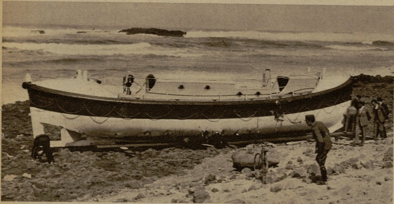
El bote salvavidas "Mariscal Liautey", que volcó cuando había recogido a los náufragos de la lancha pesquera española "Ursula II"

UNO DE LOS DOS UNICOS SUPERVIVIENTES PERMANECIO TREINTA HORAS AFERRADO A UNA PEÑA Y FUE SALVADO HEROICAMENTE POR UN MORO