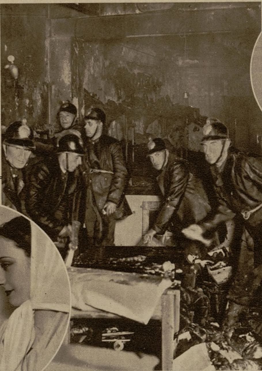
En una fábrica de muñecas establecida en la calle de Regueros se produjo un incendio, que lograron dominar rápidamente los bomberos. Un departamento del edificio incendiado