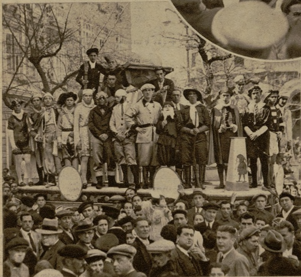
Una comparsa titulada "Los cuentos de Calleja", que obtuvo uno de los primeros premios de coros