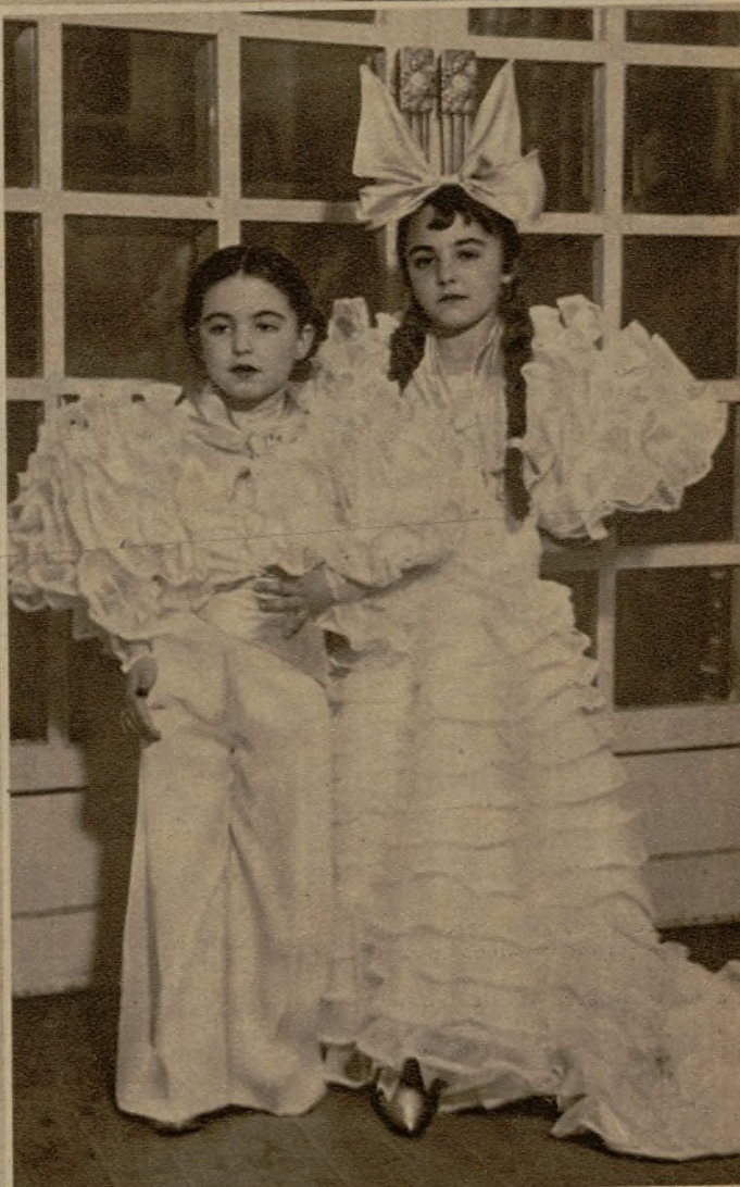
Un grupo de monísimos pequeños luciendo graciosos y artísticos disfraces, concurrentes al baile de la Asociación de la Prensa