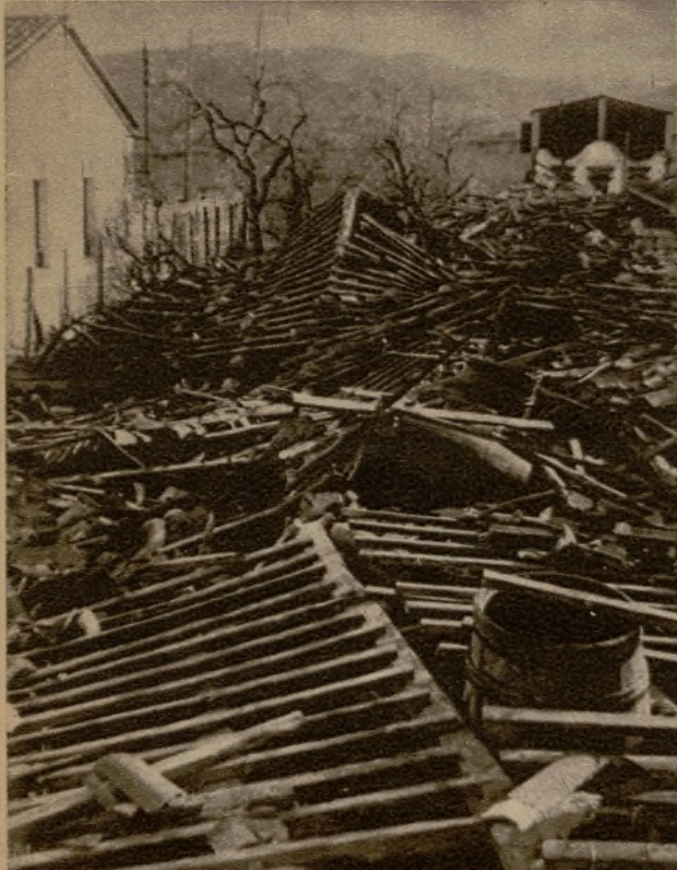
La techumbre de la fábrica de curtidos de Igualada, llamada del "Pere de Carme", arrastrada a tierra por el vendaval. Arriba, otro aspecto del hundimiento