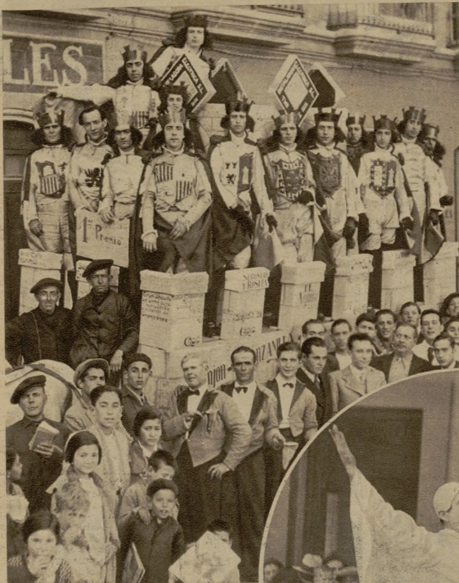
El famosísimo Carnaval gaditano parece haber renacido este año con su tradicional lucimiento. En el desfile figuraron carrozas realmente notables, como ésta de "España y sus regiones", que obtuvo el primer premio