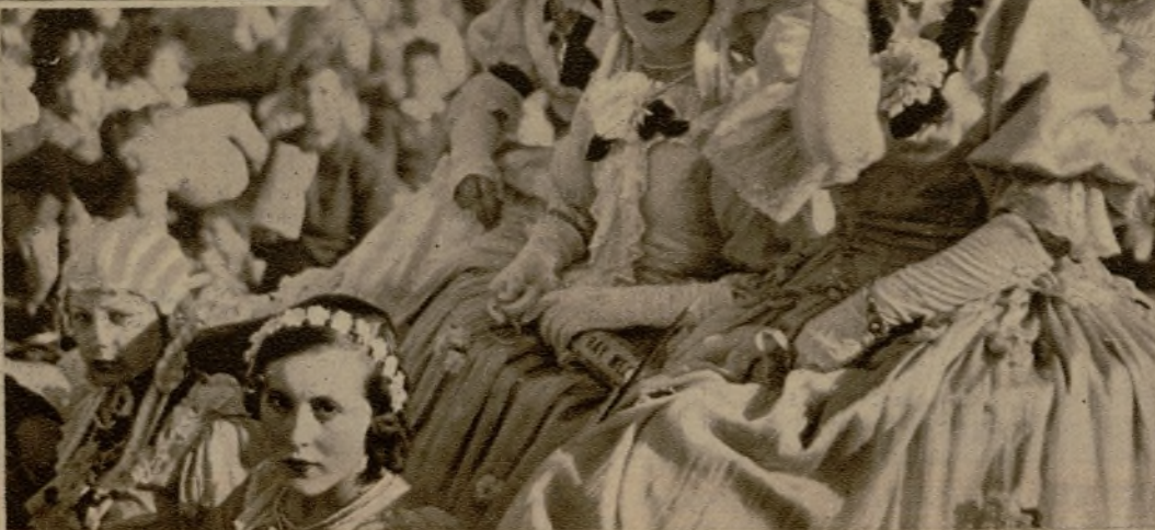
El paseo de la Castellana estuvo animadísimo en las horas de la tarde del lunes de Carnaval. Bello grupo en uno de los numerosos carruajes que tomaron parte en el desfile