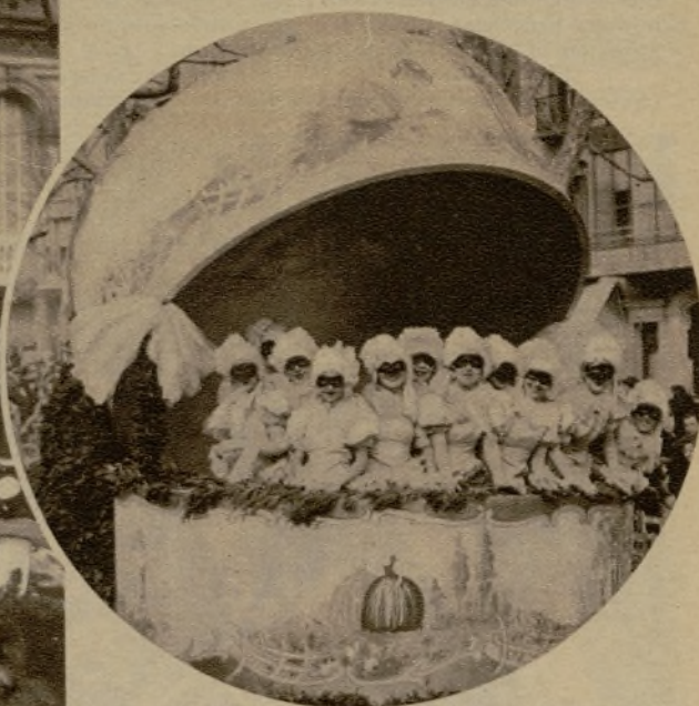
Gentiles mascaritas, en su elegante "bombonera", desfilando por el paseo de Gracia