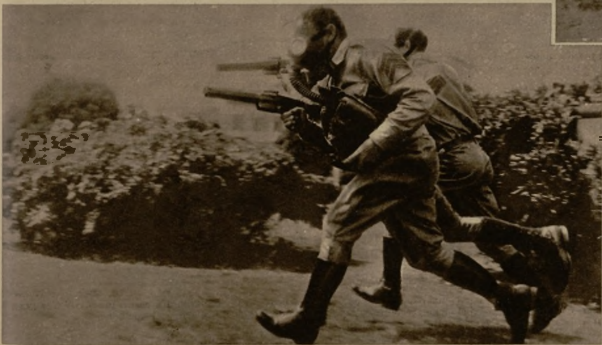
Los soldados que forman la guardia del presidente de la República de Cuba se entrenan activamente en el lanzamiento de gases lacrimógenos y en el empleo de caretas protectoras. Aquí se los ve en un momento del ejercicio que a diario realizan