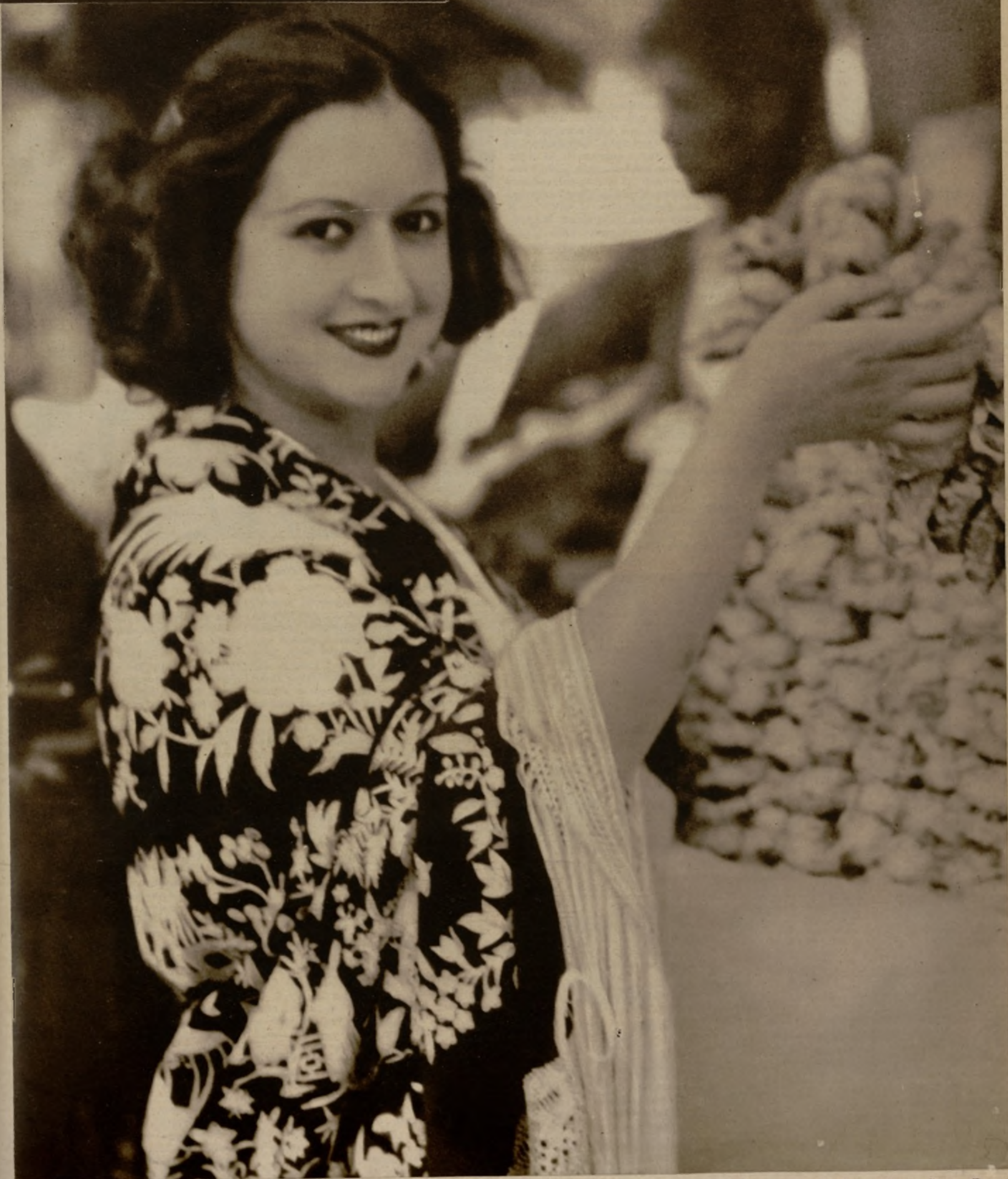
LA FIESTA DE SAN ISIDRO EN MADRID.—La capital ha celebrado ayer con la típica brillantez de siempre la fiesta de su Santo Patrón. Fueron los romeros a beber el agua milagrosa y clara de la fuente que cura la calentura “al que con fe la bebiere”, y se solazaron con la merienda y las diversiones de la Pradera. Entre los visitantes al Santo no podía faltar la madrileñísima “Miss Madrid 1934”, y he la aquí mostrando la belleza de su cara ante un puesto cercano a la ermita de San Isidro