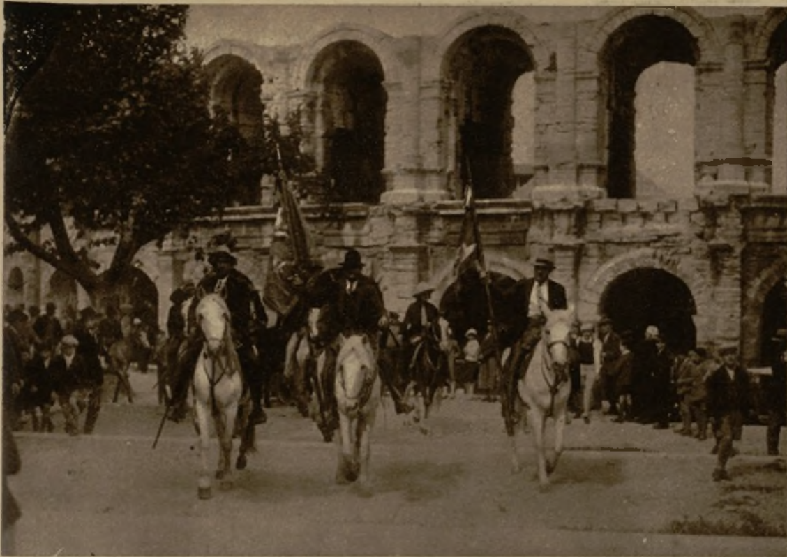
Con el entusiasmo acostumbrado se acaba de celebrar la fiesta de los "cow-boys" provenzales. He aquí a los guardianes en su desfile ante las Arenas de Arles