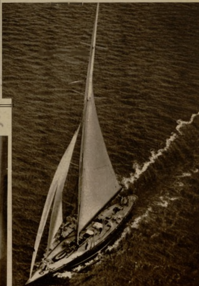
El magnífico "yatch" inglés "Endeavour", visto desde un aeroplano mientras realiza pruebas de entrenamiento para participar en las regatas en que ha de disputarse la Copa de América