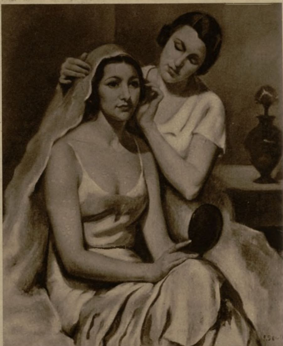
"Vispera de boda", una de las más interesantes obras expuestas en el Círculo de Bellas Artes por Pedro Segimón

Ya en el reposo, los cuadros de Pedro Segimón parecen difundir una dulce serenidad que atenúa sus colores brillantes y su dibujo correctísimo y su factura de Museo. Ya no son aquellos cuadros preciosistas atribuidos a un virtuoso de los