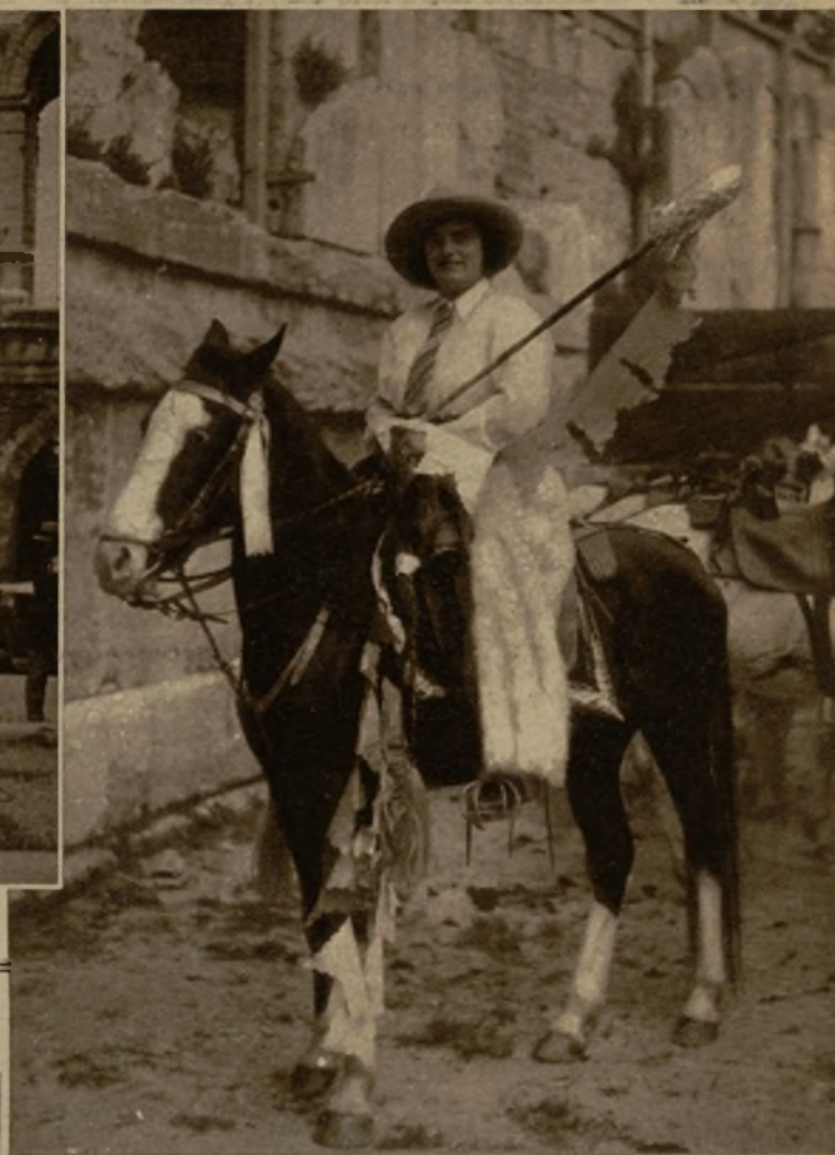
La fiesta de los "cow-boys" de la Camargue es una de las más brillantes que se celebran en la Provenza todos los años. Los números más brillantes que integran el programa son el desfile y la corrida que tienen lugar en la histórica ciudad provenzal. He aquí a la bella "caballera"—así la denominan los franceses—que ejerce funciones de presidenta de la fiesta