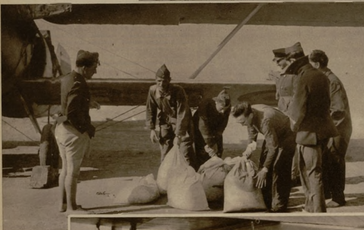
Los aviones militares se han convertido en los "cosarios" del desierto, y llevan sacos de harina, catres de campaña, correo, tabaco...