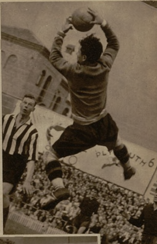
Un excelente bloqueo del portero español durante el partido de fútbol jugado en la tarde de ayer en el campo de Chamartín contra el Sunderland