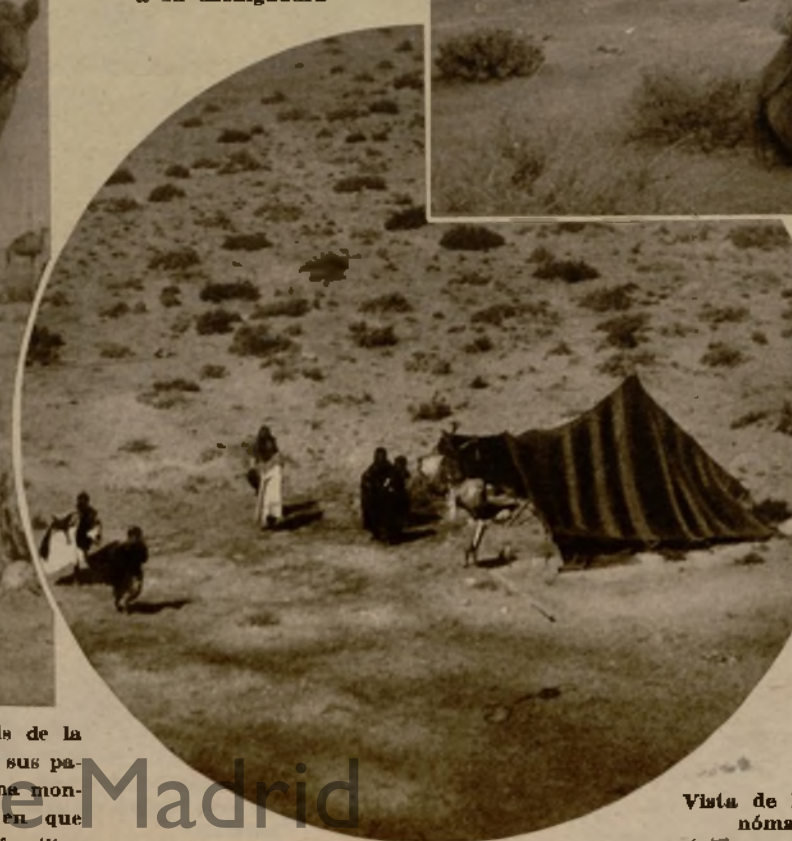
Vista de la "jaima" de una familia nómada, tomada desde un avión

Es tradicional que los guerreros del desierto marchen a las campañas seguidos por sus mujeres. Esta es la mujer de un ascarí, en el momento de subir a su cabalgadura