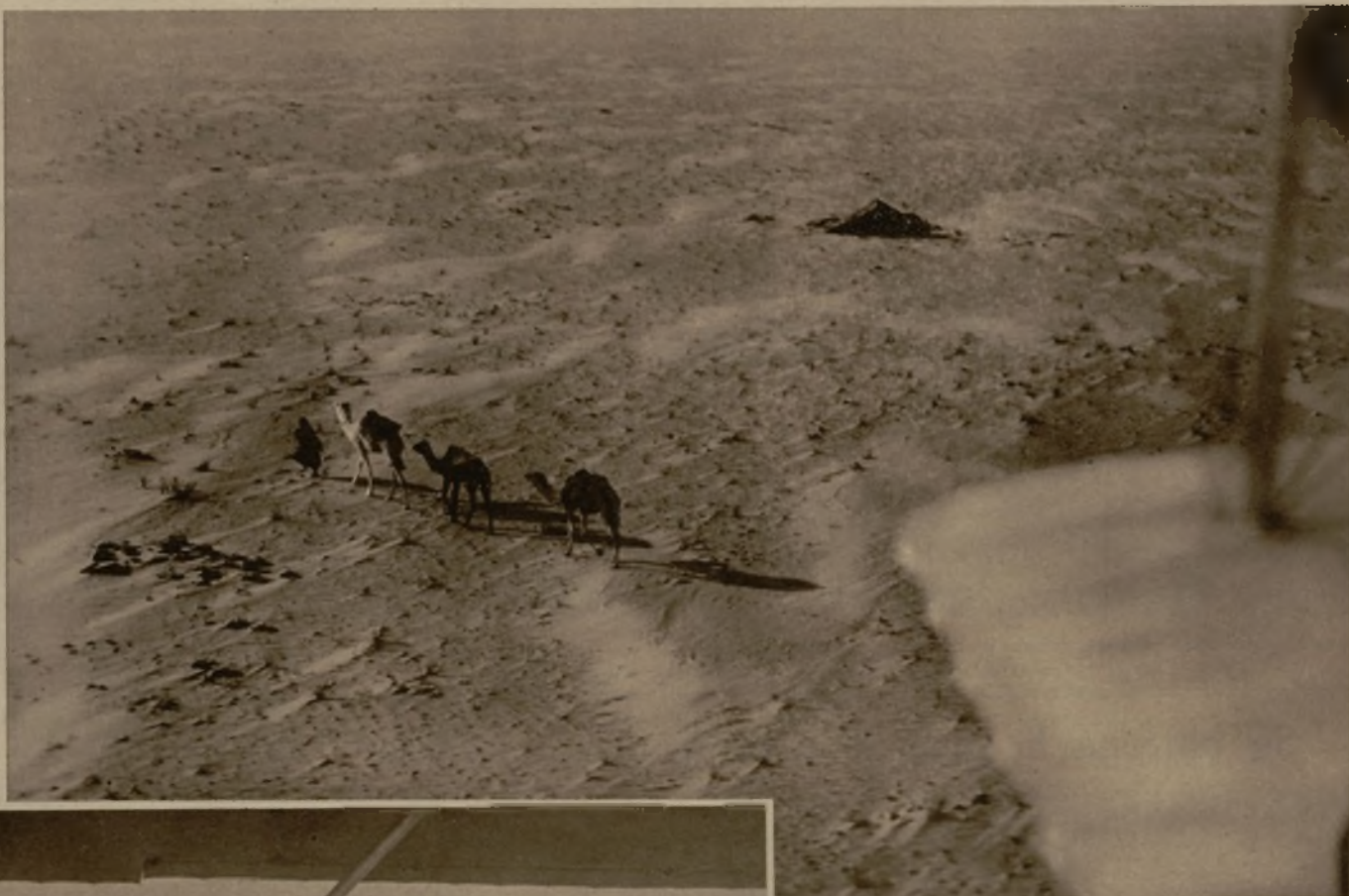
Diariamente los viejos "breguets" de la escuadrilla de Getafe cruzan los trescientos o cuatrocientos kilómetros de desierto que hay entre Ifni y Cabo Juby...

Todo esto no significa ninguna heroicidad; es un riesgo mínimo como el que millares de hombres sencillos y oscuros