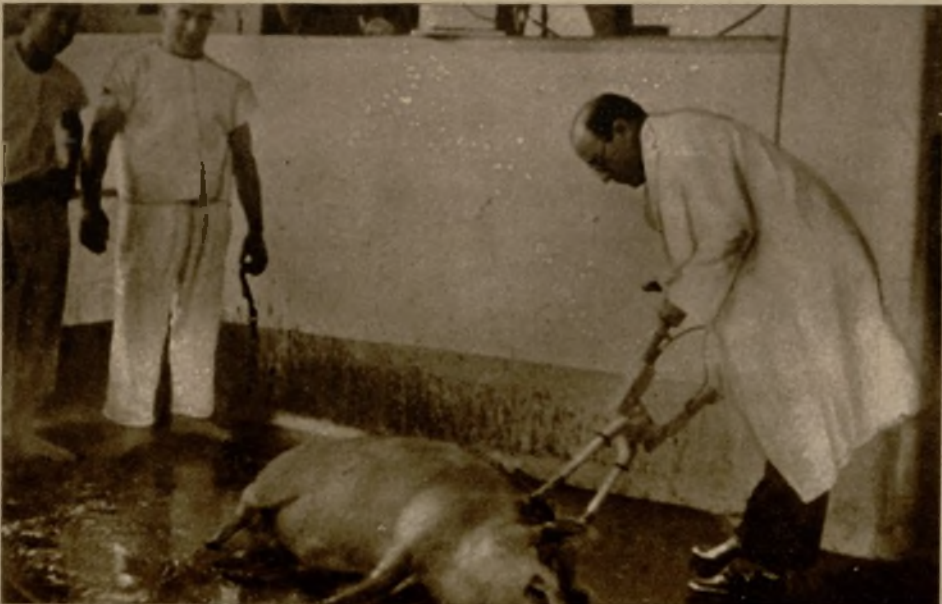
El loable propósito de que el necesario sacrificio de los animales impuesto por el consumo abrevie los sufrimientos de las víctimas ha sido origen de diversos procedimientos. En el Matadero de Río de Janeiro se intenta efectuarlo por medio de un aparato eléctrico