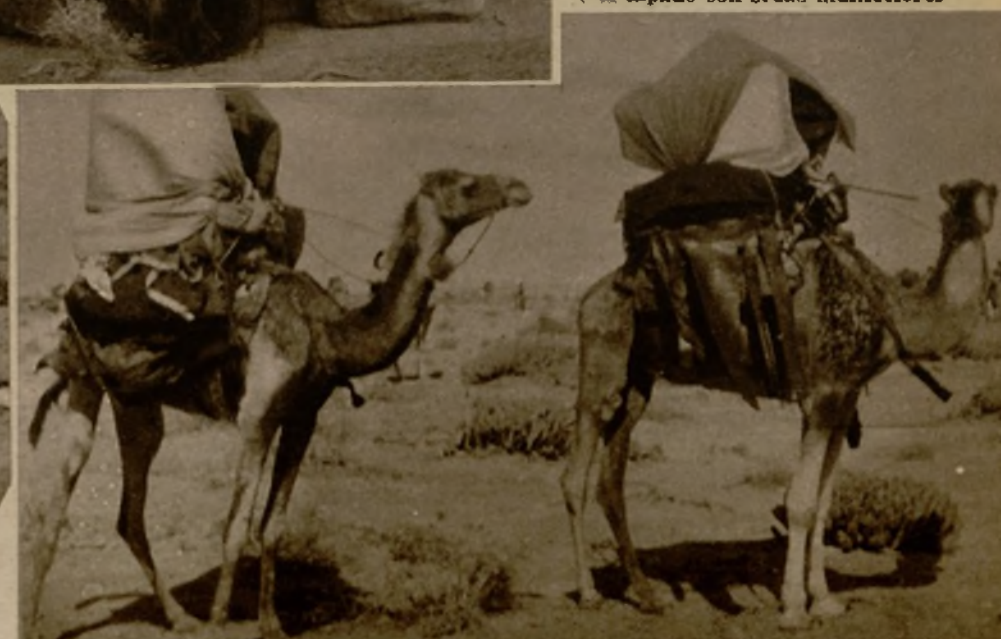
Herméticamente tapadas en su palanquín, las mujeres de los guerreros del desierto echan a andar detrás de la caravana para seguir la suerte de sus hombres en el combate

Los camellos donde van las mujeres llevan una especie de palanquín, tapado con sedas multicolores