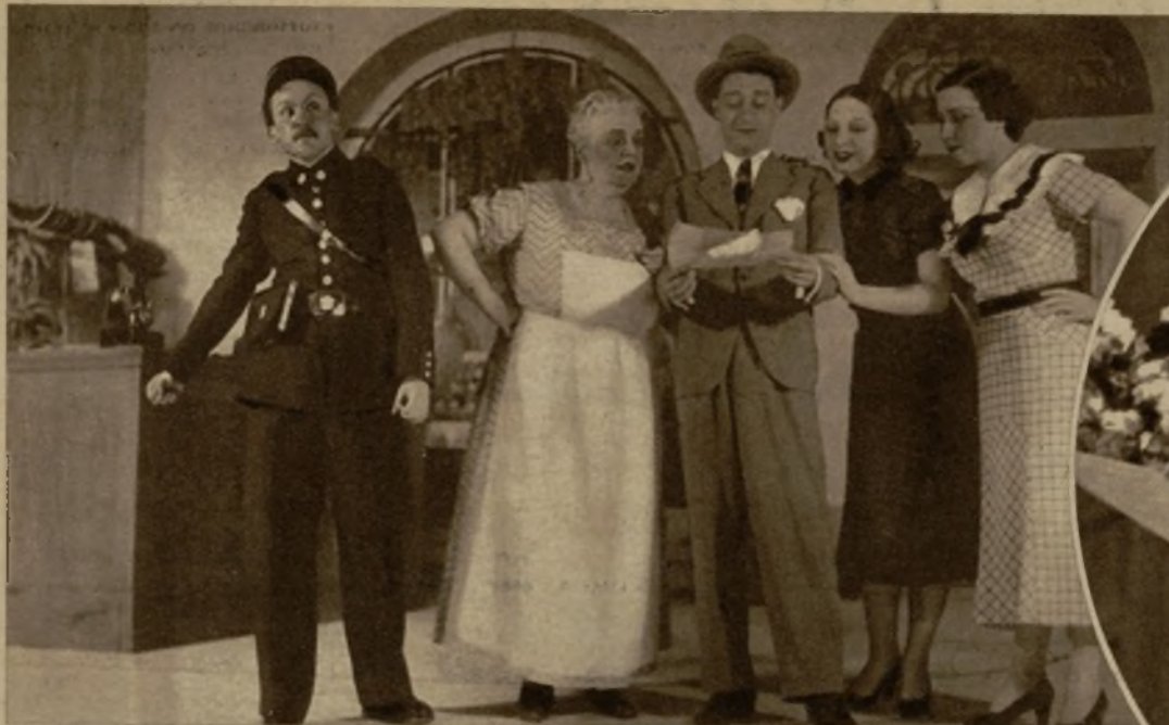
Una escena de conjunto del vodevil estrenado en el teatro de la Comedia con el título "La miss más miss"