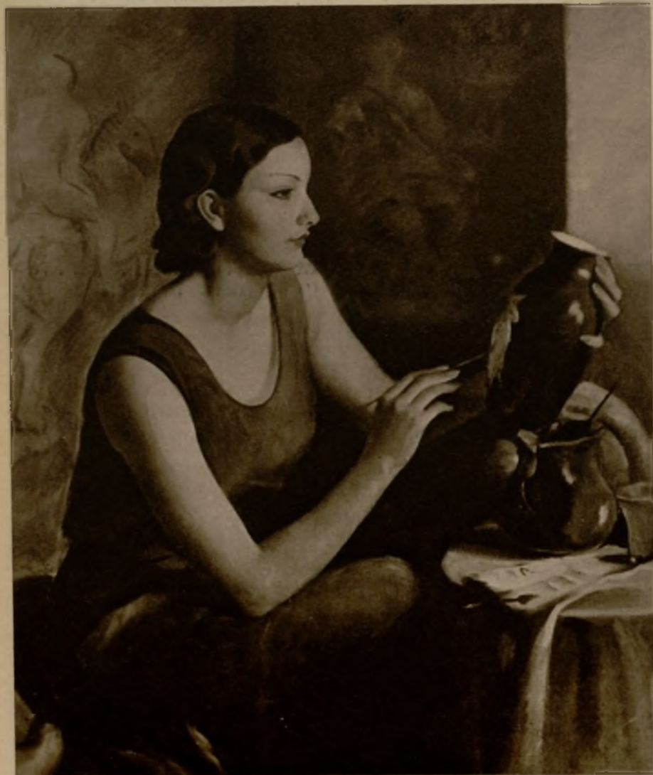
"Pasatiempo", uno de los cuadros de Pedro Segimón, que han figurado en su Exposición del Círculo de Bellas Artes

pinceles, cuya primera impresión desconcertaba. A medida que se contemplan con más calma y recogimiento, acaban por convencer e interesar. Confieso que no es fácil. Tienen en contra suya, para encender el interés artístico, todo lo que en apariencia pudiera considerarse favorable. Crudamente son cuadros demasiado bonitos. Y esta belleza superficial y amable, esta tentación sensual, es peligrosa en la obra de arte, por lo mismo que tiene muchos partidarios de esos que sólo buscan en la pintura un goce recreativo.