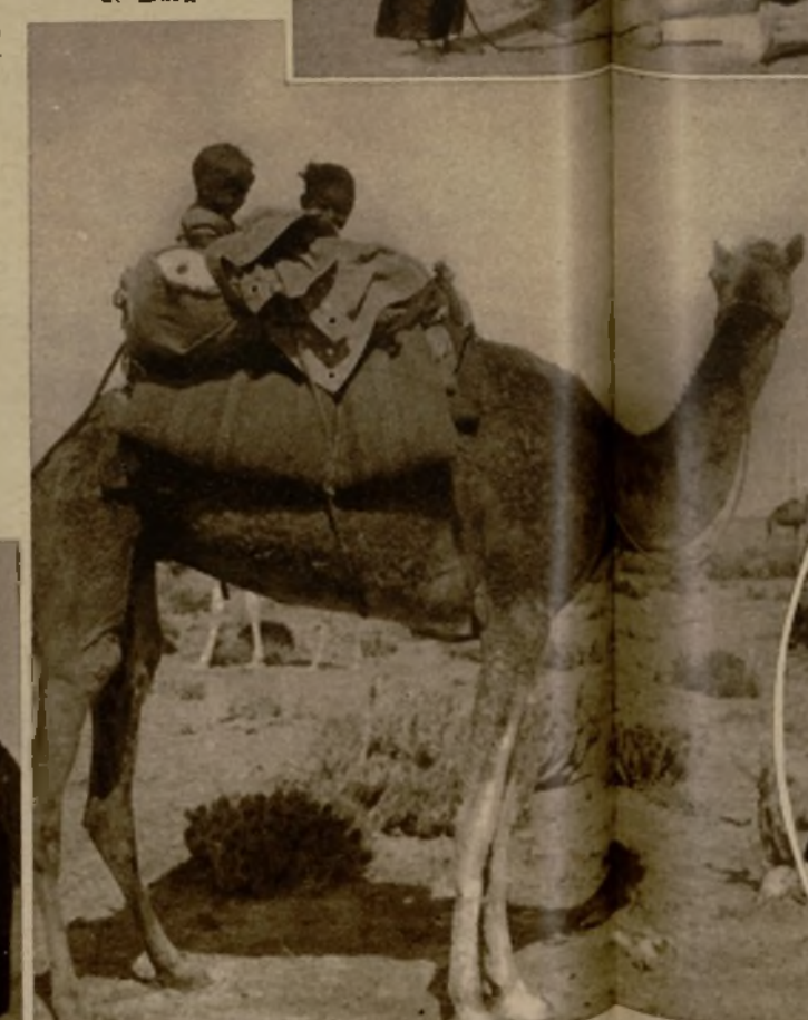
La comunicación de la columna internada con el fuerte de Cabo Juby se ha hecho por medio de palomas mensajeras. He aquí el camello portador de los palomeros

La caravana marcha a través del desierto en busca del oasis de Dora