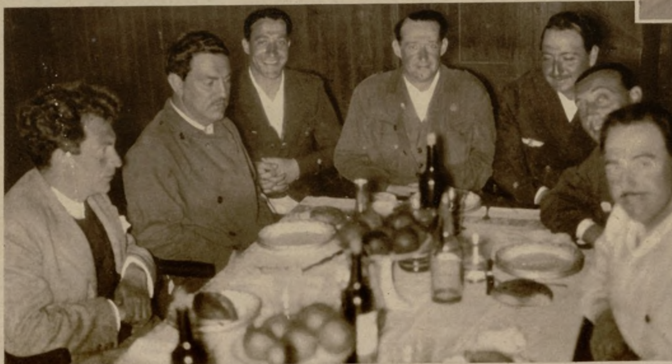
En la república de los aviadores de Cabo Juby. Después de las comidas morunas de Ifni, los pilotos de la escuadrilla de Getafe nos obsequian con la primera comida a la europea en su república de Cabo Juby.

"¿Sabe usted tirarse con paracaídas?", me pregunta el piloto del "Breguet", mientras volamos sobre el desierto...