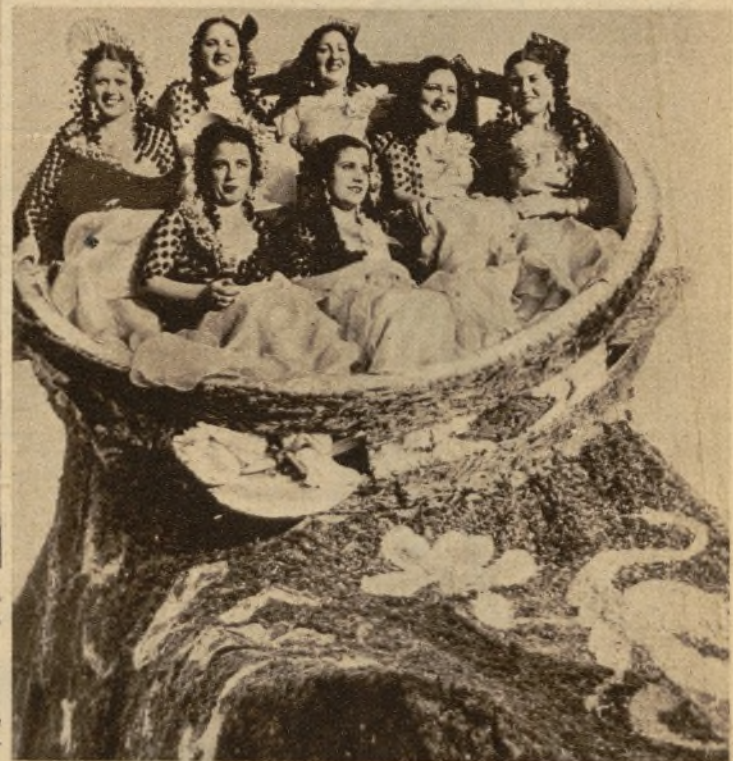
"Mantón y pandereta", otra de las bellas carrozas premiadas