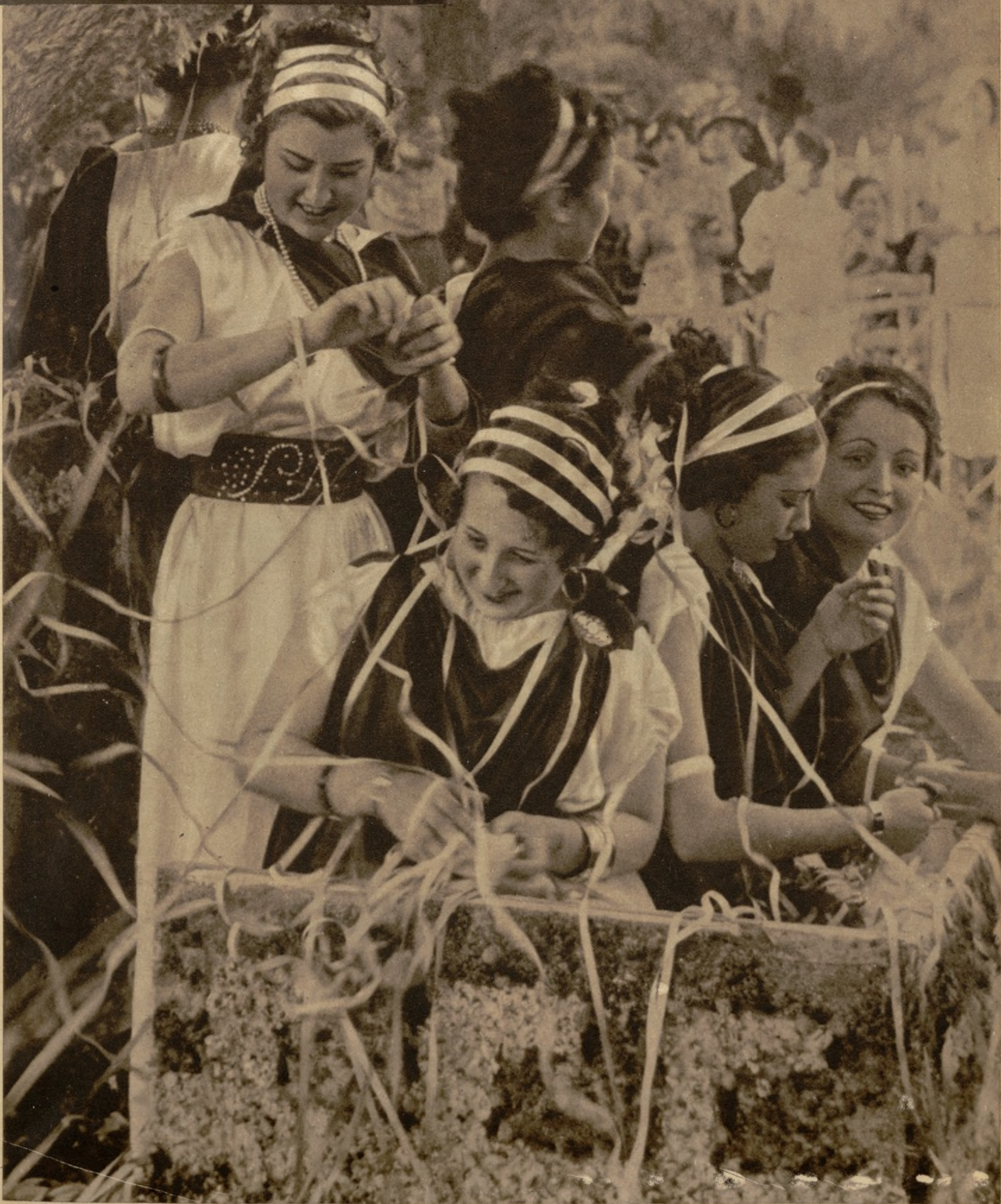
UN BRILLANTE DESFILE DE CARROZAS ARTISTICAS EN LAS FIESTAS DE GRANADA.—Uno de los más lucidos espectáculos del programa de las fiestas que se celebran en Granada ha sido el concurso de carrozas y batall de flores, gran desfile en el que han figurado numerosas y encantadoras señoritas que ocupaban los lujosos carruajes adornados. He aquí un ramillete de bellezas en la carroza "Marte", presentada por la guarnición de Granada, y que obtuvo el primer premio del Certamen