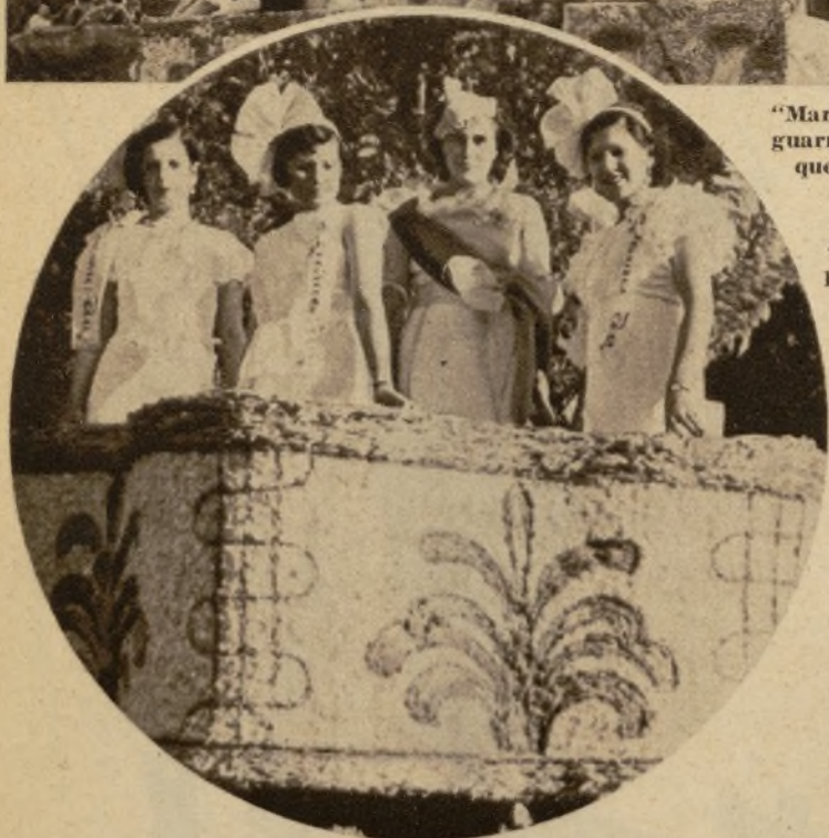
Encantadoras señoritas que ocupaban la carroza "Tintero de Talavera", de la Asociación de la Prensa, que obtuvo el premio de la Diputación provincial