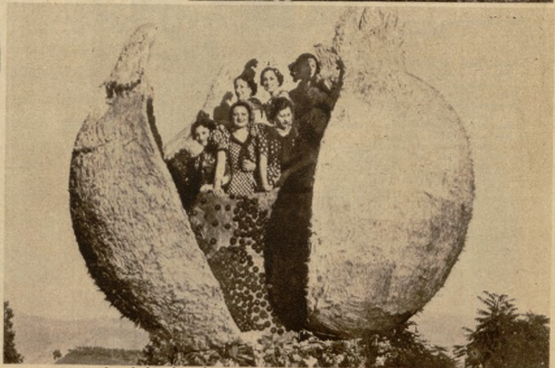
"Granada", carroza presentada por el Ayuntamiento, a la que se concedió el segundo premio, ofrecido por el presidente del Consejo