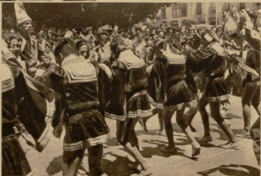
Los "danzantes" de Burgos, con los trajes de época, ejecutando sus típicos bailes ante el edificio del Ayuntamiento de la capital castellana