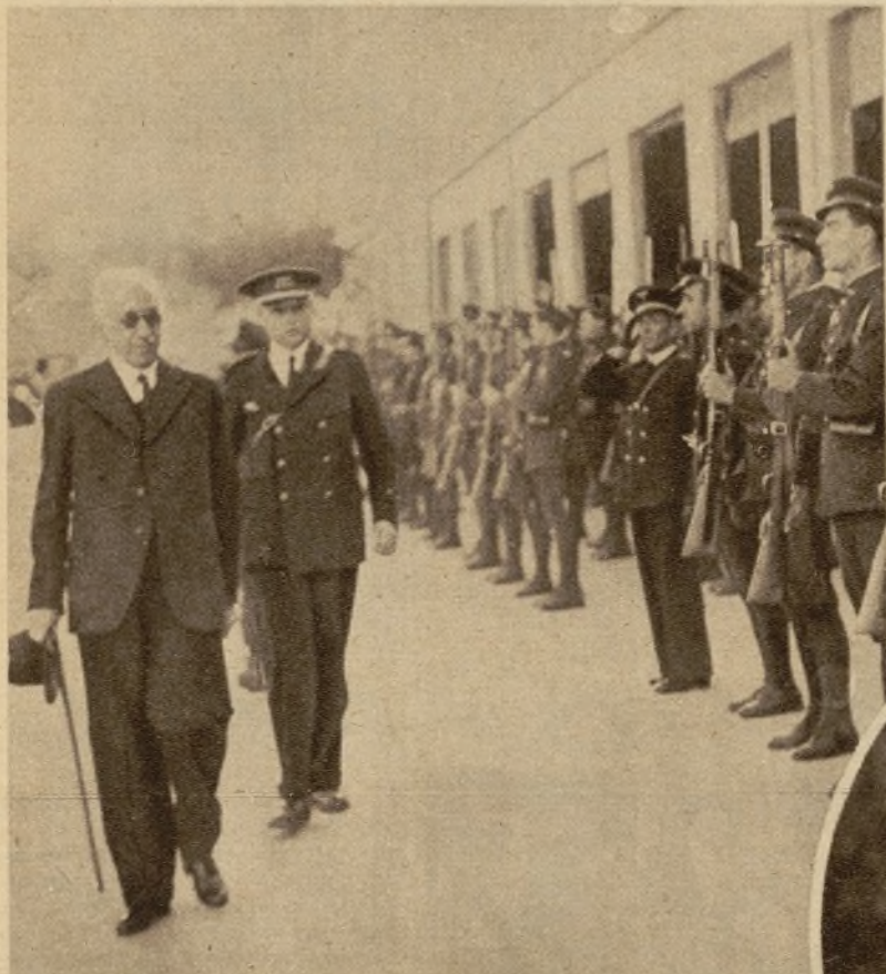
El Presidente de la República pasando revista a las fuerzas que le rindieron honores a su llegada al aeródromo