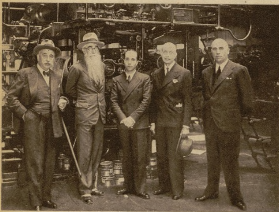
El insigne escritor don Ramón del Valle-Inclán durante la visita que hizo a los talleres del popular diario "El Faro de Vigo", acompañado del director del mismo y otras personalidades