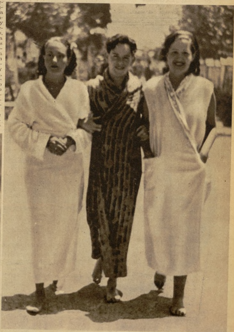
Hasta esta pequeña está comprendida en la nueva disposición

moderno, del que se encapricharán muchas clientas.