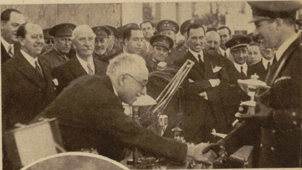
El señor Alcalá Zamora haciendo entrega de los premios a los pilotos de la escuadrilla vencedora en el concurso de escuadrillas militares