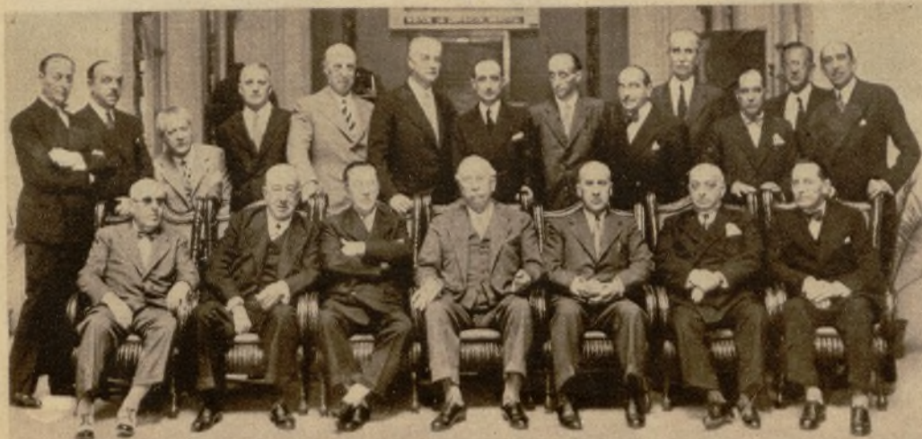
El jefe del Gobierno con los concurrentes al banquete conmemorativo del XL aniversario de la constitución del Cuerpo de Ingenieros Mecánicos de los Ferrocarriles en Obras Públicas