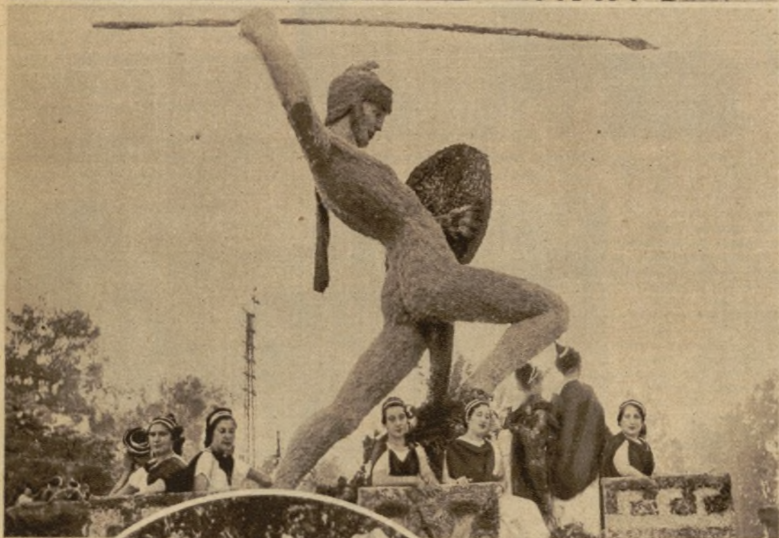
"Marte", carroza presentada por la guarnición militar de Granada y a la que se concedió el primer premio