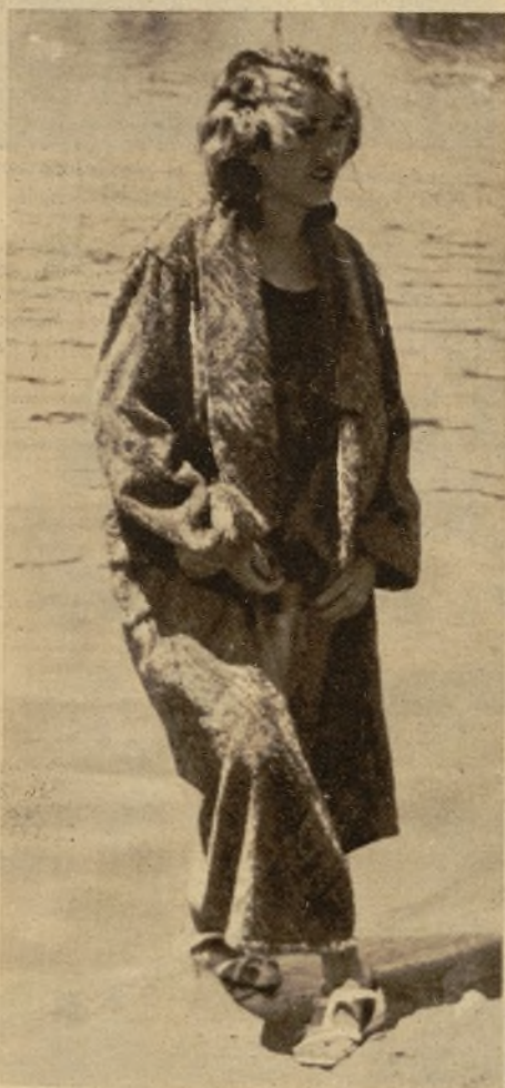
Una chica que se somete a los reglamentos

posición tan comentada, hemos visitado la playa y demás piscinas de Madrid.