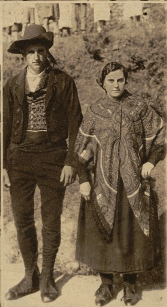
Una pareja de novios, con los atavíos típicos, que figuró en la comitiva de las fiestas de Ceánuri (Vizcaya)