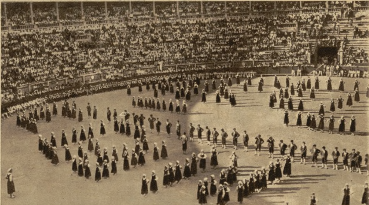
En el pueblo de Ceánuri (Vizcaya) se han celebrado vistosos festejos con motivo de celebrar sus primeras misas seis nuevos sacerdotes hijos del pueblo. En la foto, aspecto que ofrecía el ruedo de la Plaza de Toros de Pamplona durante la exhibición de bailes vascos, celebrada con motivo del "Día de la Patria". A la izquierda, pastores de Gorbea que ejecutaron típicas danzas al son de los cuernos