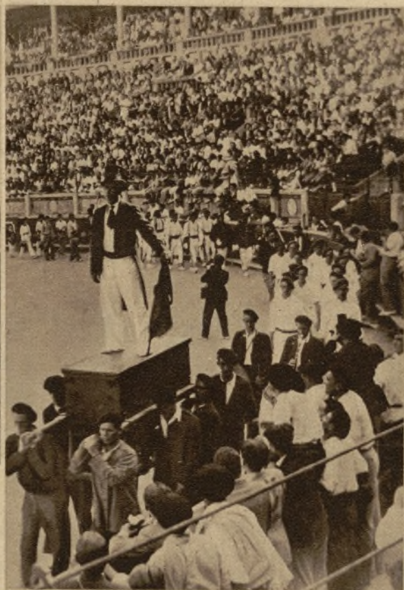
En la fiesta del "Día de la Patria", celebrada en la plaza de toros de Pamplona: "Kaxarranka", baile antiguo de los pescadores de Lequeitio