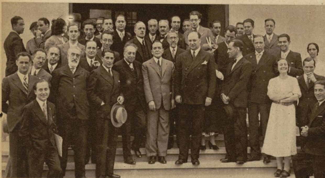
Autoridades santanderinas y profesores de la Universidad Internacional de Verano, de la capital montañesa, con los invitados al acto inaugural de dicho Centro celebrado con gran solemnidad