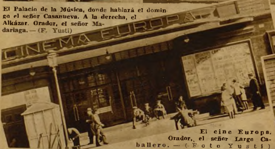
El cine Europa. Orador, el señor Largo Caballero.