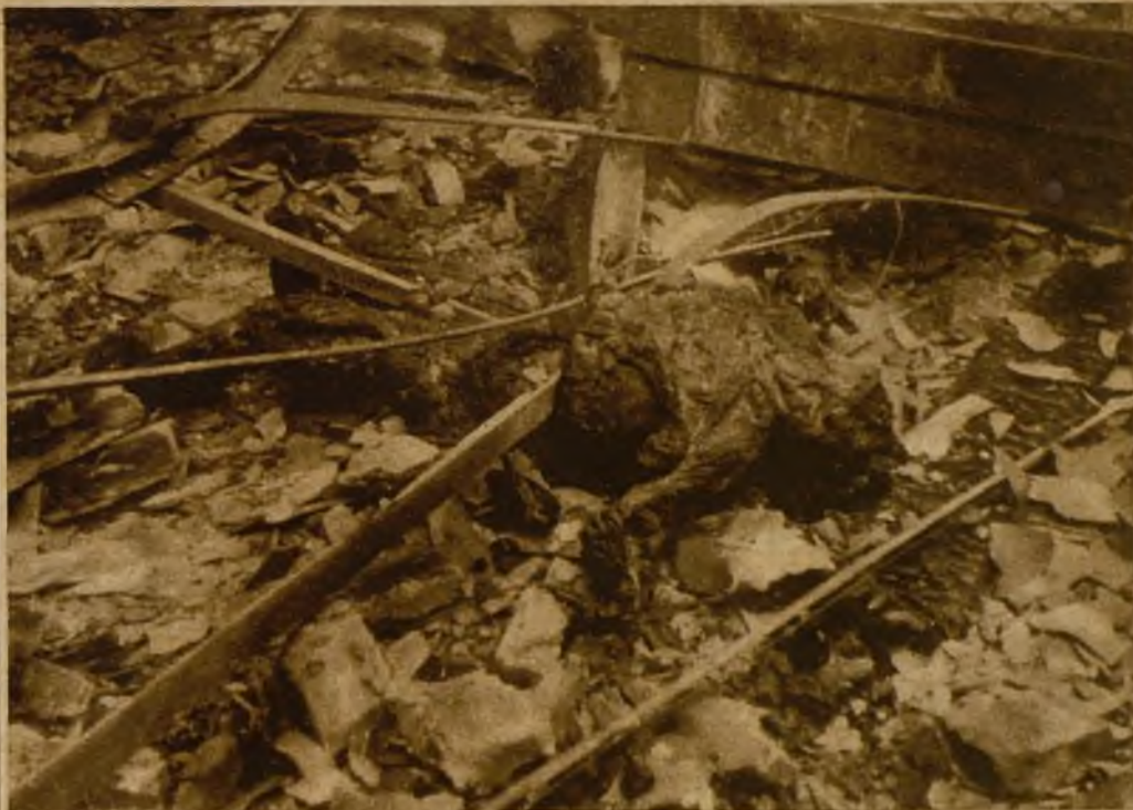
El cadáver carbonizado del desdichado obrero que pereció en el incendio de los estudios Orphea, en el lugar del siniestro

En el pabellón de la Exposición de Barcelona donde se hallaban instalados los estudios de la Empresa cinematográfica Orphea se declaró un violentísimo incendio, que destruyó el edificio. Una vista del interior de los estudios