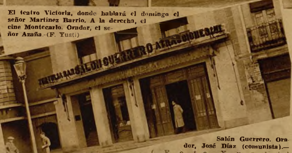
Salón Guerrero. Orador, José Díaz (comunista).