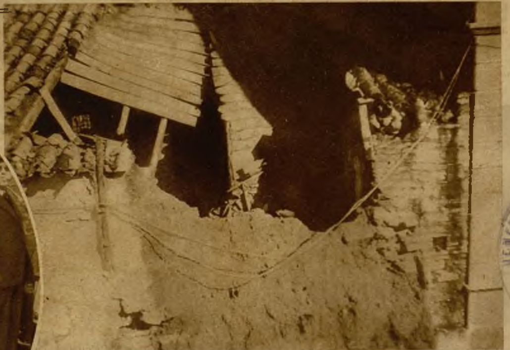
En Arjona (Jaén) se hundió un establo, cuyos muros estaban resentidos por las persistentes lluvias, quedando en el estado que aparece en la foto. También se han hundido varias corralizas