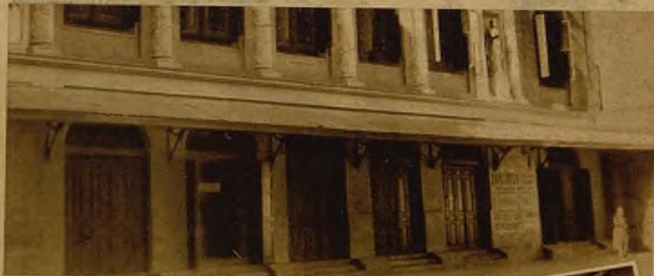
El teatro de la Zarzuela, donde hablará el domingo el señor Marín Lázaro.