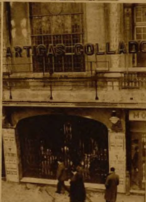
El teatro Victoria, donde hablará el domingo el señor Martínez Barrio. A la derecha, el cine Montecarlo. Orador, el señor Azaña.