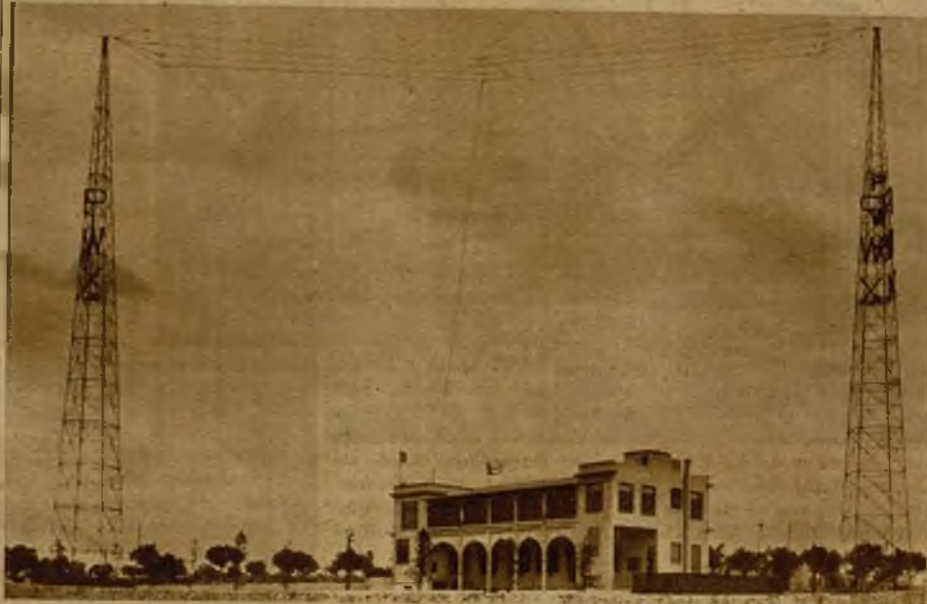
La principal emisora de radiodifusión cubana, instalada en las afueras de La Habana