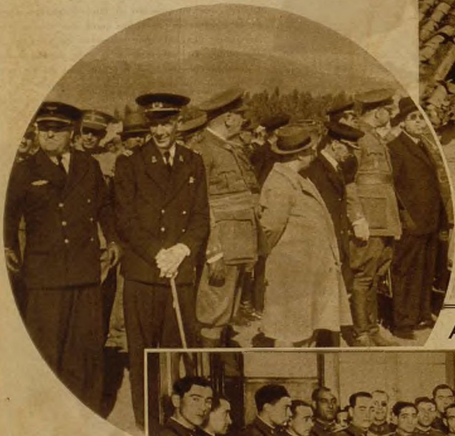
En el campo de aviación de Taulma, en la zona de Melilla, ha tenido lugar una brillante revista militar, a la que asistieron el general don Fernando Capaz y el jefe superior de las fuerzas de Marruecos, don Emilio Mola. Un grupo de jefes presenciando el desfile