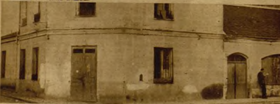
El Salón España. Orador, Angel Pestaña