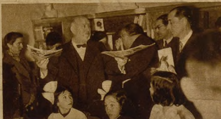
El ilustre jurisconsulto don Angel Ossorio Gallardo, presidente de la Asociación Auxiliar del Niño, entregando a los pequeños números de AHORA en los que se publicó un brillante reportaje de nuestra ilustre colaboradora Magda Donato acerca de aquella benemérita Institución