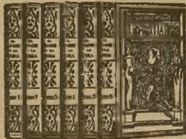
18 1/2 X 25 centímetros

Retirada la autorización que teníamos de la Casa Manóci para reimprimir la edición económica que anunciamos, no se reimprimirá una vez agotados los pocos ejemplares que quedan. Sirva eso de aviso para que los que se propongan adquirirla lo hagan cuanto antes para no perder esta oportunidad única.