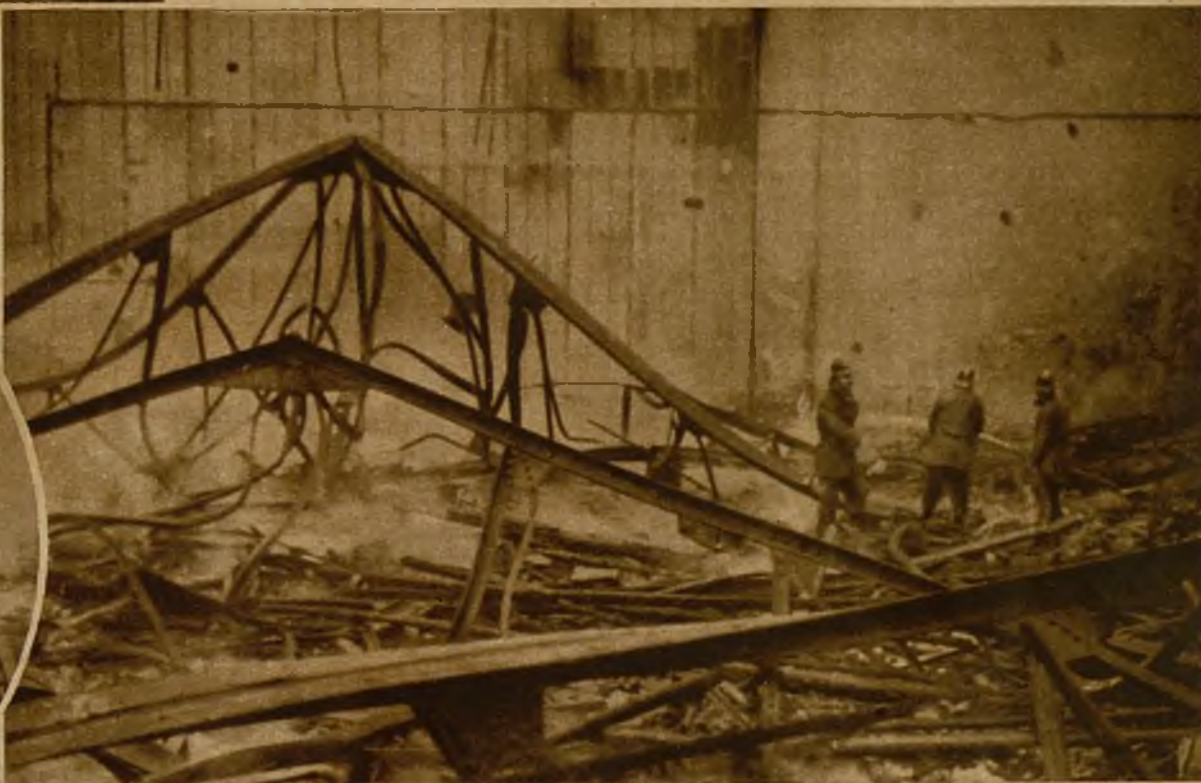
Los bomberos extinguiendo los últimos focos del incendio. Las pérdidas alcanzan una elevada cifra