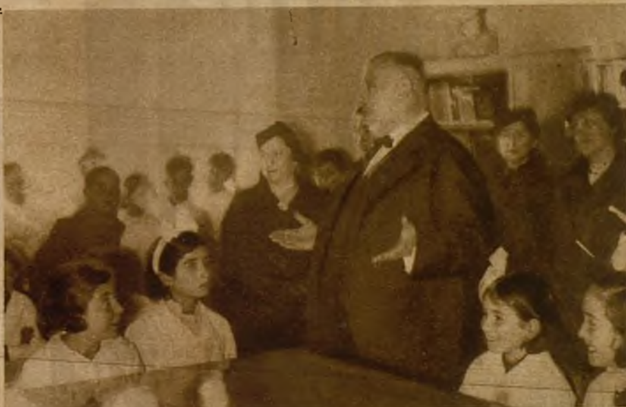
El señor Ossorio Gallardo dirigiendo la palabra a los niños del Grupo escolar "Lope de Vega", en el acto inaugural de su biblioteca, fundada por la Asociación Auxiliar del Niño, de la que es presidente el insigne escritor y abogado