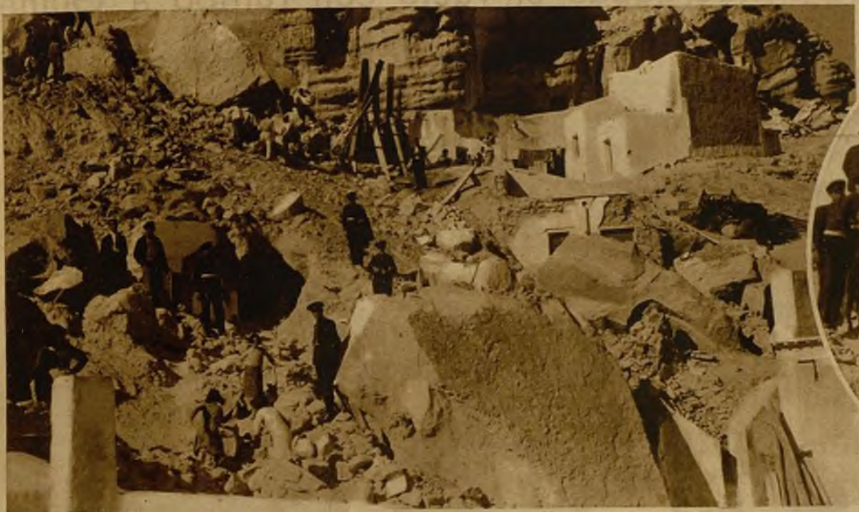
Lugar del cerro llamado de Las Mellizas, en Almería, donde, a consecuencia de la explosión de un barreno, enormes rocas cayeron sobre unas viviendas de modestas familias. Por fortuna, no han ocurrido desgracias personales

En Almería, a consecuencia de la explosión de un barreno, caen rocas de varias toneladas sobre un grupo de viviendas