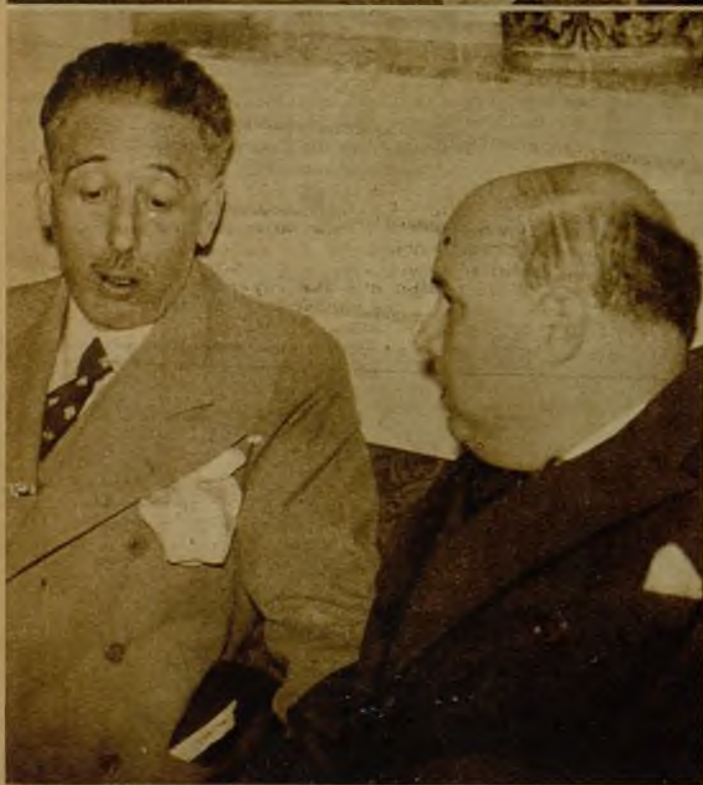
Los consejeros de la Generalidad de Cataluña, a poco de su llegada a Madrid, celebraron un cambio de impresiones en el hotel en que se ha hospedado el presidente, señor Companys. Los reunidos, durante su conferencia