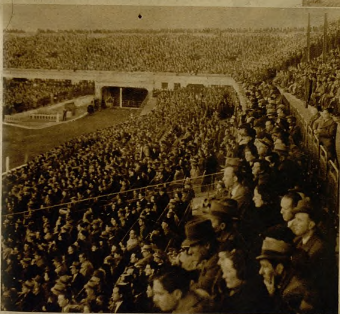
Vista de un sector del Stadium de Montjuich, en el que se congregaron sesenta mil espectadores para presenciar el encuentro internacional