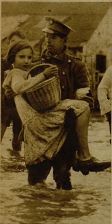
La Cruz Roja sevillana ha contribuido eficaz y generosamente al salvamento de los vecinos de los barrios inundados.

Diríase que el año 1936 ha cambiado a Madrid de situación geográfica; aquellas afirmaciones de los libros, donde se nos dice que disfrutamos de un clima en general bueno, seco y saludable, pierden veracidad si nos asomamos al balcón con ánimos de ver el cielo característico de Castilla; o si ponemos el pie en la calle. Olvidando las palabras de la