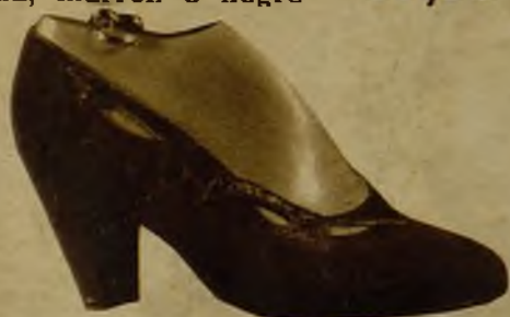
Ante y serpiente legítima, negro, 34,95

Lo mismo que en Madrid, puede usted calzarse con los mejores zapatos del mundo enviando sus medidas y escogiendo entre éstos sus modelos