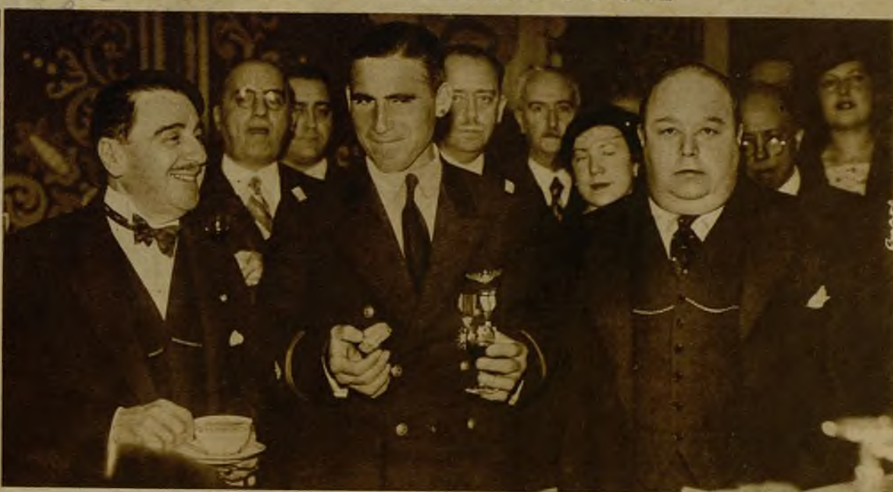
En el Ayuntamiento se celebró una recepción en honor del aviador cubano Menéndez Peláez. En la fotografía, el heroico piloto con el encargado de Negocios de su país, señor Pichardo, y el alcalde, don Pedro Rico