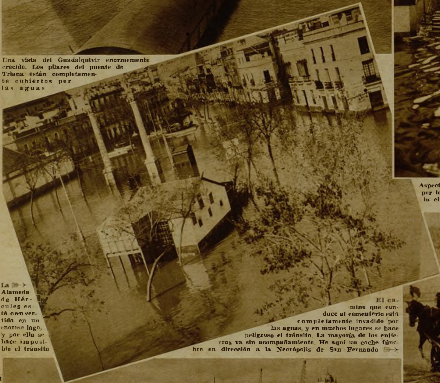
La Alameda de Hércules está convertida en un enorme lago, y por ella se hace imposible el tránsito