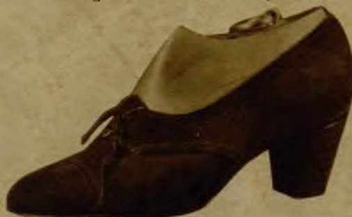
Tarde en ante negro o marrón. Tafiletes negro, marrón o azul, 31,95