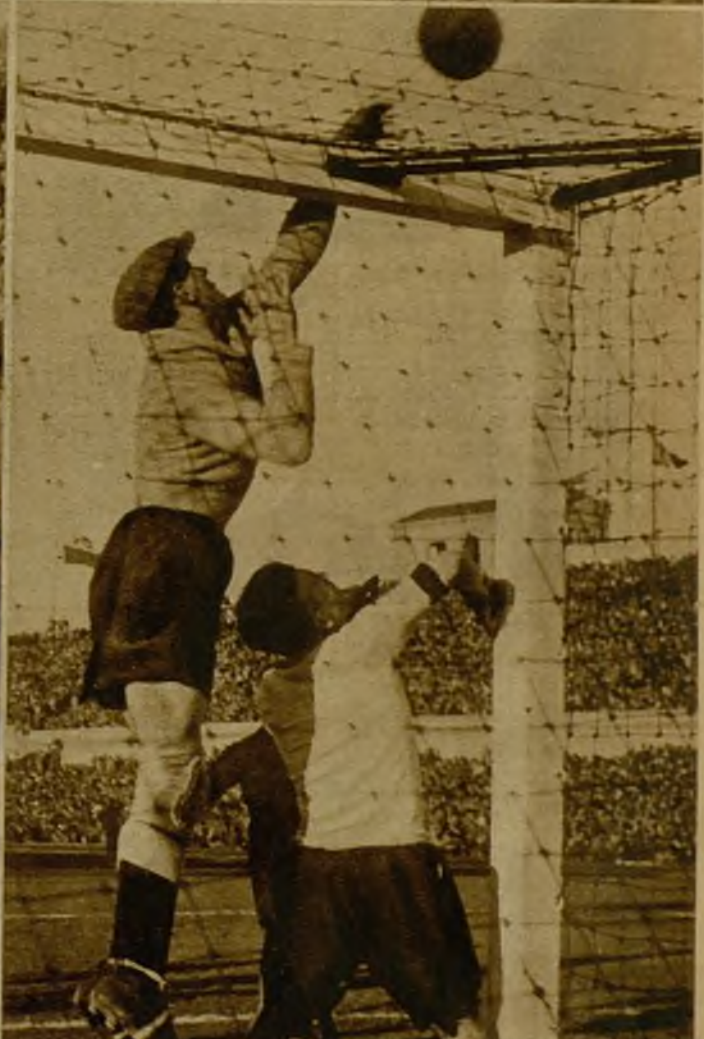
El portero alemán, que tuvo una actuación acertadísima, desvia a "corner" un tiro peligroso