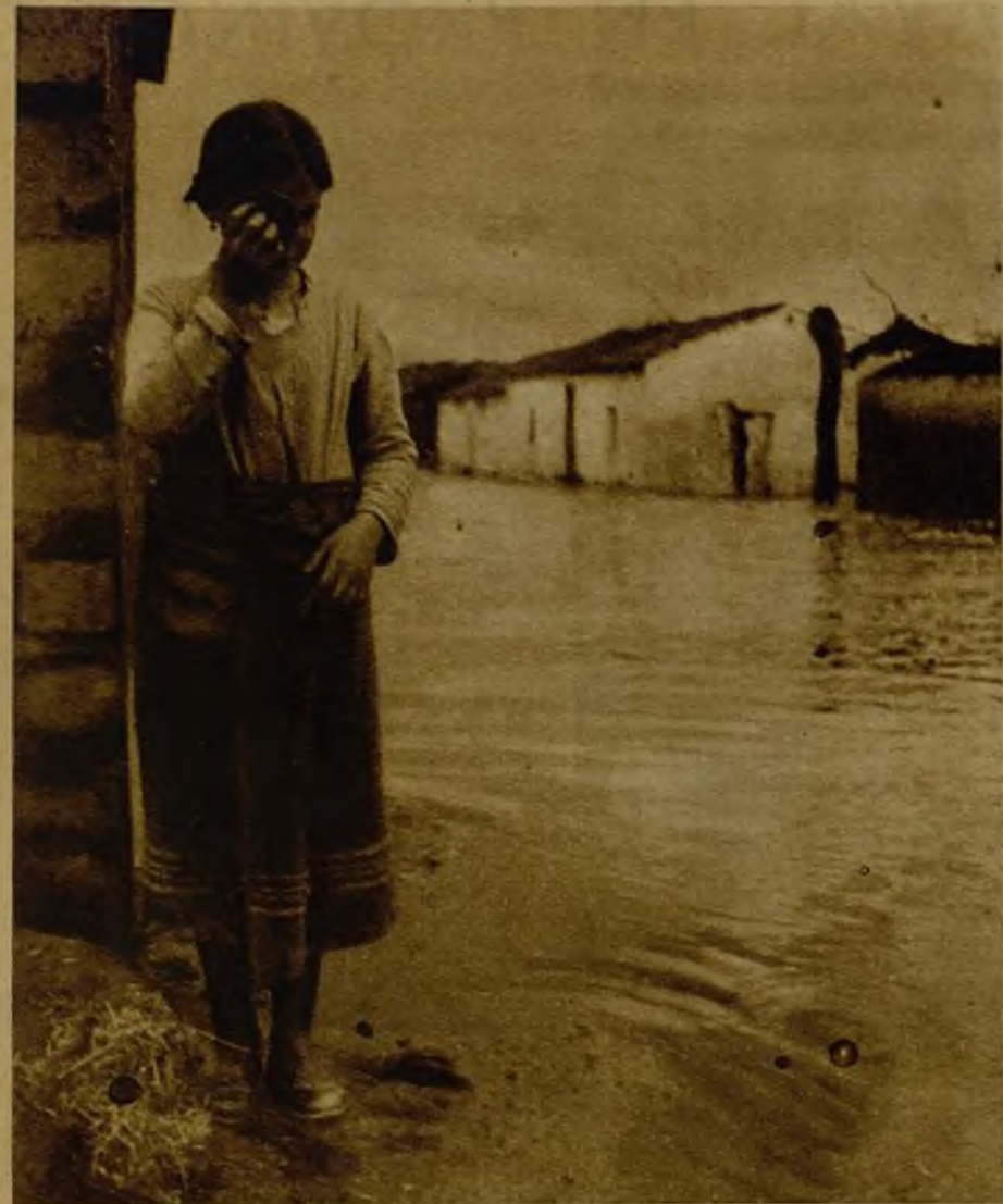
Desolación y ruina. Las aguas cercan los hogares, que los vecinos abandonan sin esperanza de hallar otro refugio. A la derecha, casas de las afueras de Badajoz, invadidas hace muchos días por el caudal del río.