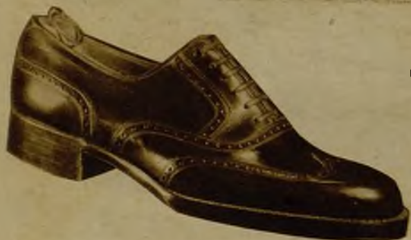
Boxcalf, color o negro, doble suela, 33,95