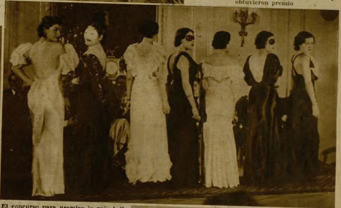
El concurso para premiar la más bella espalda femenina, celebrado en el Ritz, de Barcelona, con motivo de un baile de Carnaval, obtuvo un gran éxito y acudió a la fiesta público numerosísimo. He aquí a las concursantes desfilando ante el Jurado. En primer lugar, a la izquierda, la señorita premiada