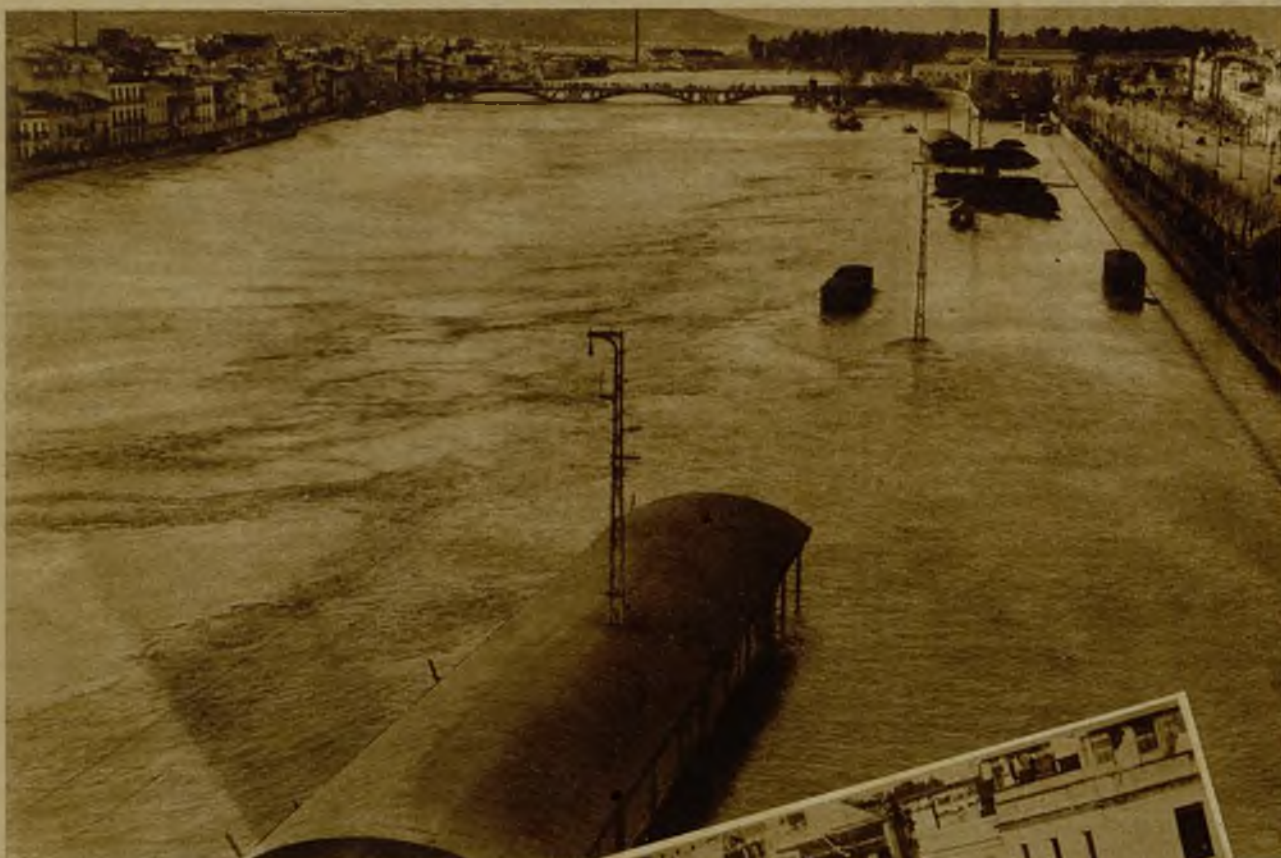
Una vista del Guadalquivir enormemente crecido. Los plares del puente de Triana están completamente cubiertos por las aguas