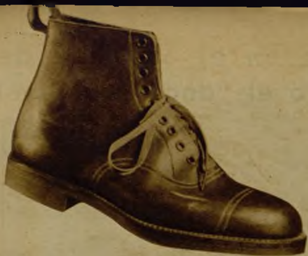
Piel hierro, color o negro, suela goma, 29,95