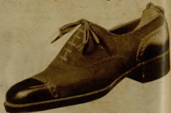
Ante y rusia, tipo inglés, doble suela, 38,95