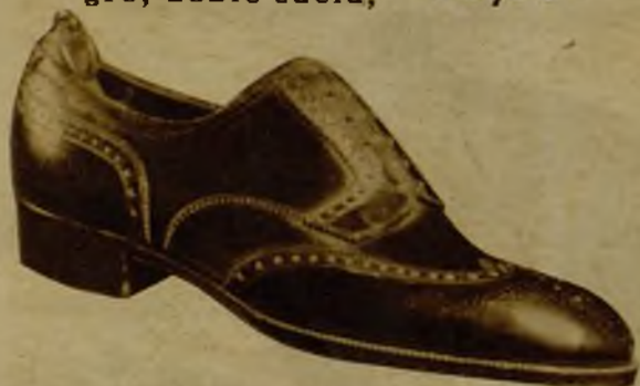
Freudenberg, color o negro, 34,95