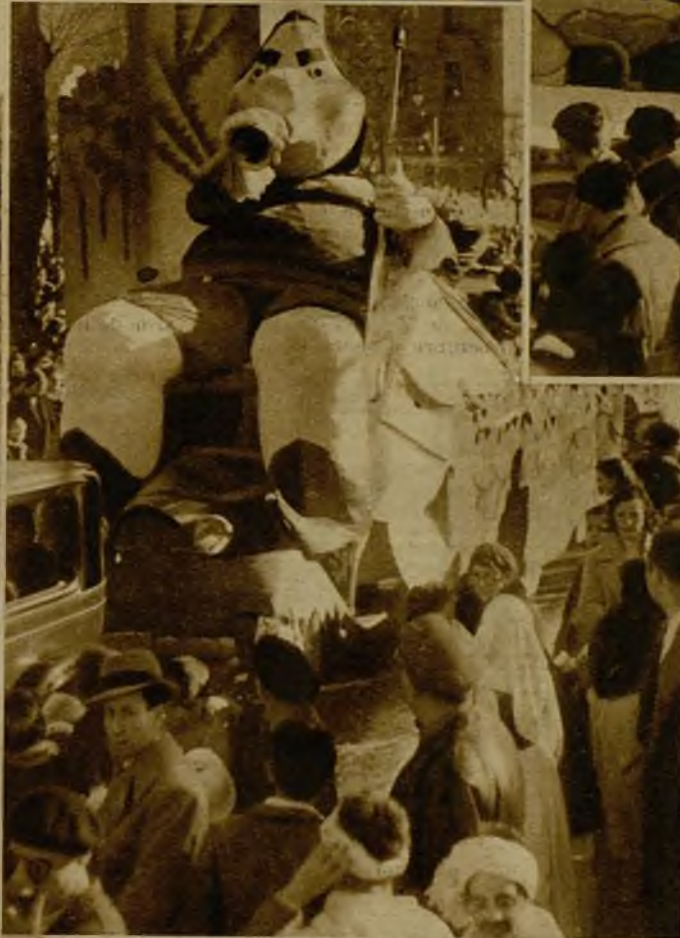
Otra de las carrozas que, ocupadas por bellas señoritas, desfilaron por el paseo de la Castellana