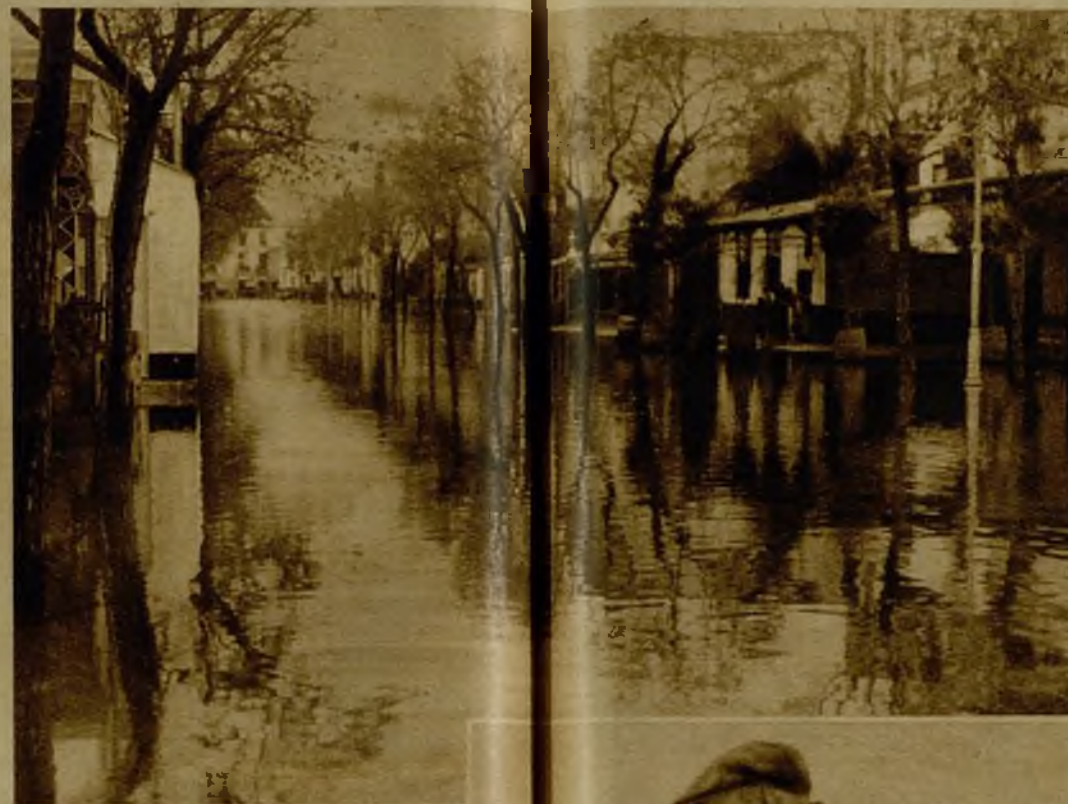
En Sevilla, la inundación reviste caracteres trágicos. Ciegos y ciegos de familias han quedado sin albergue y han perdido sus modestos ajuars, que se llevaron las aguas. He aquí el aspecto que ofrece la famosa Alameda de Hércules.

En el mapa meteorológico que tenemos a la vista puede verse—si nos lo dice un técnico antes, claro—el conjunto de círculos que señala la letra B. Ellos son los causantes de que nos mojemos.