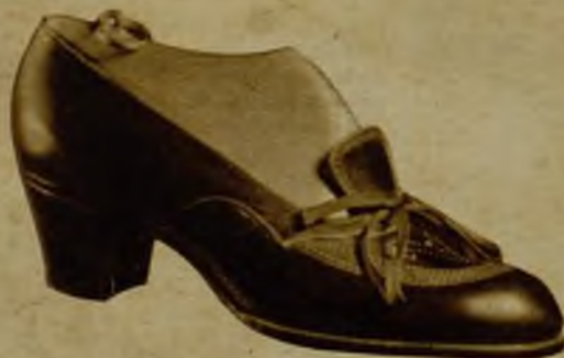
Sportivo, en negro o color 38,95