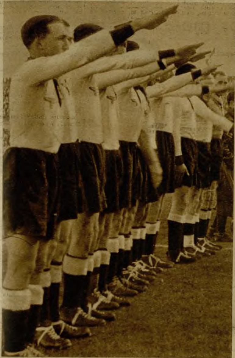
Los jugadores alemanes saludan al salir al campo a la manera nazi