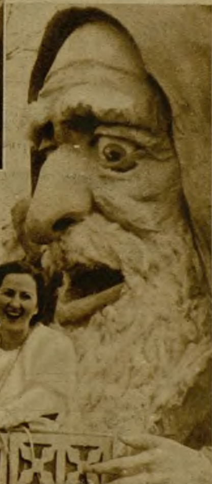
"El tesoro del gnomo" es este valiosísimo ramillete de encantadoras muchachas que en su cofre lleva el cabezudo enanillo