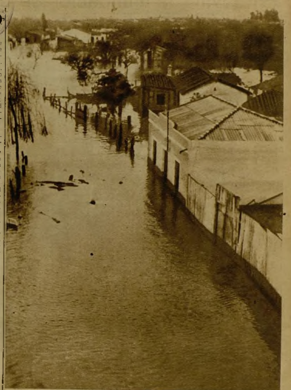
En una larga extensión, el agua adquiere gran altura. Cada casa es un pequeño islote inhabitable.

—Las causas son varias. Una de ellas, el agua que cae sobre su caudal. Aproximadamente han caído sobre el Duero y el Guadalquivir unos sesenta milime-