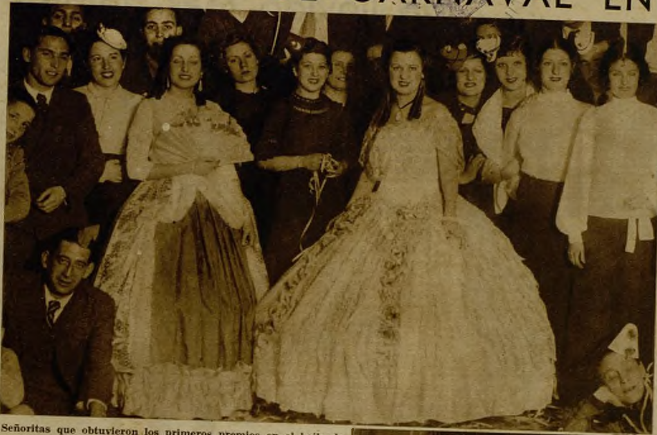
Señoritas que obtuvieron los primeros premios en el baile de trajes celebrado en el Círculo de Artistas, de Valencia