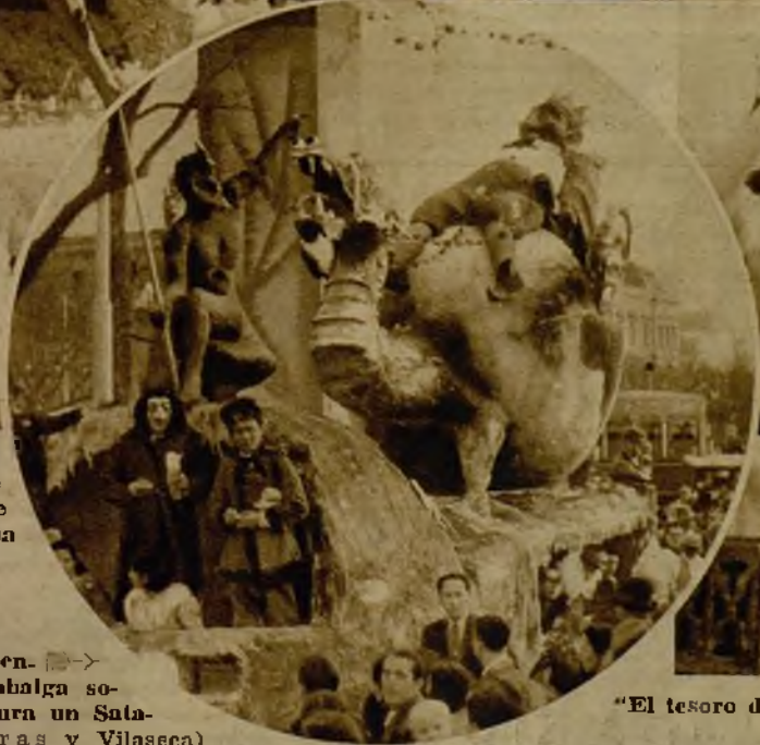
Vista de una de las artísticas carrozas del Ayuntamiento de Madrid, que ganaron la atención en el brillante desfile del domingo en la Castellana