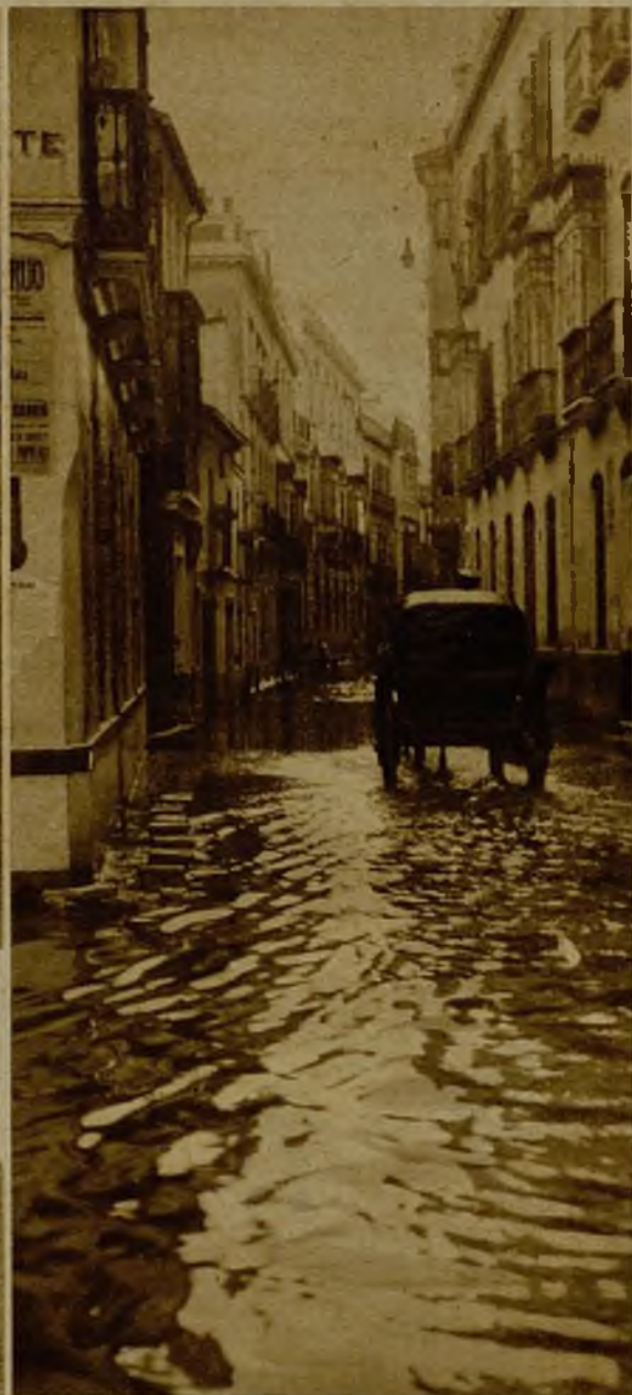
Aspecto de la calle de Trajana, a su entrada por la plaza del Duque, en pleno centro de la ciudad, que lleva varios días inundada