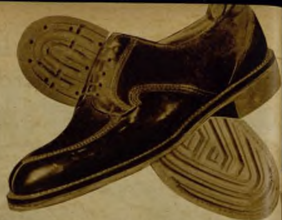
Suela goma antideslizante, color o negro, 37,95