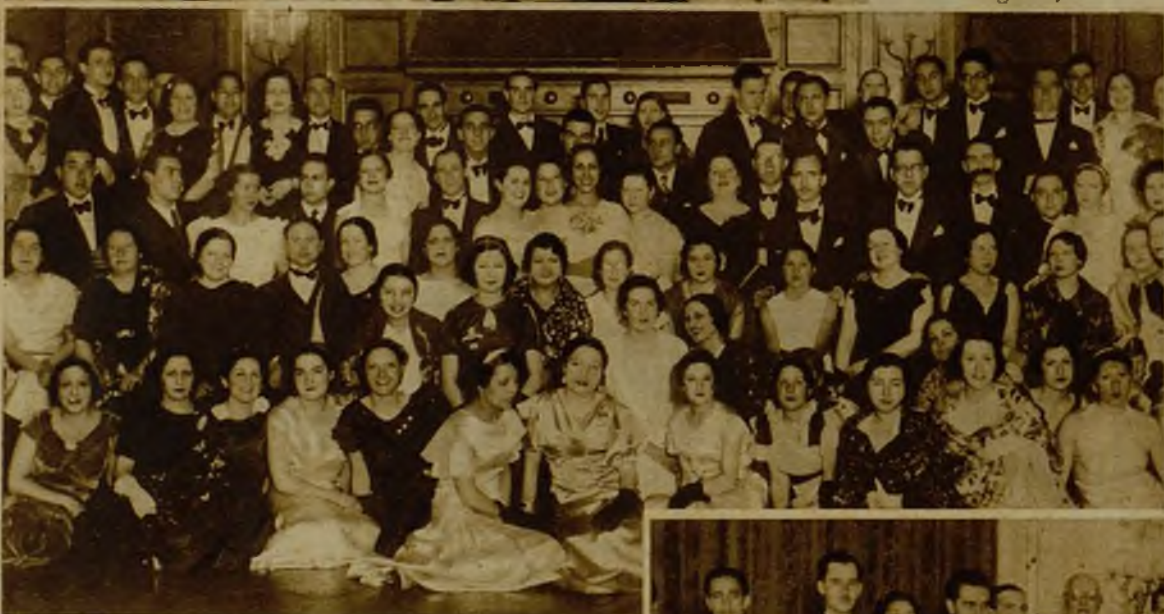
Un numeroso grupo de asistentes al lucido baile de Carnaval que, con gran éxito económico, se celebró a beneficio de los huérfanos de sastres