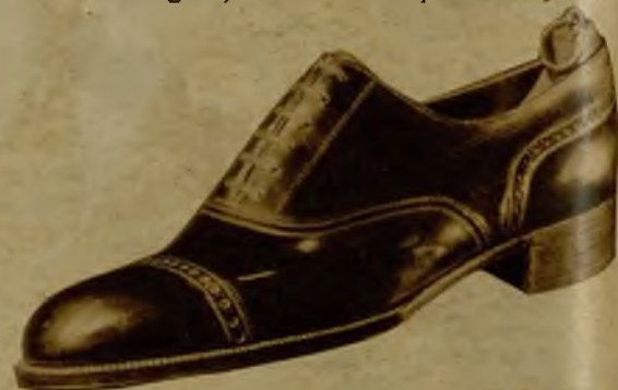
Freudenberg, color o negro, 32,95