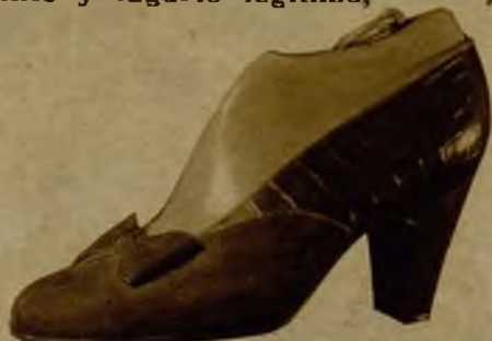
Ante y croco, marrón o negro, 38,95

¿ G R A T I S . . . . . ? SI EL DIA DE LA COMPRA ES EL DIA FAVORECIDO