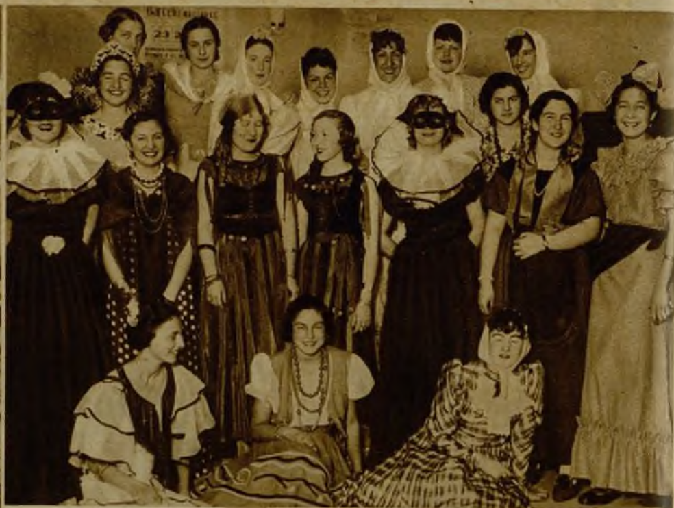
Bellas señoritas que fueron premiadas en el baile de disfraces celebrado en el Cine Barceló, organizado por los antiguos alumnos del Instituto Escuela