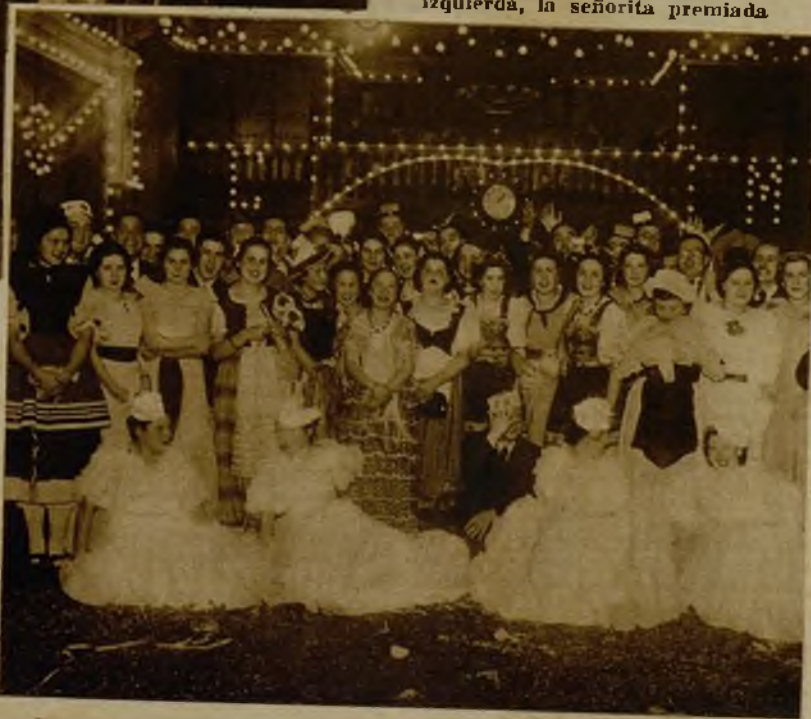
Grupo de bellas señoritas que, luciendo artísticos disfraces, han asistido a un lucido baile de Carnaval en el Círculo de la Unión Mercantil, de Vigo