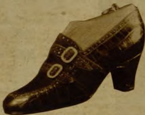
Ante y croco, 34,95

Lo mismo que en Madrid, puede usted calzarse con los mejores zapatos del mundo enviando sus medidas y escogiendo entre éstos sus modelos