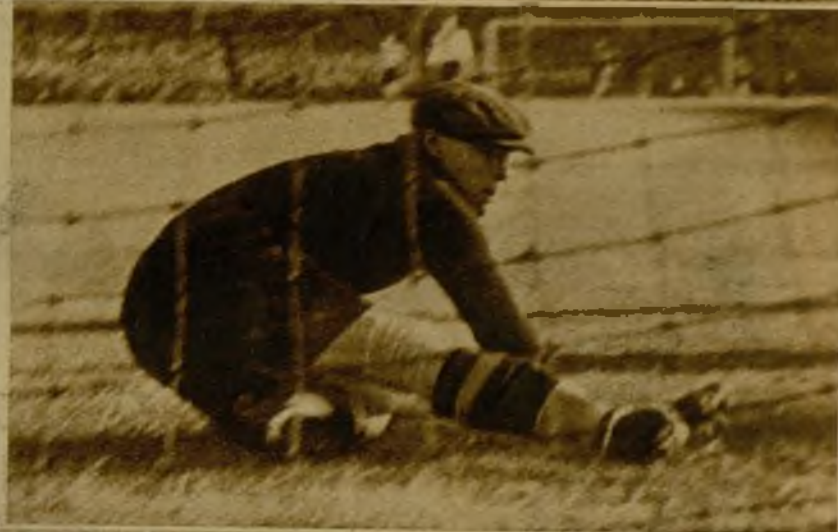
Zanora, después del primer tanto de los alemanes →→

Nuevamente ha sido vencido en su propio terreno nuestro equipo nacional. Esta vez el fracaso más rotundo ha sido de la delantera, línea a la que se creía la más eficiente. En la fotografía, el guardameta alemán Jacob, momentos después de ver traspasada su meta por el único "goal" español