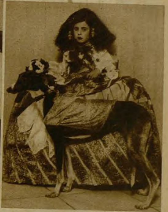
Organizado por la Prensa valenciana se ha celebrado un animadísimo baile infantil y concurso de disfraces, en el que tomaron parte encantadores chiquitines, caprichosa y artísticamente ataviados. He aquí una de las mascaritas que obtuvieron premio