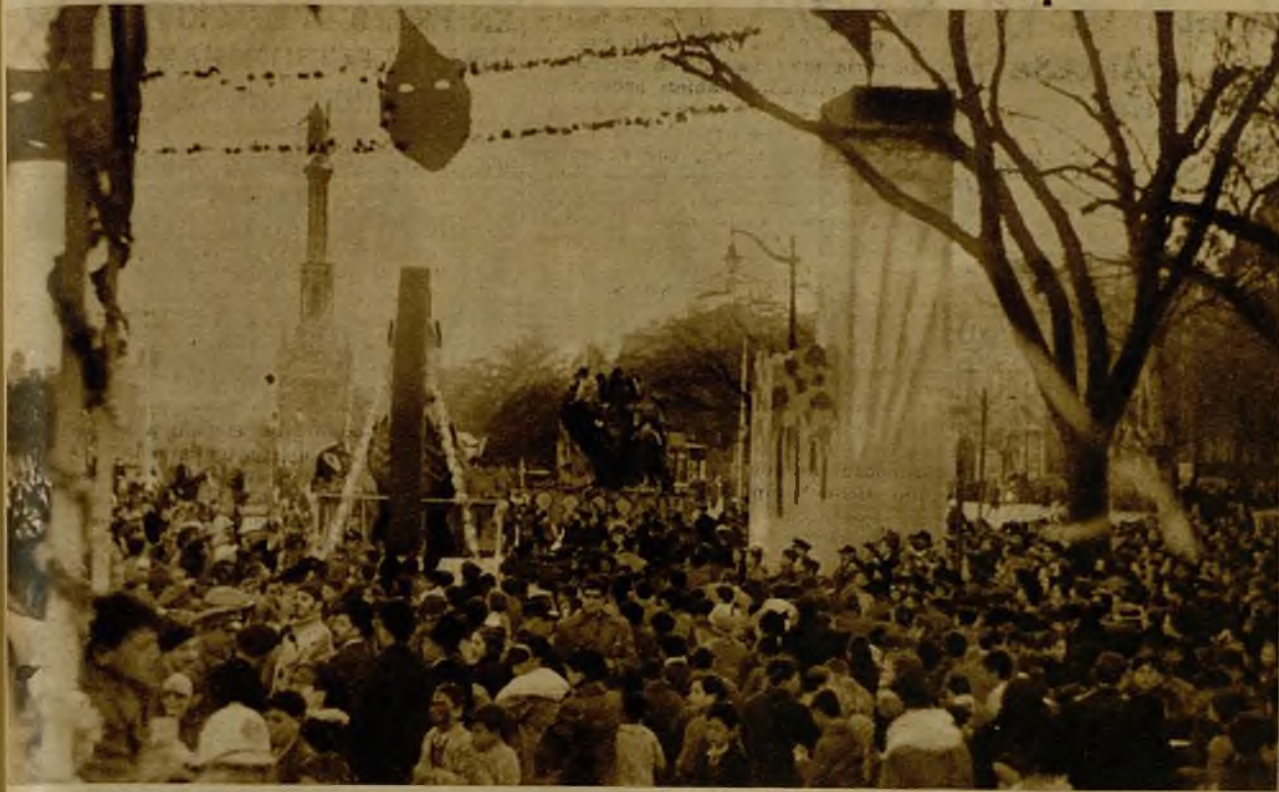
Una muestra del aspecto que ofrecía el paseo de la Castellana durante la tarde de la primera jornada de Carnaval