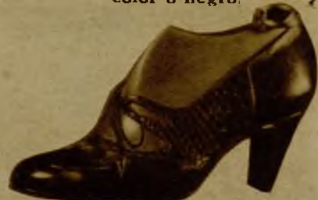
Charol y lagarto legítimo. Ante y lagarto legítimo, 38,95