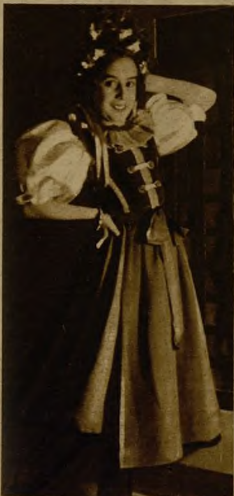
En el teatro Avenida, de Valladolid, tuvo lugar un brillante baile infantil, en el que figuraban centenares de pequeños ataviados con caprichosos y artísticos disfraces. He aquí una linda y graciosa mascarita