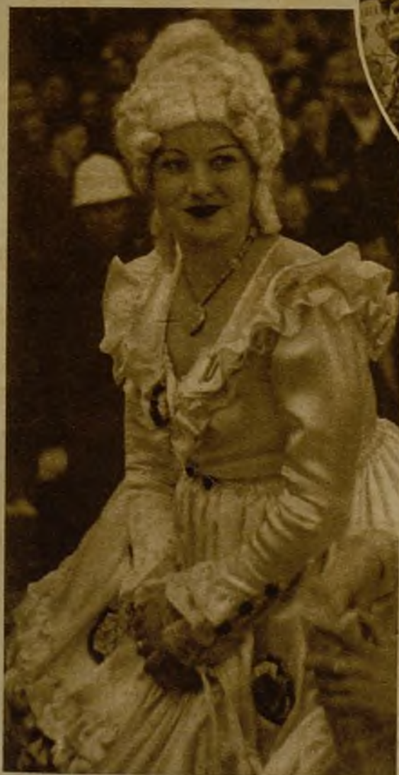
Una linda máscara que llamó justamente la atención en el desfile de la Castellana