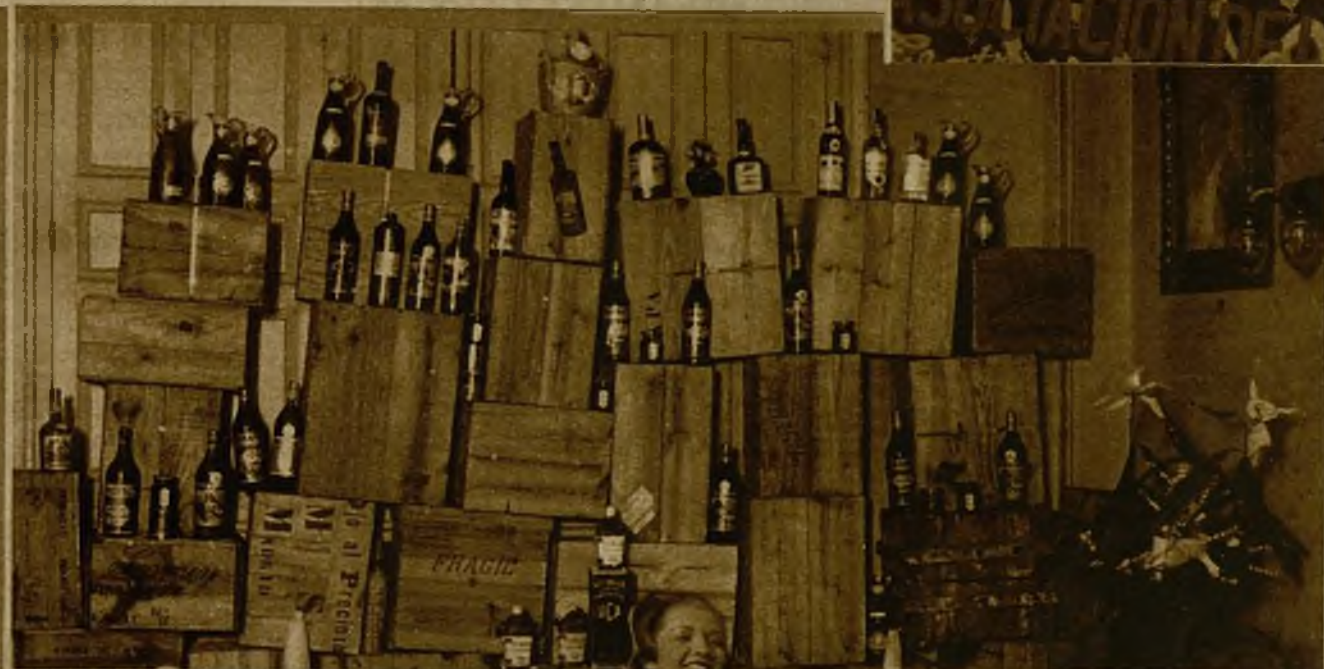
Parte de los vinos, aceites, embutidos y conservas que figuran como premios en la gran tómbola del baile de la Prensa. A la izquierda, elegante reloj de platino, con treinta brillantes y seis zafiros, marca Vulcain, tasado en 2.400 pesetas, regalo de las casas Vulcain y Coppel, Fuencarral, 5 y Mayor, 6, que se rifará como segundo premio en el baile de la Prensa