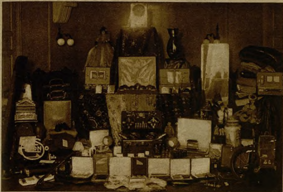
Parte de los numerosos premios que se rifarán gratuitamente en el hermoso baile de la Prensa, la fiesta más brillante de la semana de Carnaval