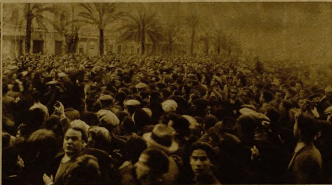
Un aspecto de la manifestación congregada ante el Ayuntamiento de Cádiz en espera de la llegada del alcalde y concejales de elección popular para tomar posesión de sus cargos.