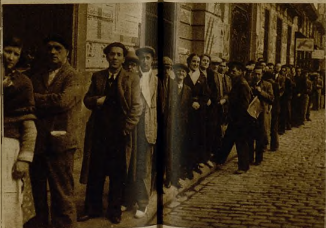
El Centro de Dependientes de Comercio, que bombardeado el 6 de octubre, convertido hoy en lugar de peregrinación de los catalanistas.

Es difícil preverlo, a juzgar sólo por la impresión que la gente del pueblo puede dar. Si algo cabe deducir por impresión, es el hecho de que no habrá grandes conmociones en la vida de Cataluña con el triunfo del Frente popular, como tampoco las hubiese habido de triun-