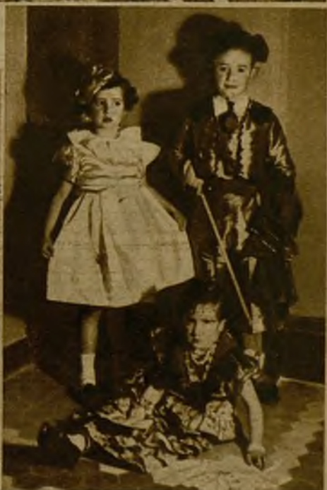
Un monísimo grupo de mascaritas que concurrieron al baile celebrado en el teatro Avenida, de Valladolid