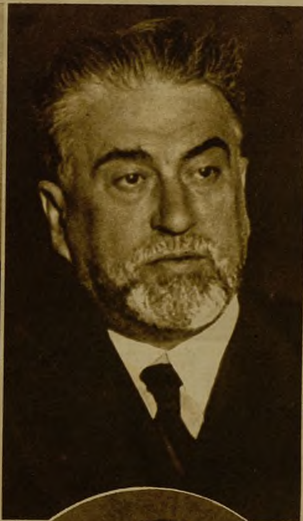
Don Francisco Barnés, nuevo presidente del Consejo de Estado