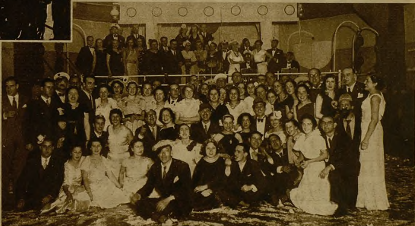
Grupo de concurrentes a un animadísimo baile de Carnaval, celebrado en la Sociedad El Sitio, de Bilbao