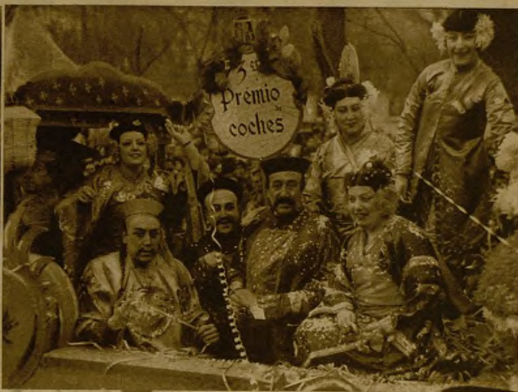
He aquí el coche adornado que obtuvo el tercer premio en el concurso del Ayuntamiento