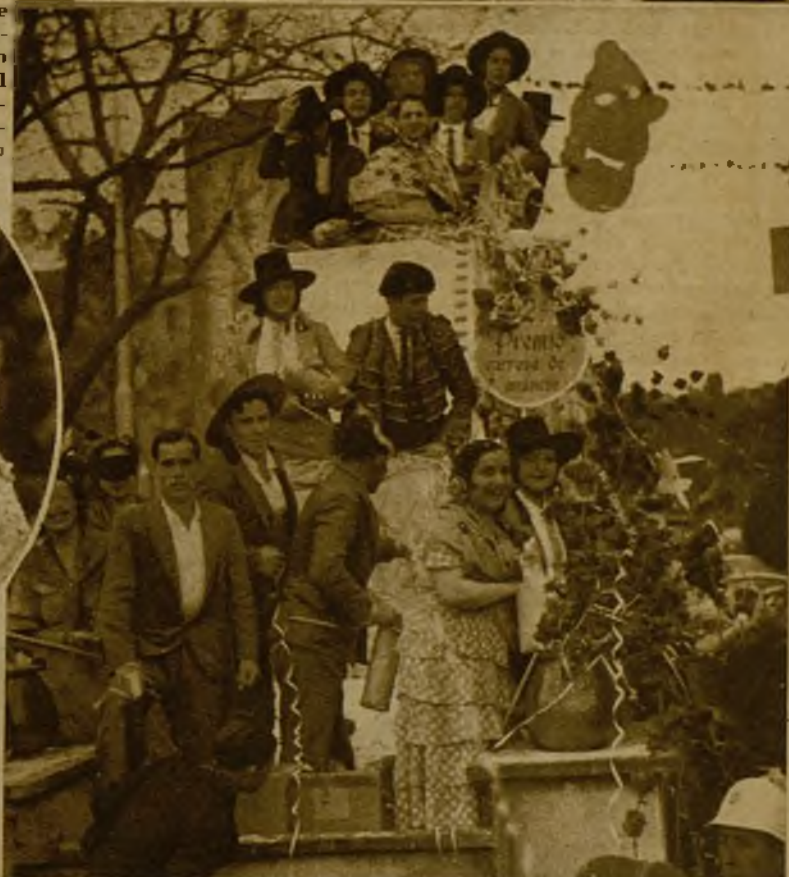
El segundo premio en el concurso de carrozas de anuncio