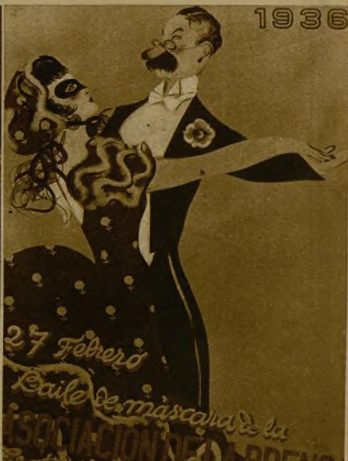
El cartel anunciador del gran baile de la Prensa, obra notabilísima del gran dibujante D'Hoy