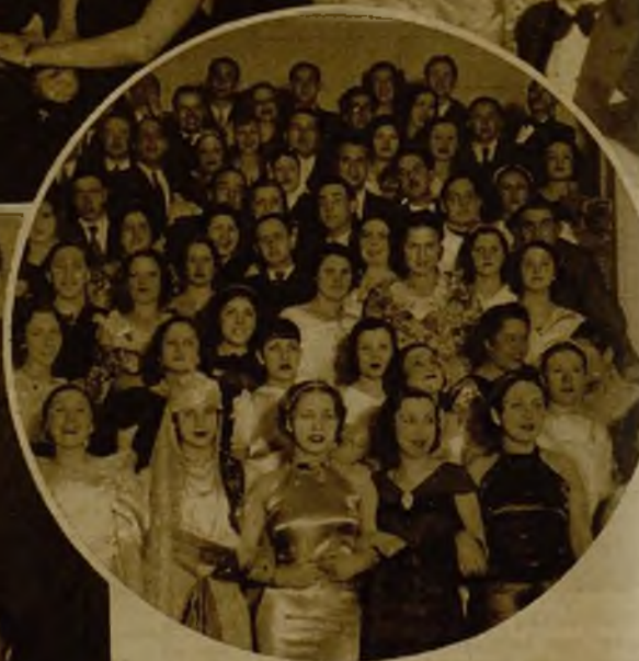
La Sociedad de Aparejadores organizó también un baile de Carnaval que estuvo concurridísimo. He aquí un grupo de encantadoras señoritas asistentes al mismo y de "galanes" que las hicieron cortejo