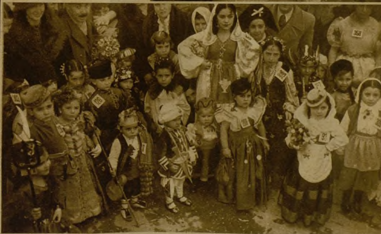
Niños disfrazados esperando el momento de desfilar ante el Jurado del concurso