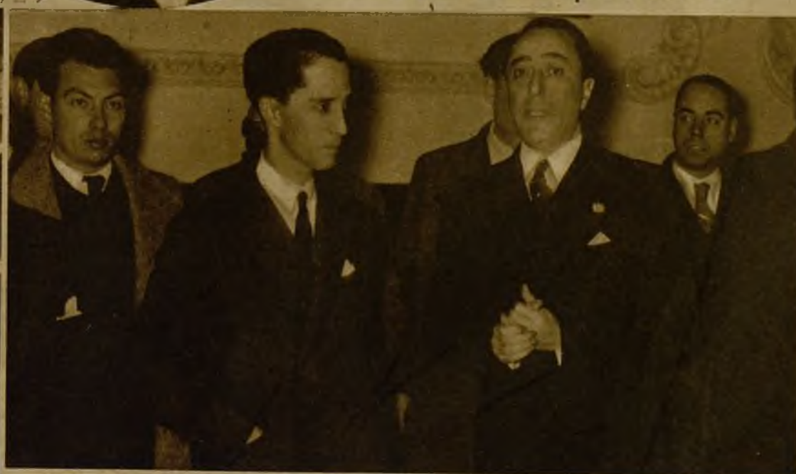
El nuevo jefe superior de Policía, don Pedro Rivas, durante su toma de posesión