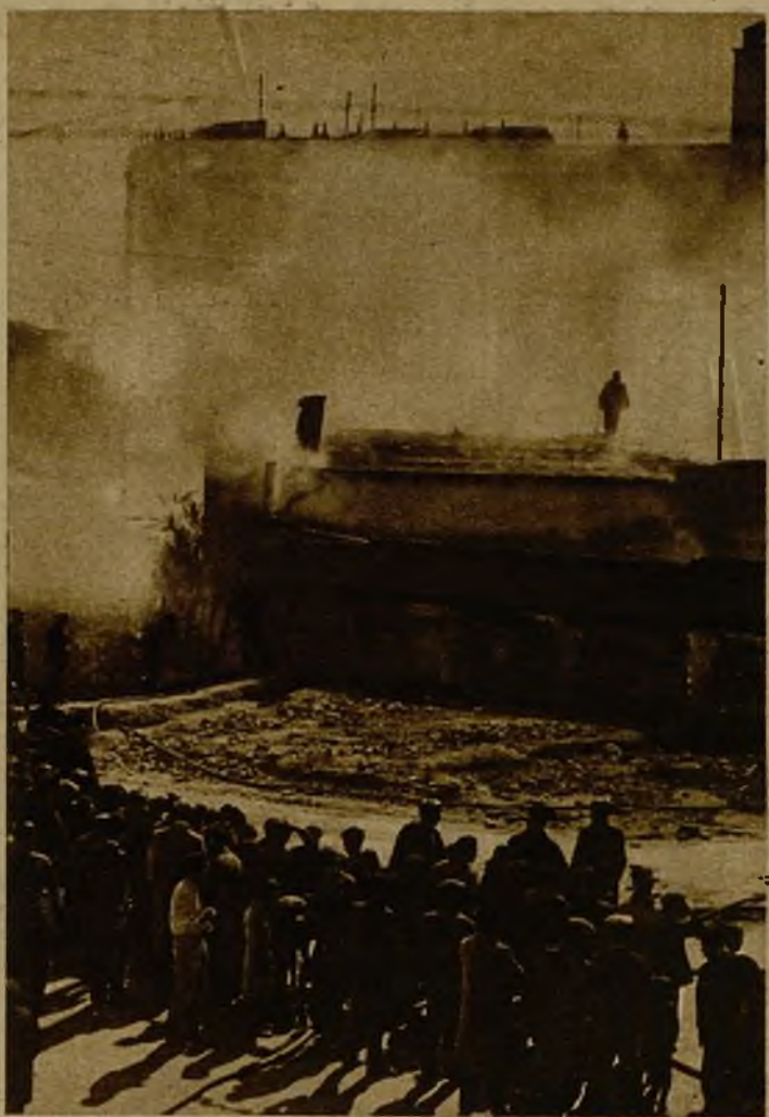
En la calle del Historiador Dago, en Valencia, se produjo un incendio en una fábrica de bolsas de papel, quedando el edificio destruido. Una vista del lugar del siniestro