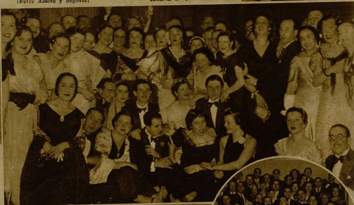
Un animado grupo de concurrentes al lucidísimo baile del Círculo de Bellas Artes