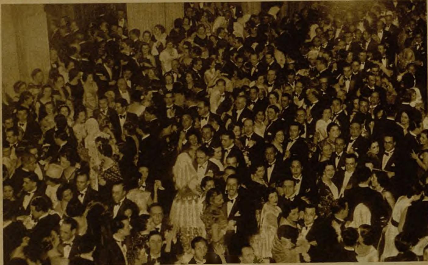
Aspecto de uno de los salones del Círculo de Bellas Artes durante el brillantísimo baile de Carnaval