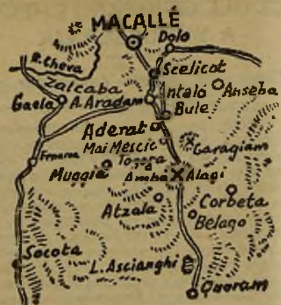
Zona donde se desarrollarán las próximas operaciones

Saliendo de Mai-Mescic, el valle se ensancha, y aunque el pueblo está un poco más bajo que la carretera se halla precisamente en la cresta militar (la cresta militar está siempre más baja que la cresta topográfica); pero guardan el valle, como gigantescos centinelas, un coloso a cada flanco: el monte Gubba-Airiat, de 2.800 metros, y el monte Garagiam, de 2.637, especie de horcas caudinas, por donde no tiene más remedio que pasar el invasor. Después, vuelve a estrecharse el valle, y formando un tremendo desfiladero, entra en las montañas de Amba Alagi.