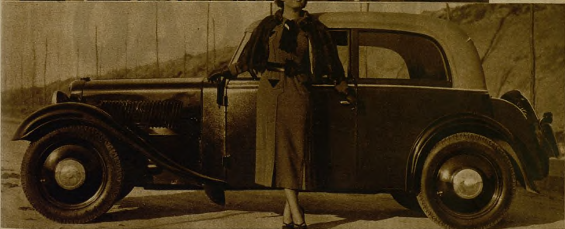
Soberbio automóvil de la acreditada marca Auto Union, tipo D. K. W., que distribuye la casa Finanzauto, Villanueva, 27, que se vende en la exposición del paseo de Recoletos, 14, y que se rifará como primer premio en la gran tómbola del baile de la Prensa