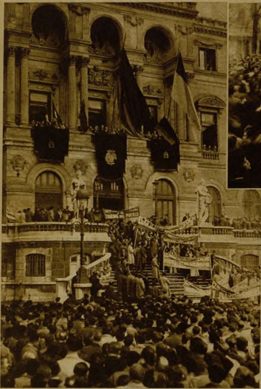
Aspecto de la entrada del Palacio Municipal de Bilbao en el momento de salir al balcón el alcalde, señor Ercoreca, y demás concejales de elección popular, repuestos en sus cargos.