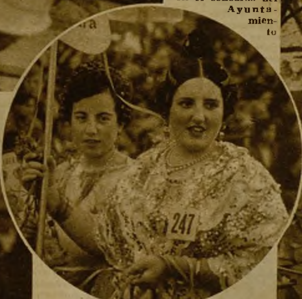
Esta encantadora señorita, que luce el traje típico valenciano, obtuvo el segundo premio en el concurso de máscaras