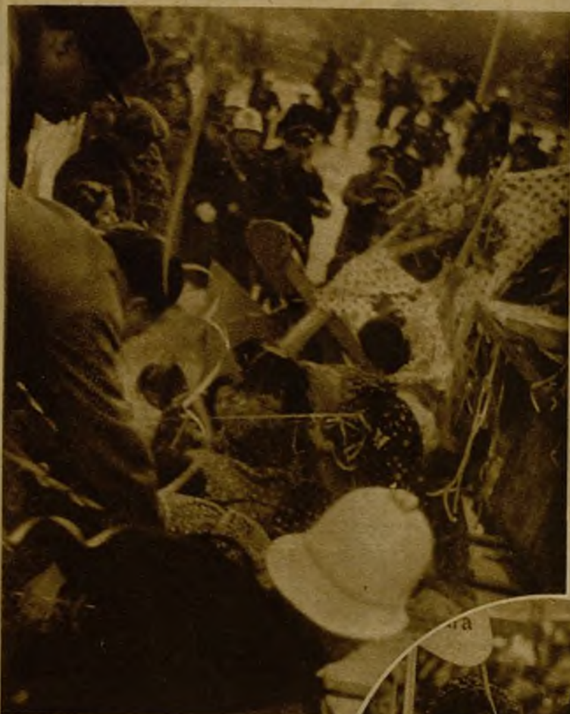
Por haberse desprendido la haranda de una carroza, las señoritas que la ocupaban cayeron a tierra, en el paseo de la Castellana. La foto ha sorprendido el preciso momento del accidente