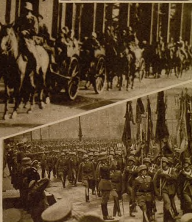
El pasado domingo se celebró en Berlín el día conmemorativo de los muertos en la guerra mundial. Las banderas del antiguo Ejército figuraron en un impresionante desfile ante el canciller Hitler. Un momento del paso de las tropas