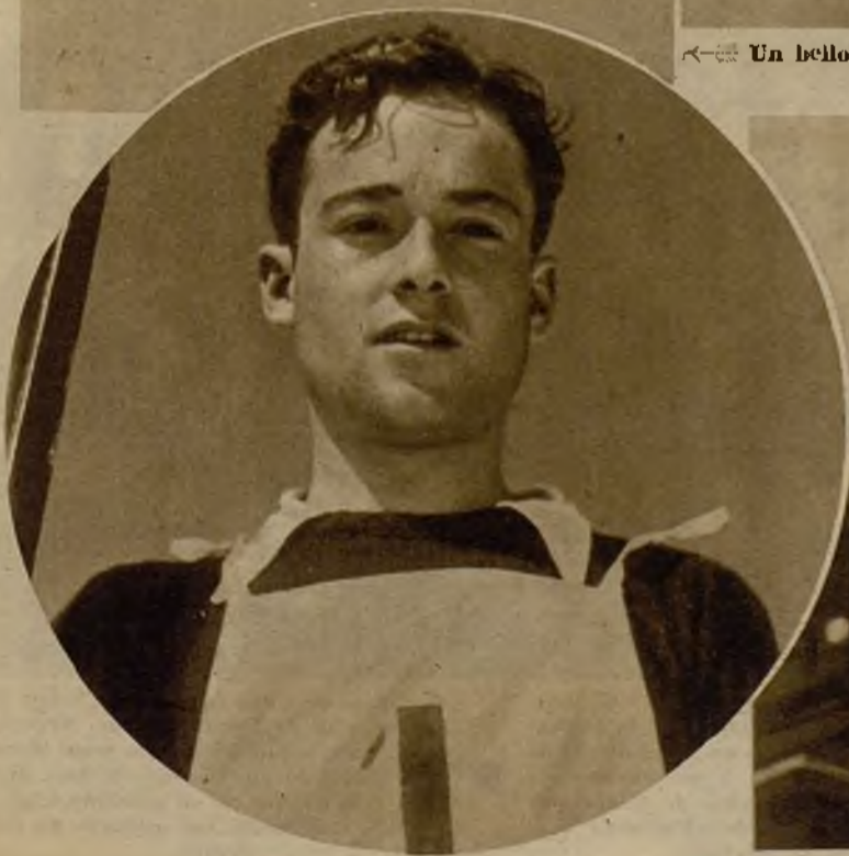
El olímpico Oriol Canals, que al vencer en la prueba se adjudicó el título de campeón