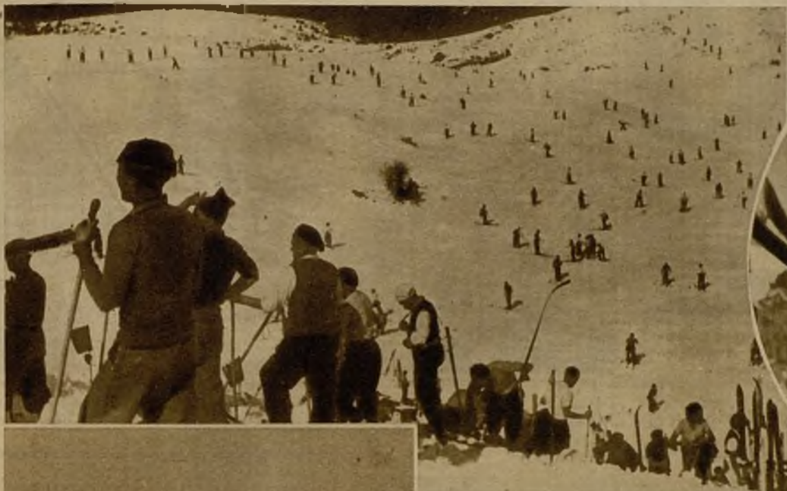
Con gran número de destacados participantes se ha celebrado en La Molina el concurso de saltos en esquí para adjudicar el campeonato de Cataluña. He aquí un aspecto de las pistas