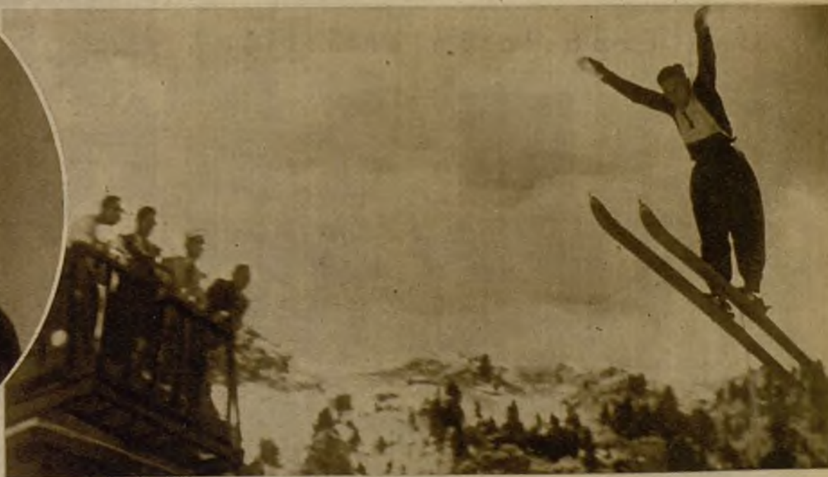
Un magnífico salto del campeón Canals, durante el concurso