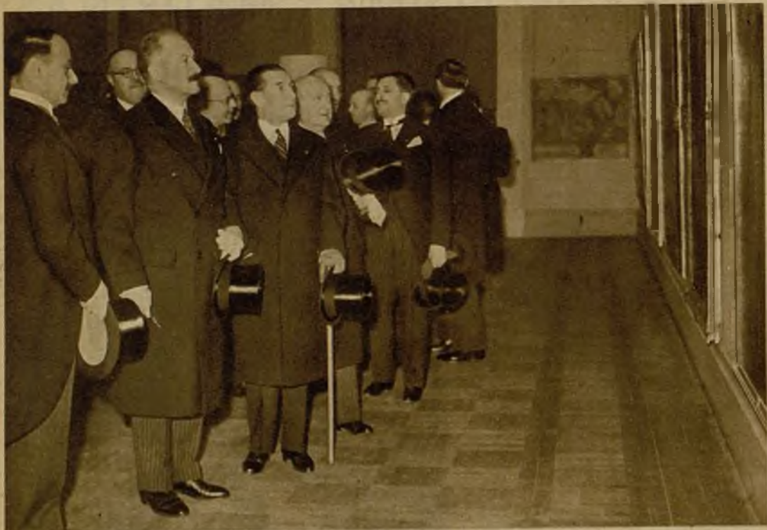
El presidente de la República francesa durante la visita hecha a la Exposición de Arte español contemporáneo, que se celebra en París