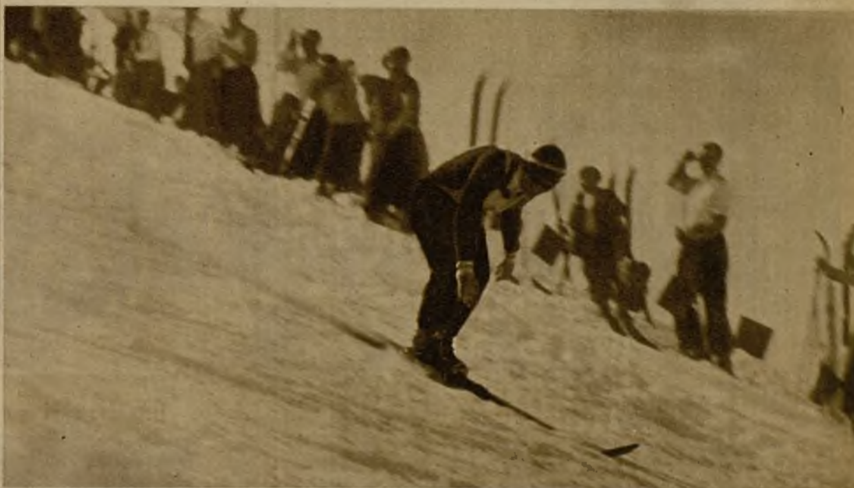
Un bello y emocionante salto en el vacío...