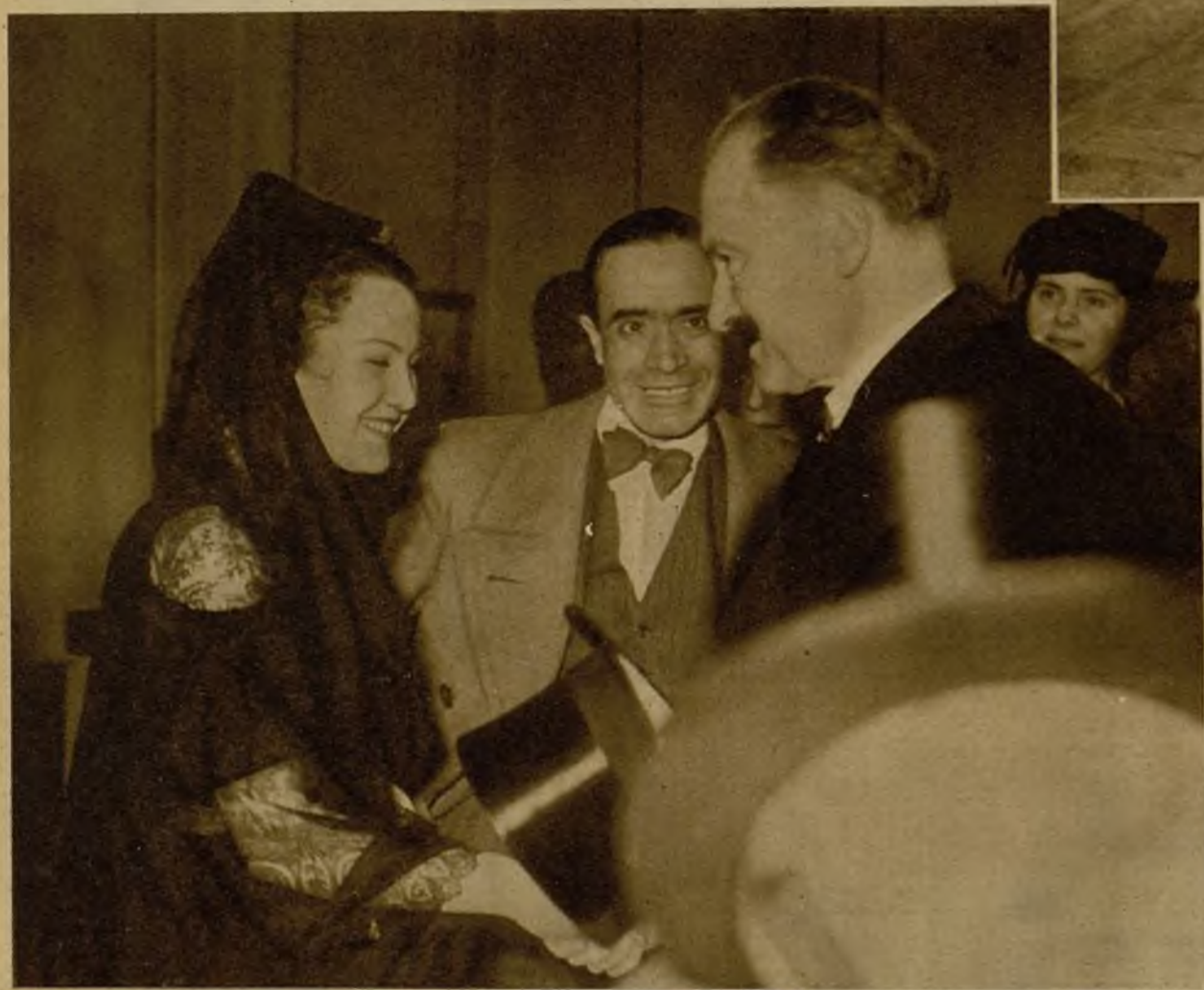
El presidente de la República francesa, M. Lebrun, es recibido, a su llegada a la Exposición de Arte español, por una linda joven ataviada con la clásica mantilla