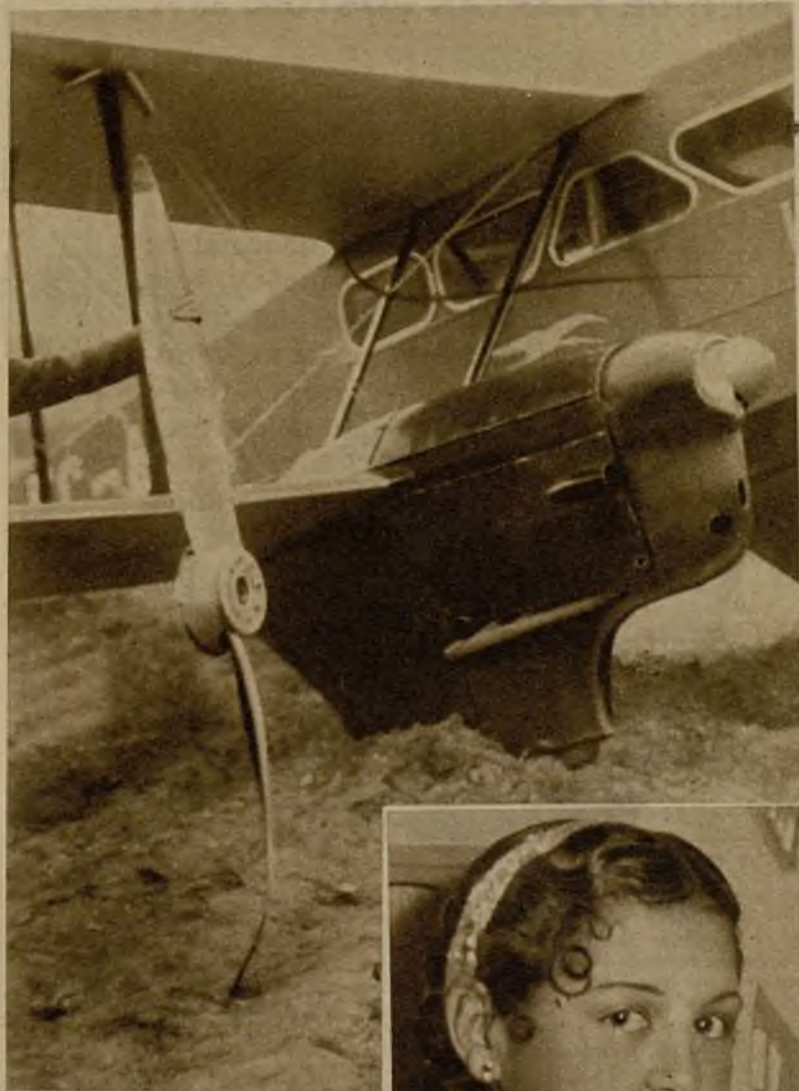
Un avión de línea que realizó un aterrizaje forzoso en las inmediaciones de Valmojado (Toledo). Según puede apreciarse en la foto, la hélice quedó rota y desprendida, y el tren de aterrizaje del aparato quedó profundamente hundido en tierra