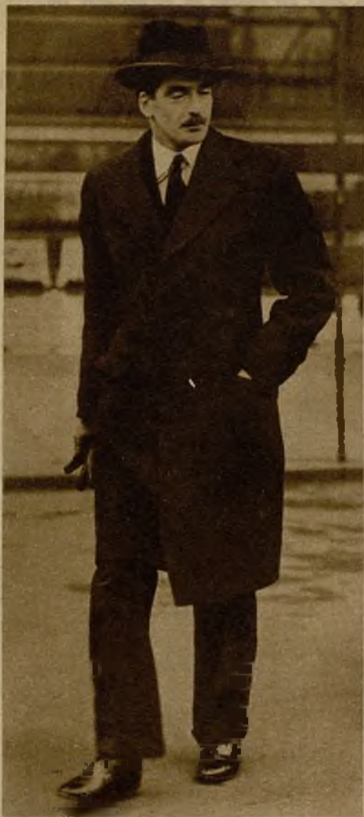
Sir Anthony Eden, el ministro de Estado británico, cuya actitud ha producido decepción en Francia y satisfacción en Alemania