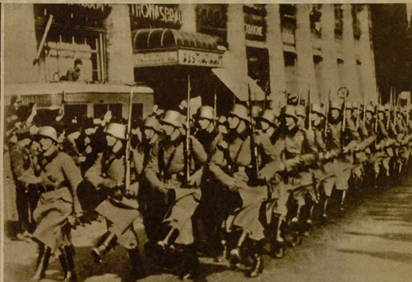
Al mismo tiempo que el canciller Hitler denunciaba ante el Reichstag el Tratado de Locarno, las fuerzas militares del Reich verificaban la ocupación de la zona de Renania. He aquí la entrada de los soldados alemanes en Colonia