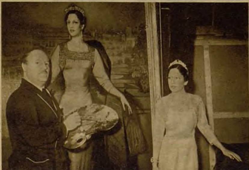
UNA OBRA DE ARTE DE BELTRAN Y MASSES.—La maharajina de Indor posando para el retrato que está pintando el ilustre artista español Beltrán Massés