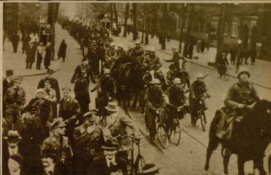
Las fuerzas de artillería alemana de ocupación al entrar en la ciudad de Francfort