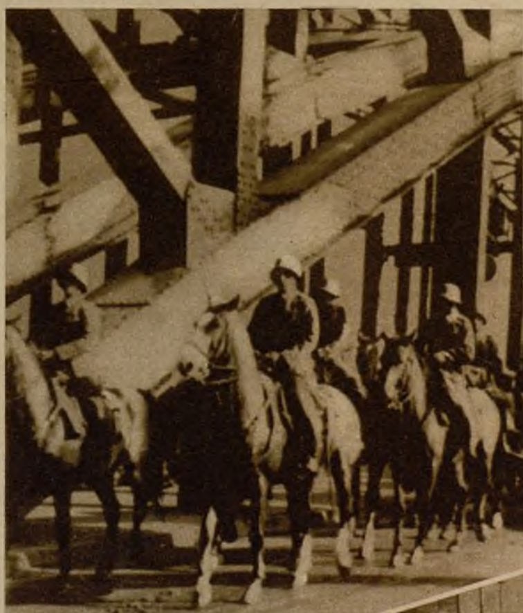
Tropas de la artillería del Reich, destinadas a la ocupación de Colonia, al hacer su entrada por el puente, situado en los arrabales de la ciudad