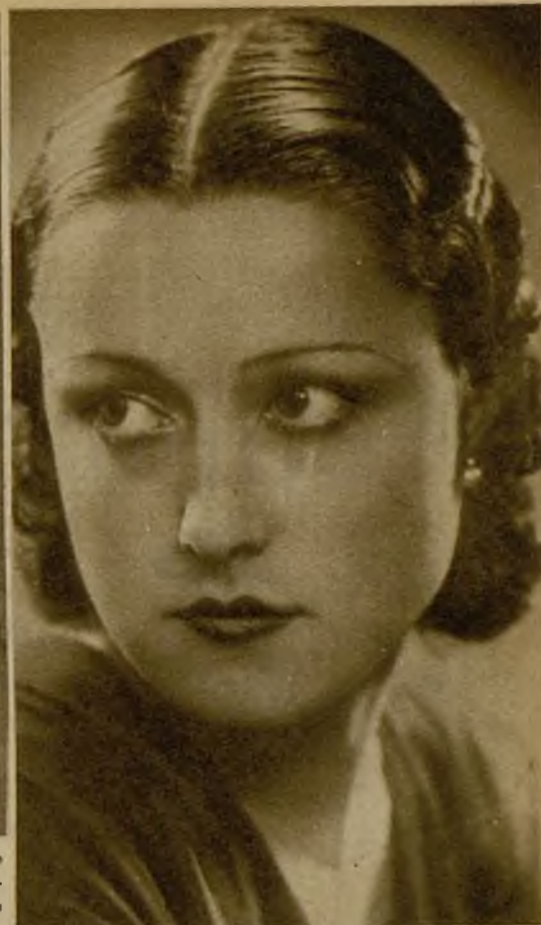
Esta encantadora señorita, cuya figura es su más evidente elogio, ha obtenido en el baile del Montepío de Teléfonos el primer premio de belleza. No ofrece duda la competencia del Jurado...