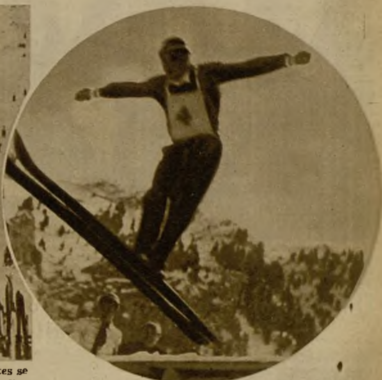
Momento de salir del trampolín uno de los participantes en el campeonato de Cataluña de saltos en esquí