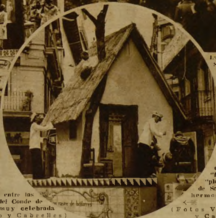
Otra falla, también muy celebrada, es la que aparece en esta "foto", que ha sido "plantada" en la plaza de San Bartolomé, de la hermosa ciudad levantina