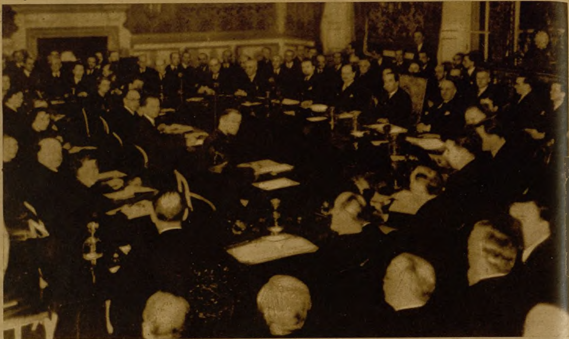
Los miembros del Consejo de la Sociedad de Naciones, reunidos en el Palacio de San Jaime, de Londres, deliberan acerca de la denuncia formulada por Francia y Bélgica sobre violación, por parte de Alemania, del Tratado de Locarno