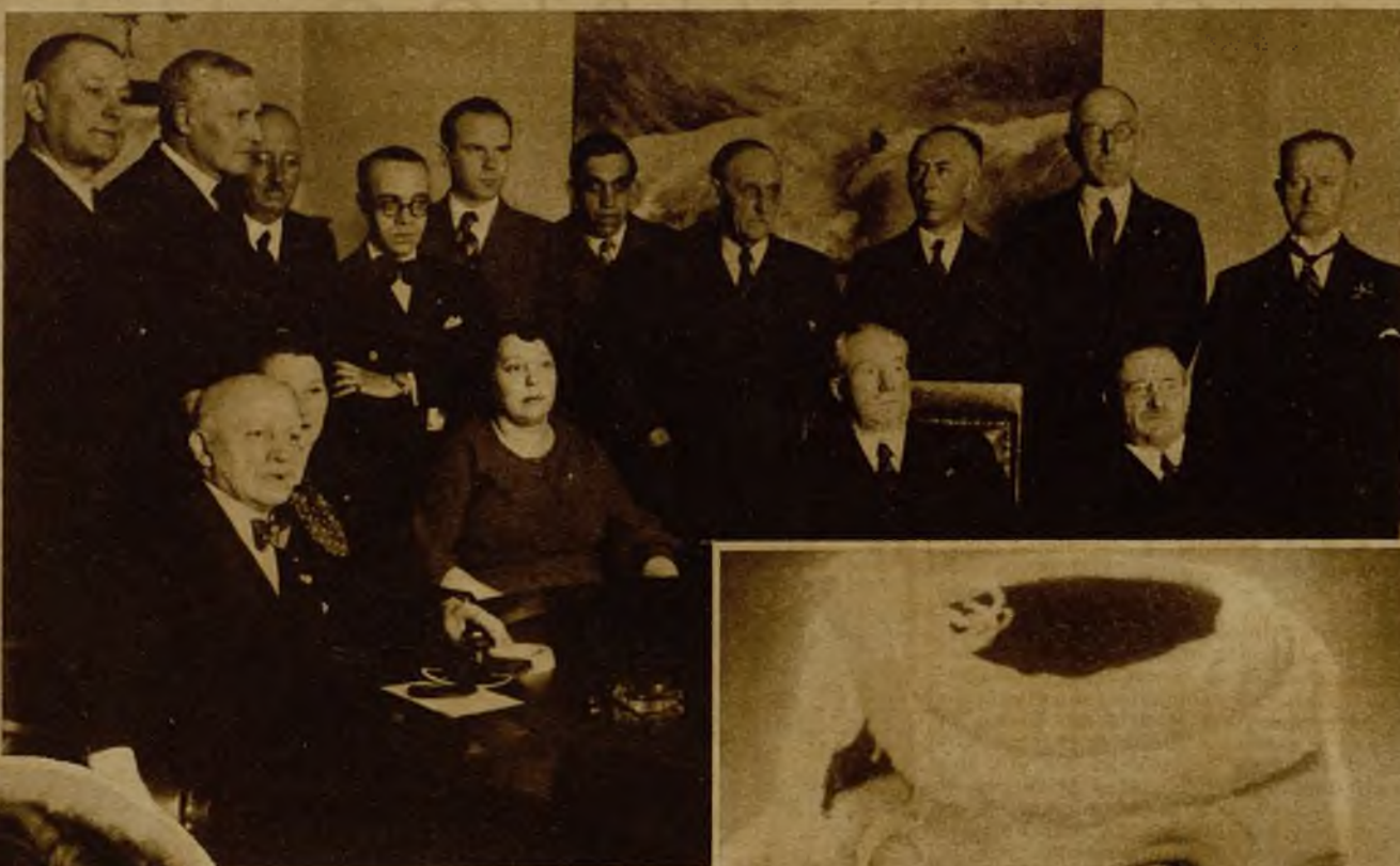
En Madrid se ha inaugurado la Asamblea preparatoria del Congreso antialcohólico de Estocolmo, con asistencia de ciento veinte delegados