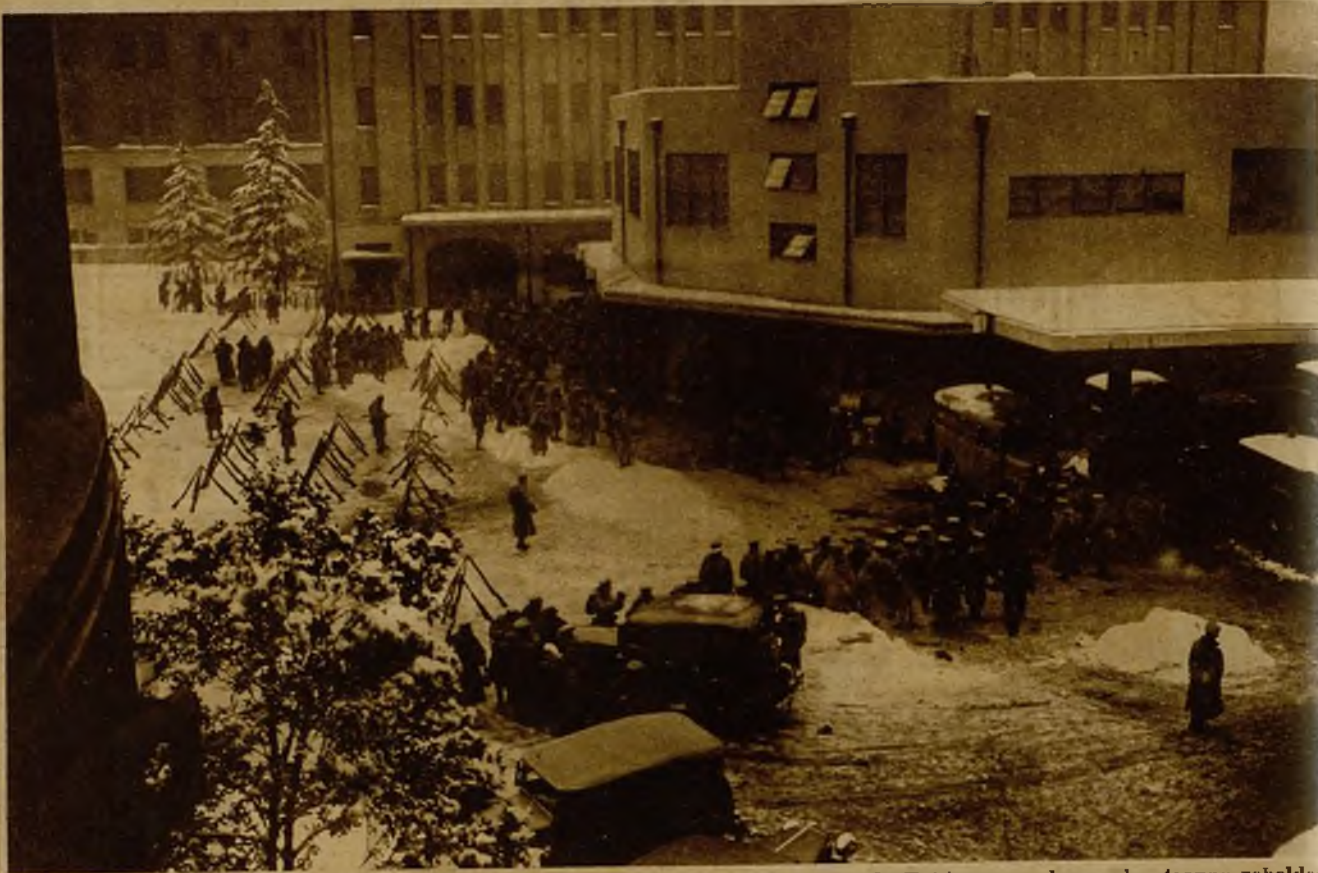
La Dirección de la Policía metropolitana de Tokio, ocupada por las tropas rebeldes, equipadas con bayonetas y ametralladoras, durante la reciente insurrección