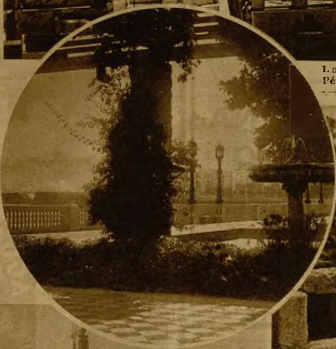
La maravillosa Pérgola de la Ala- meda gaditana