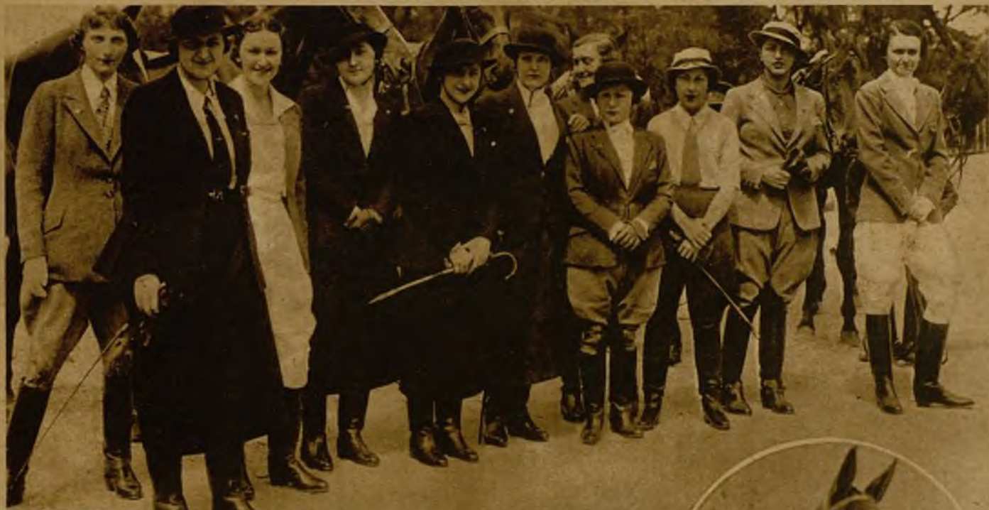
Un grupo de amazonas del Club Hípico Madrileño, dispuestas a la práctica de aquel deporte