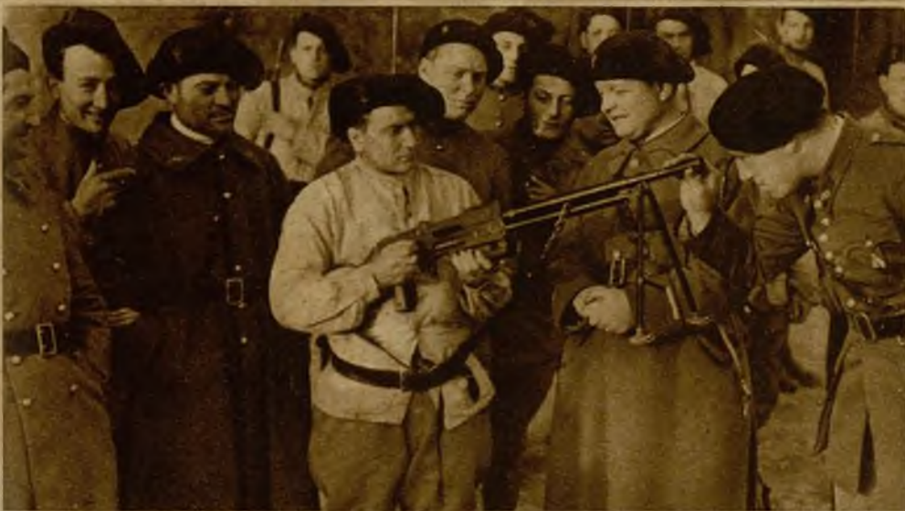
En los alrededores de Metz, un regimiento de Cazadores de Infantería está realizando interesantes maniobras de defensa. En la "foto", uno de los cazadores examina un modelo de fusil-ametralladora