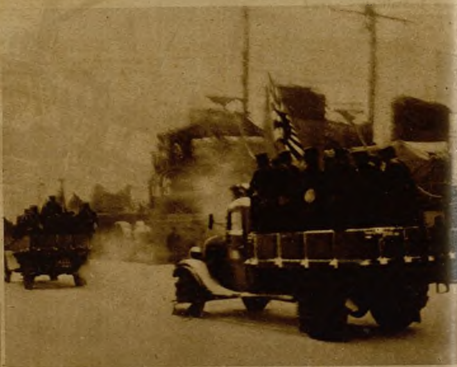
Fuerzas leales de la marinería momentos después de desembarcar en Shibaura (Tokio), procedentes de la base naval de Yokosuka, se dirigen en camiones hacia el centro de la capital para defenderla contra los ataques rebeldes