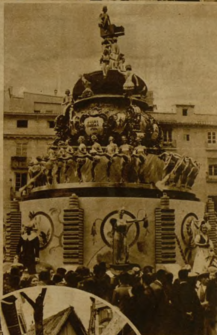
La falla de la calle de San Vicente, una de las más artísticas, que obtuvo el segundo premio entre las de la sección segunda, siendo muy celebrada, entre las más destacadas