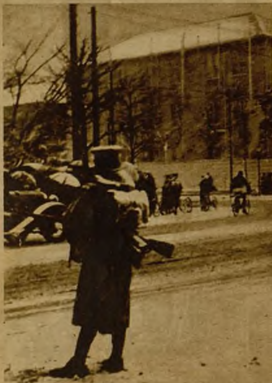
Fuerzas leales al Gobierno realizan el servicio de guardia ante el edificio del ministerio de Ultramar, en Tokio, para ponerlo a cubierto de cualquier intento de ataque de los rebeldes