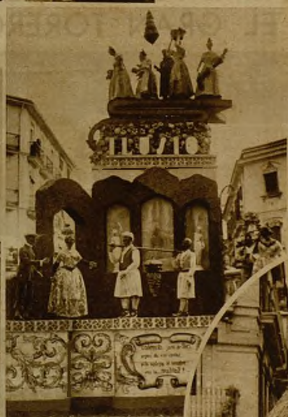
La falla situada entre las calles de Luis Morote y Matemático Marzal, que obtuvo el primer premio de las de la segunda sección