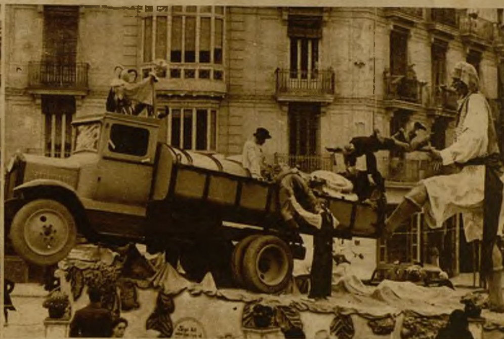
Otra de las artísticas fallas es la que reproduce esta "foto", "plantada" en la calle de Cirilo Amorós. El arte de los "falleros" valencianos, al servicio de un gran sentido del humor, brilla en estas obras, de vida tan efímera, que han de perecer sometidas a la acción de las llamas devastadoras, ante la algazara de los espectadores