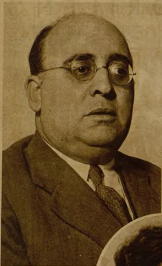
Don José María Cossío, a quien la Academia Española ha otorgado el premio "Fastenrath" por su obra "Los toros en la poesía".