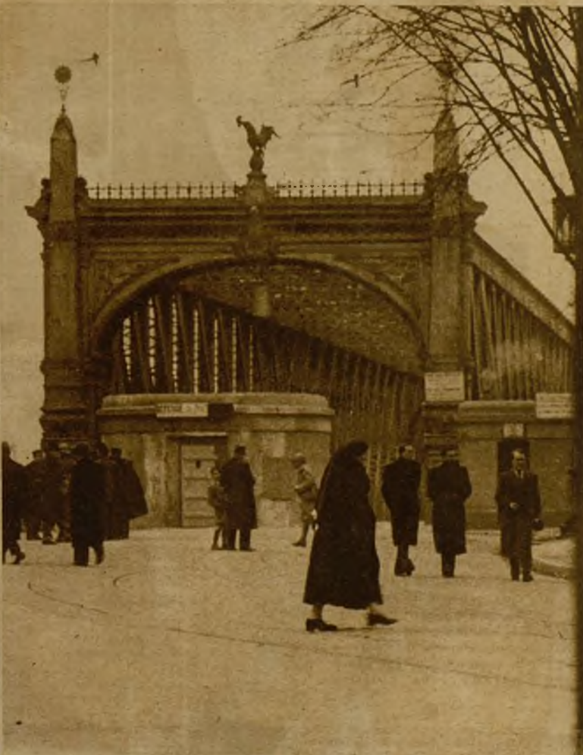
Los dos mil reservistas llamados a filas han salido de París hacia las guarniciones del Norte y del Este. Ved un alegre grupo de reservistas, rodeados de soldados