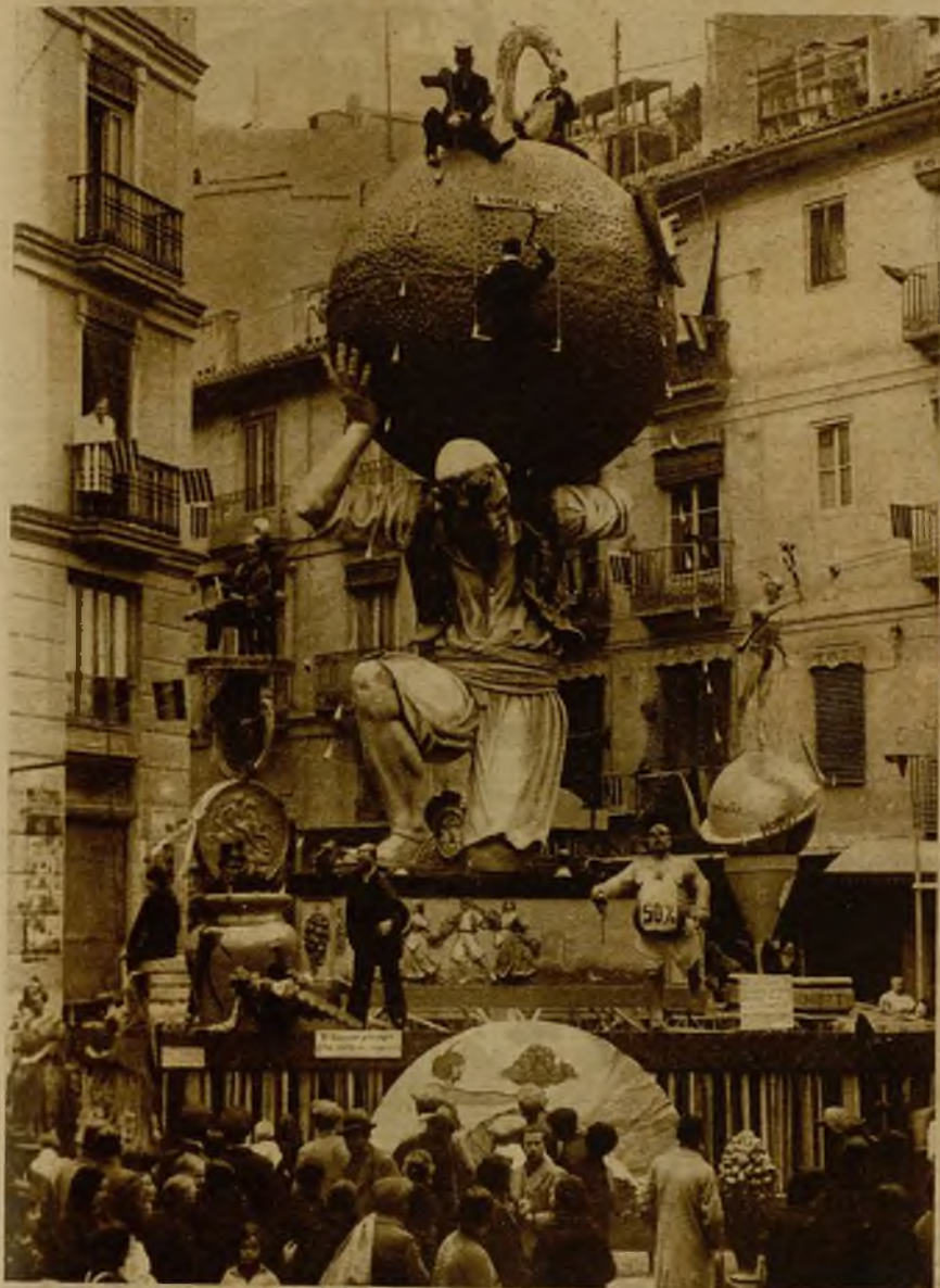
En Valencia continúan con gran animación las tradicionales fiestas de las fallas, habiéndose otorgado ya los premios correspondientes. En la "foto", una de las artísticas fallas en una plaza valenciana.