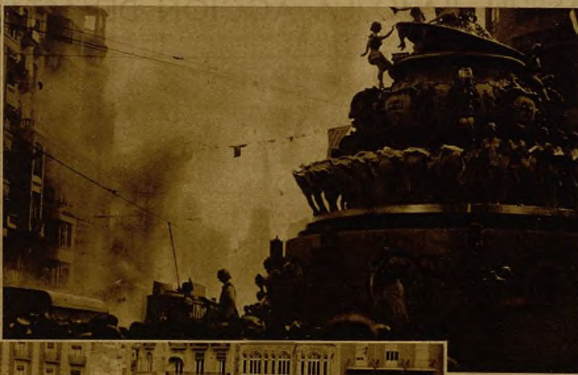
Uno de los días falleros pudiera denominarse "el de la pólvora", porque fueron innumerables las "tracas" que atronaron la ciudad. Ved una de ellas quemada ante el Ayuntamiento