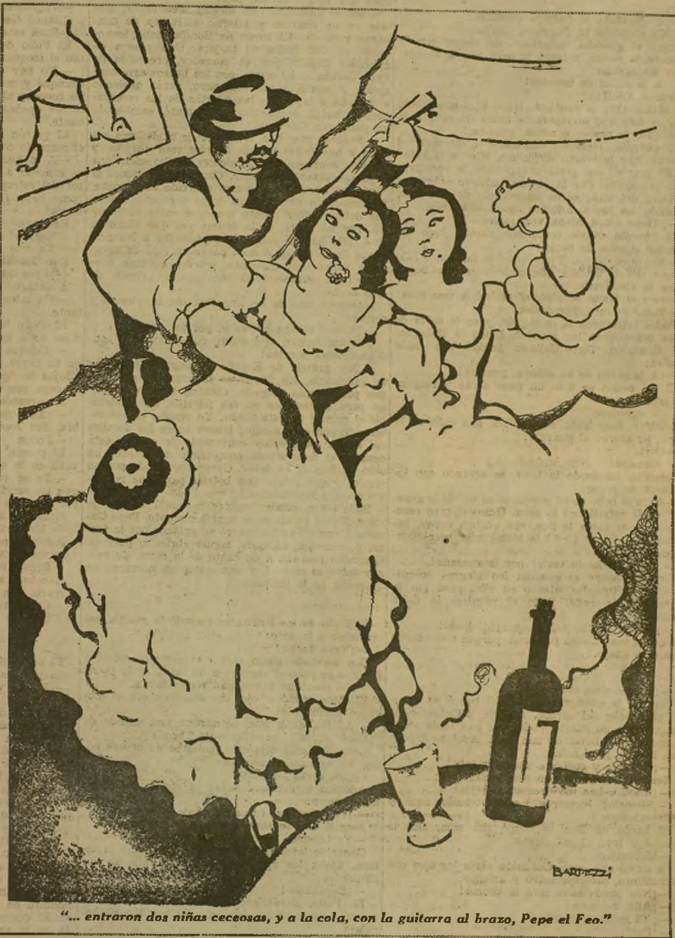
"... entraron dos niñas ceceosas, y a la cola, con la guitarra al brazo, Pepe el Feo."

El guardia, detenido en la puerta, miró a las daifas, al chaval del mandilón y a Garabato. Le inspiraban un sentimiento familiar en su calidad de pueblo, y mirándolos consolaba su aturdimiento. Toñete Bringas y el Pollo de los Brillan-