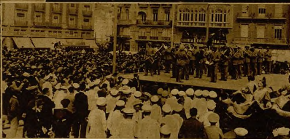
Otro de los festejos falleros consistió en un desfile de bandas de música para interpretar pasodobles durante la llamada "Fiesta del pasodoble"