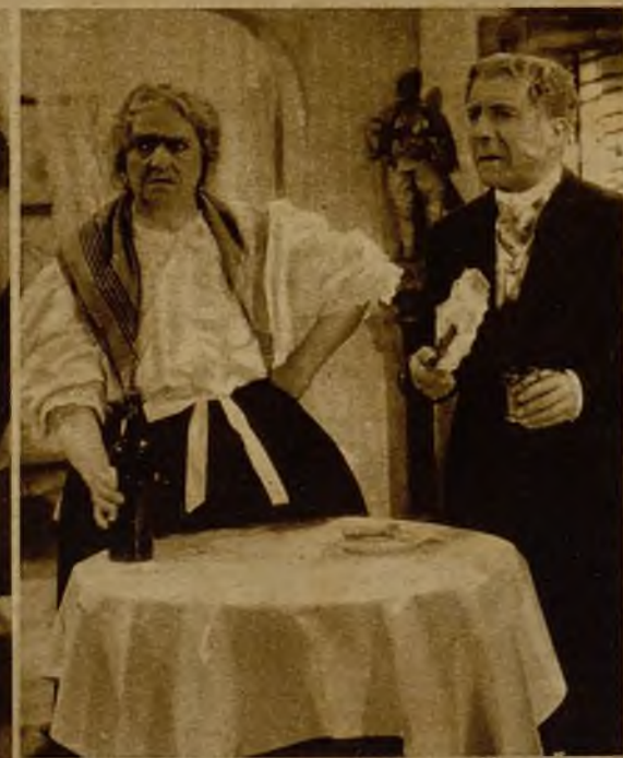
Una escena de "Rebelde", el último film de la precoz artista Shirley Temple