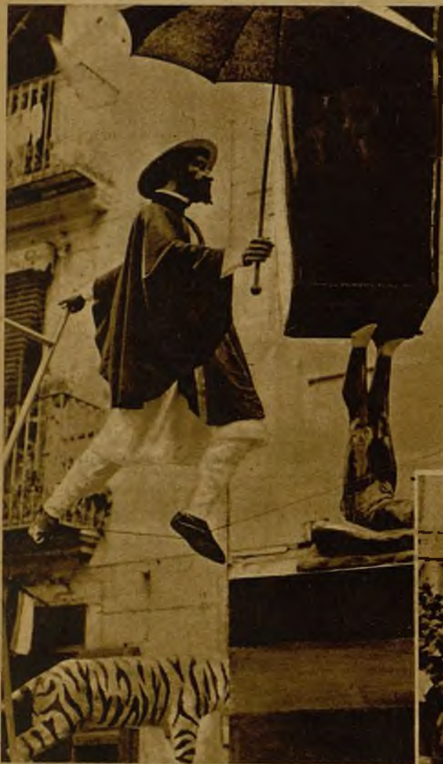
El "humor" de los artistas valencianos aparece en esta falla, en la que vemos al Negus haciendo prodigios de equilibrio sobre el alambre