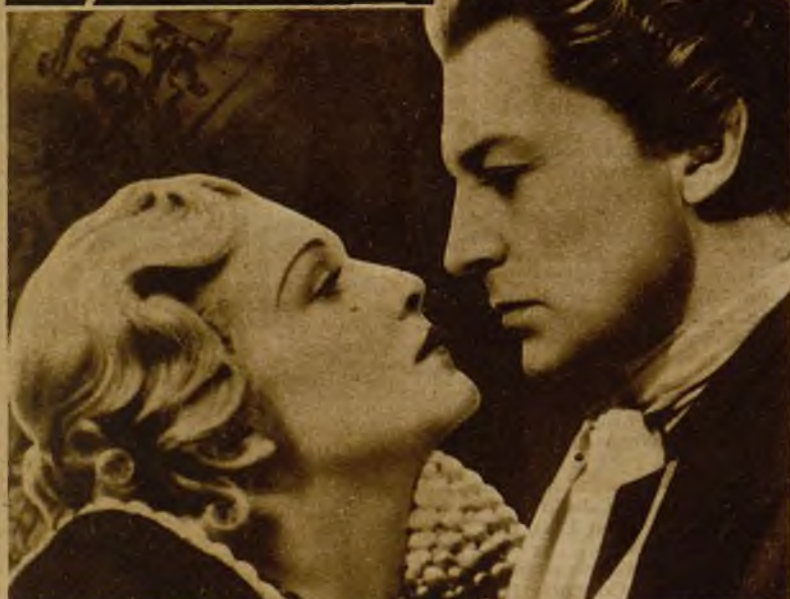
El gran actor Clive Brook y la bellísima Madeleine Carroll en "El consejero del rey"