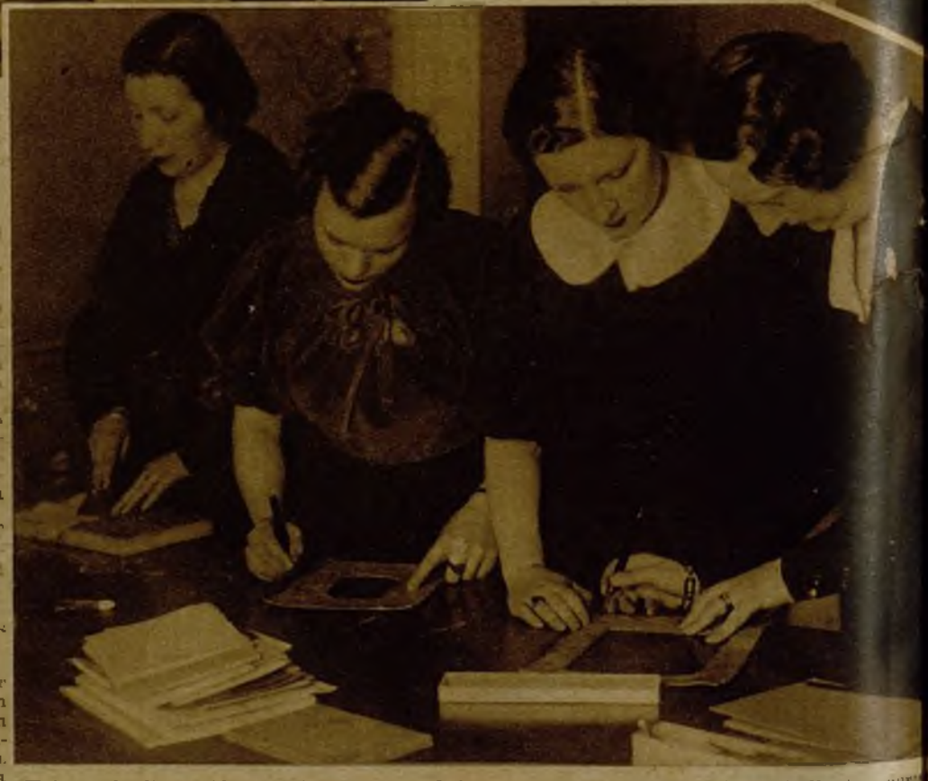
Estas señoritas están en otra clase verdaderamente insospechada, la de hucograbado, que también figura en el plan del Centro de Estudios

—Algunas muchachas, sin duda, casaderas a las otras no les preocupa la cocina—nos preguntan si damos clases culinarias. Pero no las tenemos, por el momento. No obstante, hablo que ir pensando en iniciarlas al curso que viene, en vista de que se repiten esta clase de solicitudes. También acuden señoras casadas, y algunas se van contrariadas. "¿Qué lástima—decía una, hace pocos días—yo que me había hecho ilusiones de hacerme una buena cocinera... A mi marido le gusta comer bien y variado. Le gusta, cuando viene de la oficina, encontrar una mesa ape-