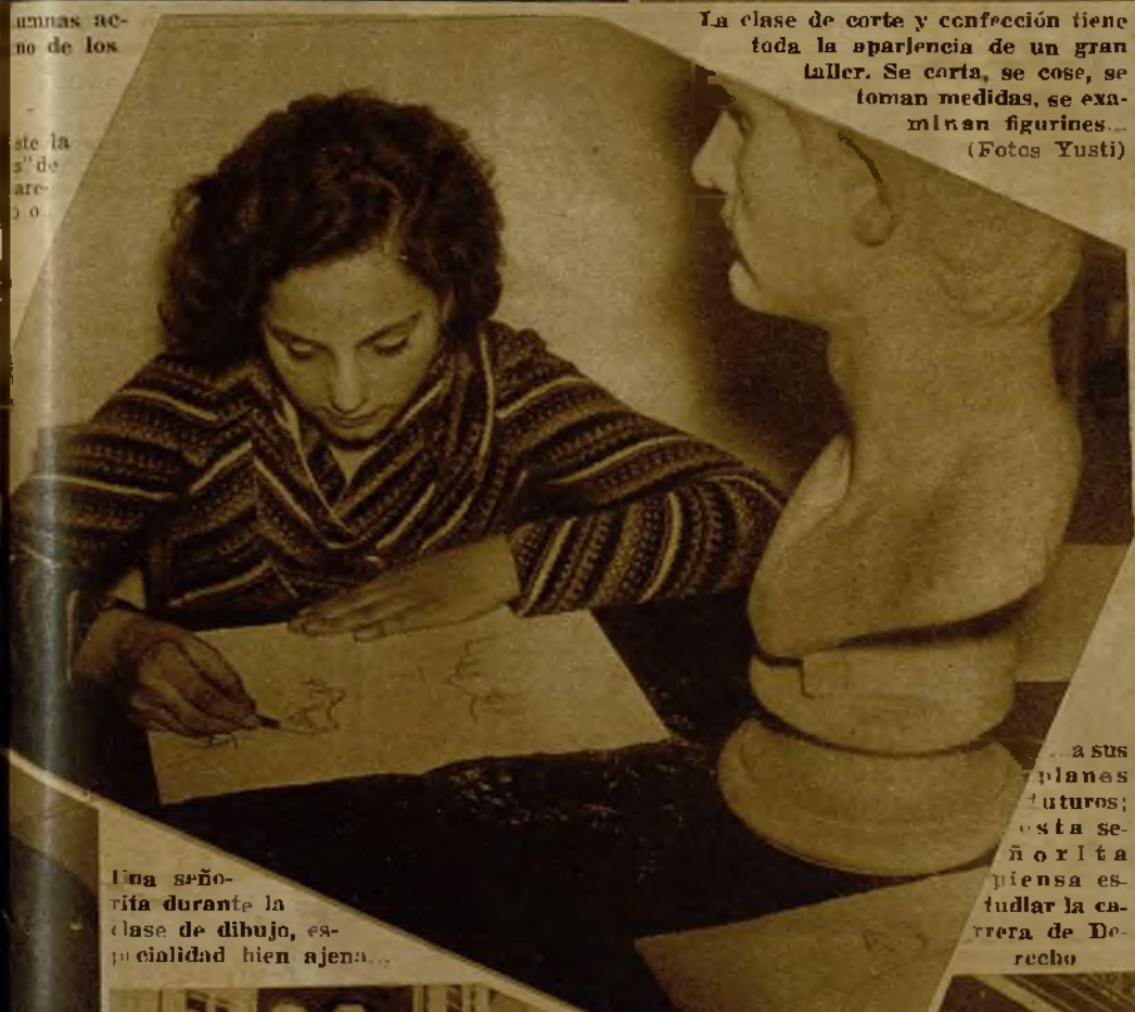
Una señorita durante la clase de dibujo, especialidad bien ajena...