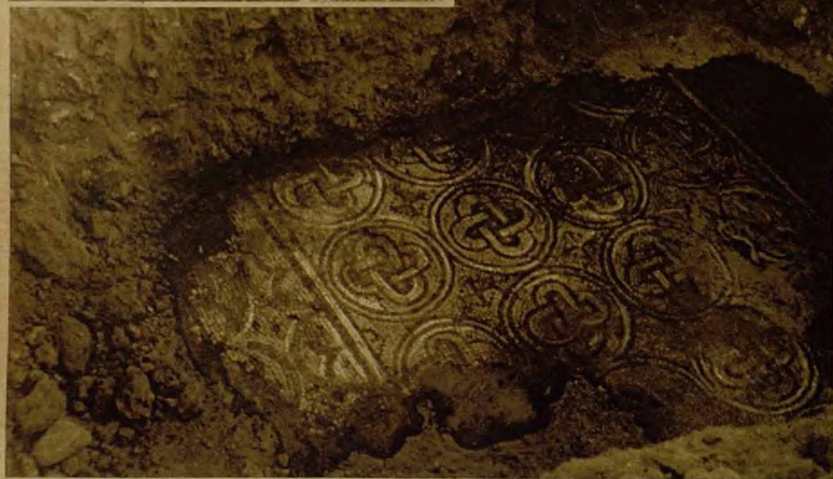
Otro de los artísticos mosaicos encontrados en las excavaciones. También han sido hallados restos de una necrópolis