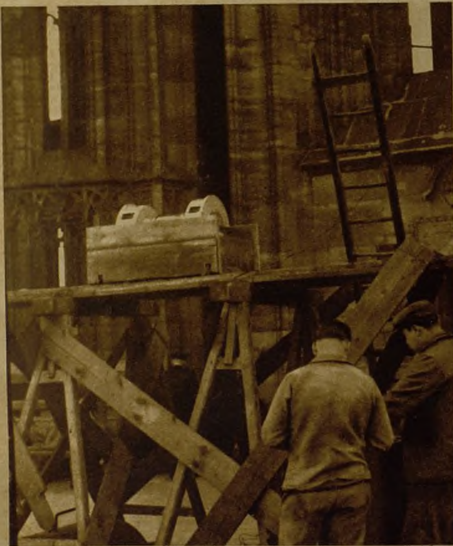
Las medidas precautorias adoptadas por Francia en toda la zona fronteriza alcanzan a la catedral de Strashurgo, donde ha sido instalada una sirena de alarma