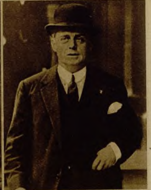
Von Ribbentrop, jefe de la Delegación alemana, que ha acudido a Londres a las reuniones que se celebran a instancia de los firmantes del Tratado de Locarno, pasea por una de las calles de la capital de la Gran Bretaña