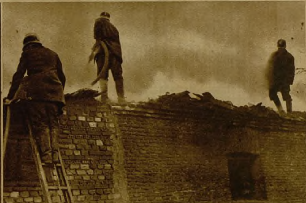
La festividad de San José, que tiene una repercusión tan íntima en innumerables hogares españoles, fué celebrada con solemnes cultos, especialmente en la parroquia dedicada al Santo. Ved un aspecto de dicha parroquia durante la misa de doce