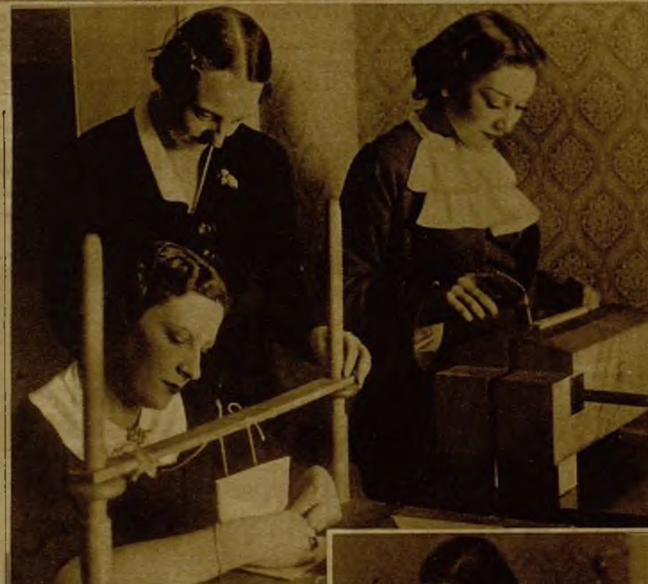
También se ha dado cabida a otros conocimientos útiles, generalmente más deseados; por ejemplo, la clase de encuadernación, en la que se están adiestrando esas bellas señoritas