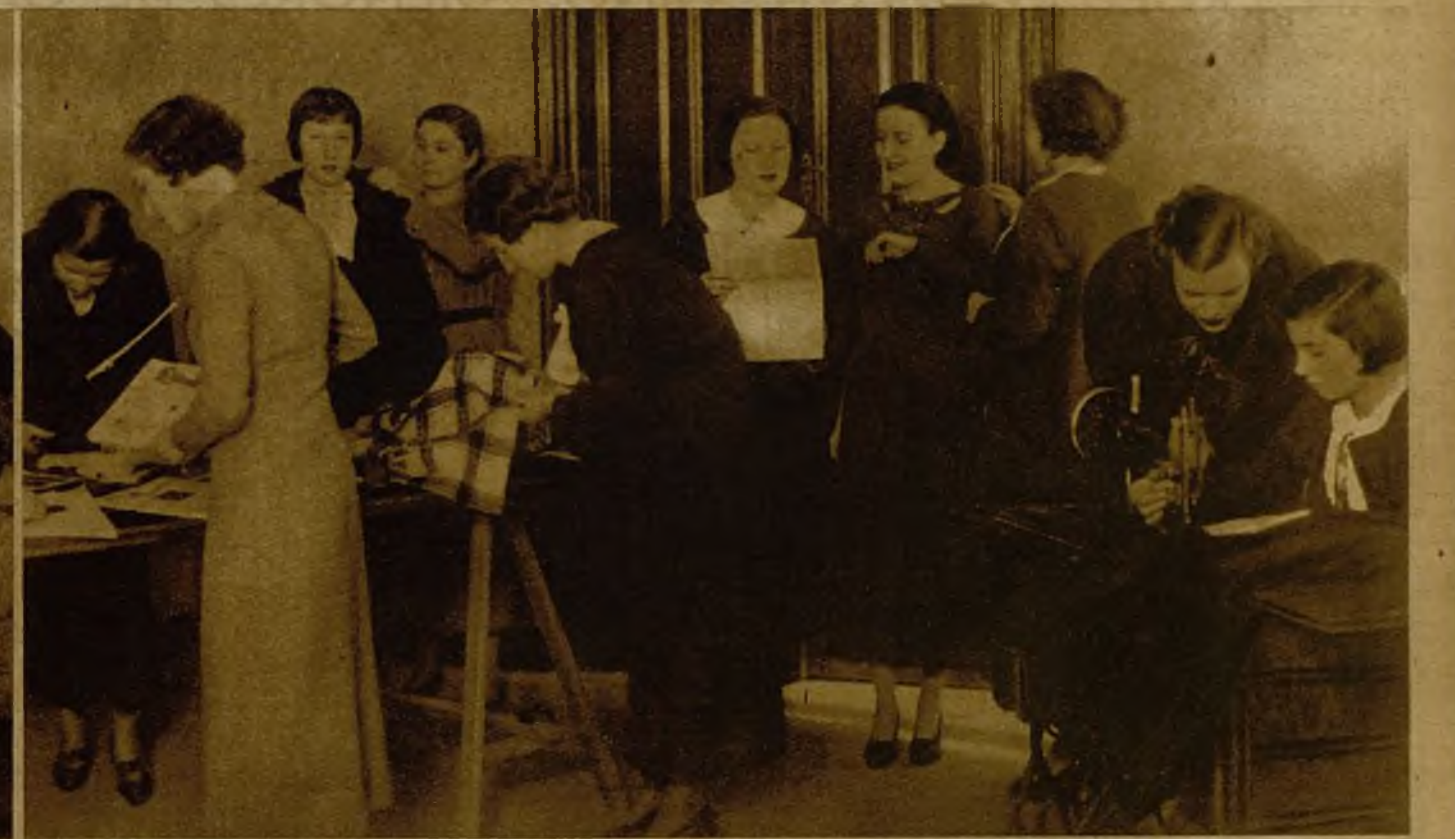
La clase de corte y confección tiene toda la apariencia de un gran taller. Se corta, se cose, se toman medidas, se examinan figurines...