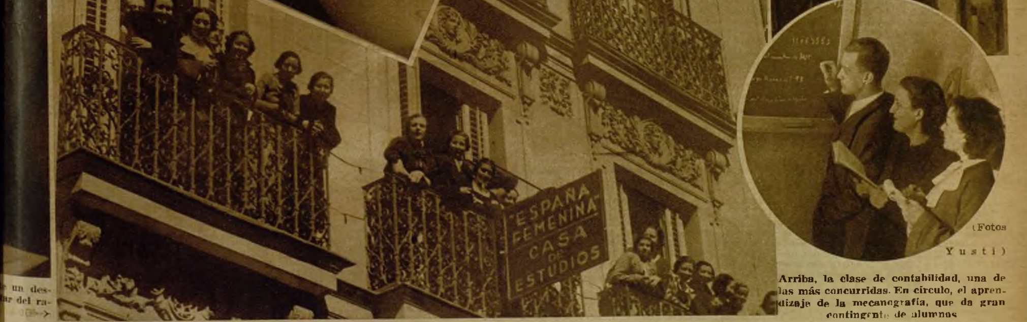
Arriba, la clase de contabilidad, una de las más concurridas. En círculo, el aprendizaje de la mecanografía, que da gran contingente de alumnas