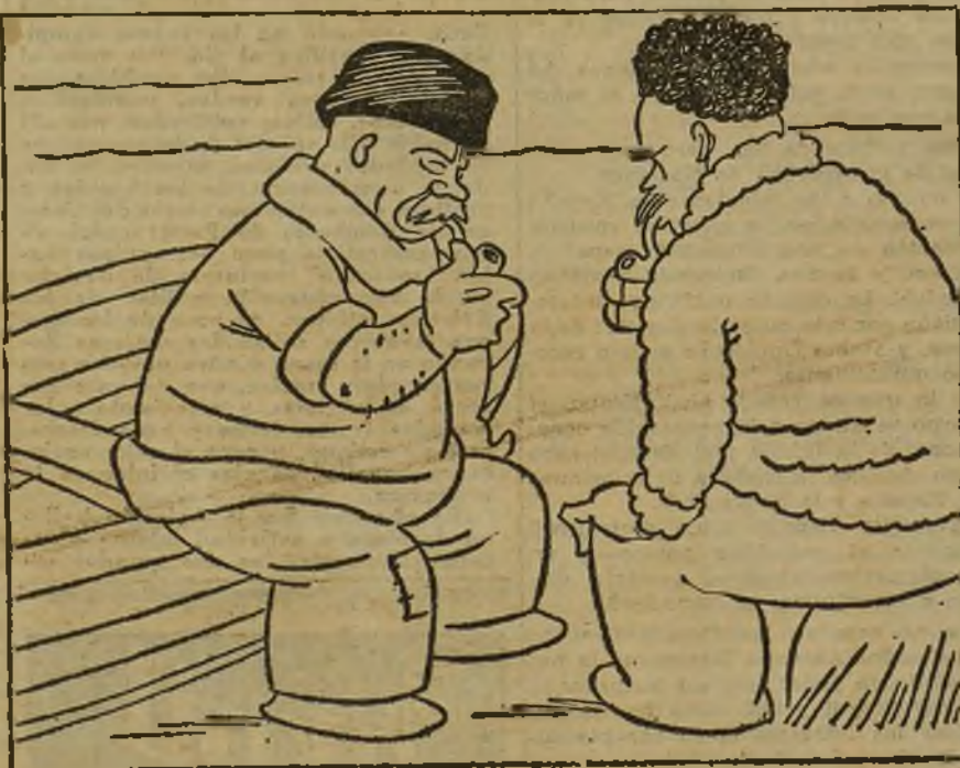
LOBOS DE MAR, por K-HITO

MAÑANA: EL DOCTOR HINOJAR por MAGDA DONATO