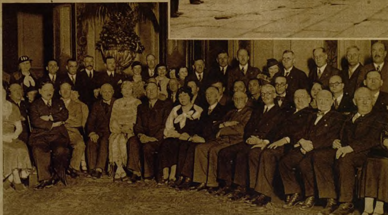
En el Ayuntamiento de Madrid fueron ayer recibidos y obsequiados por alcalde y concejales los miembros de la Asamblea Antialcohólica, preparatoria del Congreso de Estocolmo. Un aspecto de la recepción