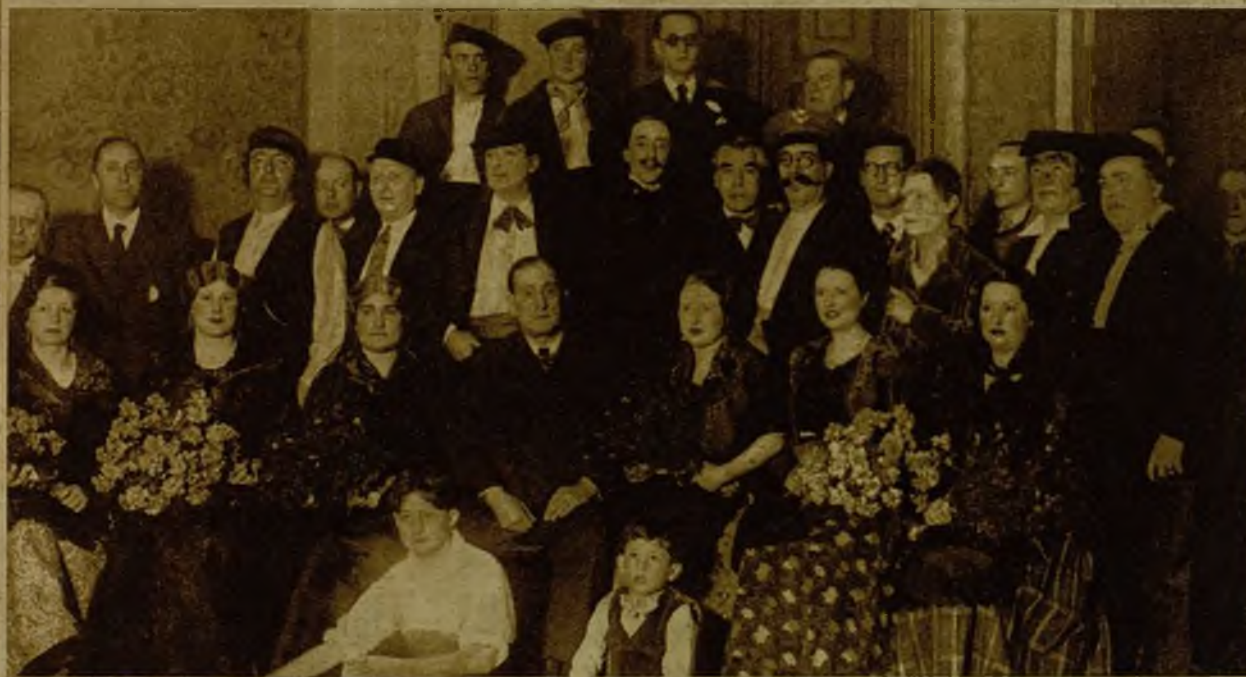
En el teatro Novedades, de Barcelona, se ha celebrado un festival a beneficio de la Mutua de Empleados Municipales. Los funcionarios representaron el sainete catalán "A cal notari"