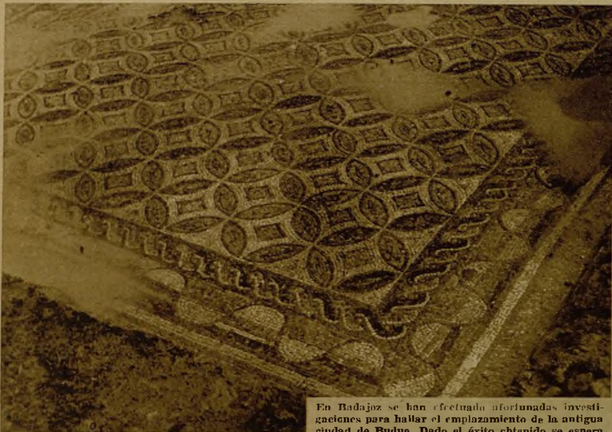
En Badajoz se han efectuado afortunadas investigaciones para hallar el emplazamiento de la antigua ciudad de Budua. Dado el éxito obtenido se espera alguna apertura económica para continuarlas. Arriba, y a la izquierda, detalle de los mosaicos hallados