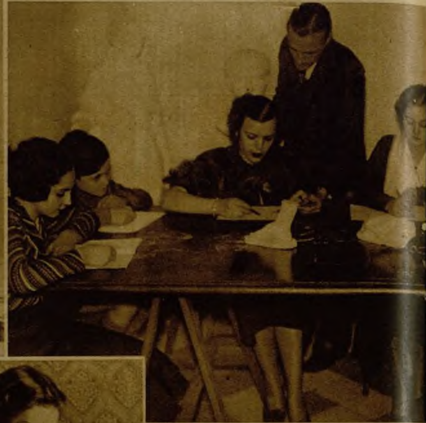
Un aspecto de la clase de dibujo, en la que las alumnas actúan, ante modelos, bajo la experta dirección de los profesores