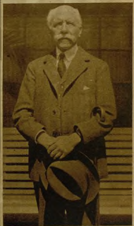
El ilustre escritor y embajador español don Francisco de Reynoso, que ha publicado en inglés un sensacional libro de Memorias y el relato pintoresco de un viaje al Japón

Índice y germen para una obra ulterior de más amplios vuelos este ensayo científico que reseñamos, descubre nuevos horizontes a la investigación moderna y el éxito de su teoría puede transformar en su aplicación las actividades y bienestar de la humanidad.