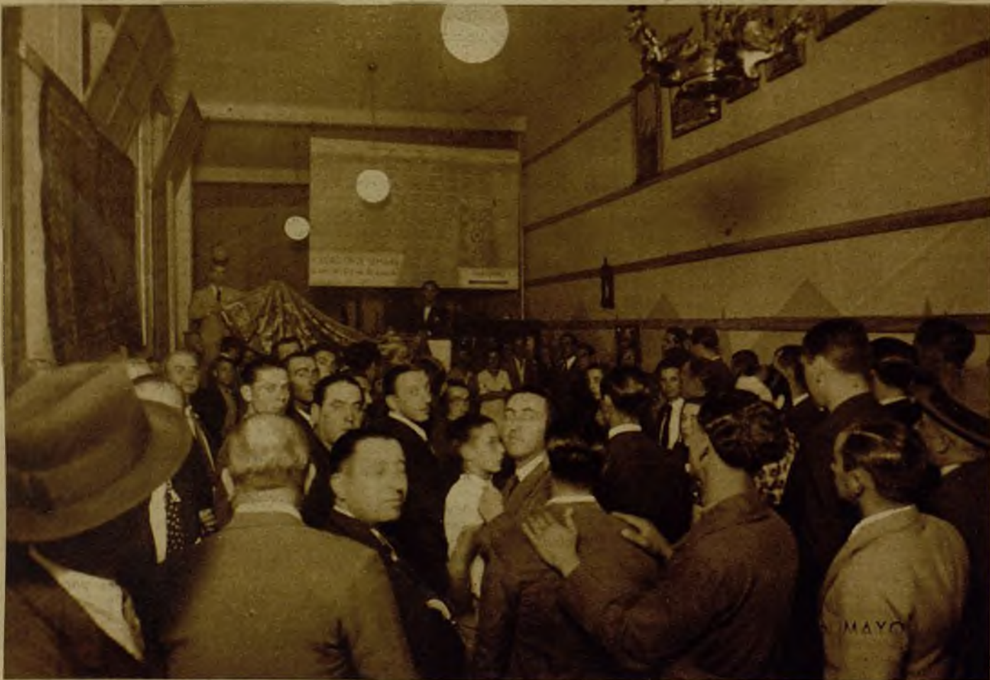
... Y las subastas "al martillo", instaladas en la Gran Vía, el Broadway de nuestro Madrid, que se moderniza (Fotos Mayo)