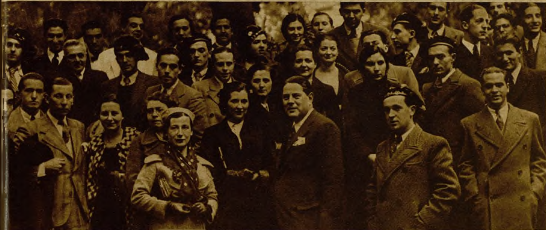
Los estudiantes de la Facultad de Montpellier que se encuentran en Barcelona durante la visita que hicieron a la Universidad de la capital de Cataluña, donde fueron recibidos por el rector y autoridades escolares