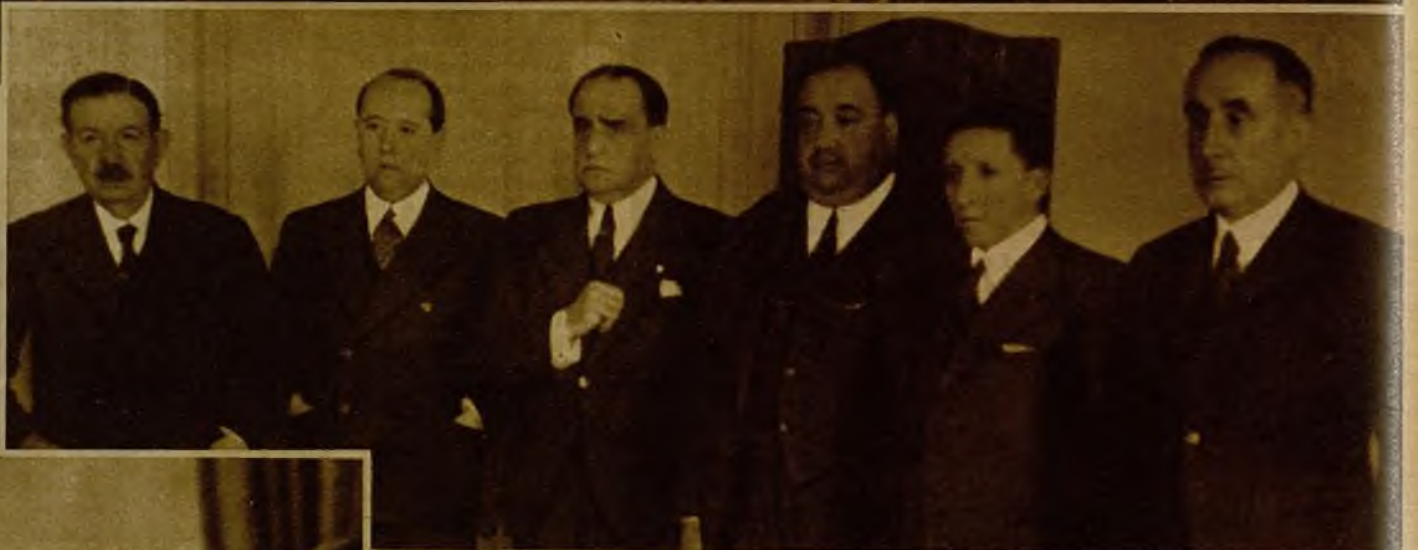
En el Hotel Ritz celebraron una conferencia los representantes de los grupos de derechas, señores Gil Robles, Goicoechea, Ventosa, Cid, Lamamié de Clairac y Calderón (don Abilio), ocupándose especialmente de la actitud a adoptar por las respectivas minorías en su acción parlamentaria