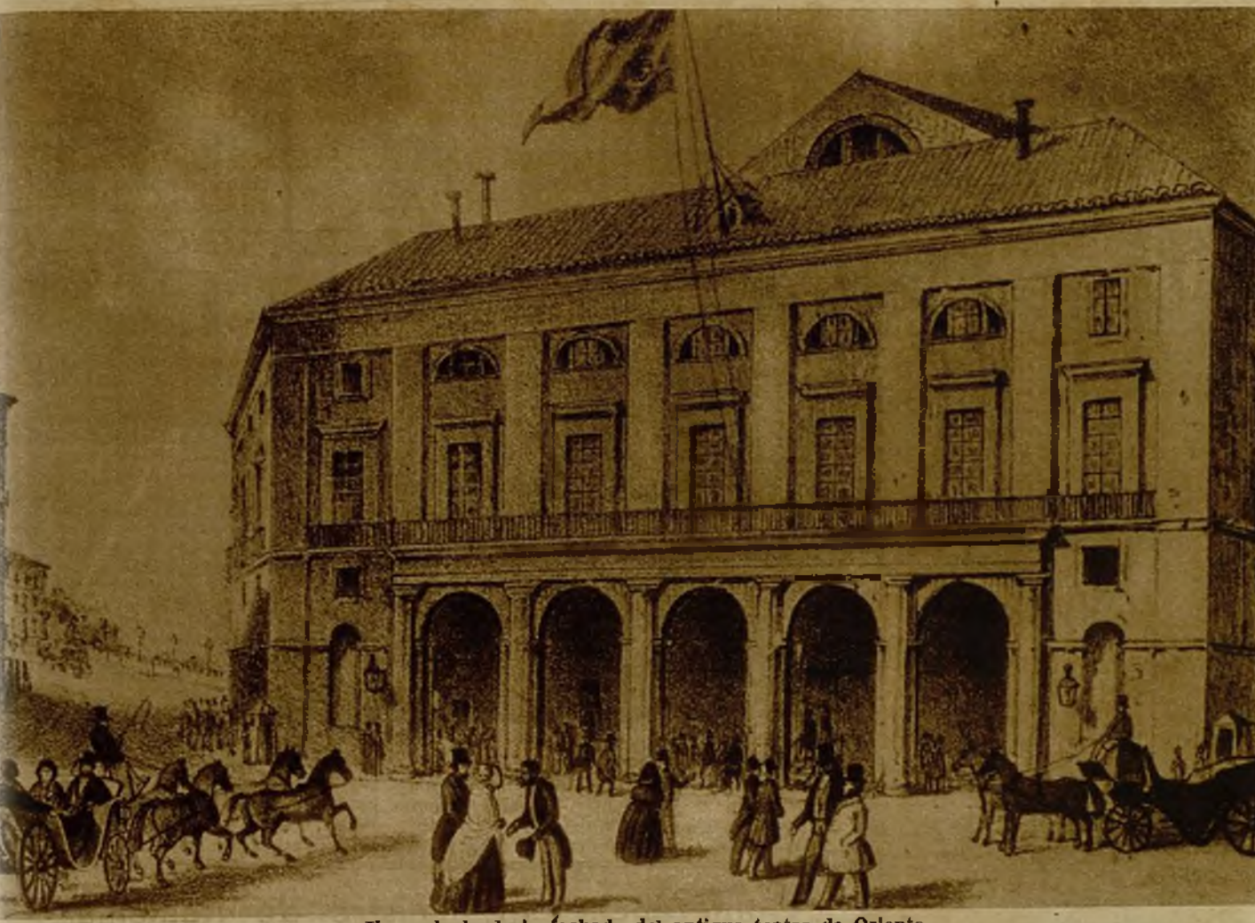
Un grabado de la fachada del antiguo teatro de Oriente