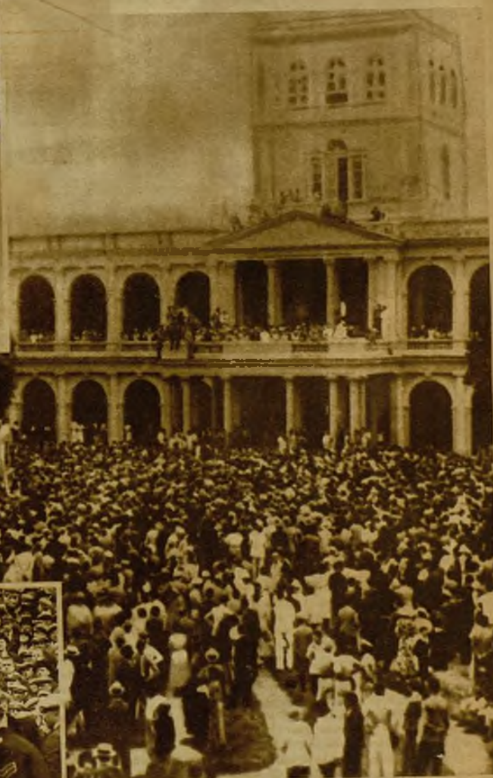
Aspecto que ofrecía la plaza Presidencial de Asunción (Paraguay) después de haber sido proclamado el general Rafael Franco, al que la multitud tributó un entusiástico homenaje. A más de los Estados Unidos, han reconocido al nuevo Gobierno paraguayo cinco grandes Repúblicas de Suramérica

El campeonato inglés de fútbol despierta este año el entusiasmo acostumbrado. He aquí un aspecto de la entrada general en el partido entre el Arsenal y el Huddersfield