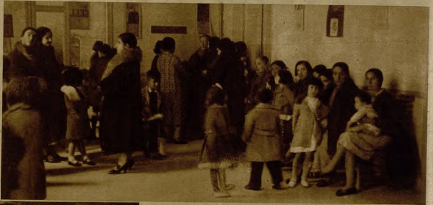
Un rincón del salón de espera del Dispensario