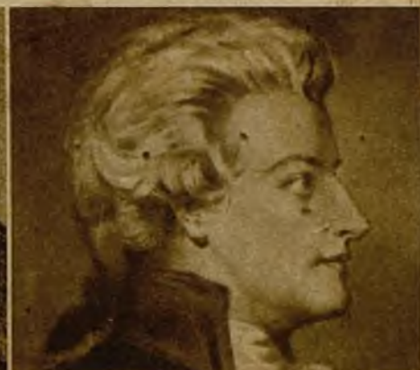
Mozart, el quernbin de Salzburgo, el niño prodigio, el hombre desgraciado, el músico genial, el desengañado glorioso...

Visitó también Rossini la casa del infante don Francisco, hermano del rey y rossinista apasionado.