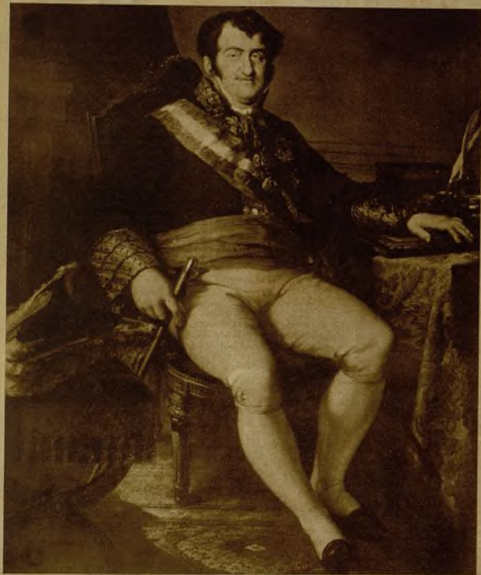
Un retrato de Fernando VII, "El Desecado", obra de Vicente López

EL DELIRIO FILARMÓNICO BAJO FERNANDO VII.—MONTRESOR.—LA CORTES "LA FABBRICA".—"TOSISTAS" Y "LALANDISTAS".—FUNDACION DEL CONSERV TORIO.—LA LOCURA ROSSINIANA.—ROSSINI, EN MADRID.—EL PURO DEL REY LA ROMANZA DEL INFANTE.—EL CAFE DEL PRINCIPE Y EL LICEO ARTISTICO