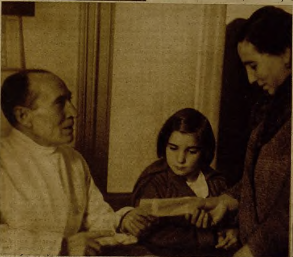
La niña necesita el previo reconocimiento, y el consejo del Dispensario da a la madre la papeleta correspondiente