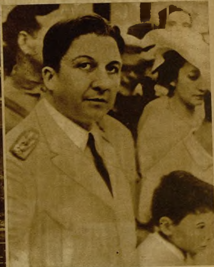
El general Rafael Franco, héroe de la guerra del Chaco, que ha asumido la presidencia del Gobierno militar del Paraguay, al que los Estados Unidos han prestado su reconocimiento