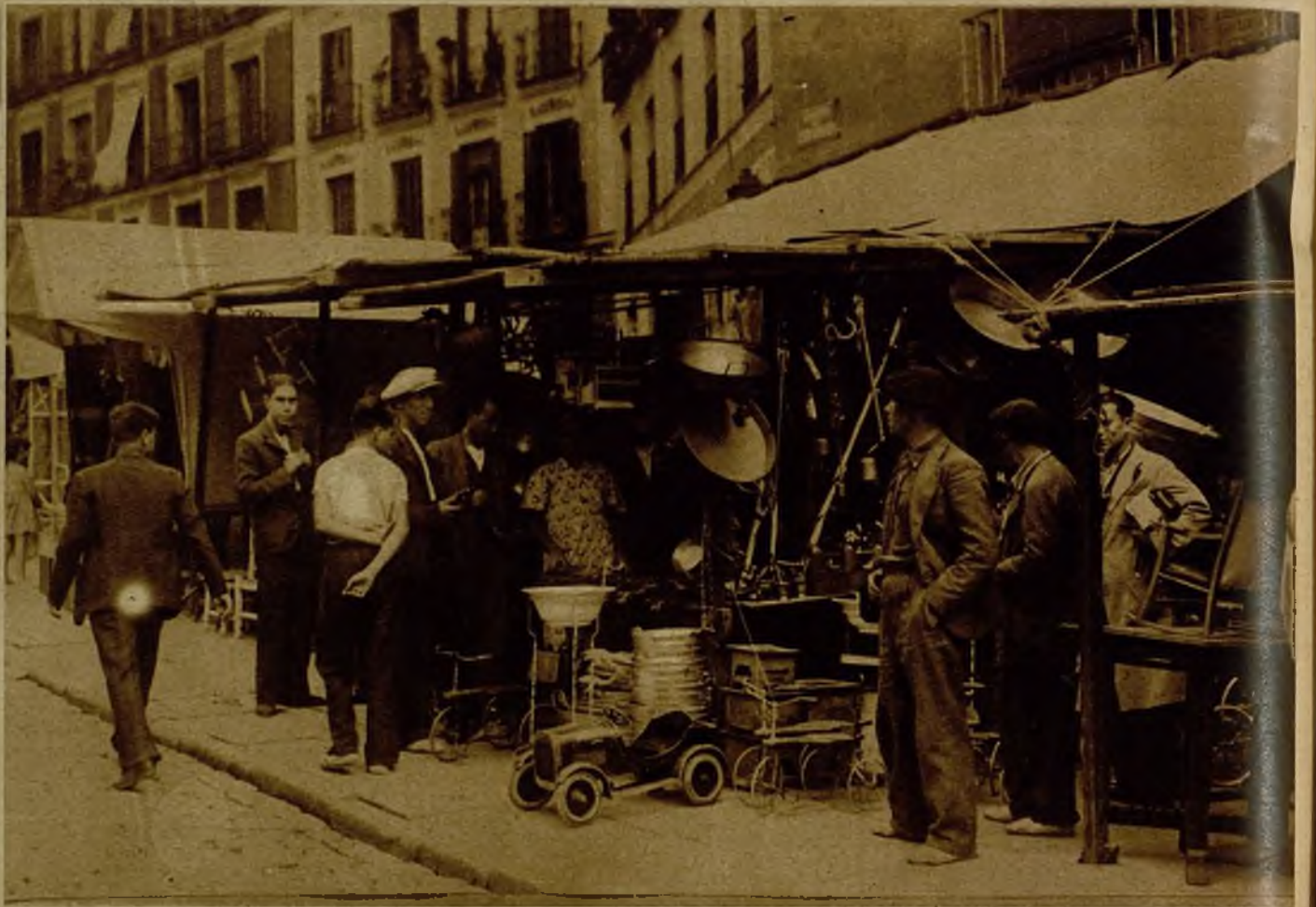
He aquí un clásico tenderete del Rastro, con todo el sabor de feria de ropavejero de un barrio judío...

Los baratillos del Rastro sienten ya, también, el peso de su vejez. La alegre feria de la industria que allí se asienta pierde día por día clientela, condenándolo a morir. Los tenderetes de ropa, artículos de viaje y cerrajería, en pintoresca promiscuidad, que se estacionan desde la estatua de "Cascorro" hasta allá, abajo, en Embajadores, han dado un