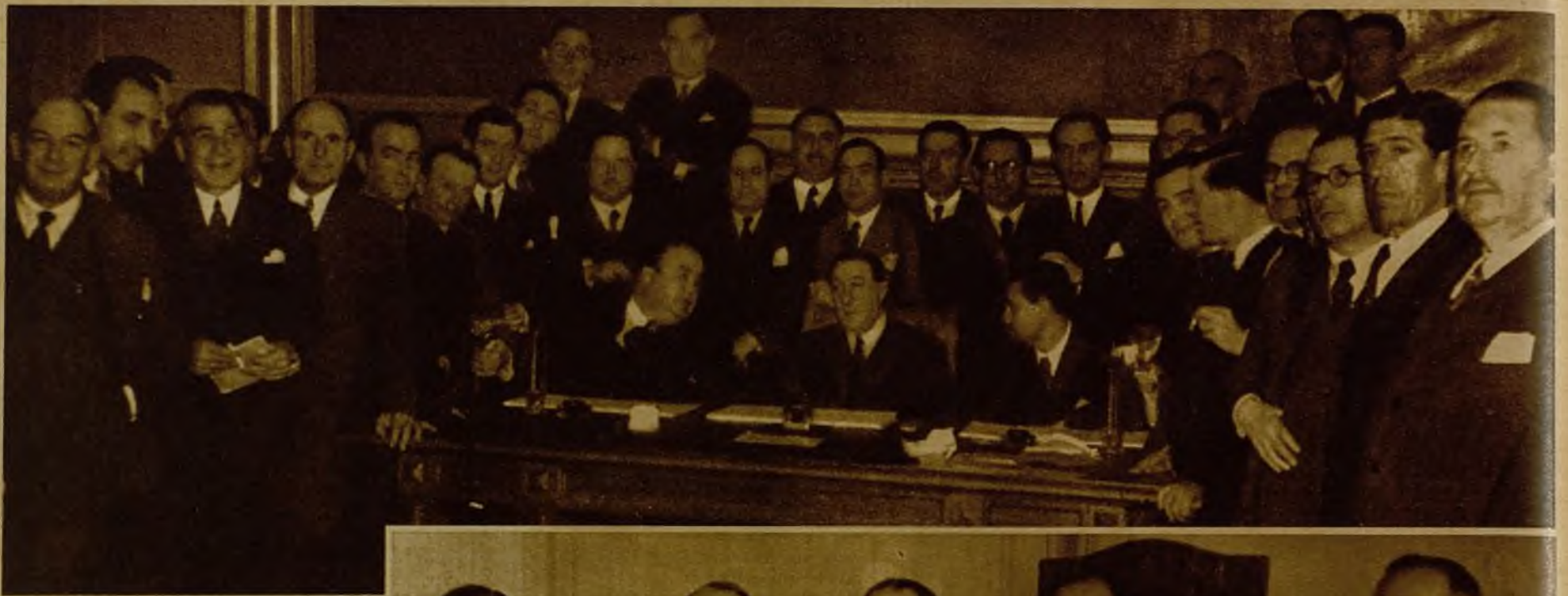
En la mañana de ayer se reunieron conjuntamente en el Congreso las minorías de Izquierda y Unión Republicana, bajo la presidencia del señor Fernández Clérigo. Después de ocuparse de diversos asuntos de trámite, los reunidos trataron del debate sobre el orden público, acordando que ambos grupos parlamentarios, como ministeriales, se atenderán a la pauta que el Gobierno marque. En la foto, un grupo de concurrentes