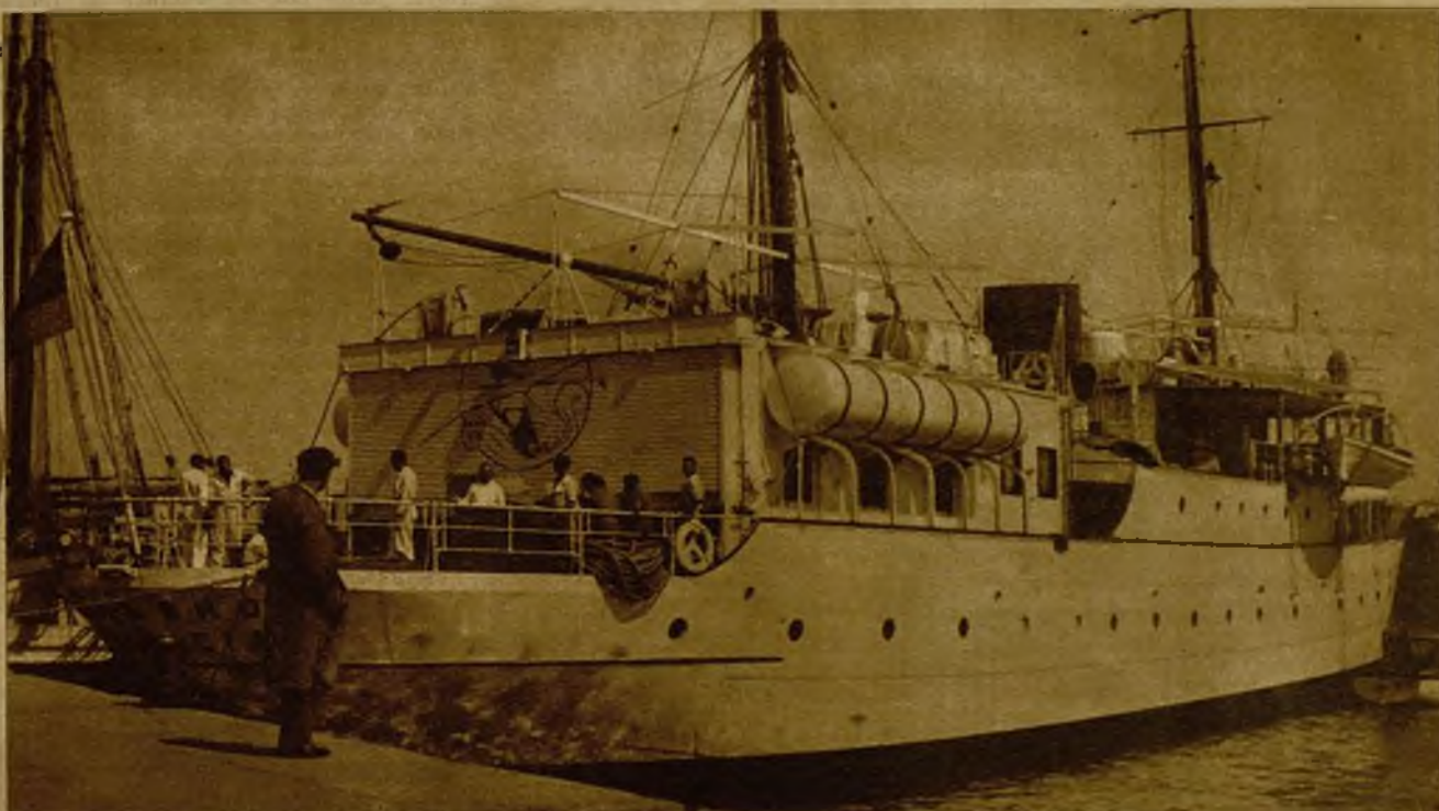
Por acuerdo del Gobierno ha sido disuelto el Patronato para la expedición al Amazonas. He aquí al "Artabro" atracado junto a la escalera principal del puerto de Valencia