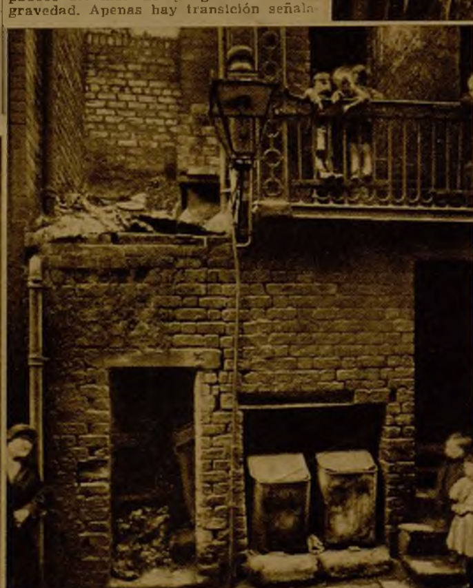
En las calles de los "slums" donde hay tráfico rodado, las madres amarran a sus pequeños para que no se alejen y puedan jugar sin peligro.

Es difícil penetrar en los interiores del calvero, sórdido y mugriento, de Kensington. Para buena muestra elegí este distrito londinense, porque el Royal Borough of Kensington, que se precia de poseer las mejores calles de la ciudad, padece del mal de gangrena en suma gravedad. Apenas hay transición señalada.