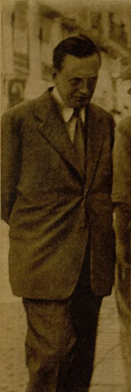
El barón von Thyssen durante su estancia en Gerona, con motivo del accidente sufrido por su esposa. En estos días va a fallarse la demanda de divorcio entre ellos