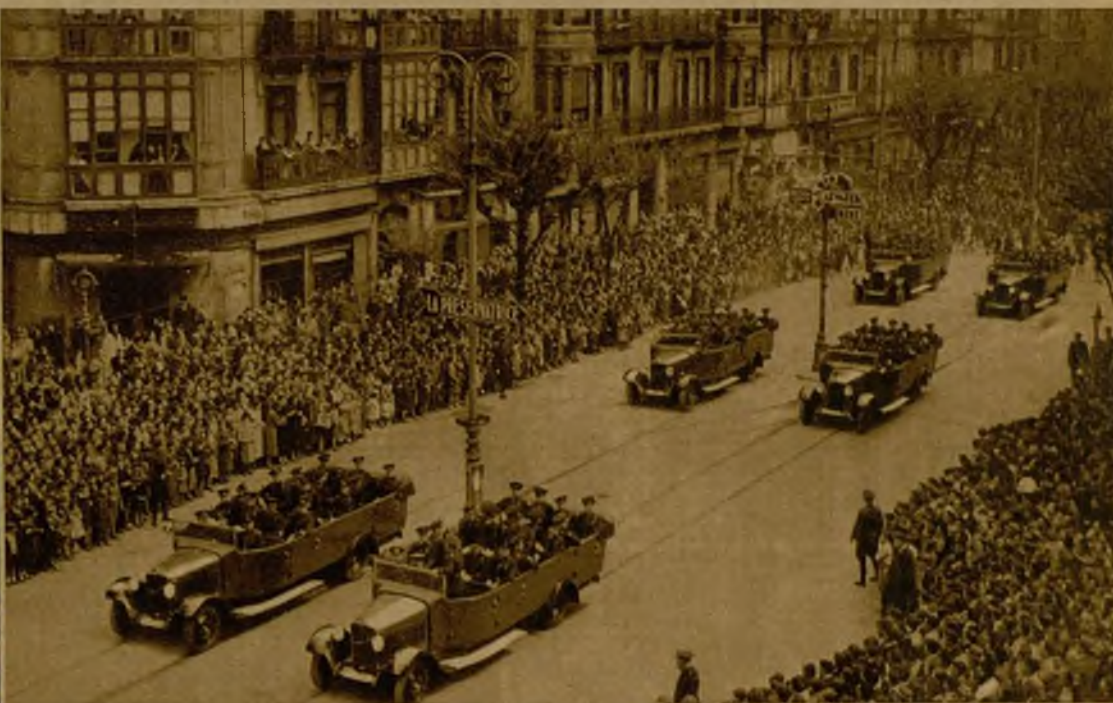
La conmemoración del V aniversario del advenimiento de la República ha revestido en toda España extraordinario entusiasmo y se ha desarrollado con orden completo. He aquí un momento del desfile militar por la Gran Vía, de Bilbao