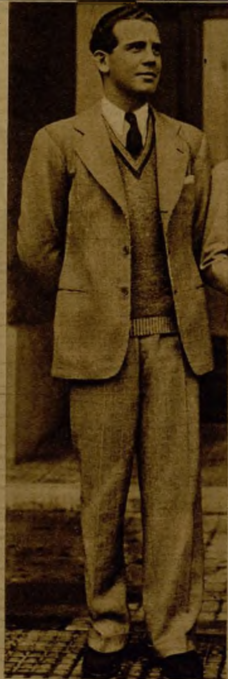
El príncipe Alejo Mdivani, que murió en el accidente de automóvil sufrido en unión de la baronesa de Thyssen en la carretera del Ampurdán