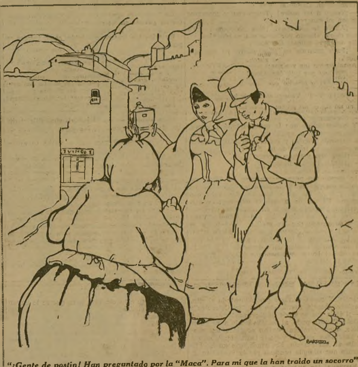
“¡Gente de postín! Han preguntado por la “Maca”. Para mí que la han traído un socorro”

—¡A la horca, amigo! ¡Vaya faena! Un ventajista ese marchoso. ¡Un ventajista! No estoy bebido. Y si lo estoy, a nadie le importa. Dexámenle ustedes las manos a ese pantalón. ¿Qué?