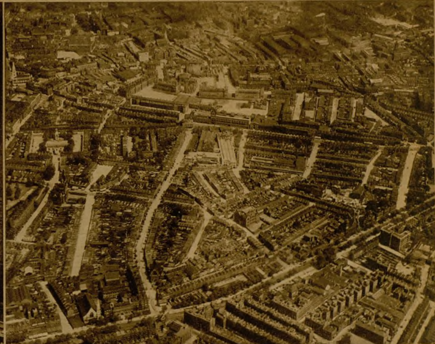
Londres, visto desde un avión, presenta grandes calveros de "slums", como éste que se ve en primer término.

puertas y ventanas para que "jueguen" sin peligro.