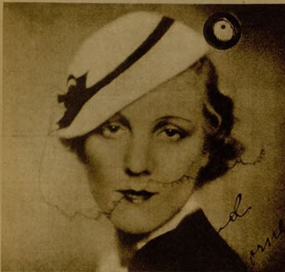
Una fotografía de la baronesa Maud de Thyssen antes del accidente de automóvil que sufrió en la carretera del Ampurdán