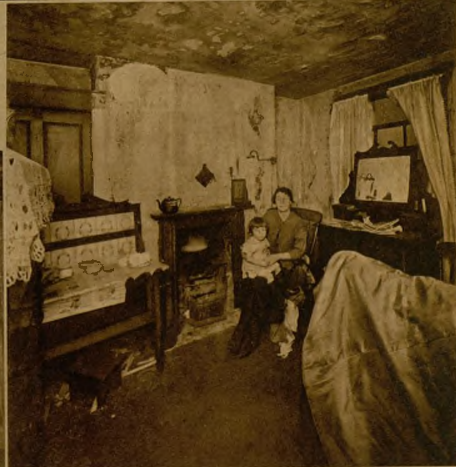
En miserables habitaciones como ésta, sin muebles, roídas por la humedad y pobladas de ratas, viven las familias de los "slums".

¿Para qué marcar más la sordidez del cuadro? Sirva esta colección de fotografías, lograda entre el vivir de los "slums", para dos cosas: para los que en Madrid, en Barcelona y otras grandes