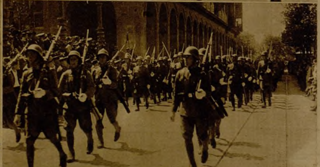
El paso de las tropas de la guarnición de Zaragoza por las calles de la capital aragonesa. Arriba, un momento del brillante desfile de las tropas en Sevilla