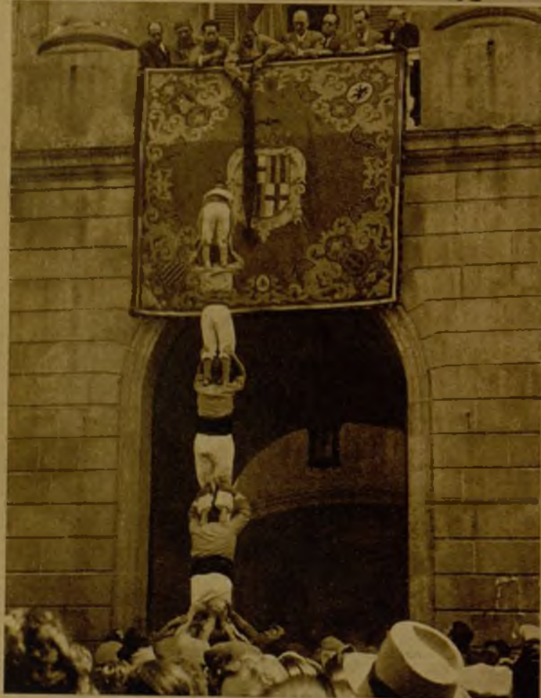
Los "Xiquets de Valls", realizando sus arriesgados ejercicios, en una brillante exhibición que hicieron en Barcelona con motivo del Catorce de Abril