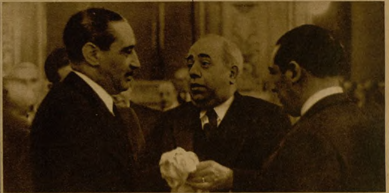
Los pasillos del Congreso estuvieron muy animados durante la tarde de ayer con motivo de la declaración ministerial que había de formular ante las Cortes el jefe del Gobierno y de la proximidad de las elecciones de compromisarios para la designación del Presidente de la República. En la fotografía, los señores Azaña y Maura en una animada conversación