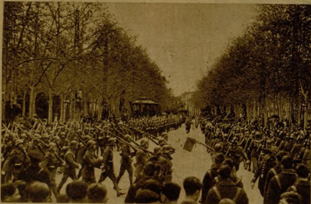
Un aspecto del gran desfile militar celebrado en Granada con motivo del Catorce de Abril. Fuerzas de la guarnición pasan ante la tribuna de las autoridades