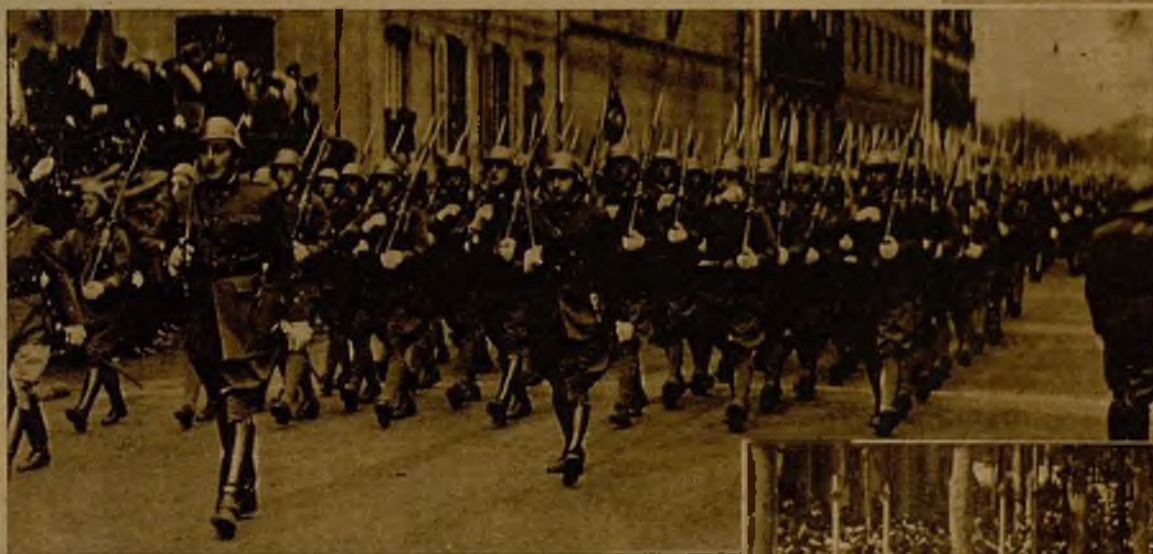
Un momento del brillante desfile de las fuerzas de la guarnición de Pamplona, con motivo de la conmemoración de la República