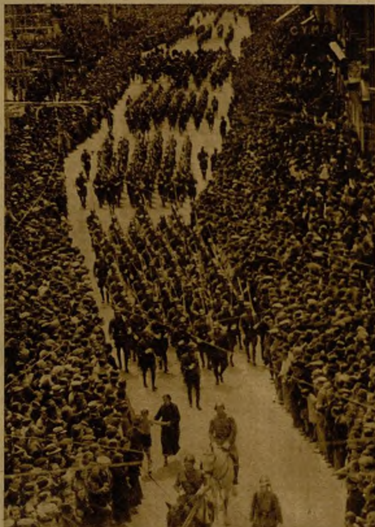
Aspecto que ofrecía la calle Blasco Ibáñez, de Valencia, durante el paso de las tropas con motivo de la fiesta del Catorce de Abril