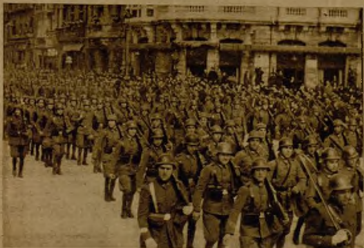
El regimiento de Infantería, número 3, de guarnición en Oviedo, desfilando ante las autoridades de la capital asturiana