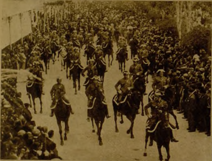
La Guardia Civil, desfilando por las calles de Murcia durante la gran revista militar