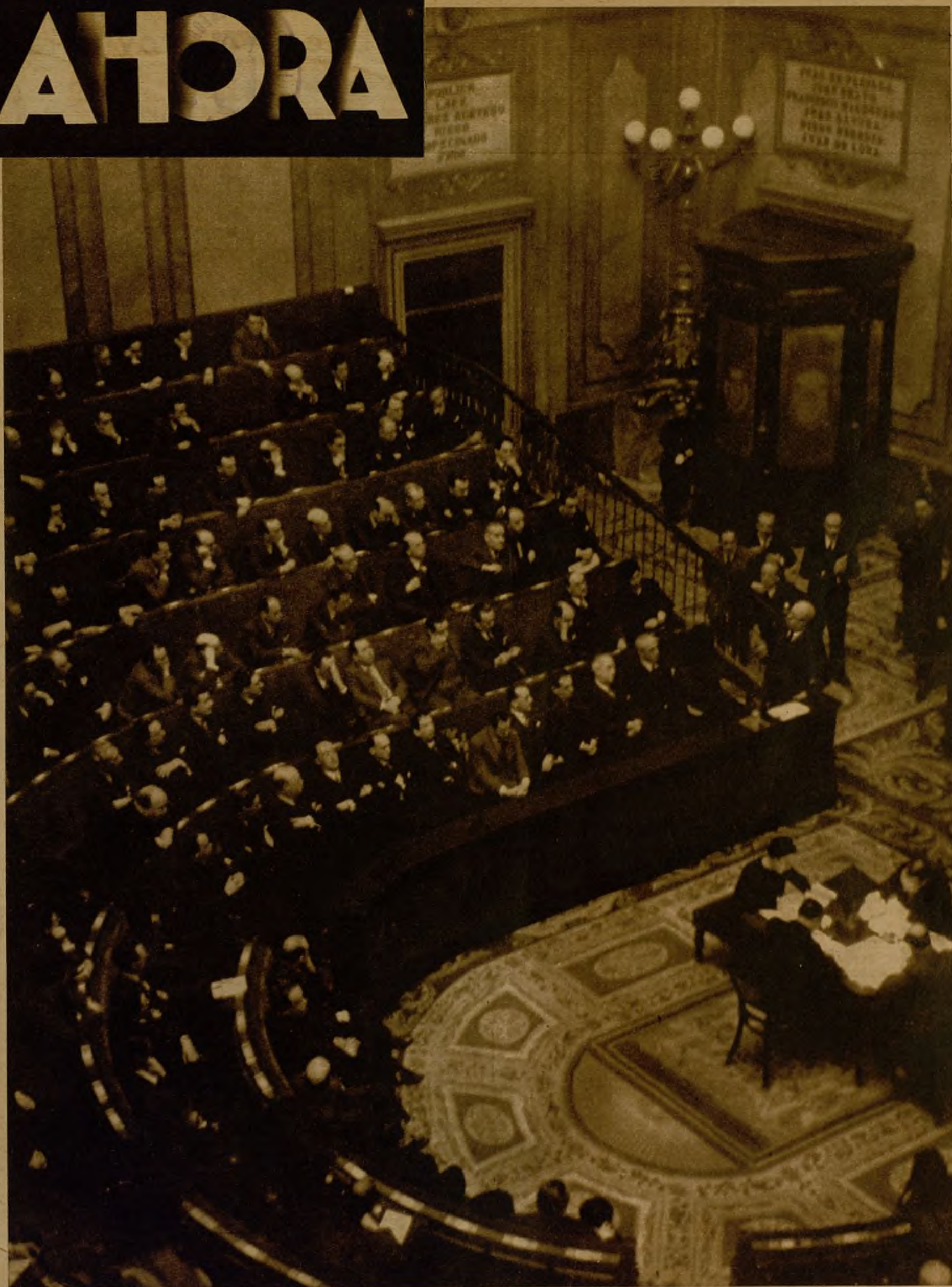
EL PRESIDENTE DEL CONSEJO FORMULA ANTE EL PARLAMENTO LA DECLARACION MINISTERIAL.—En la sesión de Cortes de ayer tarde el señor Azaña pronunció el discurso de declaración ministerial, exponiendo el programa del Gobierno y haciendo relación de los proyectos que próximamente han de ser sometidos al conocimiento de la Cámara. El presidente del Consejo durante su discurso