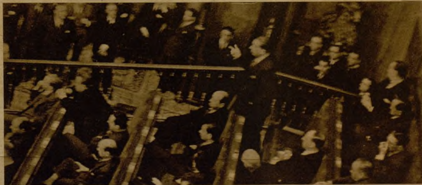
El jefe de la minoría de Renovación Española durante el discurso de oposición a la declaración ministerial formulada por el señor Azaña