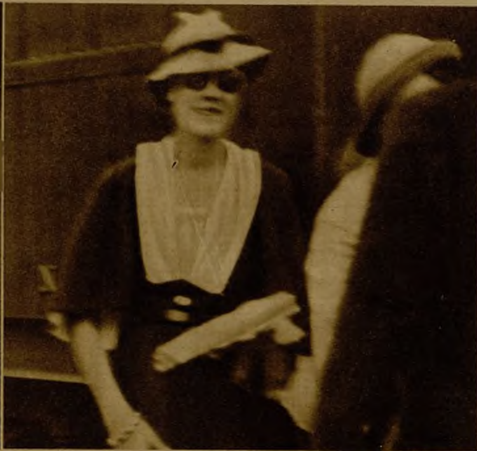
La baronesa Thyssen en la estación de Gerona, presta a tomar el tren para París, después de curada de las gravísimas lesiones que sufrió en el accidente