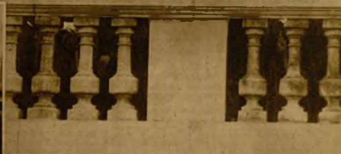
Las autoridades de San Sebastián, presenciando el paso de las fuerzas, que tuvo lugar con riguroso orden y ante una entusiastada multitud que ovacionó y vitoreó largamente a las tropas