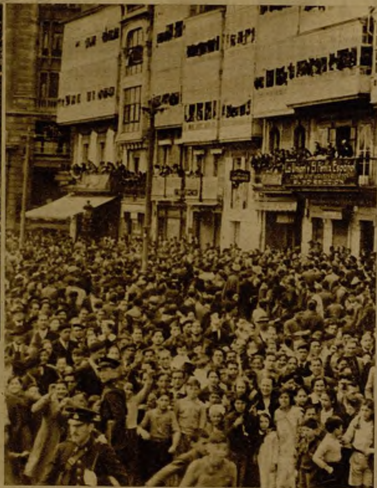
La multitud congregada en las calles de La Coruña por las que había de efectuarse el desfile de las tropas