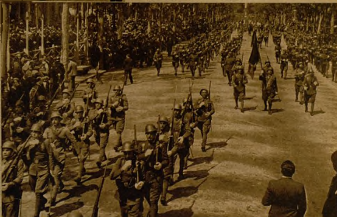
Aspecto que ofrecía el paseo de Gracia, de Barcelona, durante el desfile de las tropas con motivo del V aniversario de la República