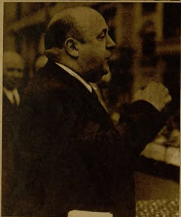
El ex ministro socialista y diputado a Cortes por Vizcaya don Indalecio Prieto durante el discurso que pronunció en el acto de homenaje a Maciá