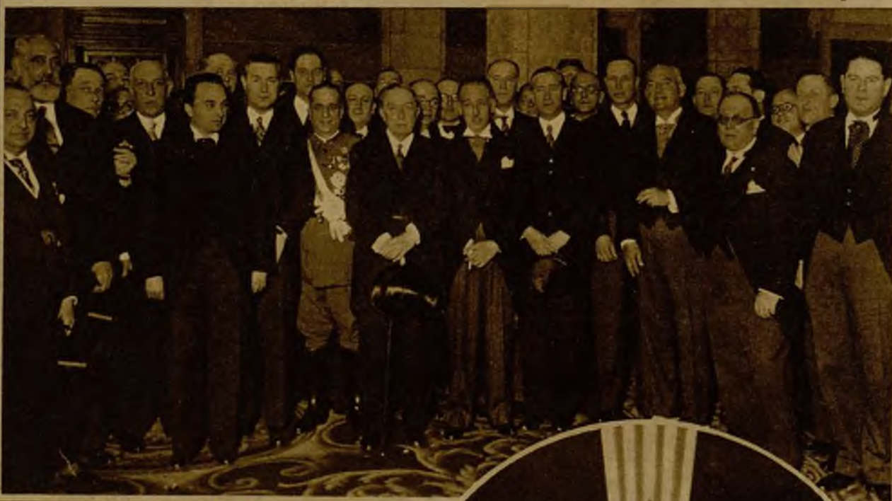
Concurrerán a la recepción oficial celebrada en el Palacio de la Generalidad, a la que concurrirán, para cumplimentar al señor Companys, los elementos oficiales y personalidades del Cuerpo diplomático