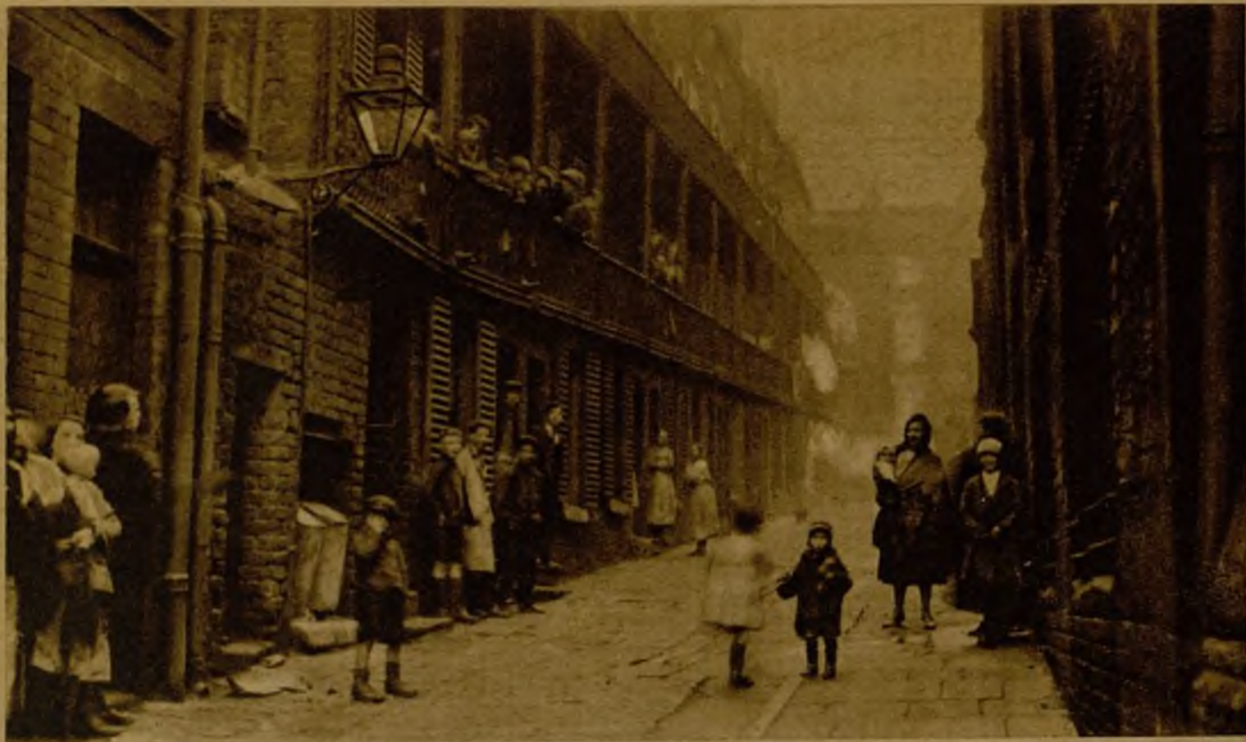
He aquí el característico aspecto de una calle de un "slum" londinense. Cada uno de los pisos de estas viejas casas tiene una sola habitación, que es al mismo tiempo, cocina, dormitorio y comedor.

Londres, visto desde la altura, con buenos gemelos, como lo he visto yo en una clara mañana de junio, al cruzar de Oeste a Oriente en un autogiro, es como un bafo de tenebrosos, en el que se ven nubes de depresiones borrosas, a modo de trozos de piel de elefante marcada por profundas arrugas. Se nota que estos calveros son muy abundantes y que se hallan diseminados por toda la inmensa superficie del plano de la ciudad, dominado así en perspectiva. Por los alrededores del Palacio de Buckingham, al lado de la magnífica barriada de soberbias construcciones, entre las que se destacan la Abadía de Westminster y el Parlamento, pegadas a las casernas señoriales edificadas entre grandes espaldas abiertas plantados de frondosos árboles, por donde se encuentran las Embajadas y las mansiones de los potentados; a dos pasos de la residencia del lord mayor de la City, lo mismo que en las barriadas fabriles que bordean el Támesis, por el lado del puerto; al Norte, al Sur, al Este y al Oeste del mar de viviendas, se ven las manchas de gangrena, grandes algunas como pueblos y aun ciudades de cierta importancia, en las que se hacían los centenares de miles de seres humanos que comparten su miserable vivir con las ratas, las chinches y la mugre.