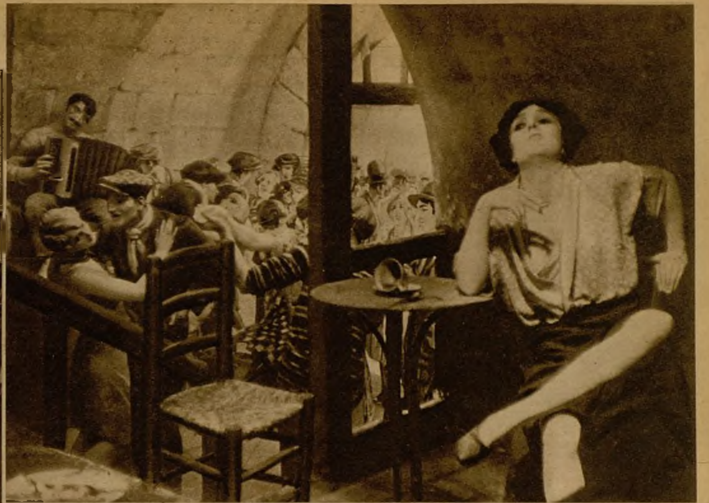
Antros montmartrés de verdaderos apaches, que fué moda frecuentar por la gente del gran mundo

No había más remedio que obedecer; miré con cierto recelo al collar de perlas de la condesa, a sus broches de brillantes. "No hay cuidado", pensé. Si se trata de un extranjero cualquiera, de los que llenan este tugurio, la cosa sería peligrosa; pero en los míos tengo confian-