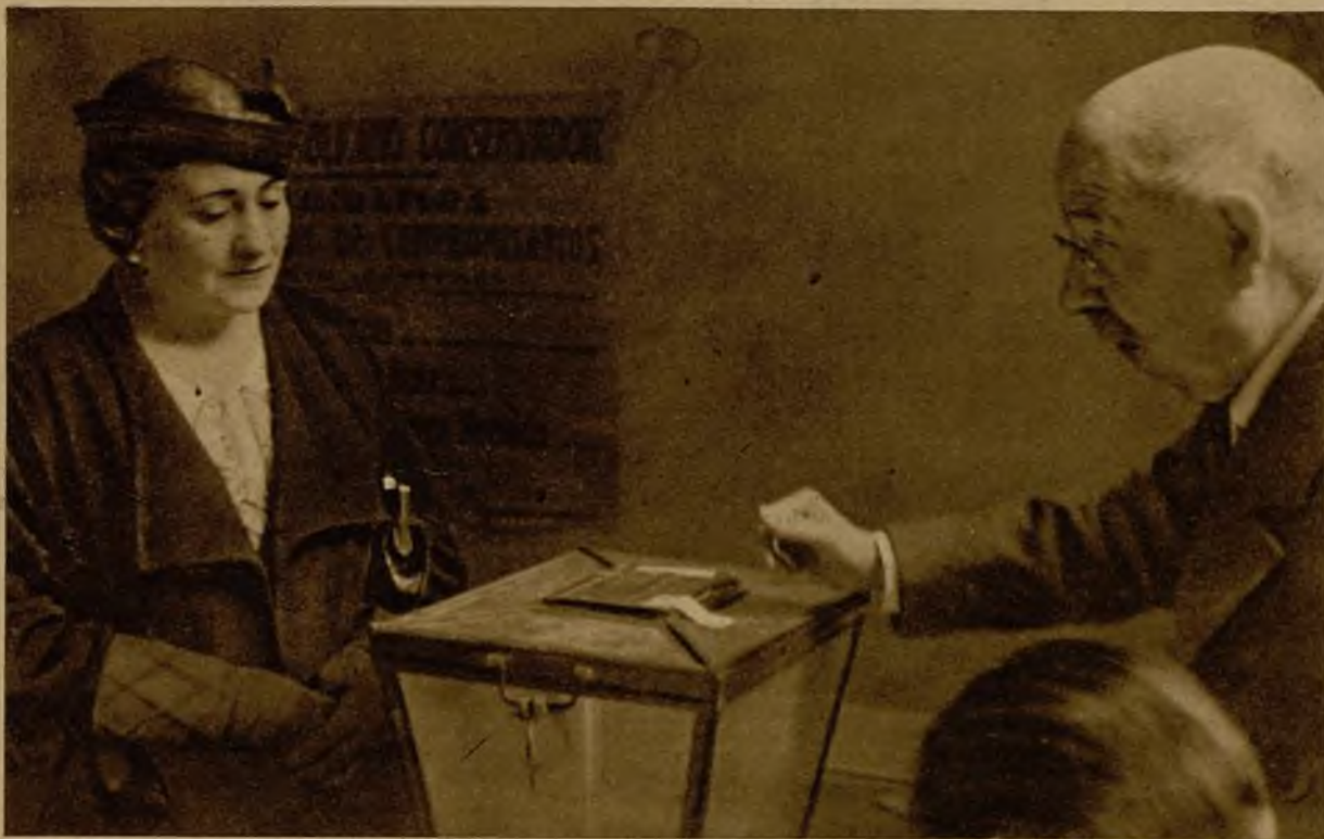
La esposa del Presidente de la República, en el momento de emitir su voto para la elección de compromisarios