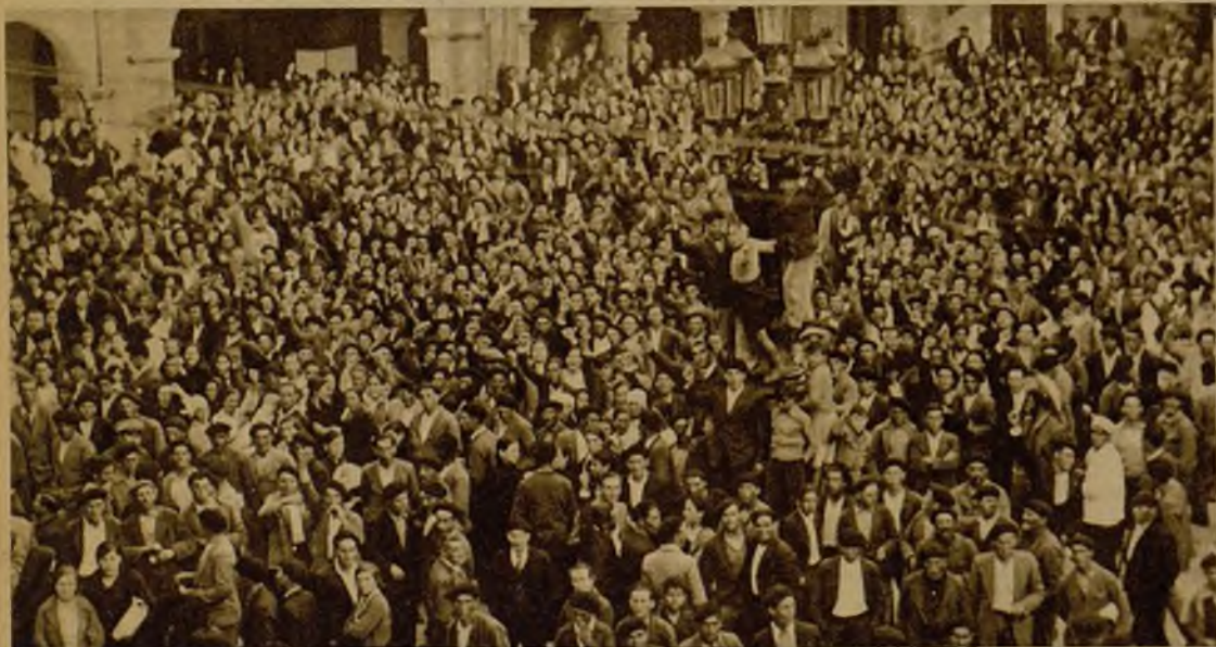
La enorme abundancia de sardina en Vigo ha ocasionado tal depreciación, que el kilo se paga en el mercado a siete céntimos. Los pescadores se han manifestado ante el Ayuntamiento pidiendo se recaben del Gobierno medidas en su ayuda