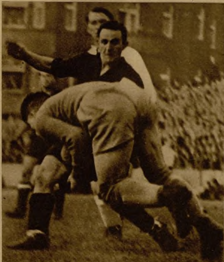
Una internada de Gorostiza, que trata de impedir la parada de Planitka

(INFORMACION EXCLUSIVA TRANSMITIDA POR LA LINEA AEREA DEUTSCHE LUFT-HANSA)