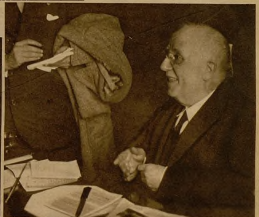
El presidente del Tribunal Supremo dando a los periodistas la referencia de la reunión del Pleno, en que se acordó aceptar la querrela contra dos de los magistrados que redactaron la sentencia en el proceso Sirval

El juez especial, señor Lafarga y Crespo, hablando con otro de los magistrados que tomaron parte en la reunión del Pleno, después de acordada su designación