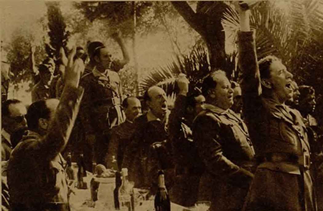
Oficiales de la Legión de la guarnición de Melilla vitoreando entusiastamente a la República después del acto de colocación de la primera piedra del edificio para escuelas y viviendas de familias de legionarios

Escuelas y viviendas para familiares de legionarios