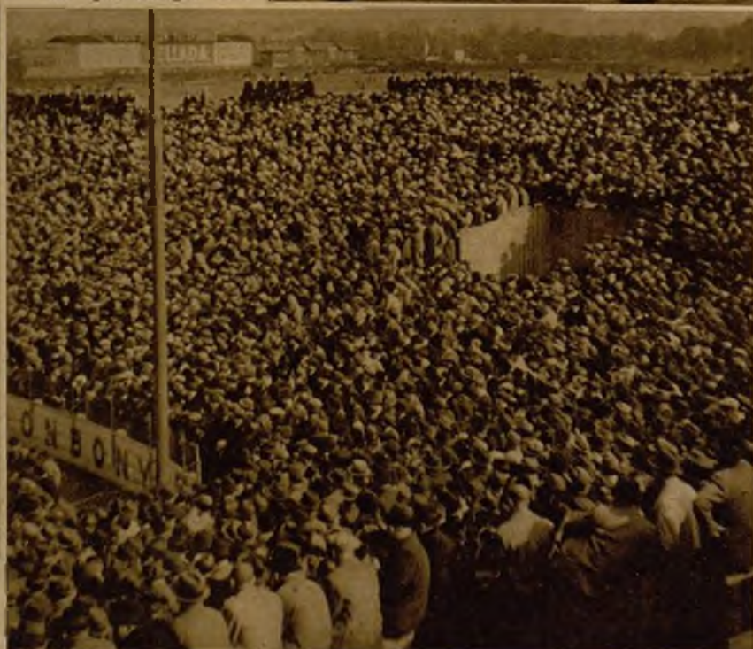
Treinta mil personas asistieron al decepcionante triunfo del equipo checo. He aquí un sector del campo del Sparta, lleno a reventar