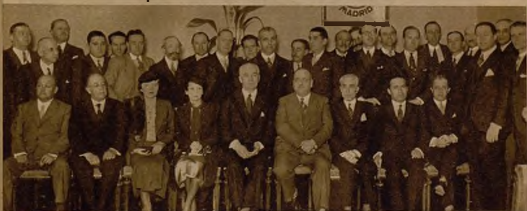
Grupo de concurrentes al banquete ofrecido por los corresponsales de la Prensa extranjera en Madrid al ministro de Estado, don Augusto Barcia

Un banquete de los corresponsales de prensa extranjera al ministro de Estado