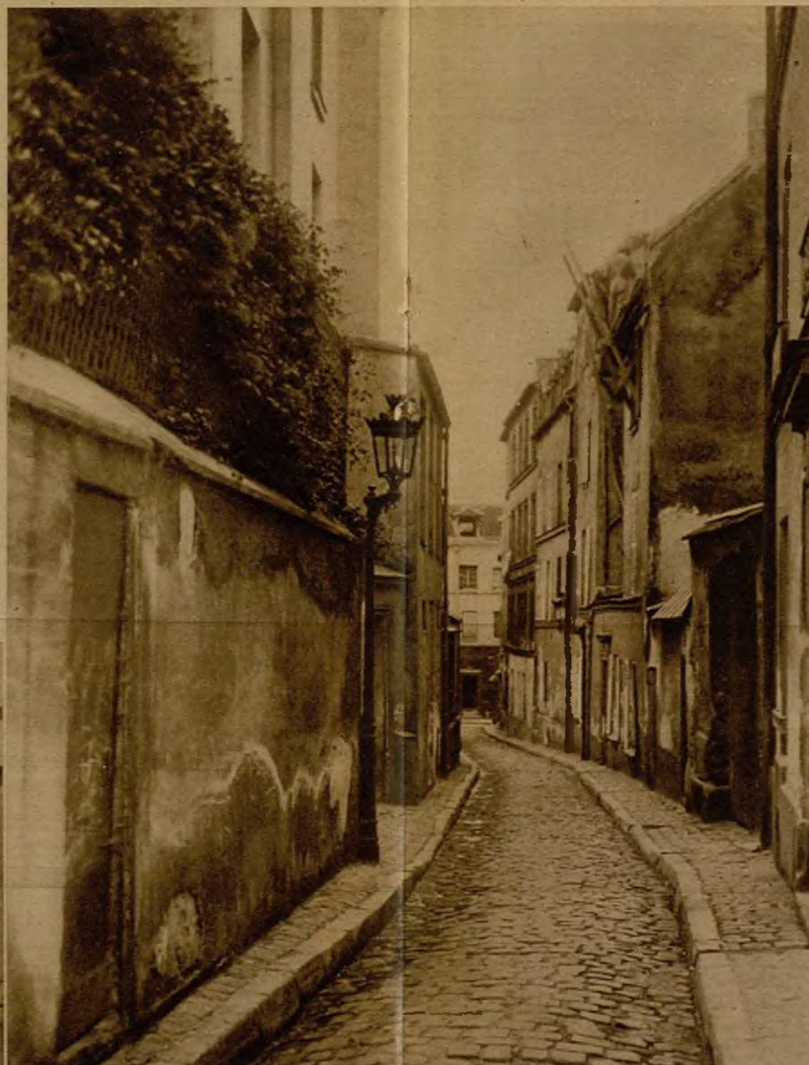
Una calleja del París tenebroso, lugar de residencia de maleantes y gente de vida anómala y crapulosa

El "Madruga" había llegado a París para vender botijos; pero los franceses, poco civilizados, no quisieron comprender las ventajas supremas del agua contenida en la alcarraza porosa, entre otras razones, porque ellos beben poquísimos ese líquido, y los que lo trincan usan agua mineral. Fué un fracaso que le obligó a vender el burro, tirar al Sena la mercancía y lanzarse él a nado a través del piélago parisién. El "Noy" era limpiabotas. En Barcelona hay demasia-