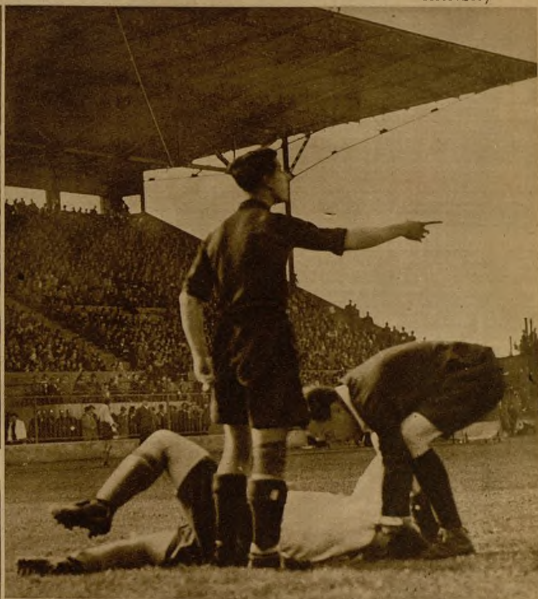
Esta fué la jugada que dió lugar al "penalty" que había de significar el único "goal" contra España. El árbitro atiende al delantero checo—que hace un poco de "drama"—, mientras Zabalo toma las primeras disposiciones defensivas