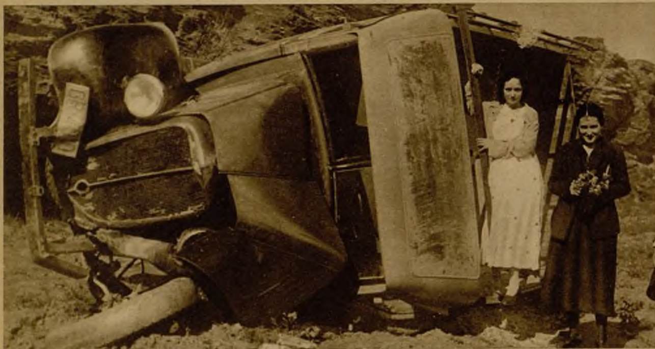
Estado en que quedó una camioneta de la matrícula de Granada que en la carretera de Almería cayó por un terraplén, resultando gravemente heridos sus dos ocupantes

Cae una camioneta por un terraplén y resultan gravemente heridos sus dos ocupantes