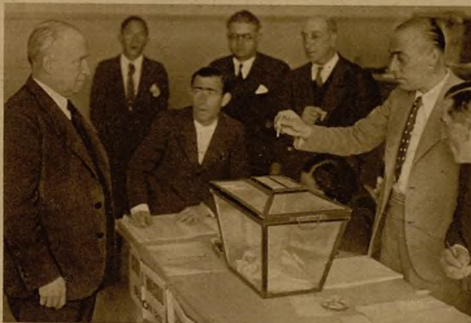
El jefe socialista y diputado a Cortes por Madrid don Francisco Largo Caballero, ante la mesa electoral donde depositó su sufragio