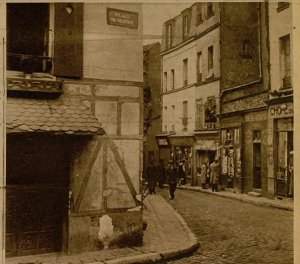
Los barrios bajos tienen, cuando más, una calle de esta amplitud, que desmocha a la pequeña place du Terre

Poco tiempo después supe que la ingenua poetisa adolescía. Tendida en su lecho, frente a la ventana, con los visillos corridos, era una divina estatuita de cera traslúcida, sin más vida que la concentrada en los ojos, donde navegaban esquifes de ensueño, y en la voz