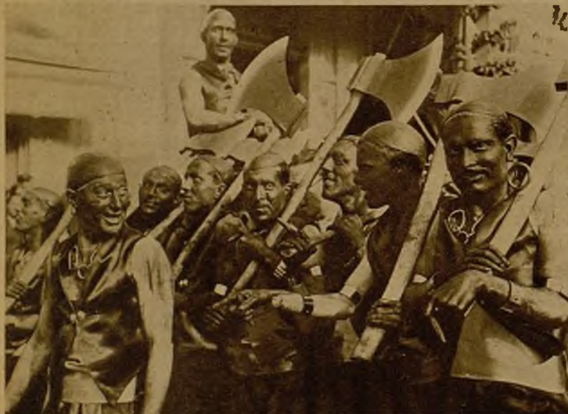
En Alcoy se han celebrado con gran lucimiento las típicas fiestas de "moros y cristianos". He aquí a un "escuadrón" de negros que participan en el desfile

Desfiles de "moros y cristianos" en Alcoy