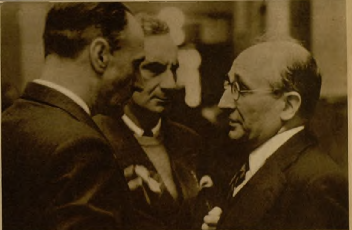
Don Salvador de Madariaga en coloquio con otros diputados, durante la animada tarde "de pasillos" de ayer en el Parlamento.