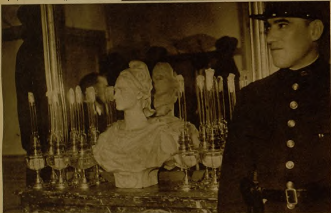
En previsión de una avería en el alumbrado eléctrico, se guardaban en el Ministerio del Interior estos quinqués de petróleo, para uso de los periodistas

La situación electoral, tal como se presenta en el intervalo que media entre las dos vueltas del escrutinio, no aparece muy clara. En este intermedio se redoblan los forcejeos de los candidatos y se intensifica la propaganda de los partidos para provocar reacciones favorables en los electores. Lo que parece probable es que al se observa rigurosamente la disciplina del bloque de izquierdas, el Frente Popular logrará gran número de actas. Sin embargo, la fracción numérica de izquierdas y derechas no sufrirá variación notable en relación con la Cámara anterior. En cambio el reparto de los votos al imprimirá distinta fisonomía al Parlamento, pues los comunistas, por ejemplo, según cálculo de "Le Temps", pueden duplicar sus puestos, los socialistas aumentar de 97 a 121, y en cambio parece que perderán actas los socialistas independientes y los radicales socialistas. Sin embargo, los partidos de centro y derecha, coaligados frente a las izquierdas, sólo han perdido en todo el país 180.000 votos, número realmente poco importante en un total de 4.200.000. La fotografía muestra un aspecto de la plaza parisina de la Opera mientras la multitud escuchaba los datos radiados del curso de la elección