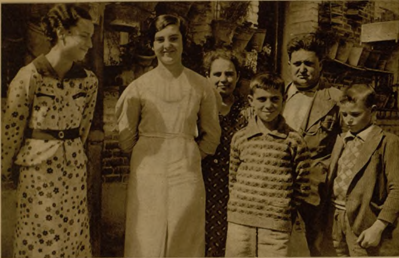
El enfermero con sus familiares