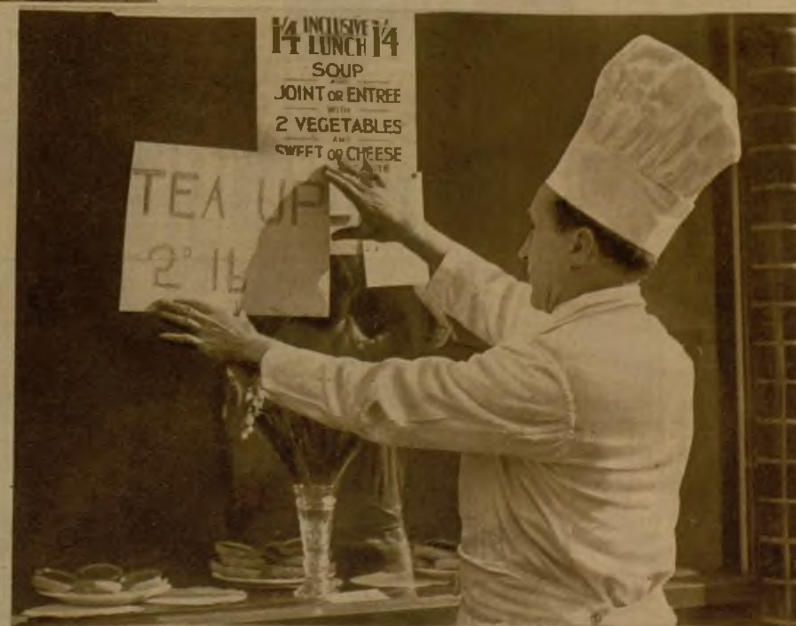
El "chef" de un establecimiento de Londres coloca en la fachada el anuncio del nuevo impuesto sobre el té.

Rico es John Bull, en verdad; pero enormes son también sus gastos: de la Gran Guerra salió con una deuda nacional de—¡aquí al que hay que hacer la gran multiplicación!—ocho mil millones de libras esterlinas; a ver: ocho por seis, cuarenta y ocho; tres por ocho, veinticuatro, y cuatro, total... doscientos ochenta y ocho mil millones de pesetas, y para ir saliendo de esos astrónomos lo primero que hace John Bull es pagar todos los años cerca de nueve mil millones de pesetas, o sea casi la tercera parte de sus rentas. En educación, sanidad, seguros, obras pías, beneficencia, viudedad y otros gastos, que le cuestan unos dos mil millones de pesetas al año, pensiones y ayudas económicas a las municipalidades en determinadas causas, se gasta este millonario de miles de millones casi catorce mil de éstas. El defender por mar, tierra y aire toda esta fortuna le cuesta ya ahora mucho más que el año pasado, y le irá costando más cada año, hasta que pasen los nubarrones que se ciernen sobre el Rin y sobre el lago Tana, o hasta que tenga que ganárselo casi todo, como en 1914, para no perderlo todo, al estallar la tempestad. Los navíos de guerra, los tanques, las aeroplanas y otras cosas por el estilo le van a costar de momento cinco mil millones de pesetas, o sea unos dos mil millones más que el año pasado.