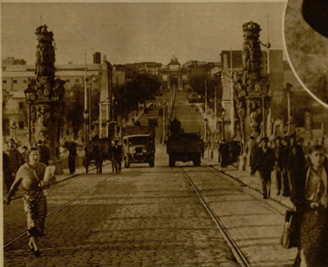
Aspecto actual del puente de Toledo, cuyas obras de reparación van a ser acometidas en breve, y en las que hallarán colocación numerosos obreros