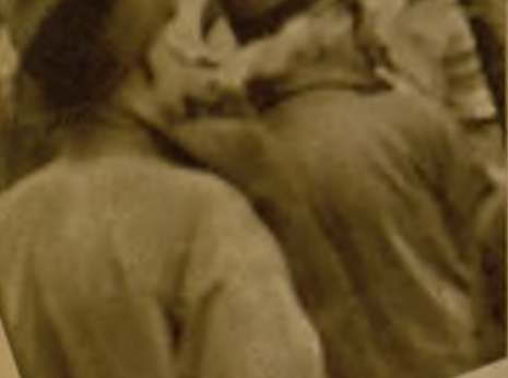
He aquí al señor Neville Chamberlain, acompañado de su esposa, al salir de Downing Street, 10, con dirección a la Cámara de los Comunes.