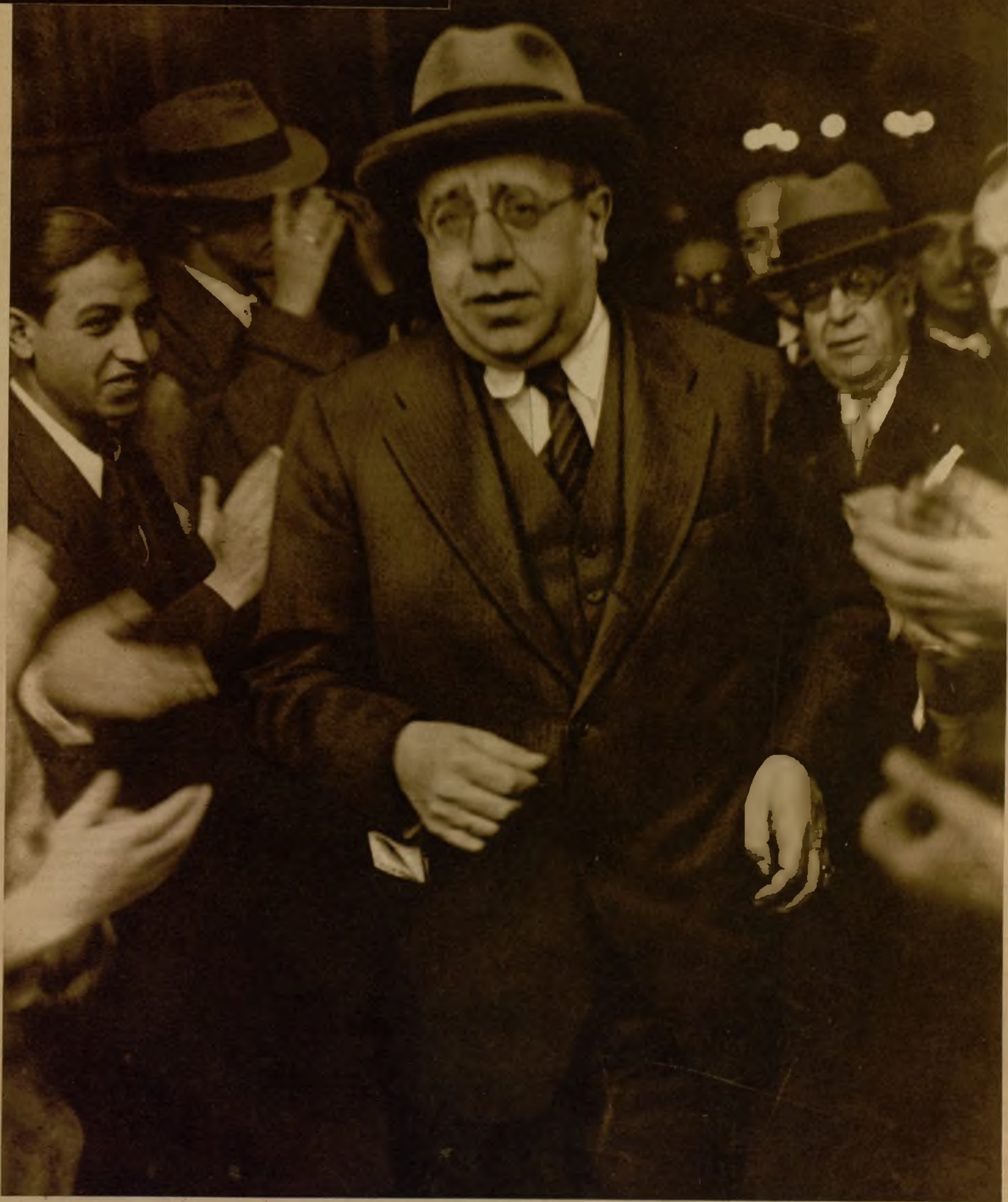
LA DESIGNACION DEL CANDIDATO PARA LA PRESIDENCIA DE LA REPUBLICA.—La nota de mayor interés político en el día de ayer fué la reunión del Congreso Nacional de Izquierda Republicana para tratar de la designación de candidato a la Jefatura del Estado. No se tomó acuerdo, dilatándose la resolución para hoy. Parece seguro, sin embargo, que el señor Azaña, que aquí aparece ovacionado por sus correligionarios al salir de la Asamblea, será la persona indicada por los partidos del Frente Popular para la primera magistratura de la nación