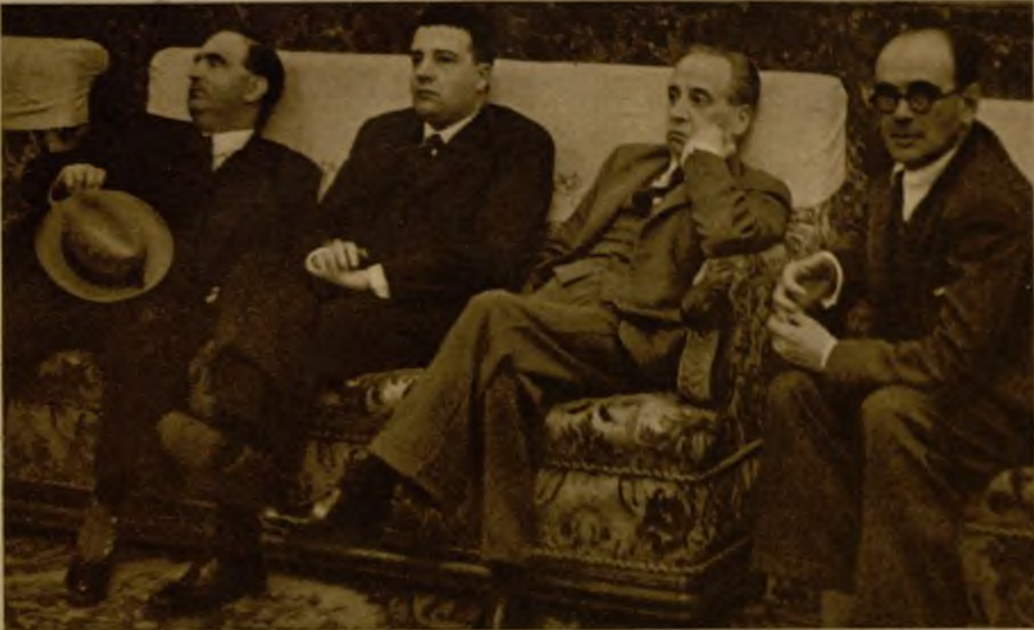
Don Alvaro de Albornoz, cuyo nombre se ha barajado reiteradamente entre los de probables candidatos a la Presidencia de la República, espera filosóficamente el curso de los acontecimientos

La actualidad y el interés político radican casi exclusivamente acerca de la designación de candidato a Jefe del Estado