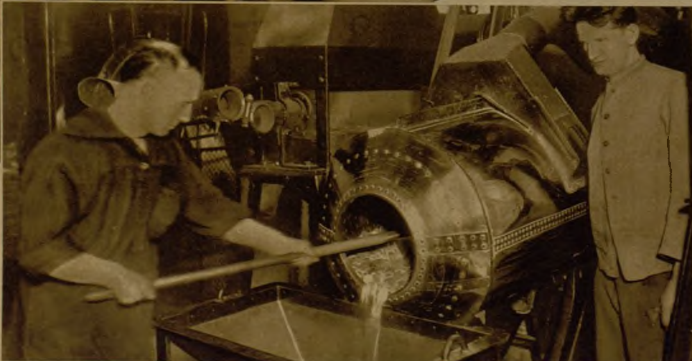
Libras esterlinas—tesoro de John Bull— a punto de quedar listas para las talegas en que se almacenarán a buen recaudo.