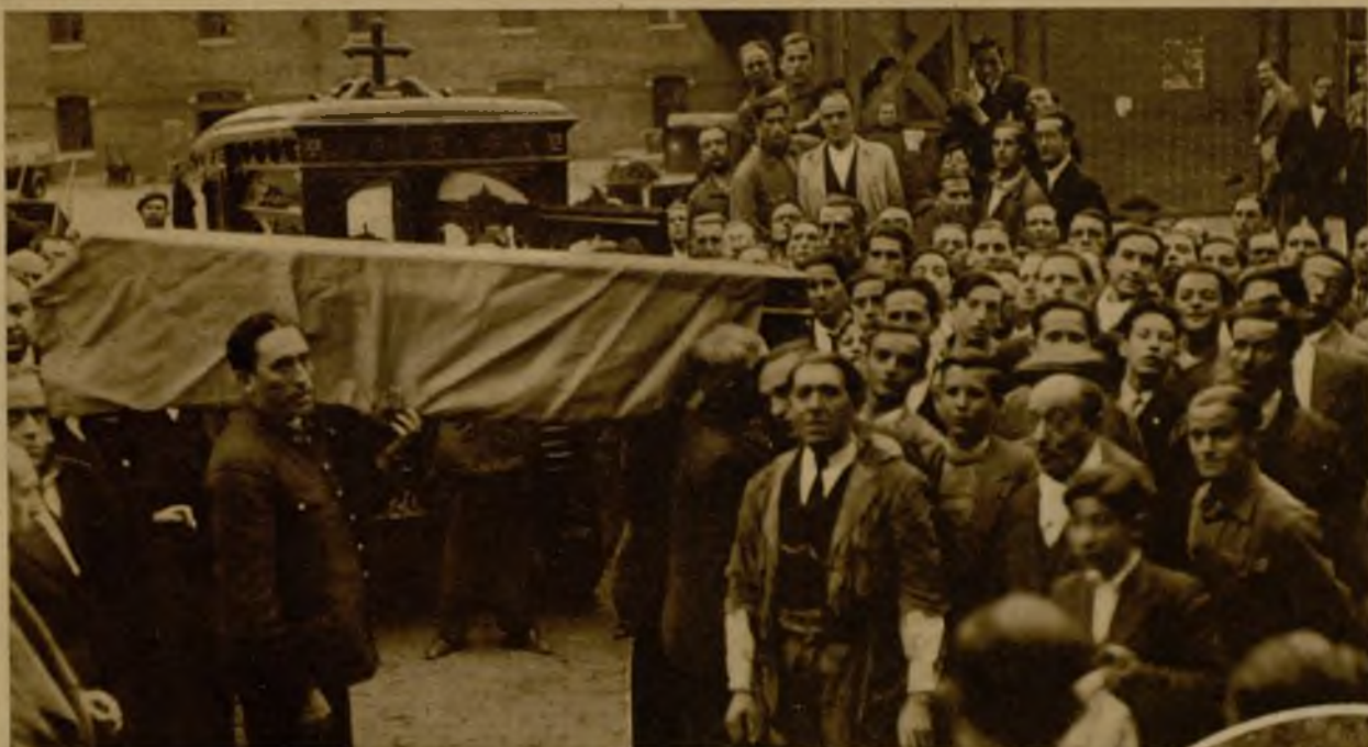
Momento de sacar el féretro que contiene los restos del que fué ilustre escritor y periodista Eugenio Noel, llegados a Madrid procedentes de Barcelona

Aparece en un pozo el cadáver de un hombre