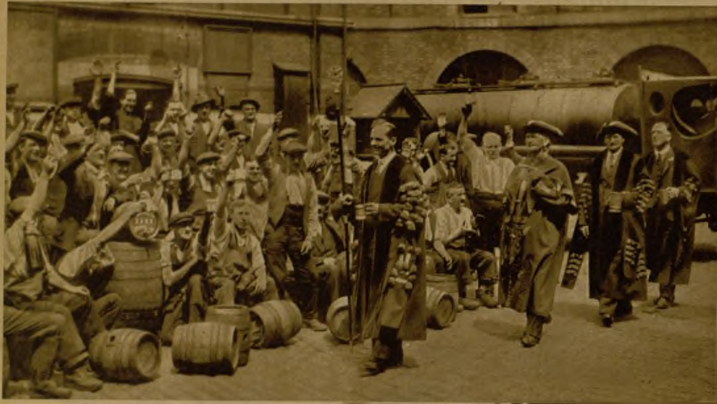
Todos los años, desde hace siglos, se presentan en las fábricas de cerveza estas pintorescas autoridades para destapar "el primer barril".—(Fotos Ortiz, Keystone y Diaz Casariego)