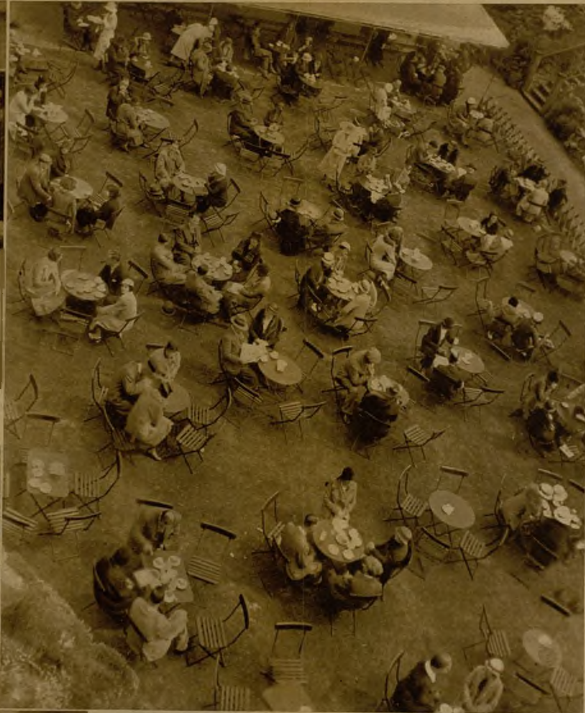
En las cuentas de este año ha aumentado John Bull dos peniques de derechos por libra de té. Con el té que bebe Londres cada veinticuatro horas se podrían llenar hasta los bordes un par de plazas de toros.