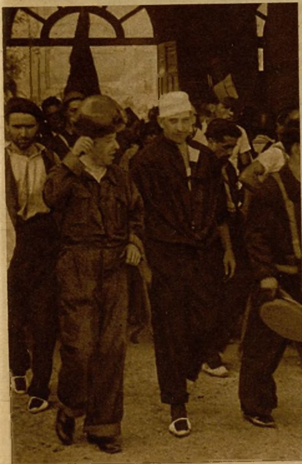
Voluntarios populares saliendo de uno de los cuarteles para tomar los camiones que les han de conducir al frente