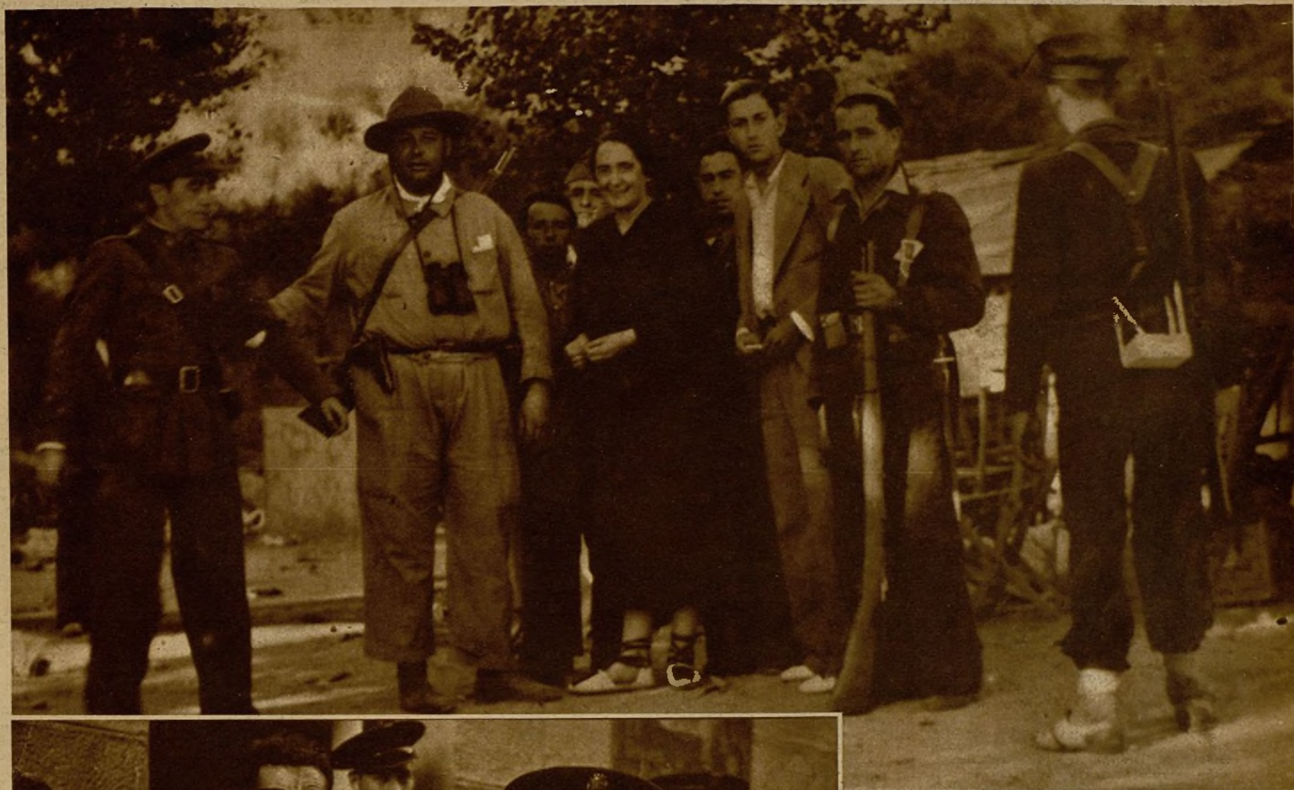
La diputada comunista Dolores Ibarruri "La Pasionaria", que visita a diario los frentes de combate, con varios milicianos y soldados