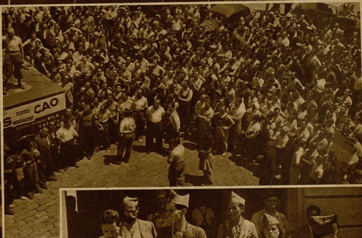
Grupos de milicianos de la capital de Cataluña escuchan la alocución de un compañero, durante los preparativos de marcha