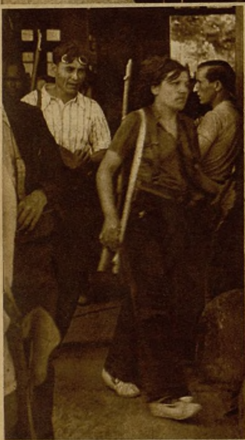
Una joven miliciana, en marcha para el frente de combate, se separa de sus compañeros para posar ante el objetivo