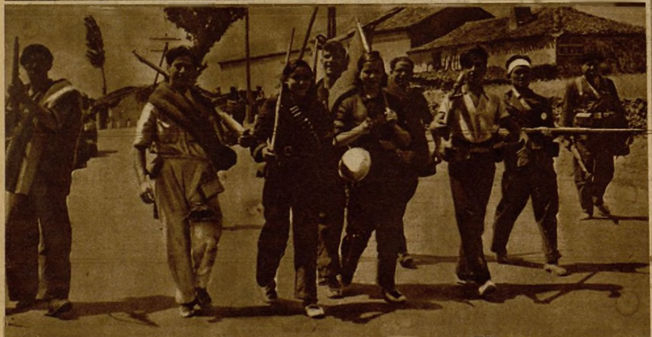
Milicianas, con un grupo de compañeros, en marcha hacia el frente