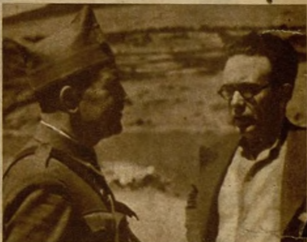
El jefe de la columna militar de una presa del Lozoya explica a uno de nuestros redactores cómo custodian las fuerzas cincuenta millones de litros de agua para los madrileños