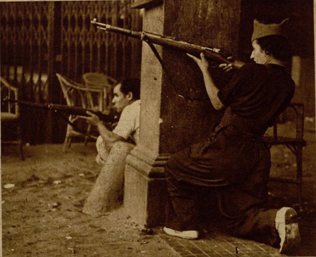
Joven voluntaria parapetada para disparar contra los facciosos