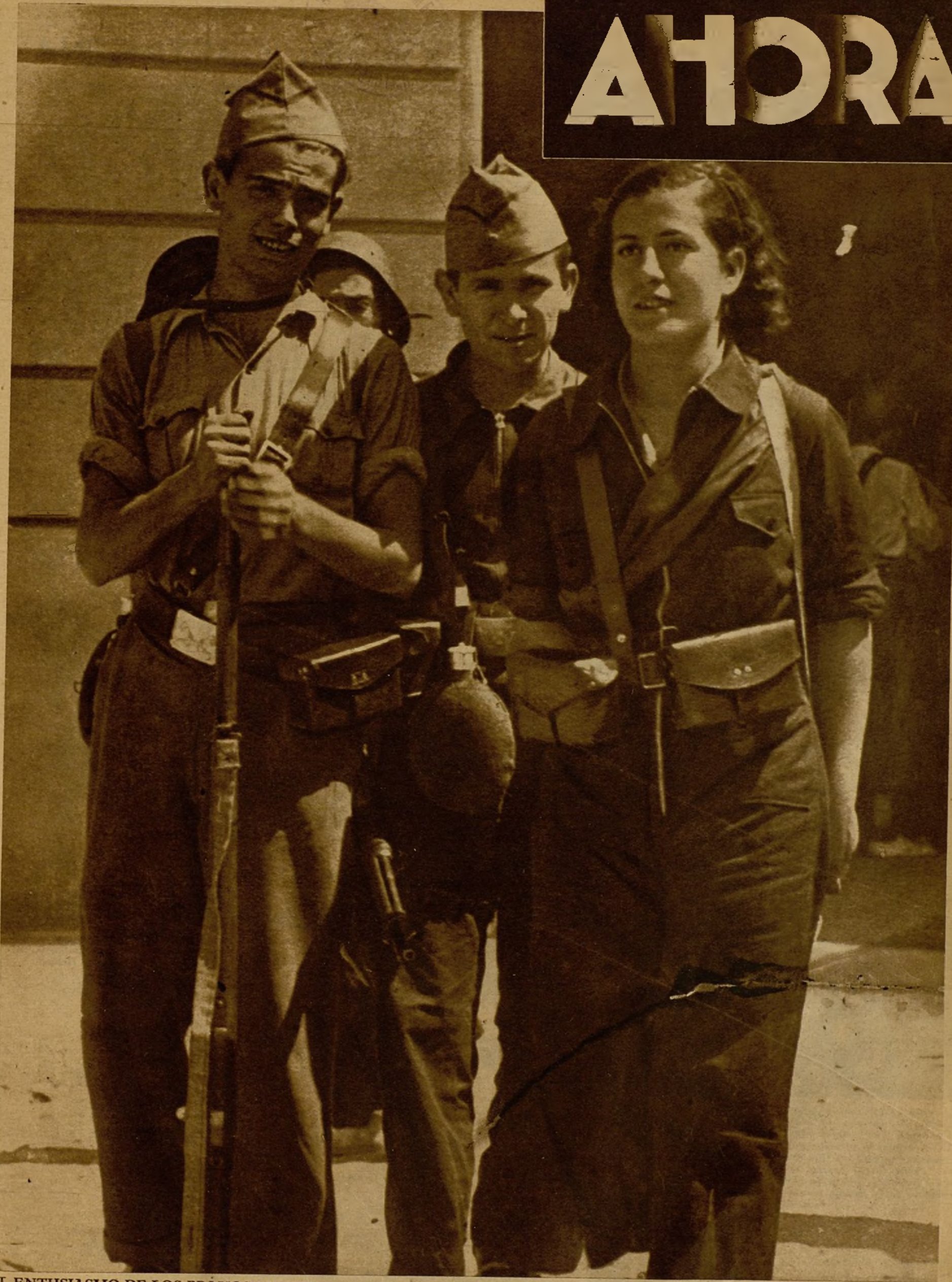
EL ENTUSIASMO DE LOS BRAVOS MILICIANOS QUE MARCHAN A LOS FRENTE DE COMBATE.—De todos los lugares de España, con vibrante y unánime fervor republicano salen fuertes columnas de voluntarios populares para combatir a los insurrectos. De ellas forman parte valientes muchachas, que, como ésta que aparece en la foto, no limitan su acción entusiasta al auxilio de los luchadores, sino que toman decidida- Ayuntamiento de Madrid