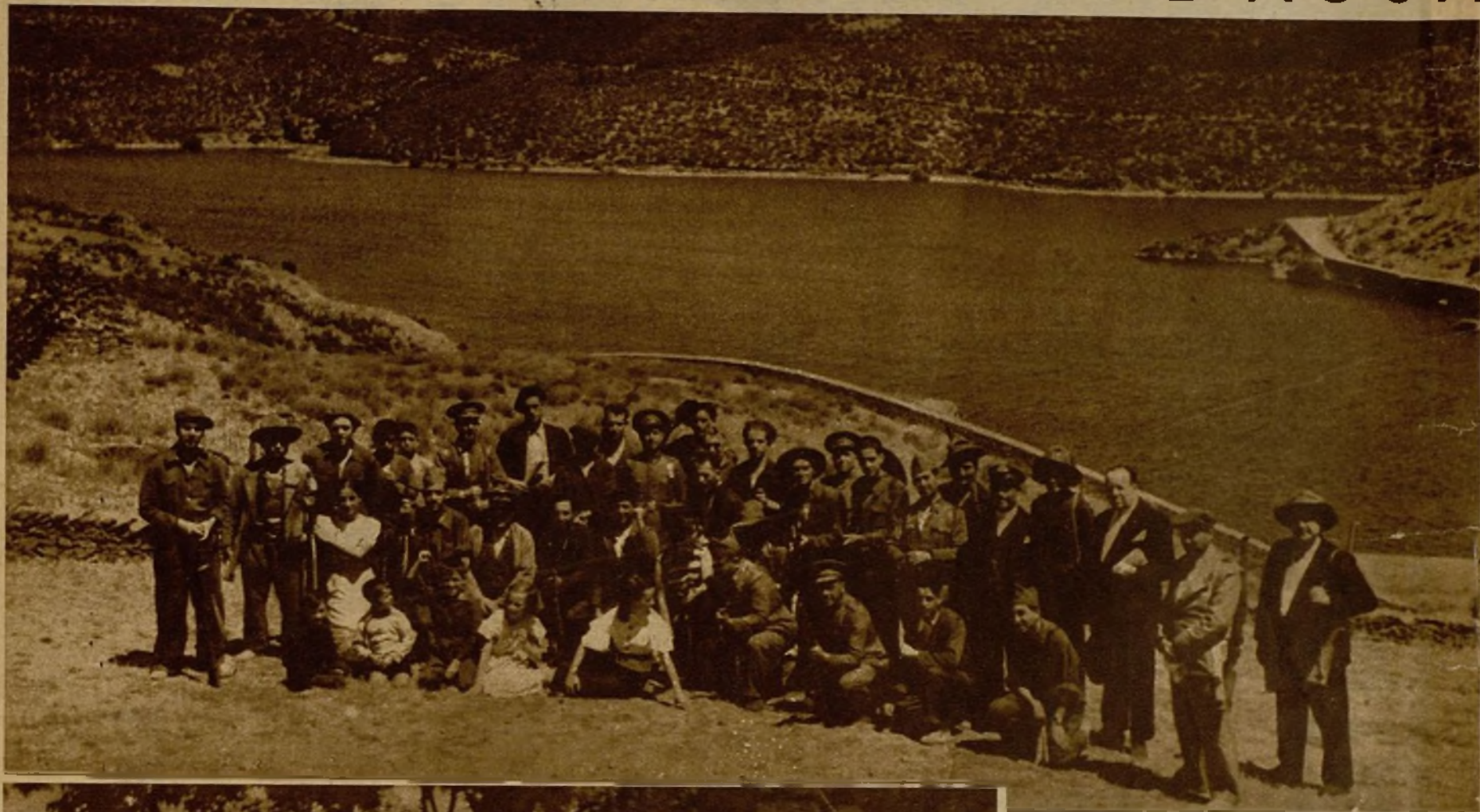
El abastecimiento de Madrid, no ya normal, sino extraordinariamente abundante, está asegurado en absoluto. Además, para evitar cualquier contingencia custodian los embalses de los canales del Lozoya fuerzas del Gobierno y milicias populares. He aquí un grupo de guardianes del agua de la presa del Villar. Las milicias están formadas por empleados y obreros de la Casa de la Moneda