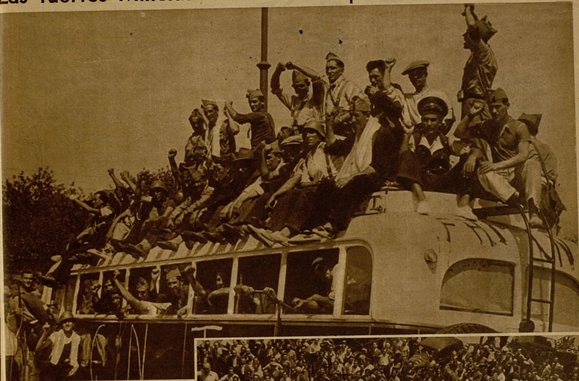
Más de sesenta camiones repletos, como éste, de soldados y milicianos han salido de Barcelona para el frente de lucha. He aquí a los entusiastas luchadores momentos antes de la partida