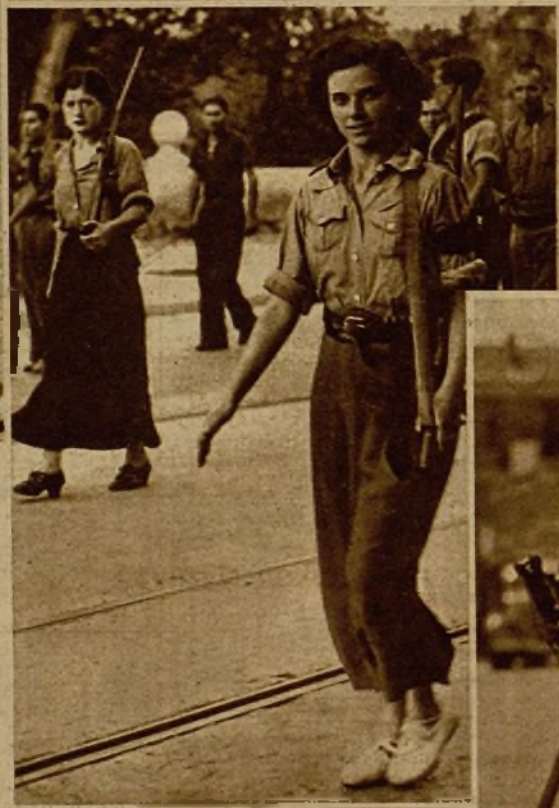
Muchachas valencianas enroladas en las Milicias populares, y que forman en las columnas que salieron de la ciudad del Turia contra los facciosos