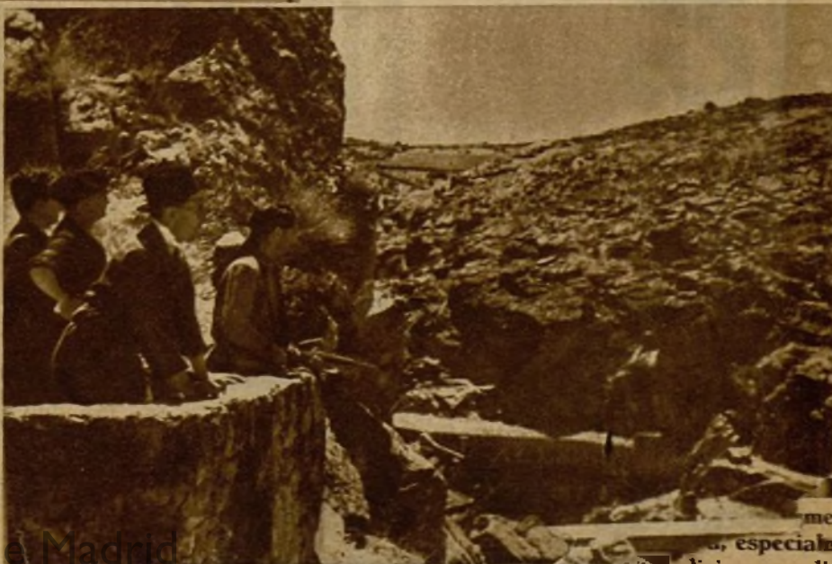
media... especialmente sediciosos pudieran