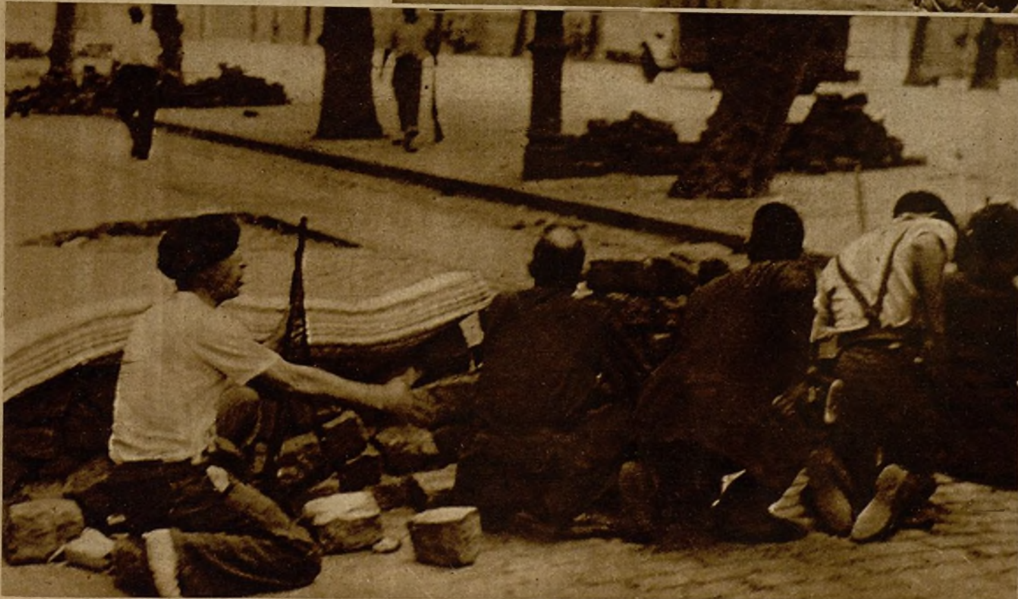
En la plaza de San Antonio el pueblo levantó barricadas, y desde ellas hizo un fuego nutridísimo contra los sublevados, reduciéndolos rápidamente y concentrándolos en sus reductos, de donde la acción conjunta de las Milicias, Guardia civil y Guardia de Asalto los desalojó después de reducirlos a total impotencia