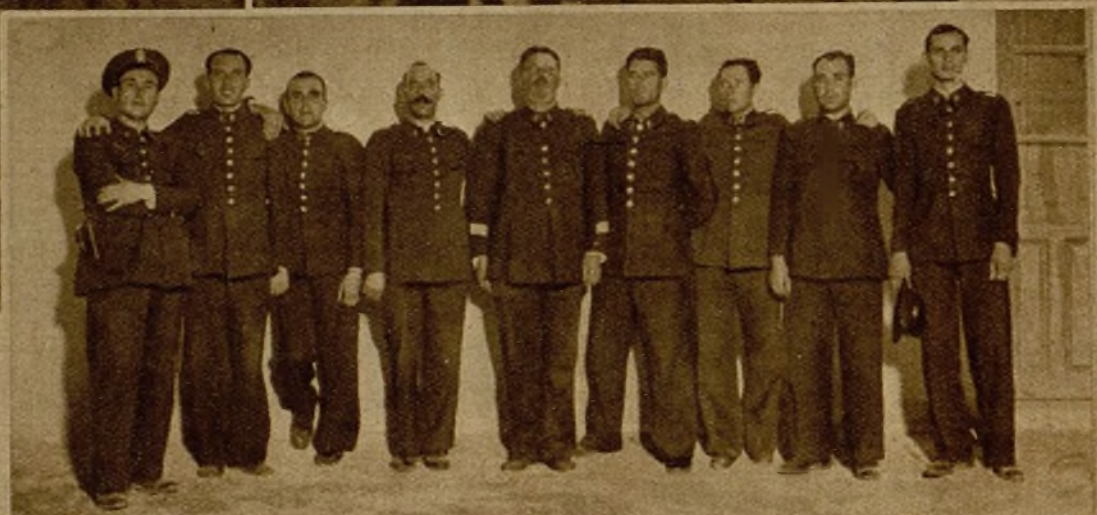
Guardias de Asalto que durante la rebelión permanecieron aprisionados por los rebeldes, por negarse a hacer armas contra las fuerzas leales