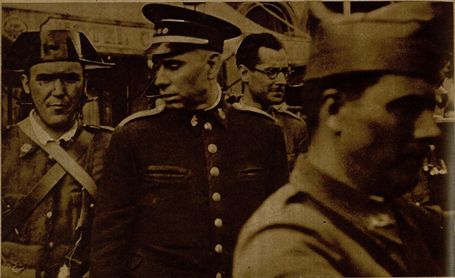
Oficiales rebeldes al salir custodiados por las fuerzas del Gobierno después de la rendición del Hotel Colón, donde los facciosos establecieron su reducto de resistencia