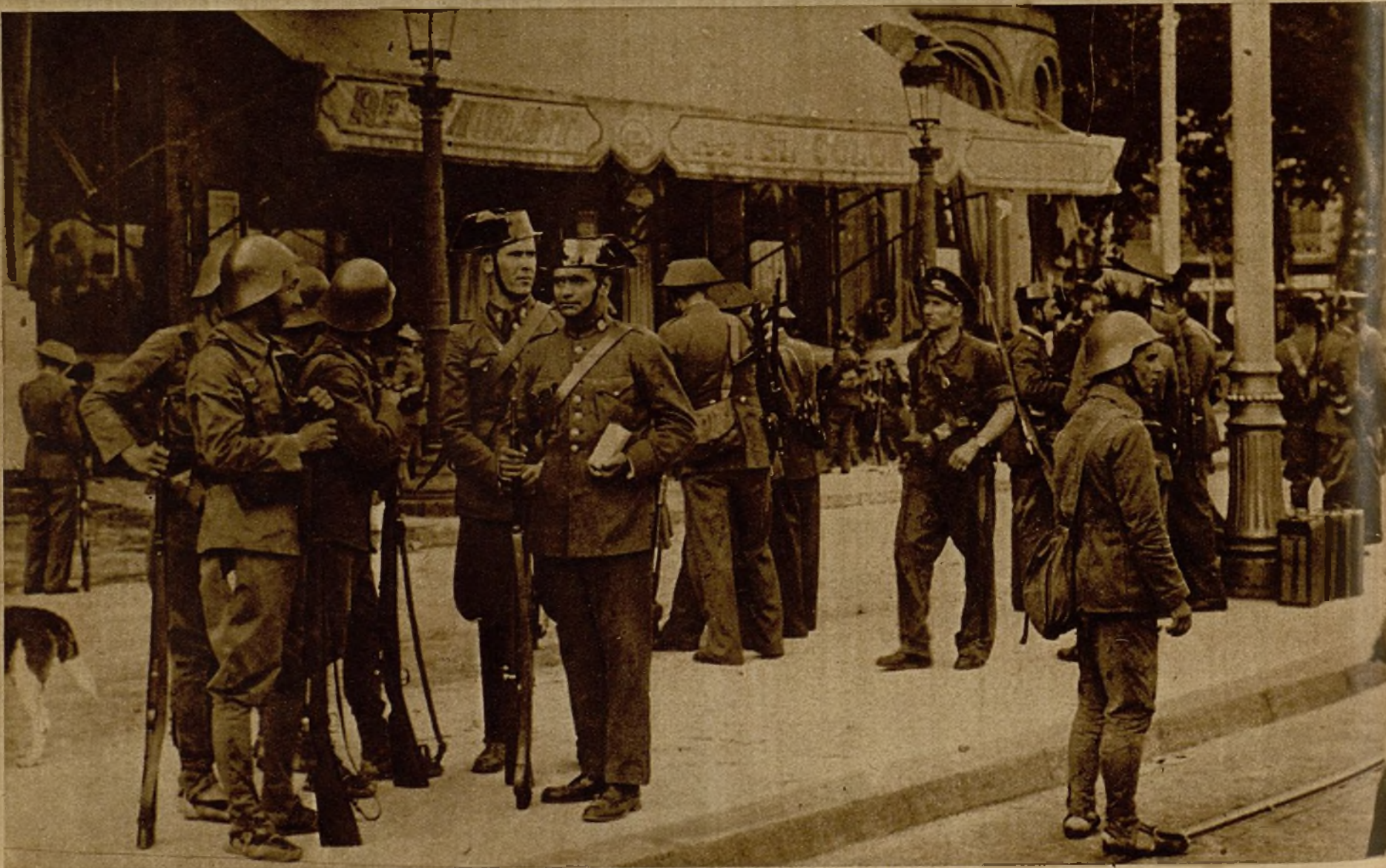
Fuerzas leales custodiando el Hotel Colón, que fue intervenido por las mismas obedeciendo órdenes del Gobierno de la Generalidad