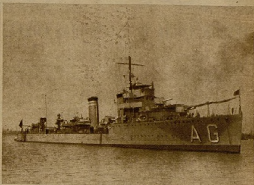
El "Alcalá Galiano" al llegar al puerto de Valencia para ponerse a disposición del Gobierno, en defensa de la autoridad legítima