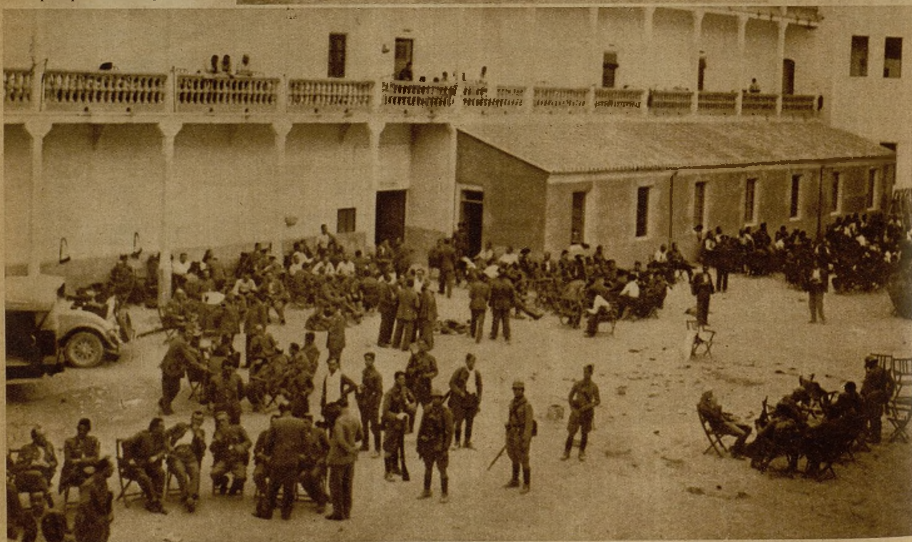
El patio del cuartel de la Guardia civil ocupado por las tropas del Gobierno y milicianos, y en el que fueron libertados muchos miembros del benemérito Instituto que habían sido aprisionados por los facciosos