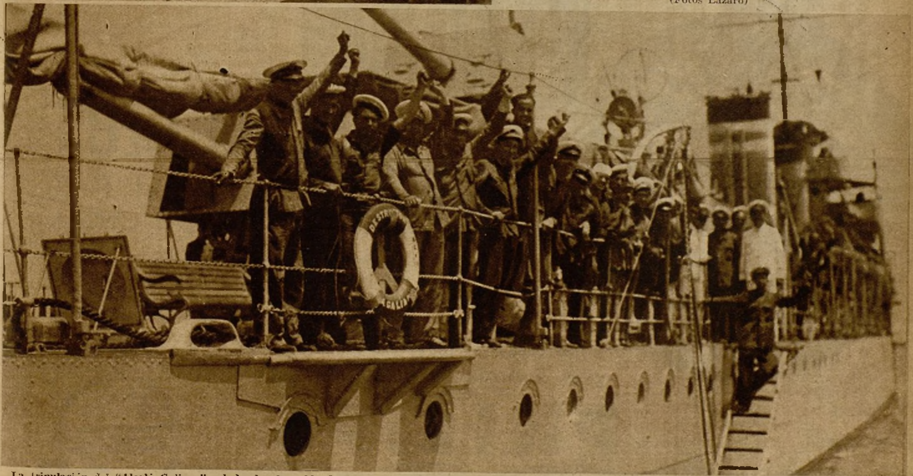
La tripulación del "Alcalá Galiano" saludando al pueblo de Valencia, que la aclamaba desde los muelles, a su llegada al puerto. Arriba, en el ángulo de la izquierda, la dotación del crucero "Lepanto" correspondiendo asimismo a las aclamaciones del pueblo