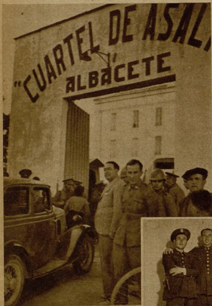
Las tropas fieles y las milicias armadas, después de una valerosa acción, se apoderaron de Albacete, donde los facciosos se habían hecho fuertes y tenían aprisionadas a las fuerzas que no habían querido seguirles en la rebelión. He aquí el cuartel de guardias de Asalto después de ser ocupado por milicianos y soldados