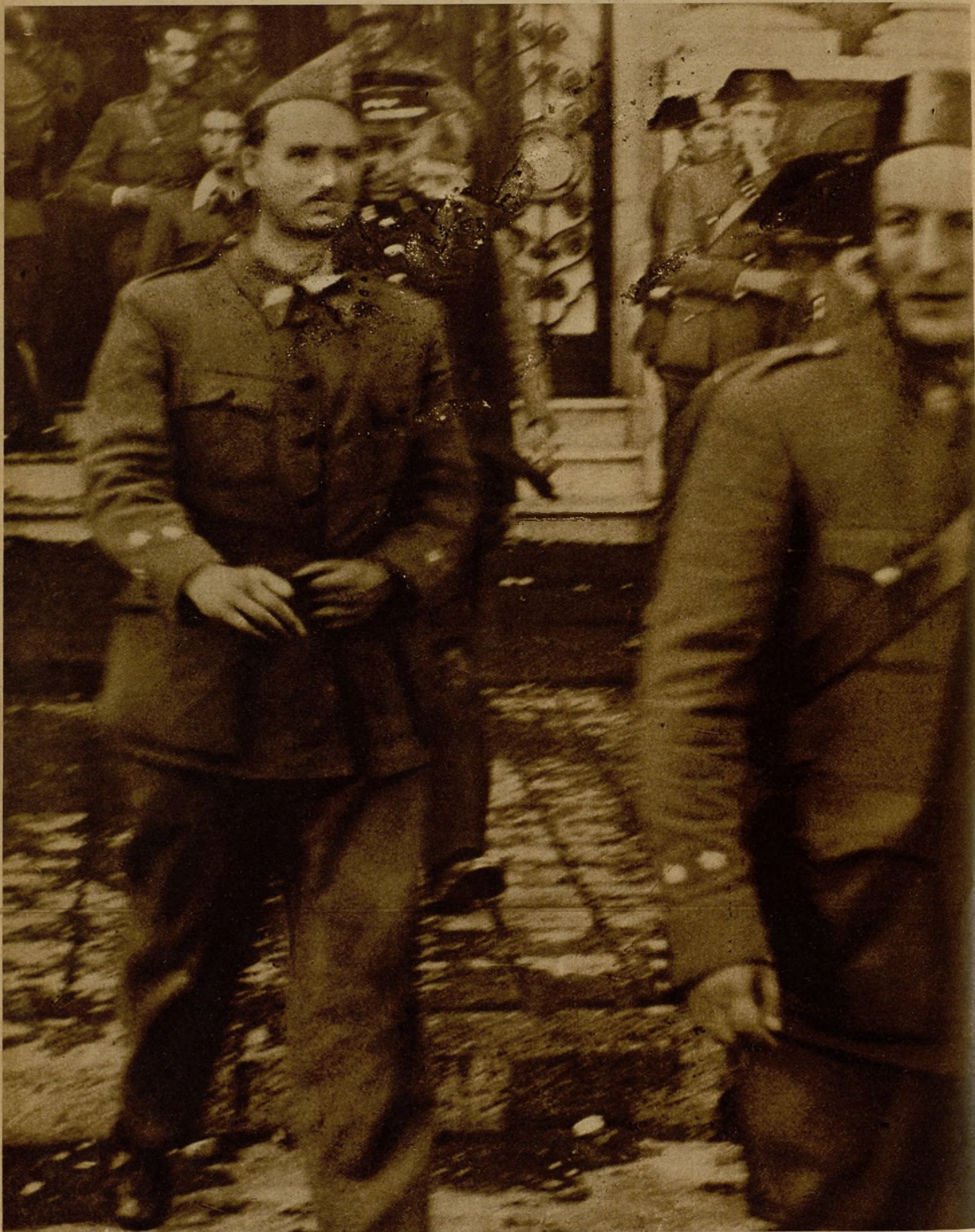
El capitán que mandaba las fuerzas rebeldes que se hicieron fuertes en el Hotel Colón, de Barcelona, el domingo 19, en el momento de salir de éste, rendido a las fuerzas del Gobierno