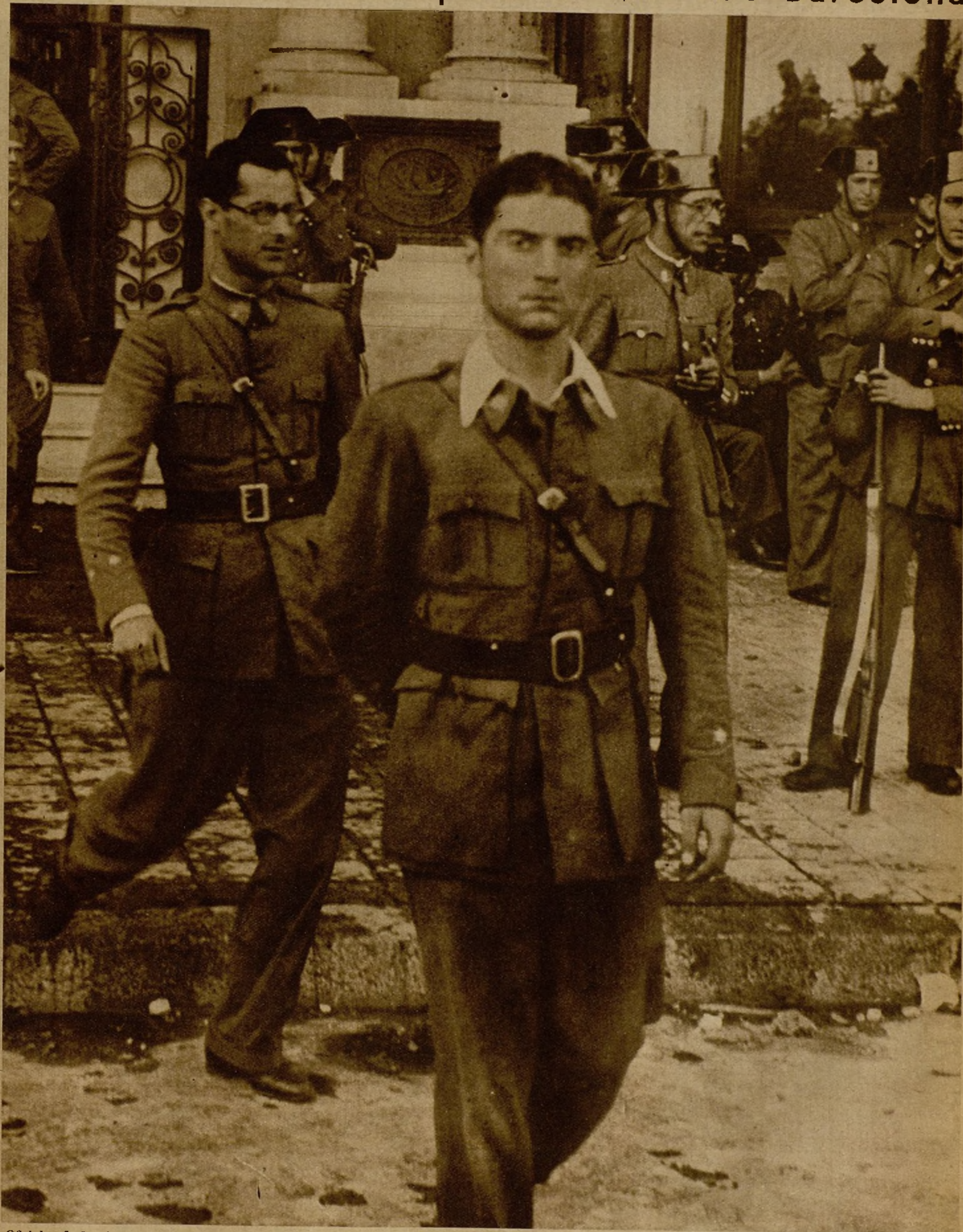
Oficiales de las fuerzas rebeldes del cuartel de Pedralbes, de Barcelona, que se habían hecho fuertes en el Hotel Colón, salen del edificio, después de haberse rendido a las tropas leales