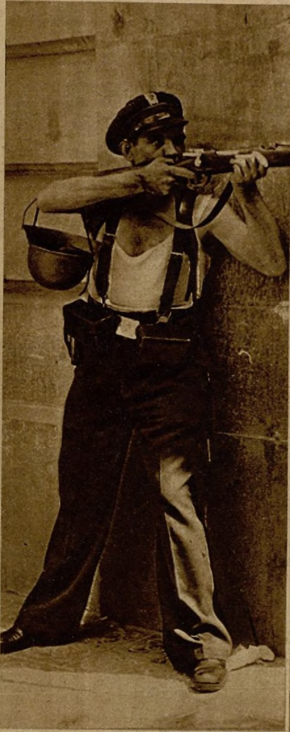
Un guardia de Asalto en la calle de las Cortes disparando contra los facciosos durante la lucha del domingo 19, que terminó rápidamente con la rotunda victoria de los leales