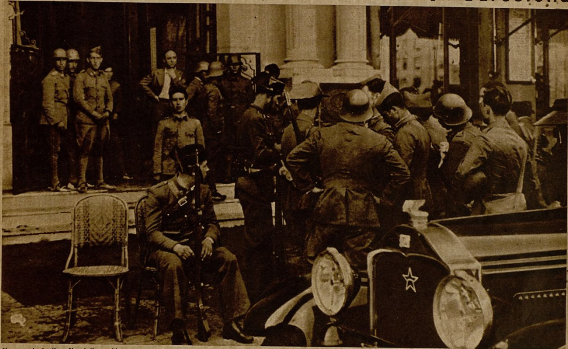
Fuerzas de la Guardia civil y soldados leales custodiando la entrada del Hotel Colón, de Barcelona, donde quedaron reducidas las tropas rebeldes que allí se hicieron fuertes