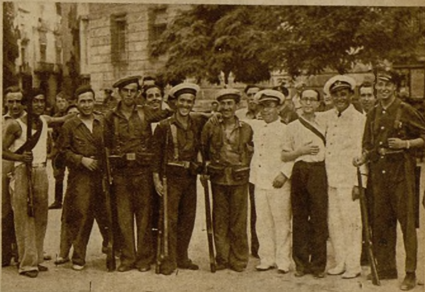
Marineros de la Escuadra fraternizan con los milicianos a su desembarco en el puerto de Valencia