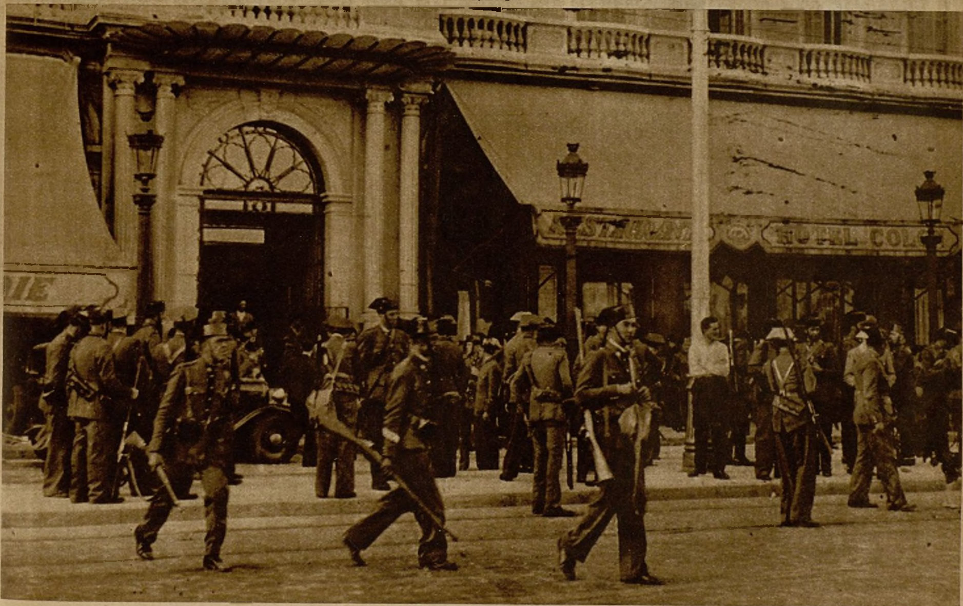
La Guardia civil, en la puerta del Hotel Colón, al iniciarse la conducción de los rebeldes prisioneros