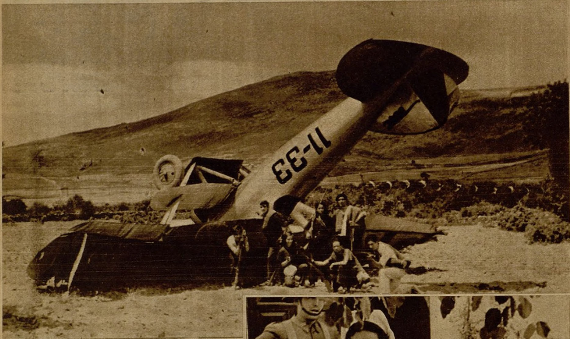
Un aeroplano rebelde, que fué derribado por nuestras tropas, custodiado por milicianos populares