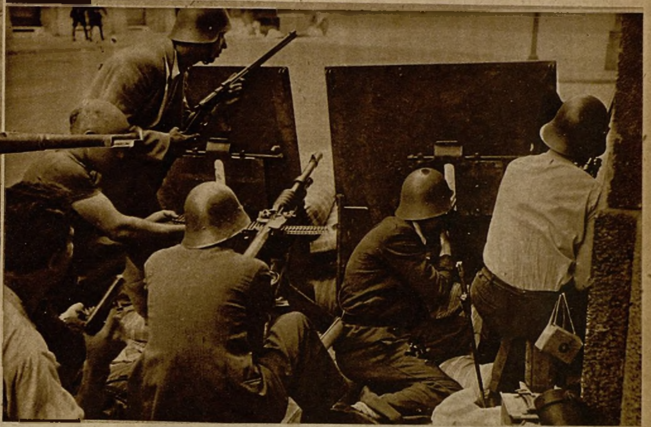
Una de las barricadas que levantaron las tropas leales en la Gran Vía Layetana, y desde las que los milicianos se batieron decisivamente