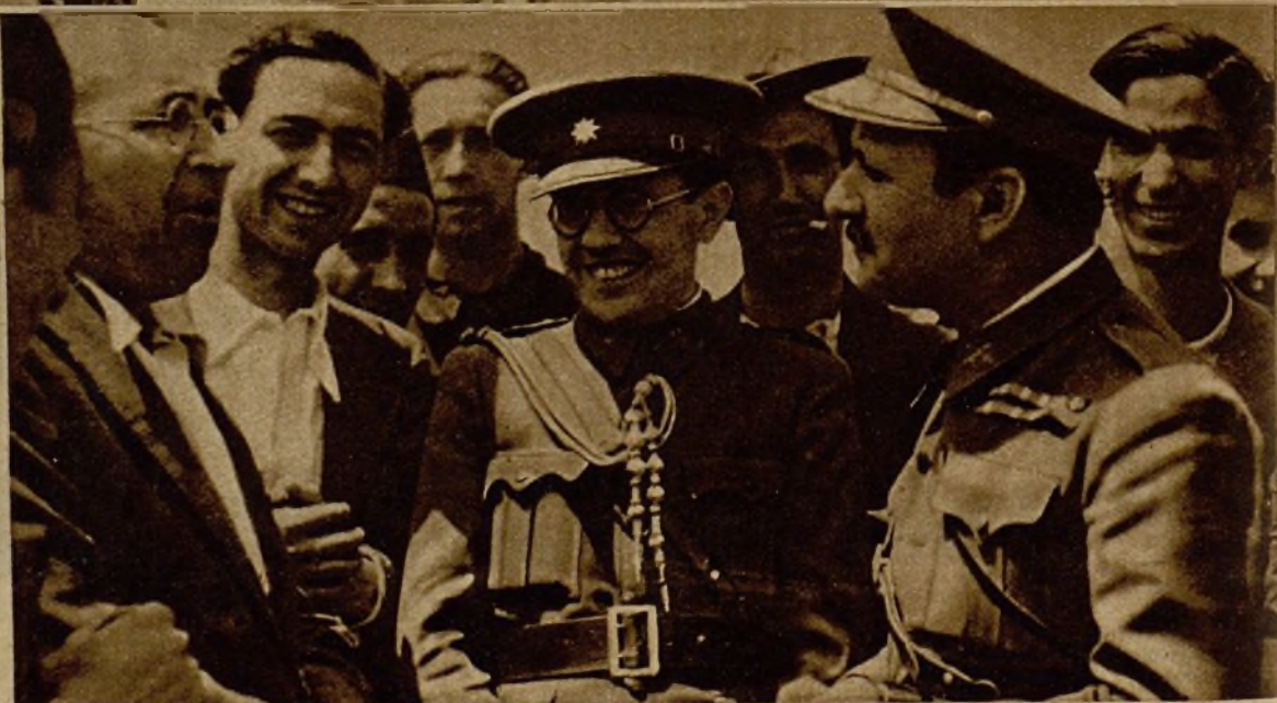
El ministro de la Guerra conversando con varios periodistas y milicianos en el frente de combate