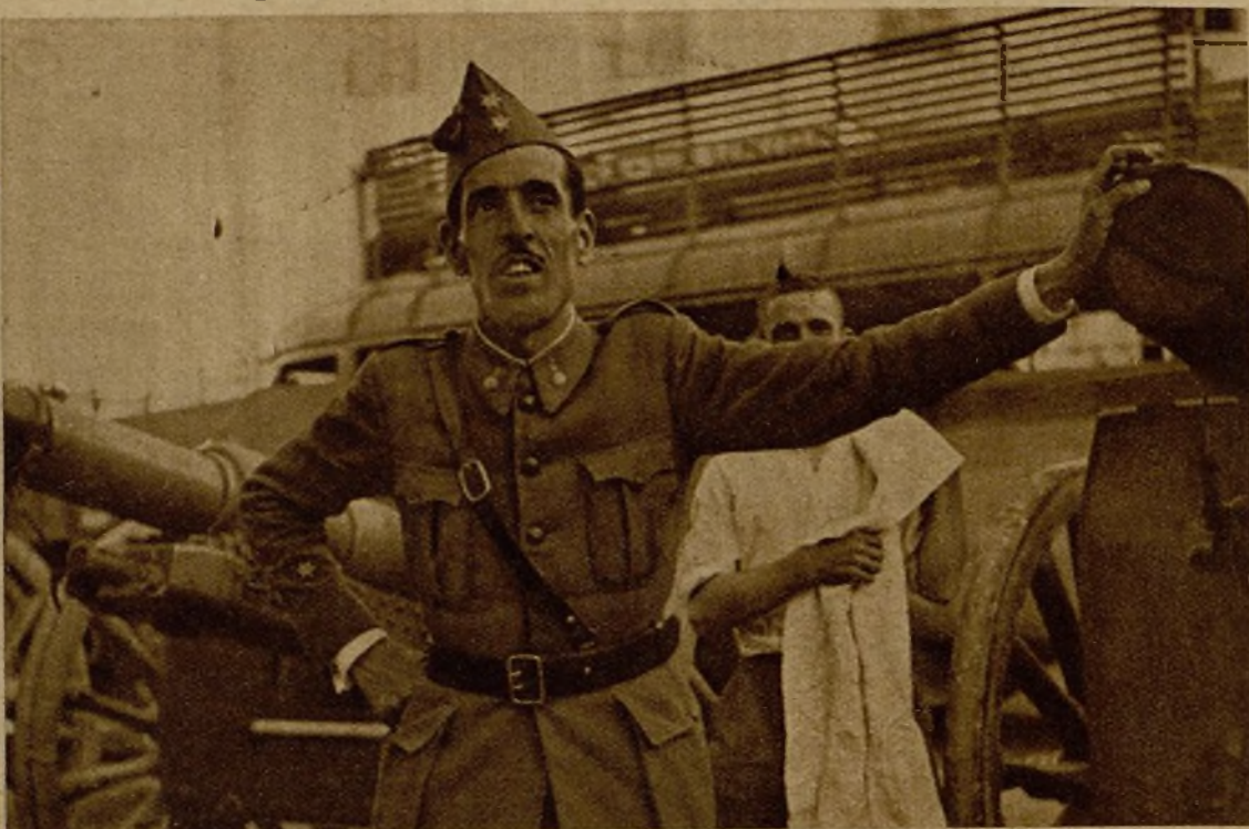
Un teniente de Artillería que resistió a las amenazas de los rebeldes, y a quienes éstos tenían prisionero. El leal militar fué libertado por nuestras fuerzas al apoderarse de la población