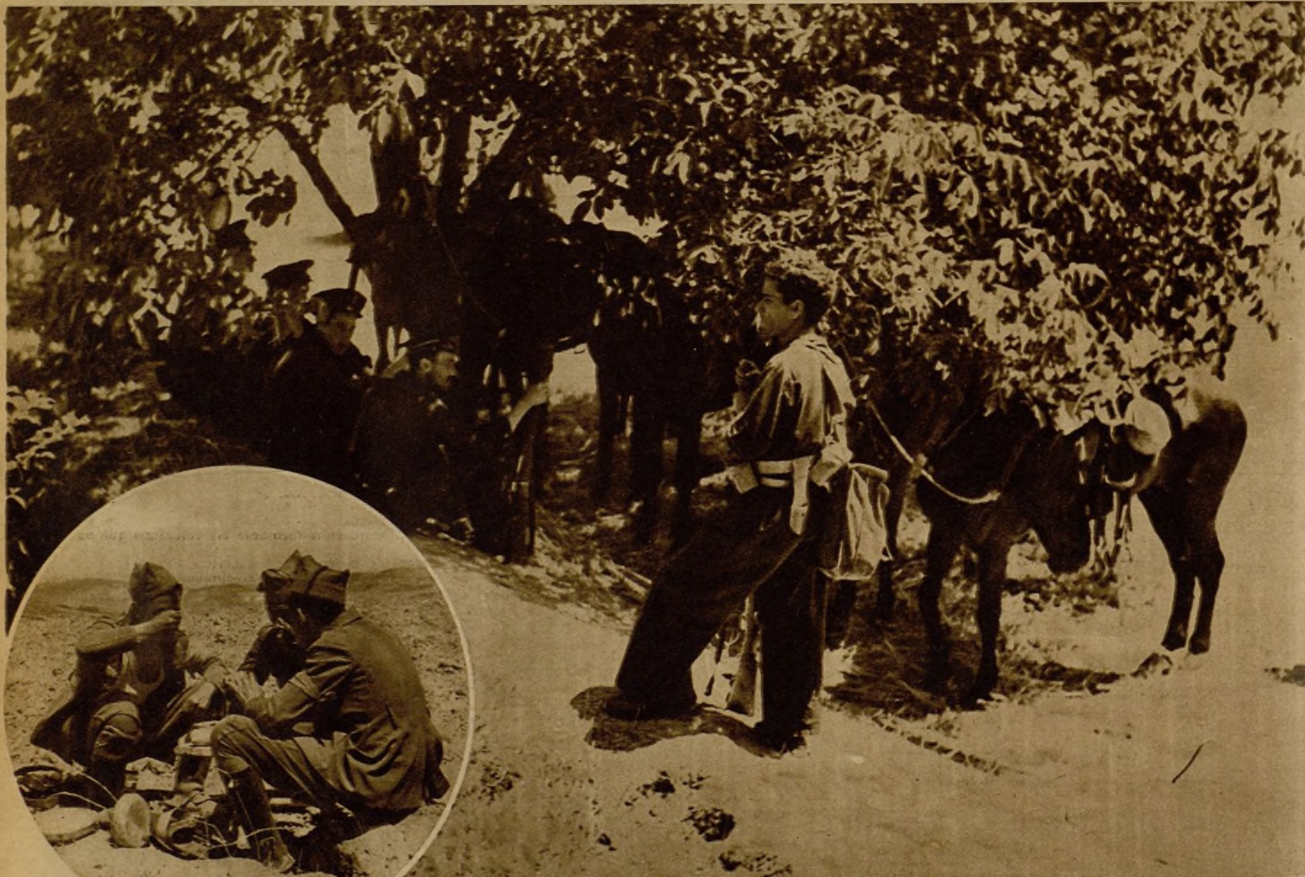
Soldados leales de la columna que combate contra los rebeldes situados en las proximidades de Medinaceli, consumiendo el rancho