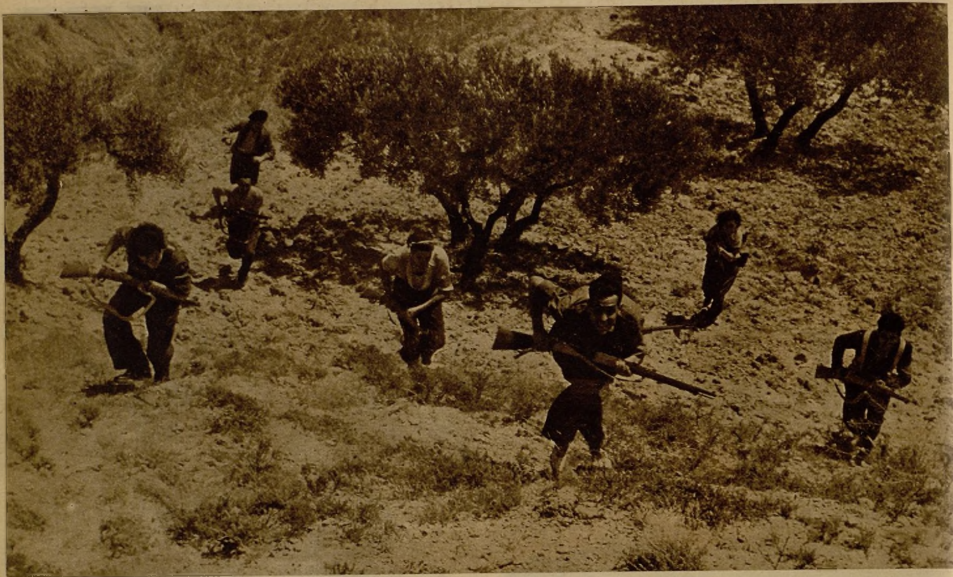
Milicianos de la avanzadilla del coronel Junévez Orge, en marcha hacia Zaragoza, se despliegan en guerrilla para localizar a unos "pacos"