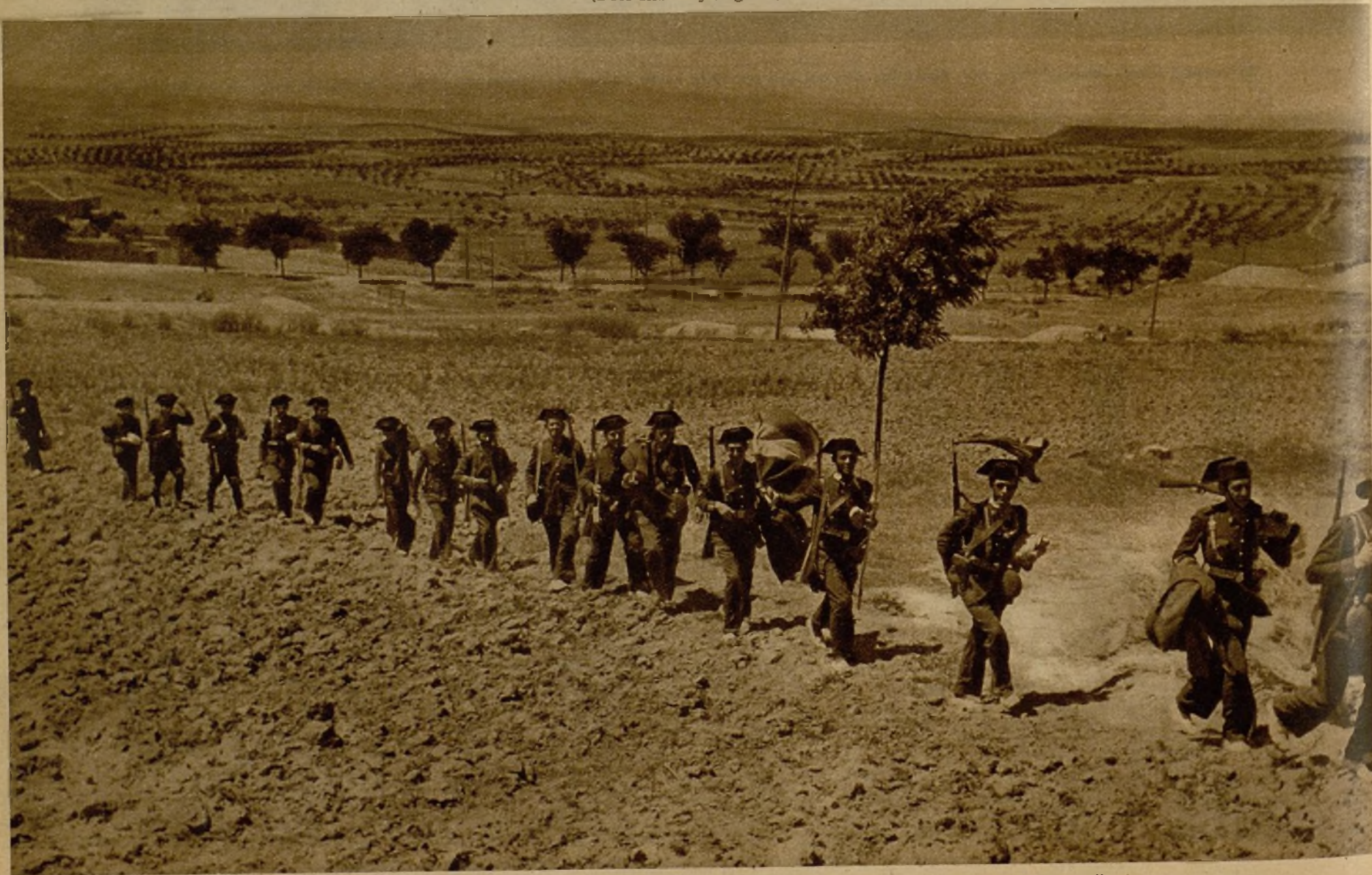
Fuerzas de la Guardia civil, en marcha para la capital de Aragón, al llegar a los alrededores de Sigüenza