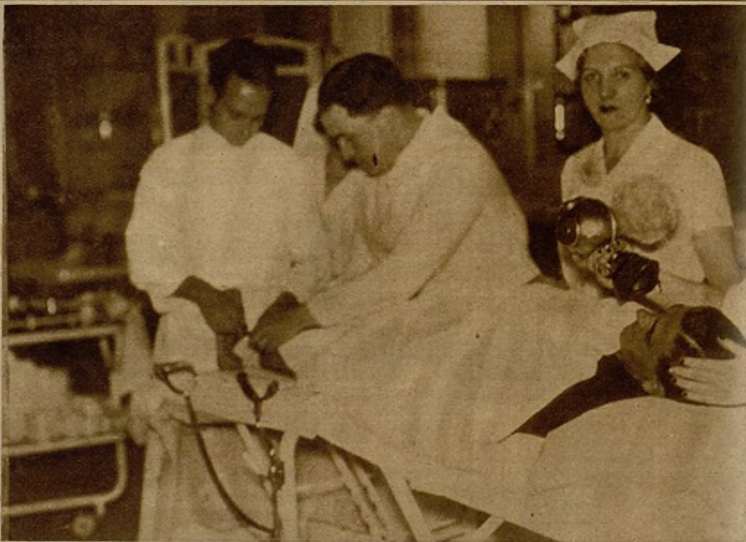
La cura a un herido en el quirófano del hospital de sangre instalado en el Casino de Madrid