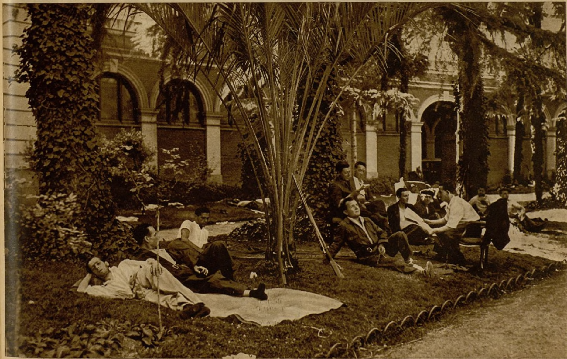
Los jardines del palacio de Medinaceli ofrecen un aspecto de cuartel en campaña. Los soldados llegados del frente reposan del cansancio de la obstinada y brava lucha