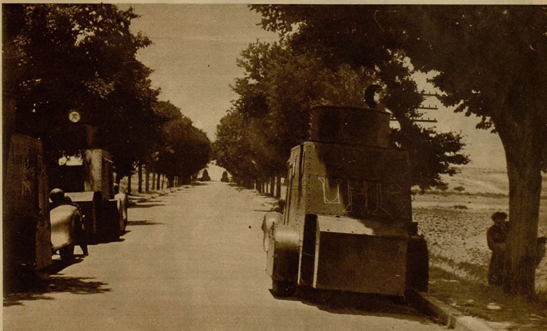
Tanques de las fuerzas leales marchan por la carretera, en dirección a Zaragoza, protegiendo el avance de la Infantería

Ayuntamiento de Madrid (Fotos Albere y Segovia)