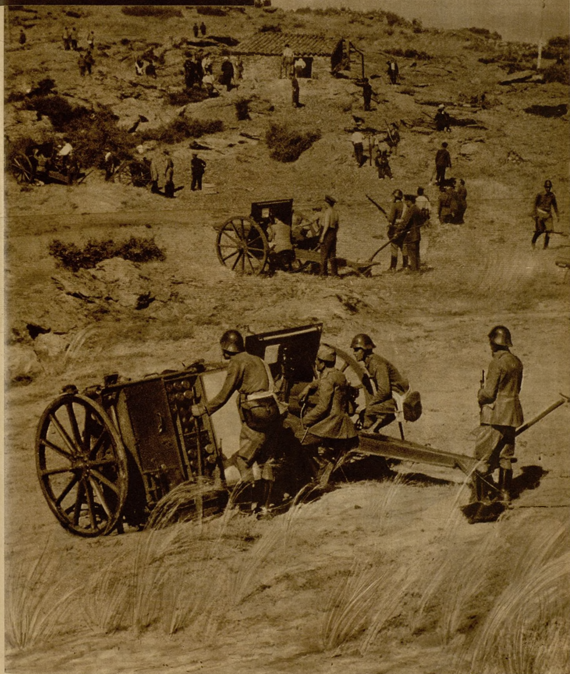
LA VICTORIOSA OFENSIVA DE LAS FUERZAS LEALES EN LOS FRENTES DE GUADARRAMA.—Continúa el avance de nuestras fuerzas con la lentitud que impone la configuración del terreno, pero asegurando rotundamente las posiciones conquistadas, hasta el punto de que el enemigo, francamente batido, retrocede incesantemente. He aquí a una batería de las fuerzas del Gobierno protegiendo con su fuego el avance de las tropas y milicias