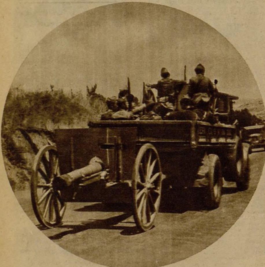
Los camiones de Artillería avanzan por Somosierra rumbo a las alturas, donde se está batuyendo a los facciosos