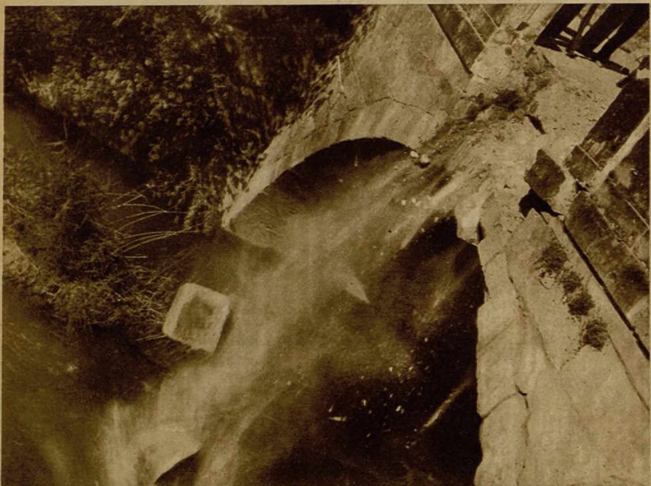
El puente de Rebolledo, sobre el Eneares, entre Tarazona y Medinaceli, que fué volado por los rebeldes y que ahora reparan nuestras tropas