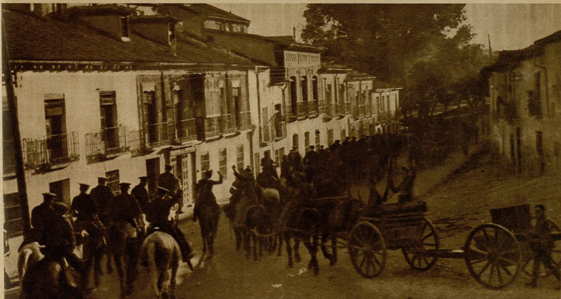
Una de las columnas del Gobierno que se dirigen hacia Zaragoza, en marcha hacia la capital de Aragón