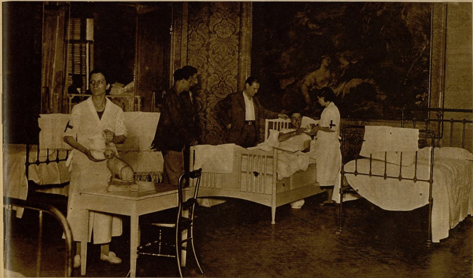
Uno de los salones del palacio del ex duque de Medinaceli, convertido en hospital, donde personal competente presta auxilio a los heridos