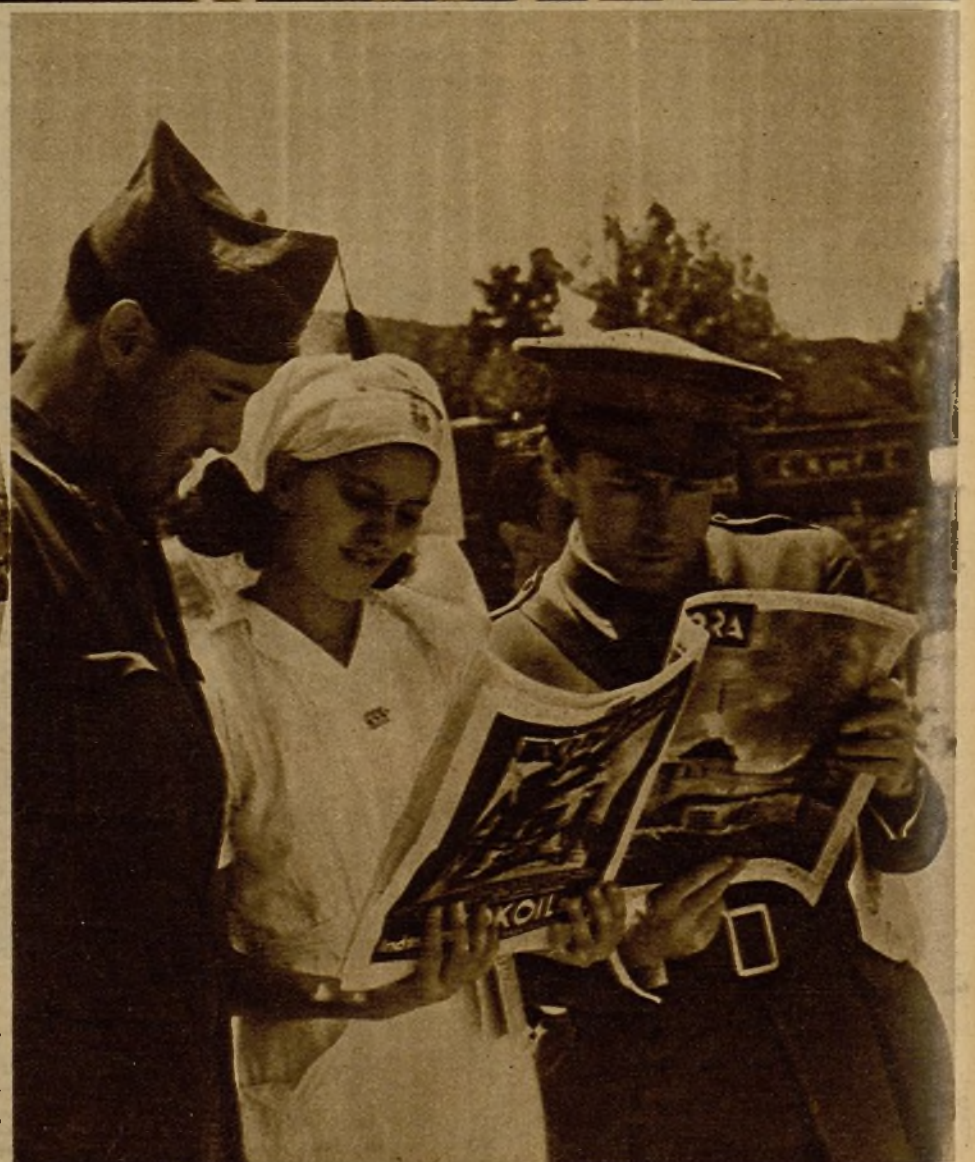
La llegada de los ejemplares de AHORA es esperada en los frentes de Guadarrama con verdadera ansiedad. Una enfermera, un capitán y un soldado contemplando nuestras fotos