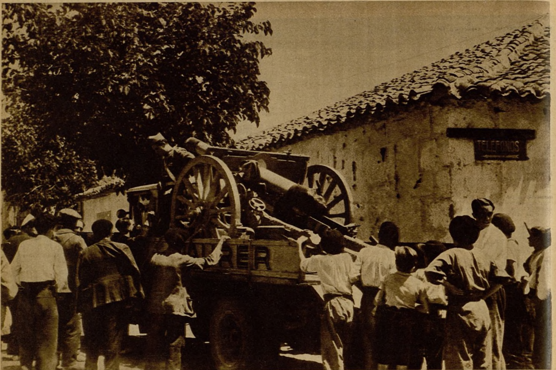
Camino de las cumbres de Somosierra marchan refuerzos de artillería, que tomarán parte en la batalla decisiva contra los rebeldes