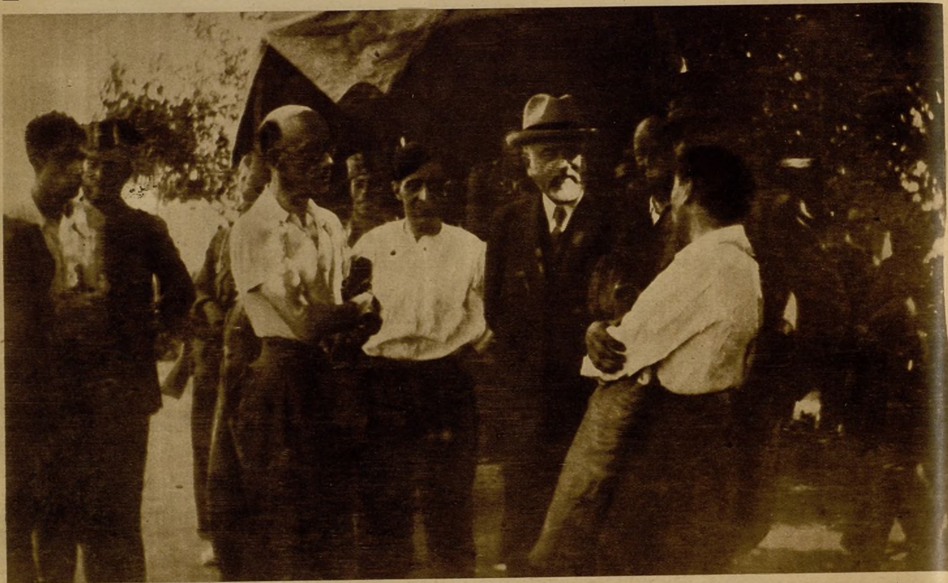
El ministro de Instrucción pública, señor Barnés, conversando con milicianos y periodistas en uno de los lugares de la Sierra de Guadarrama donde están acampadas nuestras fuerzas