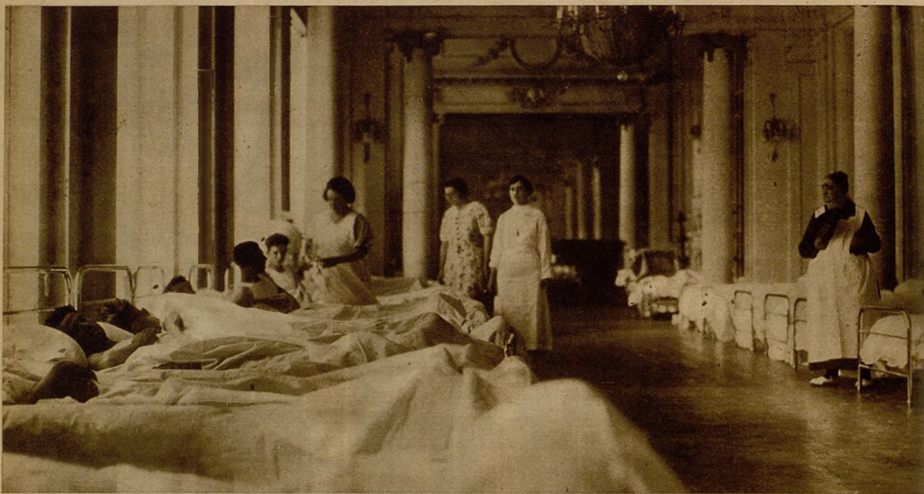
Una vista del hospital de sangre instalado en el Casino de Madrid, donde se presta asistencia a los heridos en la lucha contra las fuerzas facciosas