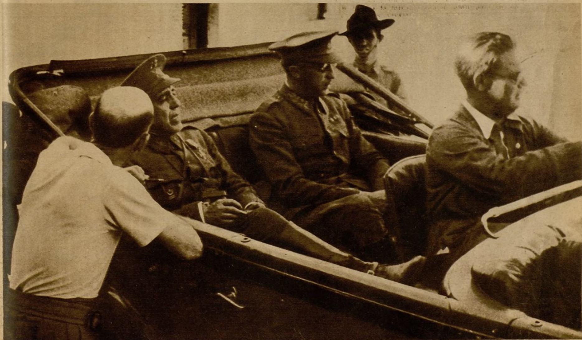
El general Riquelme al partir hacia el frente de lucha en la Sierra de Guadarrama