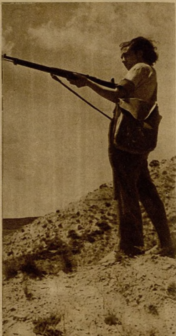
Una brava miliciana hostilizando a los facciosos situados en los montículos de Medinaceli (Fotos Alberio y Segovia)