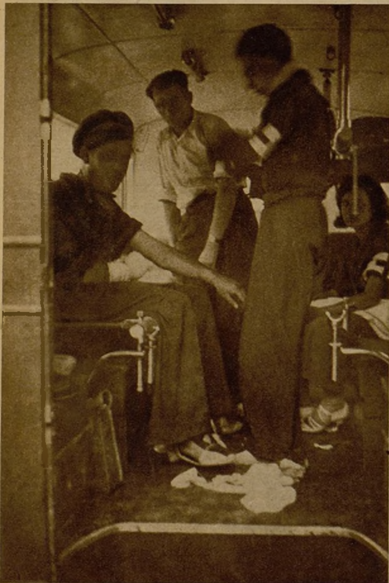
Una ambulancia en el frente de combate, en la Sierra de Guadarrama, preparada para recibir a los heridos en el frente