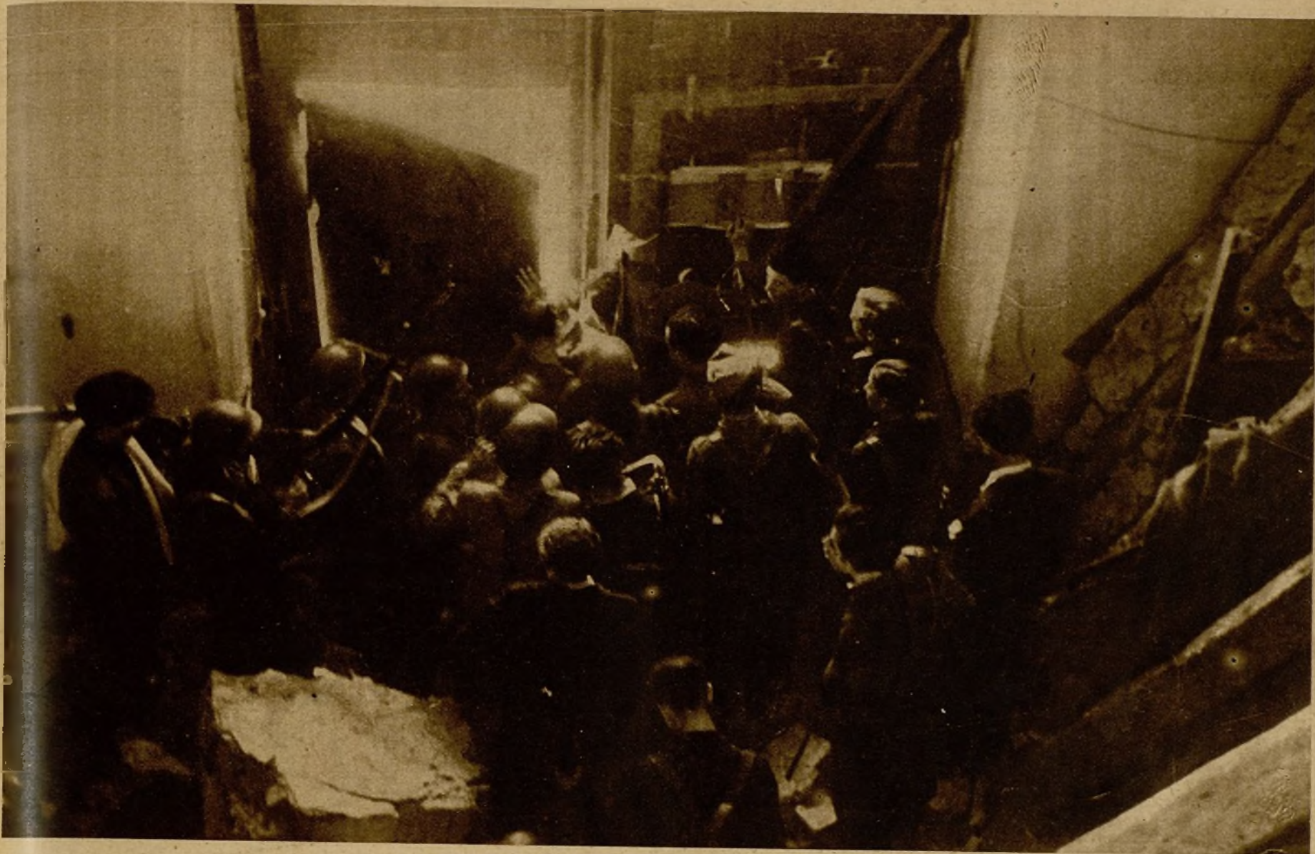
El primer grupo de atacantes, al hacer su entrada en el cuartel de la Montaña