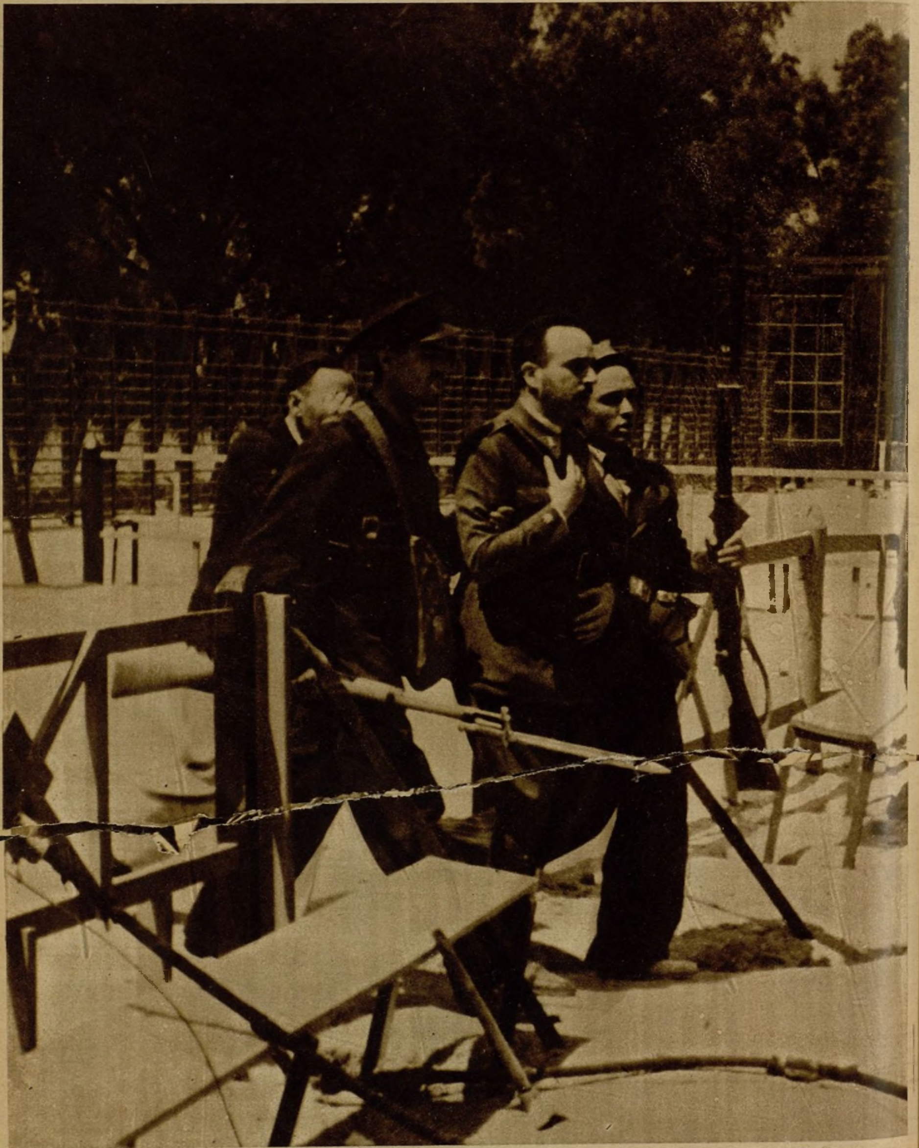
Un oficial rebelde, herido durante la lucha en el cuartel de la Montaña, es conducido a un puesto de la Cruz Roja por un guardia civil. (Ayuntamiento de Madrid y Segovia)