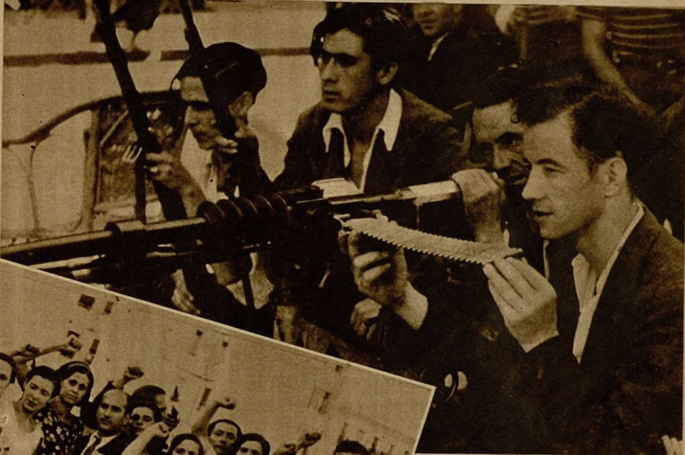
Milicianos durante su ataque al cuartel de la Montaña, ocupado por los insurrectos, manejando una ametralladora