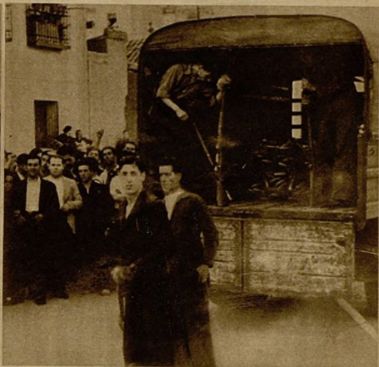
Un momento del reparto de armas a los milicianos