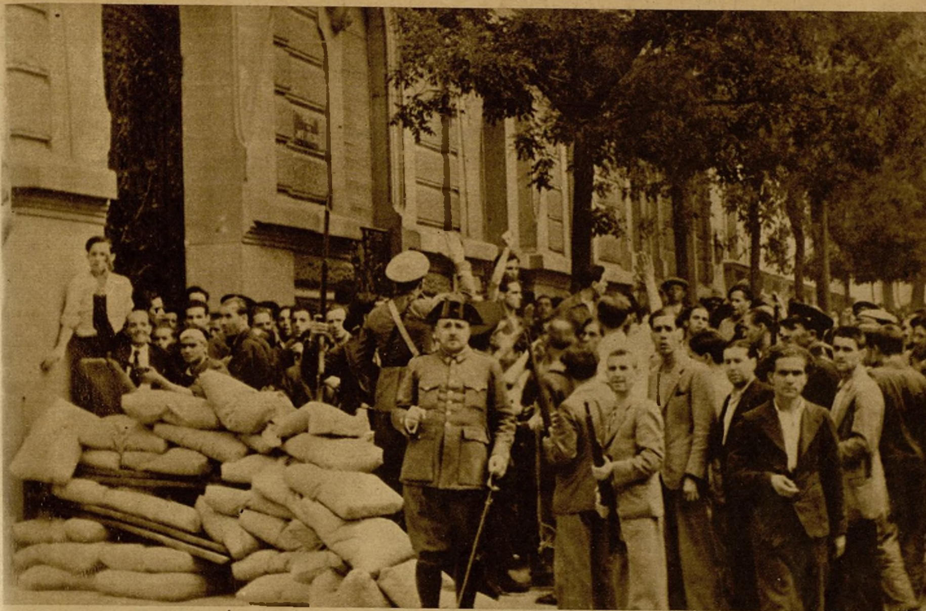
Fuerzas de la Guardia Civil y de Asalto, organizando la actuación de los milicianos armados para el ataque al cuartel de la Montaña