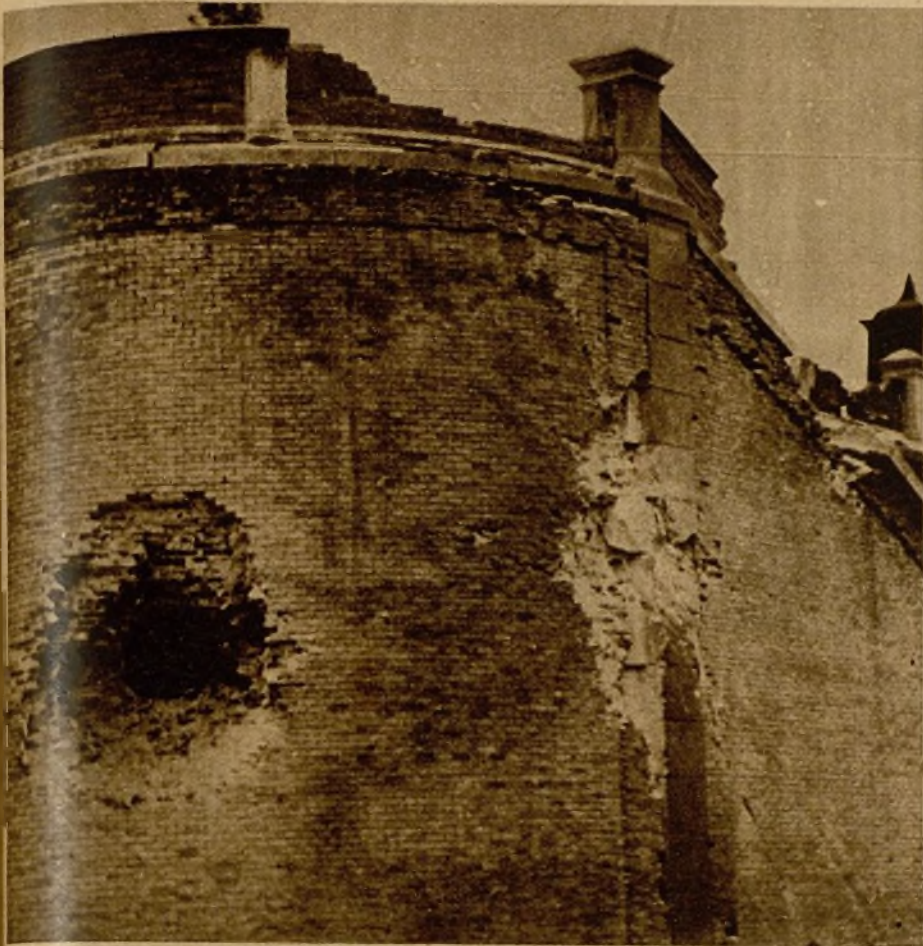
Efecto de uno de los disparos de cañón en la muralla del cuartel de la Montaña