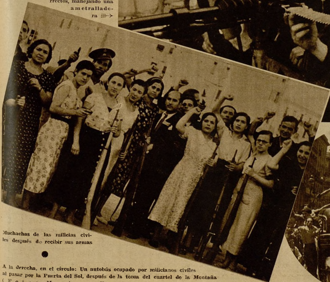
Muchachas de las milicias civiles después de recibir sus armas