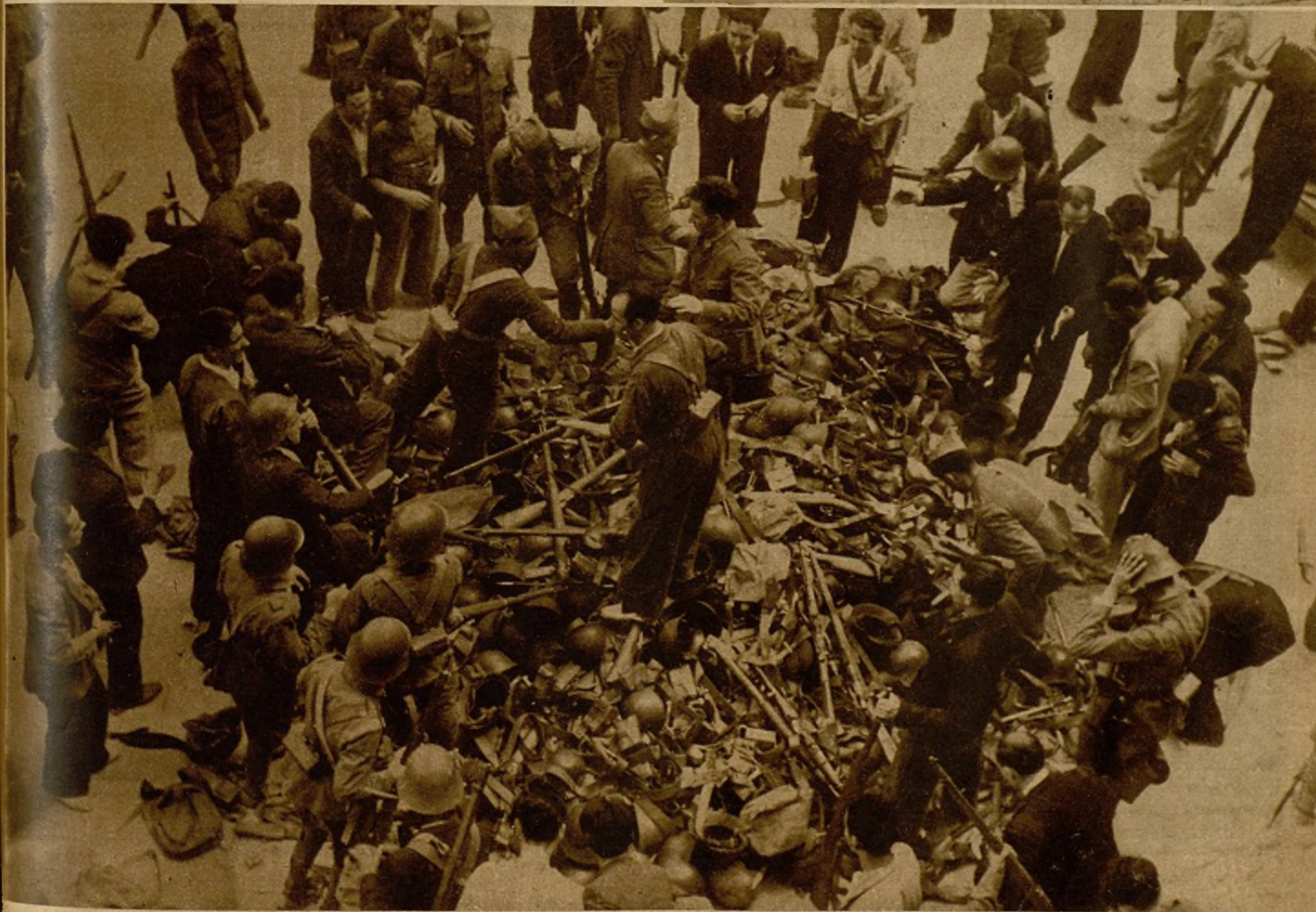
Las armas y material cogidos a los rebeldes en el cuartel de la Montaña son repartidas a los miembros de las milicias ciudadanas