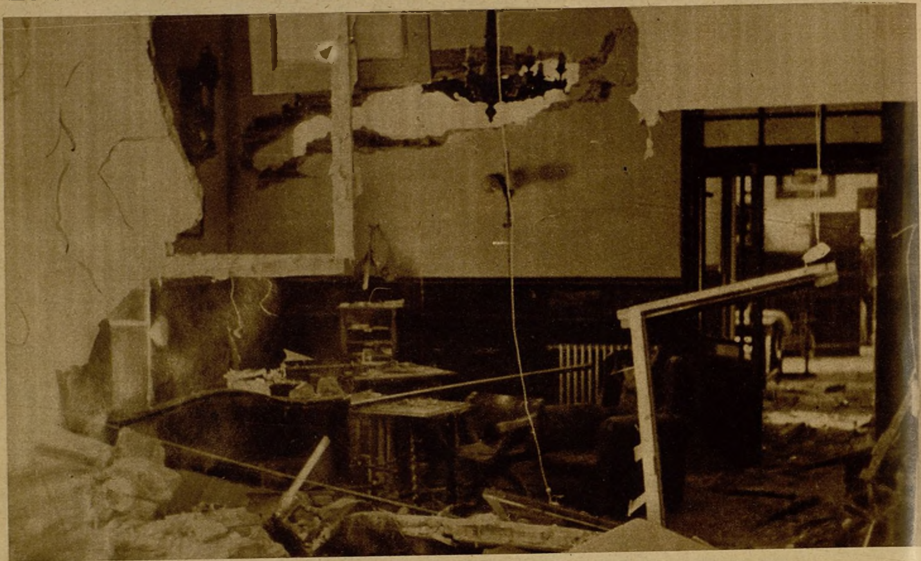
Estado en que quedaron las habitaciones de la Jefatura del cuartel de la Montaña después del bombardeo