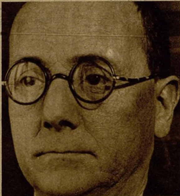
DON JOSE GIRAL Presidencia y Marina