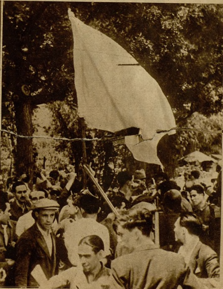
El patio central del cuartel, en el momento de ser tomado por las fuerzas de la Guardia Civil y Asalto y los milicianos civiles. La bandera blanca izada en señal de rendición por los rebeldes del cuartel de la Montaña