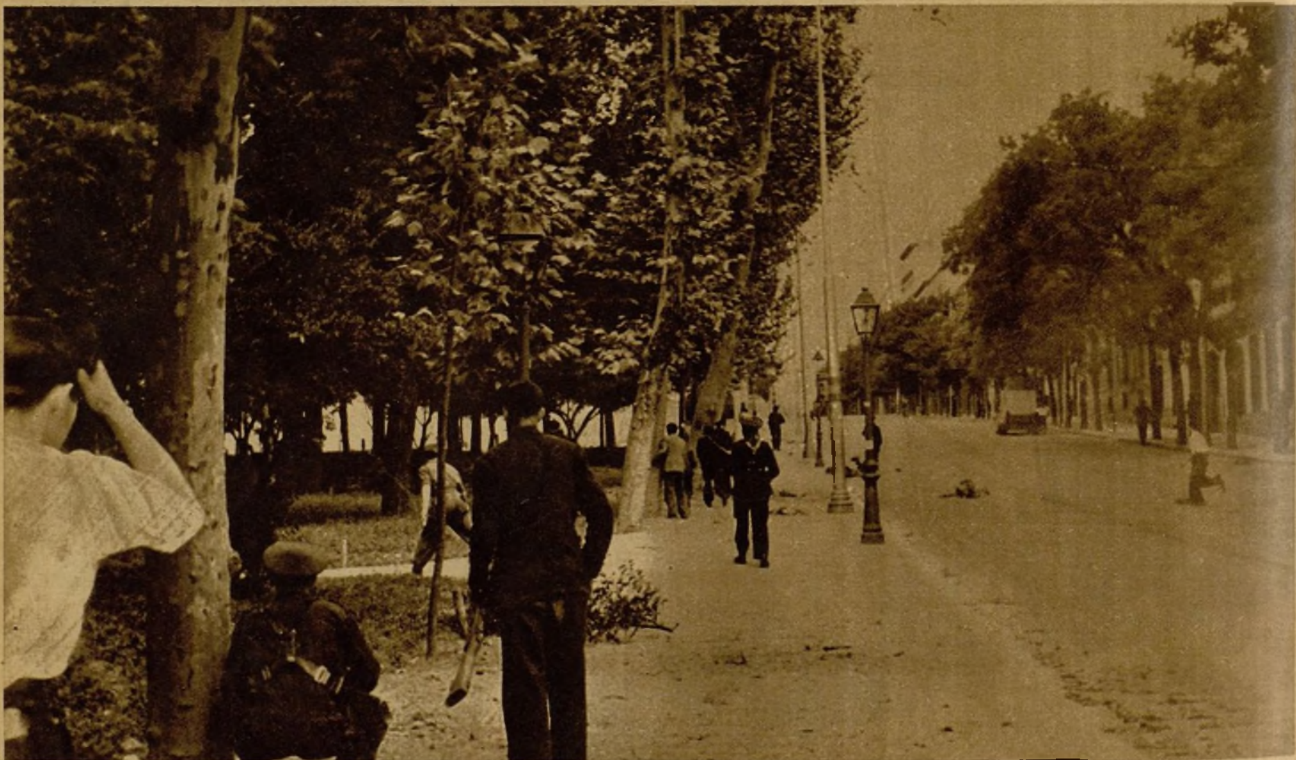
Corriéndose a lo largo de la fila de árboles, guardias de Asalto y milicianos inician su avance para cooperar al ataque al cuartel de la Montaña, del que se apoderaron tras larga lucha