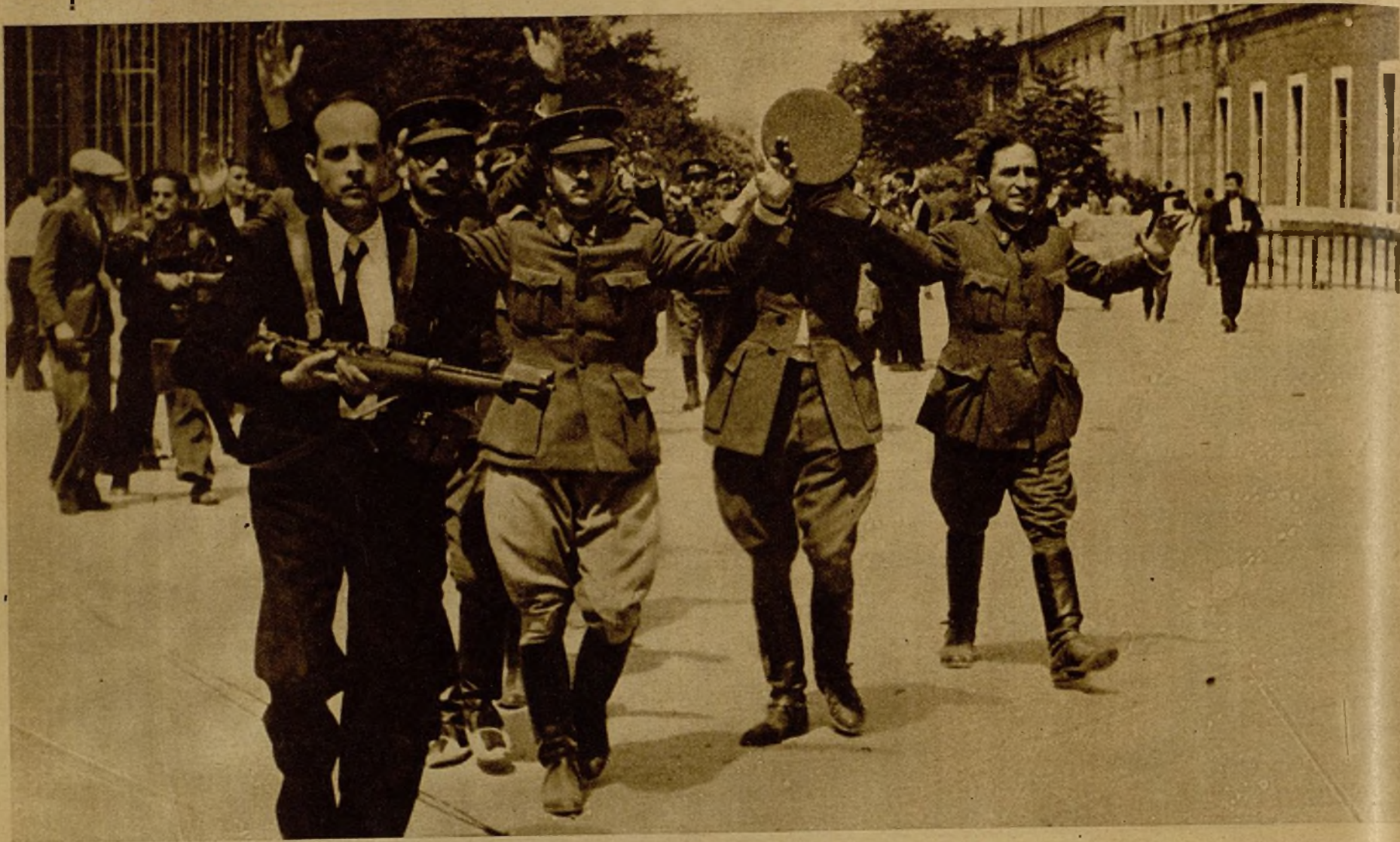
Varios de los oficiales sublevados, después de su sumisión, conducidos por un guardia cívico

Después de la sumisión de las fuerzas del Cuartel de la Montaña