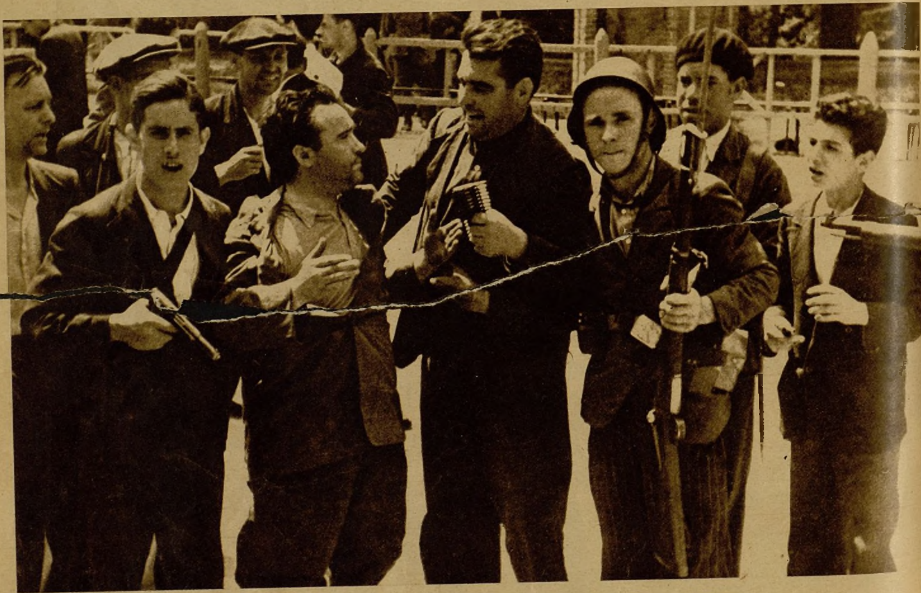
Momento de la detención de uno de los sublevados, después de la toma del cuartel de la Montaña