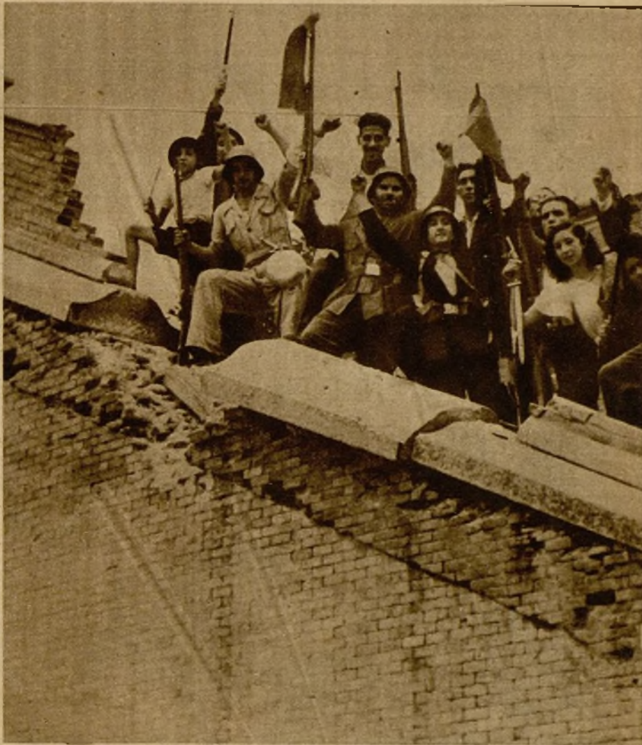
El júbilo de los milicianos después de la toma del cuartel, en la que cooperaron eficaz y valerosamente a la acción de las fuerzas de la Guardia civil y Asalto