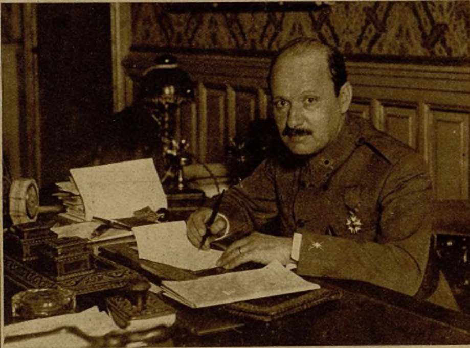
GENERAL CASTELLO Guerra