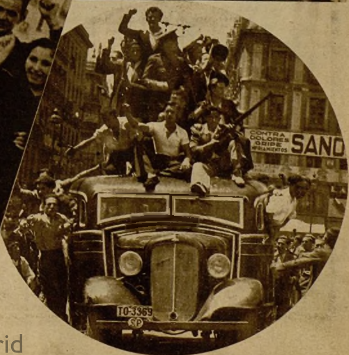
A la derecha, en el círculo: Un autobús ocupado por milicianos civiles al pasar por la Puerta del Sol, después de la toma del cuartel de la Montaña