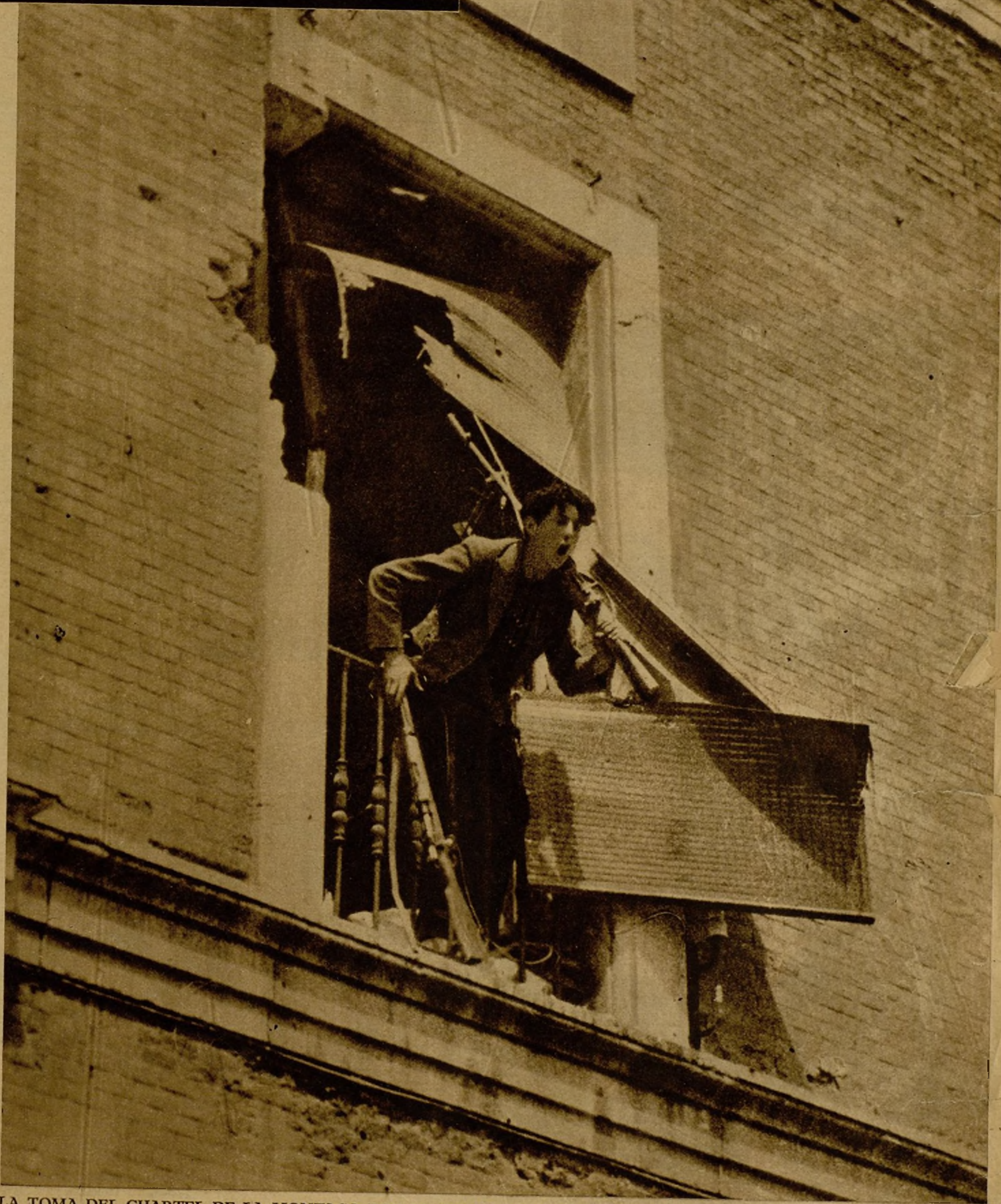
LA TOMA DEL CUARTEL DE LA MONTAÑA POR LA GUARDIA CIVIL, LAS FUERZAS DE ASALTO Y LAS MILICIAS CIVILES. Después de larga lucha, en la que los atacantes al cuartel de la Montaña, reducto de los insurrectos, hubieron de emplear enérgica y valerosa ofensiva, el edificio cayó en poder de los guardias civiles y de Asalto y de las milicias civiles. He aquí al primero de los milicianos que entró en el cuartel lanzando el grito de victoria.