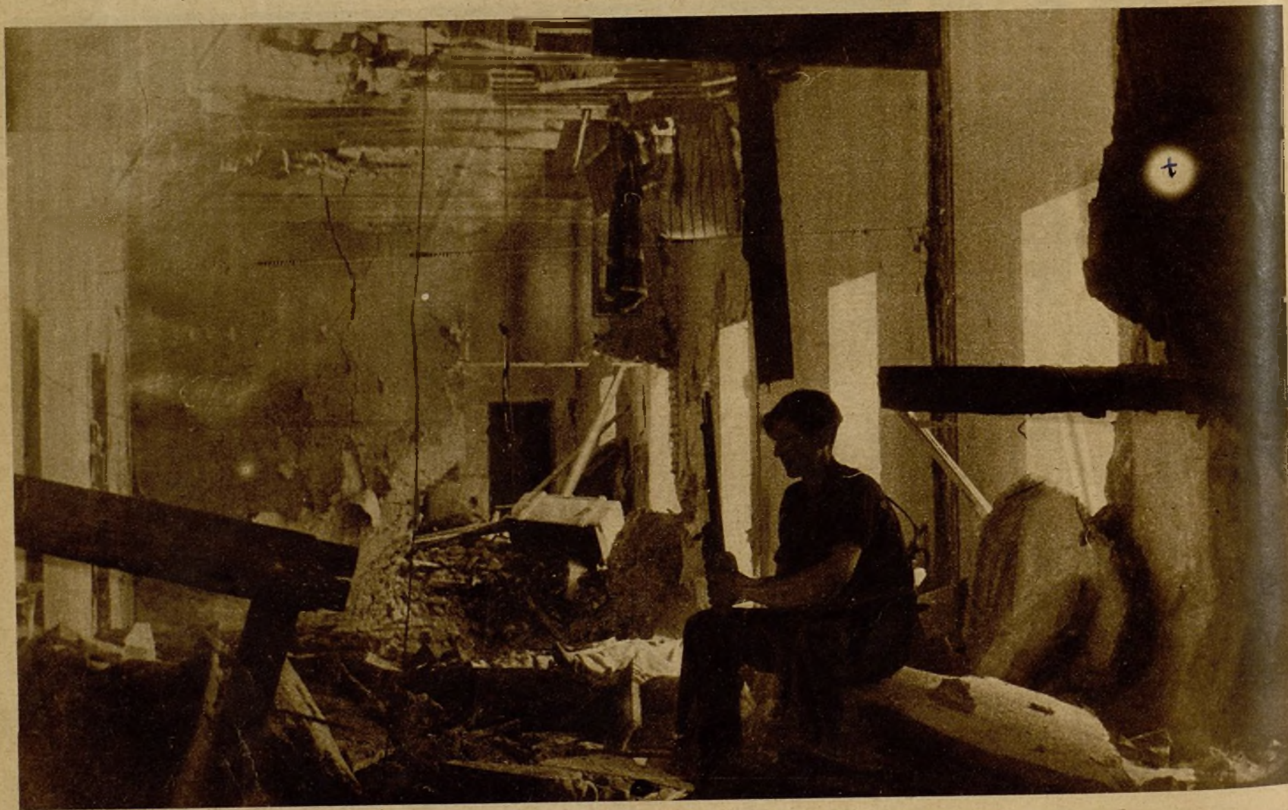
Otra vista interior del cuartel de la Montaña después de su toma por las fuerzas de la Guardia Civil y de Asalto y los milicianos