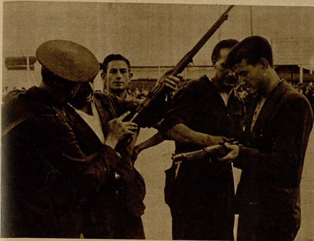
Un oficial de Asalto, mostrando el manejo del fusil a varios milicianos armados contra el movimiento insurreccional