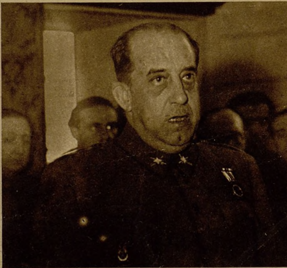
GENERAL POZAS Gobernación