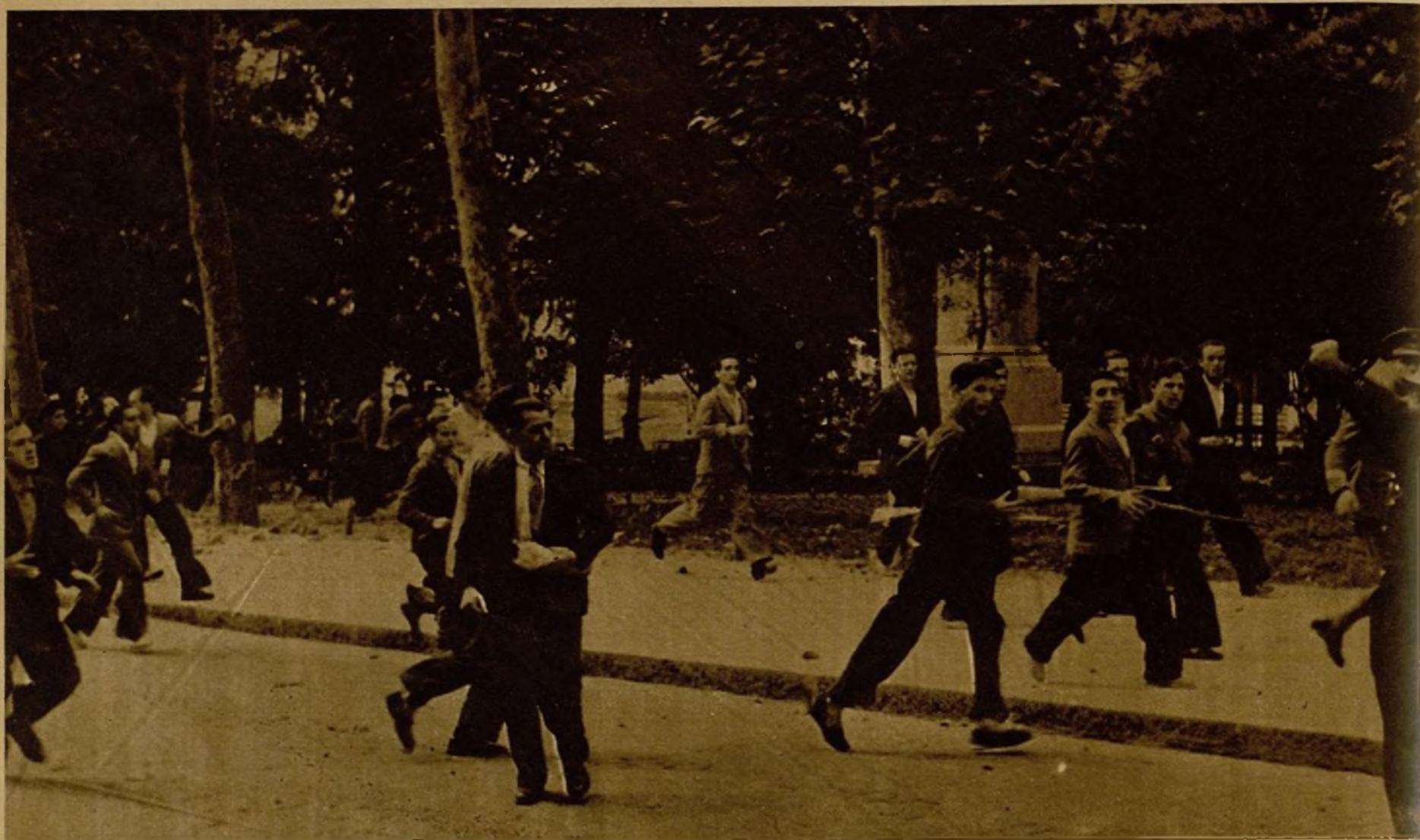
Jóvenes de las milicias cívicas, que prestaron una eficaz colaboración a las fuerzas de Guardia Civil y de Asalto, en el momento de avanzar, desplegados en guerrilla, desde la plaza de España hacia el inmediato lugar de la lucha