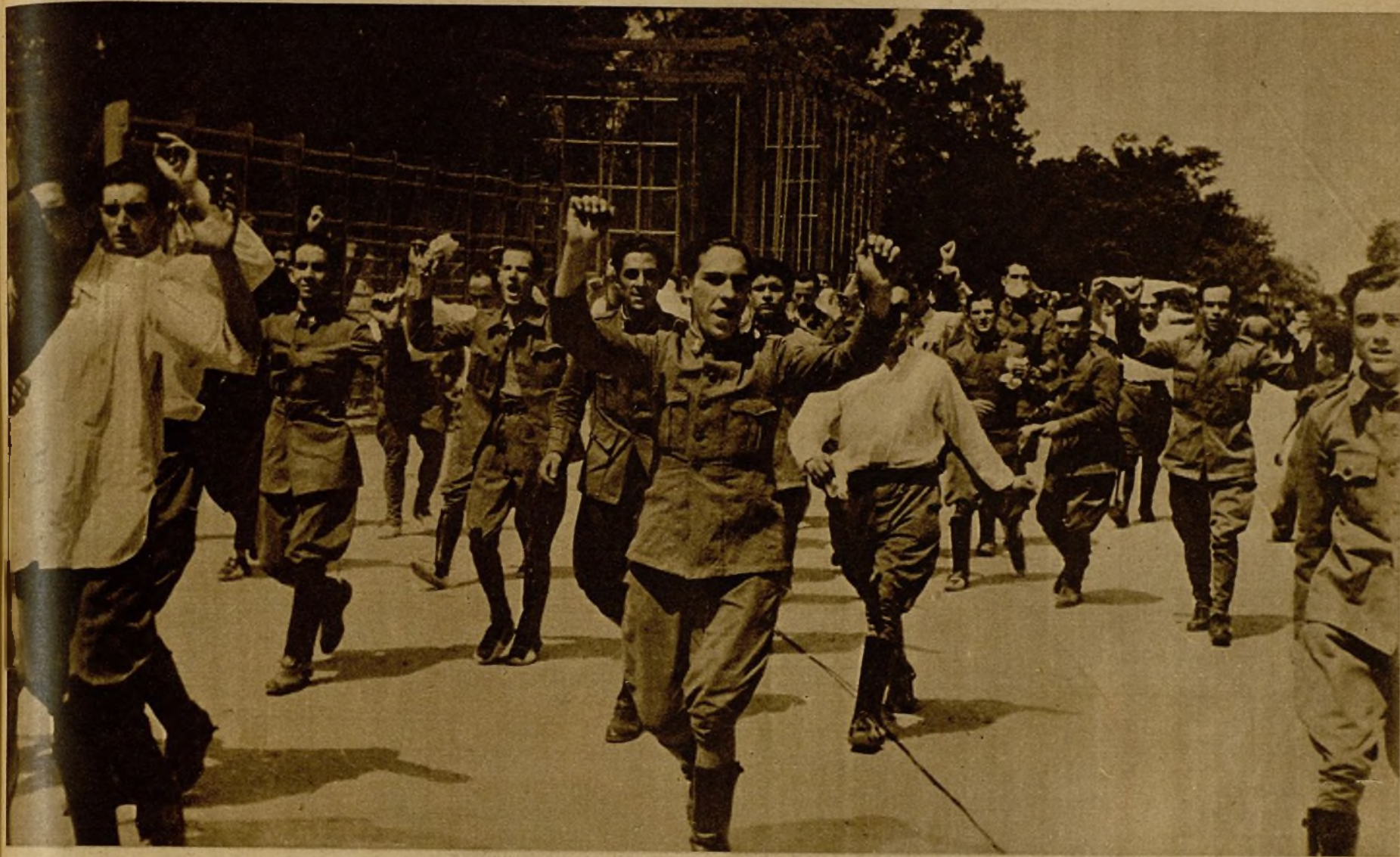
Al entrar la Guardia Civil, las fuerzas de Asalto y las milicias civiles en el cuartel de la Montaña, libertaron a los soldados a quienes los oficiales rebeldes habían recluso en las compañías