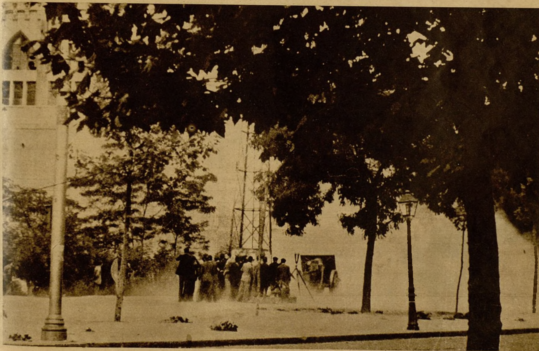
Un cañón situado en la plaza de España disparando contra el cuartel, ocupado por los rebeldes