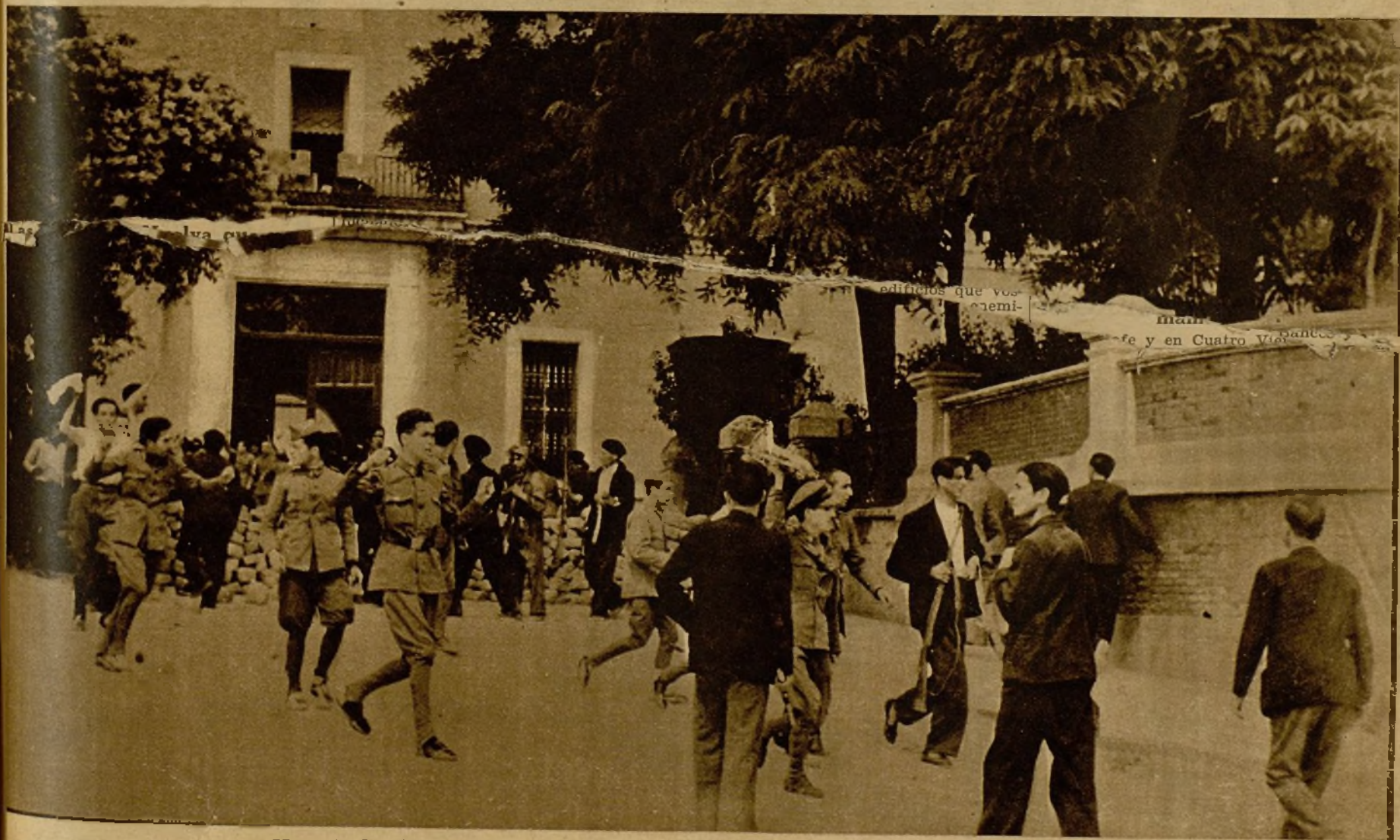
Momento de salir los soldados a la rotonda del cuartel, al ser libertados, vitoreando a la República