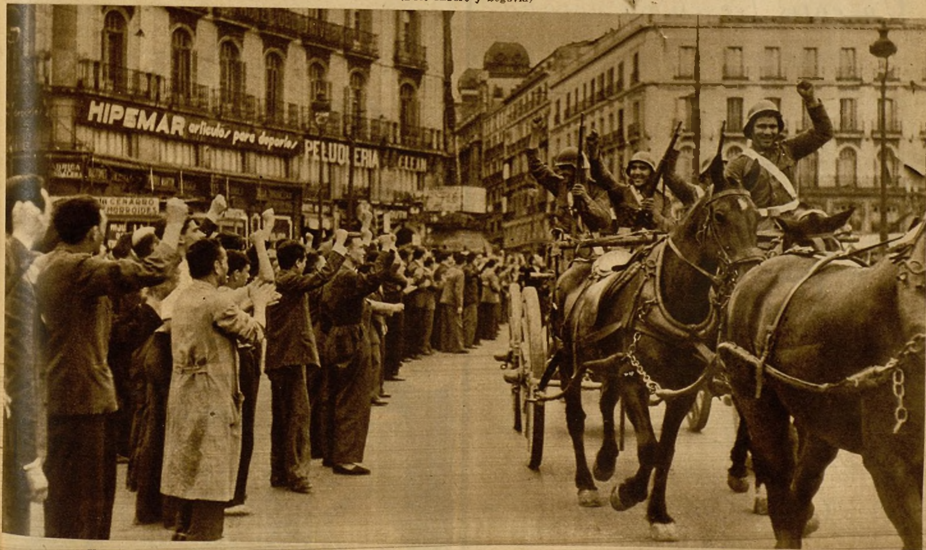
El pueblo rinde una calurosa acogida a los soldados de Artillería, fieles al Poder constituido, que desde Vicálvaro llegan a Madrid