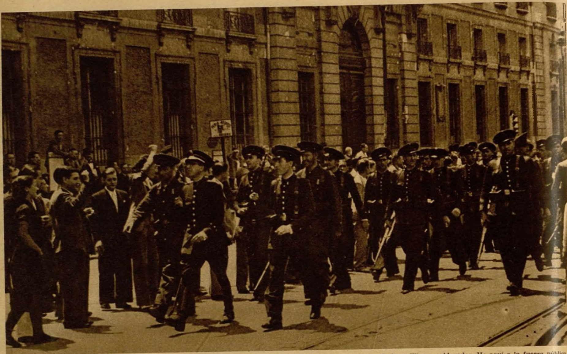
Las fuerzas de Asalto, en unión de la Guardia civil, han cooperado brillantemente a sofocar el movimiento de los militares sublevados. He aquí a la fuerza pública, aclamada por el pueblo, a su paso por la Puerta del Sol.