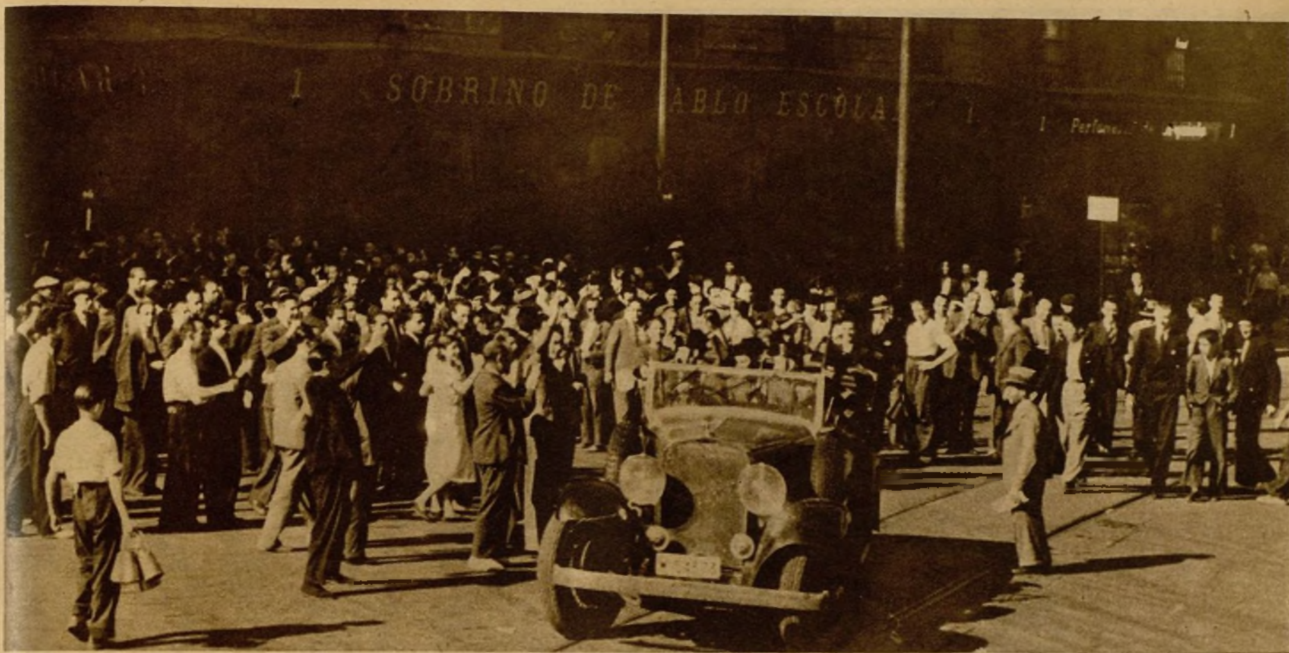
La heroica conducta de la Guardia civil ha desbordado el entusiasmo popular. Constantemente, al modo que se ve en la foto, son objeto los miembros de la Benemérita de calurosas ovaciones a su paso por las calles