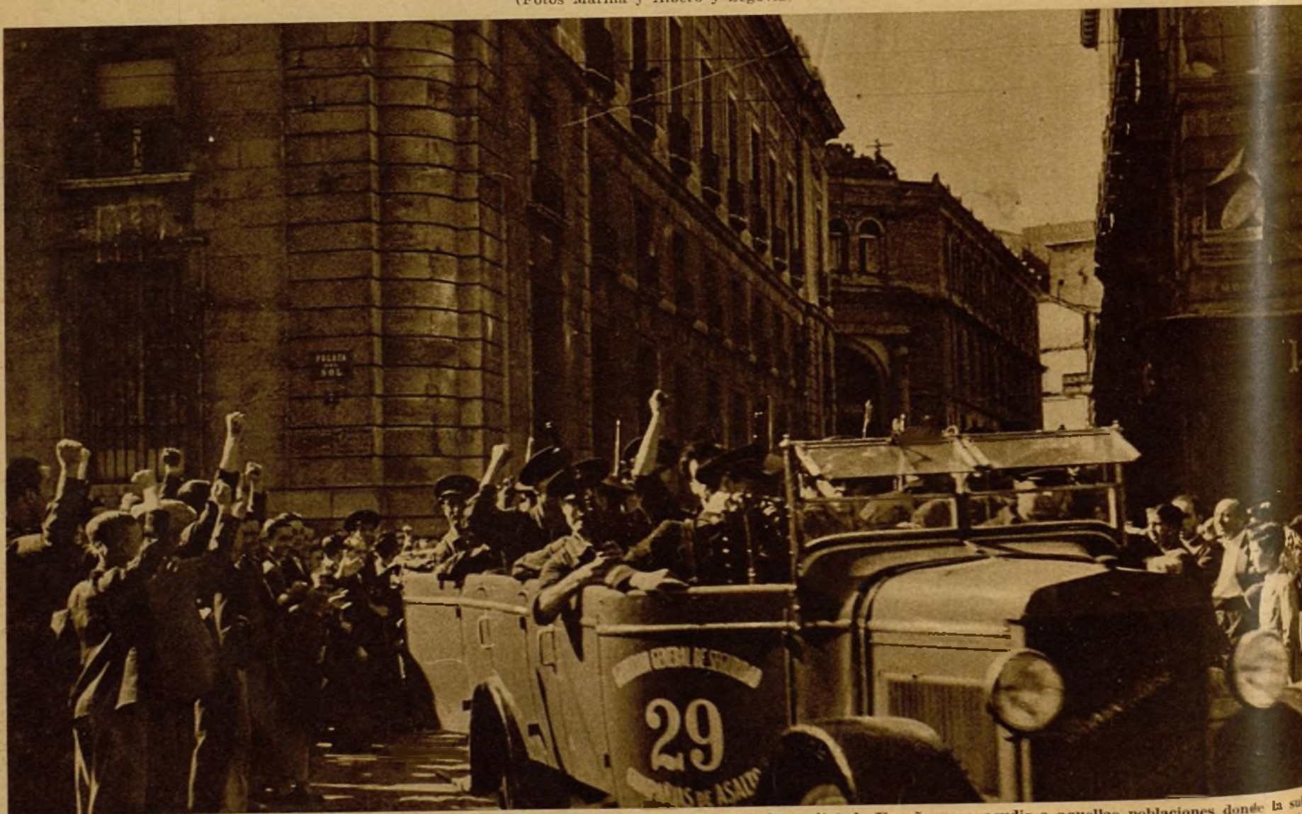
Los guardias de Asalto que prestan servicio en Madrid han tenido que desplazarse fuera de la capital de España para acudir a aquellas poblaciones donde la sublevación militar hacía necesaria su presencia. La presente foto recoge el momento en que unas camionetas de las compañías de Asalto salen del cuartel de Pontejos para sofocar en provincias un foco de rebeldía.