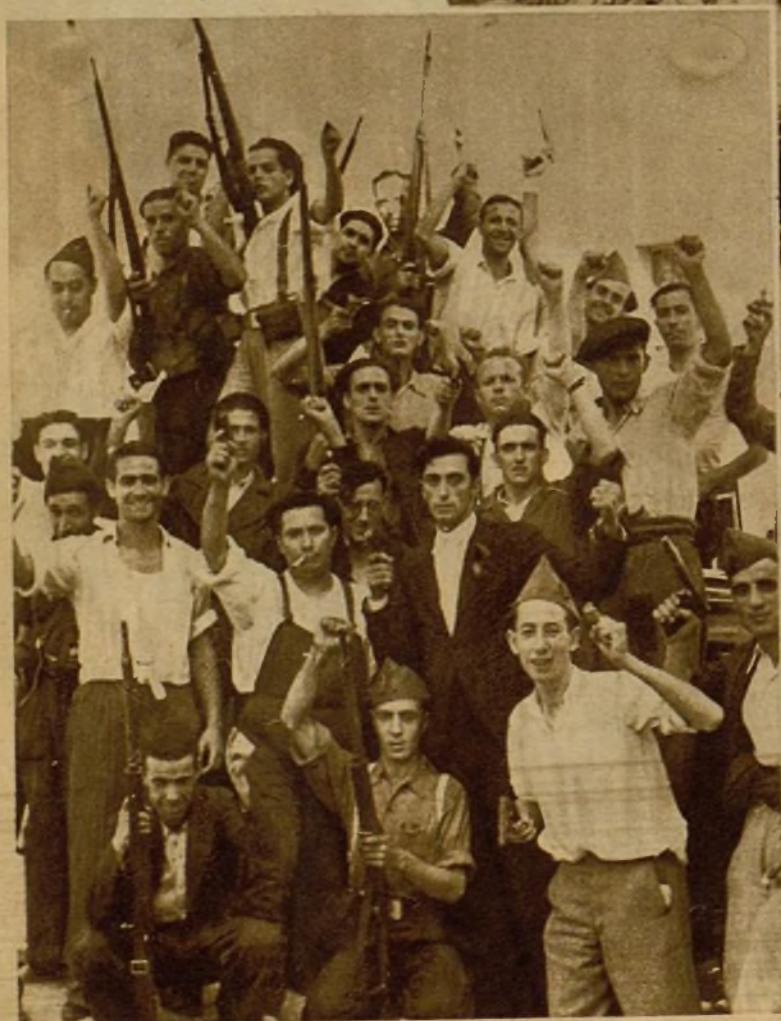
Grupo de milicianos que cooperaron valerosa y eficazmente a la derrota de los rebeldes de Alcalá. A la derecha, soldados que combatieron con admirable espíritu en Alcalá