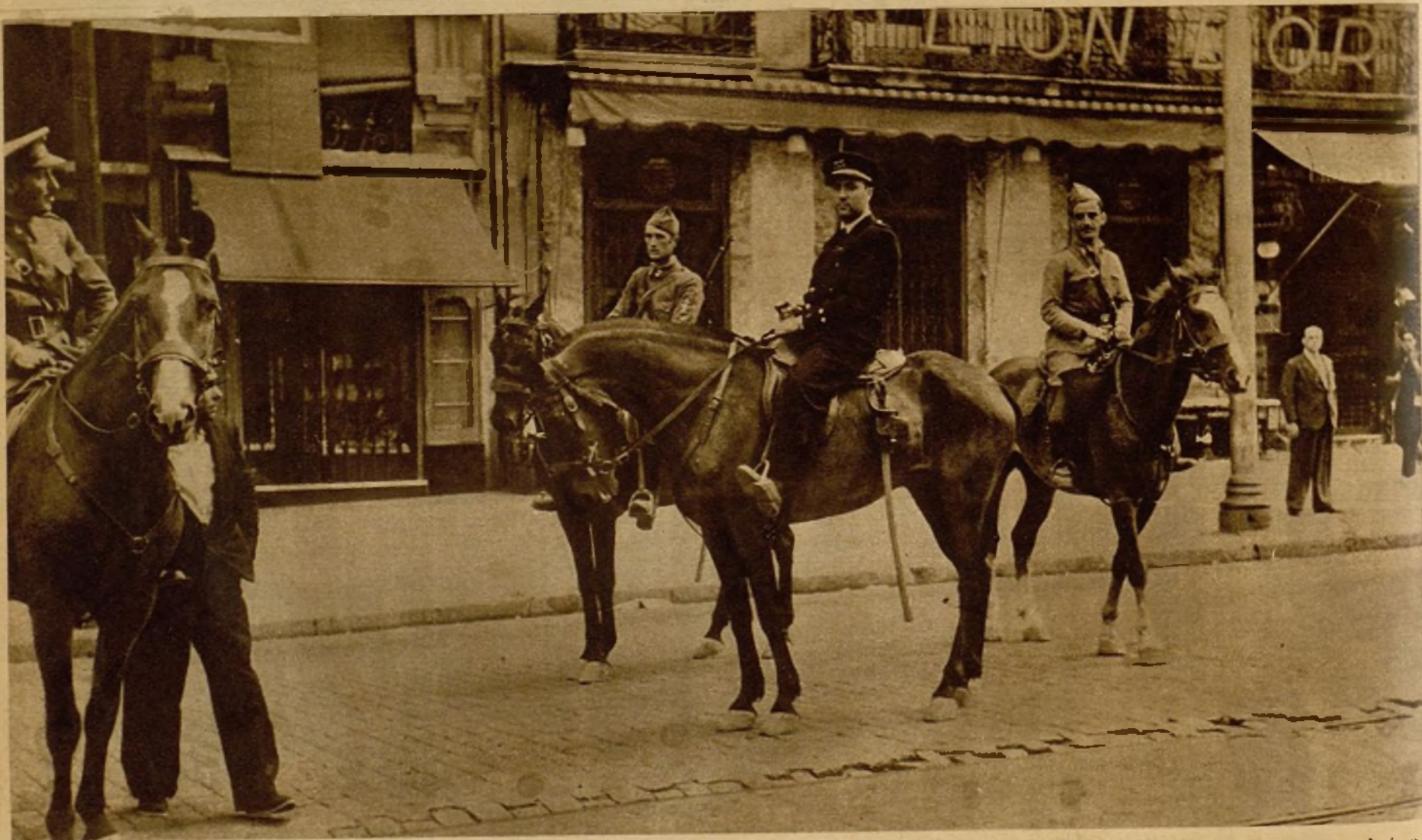
Jefes del regimiento de guarnición en Carabanchel que permanecieron fieles al Gobierno de la República con un capitán de Aviación, que, como todo el glorioso Cuerpo, ha rendido inestimables servicios