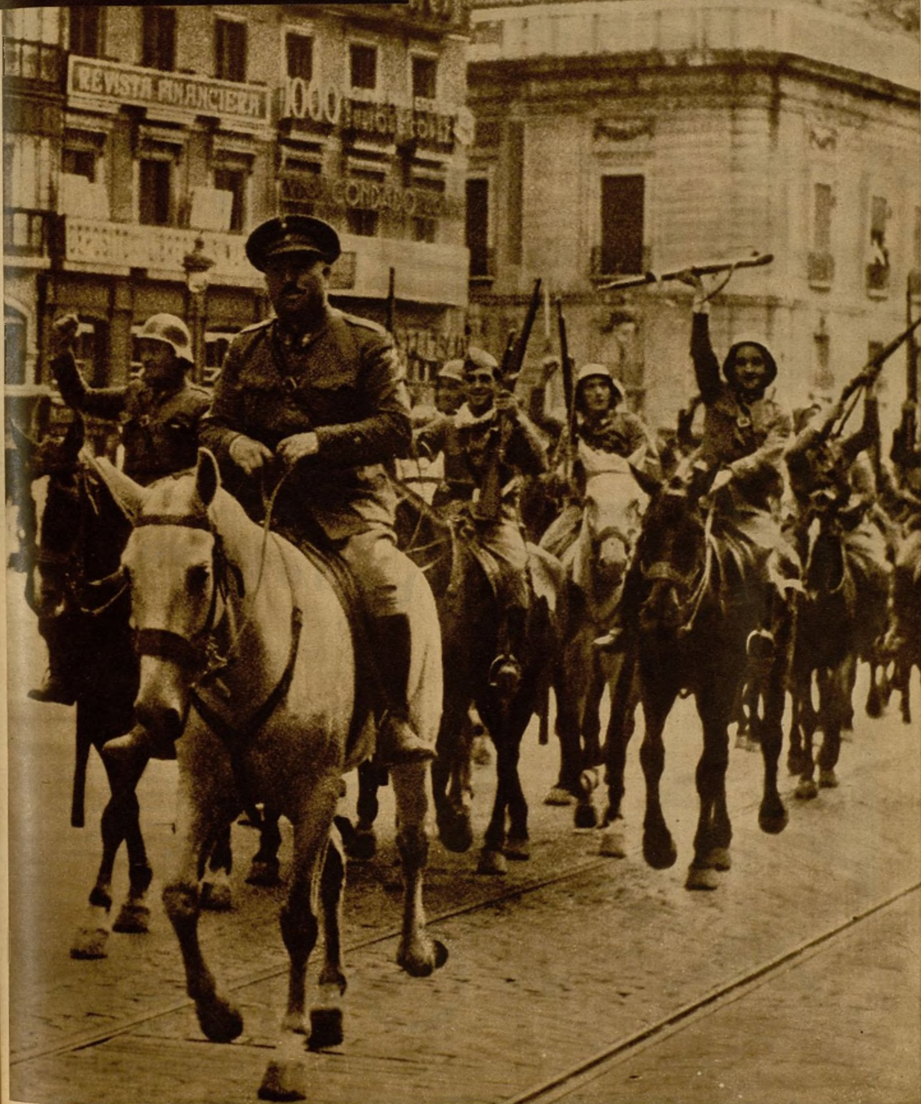
LOS CANTONES DE MADRID, SOMETIDOS.—Un momento del paso por la Puerta del Sol de las tropas de Carabanchel, que, como las de Vicálvaro, Alcalá y El Pardo, prestaron su adhesión al Gobierno, poniéndose a sus órdenes para cooperar al vencimiento de la rebelión