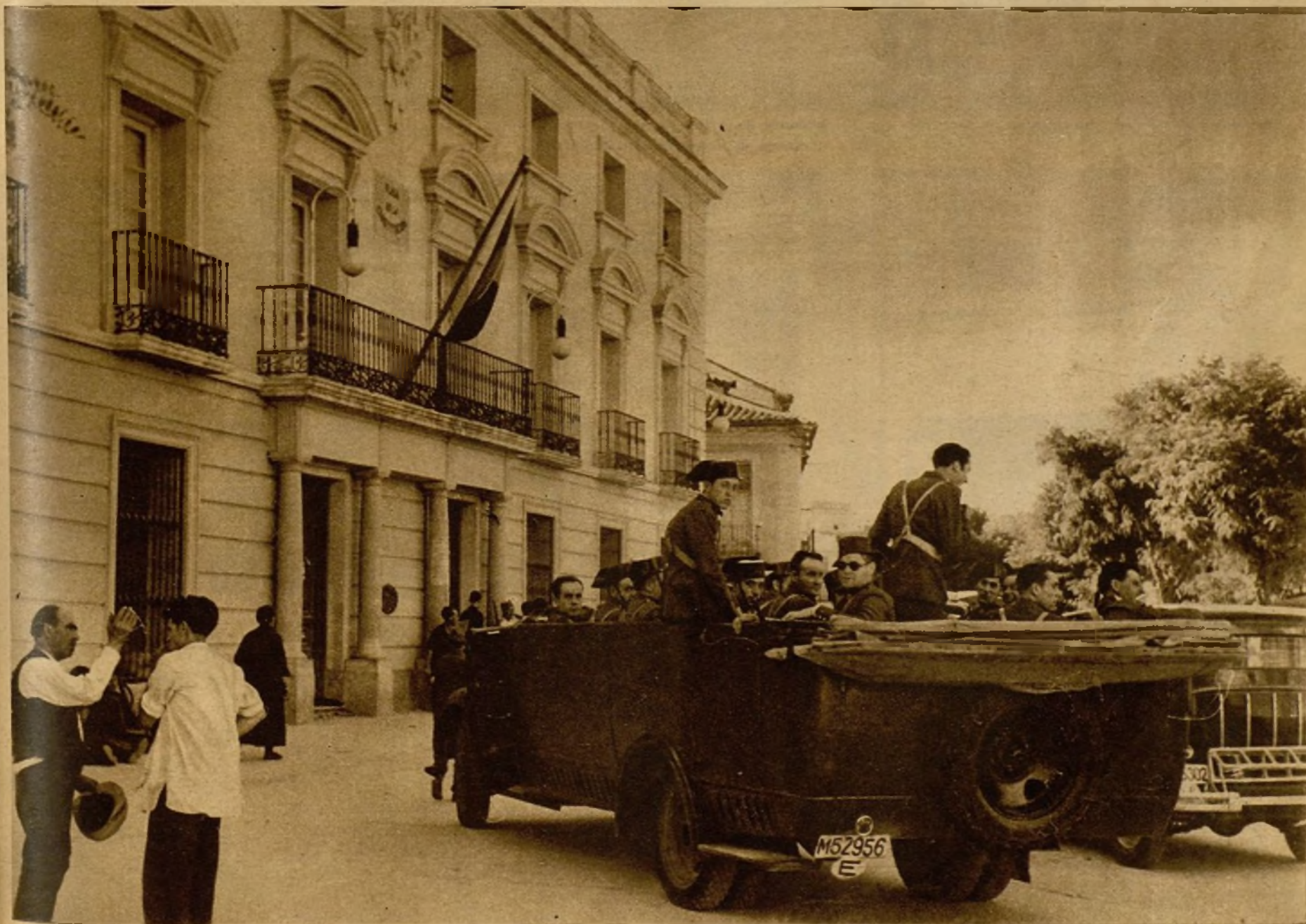
La valerosa actuación de las fuerzas del Gobierno y de las Milicias populares logró una rápida y total victoria sobre los facciosos de Alcalá de Henares. Véanse aquí las fuerzas de la Guardia civil, que contribuyeron con singular eficacia al rotundo triunfo, a la puerta del Ayuntamiento de aquella población