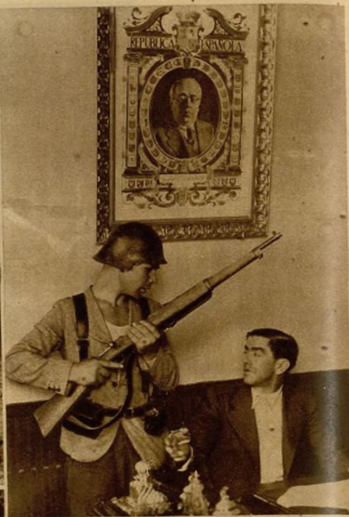
El alcalde de Alcalá de Henares relata a un miliciano la forma en que se inició la rebelión