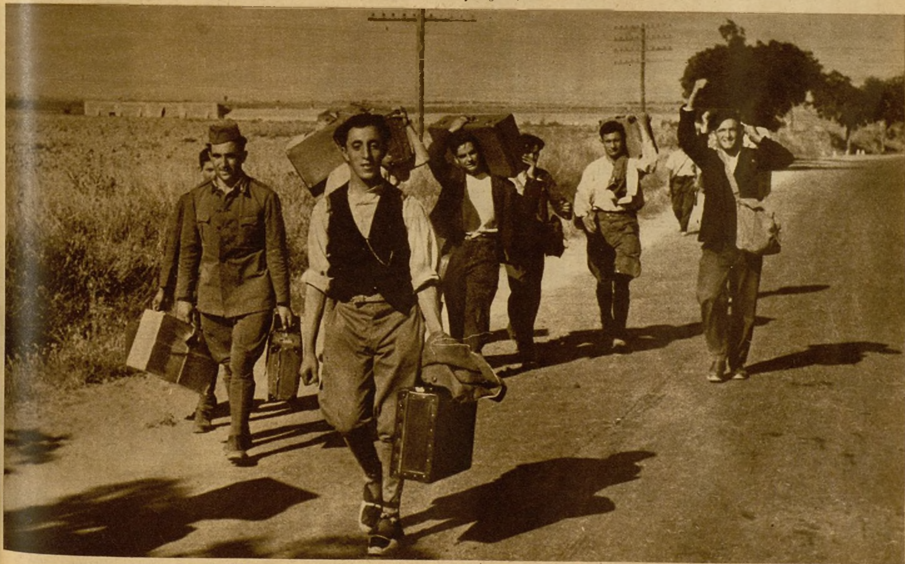
Soldados de Alcalá de Henares, que abandonaron a los rebeldes, con sus equipos en dirección a Madrid