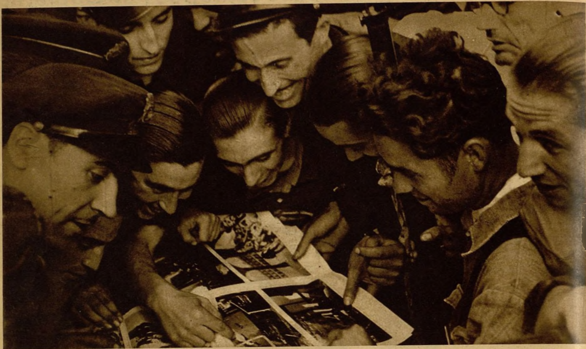
Varios guardias de Asalto y milicianos contemplan en el número de ayer de AHORA fotografías de los episodios del victorioso ataque al cuartel de la Montaña