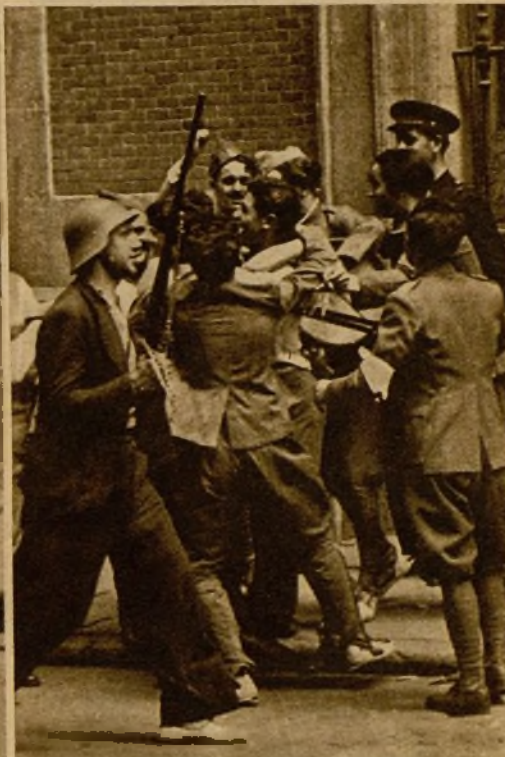
Uno de los emocionantes momentos de la salida de los soldados, que se abrazan a los jóvenes de las milicias

Una vez tomado el cuartel de la Montaña, fueron libertados los soldados que durante la lucha permanecieron en las compañías, bajo la amenaza de jefes y oficiales. Milicianos y milicianas les recibieron con caluroso afecto