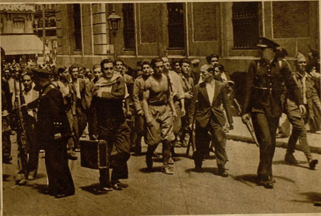
Soldados del cuartel de la Montaña a su paso por la Puerta del Sol. El público les acogió con cariñosos aplausos

Una escena de entusiasmo entre milicianos y soldados del cuartel de la Montaña. Los voluntarios acompañaron por las calles a los libertados en jubilo fraternización