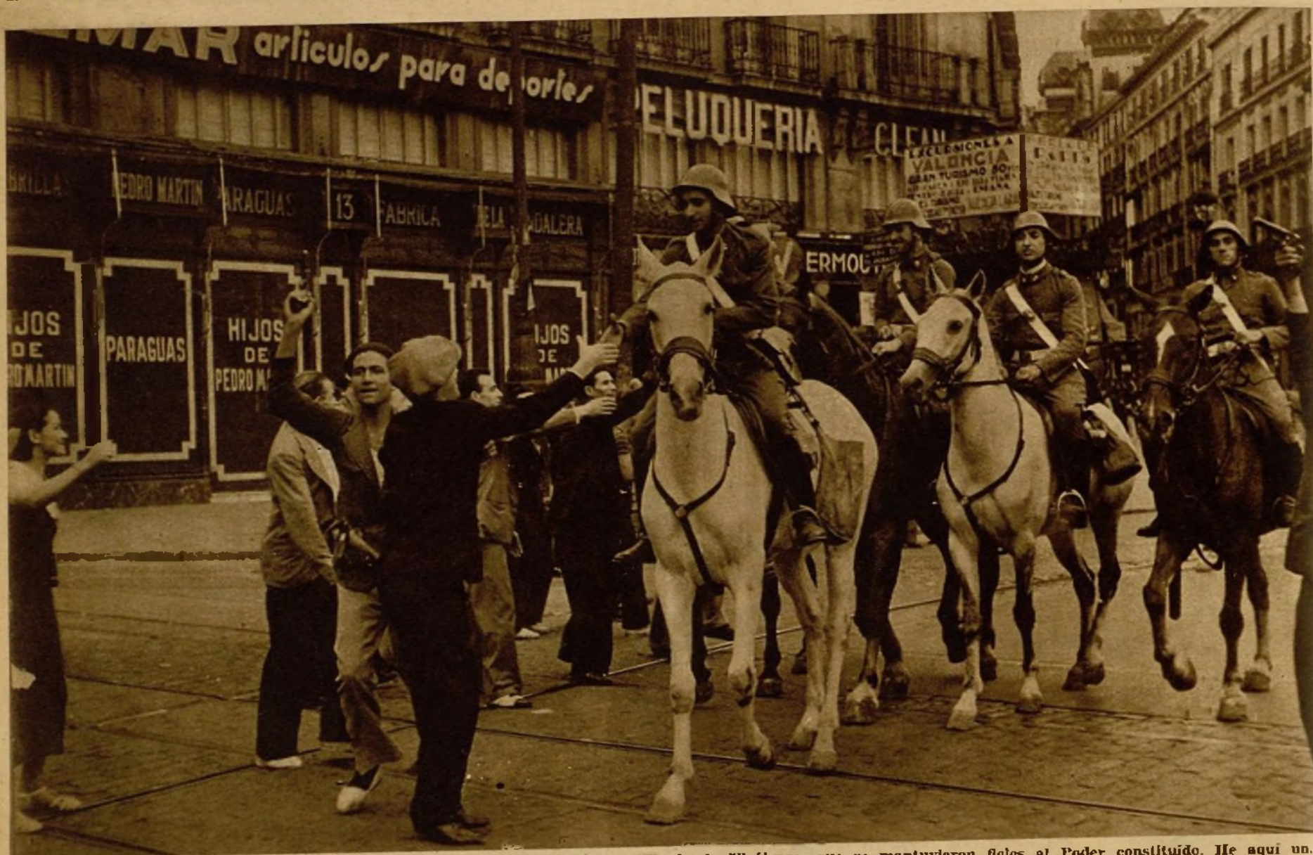
Los milicianos y el público fraternizaron en las calles con los soldados de Artillería de Yicálvaro, que se mantuvieron fieles al Poder constituido. He aquí una escena de calurosa camaradería