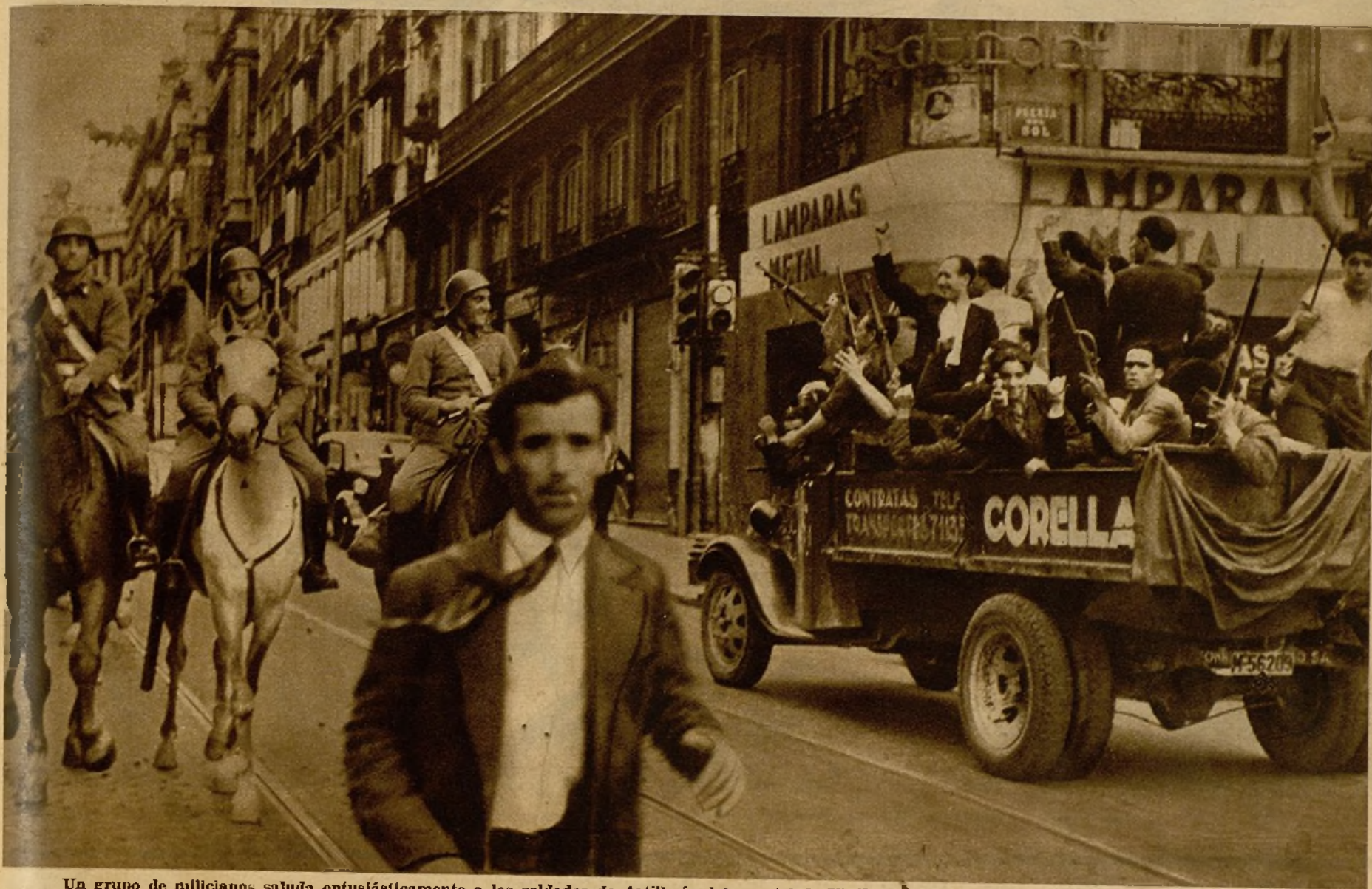
Un grupo de milicianos saluda entusiastamente a los soldados de Artillería del cuartel de Vicálvaro, que se han puesto a disposición del Gobierno