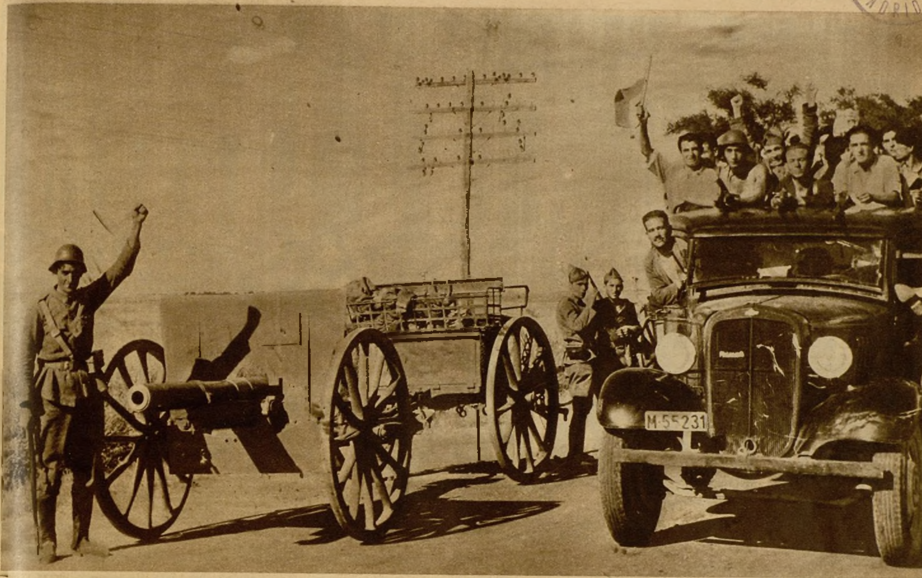
Milicianos y soldados, que rivalizaron en ardimiento y empuje para la derrota de los facciosos de Alcalá, a su regreso a Madrid