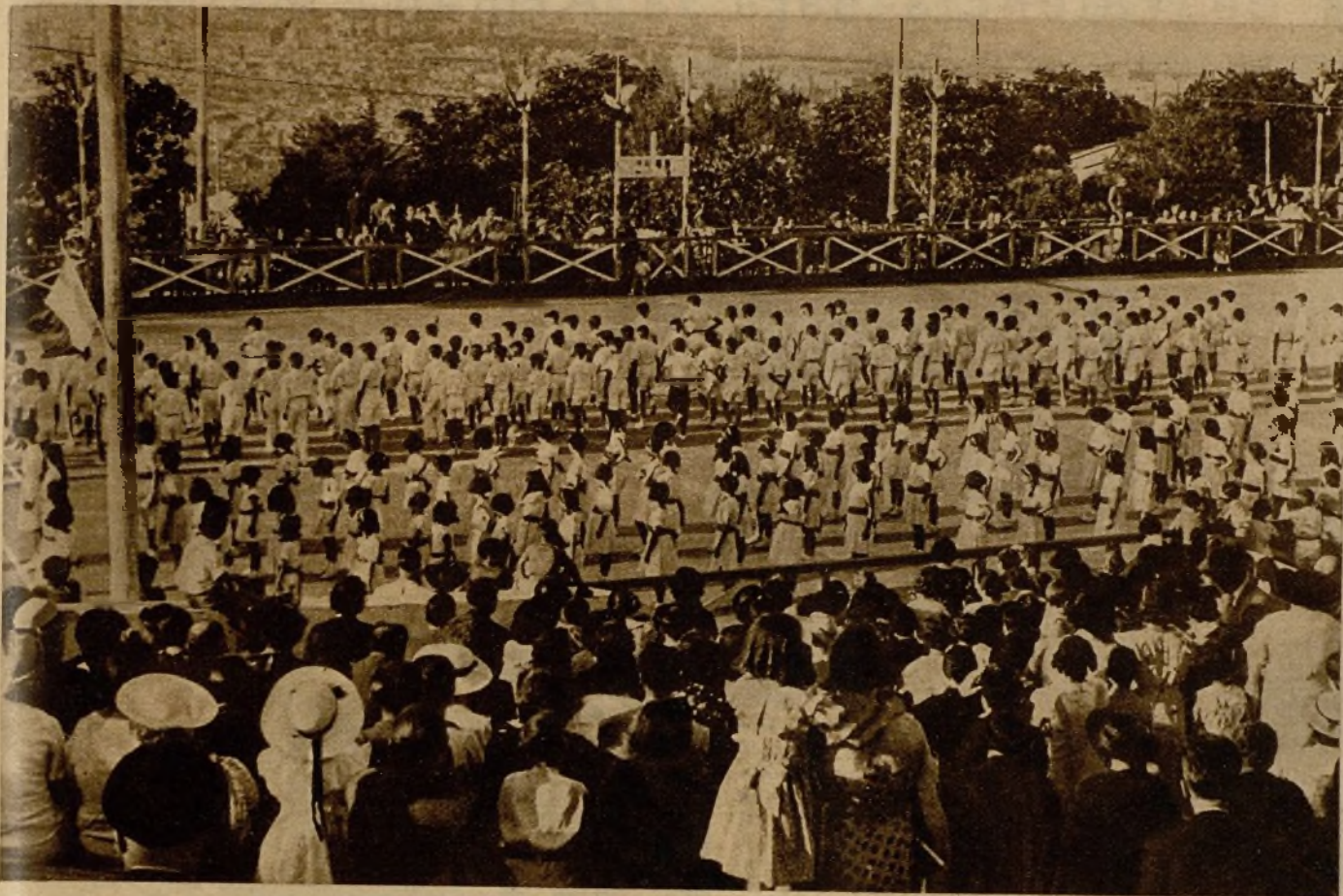
En el Parque Maricel, de Barcelona, se ha celebrado un festival infantil, organizado por la colonia francesa, en conmemoración de la histórica fecha del 14 de julio