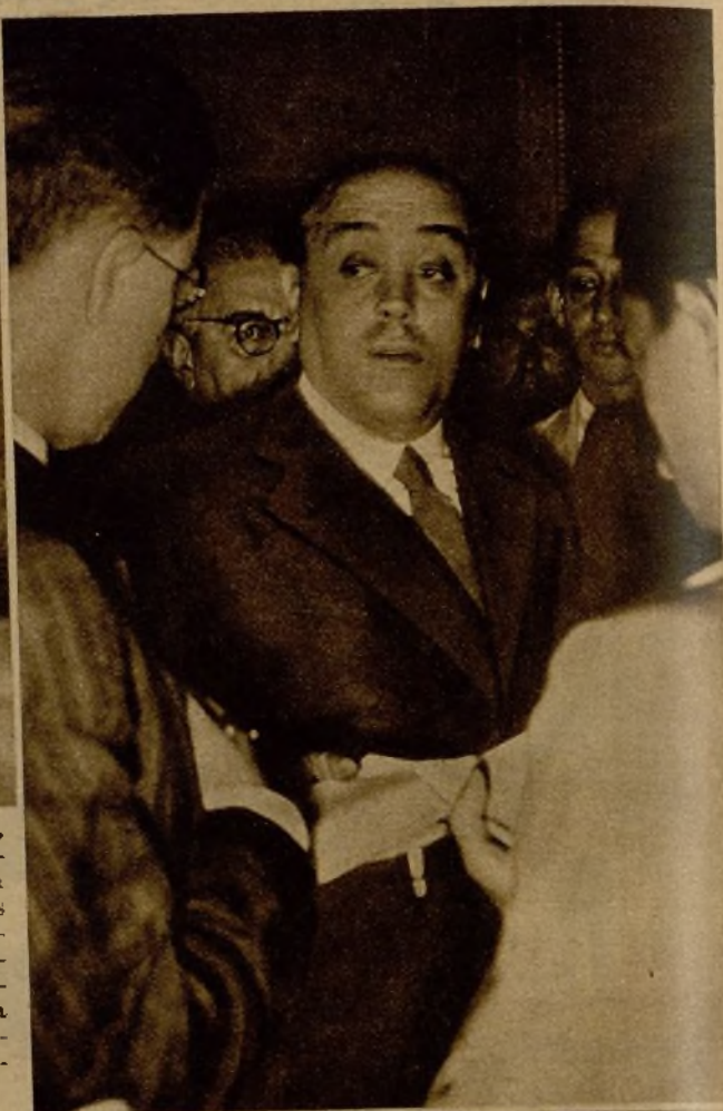
Los señores Gil Robles, Ventosa, Cid y conde de Vallpellano momentos antes de la reunión de la Diputación permanente de las Cortes. A la derecha: El presidente de las Cortes, señor Martínez Barrio, rodeado por los periodistas después de celebrada la reunión de la Diputación permanente, en la que se acordó la prórroga del estado de alarma