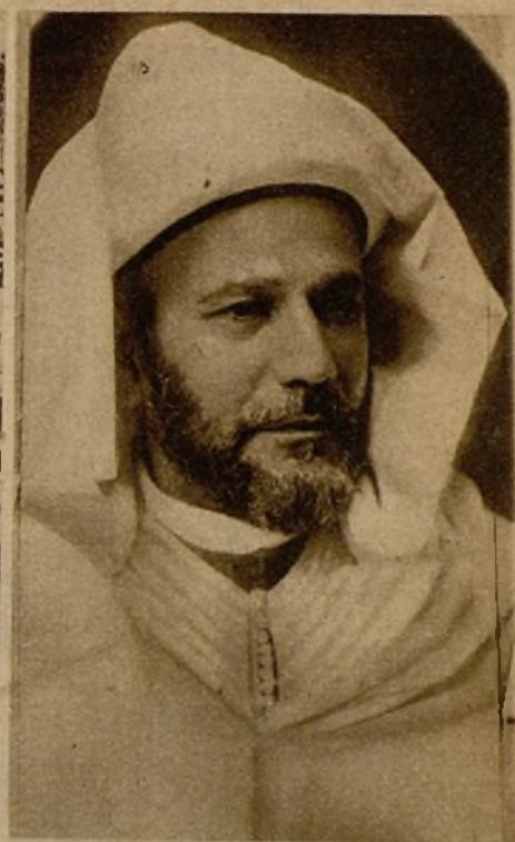
El notable musulmán Sidi Ores El Riff, leal amigo de España, a la que ha prestado extraordinarios servicios desde la guerra del Rif, que ha sido nombrado bajá de la santa ciudad de Xauen