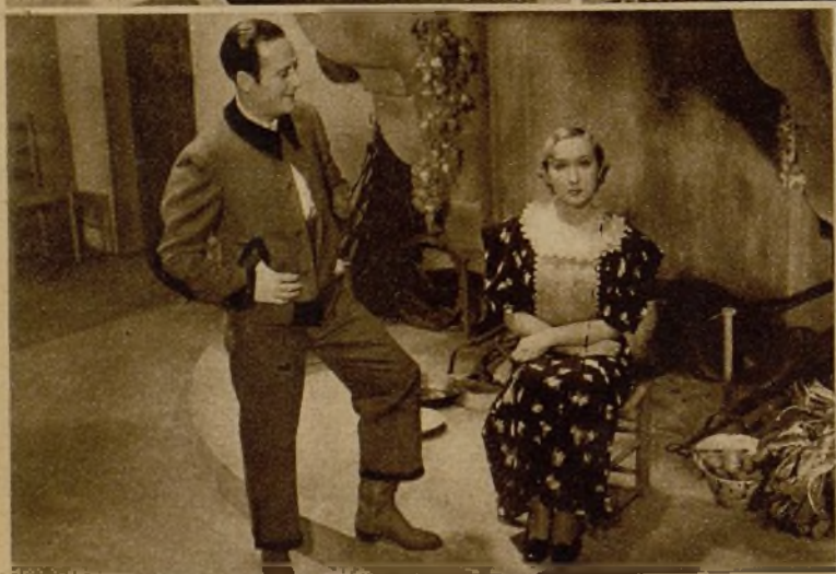
La gracia de Zasu Pitts resurge en "Así se escribe la historia". A la derecha: El gran actor Shanty en una escena de "Los últimos días de Pompeya". En la foto de la izquierda: La comedia "El rayo" se ha llevado a la pantalla con Mercedes Prendes y Salvador Soler-Mari como protagonistas