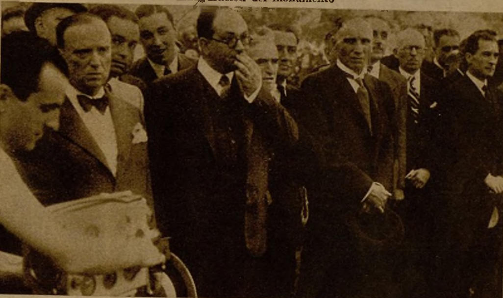
Grupo de ex combatientes catalanes, supervivientes de la Gran Guerra, que asistieron, especialmente invitados, al solemne acto

Con asistencia de las autoridades de Barcelona, miembros del Gobierno de la Generalidad, cónsul de Francia y una representación del Ejército de este país se ha inaugurado en el Parque de la Ciudadela el monumento dedicado a los catalanes que murieron en la Gran Guerra. He aquí la notable obra escultórica