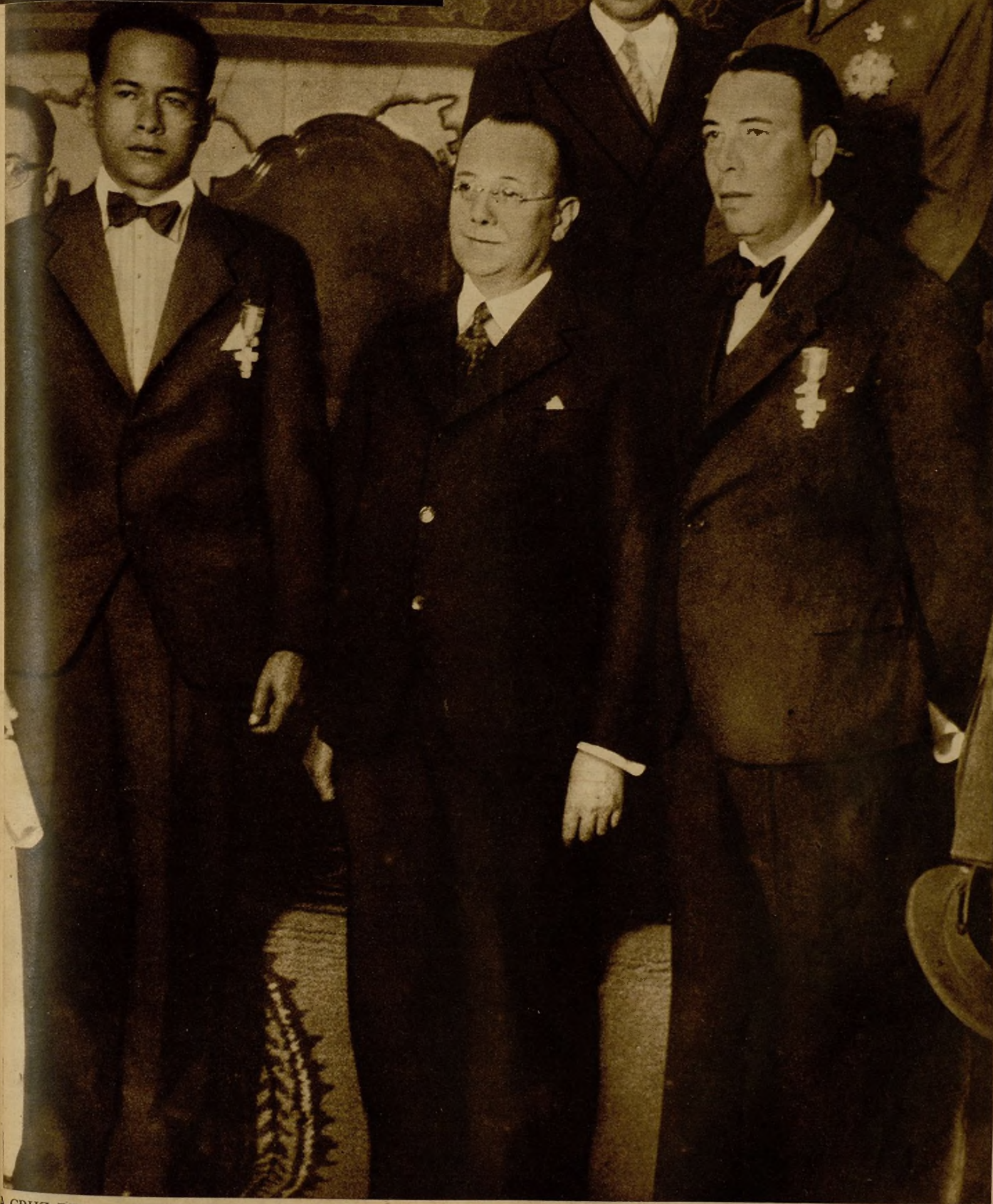
LA CRUZ DEL MERITO NAVAL A LOS AVIADORES FILIPINO S CALVO Y ARNAIZ.—En el Ministerio de Marina se ha celebrado un solemne acto en honor de los héroes del aire Calvo y Arnáiz, a quienes el Gobierno español ha concedido la cruz del Mérito Naval. En la foto aparecen los ilustres aviadores con el ministro de Marina después de haberle sido impuesta a ambos la preciada condecoración