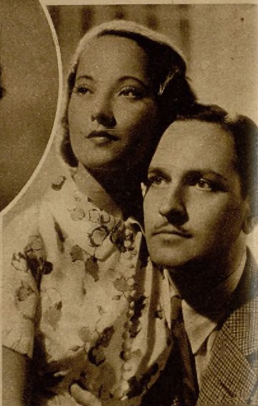
Fredric March y Merle Oberon en "El ángel de las tinieblas"