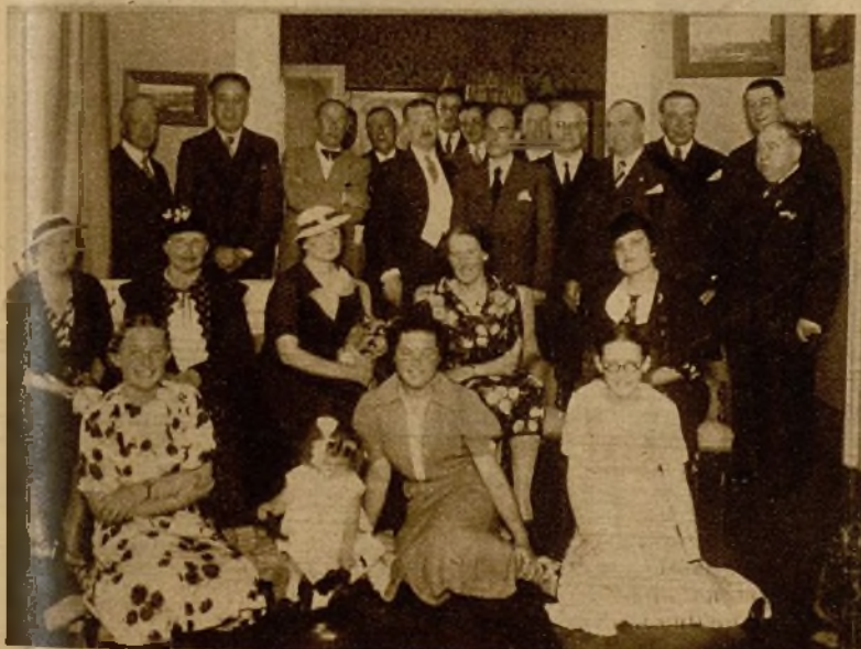
En el Consulado francés de La Coruña, con motivo de celebrarse el CXLVII aniversario de la toma de la Bastilla, se verificó una brillantísima recepción, a la que concurrieron distinguidos miembros de la colonia francesa y muchos amigos de la nación vecina