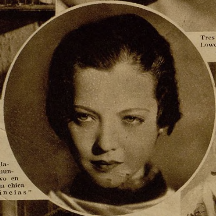
Janet Gainer, la llamada "novia del mundo", surge de nuevo en la pantalla con "Una chica de provincias"