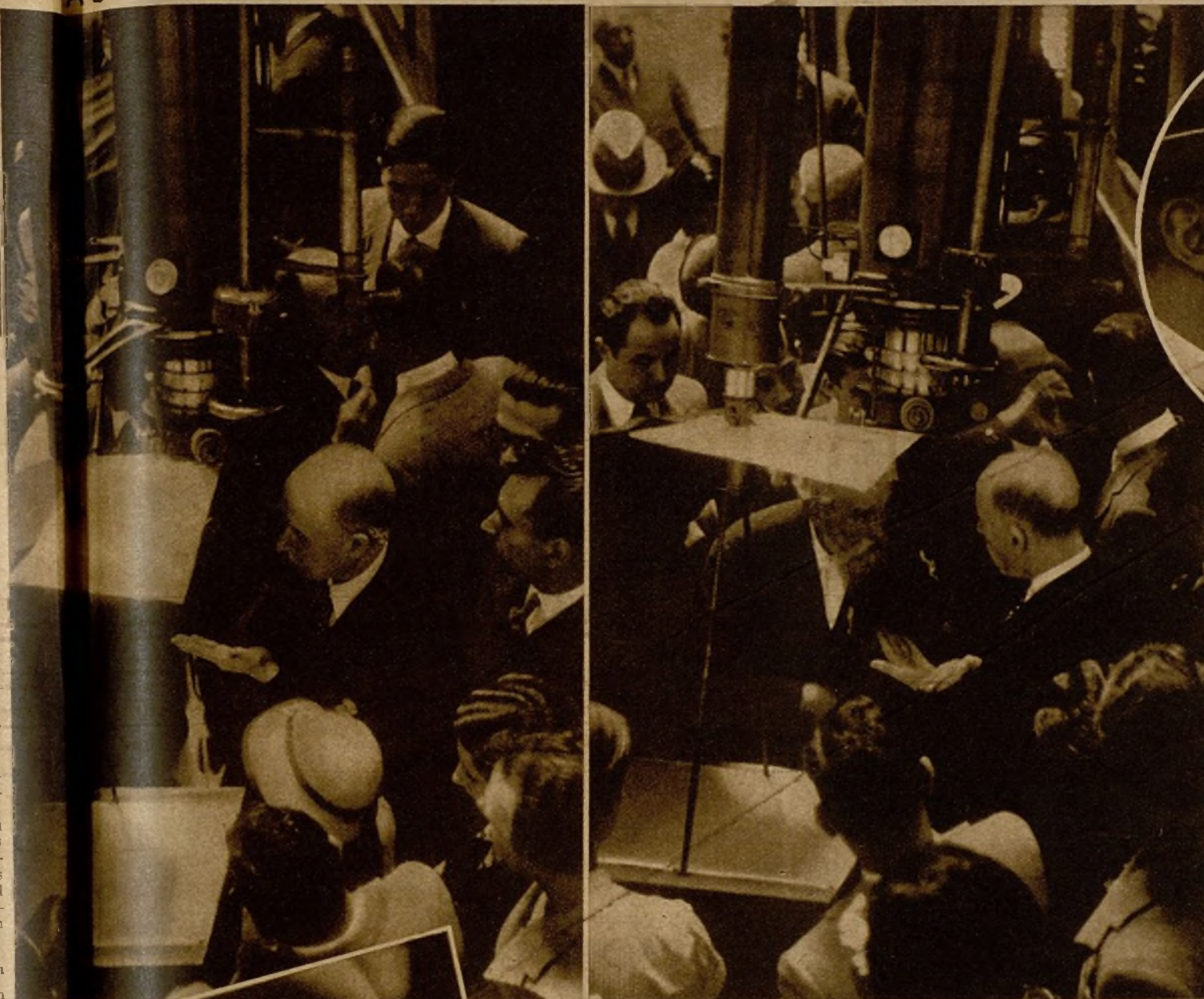
Uno de los delegados extranjeros, contemplando las manchas del sol durante la fiesta de estudio en el Observatorio Fabra