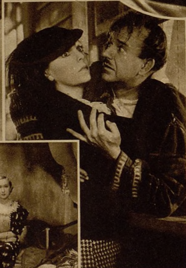
"Impetus de juventud" es la culminación del arte humano y profundo de Sylvia Sidney