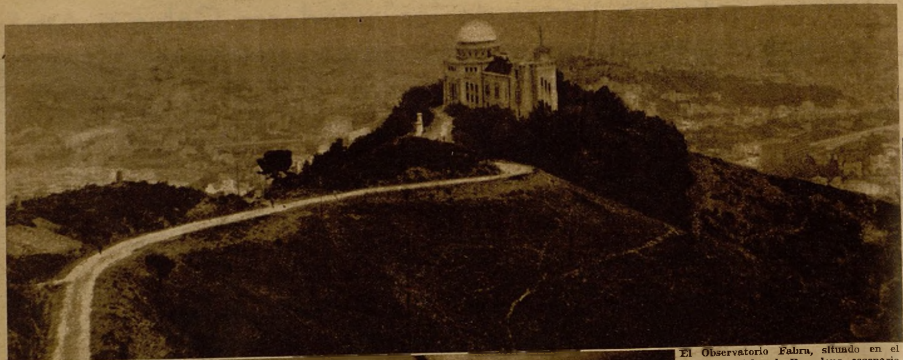
El Observatorio Fabra, situado en el monte Tibidabo, de Barcelona, escenario de la Fiesta del Sol

En Barcelona acaba de celebrarse la Fiesta del Sol. A primera vista, esta denominación les habrá sugerido la idea de algo exótico y extraordinario. Un rito complicado de alguna tribu salvaje del África o de la Oceanía, o cualquier ceremonia sagrada de la antigüedad. Pero no hay nada de eso. La fiesta a que nos referimos en esta información con todo y tener unos ribetes de paganismo es esencialmente científica e intelectual.