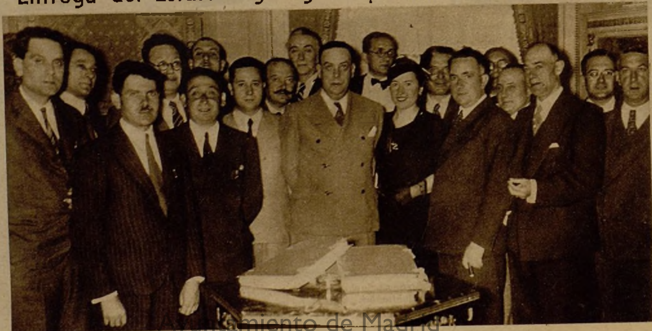
Los alcaldes de las provincias gallegas esperan a ser recibidos por el presidente de las Cortes, con objeto de hacerle entrega del Estatuto gallego