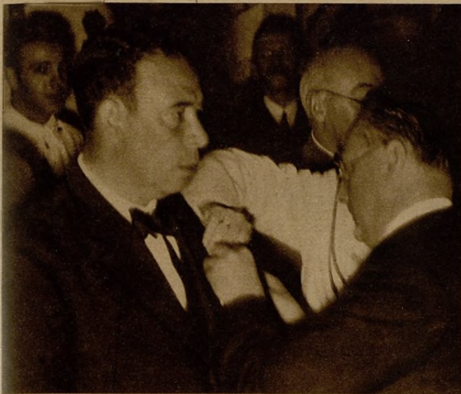
El ministro de Marina, señor Giral, en el solemne acto de la imposición de la cruz del Mérito Naval a los aviadores filipinos Calvo y Arnáiz. El acto se verificó en el Museo Naval. A la derecha, el ministro de Marina y el piloto Arnáiz