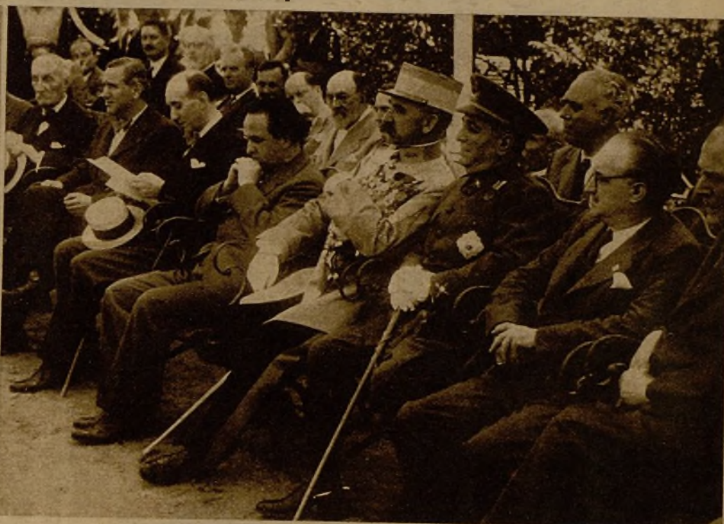
Autoridades de Cataluña, diplomáticos y representante militar francés, durante el acto de inauguración del monumento