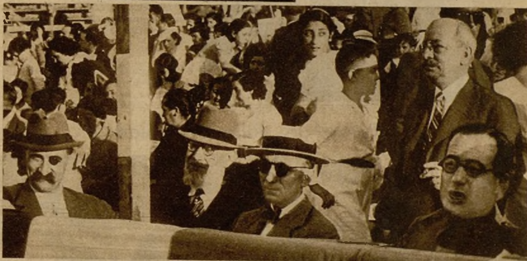
Presidencia de la brillante fiesta infantil celebrada en la ciudad condal con motivo de la fiesta nacional francesa que conmemora la toma de la Bastilla