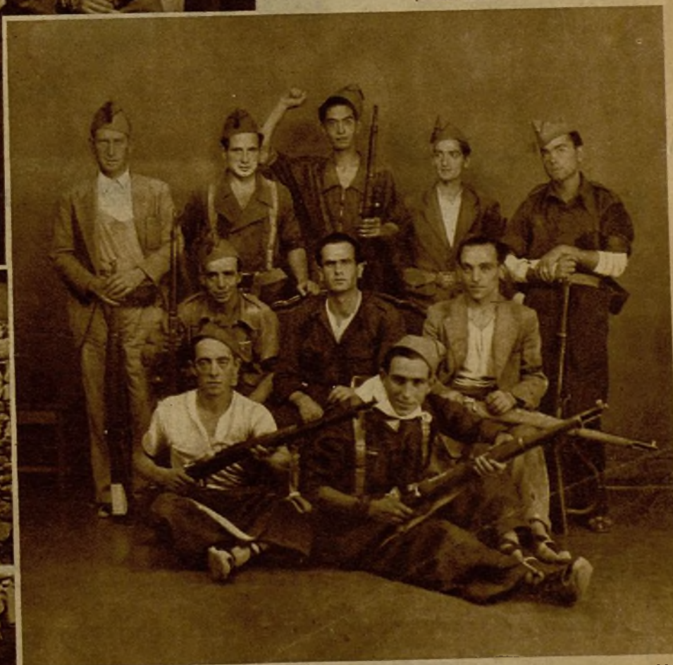
En las afueras de los pueblos, los vecinos ejercen una severa vigilancia. He aquí la entrada de uno de ellos, guardada por los milicianos