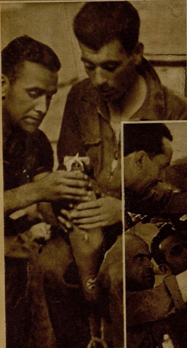
Examinando una bomba, momentos antes de ser colocada en uno de los aviones