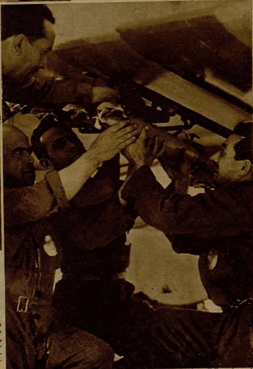
Los soldados colocando las bombas en las alas de los aparatos, que poco después han de salir para el frente, donde ejercen una acción de formidable eficacia contra las concentraciones rebeldes