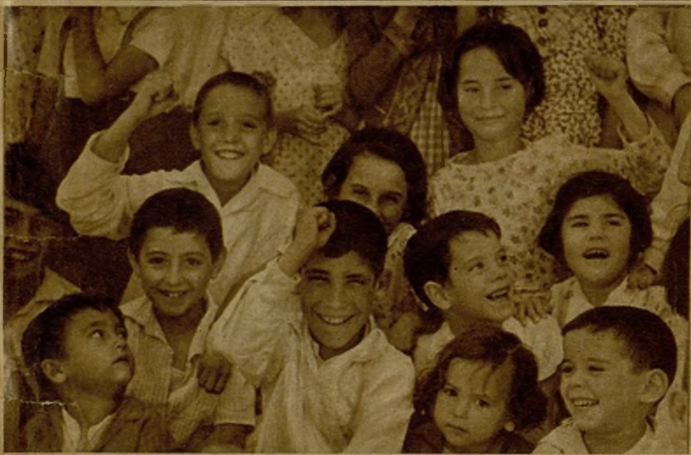
Los chiquitines pasan alegremente el día, repartido entre las clases y las alborozadas horas de recreo