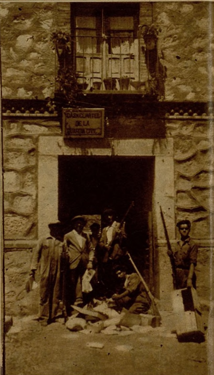
Momento de la detención de uno de los fascistas que hicieron fuego desde la torre de la iglesia de Arenas de San Pedro contra los milicianos, que redujeron a los sediciosos