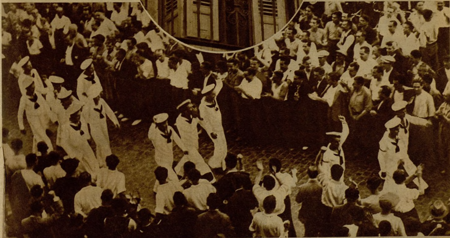
Los marineros del buque de guerra "Lepanto" aclamados por la multitud en la plaza de Castelar