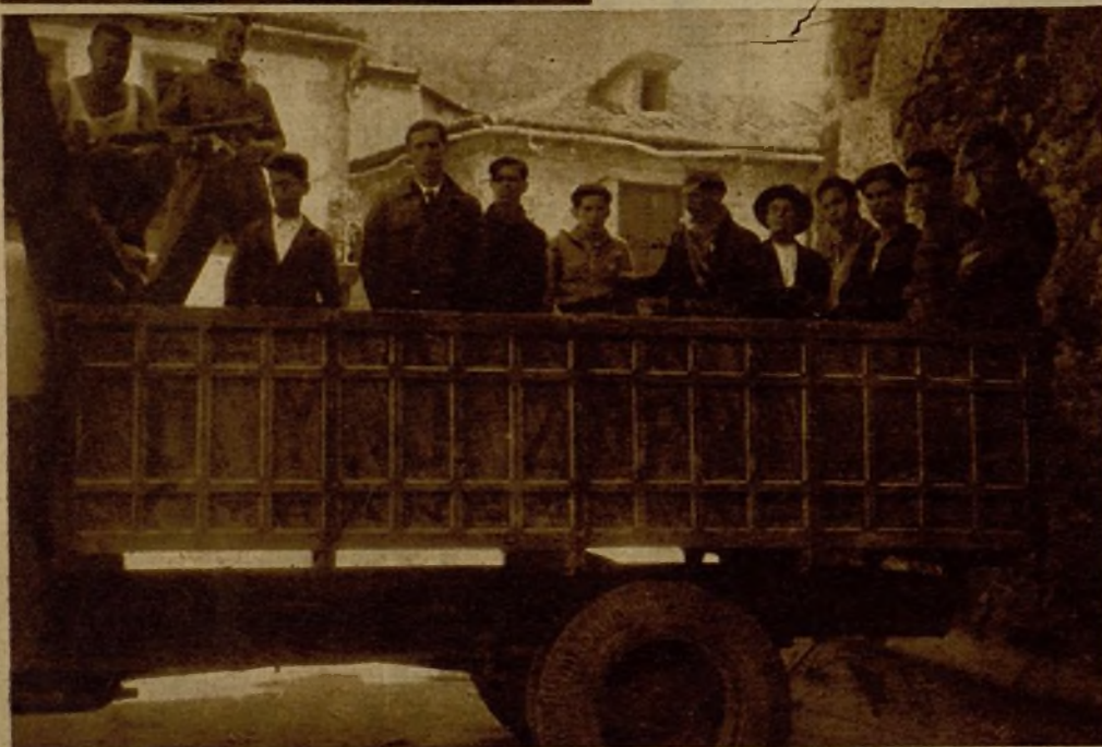
Fascistas detenidos en Arenas de San Pedro, que los milicianos transportaron en un camión para entregarlos a la autoridad