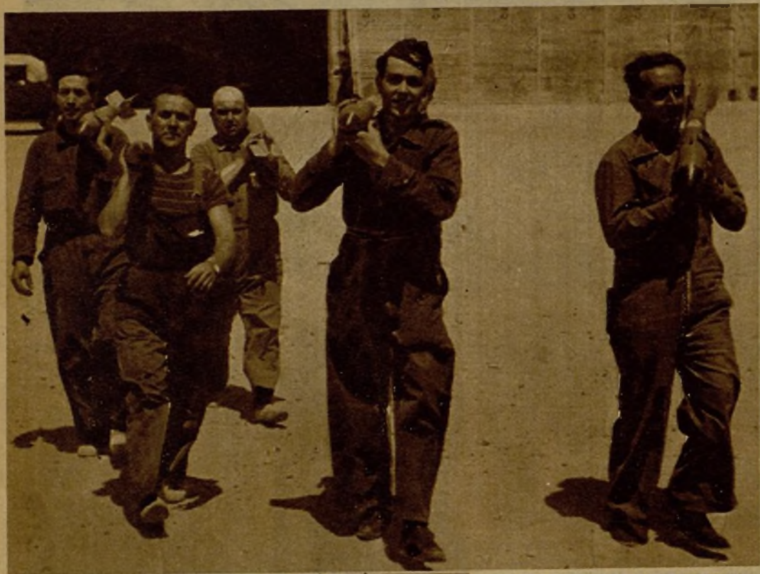
Soldados transportando bombas para ser colocadas en los aviones