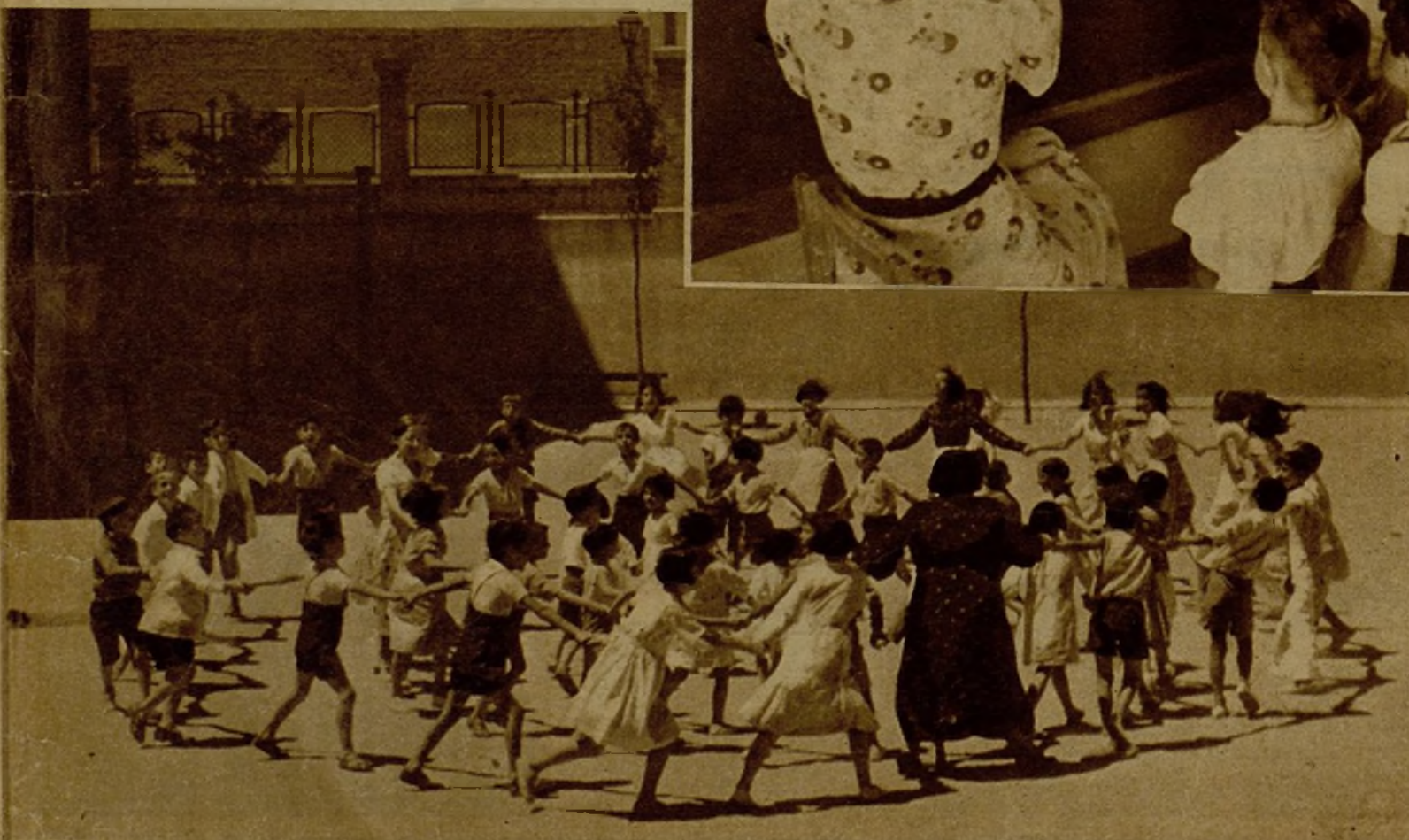
Desde primera hora de la mañana, los pequeños alumnos disfrutan del recreo en el jardín, donde permanecen casi todo el día. Véaseles jugando al corro, al cuidado de la profesora