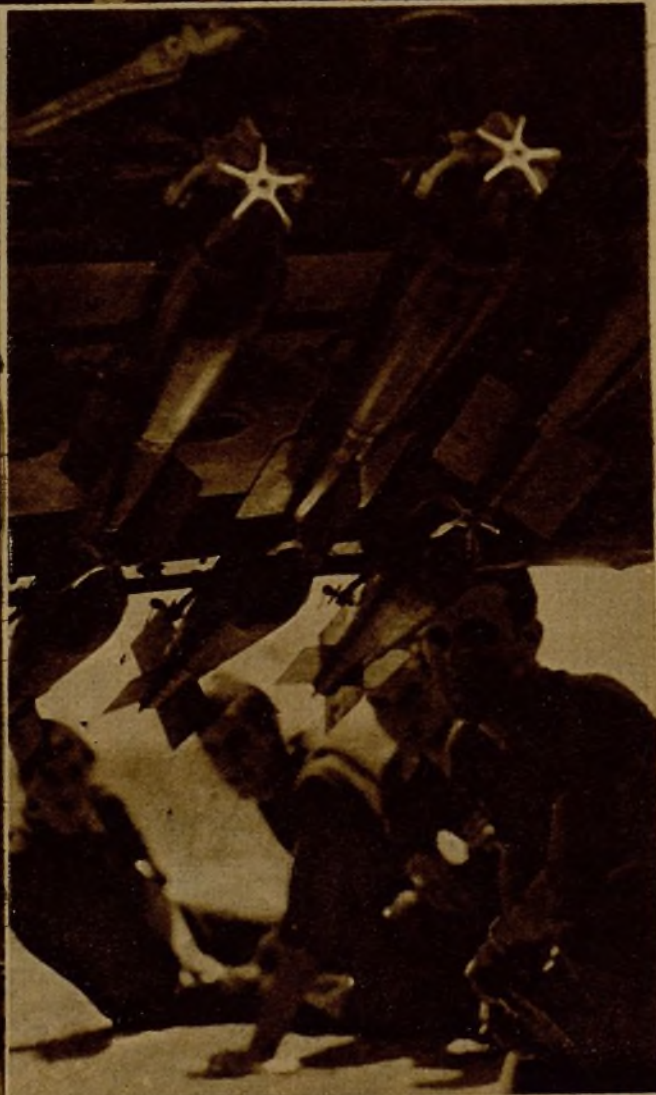
Un avión, provisto ya de su cargamento de bombas, preparado para emprender el vuelo