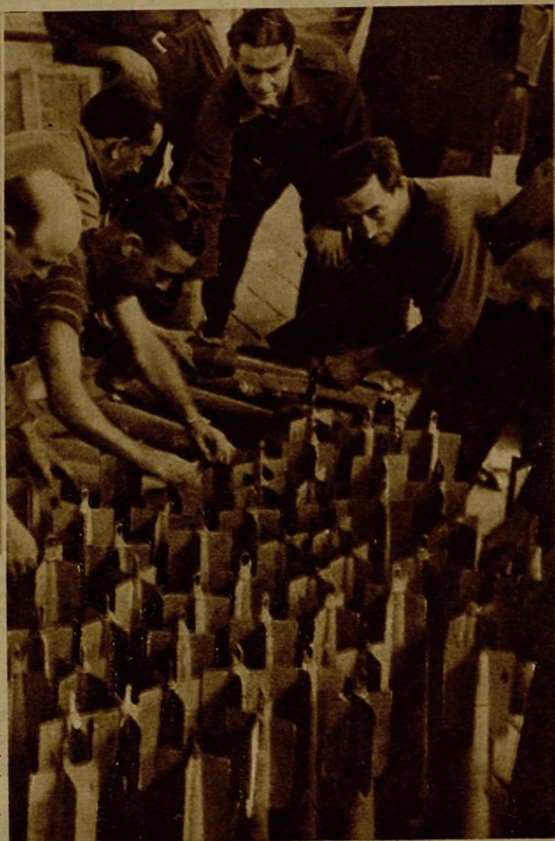
Soldados especializados repasando las bombas antes de ser transportadas a los aparatos, que las arrojarán en las posiciones enemigas