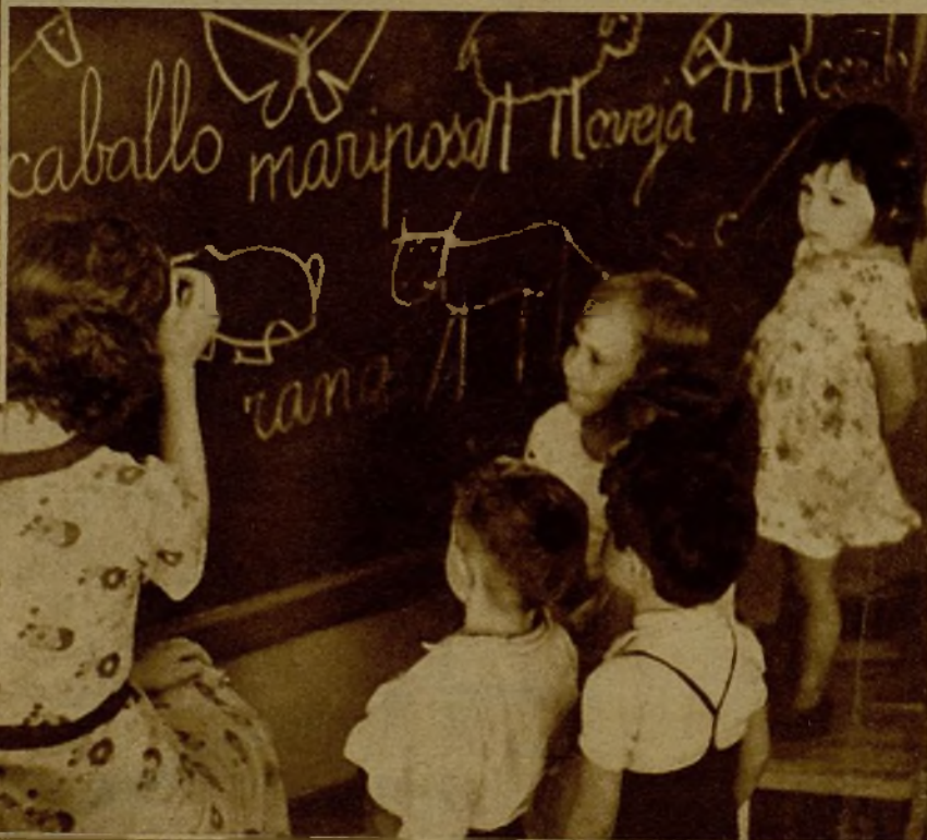
Los hijos de los milicianos durante una de las clases, que constituyen para ellos motivo de distracción y divertimento, en el Grupo escolar Amador de los Ríos