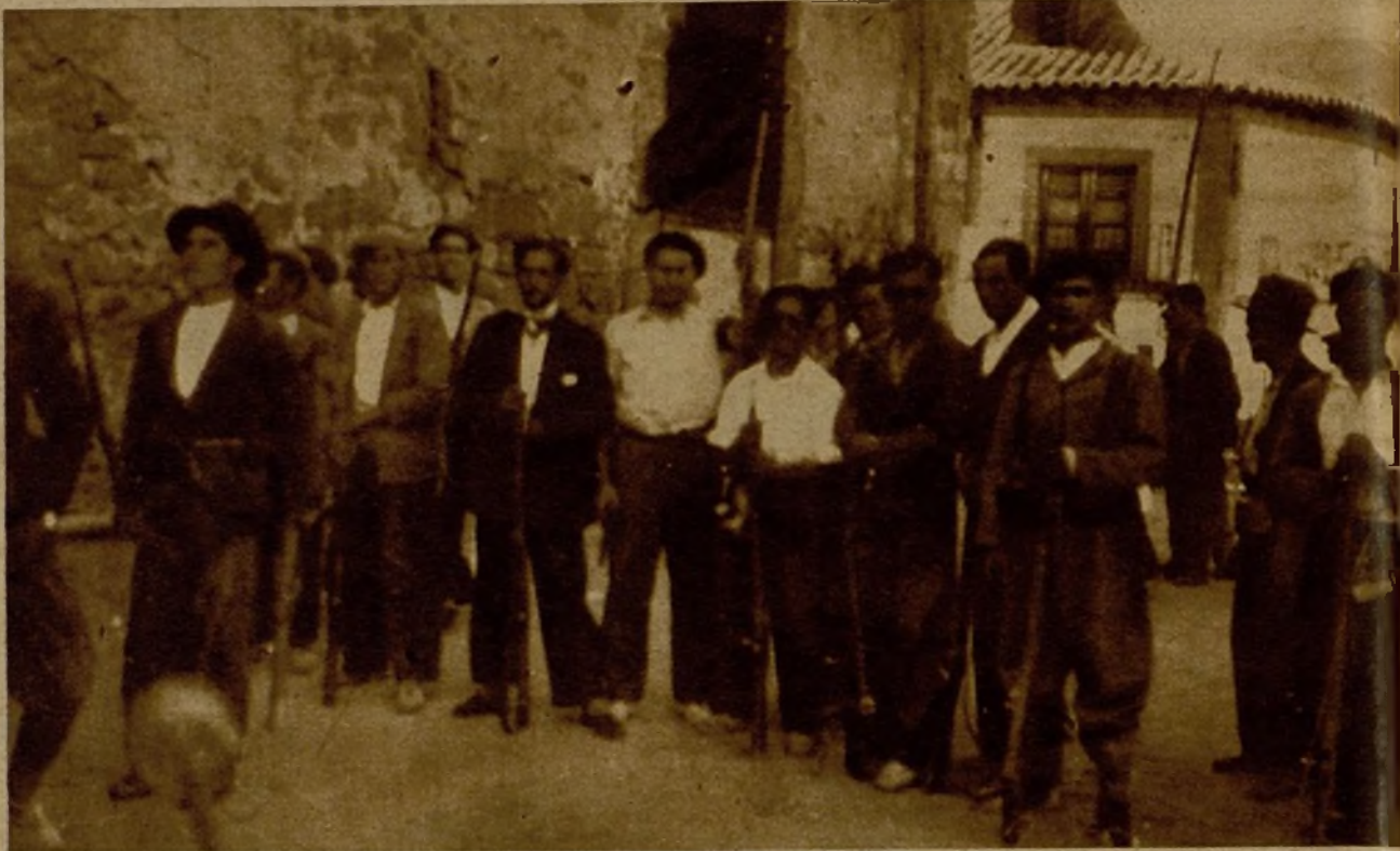
Milicianos adscritos a la F. A. I., que hicieron una audaz entrada en Arenas de San Pedro y redujeron y aprisionaron a dieciséis fascistas que se habían hecho fuertes en la torre de la iglesia. A la izquierda, dos de los milicianos que se distinguieron en la acción