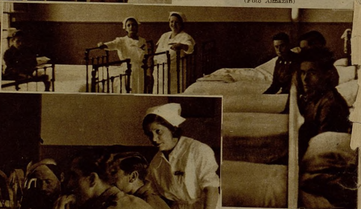
Un aspecto de los dormitorios de la Residencia de Reposo para milicianos y soldados, donde actualmente se dispone de cien plazas, que se irán ampliando