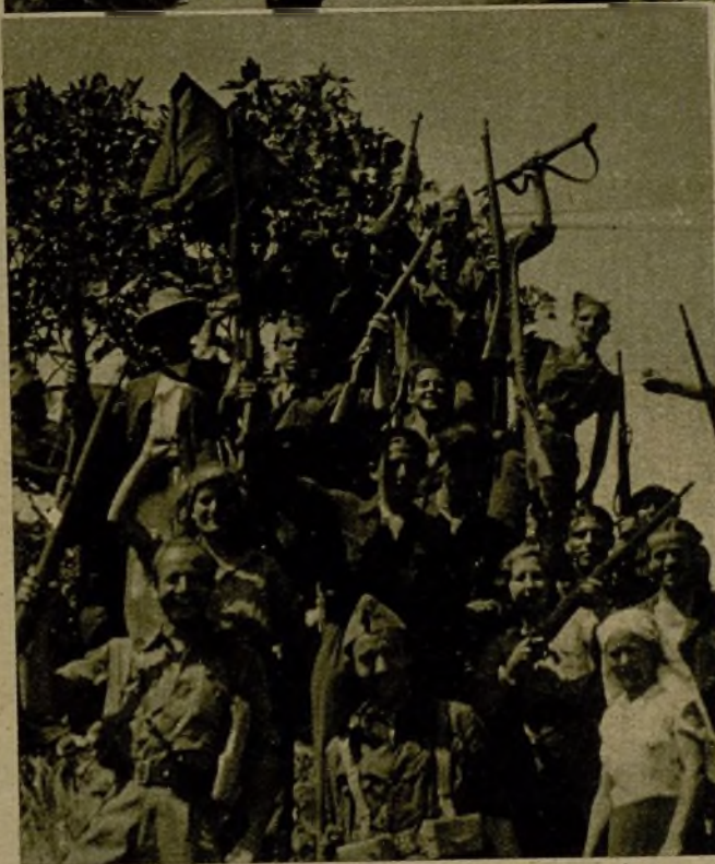
Milicianos que ganaron una importante posición a los rebeldes, después de valerosa lucha, muestran su entusiasmo por la victoria