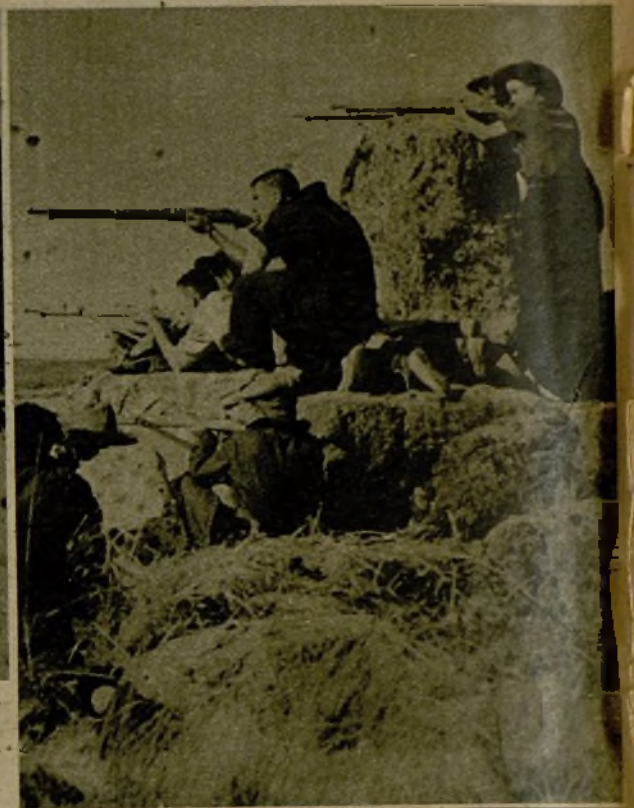
En la fotografía superior y en la de la derecha, soldados de las Milicias populares haciendo fuego de ametralladora y fusil contra los facciosos en retirada