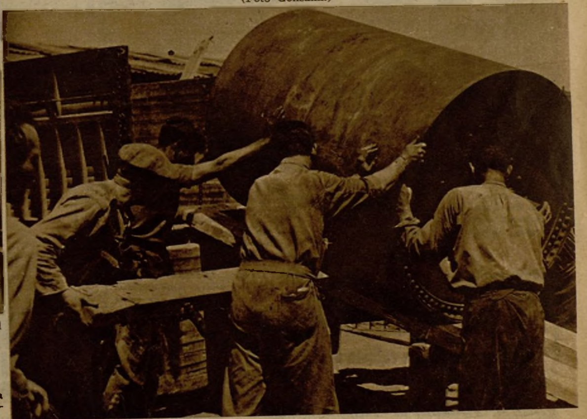
Obreros de un taller de tonelería de Barcelona, trabajando con absoluta normalidad