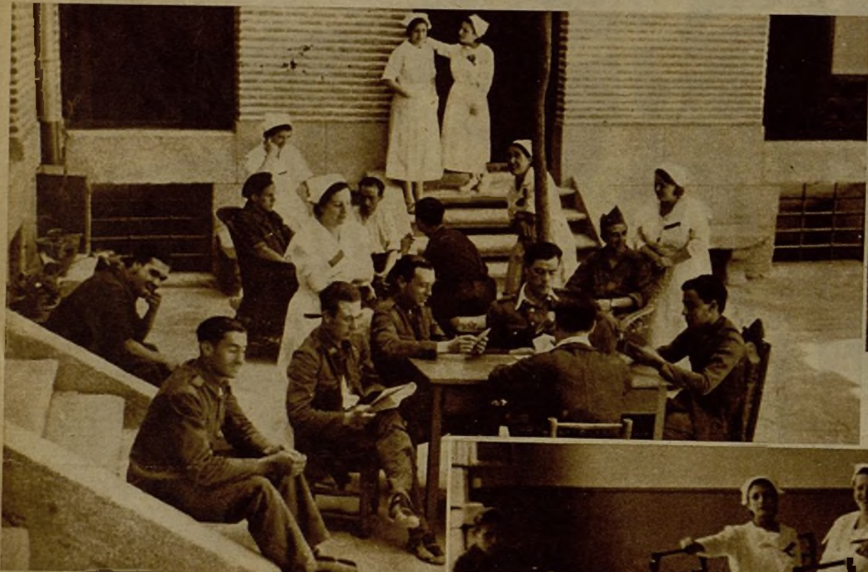
La Residencia de Reposo de la calle de la Puebla es un oasis para los soldados, agotados en la lucha.