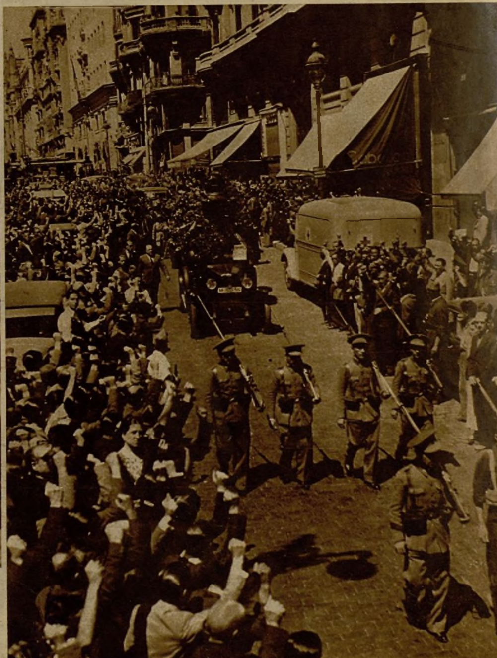
La multitud presenciando el paso de la fúnebre comitiva. Nutridísimas filas de entusiastas republicanos se extendían a lo largo del trayecto