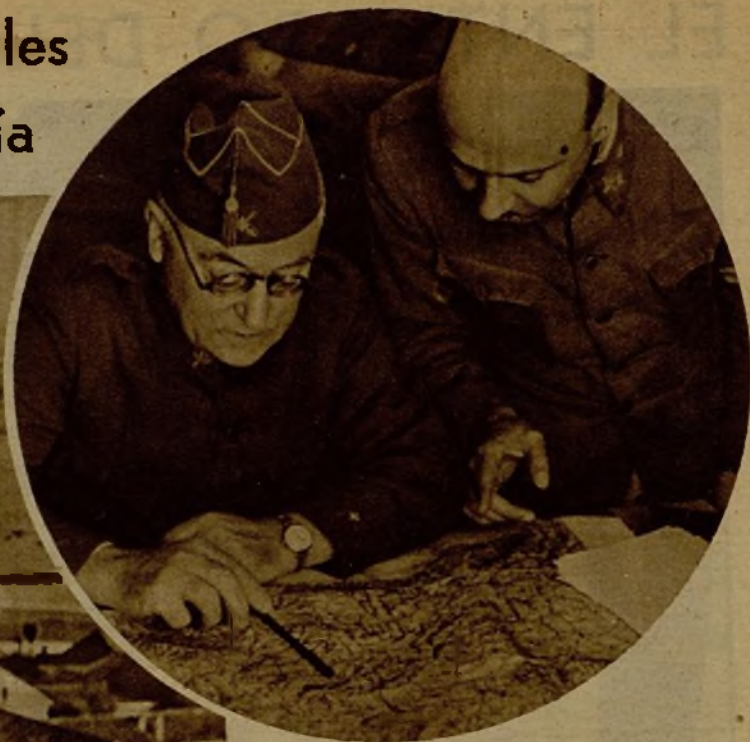
El ilustre general Miaja, cuyas altas dotes militares son eficacísima garantía para nuestra acción en el frente andaluz, donde las columnas avanzan incesantemente, dejando el campo limpio de enemigos, estudia sobre el mapa los próximos movimientos de ataque

Las tropas leales al régimen, con las valientes Milicias populares, han librado una victoriosa acción, apoderándose del importante pueblo de El Carpio (Córdoba) y haciendo huir a los rebeldes, a los que causaron numerosas bajas. Desde el castillo, que domina todo el pueblo, soldados de la República hacen fuego de fusil y ametralladora contra los grupos fugitivos