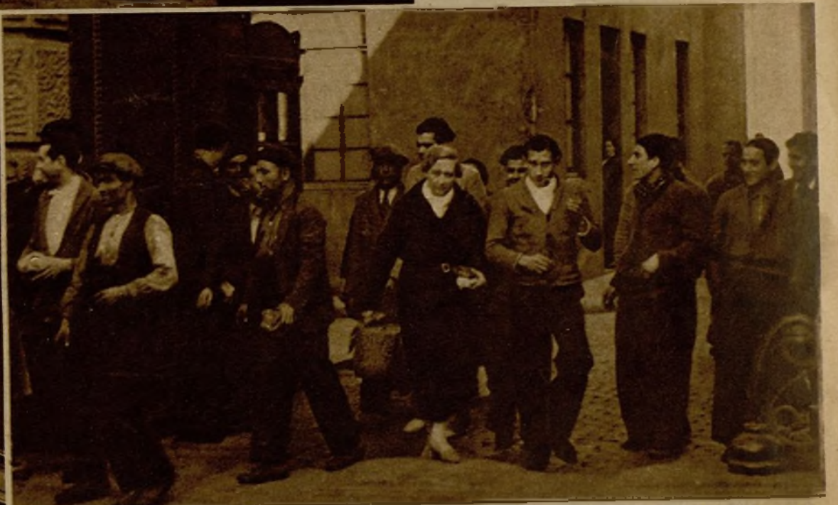
En talleres y fábricas, los operarios actúan sin la menor perturbación. He aquí la salida de un grupo de obreros a la hora del almuerzo