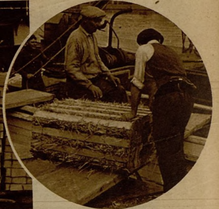
Con perfecta regularidad, como en los días anteriores al movimiento insurreccional, se efectúa la descarga de frutas y artículos alimenticios