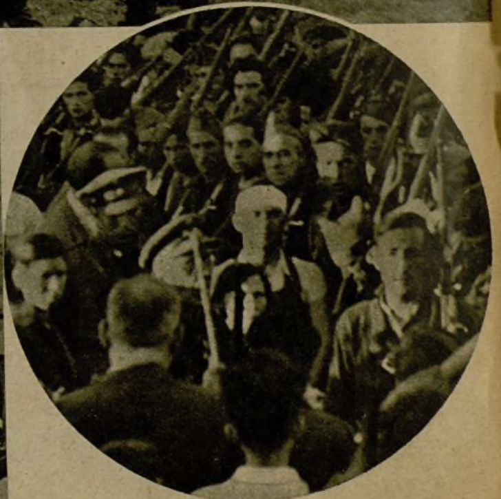
La valerosa e inteligente actuación del ilustre teniente coronel Mangada, que en su brillantísimo avance ha logrado difíciles e importantes victorias, ha merecido un simpático homenaje de las Milicias de su mando: la entrega de un bastón, que aquí muestra entre sus soldados el valiente militar