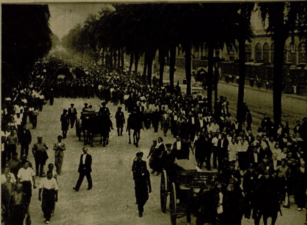
Armones de artillería en los que fueron transportados los cadáveres de los capitanes Arrando y Arenas, a su paso por las calles de Barcelona