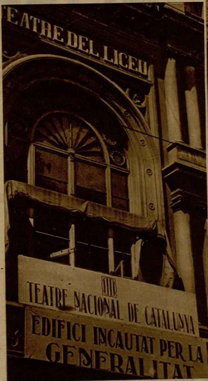
El teatro del Liceo, de Barcelona, que ha sido incautado por el Gobierno de la Generalidad