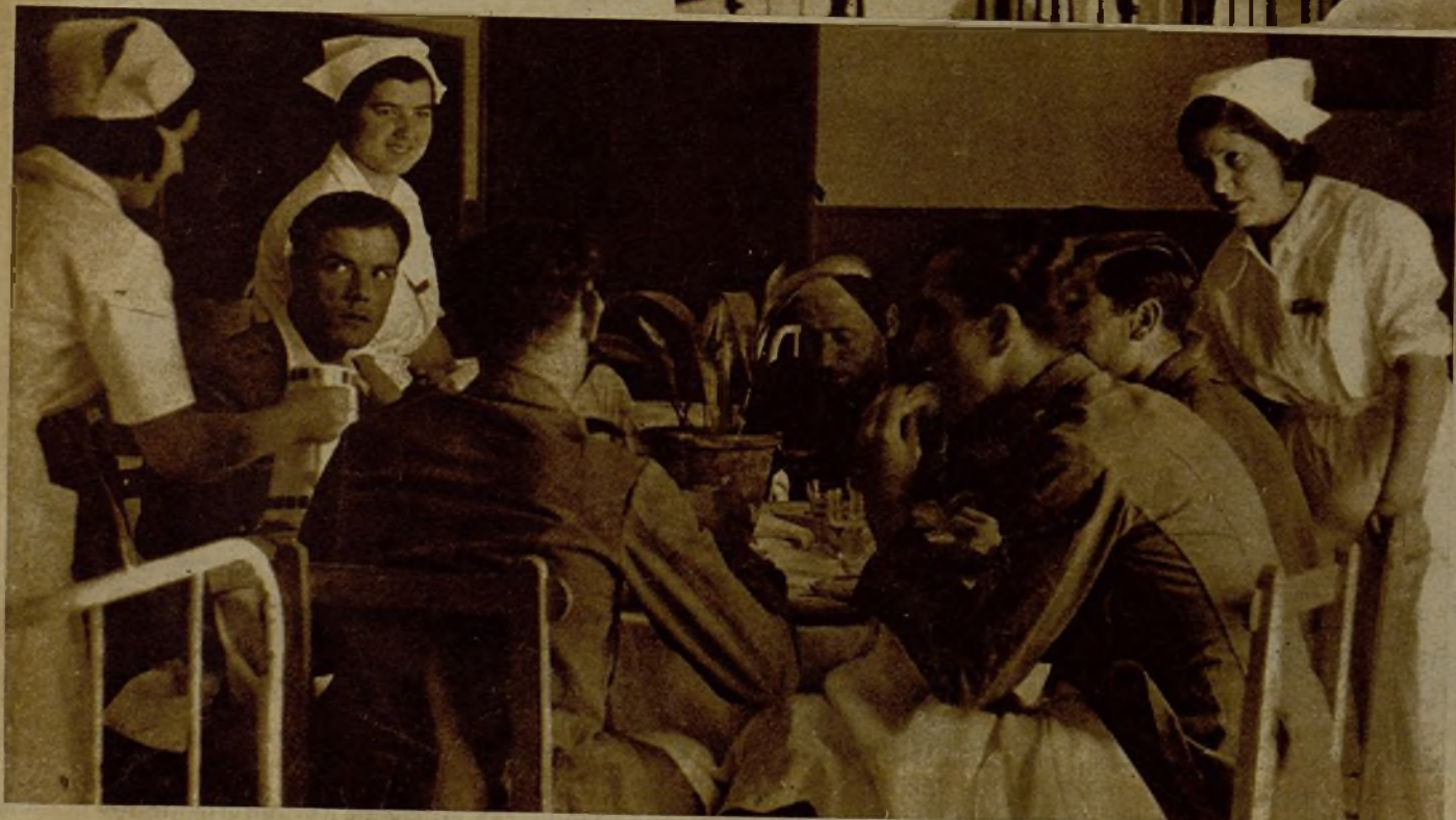
Un momento de la comida de un grupo de acogidos en la Residencia de Reposo de la Asociación de Dependientes de Espectáculos