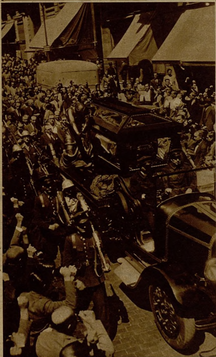
La conducción al cementerio del heroico coronel Puig, muerto en el frente de lucha contra los facciosos, constituyó una gran manifestación de duelo. El coche mortuario al partir la comitiva