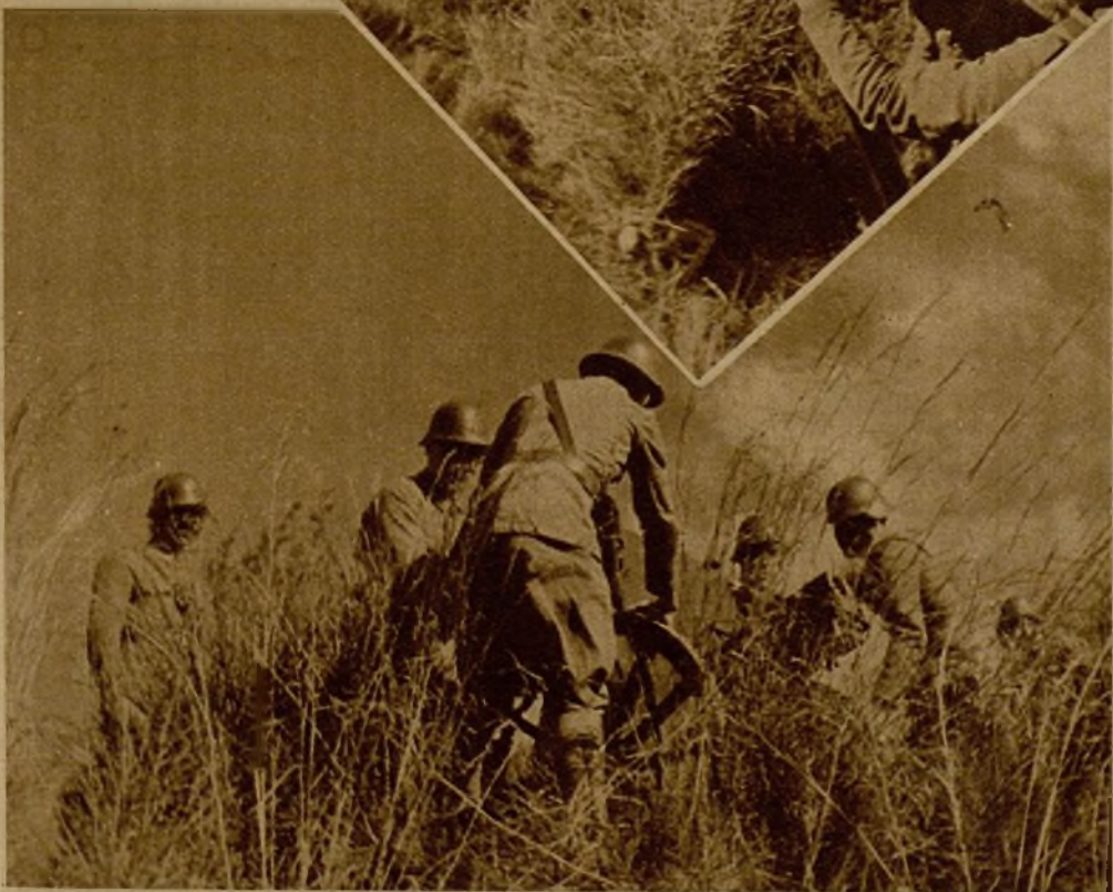
En las avanzadas de nuestro frente se artillan las posiciones para castigar al enemigo en su retirada