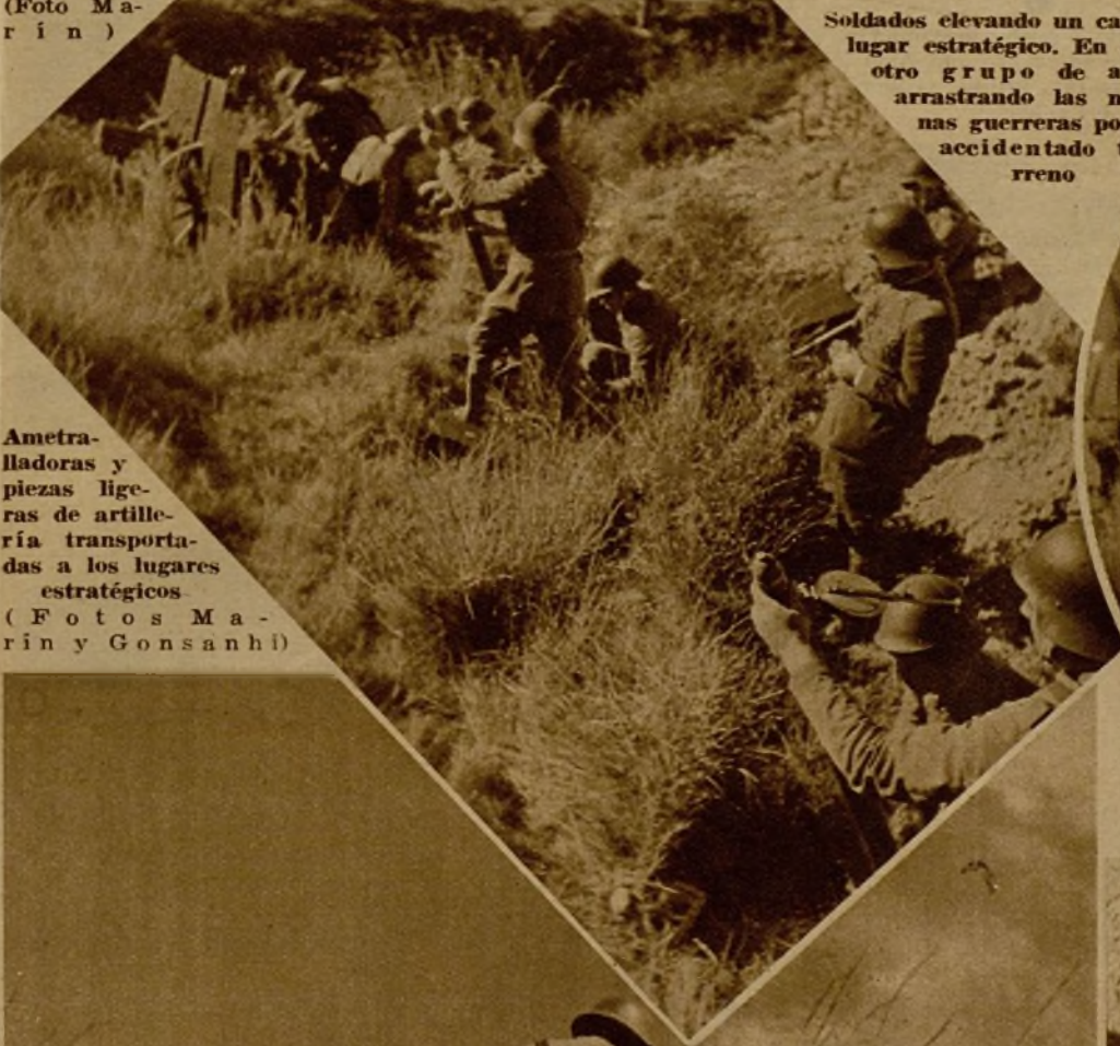
Ametralladoras y piezas ligeras de artillería transportadas a los lugares estratégicos