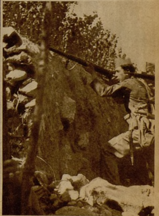
Nuestras fuerzas, perfectamente parapetadas en el frente de la Sierra, tirotean nutridamente a los rebeldes en retirada