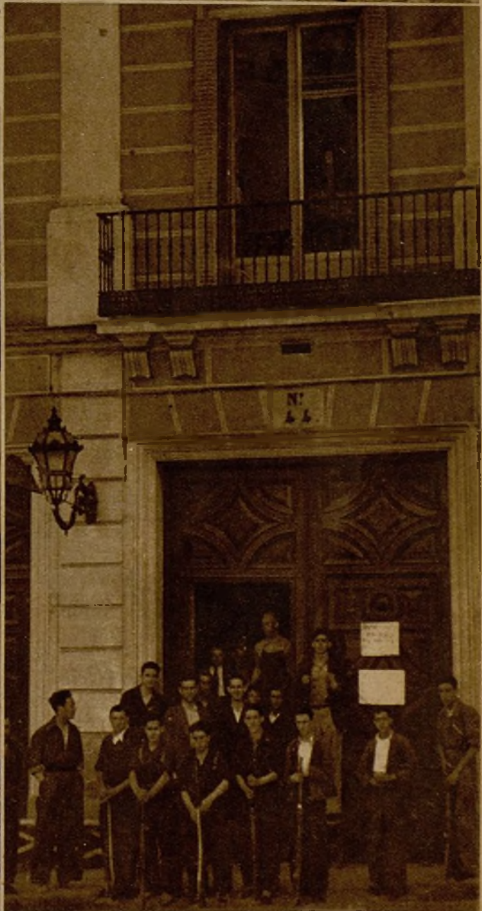
La entrada al palacio del ex duque de Fernán-Núñez, custodiada por las milicias, a las órdenes de la Junta Nacional de Incautación y Protección del Patrimonio Artístico