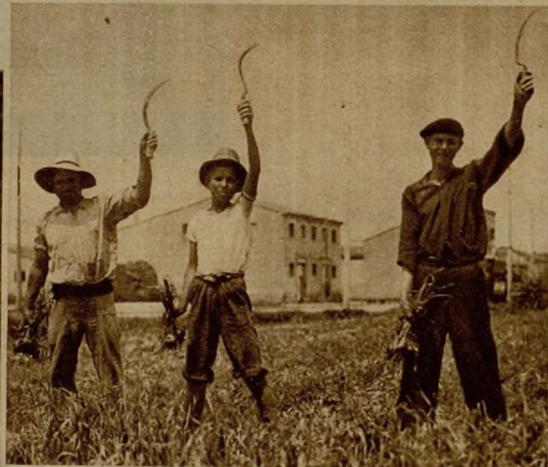
En las huertas de Valencia los campesinos han vuelto a sus tareas para cuidar de la producción, en obediencia al requerimiento de las autoridades de la República