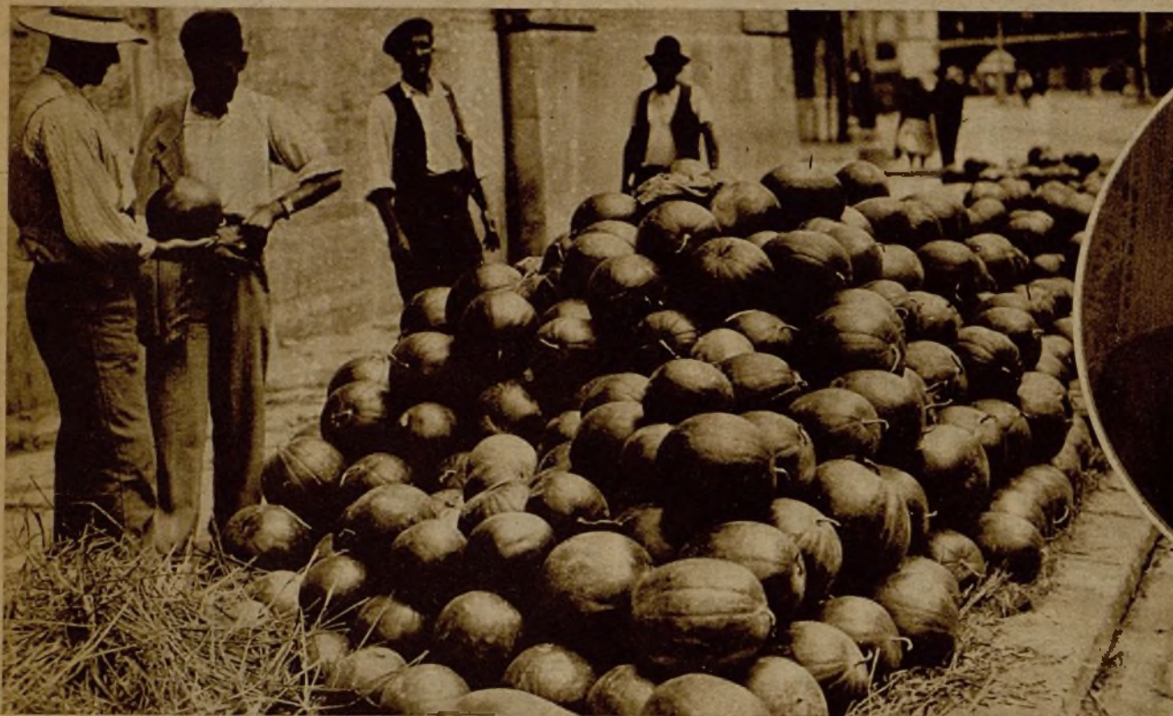
En Valencia han desaparecido las barricadas de lucha. En cambio han surgido estas otras, signo de tranquilidad y del normal desenvolvimiento de la vida en la calle: sandías y melones...