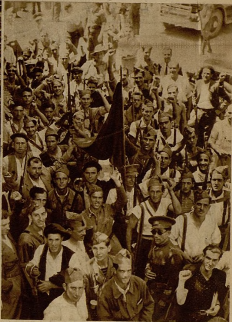
Voluntarios con su bandera esperando el momento de la partida hacia la línea de combate