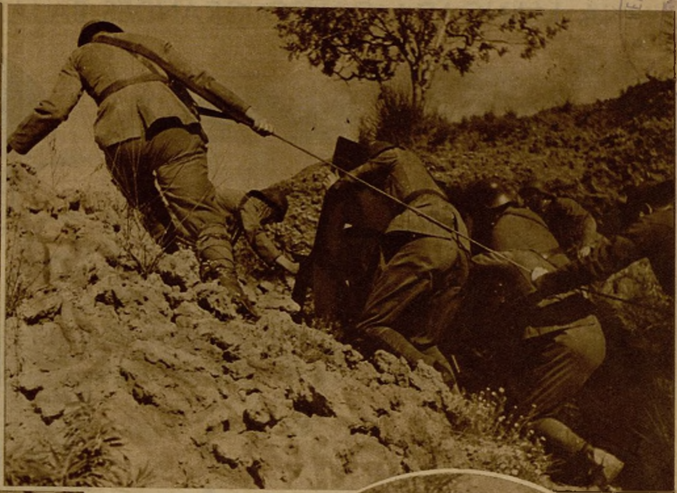
Soldados elevando un cañón hacia un lugar estratégico. En el círculo, otro grupo de artilleros arrastrando las máquinas guerreras por el accidentado terreno