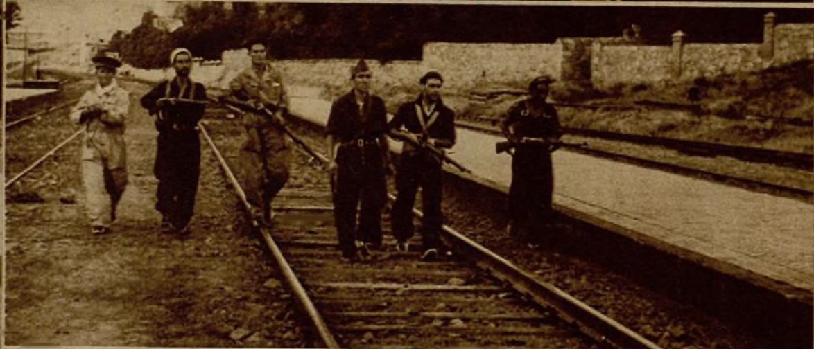
Una avanzadilla vigilando la vía del ferrocarril, después de la toma de Navalperal