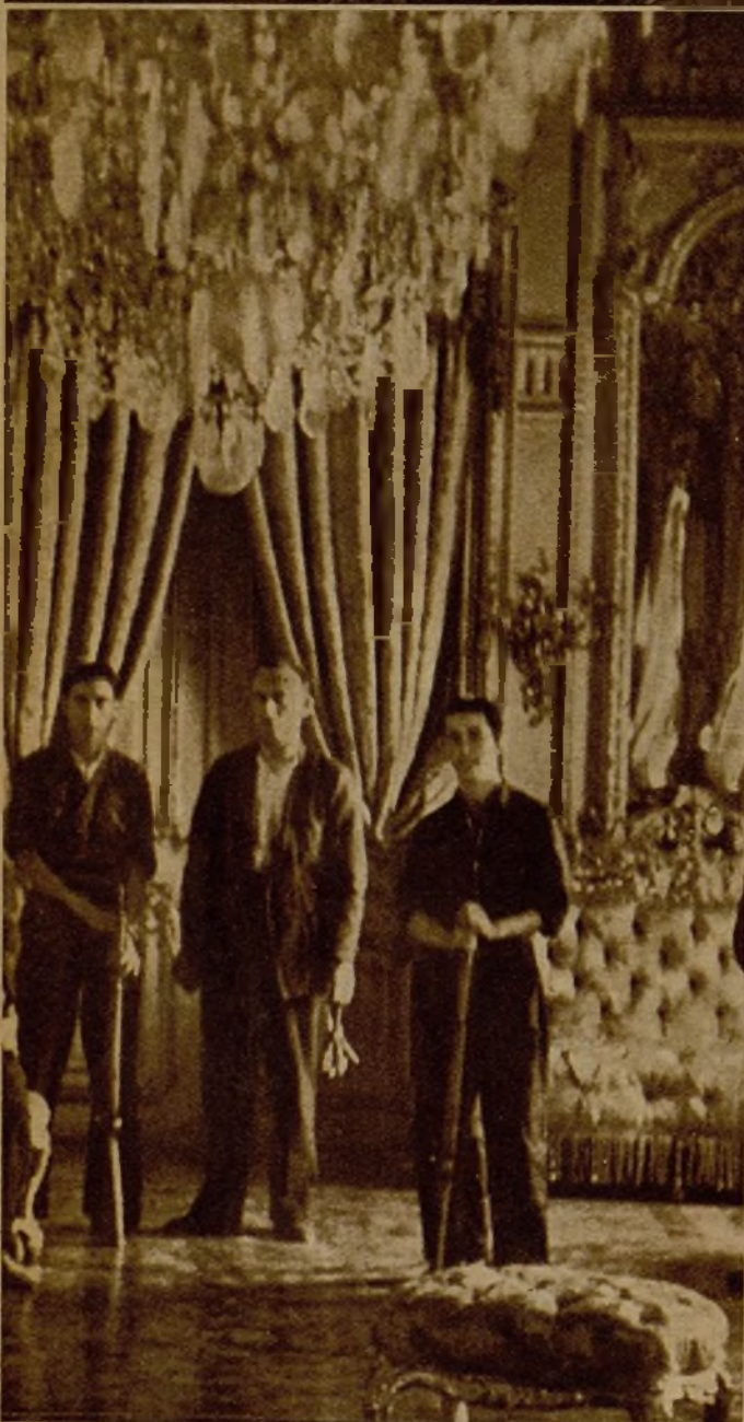
Milicianos custodiando las estancias del palacio del ex duque de Fernán-Núñez, donde se guardan valiosísimas obras de arte