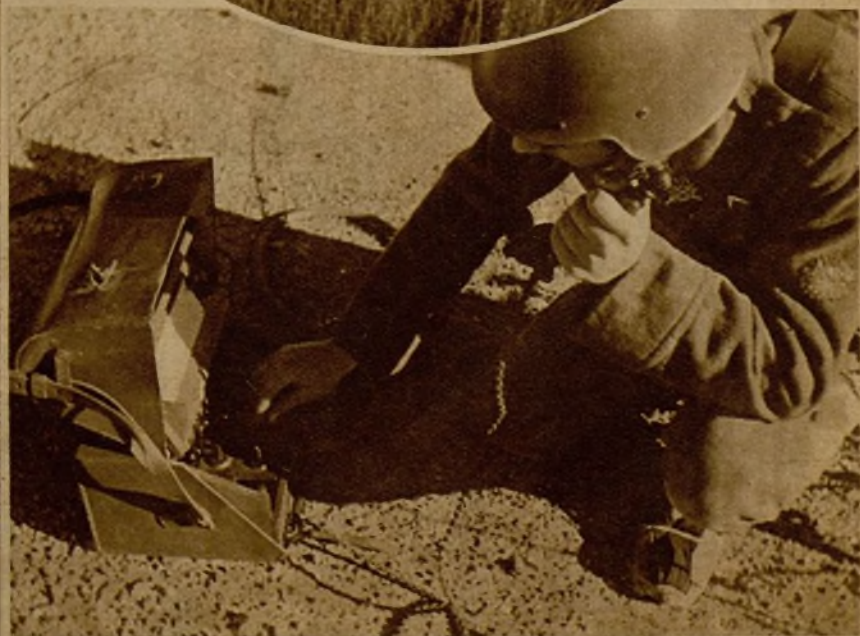
Un puesto telefónico comunicando con las avanzadas en el frente de Aragón