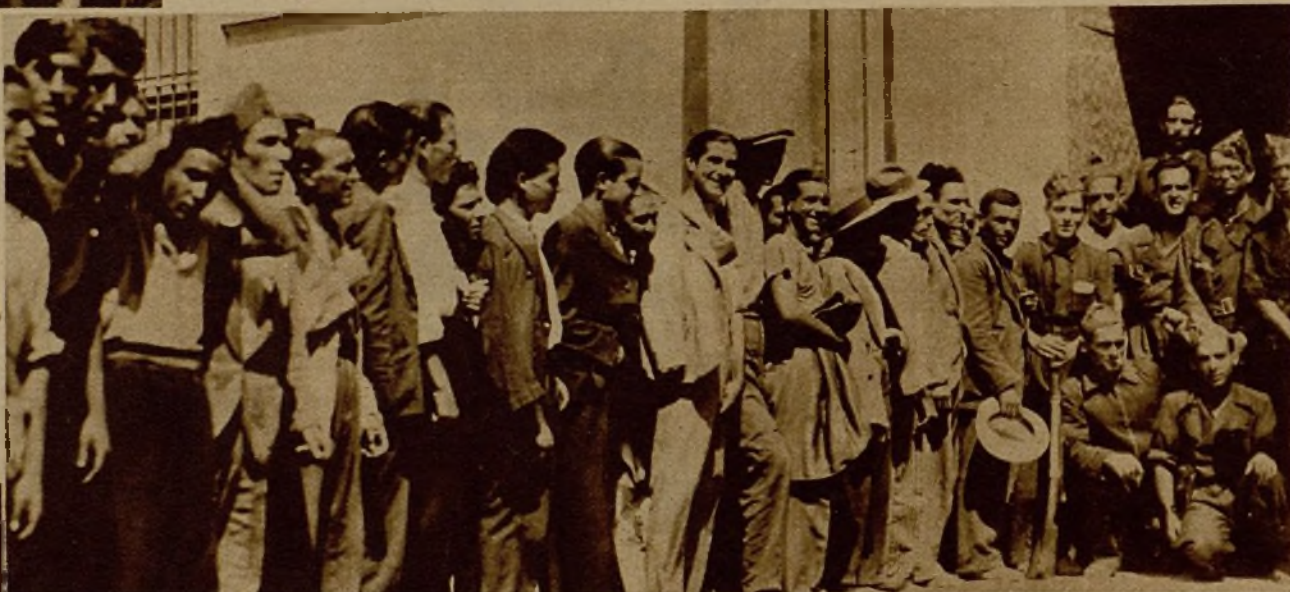
Voluntarios murcianos formando cola a la puerta del cuartel de Milicianos, para inscribirse