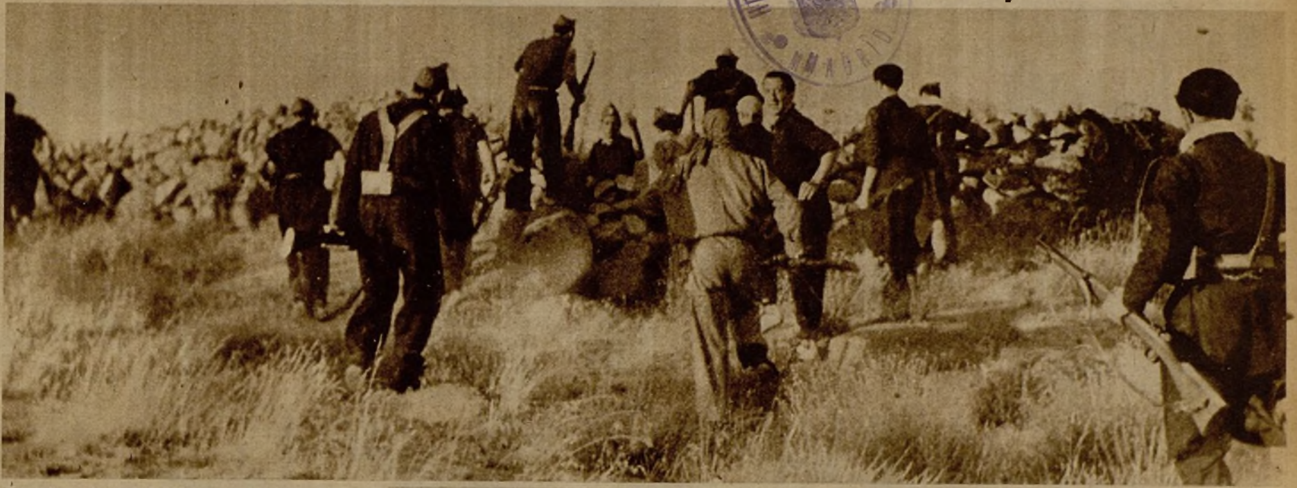
Un grupo de vanguardia de las tropas que operan en el frente andaluz saltan la tapia de un cercado para perseguir al enemigo en fuga