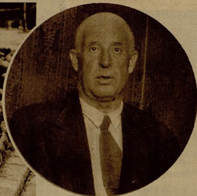
Don Ernesto Arín, prestigioso militar, que ha sido nombrado gobernador civil de Valencia