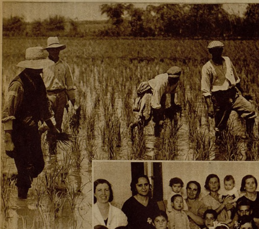
Atendiendo a los requerimientos de las autoridades y de los grupos sindicales, los obreros valencianos han vuelto al trabajo para cuidar de las cosechas en los campos de arroz