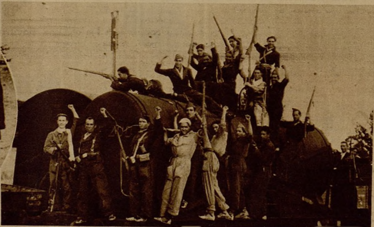
Grupo de voluntarios populares que hicieron prodigios de valor en la toma de Navalperal de Pinares