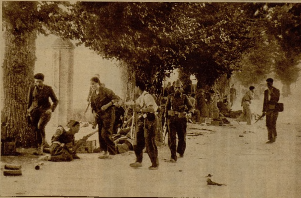
Una avanzadilla en el frente de la Sierra. Los soldados y milicianos se disponen a parapetarse tras de los árboles