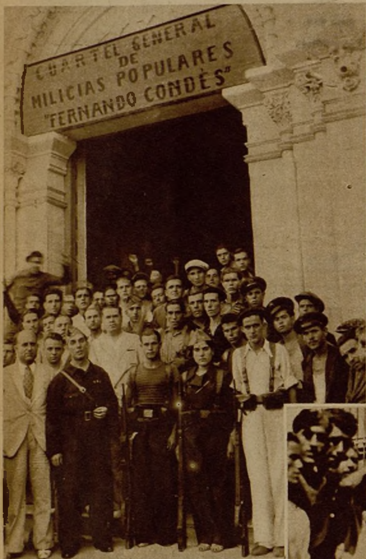
En Cartagena continúan formándose nutridas columnas de milicianos, que, llenos de entusiasmo, marchan al frente. He aquí un grupo de voluntarios prestos para la salida, en el cuartel general de milicianos "Fernando Condés"