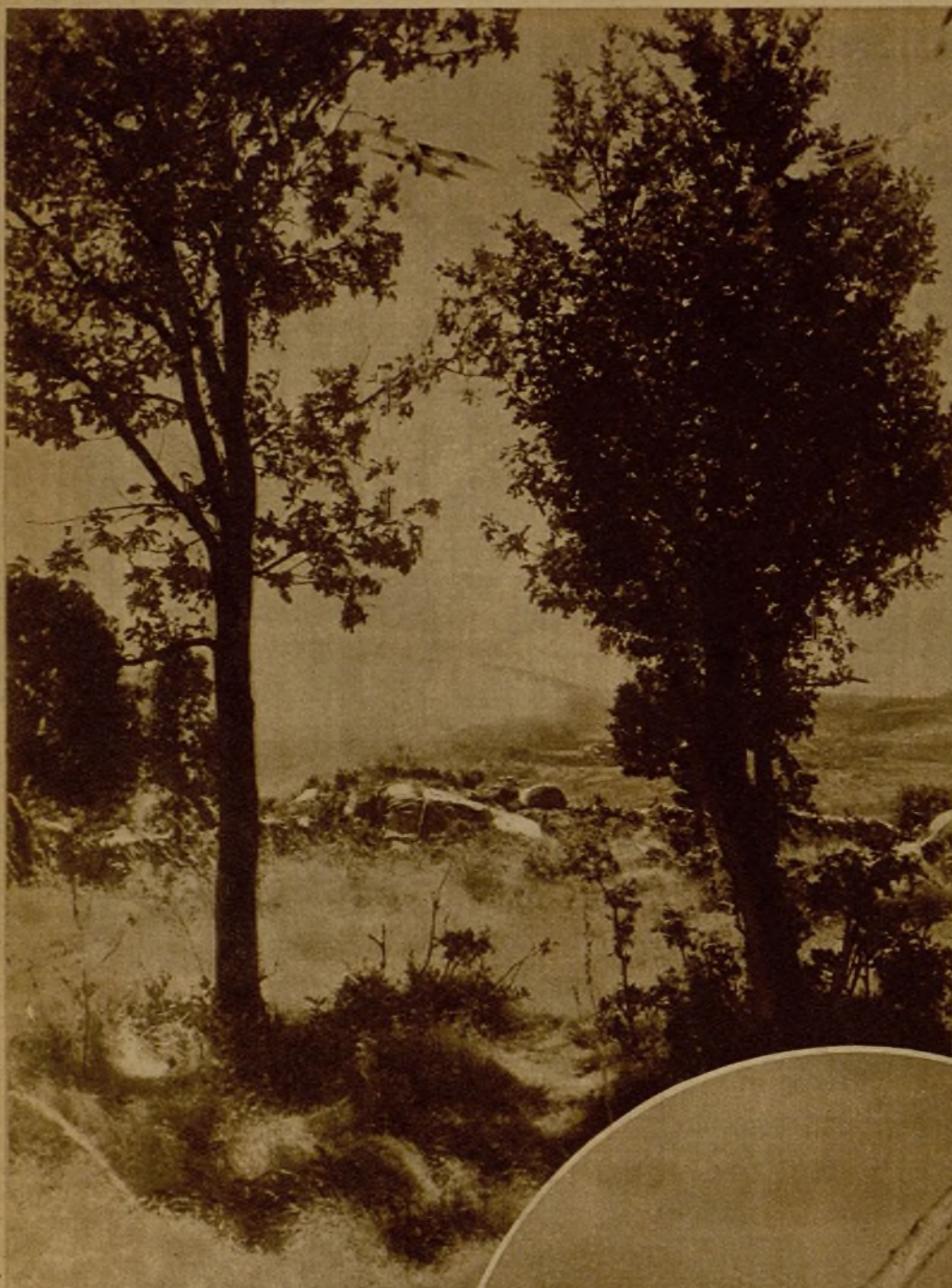
Continúan las tropas leales y los valientes milicianos su progresivo empuje, conquistando nuevas posiciones al enemigo. La aviación colabora con decisiva eficacia. He aquí a un aparato que cruza entre los árboles, instantes después de haber descargado una bomba sobre las líneas enemigas