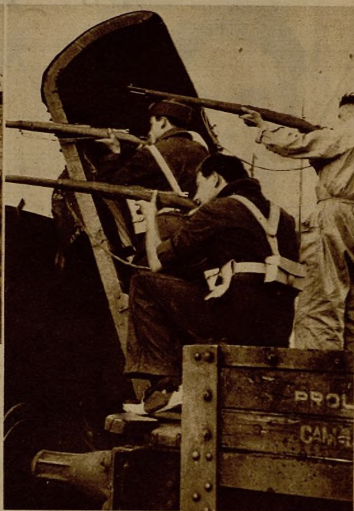
Los milicianos, a pecho descubierto, se lanzan bravamente a la toma de la iglesia de Navalperal, último reducto de los rebeldes