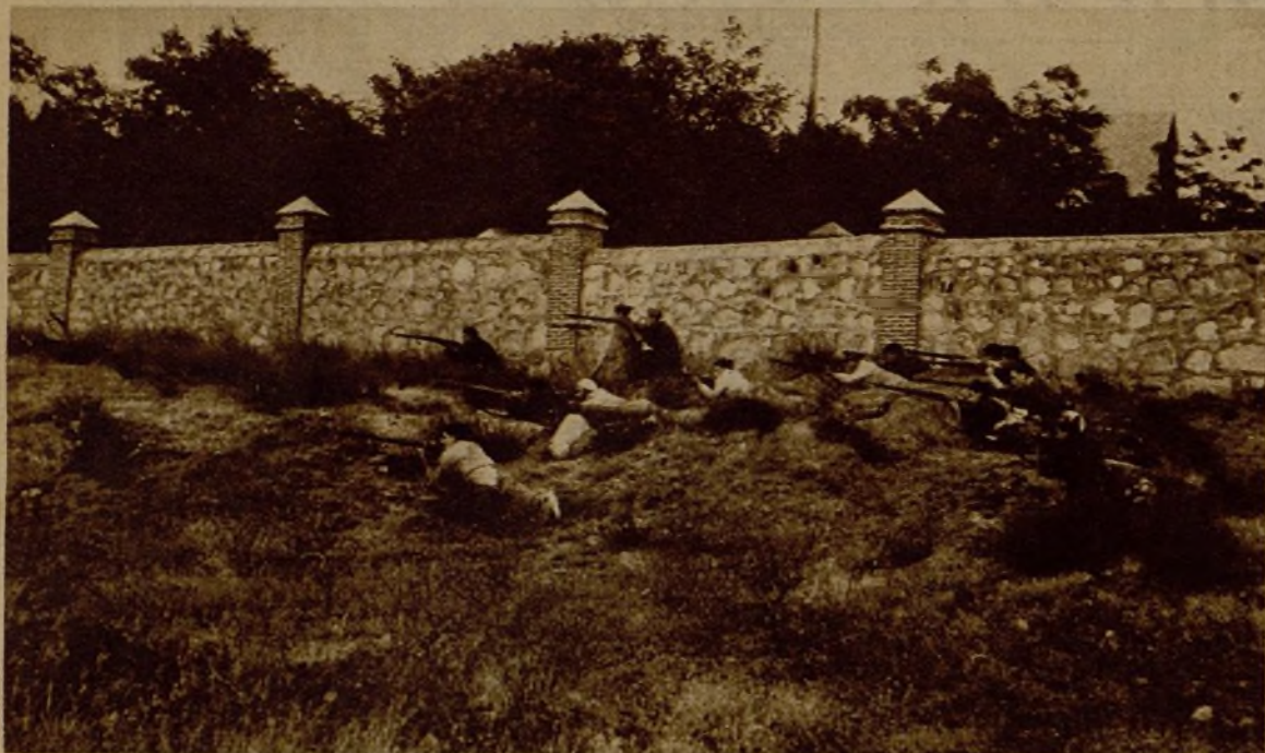
Milicianos de la columna Mangada atacando la estación del ferrocarril de Navalperal, de la que en un arrollador avance expulsaron a los facciosos