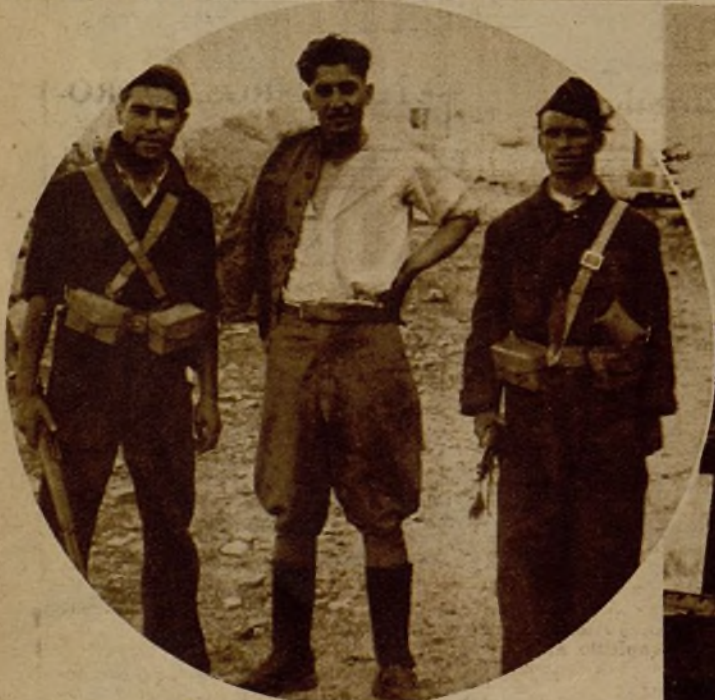
Dos milicianos conducen a presencia del coronel Mangada a un soldado de las fuerzas rebeldes que se pasó a nuestras filas