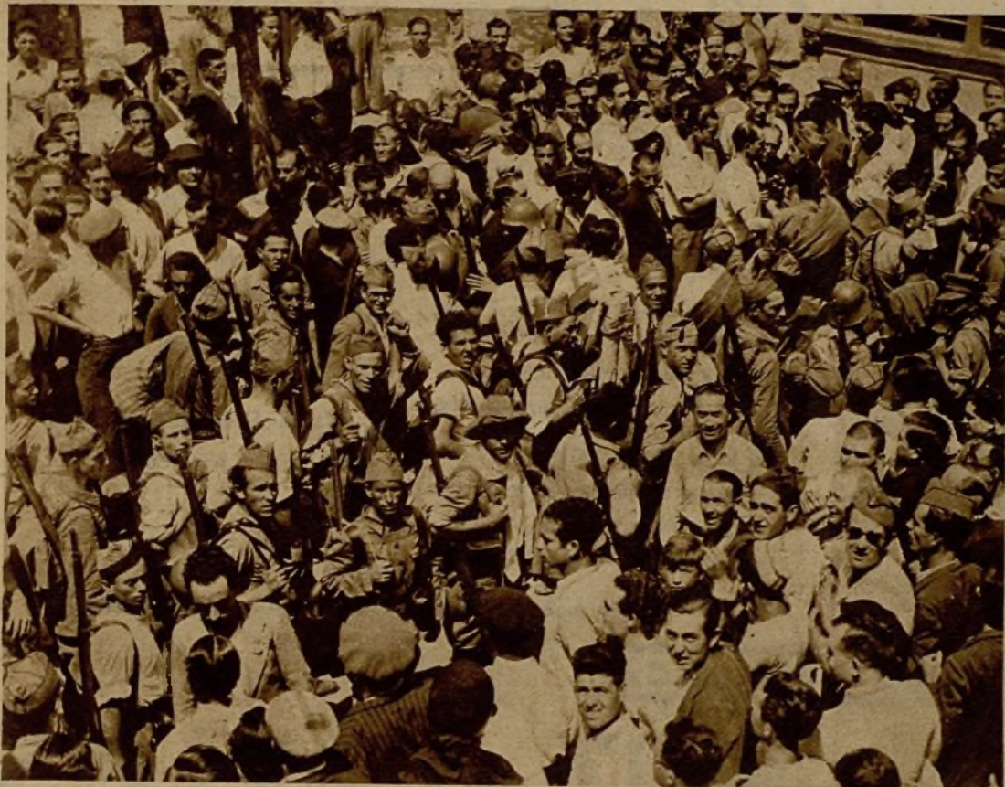
Milicianos preparados para marchar al frente de combate en una expedición de anteayer hacia el frente de Andalucía