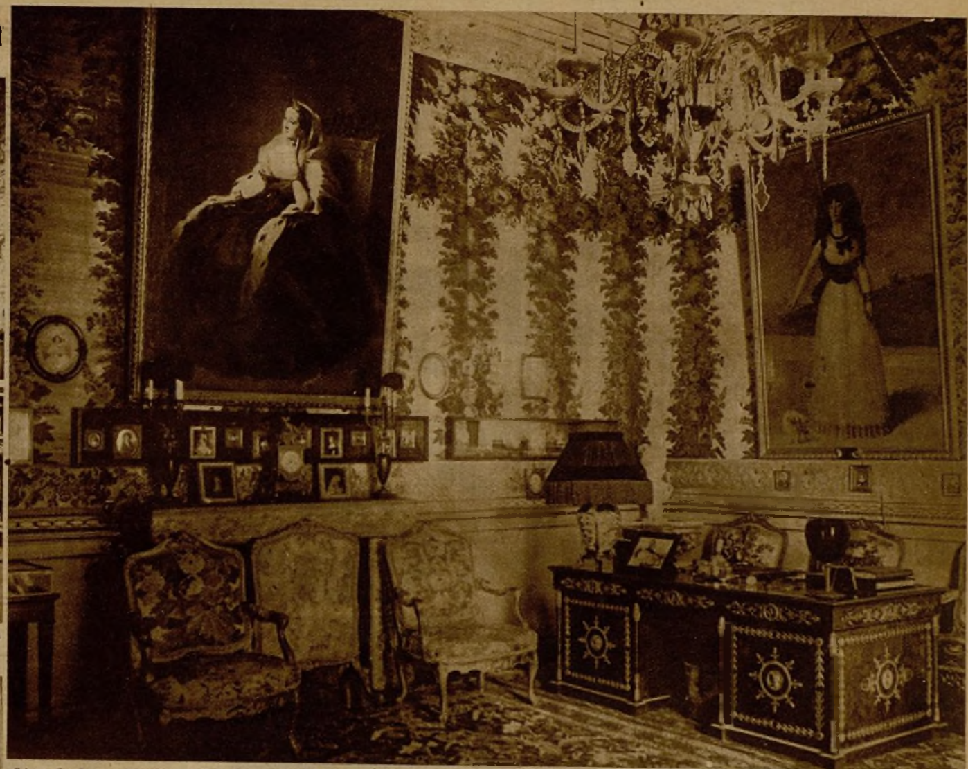
Otra de las estancias del palacio de Liria, residencia que fué del duque de Alba, y en el que la Junta Nacional custodia magníficas obras de arte