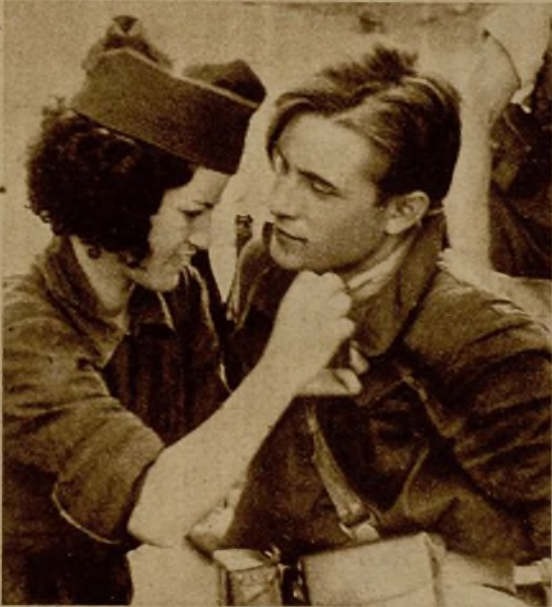
Una miliciana prestando sus cuidados a un compañero lesionado, en el frente de la Sierra