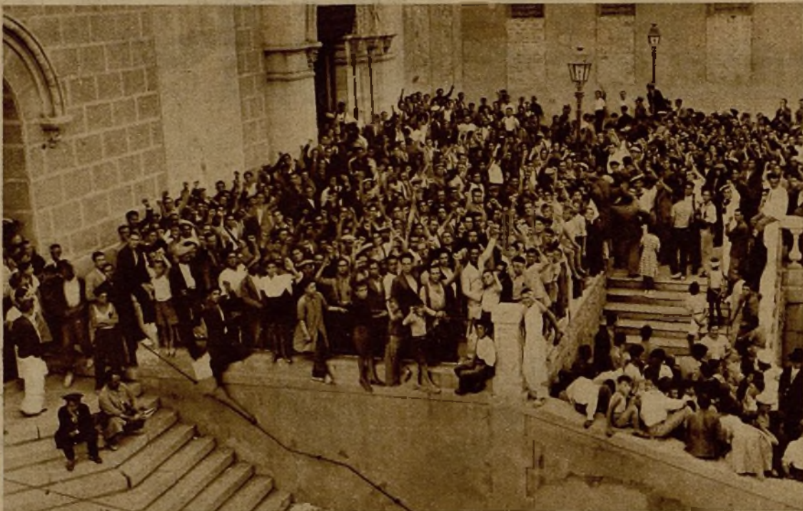
El público y familiares de los milicianos expedicionarios de Cartagena en la entusiástica despedida a los bravos defensores de la República