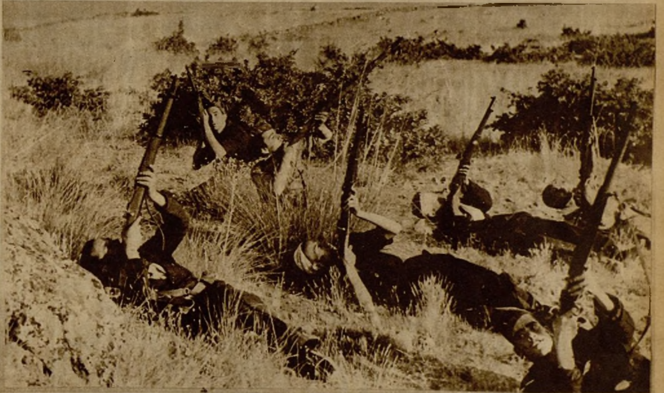
Milicianos haciendo fuego contra un avión faccioso que voló sobre nuestras líneas, en el frente de Andalucía