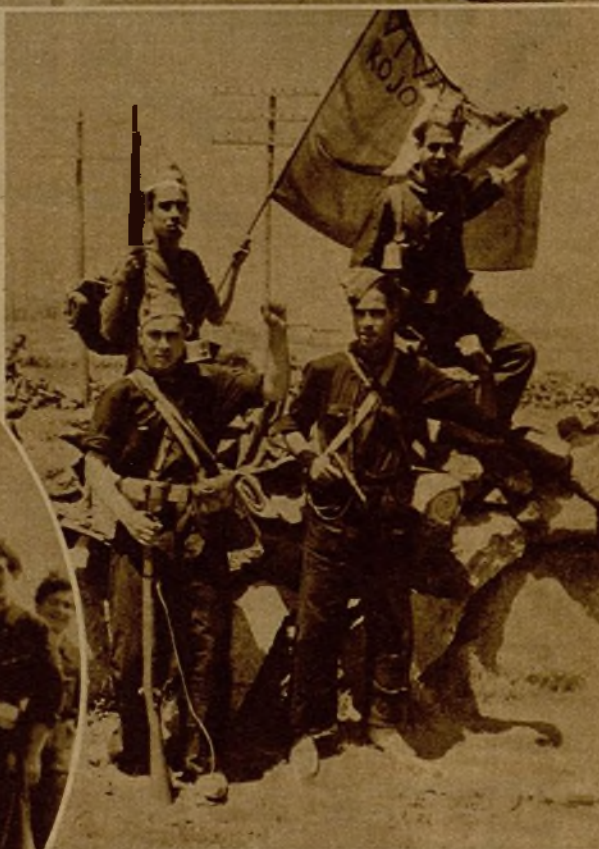
Estos cuatro muchachos, llegados de Cartagena para luchar en el frente, han sido citados ya varias veces por su bravura en los partes oficiales