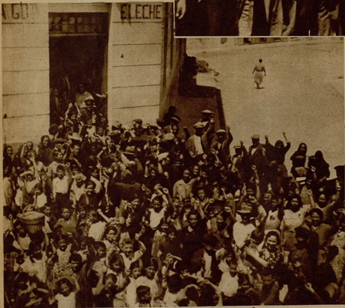
Familiares de los milicianos salidos de Albacete para los frentes de combate esperando la hora del reparto de comidas que en la institución La Gota de Leche costean el Ayuntamiento y la Diputación