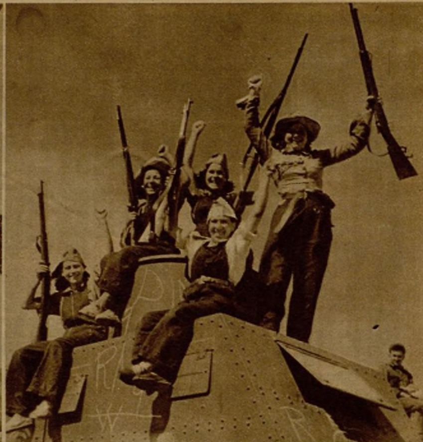
Tras la marcha fatigosa y las emocionantes horas de lucha, despejado ya el campo de enemigos, estas bellas y animosas milicianas posan sobre un tanque blindado (F. Benítez Casaux)