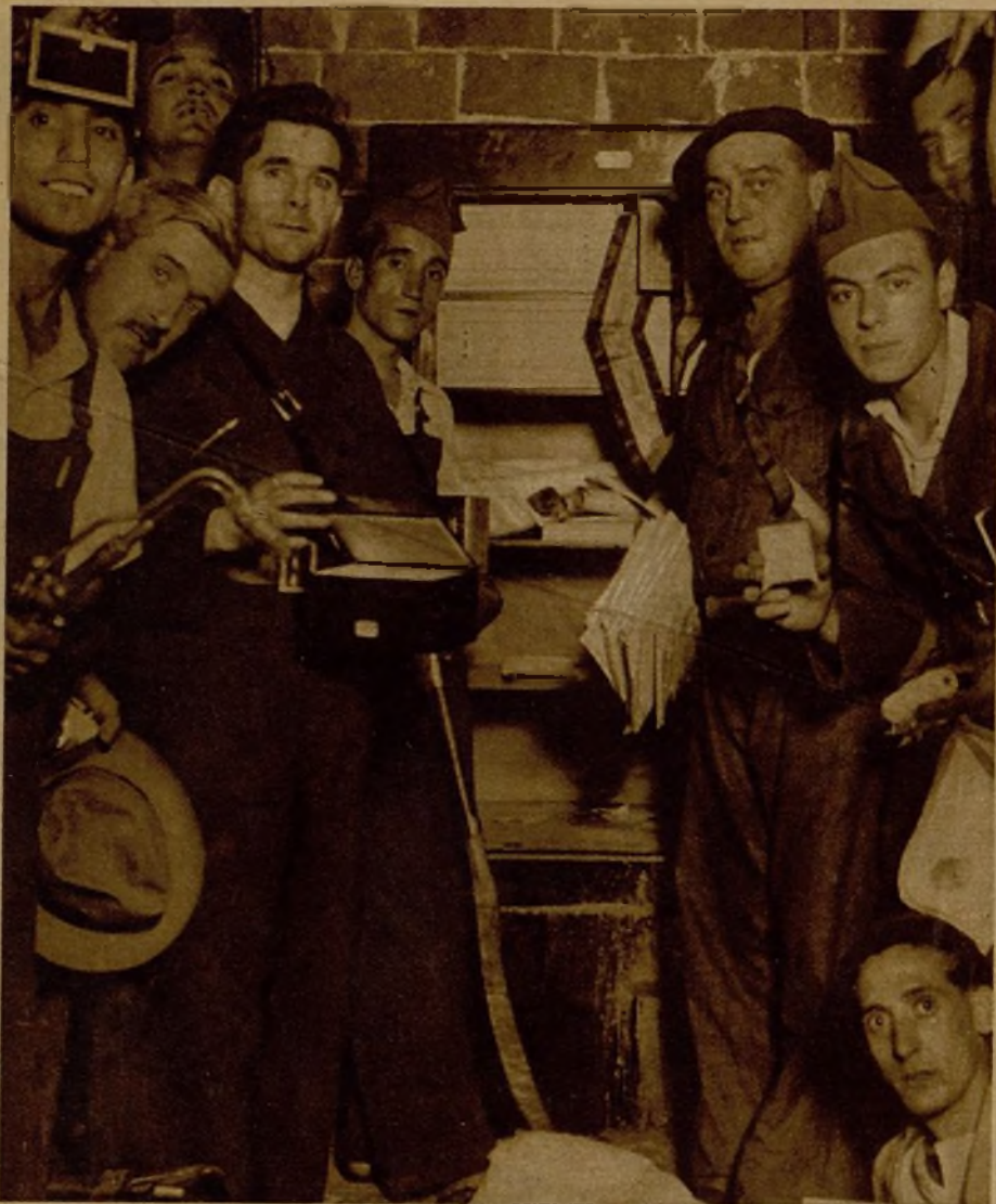
Los milicianos que vigilaban el palacio del Obispado de Madrid practicaron un registro, encontrando una caja de candales, en la que había un millón de pesetas en títulos y billetes, de los que se hizo entrega oficialmente