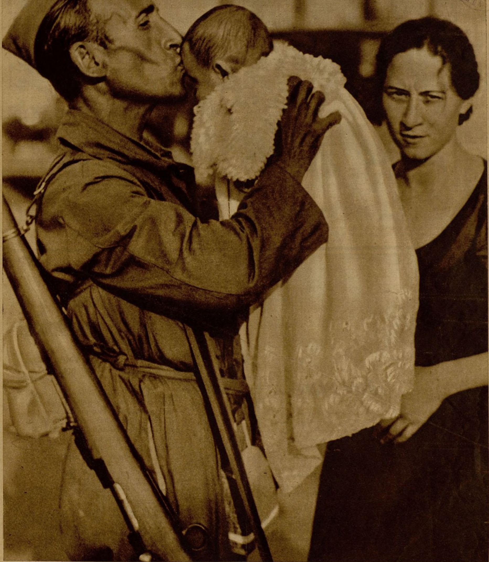
LA DESPEDIDA AL HOGAR DE LOS BRAVOS LUCHADORES QUE DEFIENDEN LA LIBERTAD REPUBLICANA. —Hombres de toda edad y condición, comunes en su fervor por las libertades y por la República, se incorporan a las columnas de voluntarios para defender con las armas la paz de sus hogares para el mañana y el justo régimen social, aunque para ello hayan de dejar un temporal vacío entre sus familiares, que se someten a la ausencia con valeroso y esperanzado espíritu. He aquí a un miliciano de la columna que ha salido de Valencia hacia Madrid, para incorporarse a uno de los frentes de lucha, despidiéndose de su esposa y de su hijo, recién nacido.