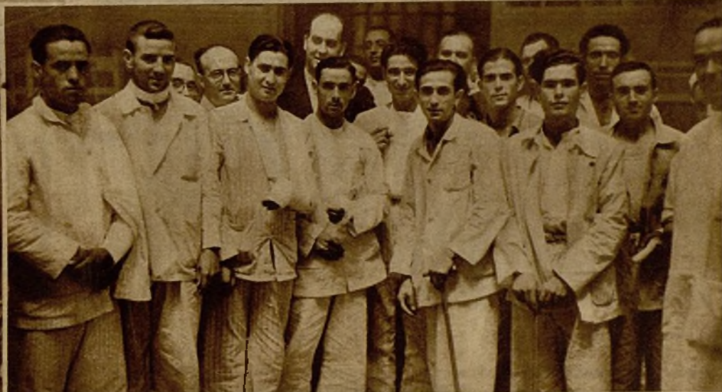
Grupo de milicianos, que ya están convalecientes de sus heridas, en el Hospital Central de la Cruz Roja