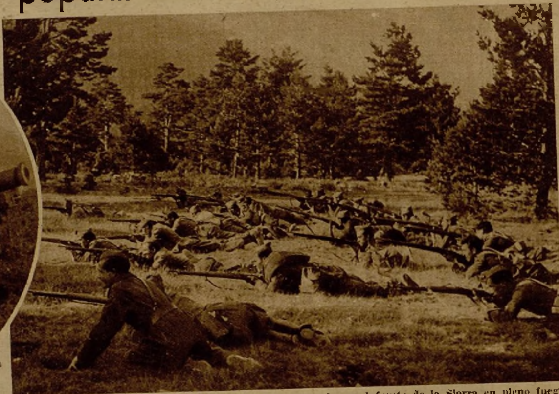
Soldados de una avanzada en el frente de la Sierra en pleno fuego contra los facciosos