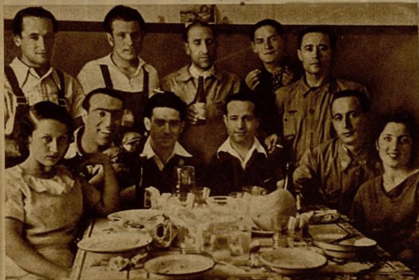
De vuelta de las líneas avanzadas, estos milicianos se reúnen a comer en una finca de la Sierra, en un breve paréntesis de la lucha