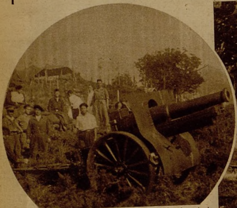
Un cañón emplazado en las inmediaciones de Irún, durante la acción en que fueron reducidos los rebeldes