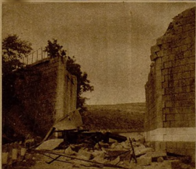
Restos del puente del Ferrocarril Central de Aragón, sobre la carretera de Valencia a Zaragoza, que fué volado por los fascistas en su huida