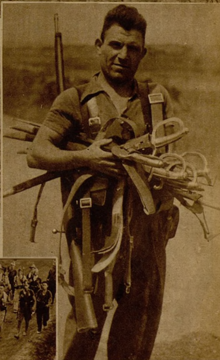
Armas que fueron intervenidas a varios guardias civiles rebeldes en la toma de Sarrión