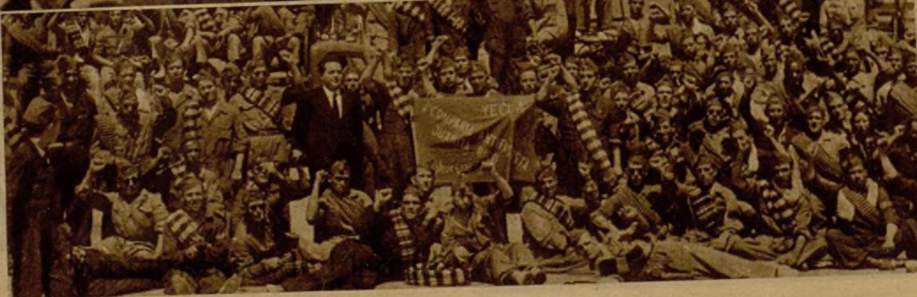
Voluntarios que componen el batallón de milicianos Juanita Itico, a su llegada a Madrid, procedentes de Murcia, para dirigirse al frente de la Sierra