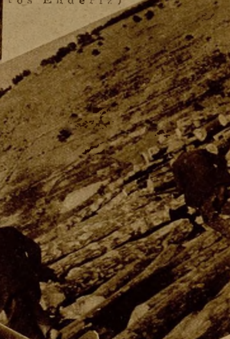
Milicianos haciendo fuego de fusilería contra el enemigo, más allá de Sagel.