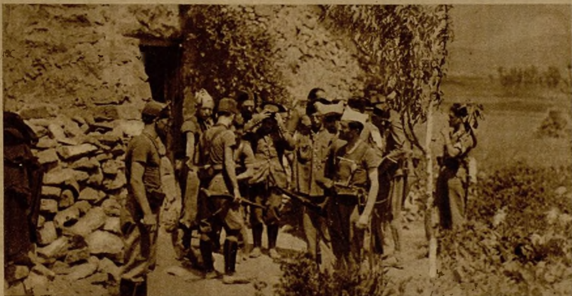
Fuerzas de las Milicias que en Sarrión tomaron este refugio, desde donde les atacaban quince guardias civiles. He aquí el momento de la salida de los capturados, uno a uno y sin armas