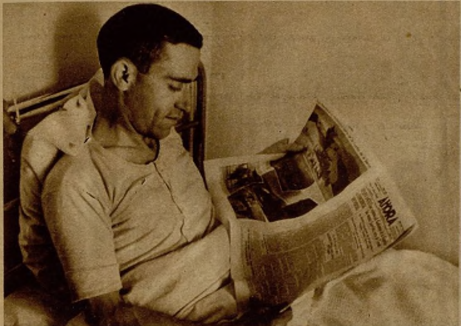
A los heridos de los hospitales se les envían diariamente, y en gran número, los periódicos madrileños. He aquí a un miliciano leyendo AHORA