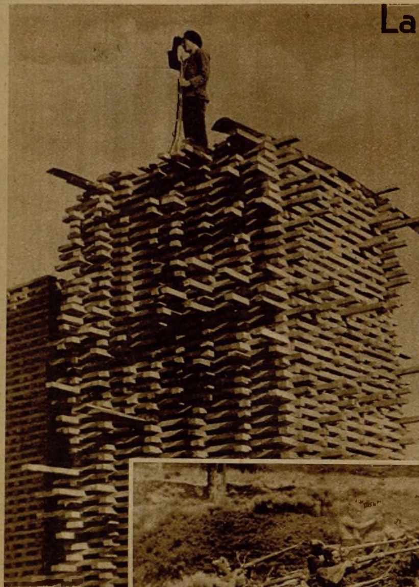
Desde la cima de estas pilas de madera, un bravo miliciano de Peguerinos vigila, expuesto a las bolas del enemigo, para dar la voz de alarma ante cualquier movimiento sospechoso en las líneas rebeldes.