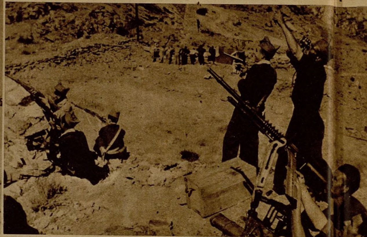
Soldados y milicianos disparando con ametralladora y fusil contra un avión rebelde. A la derecha, una brava miliciiana que en el frente de la Sierra hace diariamente la descubierta y se bate en primera línea.