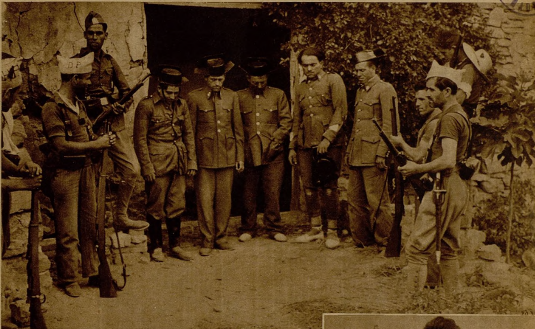
En el avance de nuestras tropas hacia Teruel fueron cercados estos cinco guardias civiles, que hacían intenso fuego y que quedaron prisioneros de los leales, después del bravo asalto al cuartel en el que se habían hecho fuertes