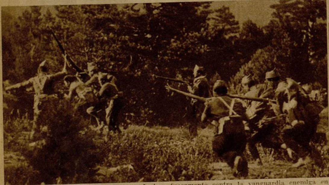
Una guerrilla de fuerzas leales avanzando impetuosamente contra la vanguardia enemiga en el frente de la Sierra